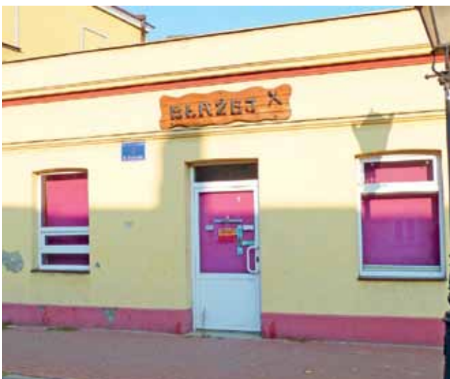
Na razie pozostała jeszcze tabliczka z nazwą lokalu, ale na drzwiach już na stałe umieszczono napis: zamknięte.

– Moim zdaniem rozwinęły się inne miasta: Stryków, Kutno, a my pozostaliśmy za nimi w tyle. Wycieczek też teraz przyjeżdża do nas mniej. Doświadczona kucharka opowiadała mi, że kiedyś jednego dnia w restauracji Polonia obiad jadło 17 wycieczek. Ile teraz czasu potrzebowalby jeden lokal, aby tyle ich obsłużyć? Może miesiąc, a może trzy? Ja nie widzę już szansy, abyśmy inne miasta dogonili... ■