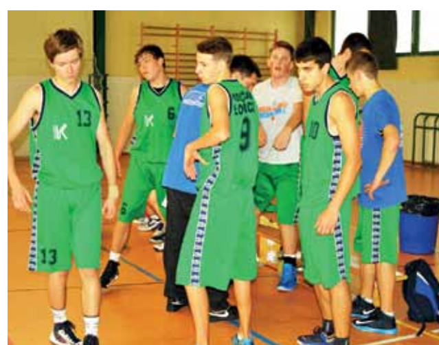
Juniorzy Księżaka wygrali w Skierzwicach po nerwowej końcówce.