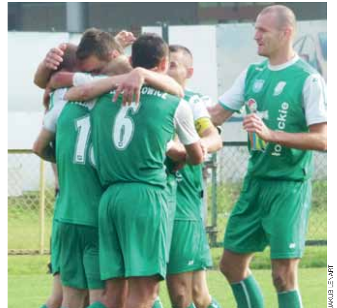
Piłkarze Pelikana cieszą się po kolejnej bramce strzelonej gościom.