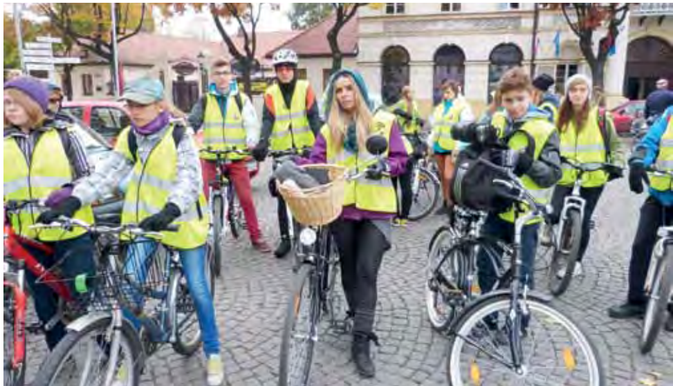
Na starcie jak zawsze pojawiła się liczna grupa gimnazjalistów ze szkoły im. Jana Wegnera z opiekunami.