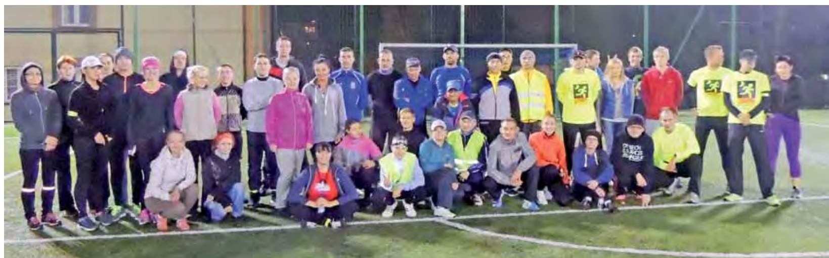
Night Runners w Żychlinie chwilę przed biegiem 8 października.

Żychlin | Zaczęło się w Poznaniu, potem była Warszawa, Płock – i Żychlin