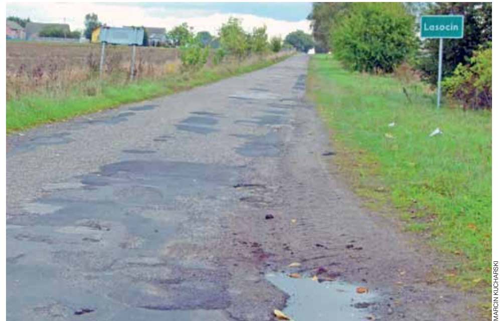
Droga z Czerniewa przez Lasocin do Osin jest drogą powiatową. Gmina dołoży do remontu jej części tylko 10 tys. złotych.

– Jeśli do niego nie dojdzie, gmina nie wyda tych 10 tys. zł – powiedział wójt Kaźmierczak. mak