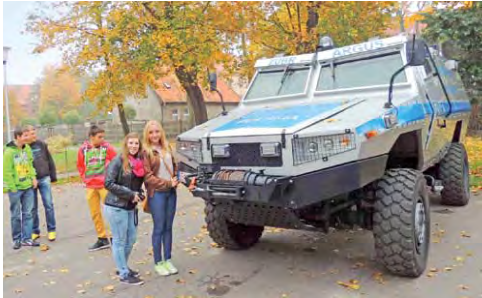
Zubr Argus – nazwa pochodzi z pewnością od mitologicznego olbrzyma z setką wiecznie czuwających oczu.

Najbardziej podobała się przyszłym policjantom wizyta na strzelnicy, gdzie obejrzeli krótki pokaz strzelecki i poznali podstawowe procedury związane z użyciem broni palnej. Po szkole uczniowie oprowadzani byli