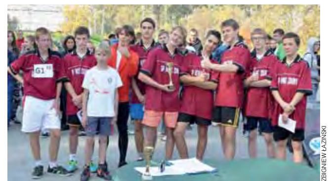
Najszybciej biegają gimnazjaliści z Nowych Zdun.