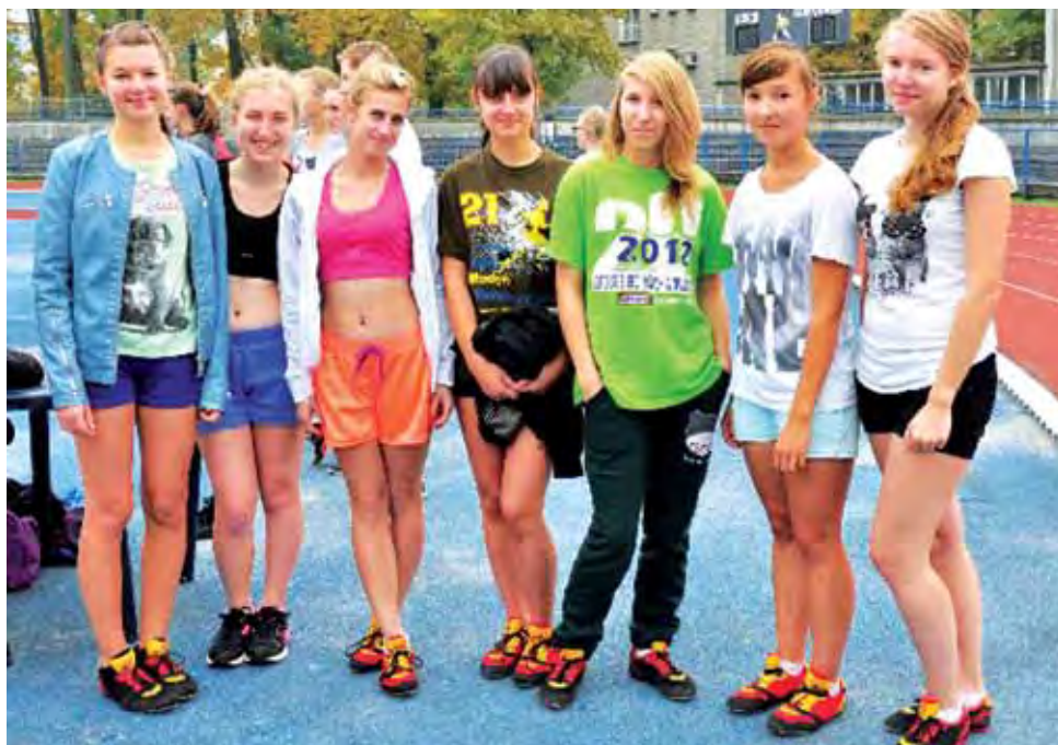
Reprezentantki Gimnazjum Żychlin - Rocznik '98-'99 podczas Mistrzostw Powiatu w LA.