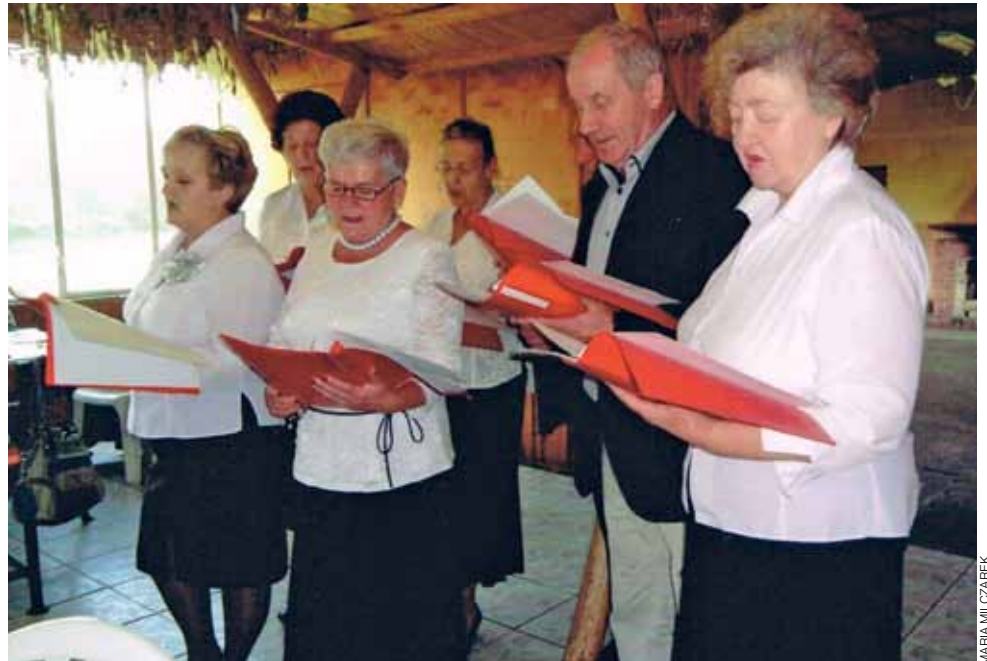
Spotkanie członków Polskiego Związku Emerytów i Rencistów uświetnił występ chóru, który wykonuje nie tylko znane utwory, ale również te, do których słowa układa sam na popularne melodie.

Emeryci, renciści i inwalidzi nie lubią siedzieć w miejscu. W tym roku pojechali na wiele wycieczek, zarówno jednodniowych,