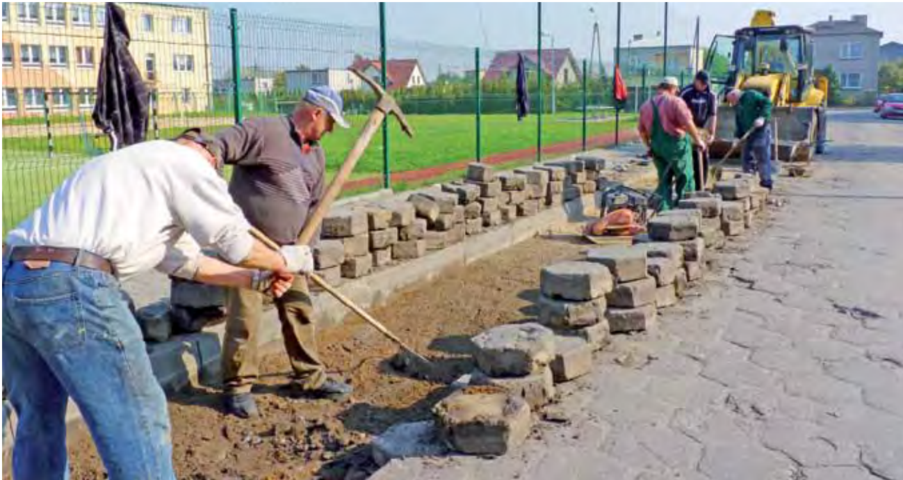
Pracownicy Mig-My poprawiają zadolenia w trylnicy na ulicy Marchlewskiego.