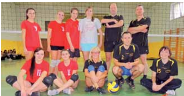
Uczestnicy meczu – Czerwone Iskry kontra Czarne Doświadczenie.

Rozegrano 5 setów. Pierwszy wygrały uczennice, drugi i trzeci należał do nauczycieli. Czwarty, grany na przewagi, zakończył się zwycięstwem dziewcząt 28 do 26. Tie-break to sukces wcześniej