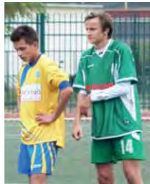
Zawodnicy Pelikana (zielone stroje) mierzą się z zespołem MKS Kutno.