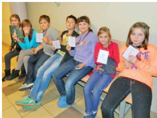
Uczniowie z Mastek pod salą wykładową Politechniki Łódzkiej.