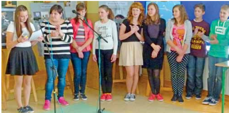
Większa część uczestników projektu tuż po seansie w szkole.

W Domaniewicach, już po raz drugi w historii, postawiono właśnie na tę ostatnią dziedzinę sztuki. W 2011 roku realizowano projekt „KinoMovie – zakładamy Dyskusyjny Klub Filmowy”. Tym razem, ponownie pod kierunkiem Gminnego Ośrodka Kultury zdecydowano się film nakręcić. Udział w projekcie wzięło w sumie 16 beneficjen-