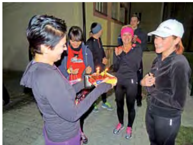
Małe urodzinowe przyjęcie wśród nocnych biegaczy.