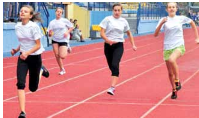
Uczestniczki biegu na 100 m - Rocznik 2000.