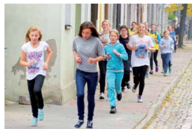
Na czas biegu ruch uliczny nie był wstrzymany, młodzież biegła więc chodnikiem. To zdjęcie wykonaliśmy na ul. Podrzecznej.