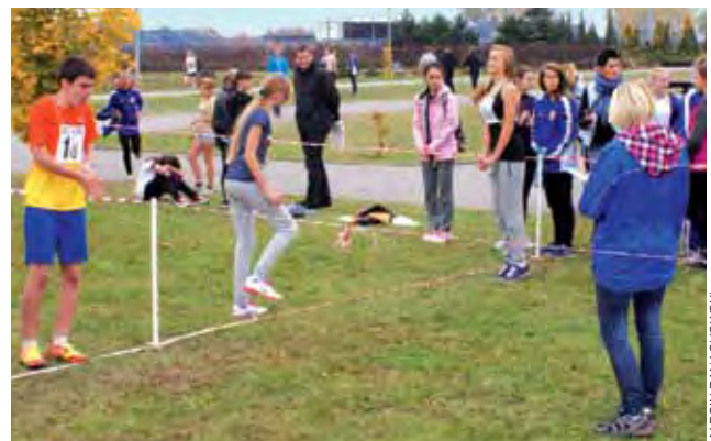
Zawodniczki Gimnazjum Żychlin przygotowujące się do biegu.