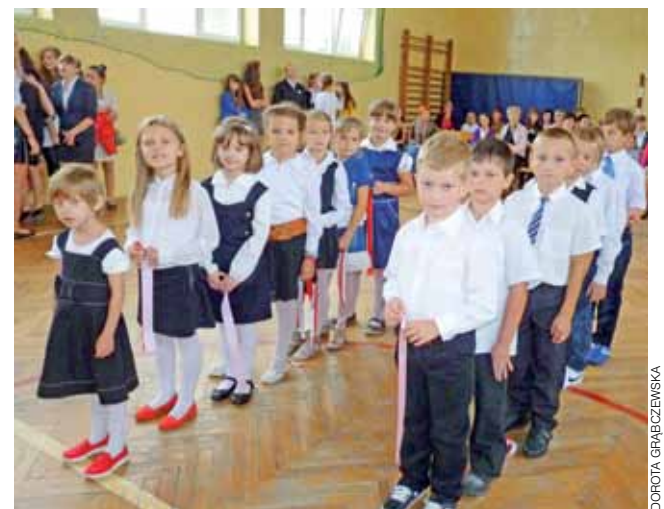
W Pacynie wśród 18 uczniów pierwszej klasy, tylko jedno dziecko jest sześciolatkiem.