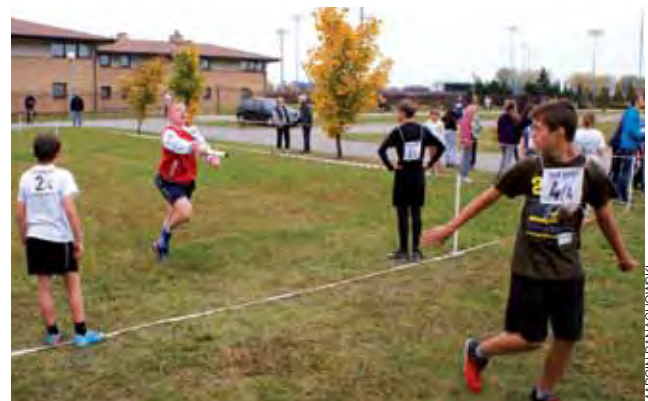
Chłopcy z Gimnazjum w Żychlinie w trakcie biegu sztafetowego.