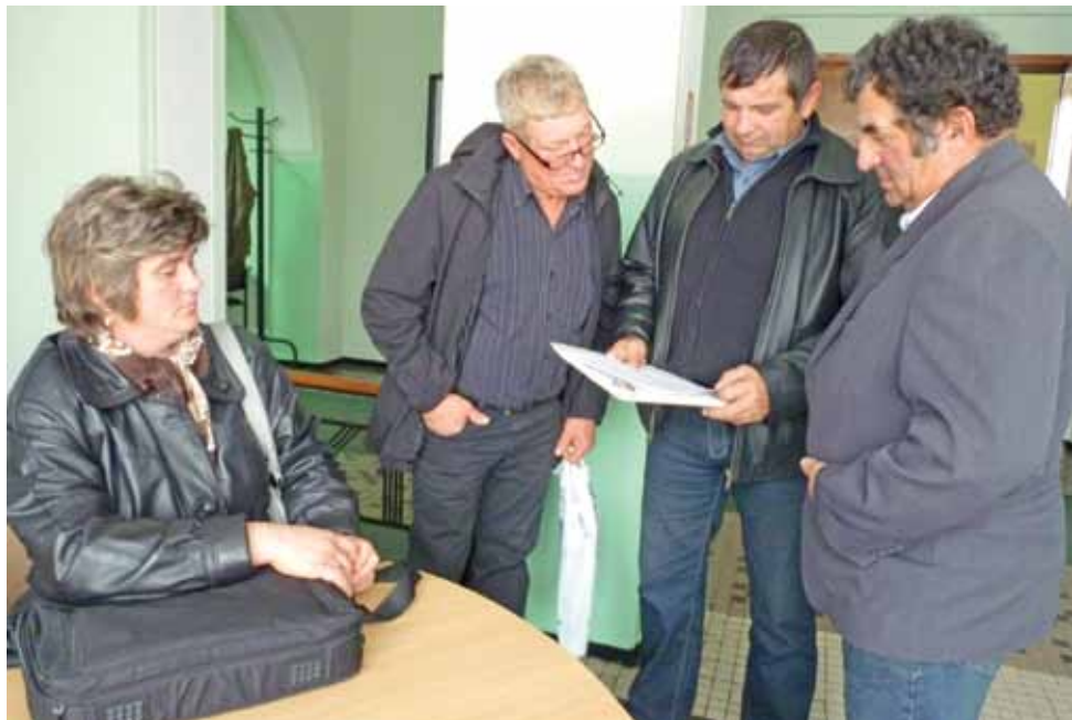
Członkowie byłego zarządu Spółki Wodnej Dobrzelin, których dziś ściga urząd skarbowy za długi spółki, poskarżyli się do Rady Powiatu Kutnowskiego na fatalny nadzór starostwa nad procesem likwidacji spółki, co skutkowało powstałym zadłużeniem. 3 października swoje argumenty przedstawiali Komisji Rewizyjnej.

“ Zapewniał, że włos z głowy nikomu nie spadnie, a zobowiązania przejmie Skarb Państwa. Zawierzaliśmy urzędnikowi, gdyż my jesteśmy tylko rolnikami.