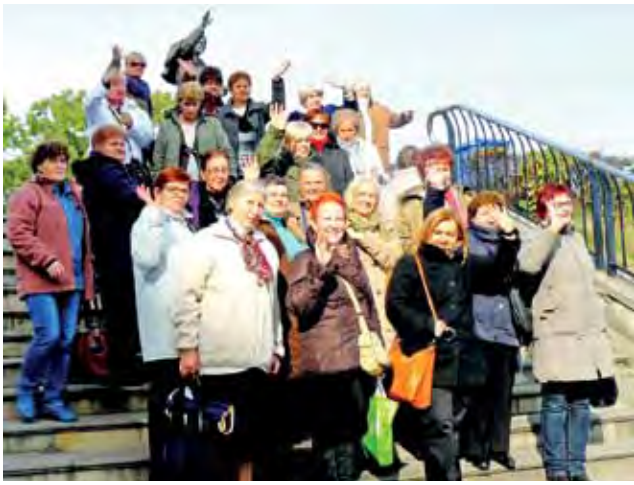
Stowarzyszenie „Łowicki Klub Amazonek” podczas pielgrzymki na Jasną Górę.