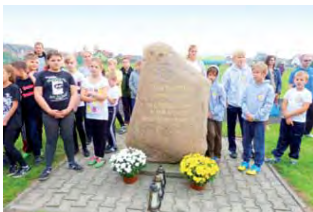
Pod kamieniem upamiętniającym miejsce, w którym JP II odprawił mszę św., zapalono znicze i postawiono kwiaty w kolorach papieskich.