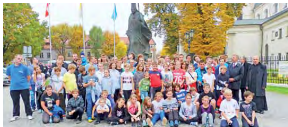
Uczestnicy Biegu Papieskiego jak zawsze stanęli przed pomnikiem Jana Pawła II, aby zrobić sobie pamiątkowe zdjęcie.

“ Koszty wszystkich wyjazdów członkowie Związku pokrywają głównie z własnych funduszy.