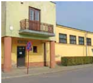
Modernizacja dawnego kina Lech będzie wykonana etapami.

Przypomnijmy, że pod koniec 2012 r. sala gimnastyczna, z której korzystała młodzież z SP 1, została wyłączona z użytkowania ze względów bezpieczeństwa.