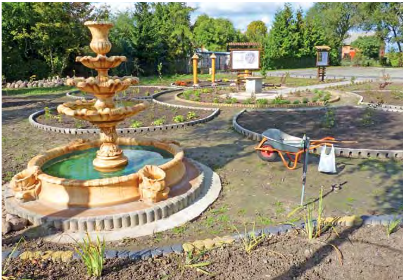
Ogród dydaktyczny w Bedlnie jest urządzany. Prace wykonują sami nauczyciele, rodzice i uczniowie. Jest w nim nawet okazała fontanna.

Bedlno | Gimnazjum kończy urządzenie ogrodu dydaktycznego