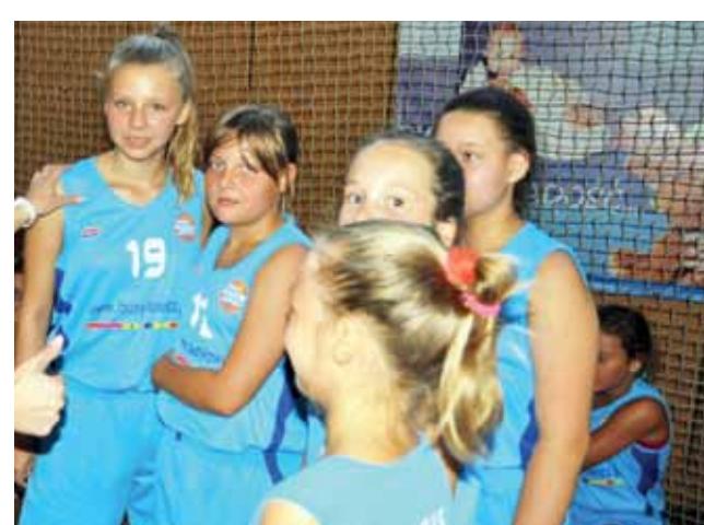
Młodziczki Księżaka będą musiały walczyć w tym sezonie ze starszymi rywalkami.