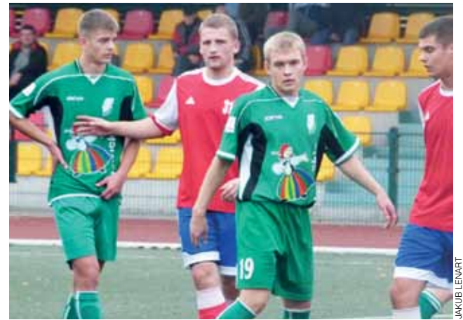
Pelikan II Łowicz – Rawka Bolimów 8:0. Przy stałych fragmentach gry piłkarze z Bolimowa starali się szczerze kryć.

W kolejnym meczu Orzeł zagra na własnym stadionie z Pogonią-Ekolog Zduńska Wola. Mecz ten odbędzie się wtorek o godzinie 16:00. divad