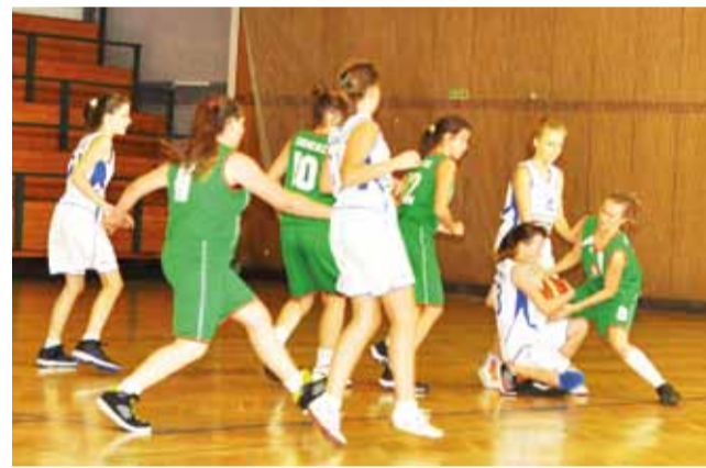
Nasze młodziczki walczyły o każdą piłkę, a mimo to przegrały.