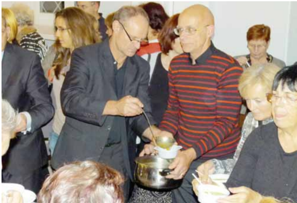
Zupa-krem z porów, ziemniaków i marchwi, którą przygotował francuski kucharz była naprawdę smaczna.