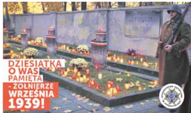
Nowa pocztówka upamiętniająca poległych żołnierzy.

Karty zostaną rozdane przez członków stowarzyszenia w czasie kwesty poświęconej ratowaniu zabytkowych grobów,