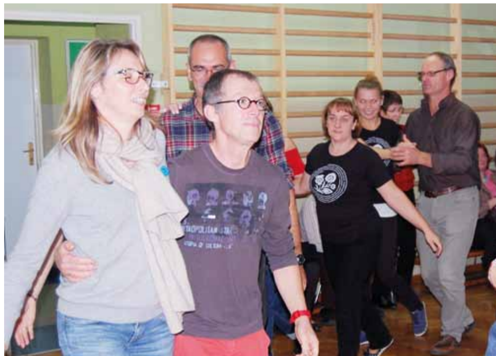
Francuzi pokazali Mazovii tańce bretońskie oraz nauczyli się łowickiego klapoka oraz obereka.