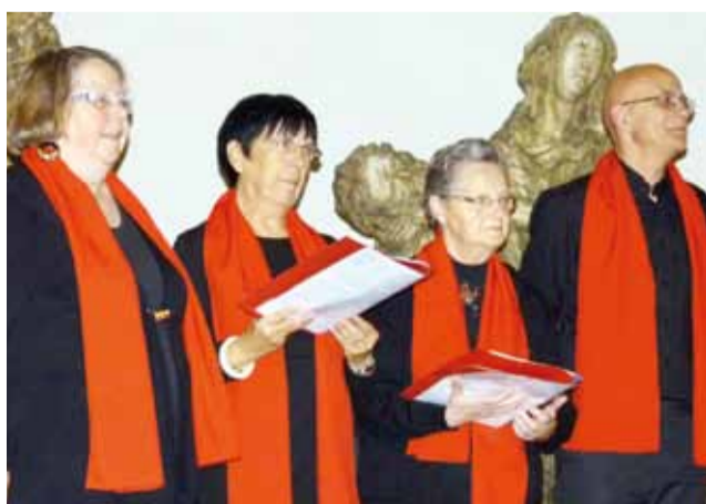
Chór Euphonia z Montoire przyjechał do Łowicza w 12-osobowym, okrojonym o połowę składzie.