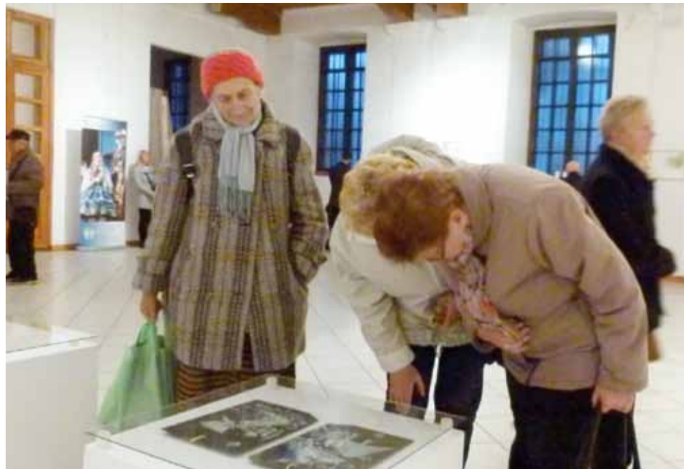
Wystawę w Galerii Browarna w Łowiczu obejrzało kilkadziesiąt osób.