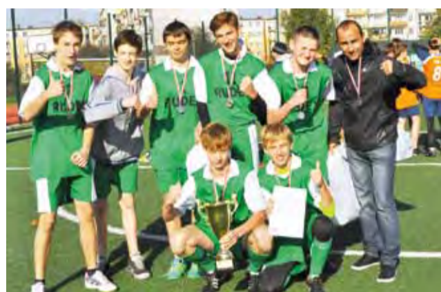
Gimnazjaliści z Bratkowic zdobyli wicemistrzowski tytuł w Sieradzu.

Mało brakowało do mistrzowskiego tytułu. Nasza ekipa pokonała zespoły z Zduńskiej Woli 3:2 i Ozorkowa 2:0, a przegrała mecz z łodzianami. Ekipa z Łodzi przegrała jednak mecz z Ozorkowem i nasi chłopcy mieli tyle samo punktów co Gimnazjum nr 18 z Łodzi i o mistrzowskim tytule zadecydowała większa ilość przyłożeń łódzkiej drużyny. To duży sukces łowic-