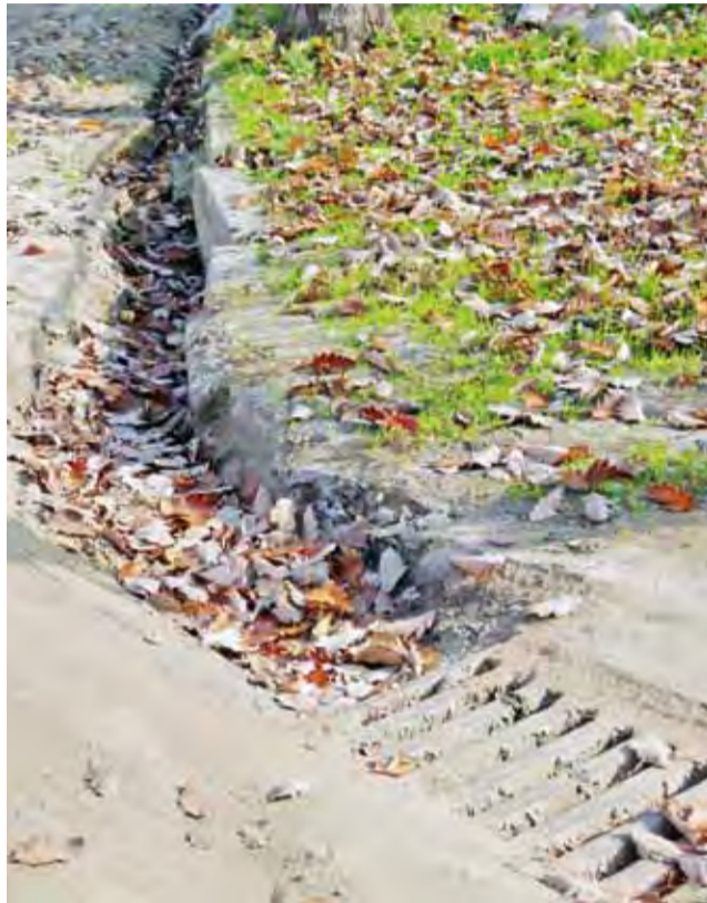
Mieszkańcy osiedla Kościuszki we własnym zakresie próbowali odprowadzać wodę z ulicy.

Do tej pory mieszkańcy posesji na osiedlu Kościuszki radzili sobie z odprowadzaniem części wody deszczowej z ulicy, własnoręcznie wykonując czy pogłębiając przyuliczne rowy i rowki odprowadzające deszczówkę. Problemem były jednak