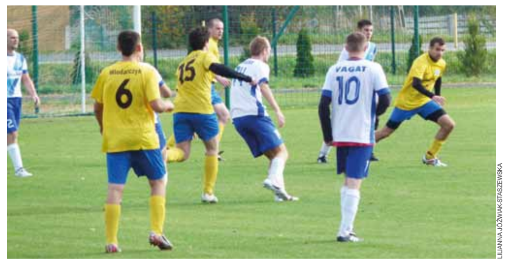
Vagat (białe stroje) to rewelacje rozgrywek. Beniaminek zajmuje wysokie czwarte miejsce w tabeli.