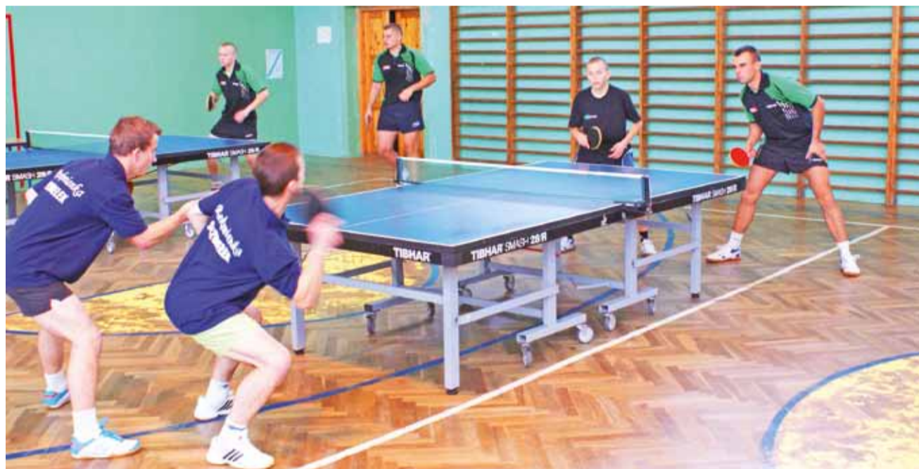
Tenisści UKS Sanniki II (V Liga) w meczu z drużyną LUKS Rzekunianka Rzekuń.

4. kolejka III ligi tenisa stołowego mężczyzn odbędzie się 17 listopada, gdzie UKS Sanniki spotkają się na wyjeździe z KU AZS SGH Warszawa. W tym samym dniu odbędzie się również V liga, gdzie UKS Sanniki II spotka się na wyjeździe z GKS Pokrzywnica.