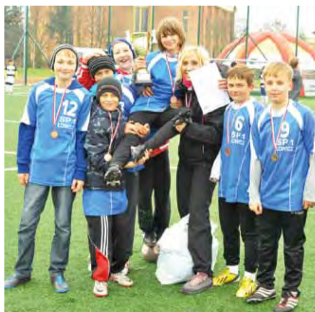
Uczniowie SP 1 Łowicz zdobyli w Sieradzu brązowe medale.

Najlepiej te trudne warunki wykorzystali uczniowie Szkoły Podstawowej 139 z Łodzi. Drużyna szkolna prowadzona przez nauczyciela wychowania fizycznego pana Jakuba Grzegorzycy-