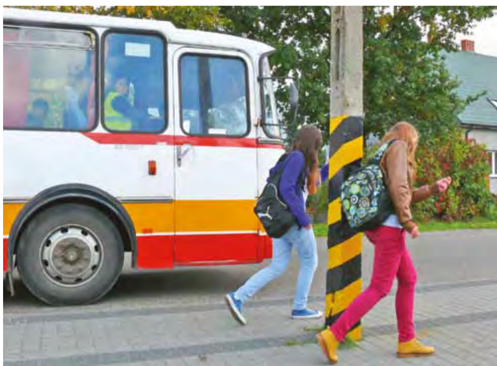
Uczennice Gimnazjum w Kompinie wysiadające na nieformalnym przystanku przy nieborowskiej OSP.

Chodzi też o to, aby autobus w miarę szybko dowiózł dzieci do szkoły w Kompinie, gdzie lekcje zaczynają się o godz. 8., po czym żeby mógł zająć się dowozem dzieci do Gimnazjum w Dzierżgówku, gdzie lekcje zaczynają się o godz. 9.