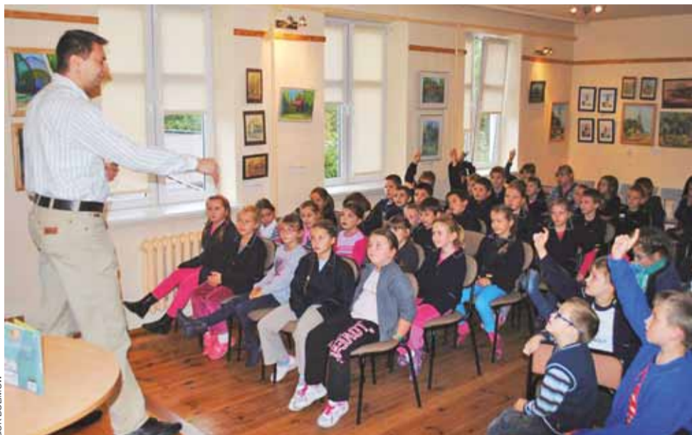
Pisarz Rafał Lasota w czasie spotkania z uczniami szkoły w Bolimowie.