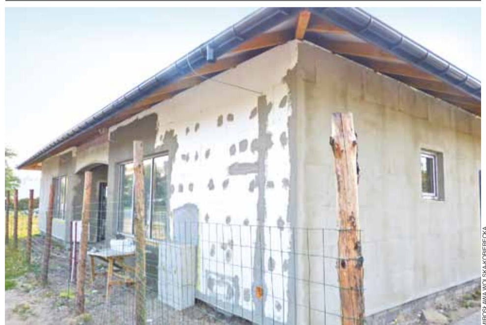
Parafia Świętego Ducha w Łowiczu prowadzi inwestycję na terenie cmentarza Emaus. Od strony ul. Tuszewskiej powstaje na nim budynek o charakterze handlowym, mający spełniać jednocześnie rolę biura obsługi cmentarza. Ma on wymiary 8,2x17,5 m. W środku przewidziane jest w jednej części biuro, magazyn i sklep z zapleczem, w drugiej – toalety oraz drugi lokal handlowy. mwk

RZUT OKIEM | TRWA BUDOWA NA CMENTARZU EMAUS