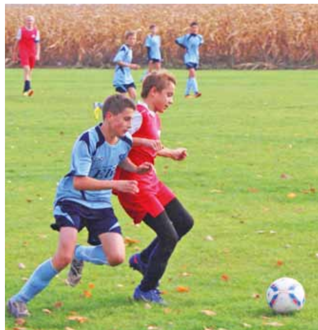
Walka o każdą piłkę w spotkaniu GKS Bedno - KKS Kozłuski.