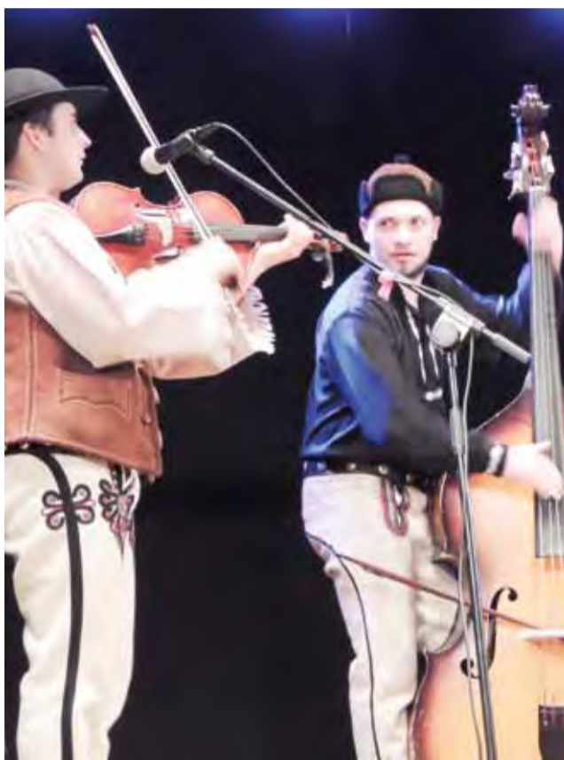
Ku czci Jana Pawła II – folkowa kapela w Żychlinie.

Drugi przetarg anulowany, nadal nie wiadomo kto wybuduje stadion w Żychlinie. str. 4