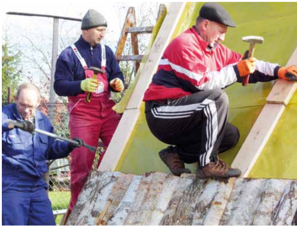
Szopa została już częściowo naprawiona. Wkrótce mają trafić do niej zwierzęta.