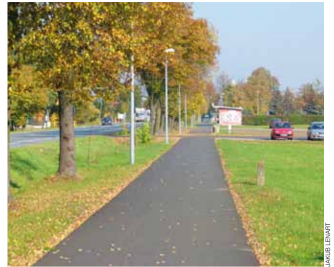
Domaniewice mogą pochwalić się nowym chodnikiem wzdłuż drogi nr 14.

Prace przy budowie kanalizacji na tym osiedlu już praktycznie zostały zakończone i ogłoszony został przetarg na naprawę dróg i regulację studzienek. Gmina zakłada, że roboty poprawiające stan drogi powinny zostać przeprowadzone do 25 listopada.