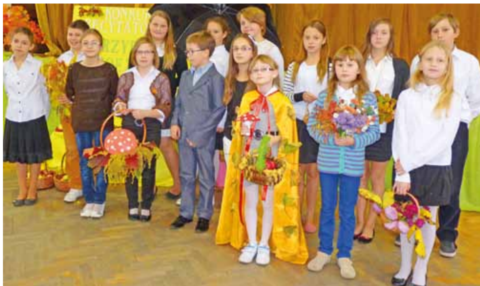
Piętnastu najlepszych recytatorów z gminy Bedno słowami poezji malowało „Barwy jesieni”.

Każda ze szkół mogła przywieźć tylko trójkę swoich najlepszych recytatorów. Największa konkurencja była w Szewcach Nadolnych, gdyż tam i szkoła jest największa. – Wśród uczniów klas II-IV do konkursu