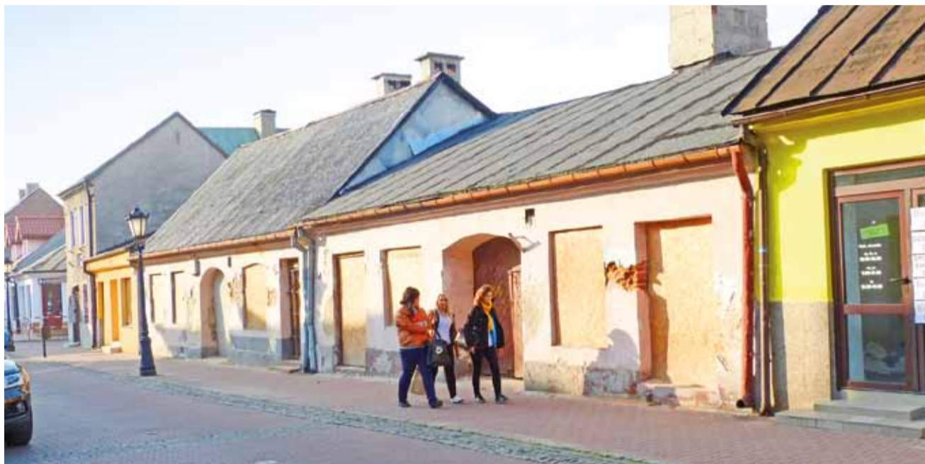
„Szmulki” od strony ul. Zduńskiej wyglądają źle, ale sprawiają wrażenie, że to solidne budynki. Po lewej budynek pod nr 18, po prawej – 16.

Do katastrofalnego stanu budynków na pewno przyczyniły się co najmniej 2 pożary, do jakich doszło już po wyprowadzeniu stamtąd mieszkańców przez Zakład Gospodarki Mieszka-