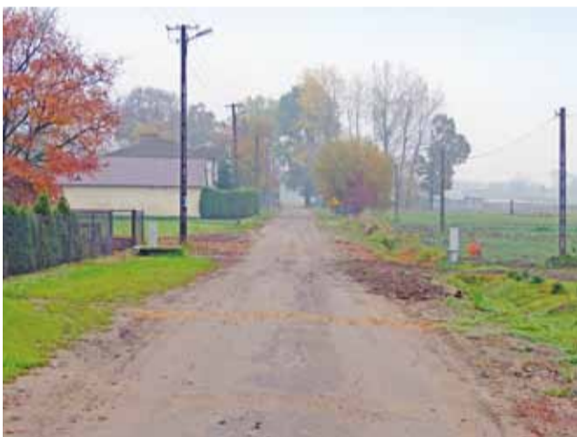
Asfaltowa czy gruntowa? Wójt mówi, że trzeba koniecznie zrobić coś z tą drogą w przyszłym roku, ale na nową nawierzchnię trzeba będzie poczekać nieco dłużej.

Z końcem września nowych chodników doczekały się także trzy ulice na terenie miejscowości Domaniewice: Leśna, Sosnowa i Kościelna. W ostatnim czasie zakończyła się także przebudowa dwóch dróg: dojazdowej do gruntów rolnych we wsi Skarłatki pod Las oraz ul. Stara Wieś w Domaniewicach.