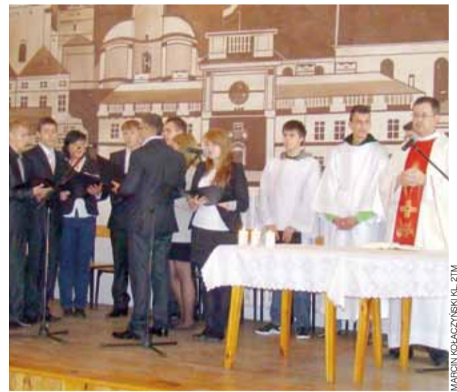
Msze święte w szkole przy ul. Podrzecznej są już tradycją od kilku lat.

Podczas mszy asystowała też schola młodzieżowa, z którą uczniowie zaśpiewali m.in. „Barکہ” i pieśni: „Panie dobry jak chleb”, „Madonna”. mak