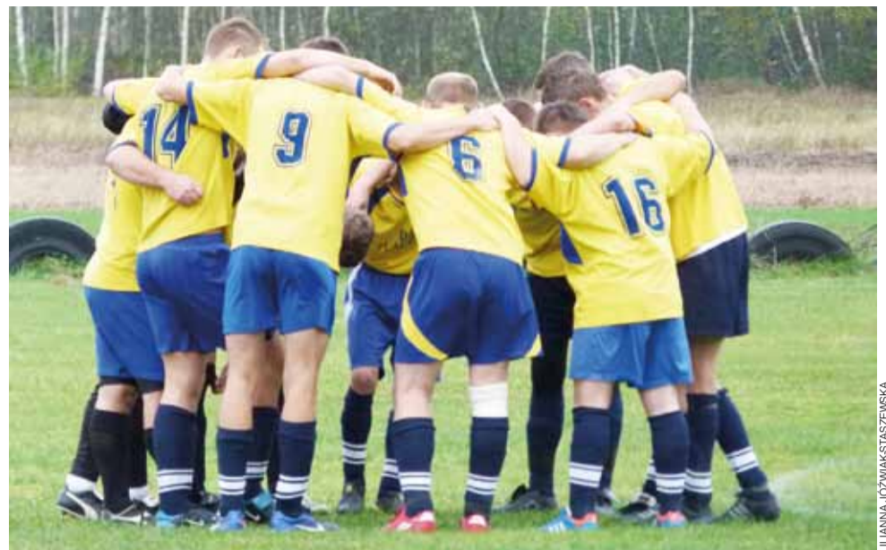
Przedmeczowa mobilizacja zawodników Daru Placencja.