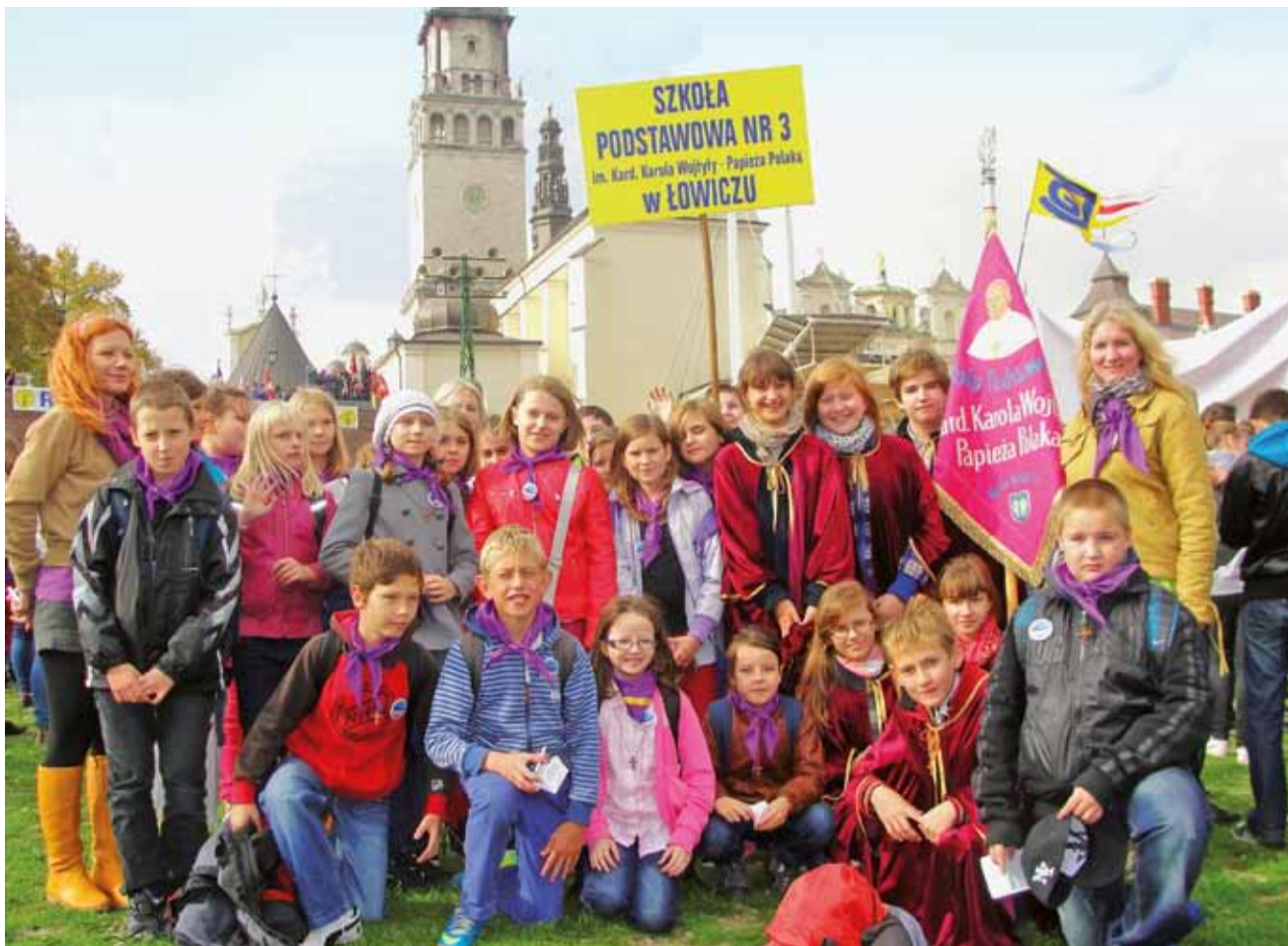
Uczniowie klas piątych SP nr 3 im. kard. Karola Wojtyły – Papieża Polaka jeżdżą na pielgrzymkę wraz z pocztem sztandarowym i opiekunami.

Łowicz - Jasna Góra | XIII Pielgrzymka Rodziny Szkół im. Jana Pawła II