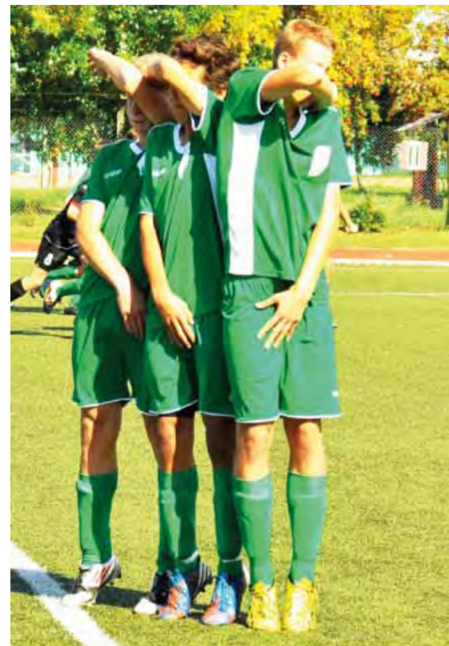
Pelikan 1999 w Wolborzu zagrał najgorszy mecz w tym sezonie.