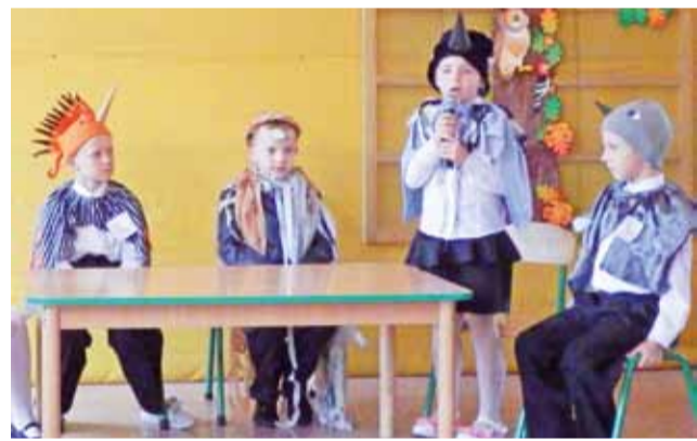
Dzieci w czasie przedstawienia z okazji Dnia Edukacji Narodowej.

W drugiej części spotkania zostali zaproszeni na projekcję filmu „Most do Terabithii”. Wyjazd przypadł do gustu zarówno młodszemu, jak i starszemu. oprac. ewr