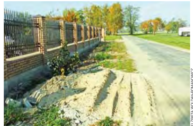
Gdzie będzie przystanek? Tu stała murowana wiata, ale podczas budowy prowadzonej na terenie po byłej szkole została zlikwidowana. Gmina szuka nowej lokalizacji.

W odpowiedzi na to pismo wójt Sylwester Kubiński informuje mieszkańców Woli Gosławskiej, że w 1997 r. gmina Bielawy nieodpłatnie przejęła wspomnianą nieruchomość od