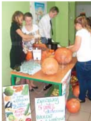
Młodzież przygotowywała zdrowe soki z owoców i warzyw.

Zespół Szkół w Oporowie zaczyna teraz realizację kolejnego prozdrowotnego programu „Trzymaj Formę”. dag