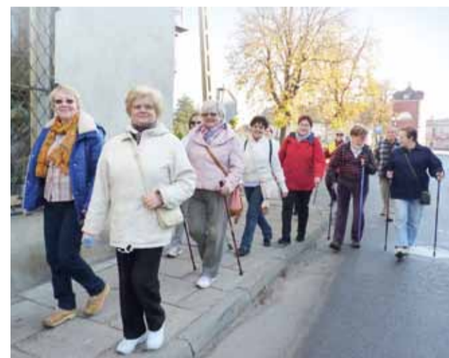
Uczestnicy Uniwersytetu III Wieku pieszo powędrowali do zamku w Oporowie.

Co ciekawe, choć gmina realizuje dużo inwestycji, zwłaszcza drogowych, to jest jedyną w województwie łódzkim, która nie ma kredytu. Taką bezkredytową politykę gmina prowadzi od wielu lat. Wszystkie inwestycje są realizowane wyłącznie z własnych środków. Okazały budynek Urzędu Gminy, który budzi zazdrość innych samorządowców, za ponad 4 mln zł, też został wybudowany kilka lat temu z własnych środków. dag