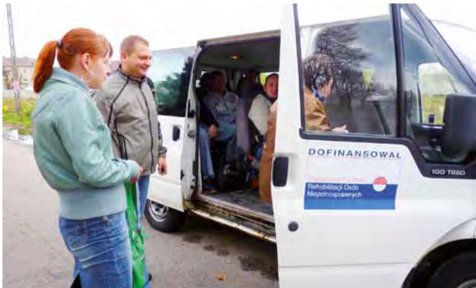
Dotychczasowy bus zakupiony przy udziale środków z Państwowego Funduszu Rehabilitacji Osób Niepełnosprawnych jest z 2004 roku. Każdego dnia kierowca WTZ rozwodzi 21 osób, robiąc po trzy kursy rano i trzy kursy po południu. Widać, że korozja „zjada” nadwozie samochodu.