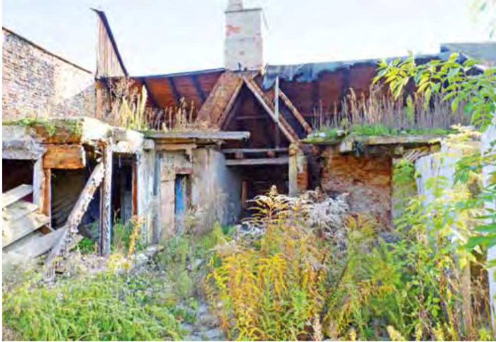
Od strony ulicy Kanonicznej widać, że to, co zostało z zabytkowej tkanki miasta, to tylko iluzja. Tak wygląda budynek pod nr 16.

– Inna sprawa to problem, czy to nadal powinna być „szmuka”, czy coś zupełnie innego – mówi architekt. Jego zdaniem inwestor i konserwator powinni to rozważyć. Może uzasadnione byłoby coś znacznie odbiegającego od obecnej architektury Zduńskiej, swoisty kontrapunkt. Bo jeśli będzie prowadzona budowa nowego obiektu, odtworzenie bryły parterowego, żydowskiego budynku miałyby sens, gdyby jego przeznaczeniem była