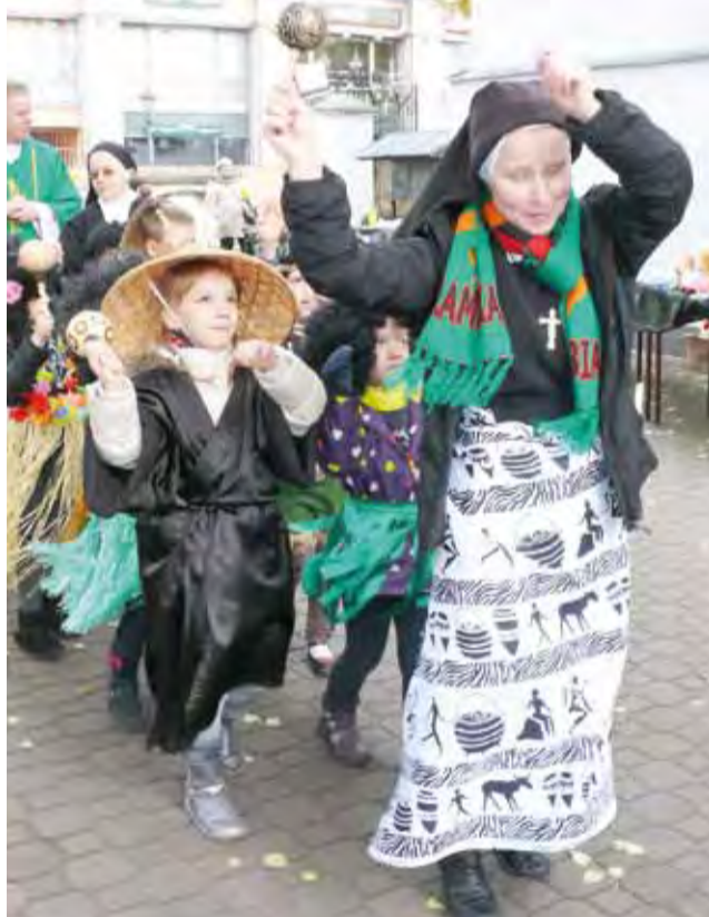
Dzieci z przedszkola diecezjalnego przebrane za mieszkańców krajów, w których działają misje wchodzą procesyjnie do świątyni, prowadzone przez jedną z sióstr.

Podkreślił też ogromny trud sióstr pracujących na misji w Lusace. Szczęśliwie mają one dostęp do wody ze studni głębinowej, hodując warzywa, ziem-