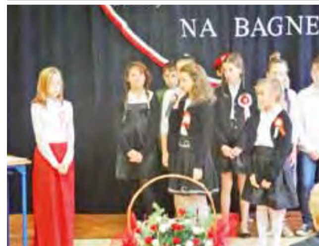
Skład wzięło się do święta Niepodległości uczniowie Szkoły Podstawowej w Bolimowie dowiedzieli się 8 listopada od Ojczyzny - uczennicy ubranej w narodowe barwy. Później inny z uczniów, który wcielił się rolę sędziwego dziadka, snuł opowieść o rozbiorach, powstaniach i I wojnie światowej, która dla Polski zakończyła się odzyskaniem niepodległości. Opowieść ta przeplatana była utworami poetyckimi i pieśniami z tamtego okresu, wykonanymi przez chór. tb