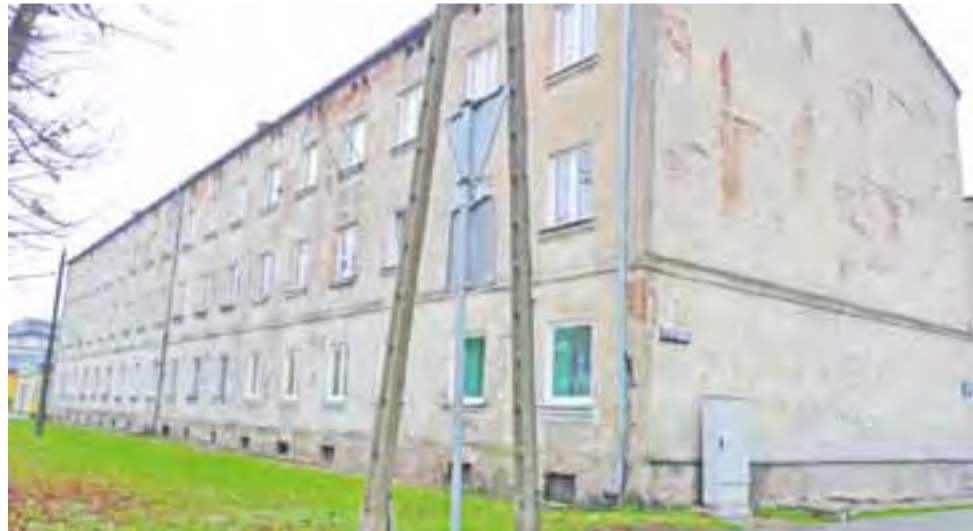
W 2014 roku cały budynek przy ul. Narutowicza 79 należący do Spółdzielni Mieszkaniowej Wspólny Dom ma mieć nową elewację. Odpadający tynk zostanie skuty i ułożony nowy. Ma być bezpiecznie i estetycznie.

O fatalnym wyglądzie kilku bloków należących do Spółdzielni Mieszkaniowej Wspólny Dom pisaliśmy w lutym. Odpadający tynk nie tylko szpeci blo-