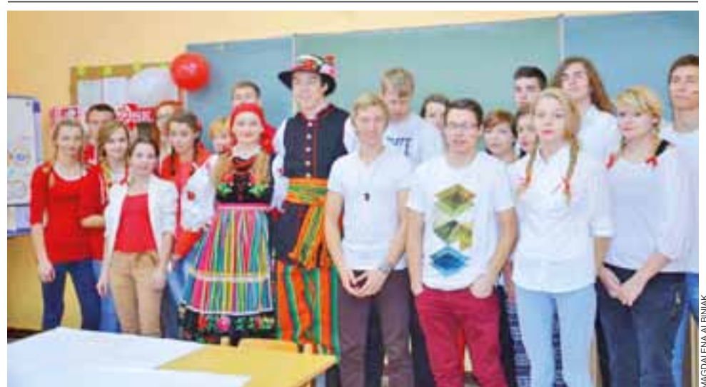
8 listopada w Zespole Szkół w Żychlinie z okazji Święta Odzyskania Niepodległości odbył się konkurs na najbardziej patriotycznie ubraną klasę. W szkole nie zabrakło uczniów ubranych w kreacje w kolorach barw narodowych, mundury harcerzy, żołnierzy czy w stroje ludowe. Część uczniów malowała narodowe barwy na policzkach i wiązała biało-czerwone kokardy na warkoczach. Na zdjęciu zwycięska klasa II a LO. ag