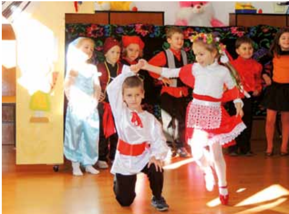
Rumuńskie dzieci z przedszkola w Suczawie tańczą polskie tańce narodowe specjalnie dla uczestników projektu.

Kiedy biegli z powrotem do świątyni zatrzymał ich mężczyzna mówiący płynną angielsz-