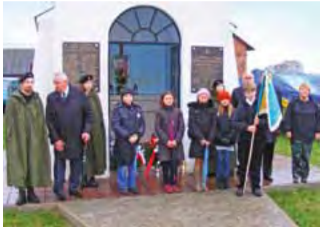
Pod kapliczką w Julianowie uroczystość Święta Niepodległości zgromadziła przedstawicieli różnych środowisk.