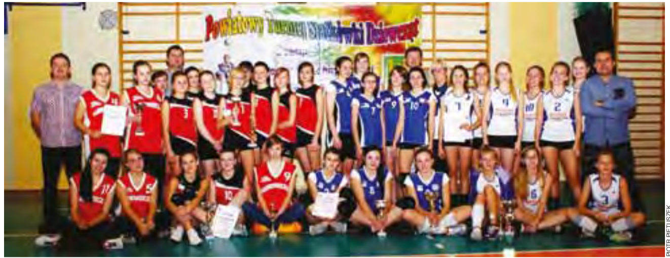
Uczestniczki Powiatowego Turnieju Siatkówki Dziewcząt w Kutnie z okazji Święta Niepodległości.