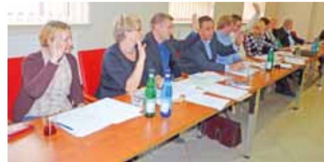
Podczas obrad sesji propozycję burmistrza, by podatki pozostawić na poziomie roku 2013 przyjęto jednogłośnie.

I taką propozycję burmistrza radni przyjęli jednogłośnie. dag