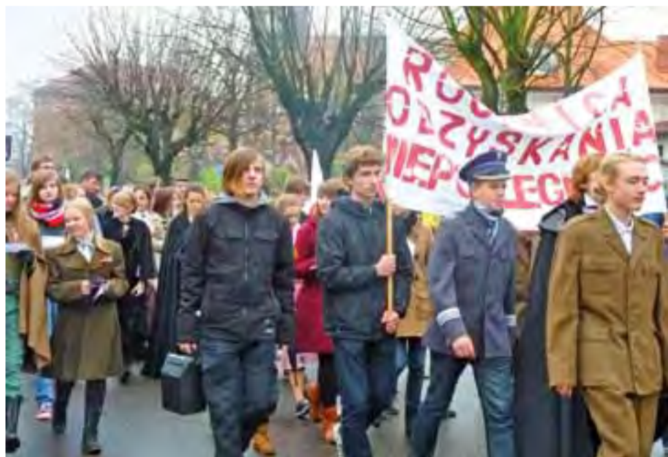
Specjalnie na marsz patriotyczny uczniowie szkoły pijarskiej starają się ubierać w stroje z dawnych epok.