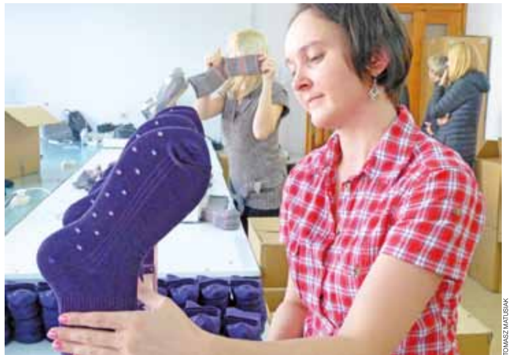
Nawet nowoczesne maszyny nie zastąpią we wszystkim ludzkich rąk.

Gospodarka | Dwie firmy z okolic Łowicza: Steven i SOX, zaprezentowano w telewizji Polsat