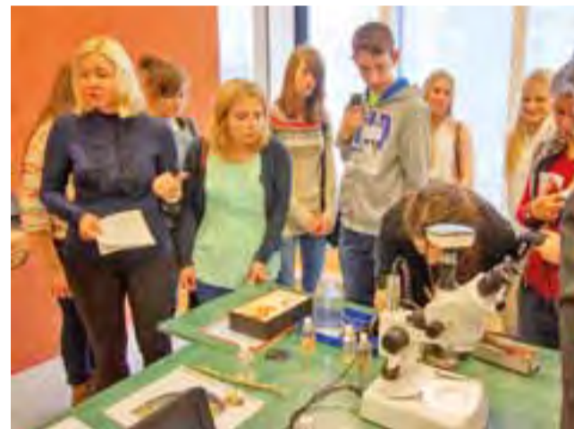
Podczas pobytu w Estonii w ramach Comeniusa dotyczącego wpływu gatunków inwazyjnych, uczestnicy projektu brali też udział w zajęciach laboratoryjnych oglądając rośliny i zwierzęta pod mikroskopem.

w którym uczestniczą, dotyczy gatunków inwazyjnych w laboratoryjnym centrum uczniowie oglądali preparaty roślin i zwie-