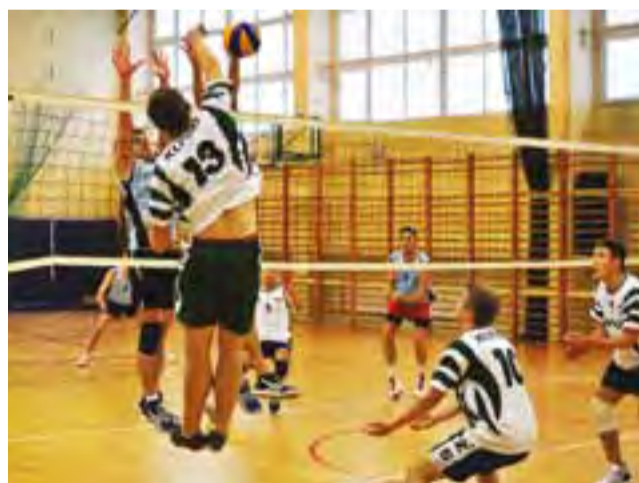
Mecz finałowy pomiędzy Volley Team Żychlin a AZS WSGK Kutno.

Rozegrane spotkania wyłoniły walczących o III miejsce w turnieju oraz finalistów. W meczu, w którym stawką było III miejsce zmierzyły się dwa kutnowskie zespoły: Marpap Kutno pokonał Zryw Kutno 2:1. Zespół Volley Team Żychlin stoczył walkę o pierwsze miejsce