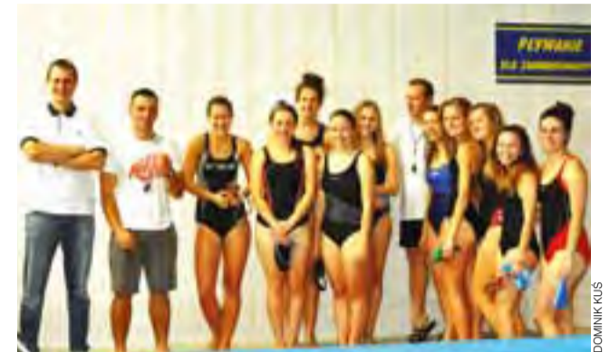
Rywalizację szkół ponadgimnazjalnych wygrały dziewczęta z I LO.

Po gimnazjalistach do akcji ruszyli pływacy ze szkół ponadgimnazjalnych. W rywalizacji dziewcząt były tylko trzy sztafety, wśród których najszybsze okazały się pływaczki z I LO (nauczy-