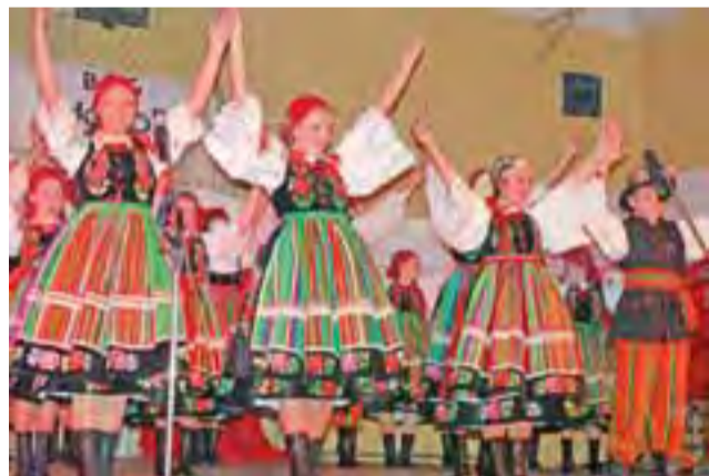
Ludowy Dziecięcy Zespół Pieśni i Tańca Pacyna zachwycił publiczność, która nagrodziła młodych artystów gromkimi brawami.

Pleckowianki podkreślają, że świetlica ułatwi im integrację. Tradycją w Pleckiej Dąbrowie stała się organizacja wigilijnego spotkania mieszkańców. W wyremontowanej świetlicy będzie sylwester, a już na andrzejki tradycyjnie solenizanci z III kwartału zorganizują wspólną zabawę. ■