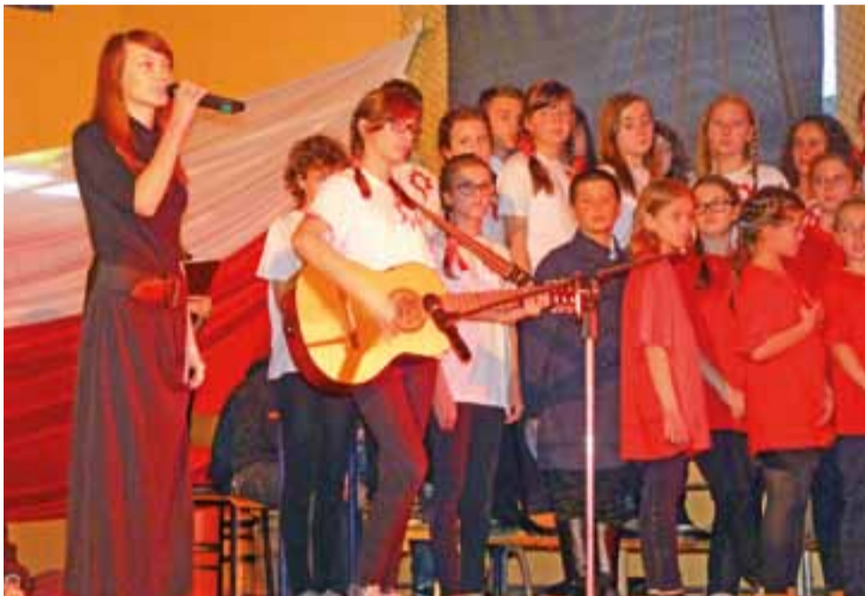
Dzieci ze szkoły podstawowej i gimnazjum w Pacynie zaprezentowały widowisko muzyczno-patriotyczne z okazji odzyskania niepodległości. Pokazali jak Polacy na przestrzeni wieków o nią walczyli.

Druga część to pokaz polskich tradycji związanych z ubijaniem masła w kierzankach, kiseniem kapusty i darcim pierza. Były ludowe przyspiewki, towarzyszące przed laty takim spotkaniom, oczywiście wyśpiewane w gwarze ludowej. str. 6