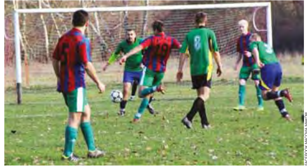
Zawodnicy Daru Placencja (zielone stroje) nieznacznie ulegli w Makowie 1:0, tracąc gola w końcówce meczu.

W rozegranej awansem 14. kolejce okręgówki w niedzielę 17 listopada zagrają: Korona – Olympic (11:00), Orleńta – Czarni (11:00), Bełchów – Vagat (11:15), Chaśno – Jeżów (11:30), Pelikan II – Astra (13:00), Juvenia – Laktoza (13:00) i Rawka – Drzewce (11:00).