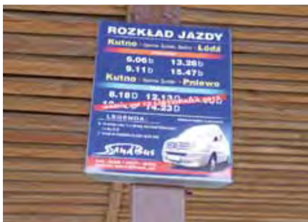
Sandbus już wywiesił swój rozkład na przystanku w Oporowie.

– Podjąłem starania, aby prywatne busy firmy Sandbus pojawiły się na terenie naszej gminy. – Nie wiem kiedy przewoźnik ruszy, mam nadzieję, że jesz-