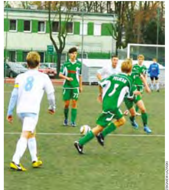
Pelikan 1998 ambitnie powalczył z UKS SMS Łódź.

W rozegranej awansem 12. kolejce B klasy w weekend 16-17 listopada zagrają: Jamno – Ostrowiec (niedziela, 14:00), Macovia II – Mokra Prawa (sobota, 14:00), Rawka II – Kopernik (niedziela, 11:00), Korona II – Start (niedziela, 14:00), Fenix – Zabostów Duży (niedziela, 14:00) i Bielawy – Niedźwiada (niedziela, 11:00).