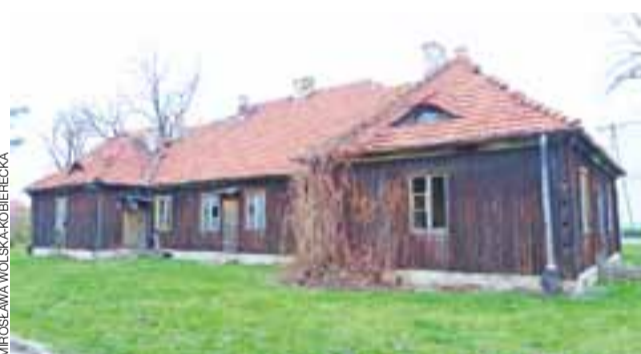
Alkierzówka popada z ruinę z miesiąca na miesiąc. Uratowanie tego zabytku będzie jednek "stono" kosztować.