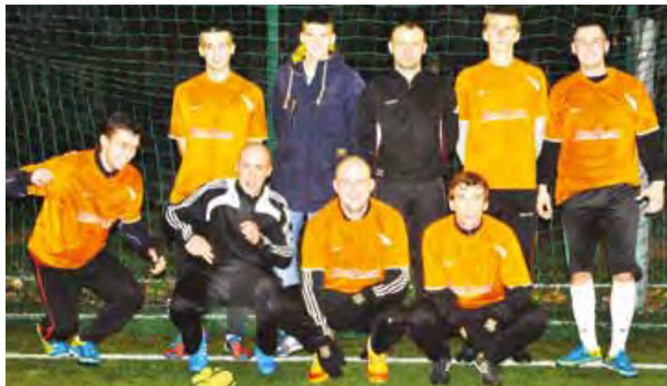
Mistrzem II edycji Łowickiej Ligi Orlika została ekipa EKO-PLAST Renix Łowicz.

W drugim meczu o punkty walczyły BTW Pizzerii Filip Łowicz z SMS Dąbkowice. W zaciętym pojedynku padł wynik 1:1 i ten wynik przedłużył nadzieję Pizzerii Filip na zakończenie rozgrywek na podium. W ostatnim meczu w II edycji Łowickiej