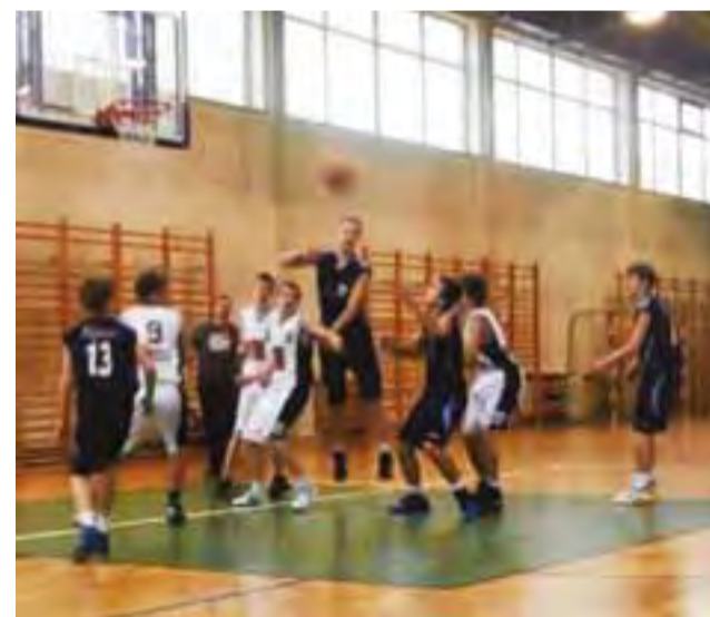
Mecz pomiędzy ASZ PWSZ Skierniewice a UKS Żychlin zakończył się przegraną koszykarzy z Żychlina 52:47.

Czwartą kwartę drużyna UKS przegrała 13:8. Na wynik końcowy miało wpływ zejście z boiska za przewinienia dwóch podstawowych graczy - Rafała Pietrza-