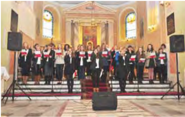
Chór Allegro z Zespołu Szkół nr 1 w Żychlinie podczas koncertu z okazji Święta Niepodległości.