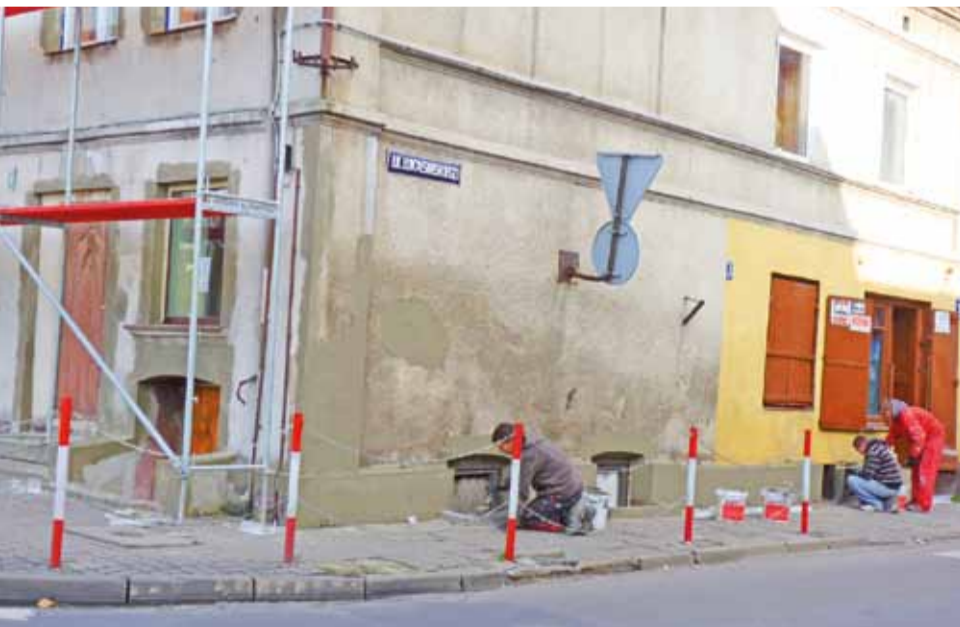
Pracownicy firmy Elvis we wtorek, 12 listopada, rozpoczęli remont elewacji kamienicy komunalnej na rogu ulic Łukasińskiego i 29 Listopada.

Tylko w ciągu ostatnich kilku miesięcy zrobiono elewację na budynku stojącym przy ulicy Narutowicza, w którym znajduje się salon Play i kwaciarnia. Nową elewację zyskała też przychodnia „Promed”, ciąg sklepów po prawej stronie ulicy Narutowicza. Inwestycje prywatnych przedsiębiorców sprawiają, że cen-