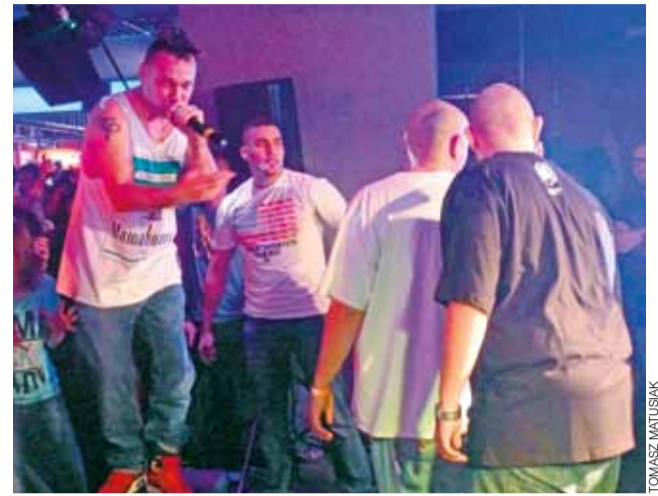
Hip-hopowcy z Hemp Gru rozkręcają publiczność zgromadzoną w Trójkącie.

Około 300 osób bawiło się 16 listopada na kolejnej imprezie w niedawno otwartym klubie Trójkąt na rogu Bielawskiej i Nowego Rynku. Tym razem królował tam hip-hop, a gwiazdą wieczoru była formacja Hemp Gru, a wcześniej grali nieco mniej znani, ale wykonujący podobną muzykę Cywil i WGWC (W Gorącej Wodzie Company).