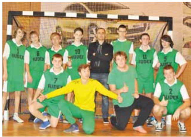
Uczniowie Gimnazjum nr 4 zostali mistrzami Łowicza w piłce ręcznej.