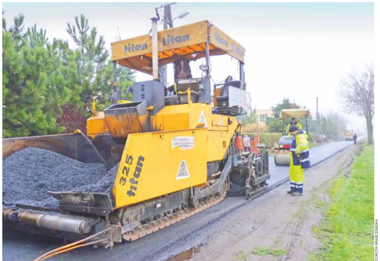
Mieszkańcy Żabikowa byli zadowoleni z pracy PRD, która układała nową nawierzchnię bardzo sprawnie.

Dlaczego do remontu drogi powiatowej w Żabikowie włączyli się mieszkańcy gminy Oporów? Otóż pierwszych ok.