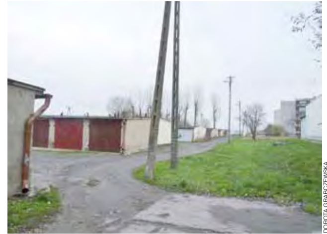
Spośród czterech lamp wzdłuż kompleksu ok. 100 garaży przy ulicy Żeromskiego pałą się tylko dwie. Pozostałe 2 zostały wyłączone 22.10.

Informacje właścicieli garaży okazały się prawdą. Przyczyną