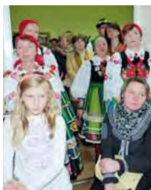
Tegoroczny Dzień Seniora zgromadził tak dużo osób, że niektórzy stali w przejściu i w korytarzu.