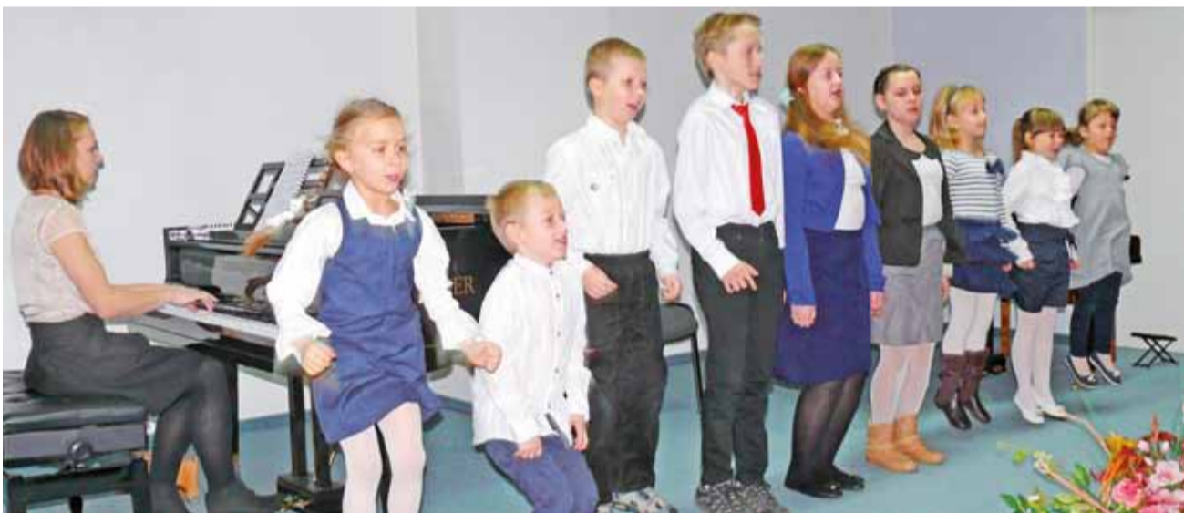
Dla uczniów szkoły była to ważna, choć wesoła uroczystość.

Po spotkaniu chętni mogli zakupić książki księdza, a także poprosić o autorskie autografy. Wyłożone egzemplarze rozszły się bardzo szybko. Całkowity zysk z ich sprzedaży zostanie przeznaczony na utrzymanie Fundacji Parafii Ormiańsko-Katolickiej. tm