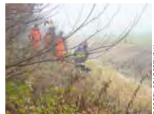
Ciało 55-letniego mężczyzny wyłowiono ze Studwi w czwartek 14 listopada po godzinie 9.

Denata z rzeki wyciągnęli strażacy z OSP Żychlin. Zdarzenie miało miejsce na wysokości zakładu Emit i ogrodów działkowych. Woda w rzece nie jest wysoka, ma kilkadziesiąt centymetrów głębokości, a rzeka ma szerokość ok. metra. Za to jest stroma skarpa wzdłuż rzeki. W czwartkowy ranek panowała gęsta mgła. – Przybyły na miej-