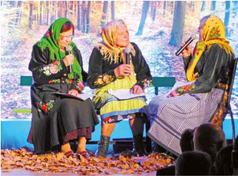
Rozmowa o Tuwimie w gwarze Łowickiej. Publiczność reagowała jak na najlepszy skecz kabaretowy.