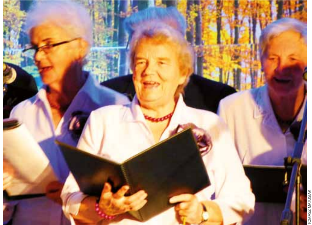
Zespół wokalny "Wrzos" w czasie występu.