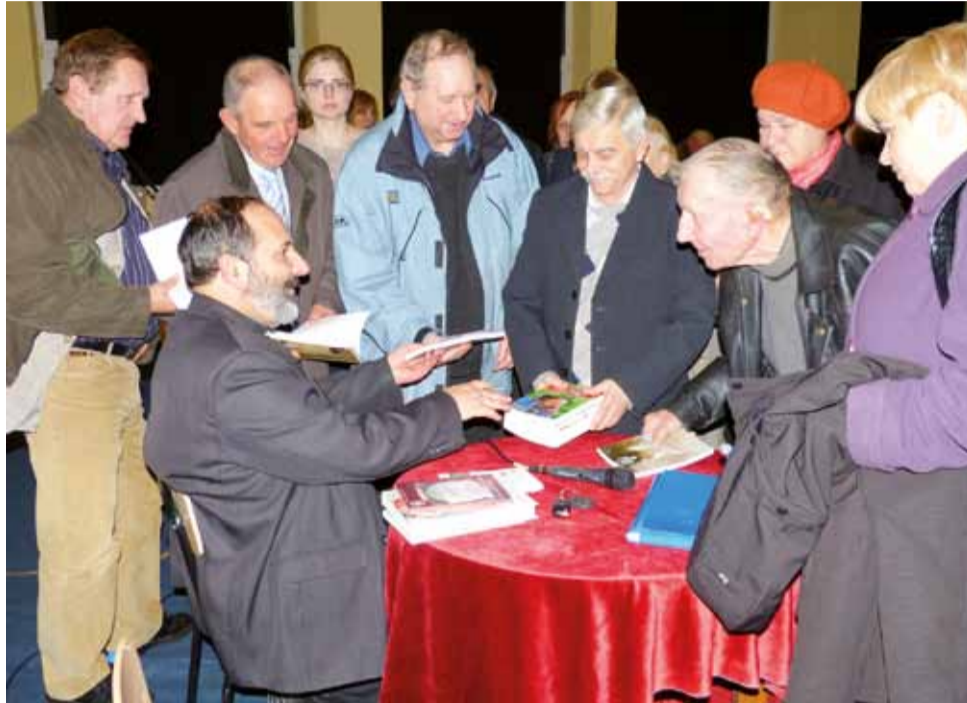
Po spotkaniu. Ksiądz Isakowicz-Zaleski rozdaje autografy na egzemplarzach jego książek.

Ksiądz Isakowicz-Zaleski za główne przyczyny eskalacji przemocy na Kresach uważa panujący wśród Ukraińców etos Kozaka, znacznie bliższy Tatarom czy Turkom, niż rycerstwu, a także fascynację ukraińskich nacjonalistów faszystem, nazizmem i kultem siły, a także świadome podburzanie do okrucieństwa prostej ludności, przez przywódców nacjonalistów i Cerkiew greko-katolicką. Podkreślał jednak, że również wielu Ukraińców ryzykowało życie za pomoc polskim sąsiadom, wielu też zginęło za to w męczarniach. – Można powiedzieć, że OUN, UPA i SS Galizien to swego rodzaju wrzód, który wyrósł na tym narodzie, niestety udało im się omamić i doprowadzić do nieprawdopodobnego bestialstwa wielu prostych ludzi.