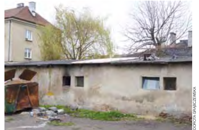
W sobotę wieczorem płonął jedna z komórek przy Narutowicza. Dzięki szybkiej akcji strażaków nie spłonęły pozostałe.