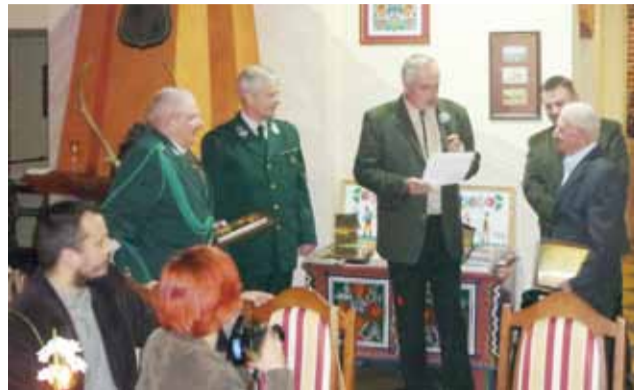
Pamiątkowe dyplomy wręczono trzem wieloletnim członkom koła.

W funkcjonowaniu koła kładzie się duży nacisk na kultywowanie tradycji łowieckiej, m.in. poprzez organizowanie uroczystych polowań hubertowskich.