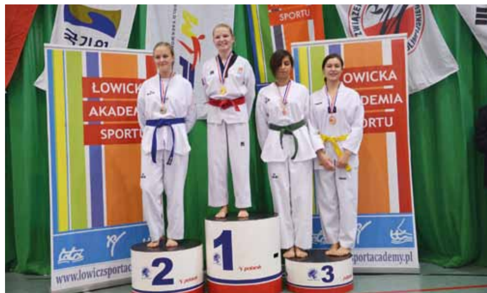
Podium w rywalizacji dziewcząt 9-11 lat w tradycyjnym poomsae.