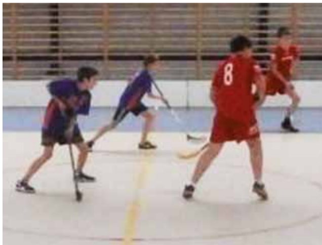
Mecz unihokela drużyny zwycięskiej ze Szkoły Podstawowej w Grabowie z reprezentacją Szkoły Podstawowej w Szewcach podczas rozgrywek powiatowych w Bednie.