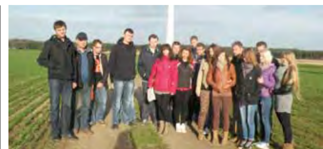
Uczestnicy projektu podczas wycieczki na fermę wiatrową.

Naczelnik jednostki przyznał, że chciałaby ona w niedalekiej przyszłości stworzyć drużynę młodzieżową, dlatego młode osoby zainteresowane nurkowaniem i działaniem w ramach struktur OSP-RW są prozono o kontakt, podobnie jak osoby zainteresowane rekreacyjnym nurkowaniem. Jak przyznał, najprościej jest przyjść w niedzielę na basen. Strażacy spotykają się na nim w godzinach 8-10. Jest też w tych godzinach możliwość spróbowania nurkowania, ale wcześniej trzeba o tym strażaków uprzedzić, muszą bowiem zabezpieczyć dodatkowy akwalung.