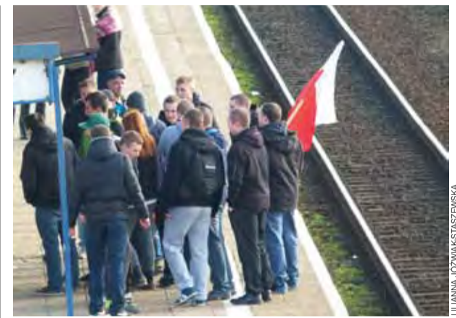
Łowicka Młodzież Wszechpolska tuż przed odjazdem pociągu w kierunku Warszawy.