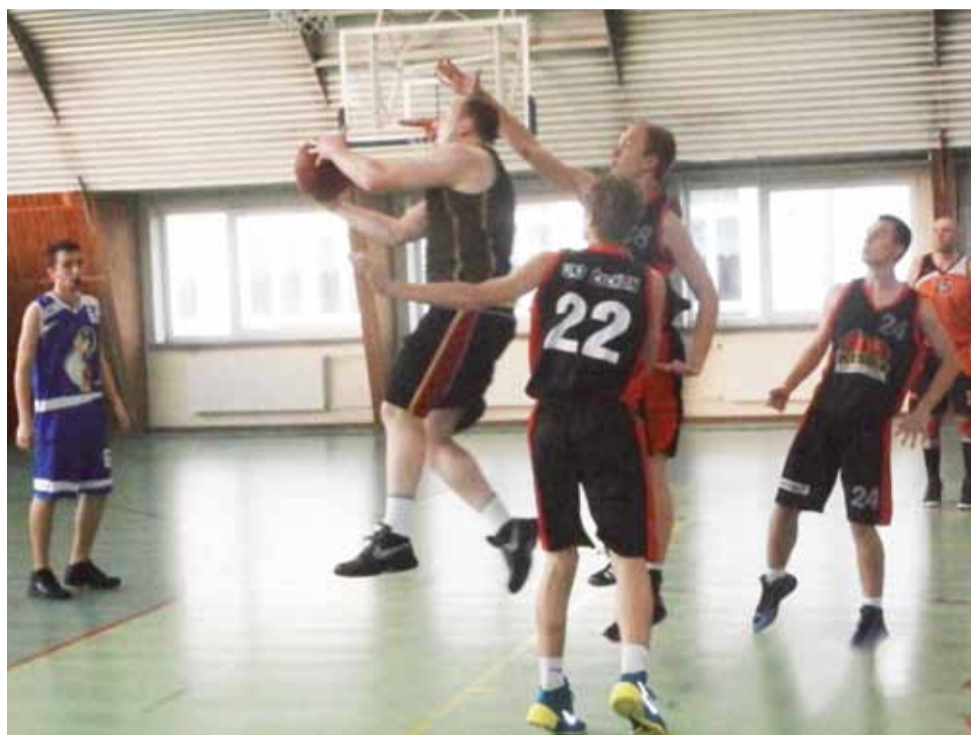
UKS Żychlin w wygranym meczu z zespołem Avatary Kutno.