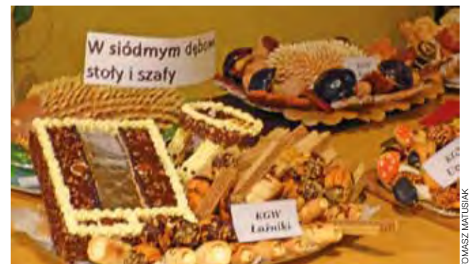
Wierszyki Tuwima mogą być inspiracją także w kuchni. Udowodniły to panie z Kół Gospodyń Wiejskich przygotowujące "Słodką lokomotywę".