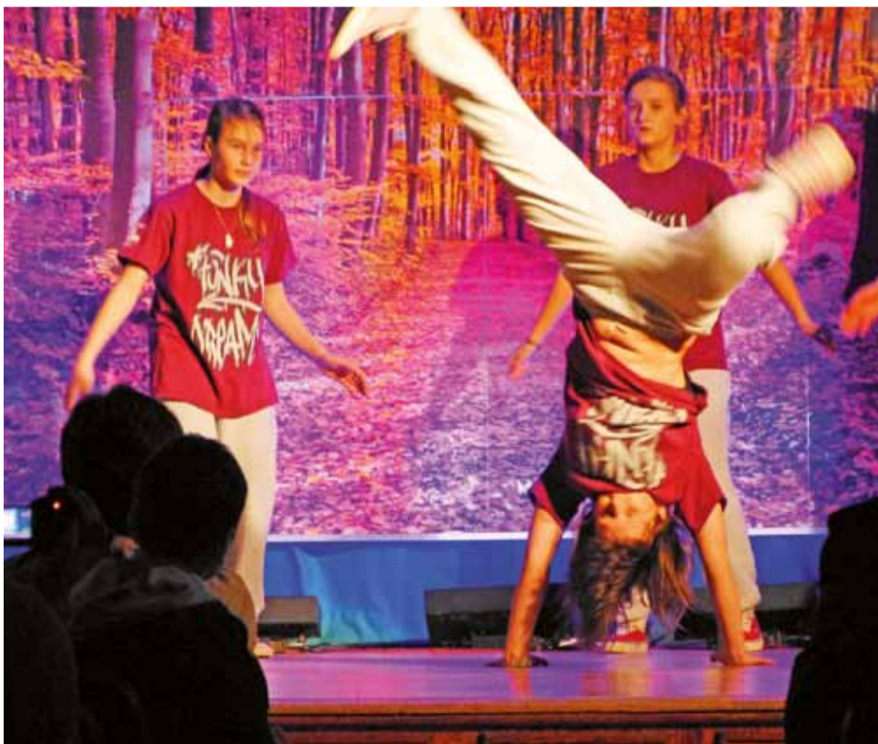
Szalony taniec w wykonaniu żeńskiej części "Funky Dreams".

W czasie uroczystości ogłoszono też wyniki i wręczono nagrody oraz wyróżnienia w kilku jesiennych konkursach. W konkursie plastycznym dla klas 0-III szkoły podstawowej