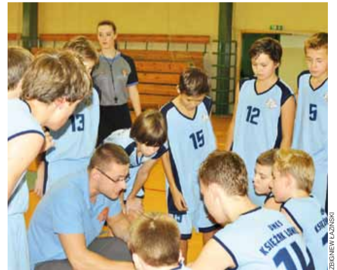
Młodzicy Księżaka z rocznika 2000 i 2001 na razie w lidze bez zwycięstwa.