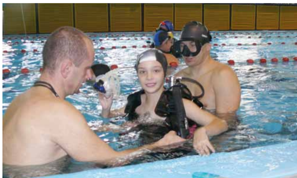
Dzieci ze szkoły pijarskiej mogły przez chwilę poczuć się jak prawdziwi nurkowie. Wyposażone w akwalung, pod okiem specjalistów zanurzały się pod wodę na dłuższą chwilę.

Po uczniach widać było, że zajęcia zostały przyjęte z dużym entuzjazmem. Dla większości był to pierwszy kontakt z nurkowaniem