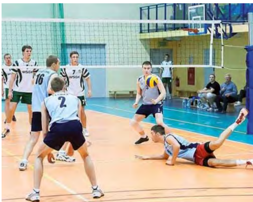
Spotkanie AZS WSGK Kutno z drużyną Volley Team Żychlin podczas 2. kolejki KALS Mężczyzn.