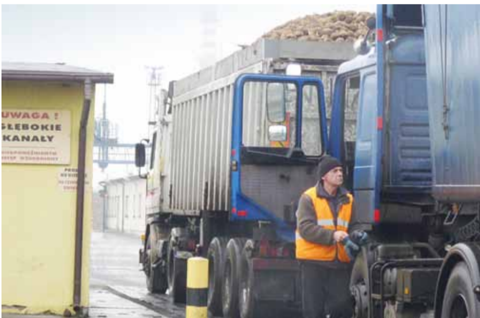
Od kilku lat buraki do cukrowni Dobrzelin są zwożone przez wyspecjalizowane firmy, według ustalonych harmonogramów.

sza, z biura prasowego Grupy Energa. Dlaczego ten urzędnik takie polecenie wydał, czy wiedział o tym burmistrz, oraz czy oświetlenie zostanie przywrócone – chcieliśmy zapytać burmistrza, ale do chwili zamykania tego numeru NE nie znalazł dla nas czasu. dag