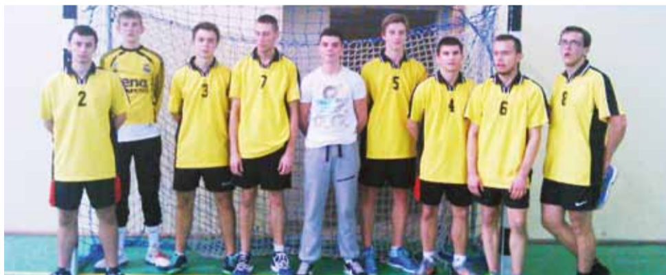
Reprezentacja LO im. A. Mickiewicza w Żychlinie podczas Mistrzostw Powiatu w Piłkę Ręczną Chłopców