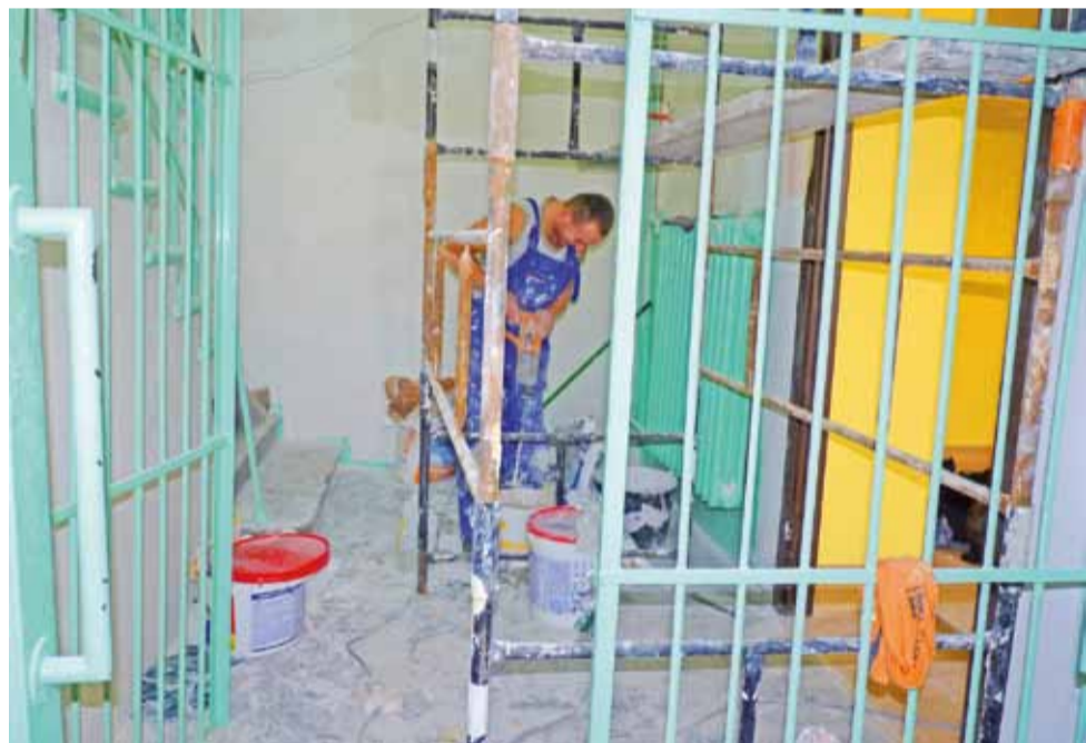
Pracownicy firmy Rem-Bud z Gołębowa koło Kutna po zakończeniu adaptacji pomieszczeń po byłym MGOK remontują również klatkę schodową do I piętra. Tym samym przejście z nowoczesnej świetlicy do budynku szkolnego nie będzie szokować wyglądem.

Adaptacja pomieszczeń kosztowała ok. 215 tys. zł. W ramach prac zrobiono również odwodnienie wokół starego budynku, a nawet wzmocniono fundamenty, które, jak się okazało, były zrobione z potężnych kamieni. dag