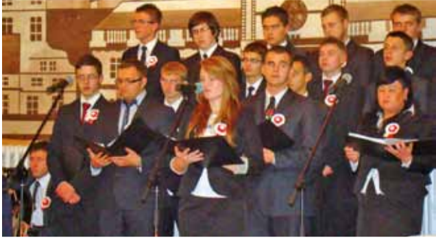
Występ uczniów ZSP nr 1 w Łowiczu.