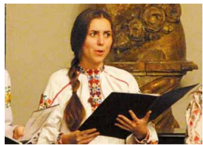
Jedna z chórzystek podczas wykonywania pieśni cerkiewnej.

Sala św. Karola Boromeusza, jak zwykle na koncertach, na które zaprasza burmistrz, zapełniła się w całości. 13 śpiewaczek i dyrygentka zaprezentowały repertuar, silnie oddziałujące na emocje większości słuchaczy. Przy religijnych pieśniach widać było na ich twarzach prawdziwe skupienie, a przy popularnej melodii „Hej sokoty”, wielu z nich zaczęło spontanicznie klaskać do rytmu