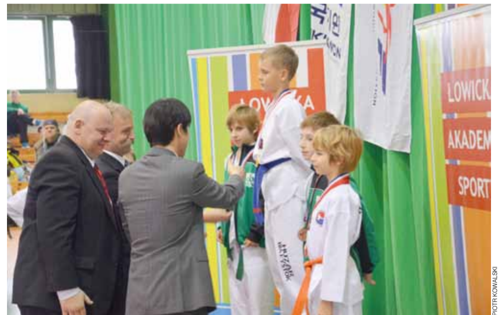
Dekoracja zwycięzców w jednej z młodszych kategorii wiekowych.

Ciekawostką był też pokaz taekwondo w... stroju łowickim. W każdej z trzech konkurencji przeprowadzono zawody w siedmiu kategoriach, z podziałem na wiek i płeć. W rywalizacji klubowej Łowicka Akademia Sportu zajęła pierwsze miejsce, wyprzedzając na podium warszawski Taekwondo Cheolin i AZS Poznań.