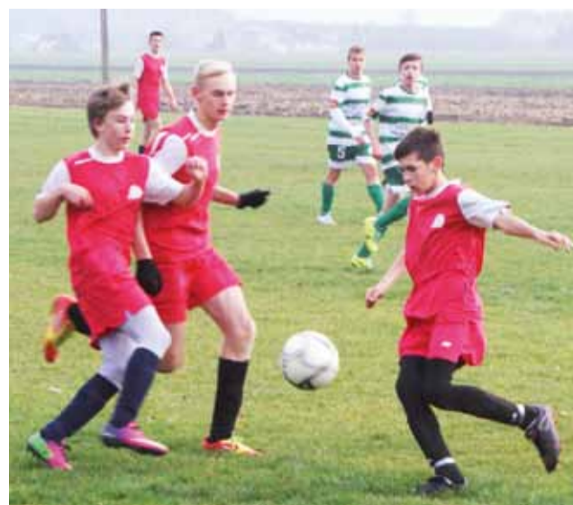
Juniorzy GKS Bedno walczący o piłkę w spotkaniu z Włókniarzem Konstantynów.