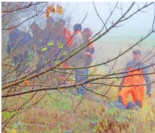
Ciało 55-letniego mężczyzny wyłowiono ze Słudwi w czwartek 14 listopada po godzinie 9.

Słudwia, w której znaleziono zwłoki mężczyzny, nie jest głęboka, to kilkadziesiąt centyme-