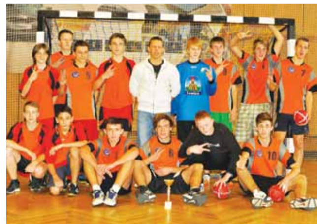
Ekipa Gimnazjum nr 2 wygrała zacięty finał i zagra w zawodach rejonowych.