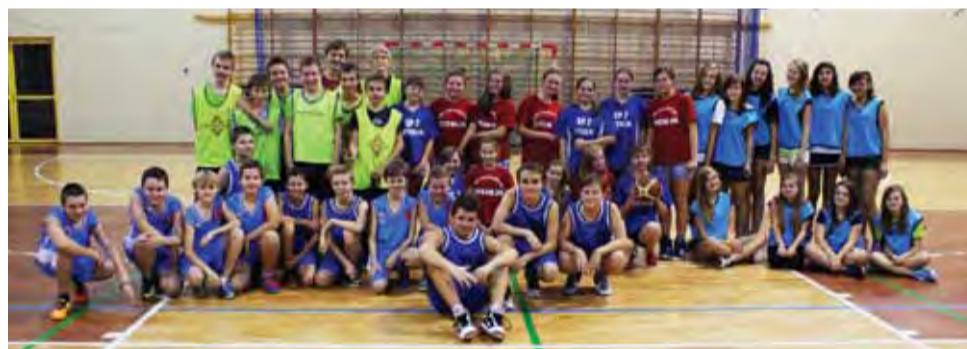
Uczestnicy Turnieju Mini Koszykówki w hali sportowej w Żychlinie.