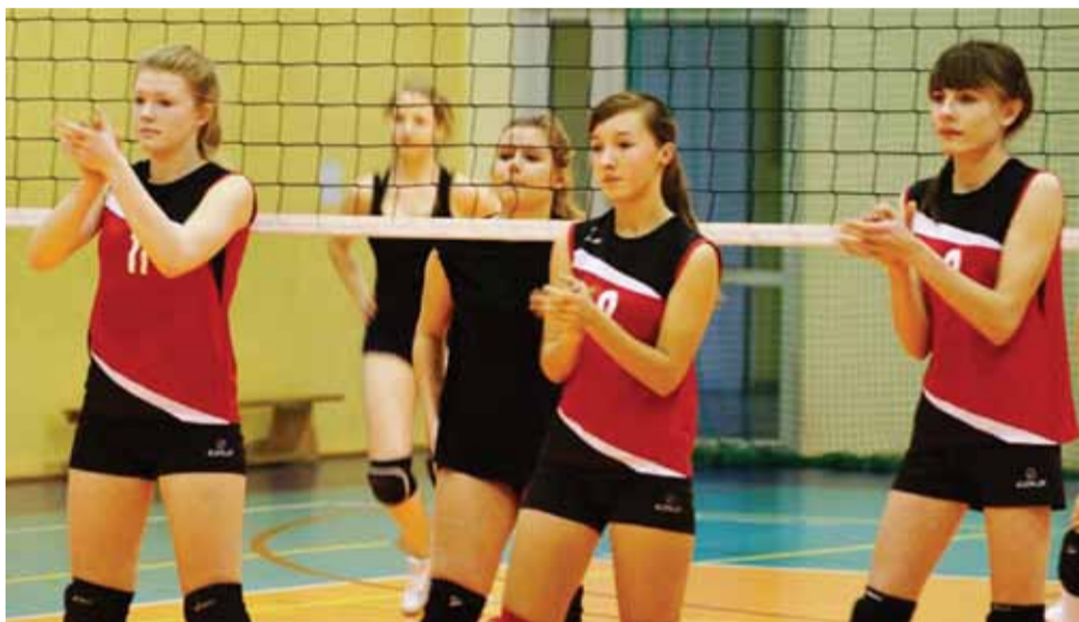
Siatkarki Mickiewicza Żychlin mobilizujące się przed spotkaniem z gostynińską drużyną.