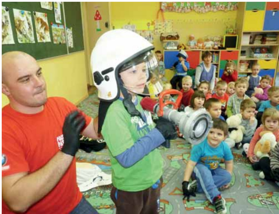
Chętnych przedszkolaków, by założyć helm strażacki, nie brakowało.

NASI DZIENNIKARZE DO WASZEJ DYSPOZYCJI OD 8.30 DO 15.30 Telefon redakcyjny 796 455 333 e-mail: zychlin@lowicznanin.info DOROTA GRABCZEWSKA