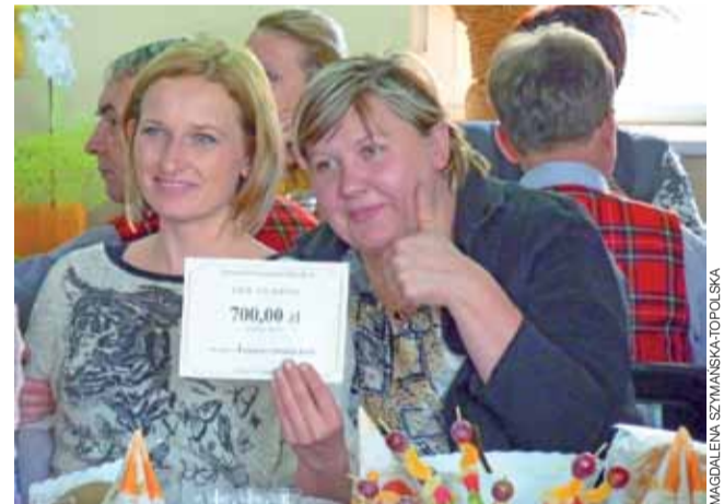
Panie z KGW Łażniki na wieść o wygranej zareagowały wybuchem radości.

Następnie zagrał i zaśpiewał zespół Krośniewiaczy, grający –