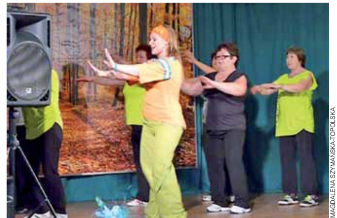
Członkowie zespołu Zumba Gold z Bełchowa pokazali, że zumba, to taniec dający dużo radości.

jak jego członkowie to określają – „miejską muzykę podwórkową” z „elementami folkloru miejskiego”. Zespół ten działa od 2005 roku przy Gminnym Centrum Kultury, Sportu i Rekreacji w Krośniewicach. Występuje na festynach, dożynkach, imprezach lokalnych. Zdobył nagrody na Przeglądzie Kapel Folklorystycznych w Sieradzu w 2009 i 2011 roku. W marcu tego roku muzycy z Krośniewic zagraли na Regionalnej Otwartej