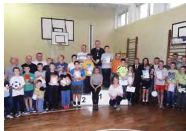
Uczestnicy III Rodzinnego Turnieju Tenisa Stołowego w z dyplomami.

Tenis stołowy | III Rodziny Turniej Tenisa Stołowego