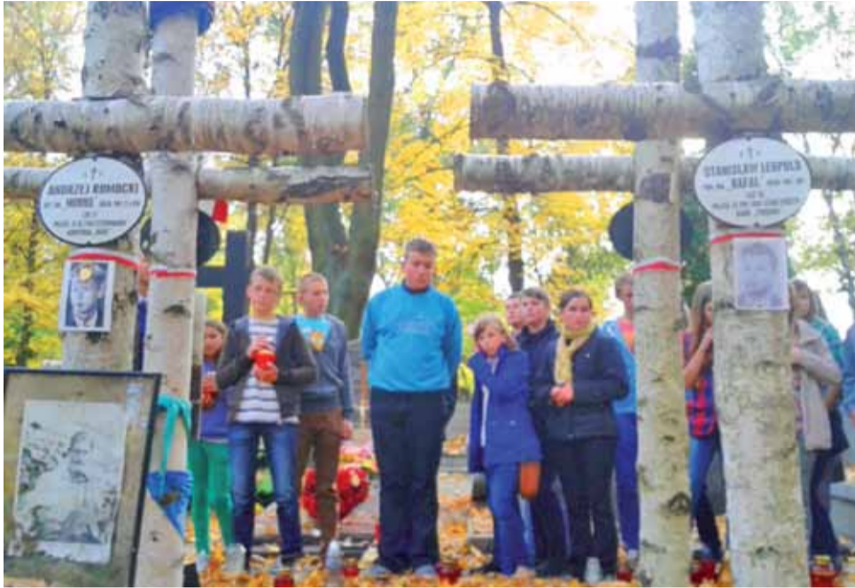
Chłopcy i dziewczęta, modlący się nad mogiłami bohaterów poległych podczas II wojny światowej, mają niewiele mniej lat niż ci, za których się modlili.

Pierwszym celem podróży było Gimnazjum i Liceum im. Stefan Batory przy ul. My-