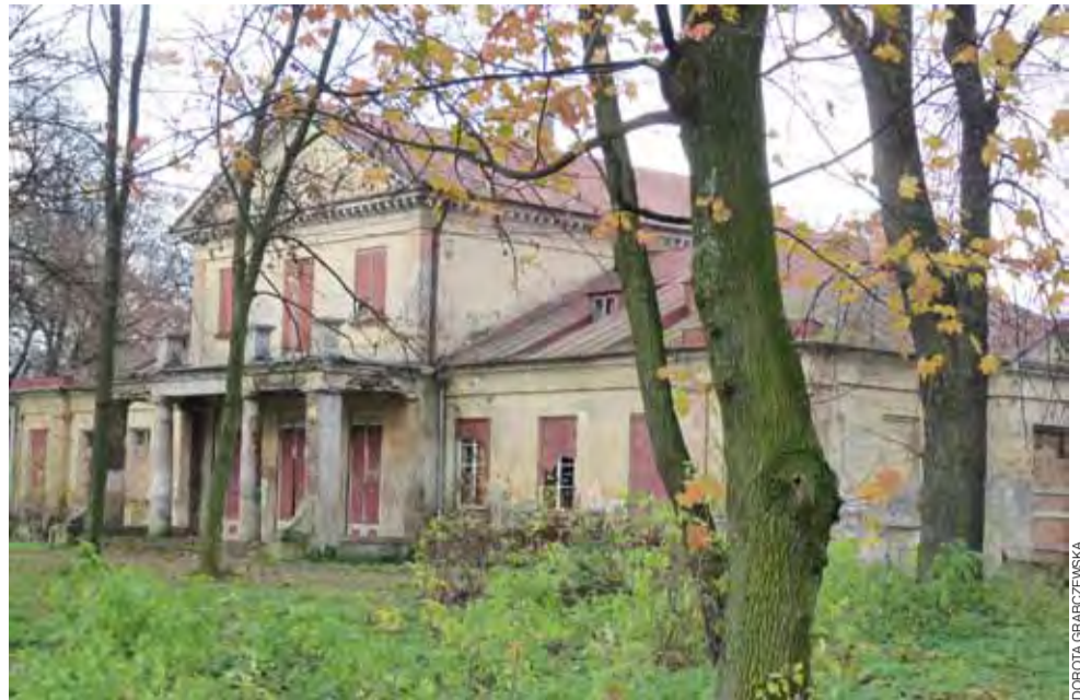
Aż wierzyć się nie chce, ale ten dwór dopiero od 2 miesięcy jest wpisany do rejestru zabytków.

Na razie nowy właściciel zabezpieczył obiekt, aby nie niszczał. Na tarasie została ułożona papa termozgrzewalna, uzupełnione rynny, dwa lata temu park został prześwietlony według projektu zrobionego przez konserwatora zabytków, założono alarm. Prace osobiście wykonywał właściciel z rodziną.