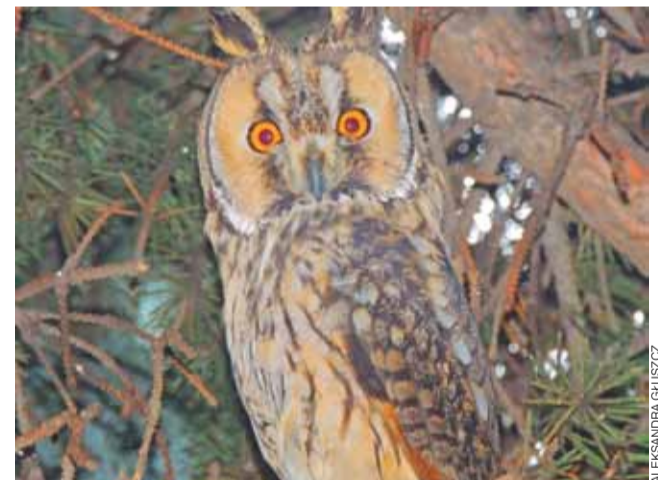
Sowa Uszatka – nowy mieszkaniec przed Społeczną Szkołą w Orątkach.

Wszyscy w Orątkach są nastawieni do sów pozytywnie i cieszą się, że właśnie to drzewo ptaki wybrały na swój dom. ag