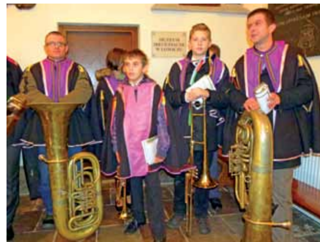
Specjalnie dla biskupa przyjechała orkiestra ze Żdżar – parafii, z której pochodzi biskup.

i dotykałem: św. pamięci prymasa Hlonda, prymasa kardynała Stefana Wyszyńskiego, za prymasa kardynała Józefa Glempa. To on mnie wybrał i namaścił na łowickim Rynku bez żadnej mojej zasługi, a chlubić się mogę tylko moimi grzechami i moimi słabościami – mówił z niezwykłą skromnością ksiądz biskup.