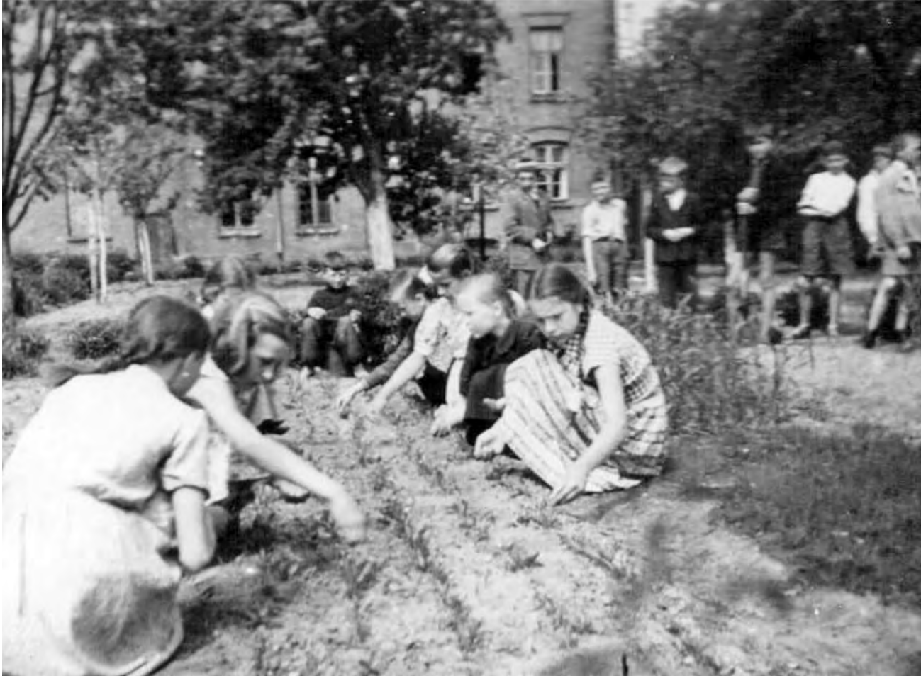
Pielenie grządek w przyszkolnym ogródku, rok szkolny 1953/54.