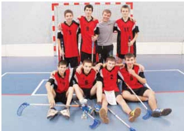
Zwycięska drużyna chłopców z Gimnazjum w Żychlinie.