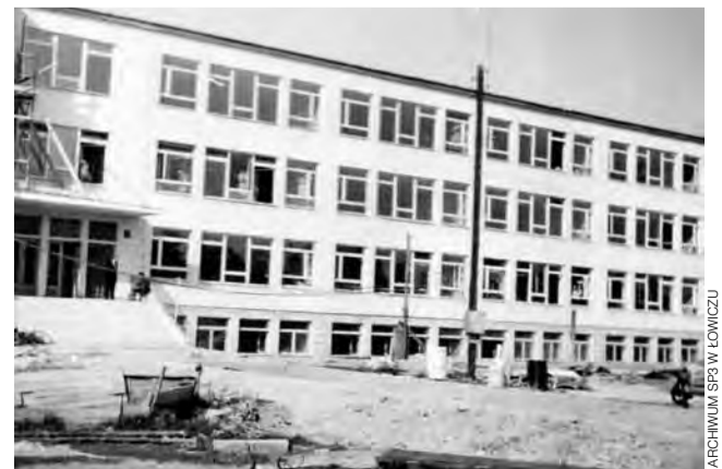
Budynek szkoły wiosną 1963.