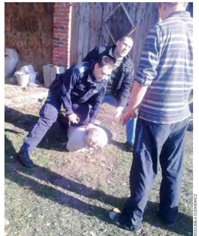
Tak wyglądała policyjna interwencja na podwórku gospodarstwa w Grzybowie.

Skarga na zachowanie 2 funkcjonariuszy interweniujących 11 listopada w Grzybowie Dolnym dotarła do komendanta powiatowego w Kutnie w piątek