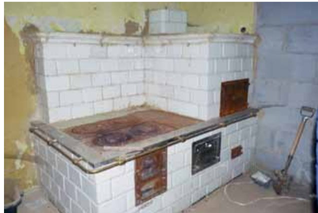
Zabytkowa kuchnia kaflowa z połowy 19 wieku została już zrekonstruowana.