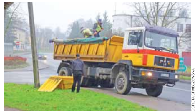
W piątek 22 listopada do pojemników na piasek rozstawionych w różnych punktach miasta wsypano piasek służący do likwidowania śliskości na chodnikach.