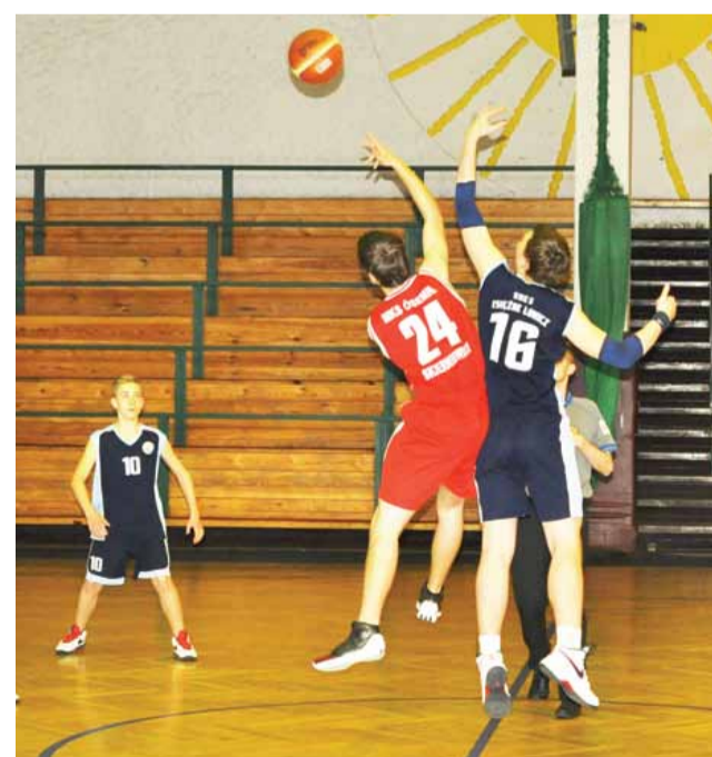
Młodzicy UMKS Księżak pokonali w derbowym meczu Ósemkę Skierniewice

Nasi młodzicy nadal zajmują w lidze wojewódzkiej w grupie A 7. lokatę. W grupie B liderem jest Piotrcovia Piotrków Trybunalski,