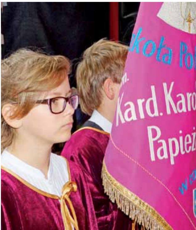
Od 1999 roku szkoła nosi imię Kard. Karola Wojtyły – Papieża Polaka.