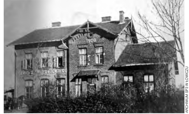
Budynek przy ul. Chemicznej 6 (obecna A. Krajowej). Tutaj mieściła się szkoła w latach 1908-1963, z przerwami w okresach wojennych.