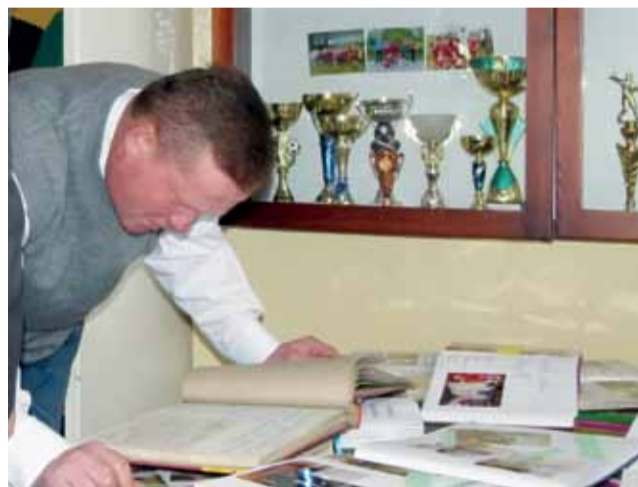
W przerwie spotkania powdzeniem cieszyli się szkolne kroniki sprzed lat.