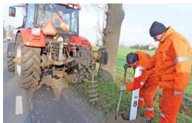
27 listopada drogowcy z Zarządu dróg Wojewódzkich Rejon Drogowy w Łowiczu robili przegląd słupków odblaskowych rozstawionych wzdłuż dróg wojewódzkich.

czas kierownik rejonu Grażyna Kaczor zapewniała, że przed zimą słupki zostaną uzupełnione. Słowa dotrzymała. Na kilkukilometrowym odcinku tej drogi brakowało ok. 20 odblaskowych słupków, drugie tyle było uszkodzonych. W środę pracownicy ustawili nowe słupki. Prace powoływały bardzo sprawnie. dag