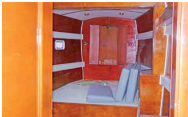
Sypialnia w jednym z pływaków katamaranu wyposażona jest w uchylnie okienka i centralne ogrzewanie.

wyposażony będzie w dwa żagle o powierzchni po 110 m 2 każdy. Główny żagiel, grot, jest pełnolistkowy, bardziej elastyczny, pod naporem wiatru odpowiednio się profiluje, aby zwiększyć siłę ciągu. Drugi żagiel, fok, zamontowany jest na sztywnym obrotowym sztagu, płótno żaglowe nawijane jest na rurę o średnicy 80 mm.