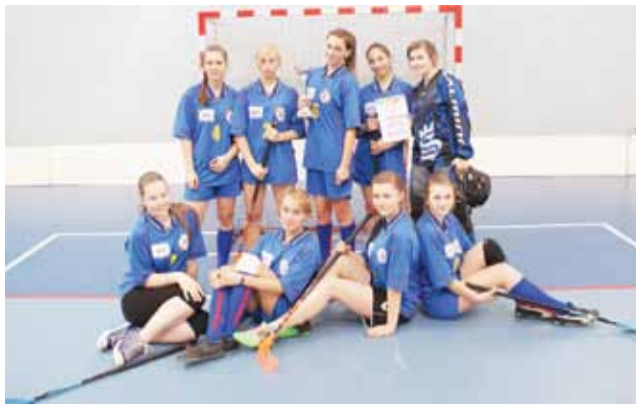
Zwycięska drużyna dziewcząt z Gimnazjum w Bedlnie.