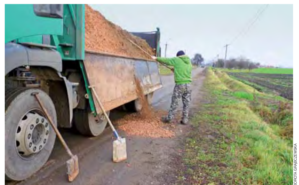
Na zlecenie Mazowieckiego Zarządu Dróg Wojewódzkich drogowcy tłuczniem zasypywali dziury wzdłuż drogi wojewódzkiej 583.

– W Buszkowie chodzi o przebudowę istniejącej linii. W ramach zadania część linii zostanie zdemontowana i zbudowana nowa o długości 500 m. Inwestycja ma zapewnić mieszkańcom bezawaryjne korzystanie z prądu. Projekty techniczne mają być gotowe w pierwszym kwartale 2014 roku. Inwestycje będą realizowane w II półroczu. dag