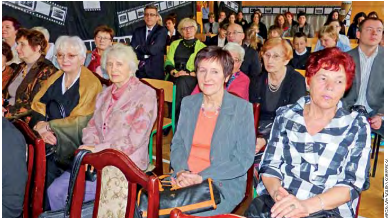
Na widowni emerytowani pracownicy szkoły, za nimi pozostali zaproszeni goście oraz obecni nauczyciele.

Łowicz | Szkoła Podstawowa nr 3 świętowała swój jubileusz