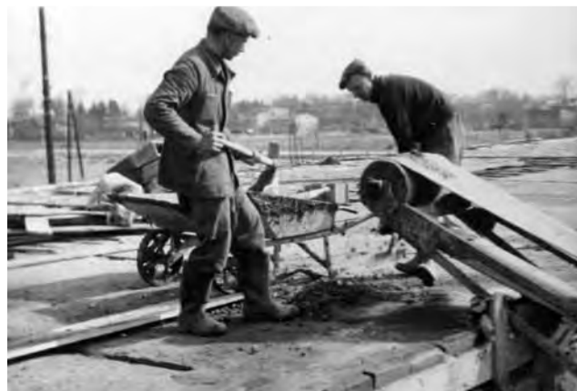
Zalanie stropów obecnego budynku szkoły.

Wspomnień było oczywiście więcej. Galerię zdjęć z uroczystości oraz film można obejrzeć na naszym portalu www.lowiczain.info w zakładce Edukacja/Wydarzenia. ■