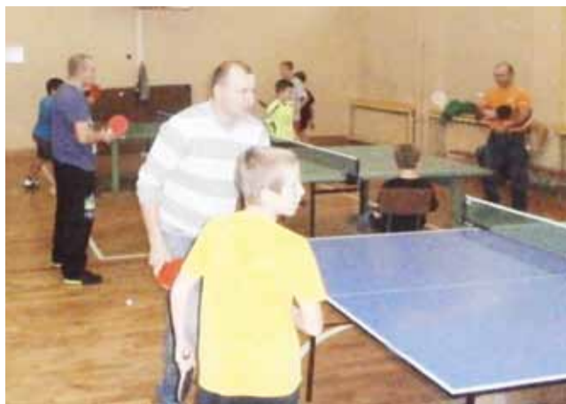
Zawodnicy turnieju tenisa stołowego podczas rozgrywanych meczów.