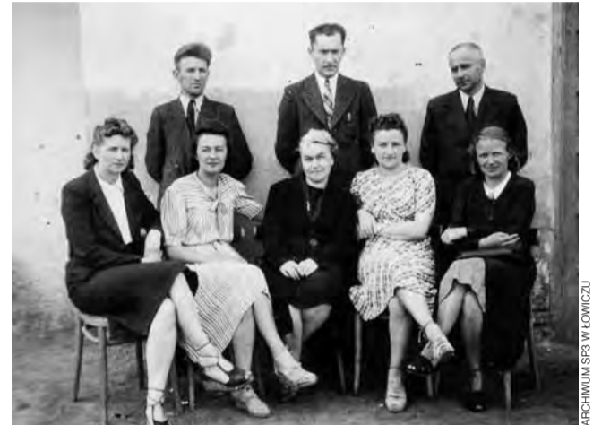
Zespół nauczycieli tajnego nauczania, rok 1943-44.