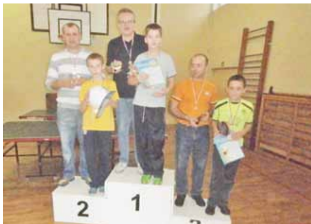
Zwycięska trójka Rodzinnego Turnieju Tenisa Stołowego.