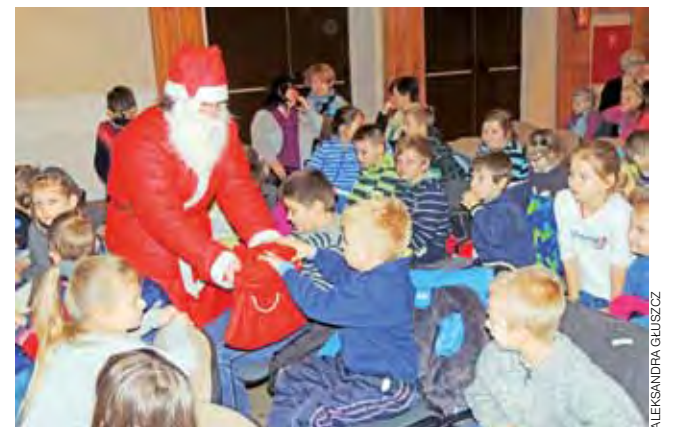
Wszystkie dzieci były grzeczne. Święty Mikołaj rozdaje dzieciom cukierki w Żychlińskim Domu Kultury.

Po spektaklu, nagrodzonym gromkimi brawami, na scenę wkroczył Mikołaj. Zadał on dzieciom zasadnicze pytanie: Czy były grzeczne w tym roku i czy