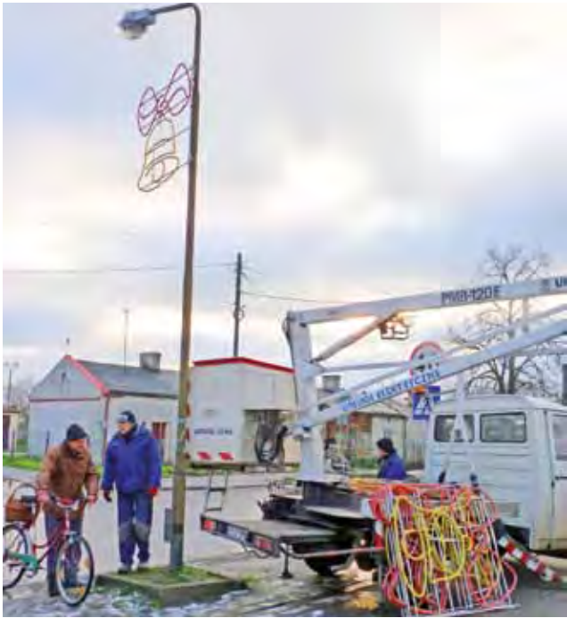
Świąteczne lampki i ozdoby zawieszali pracownicy ZEP Żychlin. Ozdobne dzwony zawisły wzdłuż Traugutta i Orłowskiego

Już wiadomo jak będzie wyglądać hala sportowa w Oporowie. str. 7