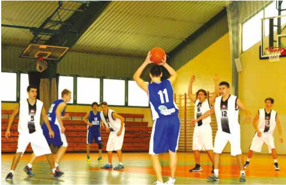
Juniorzy Księżaka pewnie wygrali derbowy pojedynek z AZS Skierniewice

Po sześciu zwycięstwach i dwóch porażkach nasi juniorzy są cały czas wiceliderami liderami grupy B Wojewódzkiej Ligi Juniorów z 14 punktami na koncie. W grupie A nadal liderem jest Piotrcovia Piotrków Trybunalski przed ŁKS II Łódź. Kolejny mecz łowiczanie zagrają w sobotę 14 grudnia w Żychlinie. zł