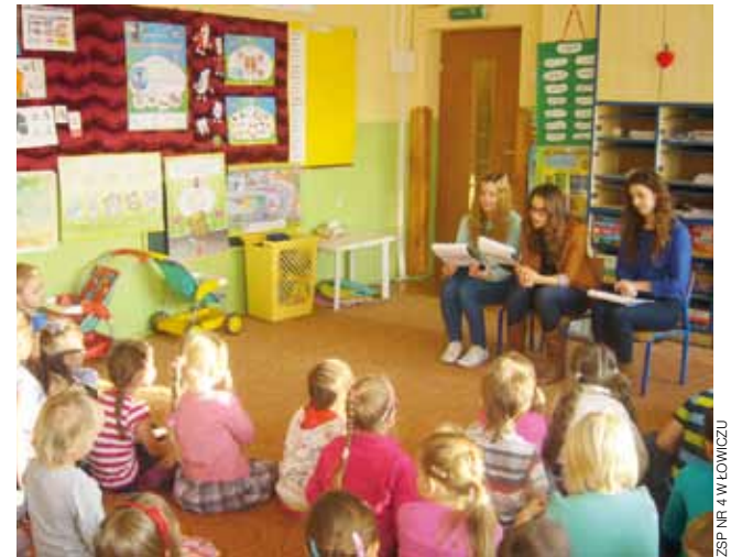
Przedszkolaki uważnie słuchali bajek, które czytały im uczennice z ZSP nr 4.

Pełne pozytywne wrażenia i nowych pomysłów dziewczynki przystępują już do opracowania kolejnych scenariuszy spotkań z najmłodszymi. mst