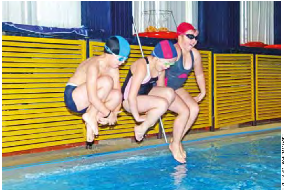
Skok do wody. Nauka pływania na basenie w Łowiczu – jak widać dostarcza dzieciom wiele emocji.