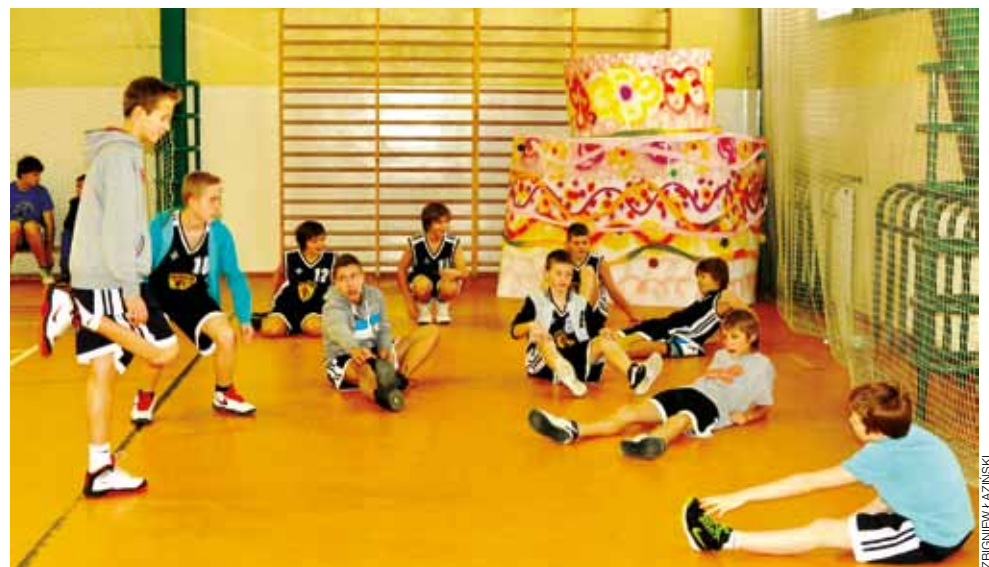
Młodzi zawodnicy Księżaka z rocznika 2001 będą groźni w lidze za rok.

Koszykówka | 9. kolejka Wojewódzkiej Ligi Młodzików U-14