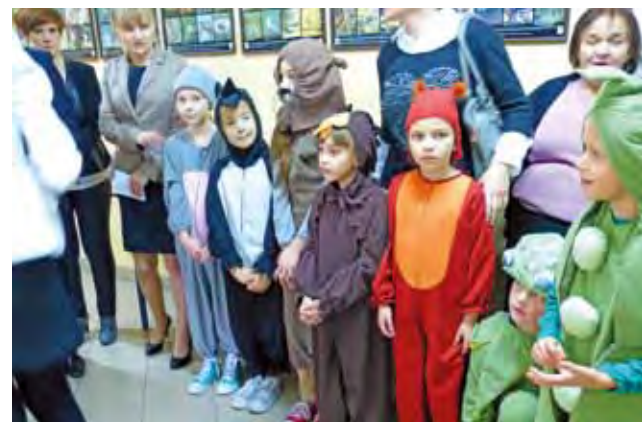
Uczniowie, w przebraniach inspirowanych przyrodą, także złożyli gościom podziękowania za otwarcie eko-pracowni i za odwiedzenie szkoły.

co stwierdził automatycznie sam program. Tablica daje też możliwość podłączenia do niej innych urządzeń, na przykład laptopów (wójt gminy Dariusz Reczulski zamierza dokupić dodatkowe w przyszłym roku, tak, aby każdy uczeń na lekcji mógł dysponować jednym) czy mikroskopów.