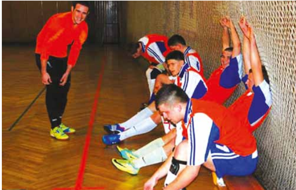
Zawodnicy Zatorza III mieli wiele powodów do zadowolenia. Pokonali Górki Łowicz aż 5:0!