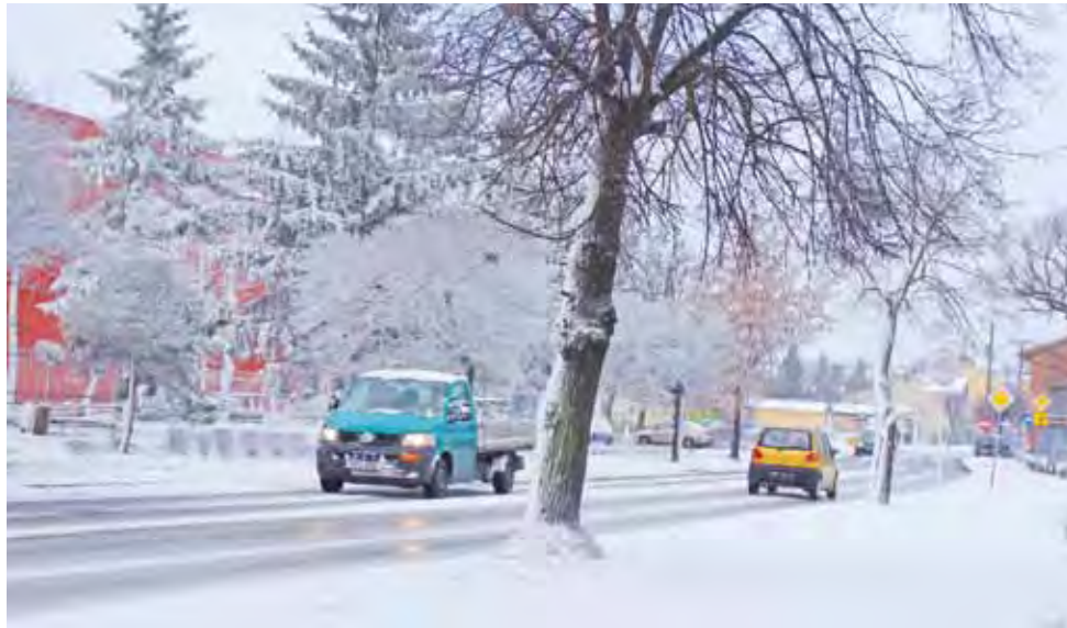
Tak wyglądała ul. Narutowicza w Żychlinie po piątkowej burzy śnieżnej.