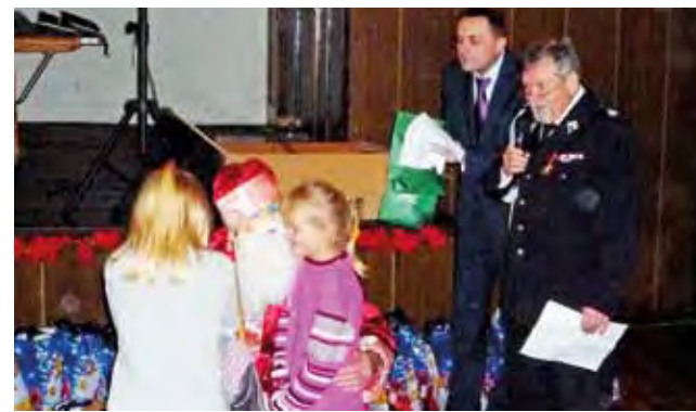
Strażacy z zarządu OSP gminy Bolimów pokazali po raz kolejny wielkie serce, angażując się w przygotowanie paczek dla dzieci.

Myślę, że to dobrze, zwłaszcza dla dzieci, ale dla dorosłych też, coś słodkiego pod choinką to zawsze przyjemny akcent. tm