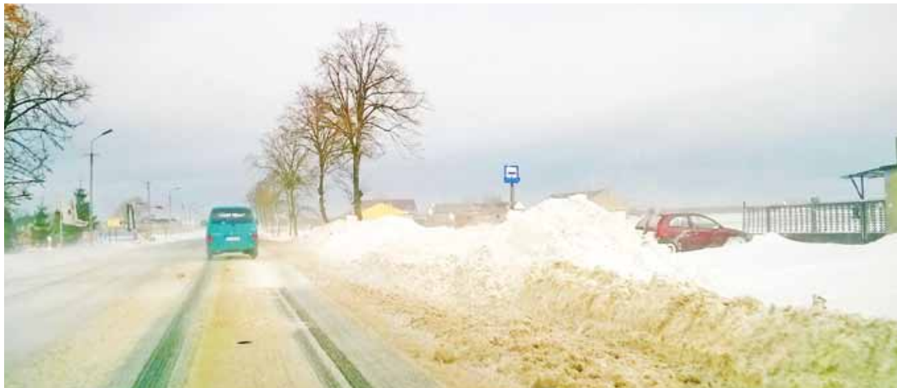
Tak wyglądała droga Kutno – Gostynin 7 grudnia w południe. Służby odpowiedzialne za jej utrzymanie odsnieżyły już odcinki, które zawiewał wiatr.

Najgorzej było w gminie Oporów, w południowo-zachodniej części gminy Żychlin oraz w gminie Pacyna, gdzie zasypane miejscami sięgały 2 metrów. W szczytowym momencie bez prądu było kilkanaście tysięcy osób. Na całym obszarze Energa-Operator Płock bez prądu było nawet 70 tys. gospodarstw. Uszkodzonych było 1800 transformatorów. – Jechałem samochodem z Żychlina do Pacyny, gdy dorwała mnie śnieżycy – opisu-