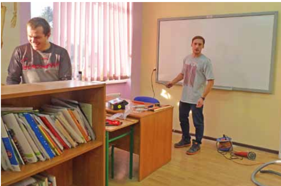
W czwartek pracownicy MPC z Kutna montowali w ekopracowni w Zespole Szkół w Oporowie tablicę multimedialną i instalowali sprzęt elektroniczny.