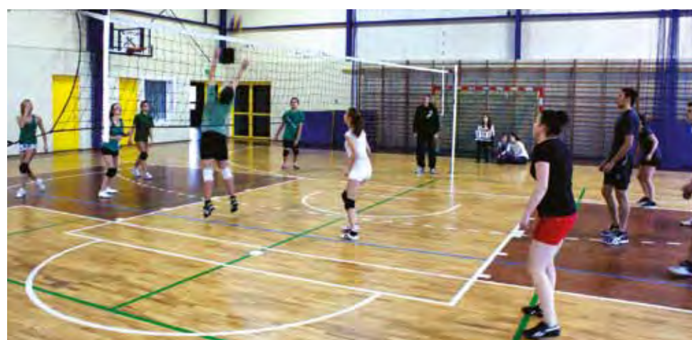
Rywalizacja siatkarska pomiędzy drużynami licealnymi podczas zorganizowanego w hali przy ZS Nr 1 w Żychlinie