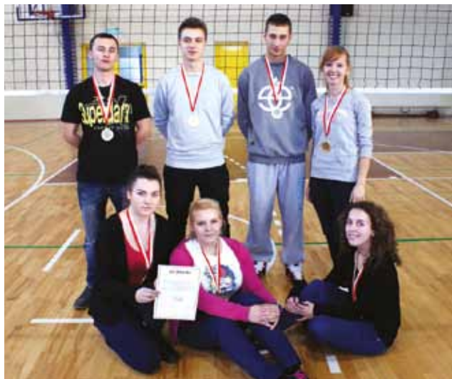
Uczniowie klasy III LO im. A. Mickiewicza w Żychlinie, którzy zajęli I miejsce w Turnieju Siatkówki.

Nowy Łowiczanie Tygodnik Ziemi Łowickiej członek Stowarzyszenia Gazet Lokalnych