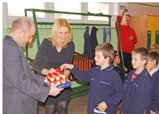
Każdy uczeń od gości z Jaktorowa otrzymał czekoladowego mikołaja.