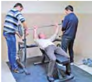
Sztanga w górę! Strażacy wypróbowali sprzęt do ćwiczeń.

Poseł ma nadzieję, że sala w strażnicy zmotywuje mieszkańców do podjęcia aktywności fizycznej, tak ważnej dla utrzy-