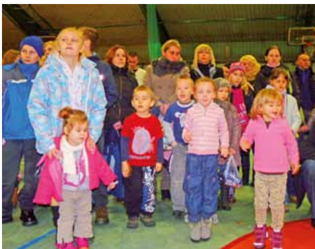
Ci, co dostali się do środka, mogli być zadowoleni.