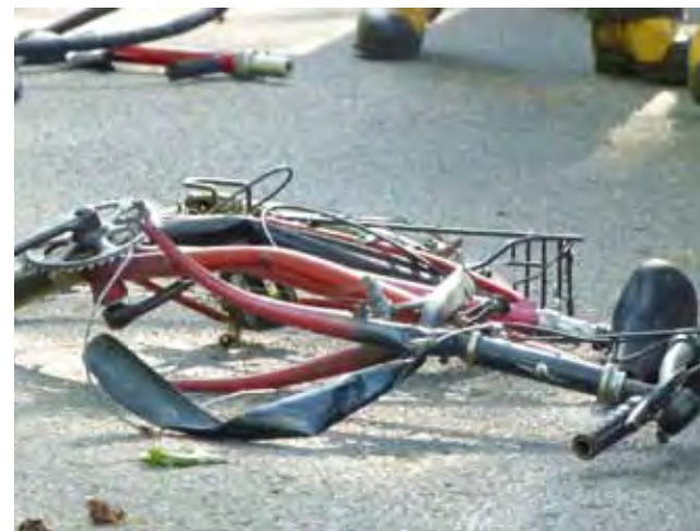
21 lipca 2013 r. Zniszczony rower w czasie trwania akcji ratunkowej ciągle leżał na drodze. Opis jego stanu po wypadku jest jednym z dowodów w sprawie.