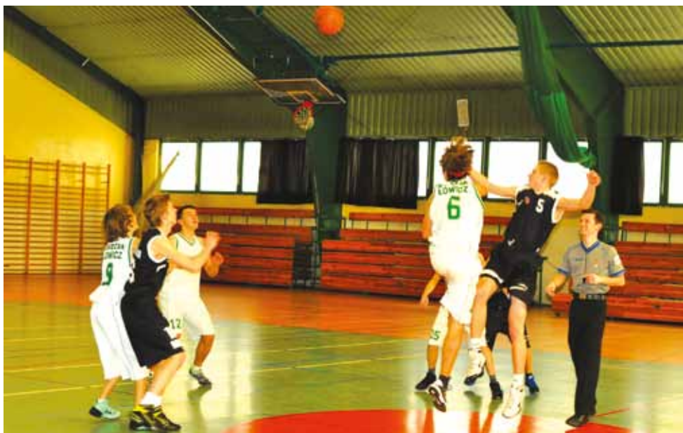
Kadeci Księżaka przegrali końcówkę meczu.