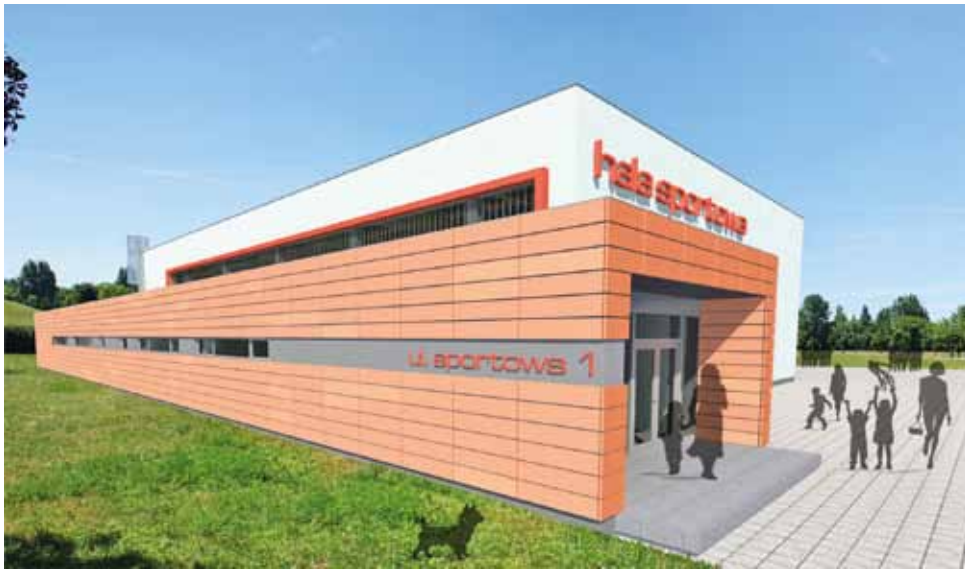
Tak najprawdopodobniej będzie wyglądać hala sportowa, która powstanie przy Zespole Szkół w Oporowie.

– Teraz będziemy występować o pozwolenie na budowę – dodaje wójt. – W styczniu 2014