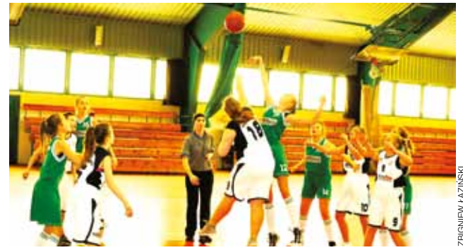
Dziewczeta z Księżaka nie miały szans ze starszymi rywalkami.