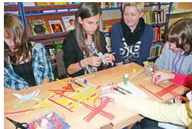
Uczniowie chętnie uczyli się techniki robienia tradycyjnych ozdób.

– Udało się nam kolejnym ludziom przedstawić problem i to jest bardzo ważne – dodaje Rutkowski. mwk