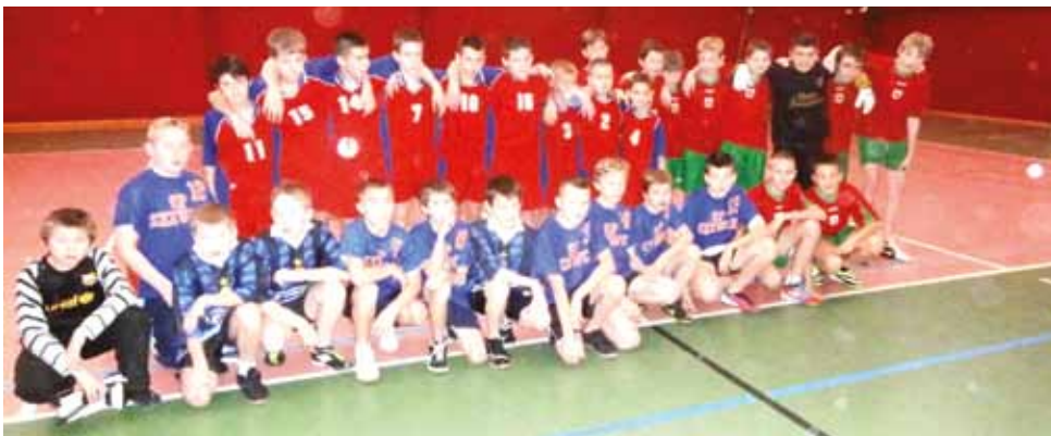
Drużyny chłopców biorące udział w półfinale powiatowym w mini piłce ręcznej, który odbył się w Grabowie.