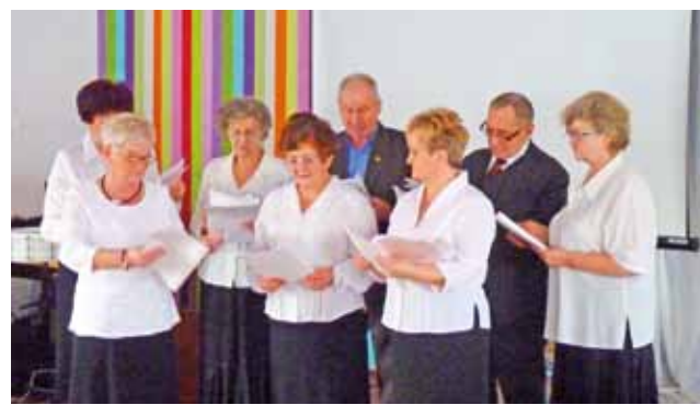
Podczas spotkania opłatkowego łowickiego Związku Emerytów miało miejsce wystąpienie chóru.

Wśród tradycyjnych postaci opowieści z Betlejem w przedstawieniu pojawiły się anioły oraz leśne zwierzęta, które złożyły dary u żłobka, w którym spoczywał narodzony Jezus. W rolę