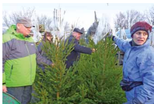
Tradycyjne choinki powoli stają się modne. Za te okazałe trzeba było zapłacić po 50 zł.

Wszyscy wyróżnieni dostali nagrody ufundowane przez radę rodziców. Po prezentacji stroiki wróciły do autorów i zdołały święteczny stół w ich domach. dag