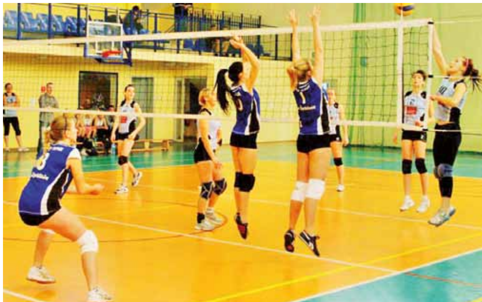
Siatkarki Zespołu Szkół w Żychlinie w wygranym spotkaniu z Hurt Pap Kutno-