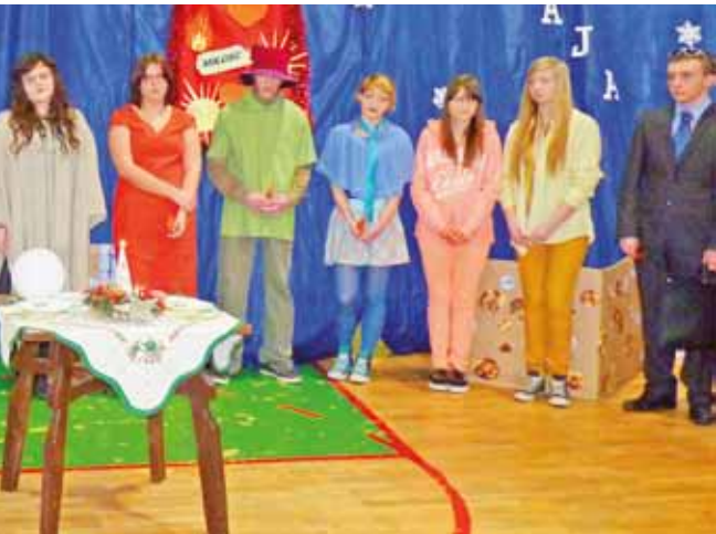
Młodzież z Gimnazjum nr 2 radość ze świąt Bożego Narodzenia wyśpiewała w piosence „Last Christmas”.