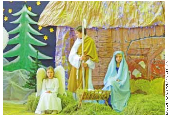
Św. Józef w kocierzewskich jasełkach swą postawą pokazywał, że jest czujny i gotowy, by strzec swej rodziny.

Łowicz i okolice | W atmosferze świąt Bożego Narodzenia