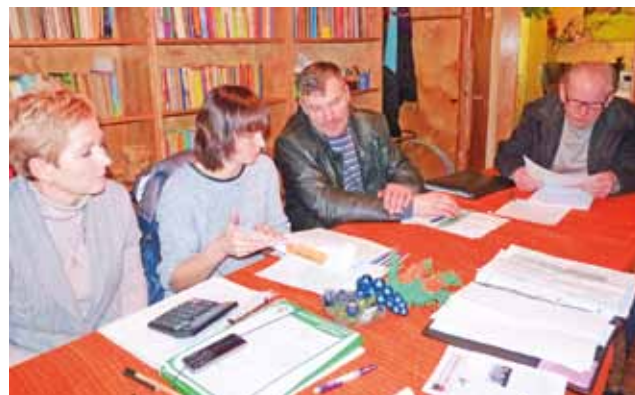
Członkowie komisji oświaty długo rozmawiali na temat planowanych inwestycji drogowych w 2014 roku.

Ponieważ gmina może ubiegać się o dofinansowanie z Programu Rozwoju Obszarów Wiejskich do modernizacji jednej drogi, wójt zaproponował, by w 2014 roku składać wniosek o takie dofinansowanie na 3,5 km odcinek drogi Samogoszcz-Jurków Drugi-Dobrzewy i Halinów-Jurków II-Oporów. Są to wprawdzie