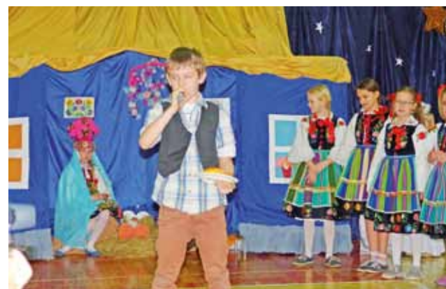
Dzieci ze Szkoły Podstawowej nr. 4 bez problemu recytowały wiersze.

Młodzi widzowie oglądający 20 grudnia przedstawienie jasełkowe w Szkole Podstawowej nr 1