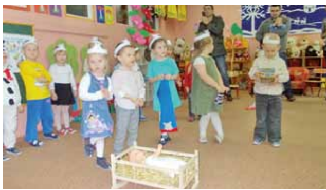
Jasełka przedstawiły również dzieci z najmłodszej grupy przedszkolnej.

W przedstawienie zaangażowani byli uczniowie różnych klas, poczynając od pierwszej podstawówki, ale najważniejsze role odgrywali gimnazjaliści. Odpowiadali za nie nauczyciele: Mar-