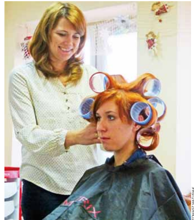
W studiu fryzjerstwa "Matrix" przy ulicy Zduńskiej dużo pracy było także w Wigilię.

Dostrzega też pewną, niezmienną od lat tendencję – pano-