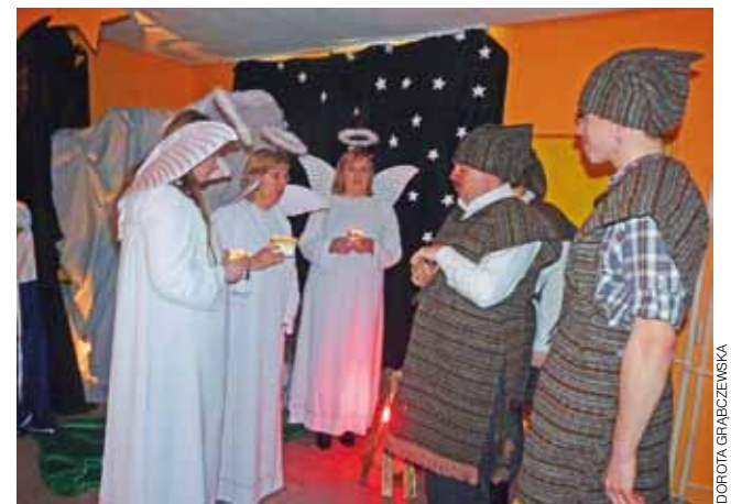
Uczestnicy Warsztatów Terapii Zajęciowej przedstawili rodzicom i gościom tradycyjne jasełka.