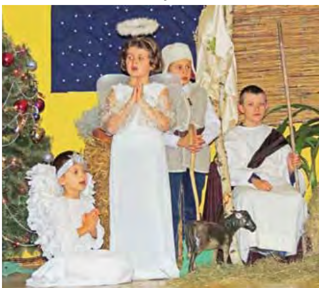
Jasełka w Orątkach w wykonaniu dzieci ze szkoły i przedszkola.

W końcu doczekały się na wizytę w sali tronowej, gdzie oczekiwał ich Święty Mikołaj wraz z pomocnikiem elfem. Nie zabrakło wspólnych kołęd, rozmowy, pamiętkowych zdjęć i słodkości.