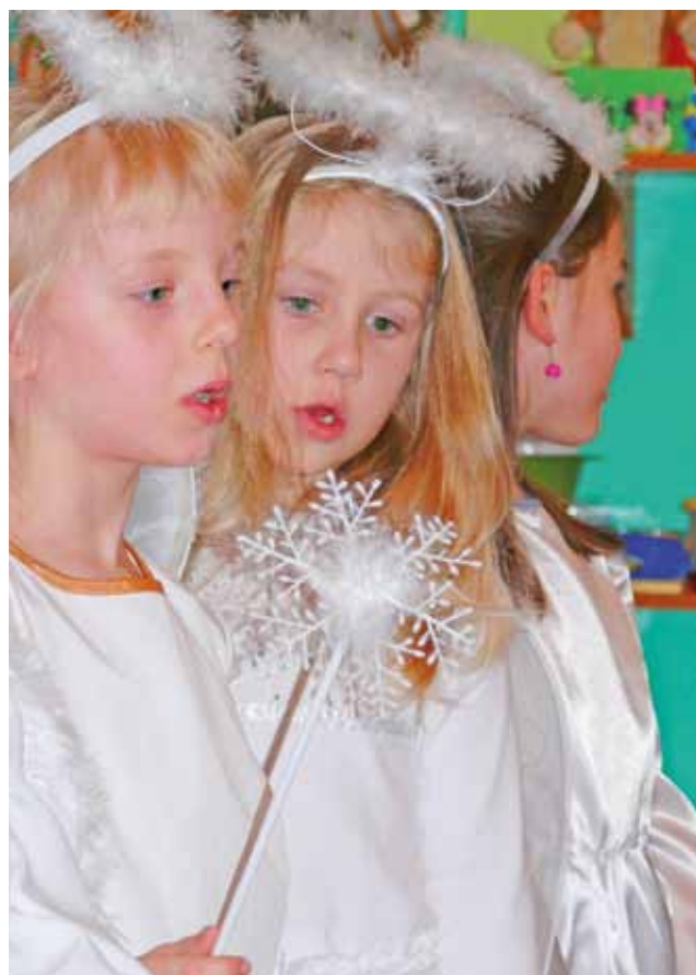
Dziewczyny z grupy 6-latków Przedszkola w Bolimowie odegrały w jasełkach rolę m.in. aniołów.

Jasełka, które zostały zaprezentowane przez uczniów, przedstawiały filozoficzno-moralną refleksję na temat sensu świąt Bożego Narodzenia.