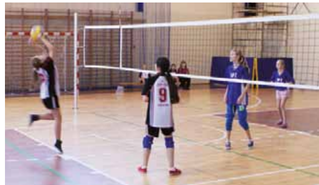
Drużyna dziewcząt Szkoły Podstawowej Nr2 w Żychlinie w meczu z drużyną z Grabowa.