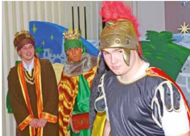
Jasełka w Zduńskiej Dąbrowie przygotowano z wielkim rozmachem.