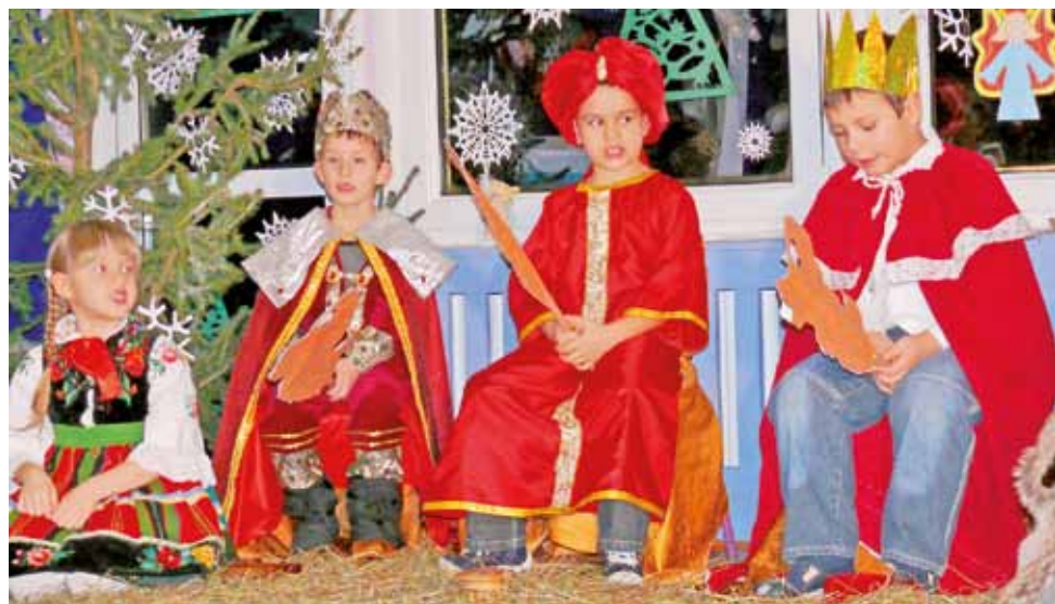
Trzej Królowie z jasełek w Przedszkolu Integracyjnym nr 10 w Łowiczu.

Gromkie brawa usłyszały dzieci z grupy „Wiewiórek”, czyli 5-6-latków z Przedszkola Integracyjnego nr 10 „Pod Świer-