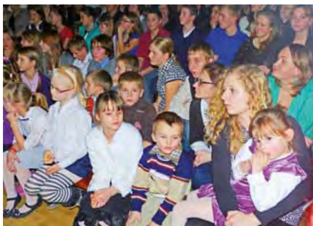
Zduńska Dąbrowa. Goście z domu dziecka w Gostyninie zasiedli w pierwszych rzędach.