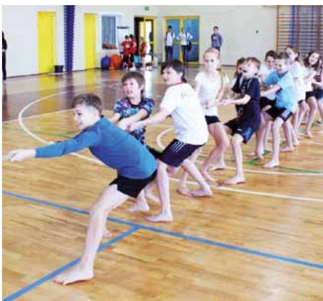
Przeciąganie liny – jedna z konkurencji turniejady.