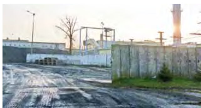
Teren obecnej ciepłowni w Żychlinie zostanie w ciągu trzech lat przebudowany kompletnie. Powstanie też drugi, 80-metrowy komin, obecny ma ok. 45 metrów.

Obecnie trwa modernizacja istniejących kotłów węglowych wraz z budową instalacji odpylania spalin oraz remontu emitora. W następnej kolejności planowa-