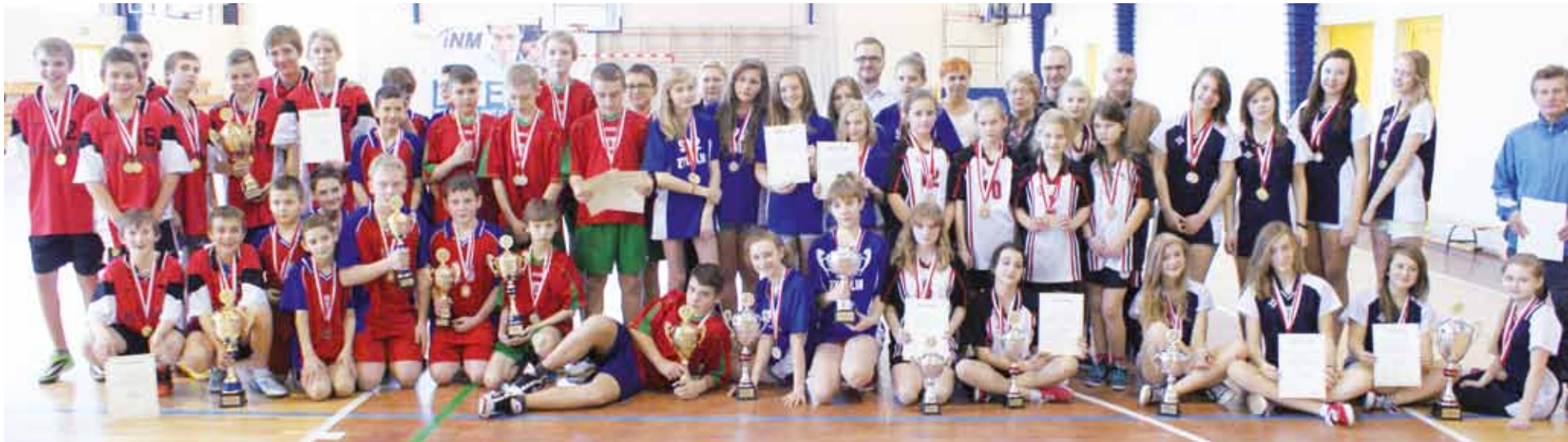
Uczestnicy Gminnego Turnieju mini siatkówki i mini koszykówki dziewcząt i chłopców.

Sport szkolny | Gminny Turniej mini siatkówki i mini koszykówki