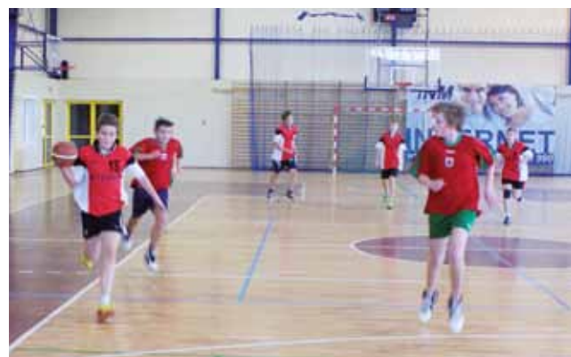
Koszykarze klas I Gimnazjum w meczu z drużyną ze Szkoły Podstawowej Nr2 w Żychlinie.