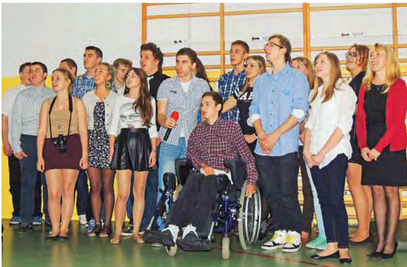
20 grudnia w Zespole Szkół w Żychlinie odbyło się wspólne kolędowanie. Każda klasa śpiewała wybrany przez siebie utwór. Mimo że można było wybrać zarówno piosenki w języku angielskim, jak i świąteczne piosenki znanych zespołów – przeważały tradycyjne kolędy. Na zdjęciu klasa II b LO im. Bohaterów Września 1939 roku podczas swojego występu. ag