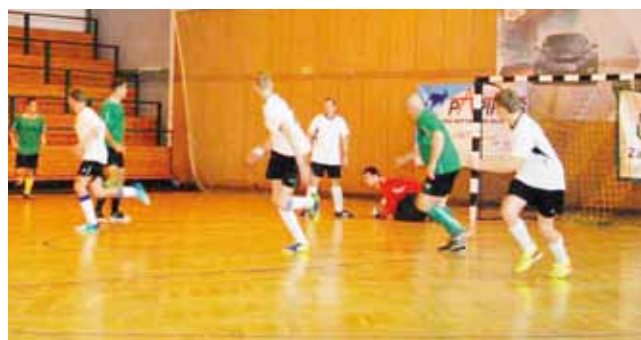
KS Ostrowiec na parkiecie zwyciężył 5:1. Niestety mecz zweryfikowano jako walkower.

■ Dream Team Kompina – Szkiełka Dzajf Łowicz 1:7 (1:1);