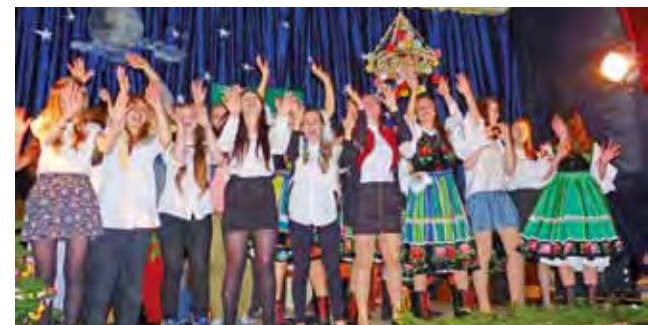
Młodzież z Gimnazjum nr 2 radość ze świąt Bożego Narodzenia wyśpiewała w piosence „Last Christmas”.