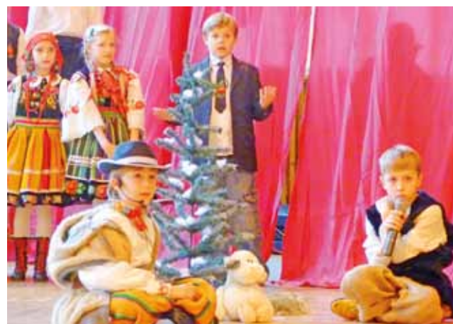
Jasełka w Zespole Szkół przy ul. Grunwaldzkiej miały typowo łowicki charakter.