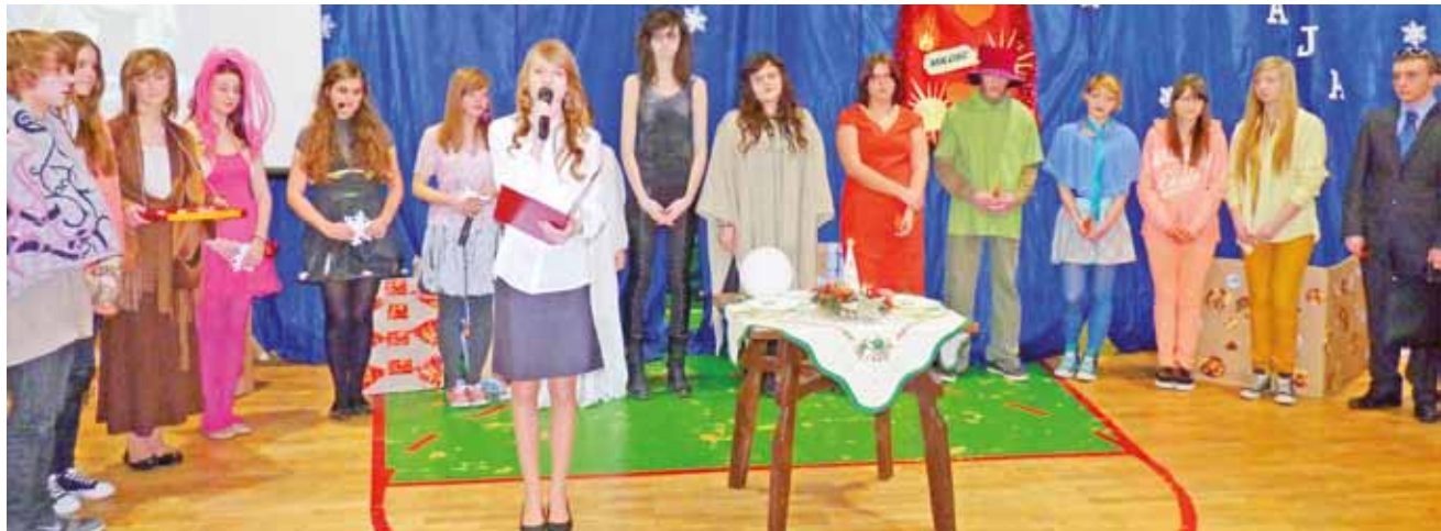
Ozdoby choinkowe i postaci z bajek to bohaterowie jasełek w I LO.