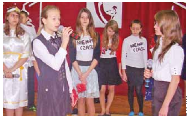
Uczniowie SP w Bolimowie w swych jasełkach wykorzystali postać Małego Księcia.