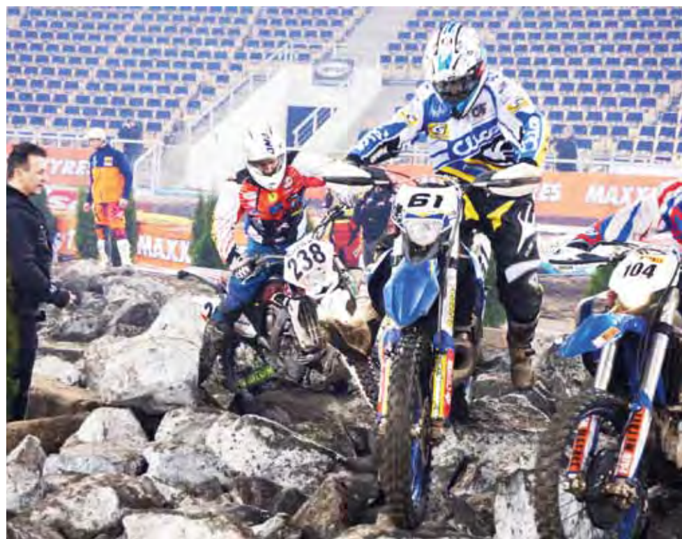
Zawodnicy najwięcej problemów mieli na odcinku z głazami.

Jednak z pierwszej części czasówki dalej przeszło tylko dziesięciu zawodników. O pozostałe sześć wolnych miejsc przyszło łowiczaniecowi walczyć w wyścigu ostatecznej szansy, gdzie spisywał się naprawdę dobrze.