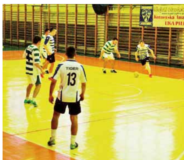
Gladiatorzy z Miasta Noży w wygranym meczu 9:1 z drużyną Przyszłość Tiger – Krośnice podczas kolejki KAHLPN Mężczyzn.

Następna, 6. kolejka odbędzie się w niedzielę 12 stycznia, Gladiatorzy z Miasta Noży rozegrają mecz z drużyną KP Klonowiec Stary.