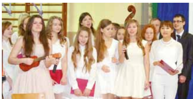
Szkolny chór imponuje nie tylko liczbą członków, ich urodą, ale przede wszystkim talentem, który posiadają.