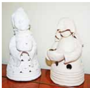
Te prace nazywane są Nianie. Są to świeczniki (małą świecę umieszcza się w środku).