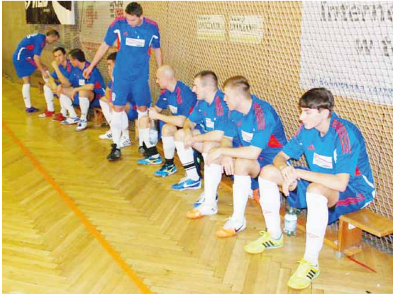
Szeroka ławka to wielki atut liderujące w tabeli Dach-Luxu.