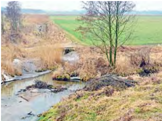
Kanał Laktoza na tym odcinku już dawno nie był oczyszczany.

Ciągnący się przez tereny gmin Łowicz i Łyszkowice kanał Laktoza w latach poprzednich już wiele razy dawał się we znaki mieszkańcom Starych Grud, powodując podtopienia na ich polach. Problem znacznie się nasilił po budowie autostrady A2.