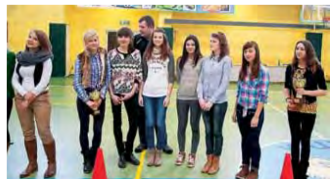
Zawodniczki Mickiewicz Żychlin z pucharem za zajęcie szóstego miejsca w KALS Kobiet.