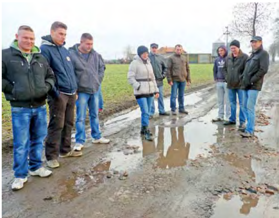
Mieszkańcy Jaworzyny wołają o naprawę drogi powiatowej Gołędzkie-Pobórz , gdyż droga stała się już całkowicie nieprzejezdna w kilku miejscach. Niektóre dziury mają głębokość nawet 15 cm.

Gmina Oporów chce pomóc starostwu jak może, by drogę wyremontować. Najpierw deklaruwała, że przekaże 40 tys. zł oraz zrobi parkingi za następnych 100 tys. zł. Później przedstawiła drugą propozycję, podwyższając udział gminy do 50 proc., ale nie w gotówce, a w wykonaniu parkingu koło zamku w Oporowie, którego brakuje, barierki ochronnych wzdłuż stawu, które skarpa się osuwa i stanowi zagrożenie. Ale zdaniem starostwa to zbyt mało. – To proszę mi wy-