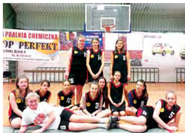
Ekipa owickiej Czwórki pewnie wygrała w Łowiczu w "kosza".