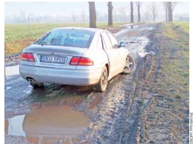
Droga powiatowa Gołędzkie-Pobórz jest w fatalnym stanie. W czwartek, 27 lutego, Przemysław Kowalski urwał koło od swojego samochodu, wcześniej Wiesław Korycki uszkodził miskę olejową.

– Jechałam tamtędy dwa tygodnie temu, wiem, jak droga wygląda i że wymaga gruntownego remontu, dlatego wyceniliśmy pracę na 400 tys. zł (wykonanie ok. kilometra w 2-3 odcinkach) – tłumaczy. – Cóż z tego, że gmina Oporów proponuje zrobienie parkingów? Przy potrzebach drogowych powiatu parkingi są nam na razie niepotrzebne. Na remonty wszystkich dróg w powiecie mamy 900 tys. zł. Równie zła jak droga w Gołędzkim są inne drogi jak np. Długoleka – Muchnice czy Strzegocin – Ktery. Którą wybrać drogę? Decyzje jeszcze nie zapadły, będziemy dyskutować na zarządzie. A może jedynym rozwiązaniem będzie nawiezienie