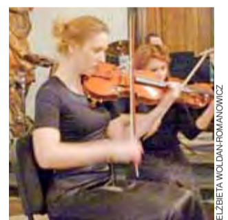
Muzyka w muzeum. Udany występ Akademickiej Orkiestry Politechniki Łódzkiej zainaugurował cykl koncertów „Burmistrz miasta zaprasza”.

Pierwszy z cyklu tegorocznych koncertów „Burmistrz miasta zaprasza” – występ Akademickiej Orkiestry Politechniki Łódzkiej należy uznać za sukces. Łowickiej publiczności spodobała się składanka dobrze znanych utworów muzyki filmowej.