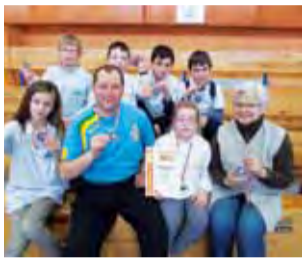
Brązowa ekipa szachistów ze Szkoły Podstawowej w Nieborowie.

– Szkoda mi trochę tych zawodów, bo mam przecucie, że przy większej koncentracji mogliśmy zdobyć nawet złoto. W kluczowych momentach ze słabszymi drużynami notowaliśmy tylko remisy i to zadecydowało o brązowym medalu. Na usprawie-