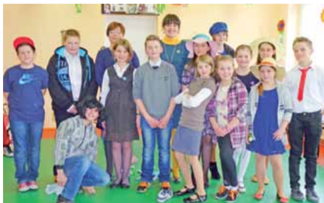
Oto uczniowie biorący udział w pełnym humoru przedstawieniu z okazji Dnia Kobiet w Szkole Podstawowej w Gągolinie Płd. wraz nauczycielkami.

Nieco w krzywym zwierciadle, ale na wesoło i bardzo prawdziwie uczniowie przedstawili historię przeciętnej polskiej rodziny