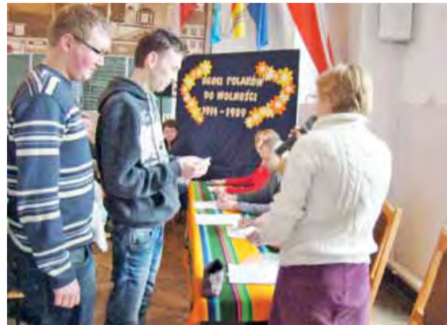
Uczniowie odpowiadali ustnie na wylosowane zestawy pytań.

Każdą klasę reprezentował trzyosobowy zespół. Konkurs odbył się w szkolnej auli. Uczniowie odpowiadali ustnie na wylosowane zestawy pytań. Musieli na przykład wiedzieć, kiedy Józef Piłsudski przybył do Warszawy, zwolniony z więzienia w Magdeburgu. Wyjaśniali też, jak przebiegało przekazywanie mu władzy, wskazywali najistotniejsze postanowienia Konstytucji marcowej z 1921 roku czy też tłumaczyli, czym był NSZZ „Solidarność”.