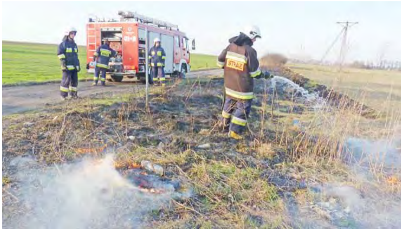
We wtorek po godz. 16.00 strażacy z OSP Żychlin gasili płonące trawy w Dobrzelinie.

Gmina Żychlin | Plaga pożarów suchych traw