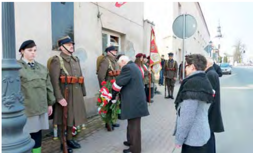
Kwiaty pod tablicą upamiętniającą uczestników akcji złożyło kilka delegacji.

szące się do słynnej akcji pod Arsenalem w Warszawie.