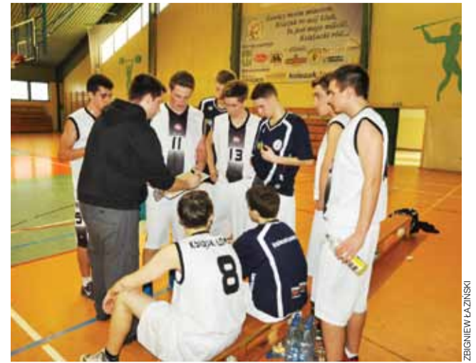
Juniorzy Księżaka walczą w rundzie finałowej województwa łódzkiego o miejsca 1-6.