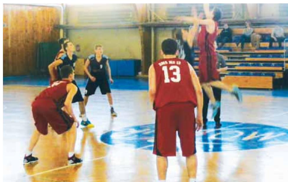
Mecz UKS Żychlin kontra SMS MG-13 Łódź podczas Wojewódzkiej Ligi Koszykówki U-18 w Łodzi.

Zachęcamy wszystkich sympatyków siatkówki i kibiców drużyny Volley Team Żychlin do aktywnego dopingu. Dla widzów przygotowano liczne atrakcje i nagrody, m.in. konkurs celnej zagrywki. Dla amatorów fotografii konkurs na najlepsze siatkarskie ujęcie z turnieju. Dla autora najlepszego zdjęcia bardzo atrakcyjną nagrodą rzeczową. Dla najbardziej aktywnego kibica czeka koszulka Asseco Resovii Rzeszów – zeszłorocznego Mistrza Polski siatkówki męskiej.