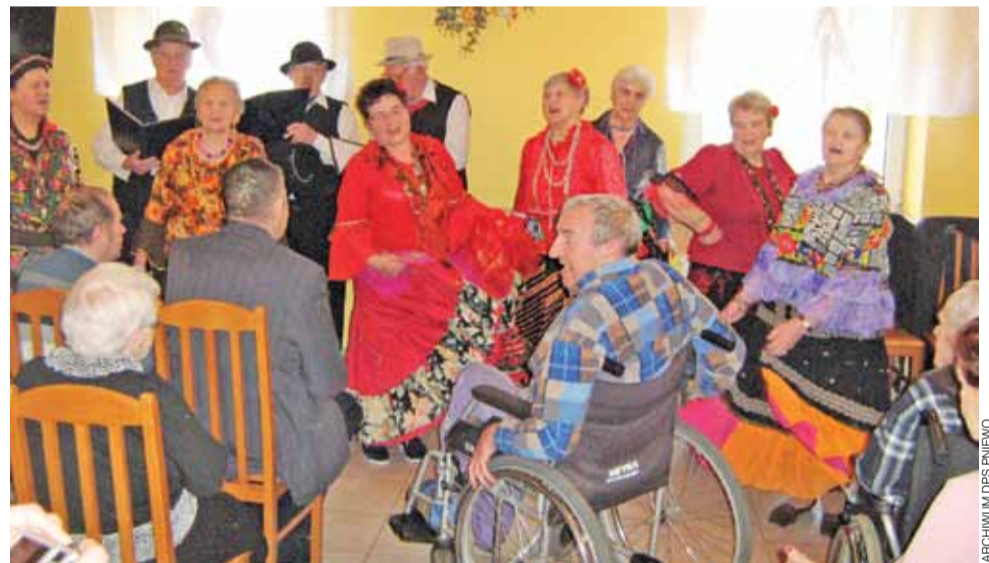
Występ chóru Wrzos ze Zdun dał mieszkańcom DPS Pniewo wiele radości.