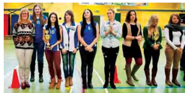
Siatkarki Zespołu Szkół Żychlin z pucharem za zajęcie czwartego miejsca w KALS Kobiet.