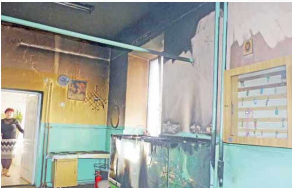
Tak w środę rano wyglądało pomieszczenie szatni w SP 1, gdzie wybuchł pożar. Najprawdopodobniej źródłem pożaru była akwariowa jarzeniówka. Woda z pękniętego akwarium sama ugasiła ogień.

W środę większość pomieszczeń klasowych została doprowadzona do porządku. Najgorsze zgliszcza zostały w szatni, gdzie nadal stoi pęknięte akwa-