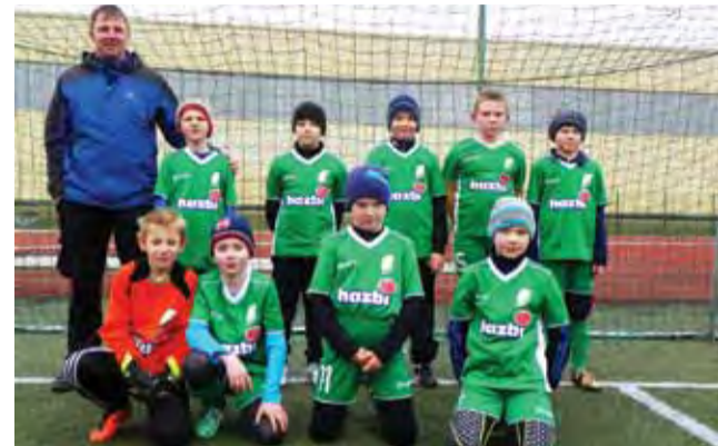
W gronie dziesięciolatków bezkonkurencyjna była ekipa Pelikana 2004.