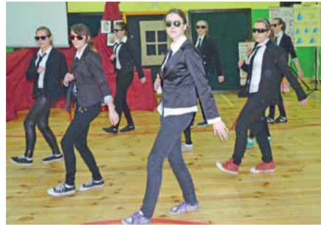
Jedną z atrakcji Dnia Otwartego w gimnazjum w Popowie był występ dziewczęcej grupy tanecznej.