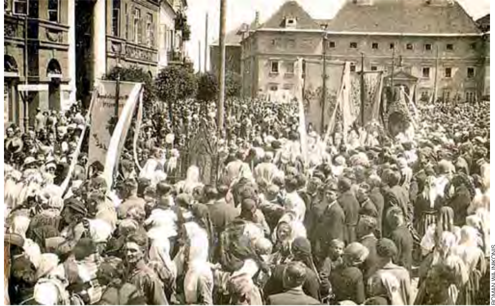
Boże Ciało w Łowiczu – 31 maja 1934 r.