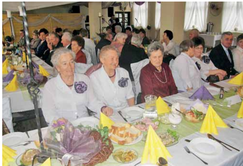
Chórzystki w strojach galowych, z kwiatami w kolorze fioletowym, podczas balu z okazji 10-lecia zespołu.

Pierwszy występ zespołu odbył się już 25 kwietnia 2004 roku, w Domu Kultury w Zdunach. Na widowni zasię-