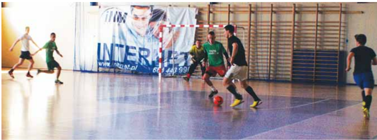
Spotkanie pomiędzy drużyną Jurny Buhaj a Deltą Śleszyn, zakończyło się wygraną Jurnego 7:4.