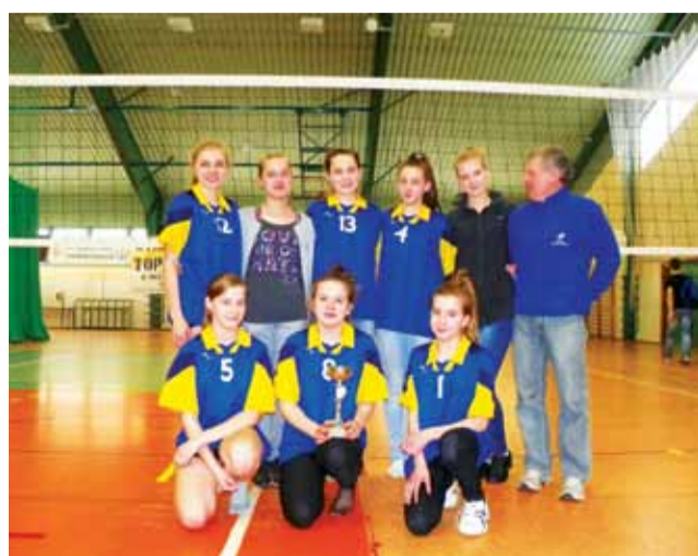
Ekipa Gimnazjum z Domaniewic pewnie wygrała zmagania w powiecie łowickim.

Sport Szkolny | PGS w piłce siatkowej dziewcząt