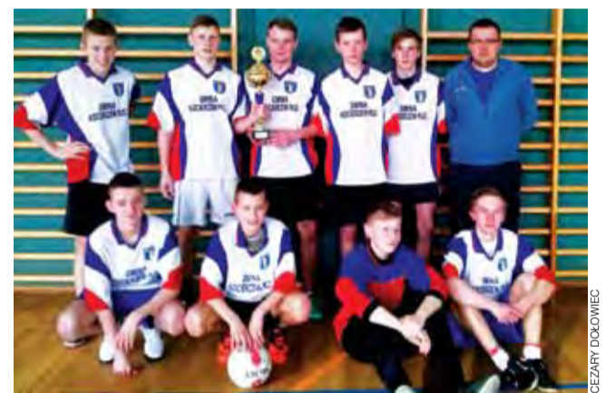
Ekipa z Łaguszewa zagra teraz w finale wojewódzkim.