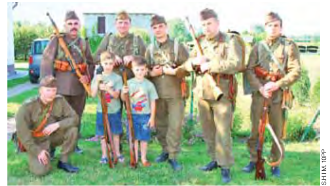
Członkowie Stowarzyszenia Historycznego im. 10 Pułku Piechoty w czasie jednego ze swoich przemarszów przez łowickie wsie.

larzu i łowickich pasiakach, przeznaczony dla klasy IV – nikt nie napisał go bezbłędnie. Łatwiejsze dla uczestników okazały się natomiast ortograficzne opowieści o zółwiu (tekst dla klas II – III) i o uczniu, który chciał zostać chirurgiem (tekst dla klas V – VI). Każdy uczestnik dostał na pamiątkę książkę i kubek, natomiast zwycięzcy pod koniec roku szkolnego otrzymają nagrody burmistrza Łowicza.