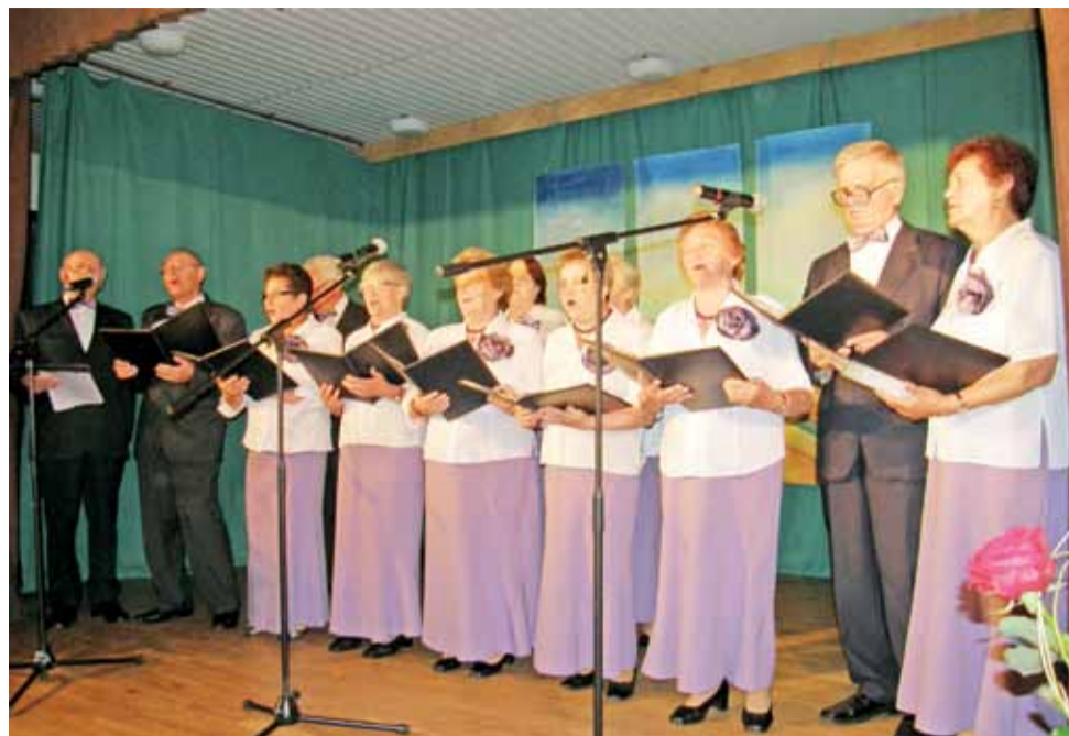
„Wrzos” śpiewał podczas jubileuszu 50-lecia par małżeńskich niejednokrotnie. To występ z 25 lipca 2010 roku.

15 lutego tego roku seniorzy bawili się w miejscowej remi-