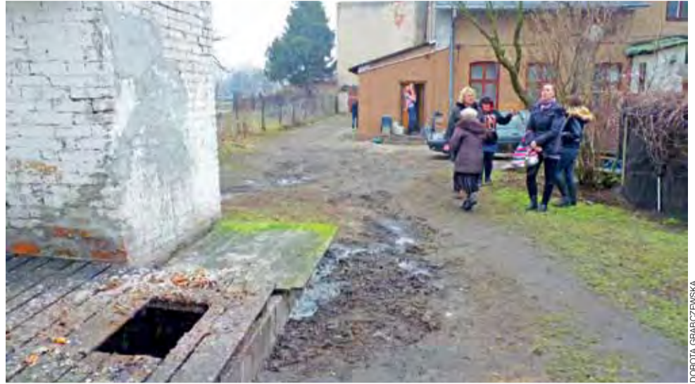
Mieszkańcy kamienicy przy ulicy 3 Maja 5, tuż obok targowicy, wciąż nie mają wody, a zamiast szamba mają śmierdzące kloaki.

W ulicy 3 Maja nie ma kanalizacji ściekowej. Podprowadzenie wody do kamienicy oznaczałoby konieczność budowy dużego szamba z prawdziwego zdarzenia. Samorząd może też zabiegać o budowę kanalizacji w ulicy, ale to już kilkumilionowe zadanie, choć przed laty ujęte w planach rozwoju miasta. – Na podprowadzenie wody