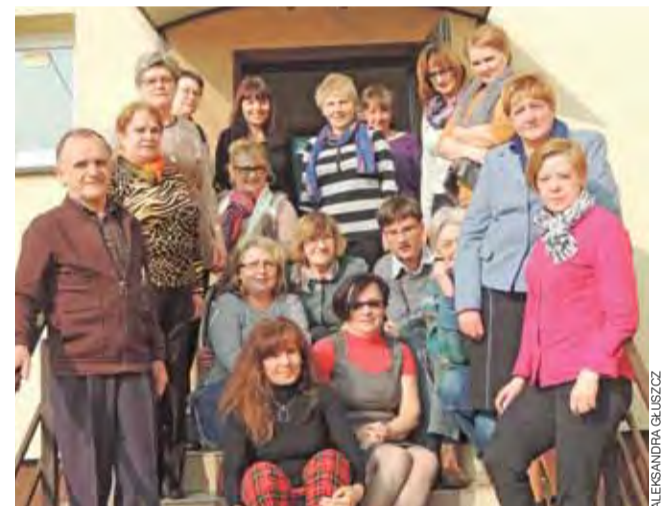
Członkowie Stowarzyszenia Pomocy Dzieciom i Młodzieży „Blisko Dziecka” podczas XII walnego zebrania członków

Jednym z najważniejszych przedsięwzięć stowarzyszenia w 2014 roku będzie projekt finansowany z Kapitału Ludzkiego – Postaw na pracę, organizowa-