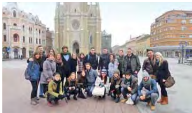
Uczestnicy wymiany podczas zwiedzania Nowego Sadu w Serbii.