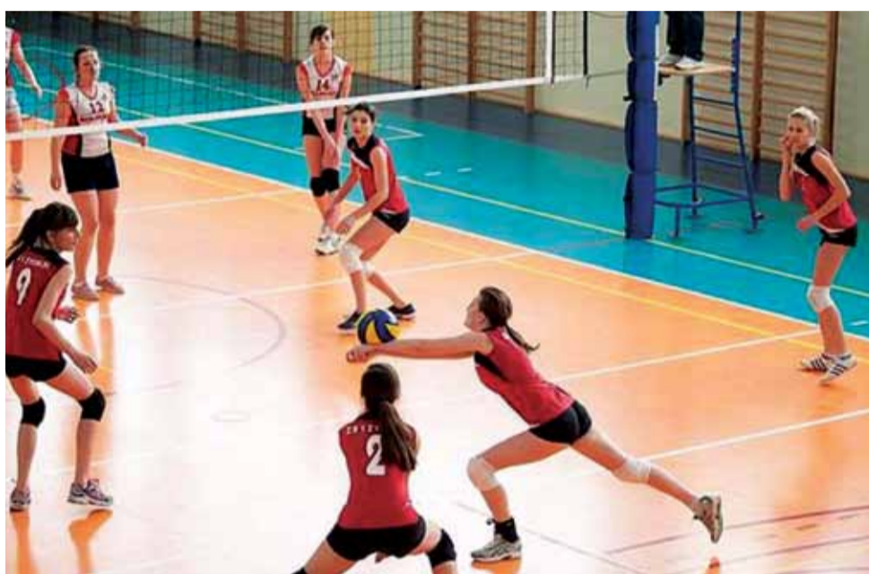
Mecz zawodniczek Mickiewicz Żychlin kontra Hurt Pap Kutno podczas ostatniej kolejki rozgrywek KALS.