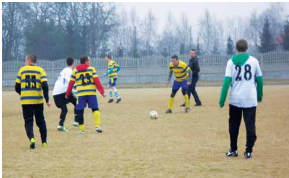
Juniorzy z Bielawy szykują się do piłkarskiej wiosny.