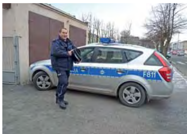
Komisariat w Żychlinie zbiera pieniądze na zakup nowego radiowozu, by sprawnie obsługiwać mieszkańców.

Ponieważ obrażenia mężczyzny są powyżej dni 7, trwa postępowanie wyjaśniające, co do okoliczności wypadku. dag