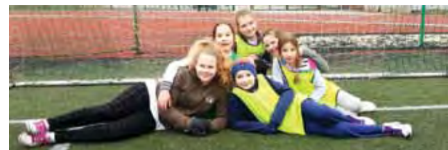
Wśród dziewcząt eliminacje miejskie wygrała łowicka Siódemka.