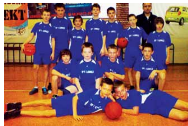
W Łowiczu najlepsi koszykarze są w SP 1.