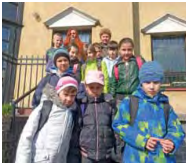
Dzięki wyższej o 5 tys. dotacji z urzędu gminy dzieci ze świetlicy środowiskowej mogą liczyć w tym roku na więcej atrakcji.

– Chcemy też kupić dwa kolorowe regały za 500 zł, by ożywić nieco szarość pomieszczenia świetlicowego oraz aparat fotograficzny, by upamiętniać nasze