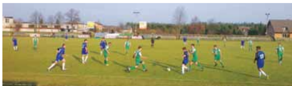
Zawodnicy Orła Nieborów odnieśli cenne zwycięstwo na trudnym terenie w Zelowie.