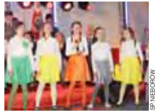
Dzięki współpracy szkoły z Centrum Promocji Kultury na warszawskiej Pradze, uczennice z Nieborowa mogły zaprezentować się szerszej publiczności.