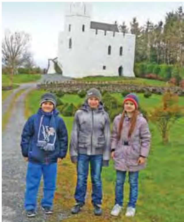
Młodzi judocy mieli okazję zwiedzić wiele ciekawych miejsc w Irlandii.