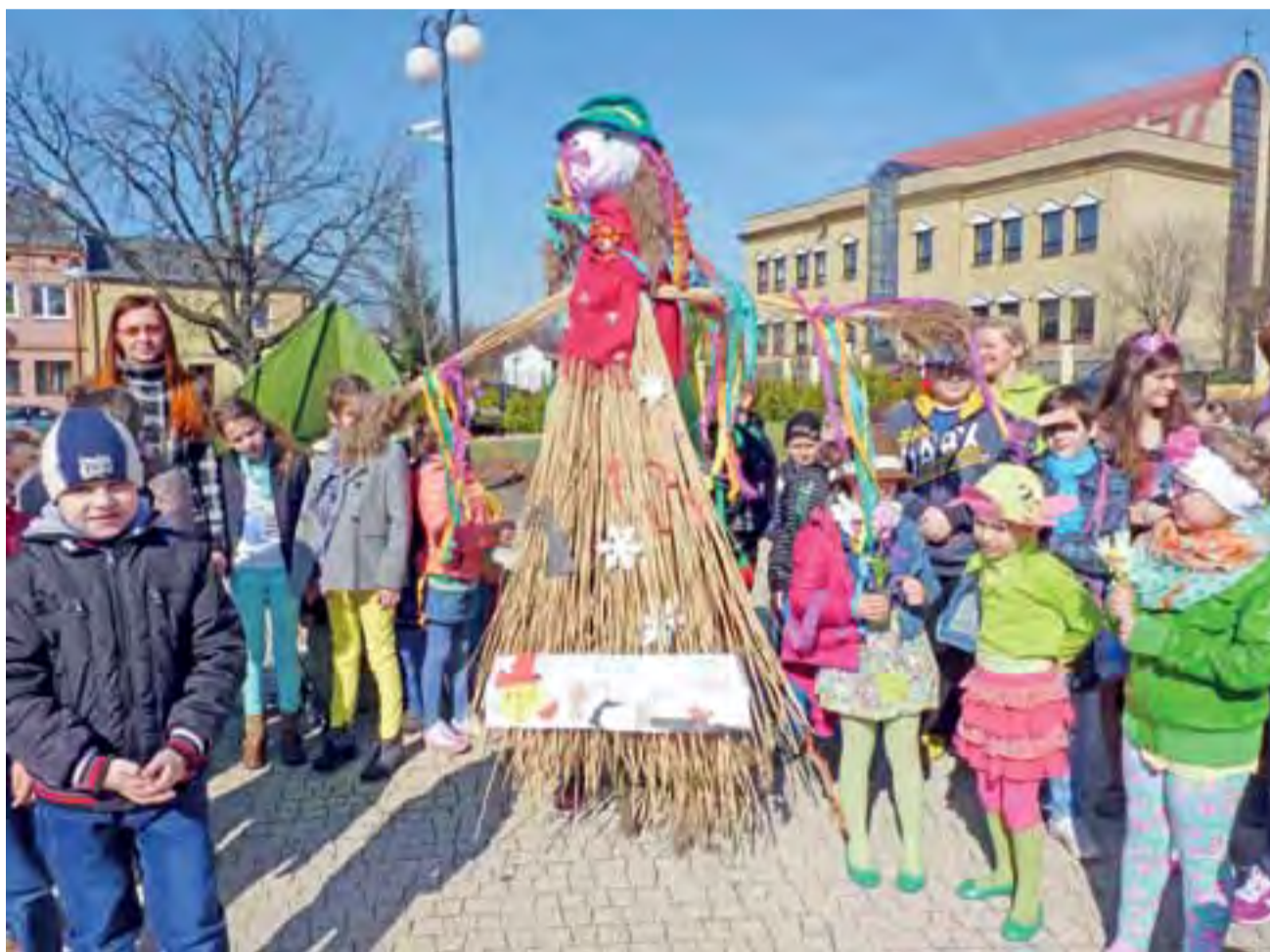
Marzanna SP 1 była bardzo wysoka, w sukni z wikliny.

Dzieci z SP 1 ubrane w zielone przebranie z zielonym liściem były rewelacyjne. Obok były przedszkolaki przebra-