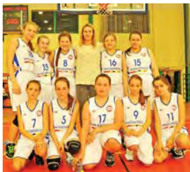
Zespół żaczek Księżaka powalczy o 5. miejsce w woj. łódzkim.

Po rozegraniu dziewięciu spotkań łowiczanki zajęły w rundzie