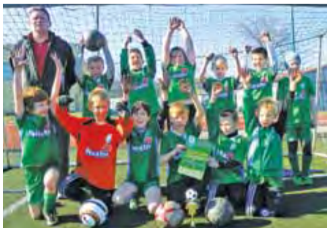
Pelikan z rocznika 2004 pewnie przeszedł przez eliminacje powiatowe.

W turnieju MUKS Pelikan zagrał w składzie: Mateusz Goz-