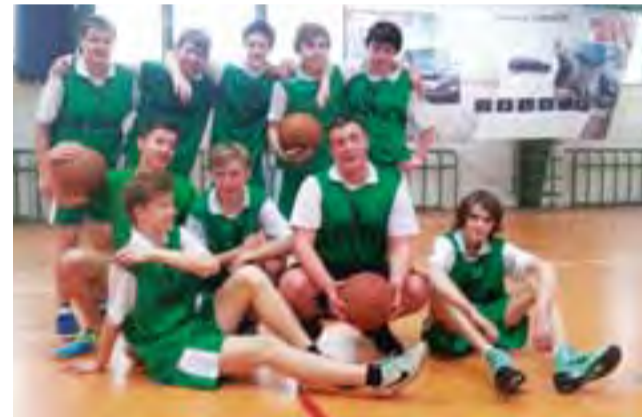
Ekipa Gimnazjum nr 4 w miejskich zmaganiach zajęła drugie miejsce.

Wyniki rywalizacji: G 2 Łowicz – Pijarskie GKP 40:2, G 1 Łowicz – G