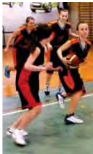
W zawodach dziewcząt odbył się tylko jeden mecz.

Szkoda, że nauczyciele wychowania fizycznego z innych szkół nie chcą rywalizować w koszykówce, która w naszym mieście jest tak popularna. Często tłumaczą to tym, że nie mają zawodniczek trenujących w klubie UMKS Książka i nie mają szans