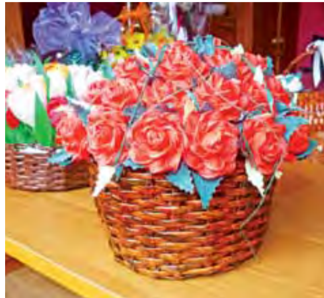
Z bliska na polakierowanej plecionce widać jeszcze litery tekstu.