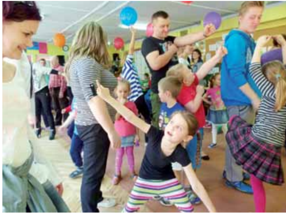
W nietypowych zajęciach prozdrowotnych w „Słoneczku” uczestniczyły dzieci wspólnie z rodzicami.

Spotkanie rozpoczęło się występem dzieci z grupy 5-latków. Przedszkolaki zaprezentowały różnorodne możliwości aktywnego spędzania wolnego czasu. Zachęcały do spacerów, wspólnych wyjść na place zabaw i do parków. Po przedstawieniu zarówno dzieci jak i rodzice ruszyli w wir tańców latynoamerykańskich z elementami ćwiczeń fitness oraz zabaw ruchowych, możliwych do wykonania z czynnym udziałem rodziców. Rodzice wspólnie z maluchami robili śmieszne miny, naśladowali siebie nawzajem, wspólnie płaśli czy też skakali. Dzieciom bardzo spodobała się zabawa polegająca na tym, że rodzice mie-