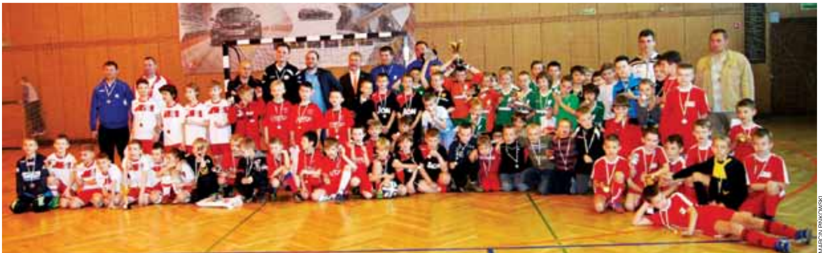
Pamiątkowe zdjęcie uczestników turnieju z medalami i pucharami.