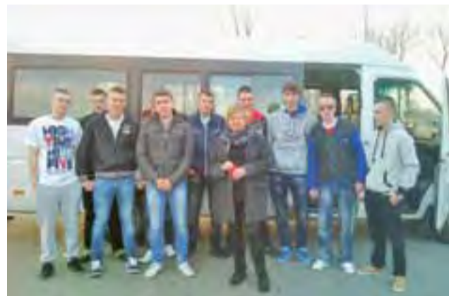
Mechanicy przed wyjazdem na lotnisko.

Wcześniej wszyscy uczestnicy wyjazdu przeszli kurs języka angielskiego. Podczas niego zapoznali się ze specyfiką regionu, a przede wszystkim z charaktery-