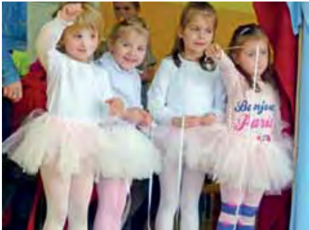
Najmłodsze dziewczęta ze szkoły w Starym Waliszewie zaprezentowały się w Jeziorze Łąbędzimu.

Podczas spotkania można było oglądać m.in. taneczne popisy przedszkolaków. Najmłodsze dzieci zatańczyły Jezioro Łąbędzie, naśladowały taniec z piosenki Gangnam Style po-