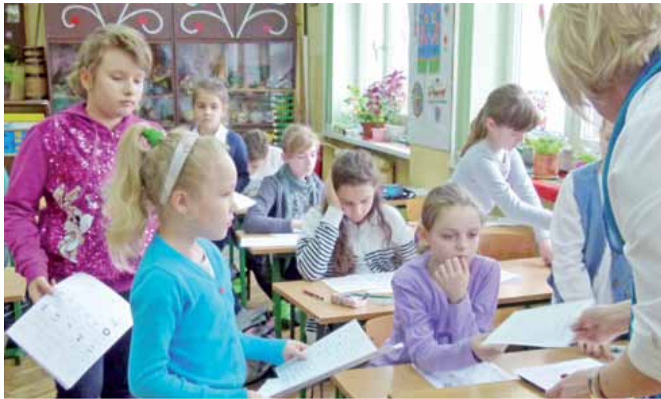
W SP nr 2 do Kangura matematycznego przystąpiło ponad 30% uczniów. Testy rozwiązywano w pięciu klasach.

Zainteresowanie konkursem w szkołach było różne. W łowickiej SP 2 w tym roku przystąpiło do niego aż 118 uczniów z klas II-VI. – Cieszymy się z tak dużego zainteresowania, tym bardziej,