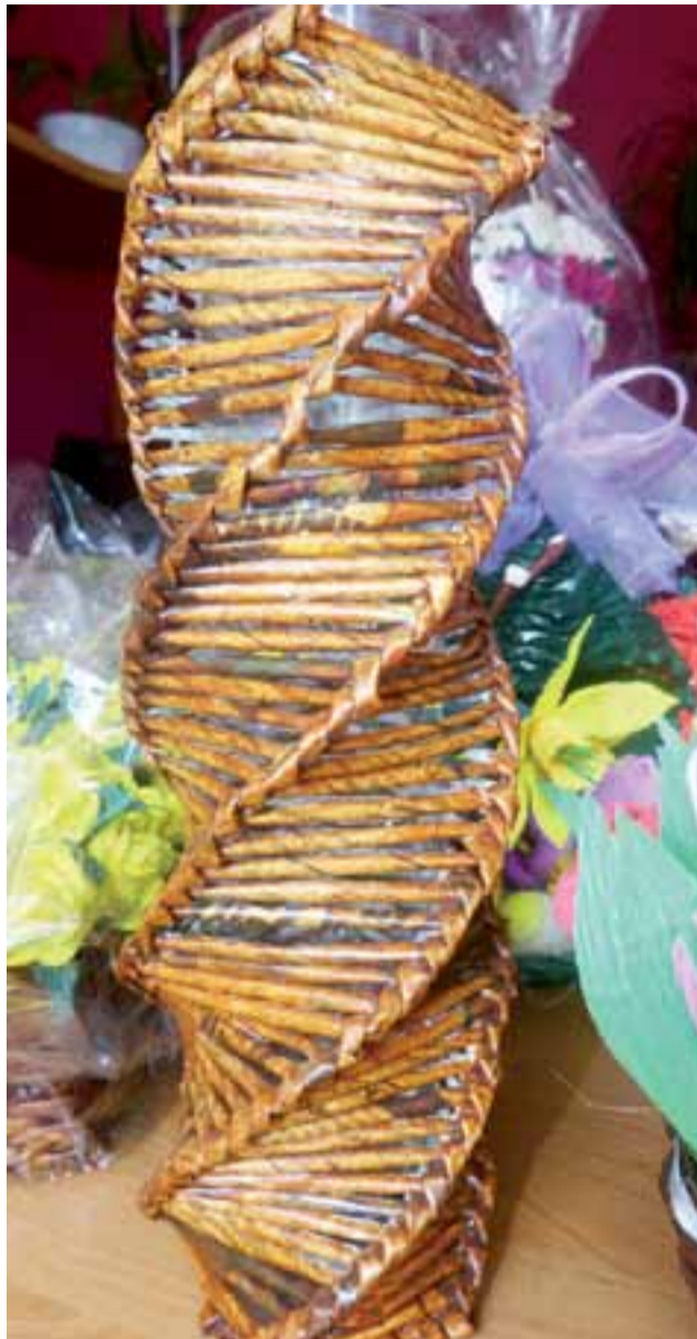
Osłona na szklany wazon tylko z daleka wygląda jak prawdziwa wiklina.