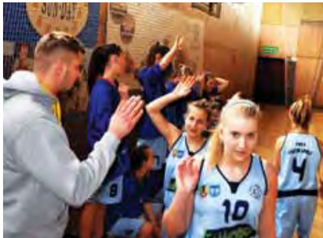
Łowickie Kadetki zakończyły rozgrywki wojewódzkie na 6. miejscu.

Koszykarki Książka ostatecznie uplasowały się w rozgrywkach Ligi Wojewódzkiej Kadetek (U-16, do lat 16) na 6. miejscu w gronie 11 zespołów, co jest dobrym wynikiem. Przypomnijmy, że nasz team grał w większości zawodniczkami z młodszego rocznika 1999, które w nadchodzącym sezonie pozostaną w tej rywalizacji.