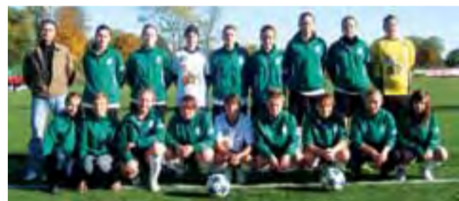
Piłkarki Pelikana pokonały w niedzielę KU AZS aż 5:1!