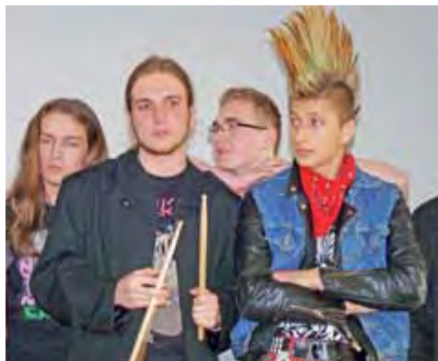
Pokaz Talentów w kategorii „Zespoły” wygrało w tym roku punkowo-rockowe „Zderzenie”.

Siedem modelek (w tym jeden model stylizowany na kobietę) przedstawiało stroje z „tego, co jest pod ręką”, czyli worków foliowych na śmieci, folii aluminiowej, papieru kolorowego, gazet i kartonu. Niemalże wszystkie stroje wzbudziły zachwyt publiczności, zwłaszcza kreacja wieczorowa z czarnego worka