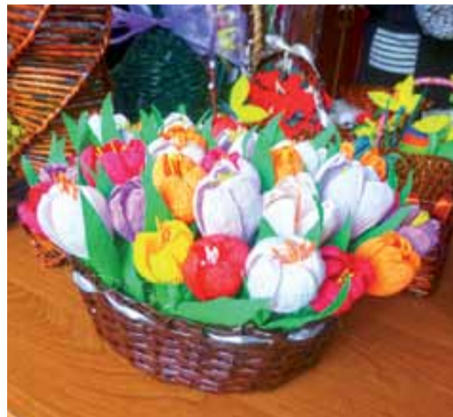
Koszyk wypleciony z Nowego Łowiczainina z bibułowymi krokusami.