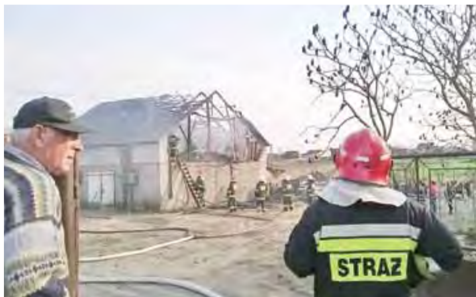
W sobotę, 22 marca, doszło do pożaru stodoły przy ul. Dobrzelińskiej w Żychlinie. W gaszeniu budynku i zabezpieczeniu terenu brały udział jednostki OSP z Żychlina i Sleszyna OSP, JGR z Kutna.