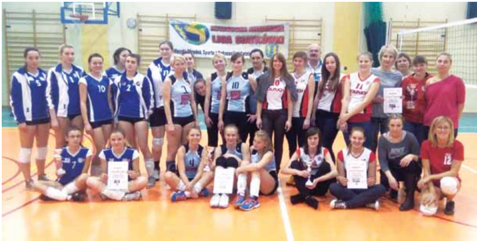
Uczestniczki III Wiosennego Turnieju Siatkówki Kobiet w Kutnie.

Piłka siatkowa | III Wiosenny Turniej Siatkówki Kobiet