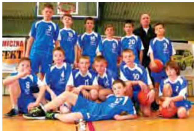
Uczniowie z SP 1 zostali mistrzami powiatu w minikoszykówce.