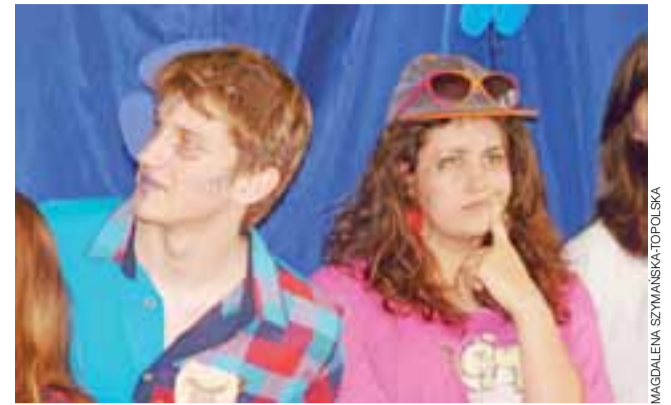
Pytania z wiedzy o życiu i twórczości Józefa Chełmońskiego okazały się dla uczestników tego konkursu bardzo trudne.