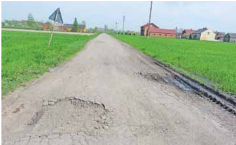
Droga do Rakowa czeka na remont. Urząd Gminy w Pacynie złożył wniosek na dofinansowanie remontu ok. 1000 m do Urzędu Marszałkowskiego w Warszawie w ramach WFOGR.