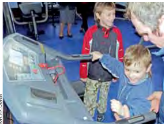
Już podczas otwarcia świetlicy bieżnia cieszyła się dużym powodzeniem, również wśród najmłodszych.

W drugim konkursie (pisanka) GOK nie stawia żadnych ograniczeń związanych z zastosowaną techniką. Jaja mogą być np. malowane czy oklejane papierem. Ważne, aby w przypadku wykorzystania jaj naturalnych były one trzykrotnie gotowane, aby zachowały swoją twardość. Prace należy dostarczyć do GOK do 11 kwietnia. Termin ogłoszenia wyników i wręczenia nagród zostanie podany, gdy jury zakończy swoje prace. tb