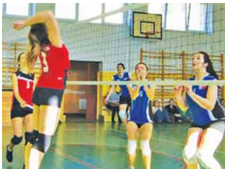
Siatkarki ZS w Żychlinie w spotkaniu z drużyną Mickiewicza.

Sport szkolny | Półfinał Powiatowy Piłki Siatkowej Dziewcząt i Chłopców