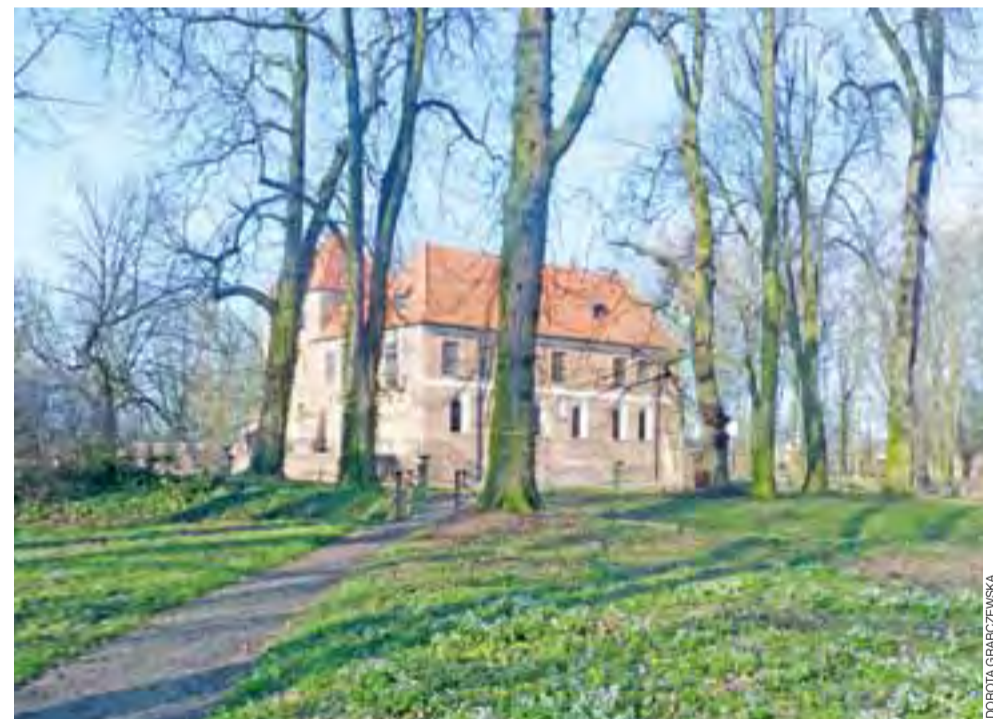
Starostwo Powiatowe w Kutnie do 31 marca chce złożyć wniosek do Wojewódzkiego Funduszu Ochrony Środowiska w Łodzi na rewitalizację zieleni w parku przy Muzeum Zamek w Oporowie.

reszta ciała jest bezwładna, nie było to łatwe. Mimo że potrzebuje pomocy przy myciu, ubieraniu, jedzeniu, przenoszeniu z jednego miejsca na inne, nie traci nadziei. Wierzy, że kiedyś to się zmieni. Przychodząc na koncert i ofiarując tyle, ile jesteś w stanie – możesz mu w tym pomóc. ag