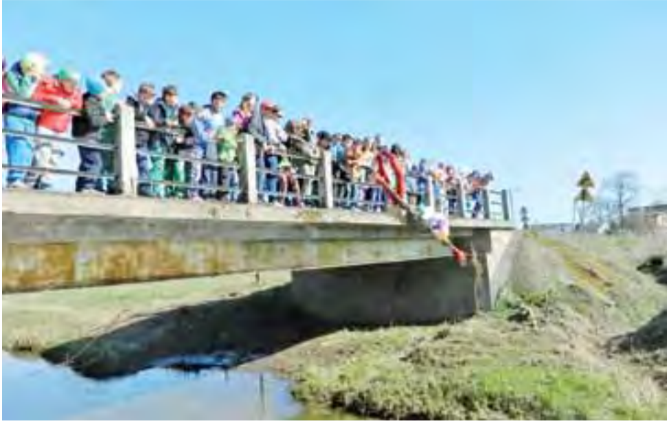
Dzieci ze Szkoły Podstawowej w Mastkach wrzuciły Marzannę do Nidy.