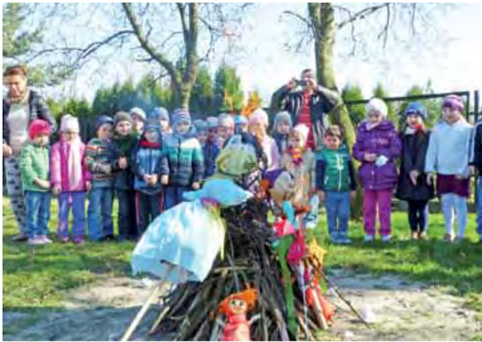
Przedszkolaki i ich goście pożegnali zimę paląc Marzannę.

Można więc uznać, że podczas dni otwartych rozpoczyna się już praca z dzieckiem. Każdego dnia (13 i 14 oraz 20 i 21 marca) do placówki przychodziło około 30 dzieci, które brały udział w typowych zajęciach