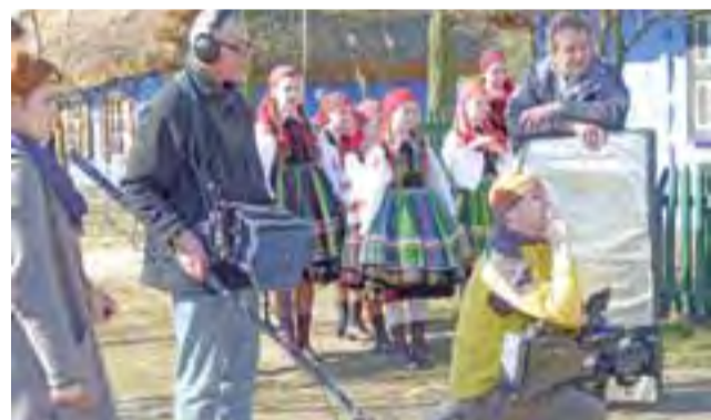
Kocierzewiaci szybko wcielili się w swoje role podczas nagrywania programu dla TVP. Ekipie telewizyjnej sprzyjała również pogoda.

10 lat temu przy Placu Targowym powstała trzykondygnacyjna hala targowa, która obecnie jest rozbudowywana o nową dwukondygnacyjną halę i siedmiopiętrowy wieżowiec. mst