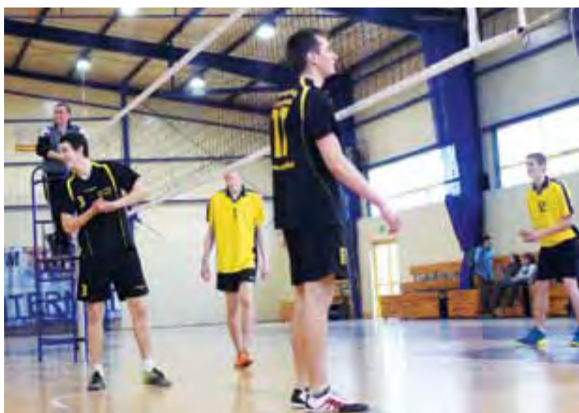
Mecz pomiędzy drużynami: LO im. A. Mickiewicza w Żychlinie a ZS w Żychlinie