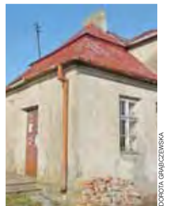
Budynek w Mnichu ze świetlicą na parterze zostanie przez gminę Oporów wkrótce wyremontowany.

ku. Jak podkreśla wójt, najważniejsze jest jednak poprawienie dachu i założenie rynien, które wprawdzie są, ale są dziurawe jak sito, a woda leje się z dachu po ścianach. Budynek rzeczywiście wygląda fatalnie, gdyby gmina nic nie zrobiła, niszczałby w szybkim tempie. dag