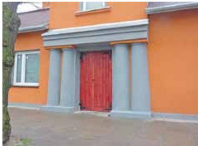
Zainteresowanie mieszkańcami w kamienicy przy ulicy 1 Maja 17 w Żychlinie jest bardzo duże. Przydziału mieszkań jeszcze nie było. Nastąpi to w kwietniu.

– Mnie też kilka osób pytało o przydział mieszkań, ale to jeszcze nie nastąpiło – przyznaje Grzegorz Ambroziak. – Być może nieuprawnione zwiędzenie lokali sprawiło takie wra-