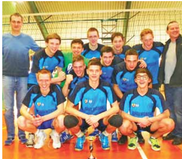
Siatkarze z Chelmońskiego wygrali turniej powiatowy i mieli duże szanse na awans na zawody wojewódzkie.