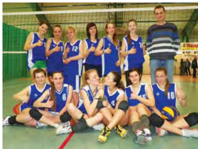
Zespół dziewcząt z I LO w Łowiczu wygrał mistrzostwa powiatu i był trzeci w zawodach rejonowych.