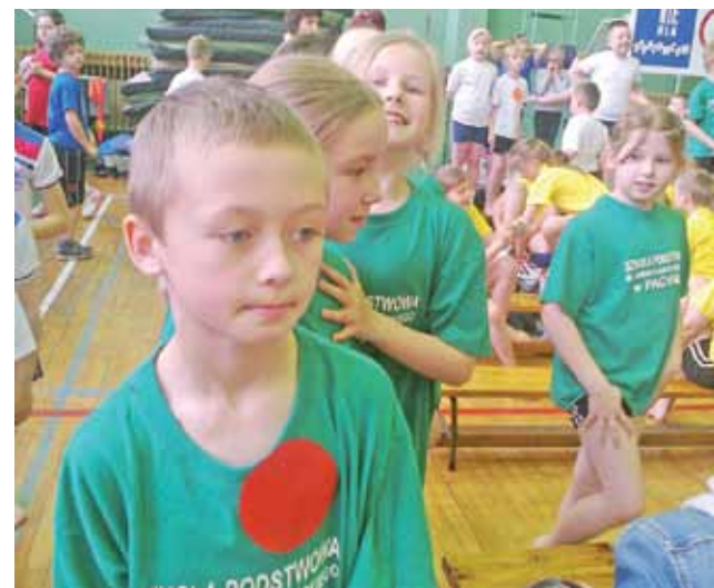
Uczniowie klas I-III ze Szkoły w Pacynie wygrali Turniejadę.

Wszyscy doskonale się bawili, choć dzieci bardzo ze sobą rywalizowały i cieszyły z kolejnego zdobytego pucharu. Były też medale i okolicznościowe dyplomy. Dla szkół były profesjonalne tablice punktowe.