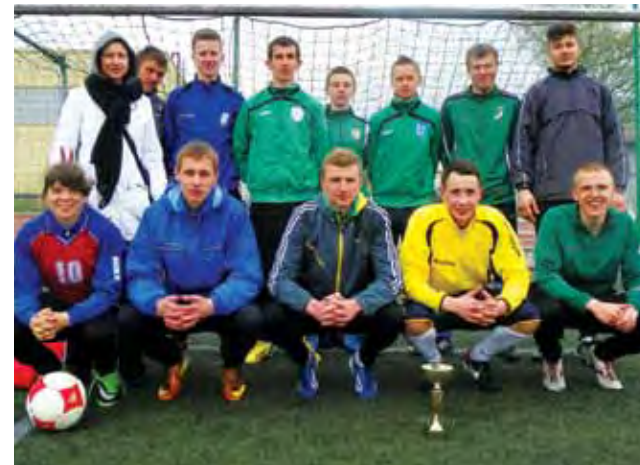
Ekipa z Blichu wygrała zawody powiatowe, potem rejonowe i zagra w finale wojewódzkim.

Mistrzostwa odbyły się na stadionie OSiR i wzięło w nich udział 7 ekip, które rywalizowały systemem pucharowym. W ekipie z Blichu było kilku graczy Pelikana i to na pewno zadecydowało o końcowym sukcesie. W finale ZSP nr 2 Łowicz pokonał ekipę Ekonomika 3:0 po dwóch bramkach Micha-