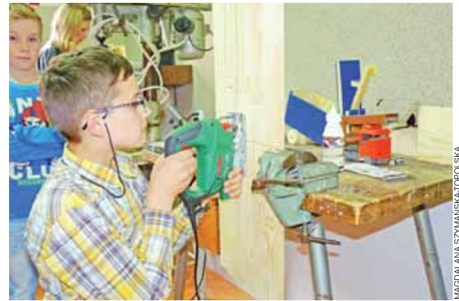
Wycinanie elementów drewnianych z płyt i desek, stało się ulubionym zajęciem chłopców.

W projekcie „Droga do sukcesu” przewidziane są również wycieczki tematyczne. Jedną