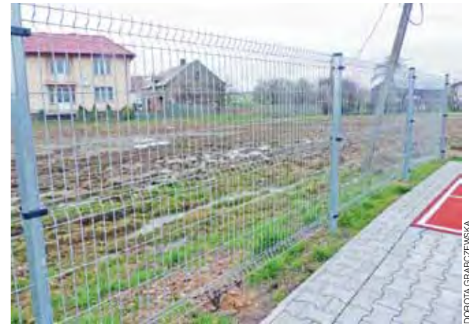
Boisko wielofunkcyjne obok szkoły w Pacynie nie ma odprowadzenia. Woda z boiska jest odprowadzana wprost na niżej położone pola rolników. dag

Oporów | Głośne czytanie po świętach Oskar i pani Róża