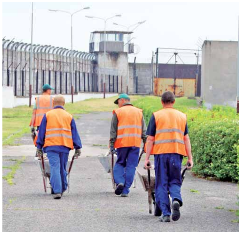
Wiosenne porządki na terenie Zakładu Karnego w Łowiczu.

W pierwszej kolejności skierowania dostają ci więźniowie, którym pieniądze są potrzebne najbardziej – mają do płacenia alimenty czy inne zobowiązania,