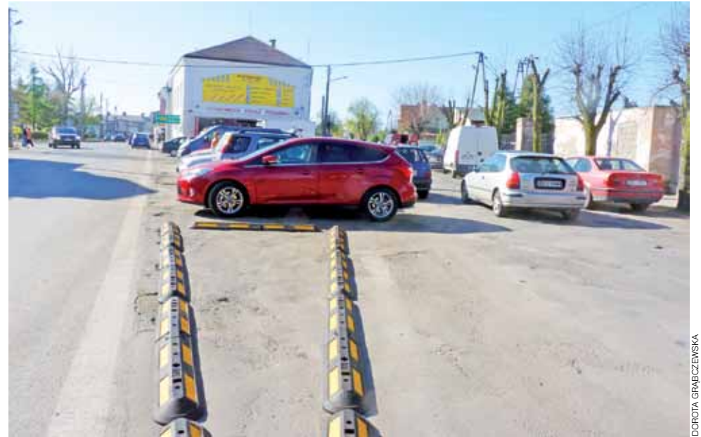
Na wniosek komisji ds. bezpieczeństwa w Urzędzie Marszałkowskim w Łodzi, pracownicy Zarządu Dróg Wojewódzkich, oddział w Łowiczu, zamontowali separatory przy 3 Maja. Podczas czwartkowego targowiska doskonale zdały egzamin.

– Zamontowaliśmy separatory ruchu, gdyż takie było wskazanie komisji ds. bezpieczeń-