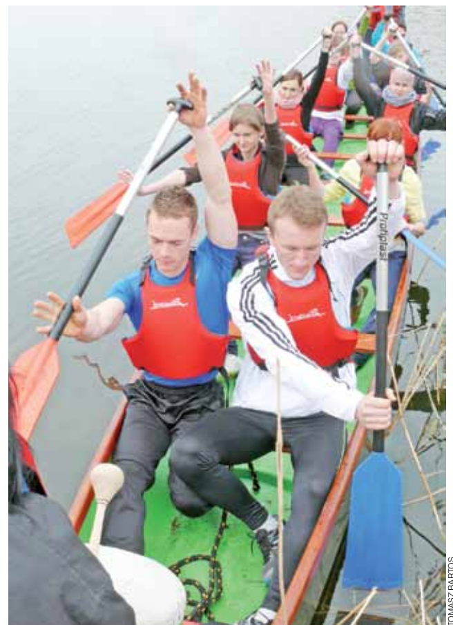
Przed wyruszeniem na wodę każda z osad przechodzi krótkie szkolenie, jak ma posługiwać wiosłami, aby efektywniej płynąć. Szkolą członkowie ŁAS, siedzący na pierwszej ławce.

Akademia jest otwarta na każdego, kto chciałby zasilić osady smoczyczych łodzi. Treningi zaczynają się w niedzielę o godz. 13. ■