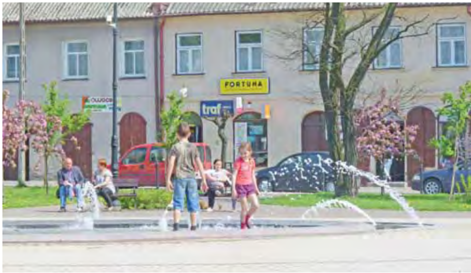
Fontanna w centrum Żychlina została uruchomiona na święta Wielkanocne. Piękna słoneczna pogoda sprzyja spacerom i odpoczynkowi na ławeczkach wokół niej. Chętnych do spędzania wolnego czasu nie brakuje. Tryskające źródła to również raj dla dzieci. Mieszkańcy podkreślają jedynie, że ławek w sezonie letnim wokół fontanny jest za mało, gdyż z każdym rokiem przybywa osób tam wypoczywających. Tekst i fot. dag