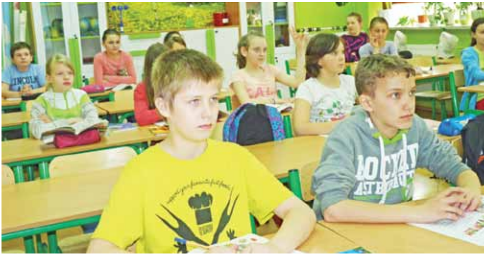
Nowa pracownia i nowoczesne pomoce naukowe są do dyspozycji uczniów ze Szkoły Podstawowej w Kocierzewie Płd. już od marca.

Kocierzew Płd. | Łatwiej zdobywać wiedzę