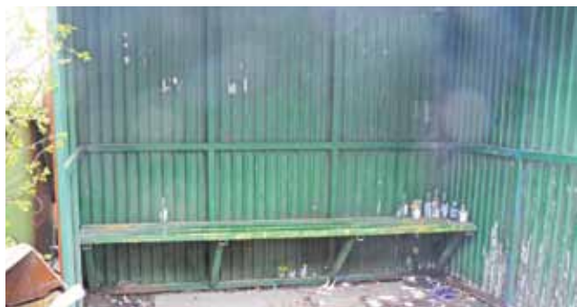
Butelki na przystanku autobusowym w Dobrzelinie to norma. A przecież obok stoi śmietnik.

Przystanek w Dobrzelinie upatrzyli sobie smakosze mocnych trunków. Taką wystawę butelek po alkoholu zastaliśmy na przystanku w południe, 11 kwietnia, choć śmietnik stoi tuż obok przystanku.