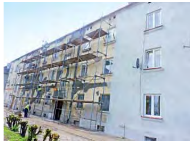
Na bloku Narutowicza 79 już ułożono część nowej elewacji.

– Rynny są dziurawe, w niektórych miejscach aż widać niebo – mówią pracownicy firmy wykonującej zadanie. Pokazują nam miejsca, przez które faktycznie nawet z ziemi widać niebiańskie prześwity. – Cóż z tego, że elewacja jest pięknie zrobiona, skoro woda po niej leci z da-