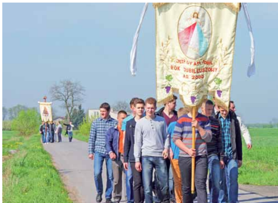
Grupy kawalerów wędrowały we wtorkowe przedpołudnie ze swoich wiosek do kościoła w Boczku, by uroczysto odnieść tam chorągwie.

Tor marszu ma kształt kwadratu. Mężczyźni wędrują przez pola do czterech rogów, które stanowią granicę z sąsiednimi wioskami. W każdym rogu wbiągają w ziemię paleńkę i krzyżyk, kropią to miejsce wodą święconą, po czym palą belkę słomy i chodzą wokół, śpiewając pieśni wielkanocne. Przed czwartym – ostatnim rogiem mają ognisko. Pięką kielbaski, rozmawiają, posilają się i zbierają siły na dalszą wędrowkę. Przed wyruszeniem w drogę śpiewają „Kiedy ranne wstają zorze”. Po zakończeniu marszu wracają do punktu wsi, z którego wyszli i kierują się do