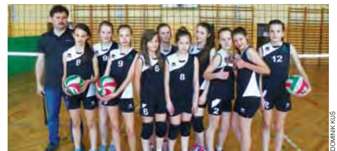
Ekipa siatkarek z Domaniewic w tym roku po zdobyciu mistrzostwa powiatu nie zdołała wygrać zawodów rejonowych.