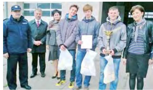
Turniej o bezpieczeństwo odbył się w szkole na Blichu, która ma miasteczko ruchu drogowego.

– Gwiazdy fascynują, bo wciąż niewiele o nich wiemy, a w kosmosie jest jeszcze bardzo dużo do odkrycia. tm