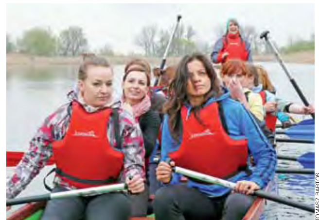
Damska osada odbija od brzegu. Dla bezpieczeństwa wszystkie osoby wsiadające na smoczą łódź muszą mieć założone kamizelki ratunkowe.