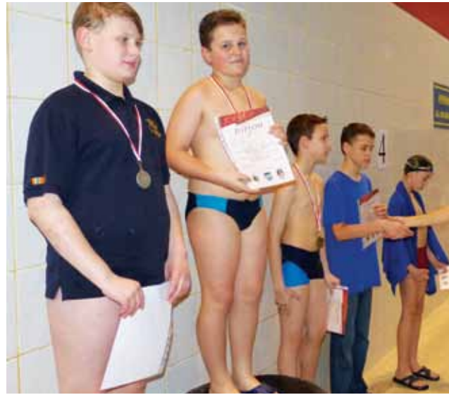
Młodzi pływacy dumnie prezentują swe medale.

Pływanie | X Indywidualne Mistrzostwa Łowicza Szkół Podstawowych