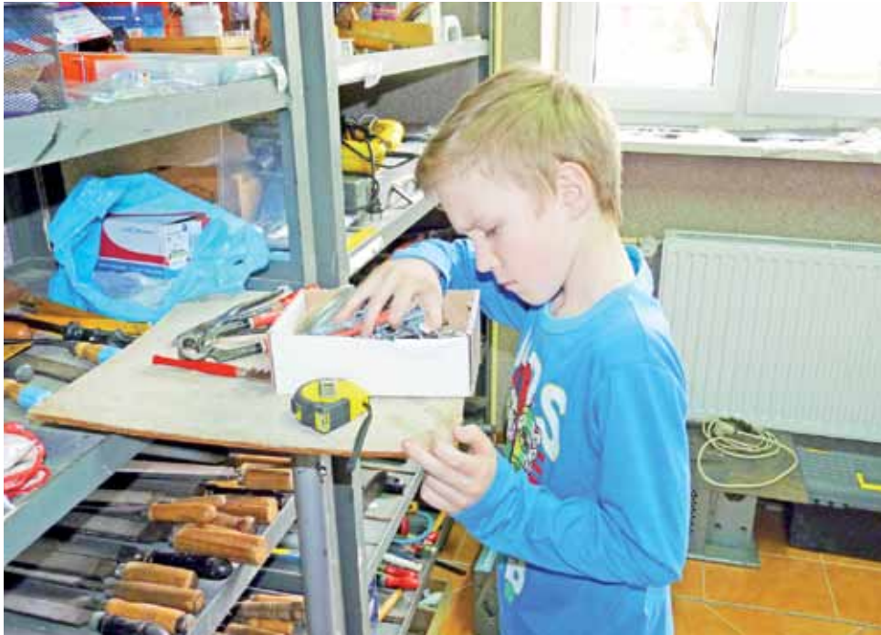
Na zajęciach technicznych uczniowie sami wybierają materiały, które są im potrzebne.

Zajęcia realizowane w „Droga do sukcesu” można podzielić na dwie grupy. Do pierwszej zaliczają się zajęcia z języka polskiego, matematyki, języka angielskiego oraz logopedyczne. Mają one na celu pomoc tym uczniom, których tempo nauki i przyswajania wiadomości jest wolniejsze od tempa innych uczniów. Drugą grupę zajęć sta-