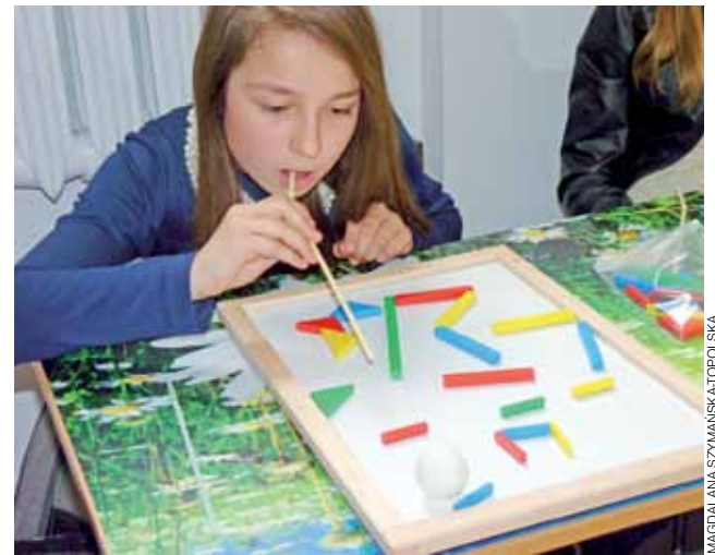
Niby proste ćwiczenie, a ma istotne znaczenie dla poprawy wymowy.

z nich odbyła się w połowie marca. Uczniowie odwiedzili wówczas British Council w Warszawie. To szkoła językowa, która umożliwiła nawiązanie kontaktów językowych z Wielką Brytanią. Uczniowie mieli okazję poznać kilka faktów historycznych na temat tej placówki, rozwiązywali przykładowe zadania egzaminacyjne z języka angielskiego – niektórzy z nich wypadli rewelacyjnie.