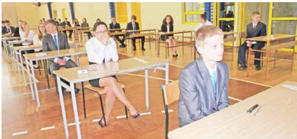
W Żychlinie do egzaminu gimnazjalnego przystąpiło 86 uczniów. Wszyscy pisali egzamin na sali gimnastycznej.