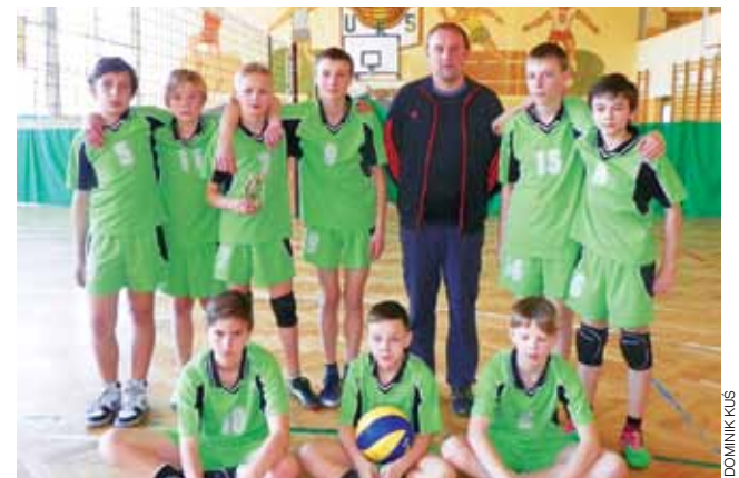
Mistrzowie powiatu łowickiego ze Szkoły Podstawowej w Bednarach.