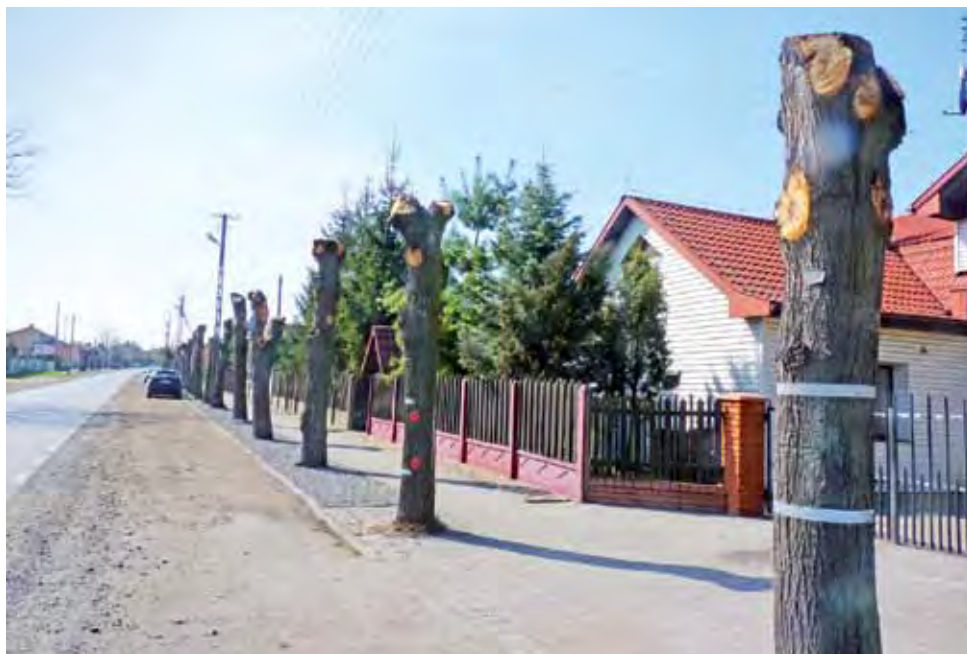
Lipy przy ulicy Sannickiej przycięto na słupy. Miodu z nich nie będzie.

Drzewa powinny przycinać specjalistyczne firmy. Ale jeśli nawet robią to laicy, to wystarczyłoby trochę zdrowego pomysłunku, a tego widać brakuje. str. 2