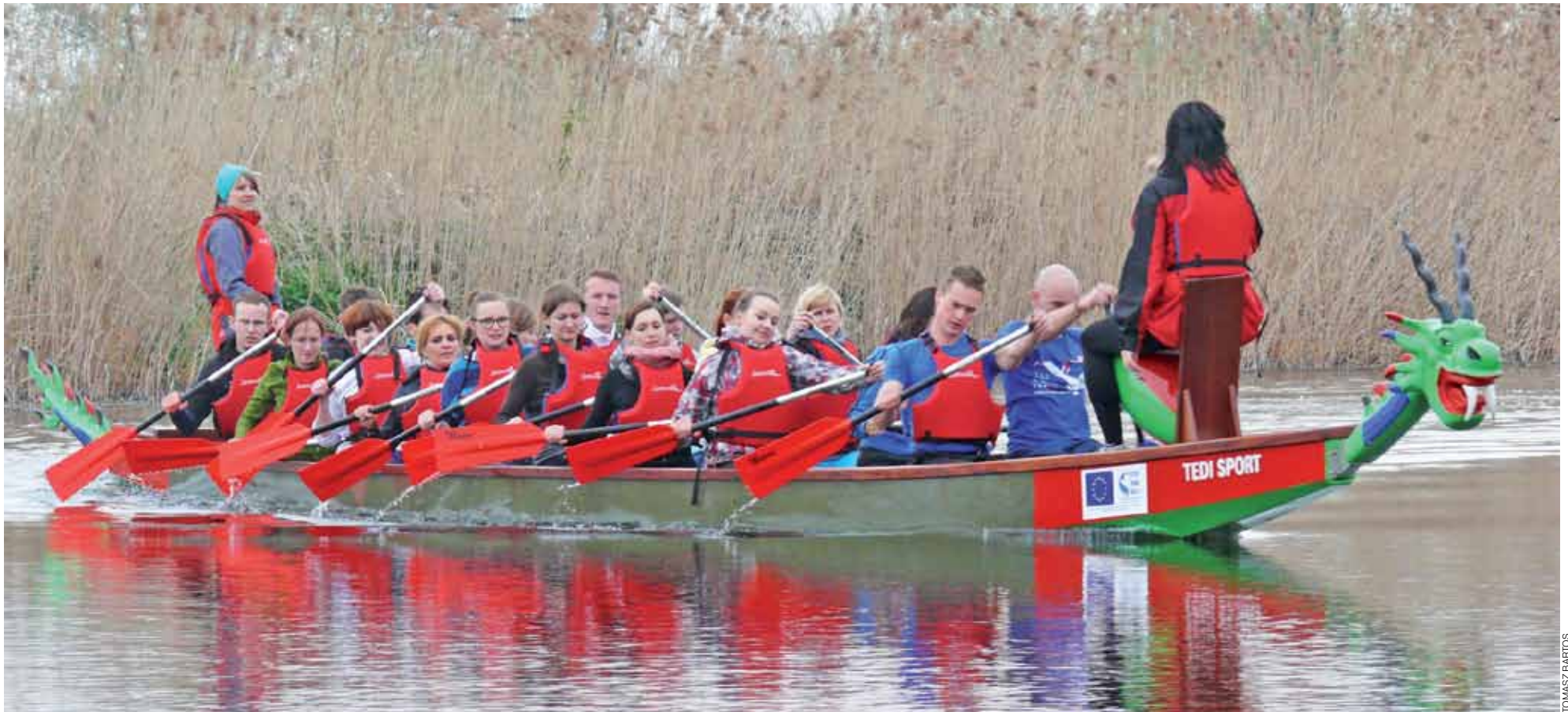
Smocza łódź z pełną osadą liczącą 20 osób robi duże wrażenie. Największe jednak na ostatniej prostej, gdy wiosłarze „dociskają” i łódź płynie na prawdę szybko.

Łowicz | Nowa propozycja Łowickiej Akademii Sportu