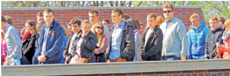
Żychlińscy maturzyści na wałach jasnogórskich podczas drogi krzyżowej w sobotę, 12 kwietnia.