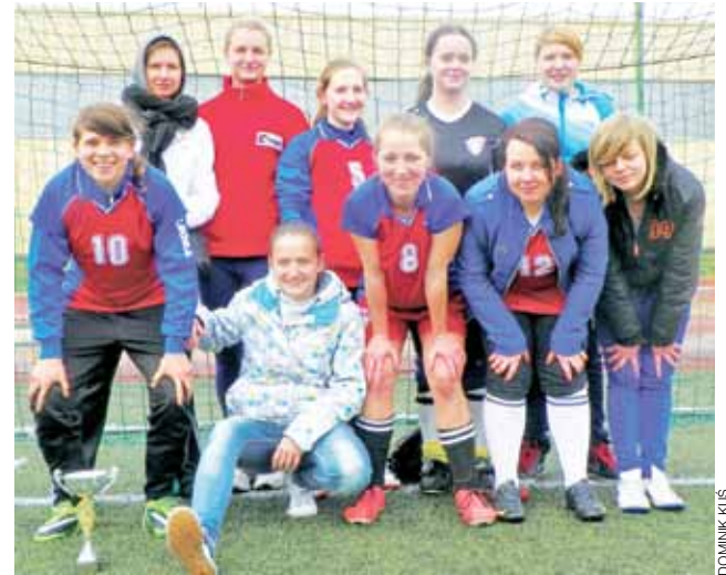
Dziewczyny z ZSP nr 2 na Blichu po zdobyciu mistrzostwa powiatu łowickiego zagrają w zawodach wojewódzkich.

Wyniki rywalizacji: Grupa A: ZSP 4 Łowicz - II LO Łowicz 1:0, I LO Łowicz - ZSP 4 Łowicz 0:1, II LO Łowicz - I LO Łowicz 0:2. Grupa B: ZSP 3 Łowicz - ZSP 2 Łowicz 1:3. Mecze półfinałowe: ZSP 4 Łowicz - ZSP 3 Łowicz 2:0, ZSP 2 Łowicz - I LO Łowicz 0:0 (2:1 karne). Mecz o 3. miejsce: ZSP 3 Łowicz - I LO Łowicz 3:4; br.: 1:0 Zimna, 1:1 Brzezińska, 2:1 Zimna, 2:2 Brzezińska, 2:3 Stawicka, 2:4 Kunikowska, 3:4 Zimna. Mecz o 1. miejsce: ZSP 4 Łowicz - ZSP 2 Łowicz 2:3; br.: 0:1 Wiankowska, 0:2 Wiankowska, 1:2 Pacler, 3:1 Wiankowska, 2:3 Pastusiak.