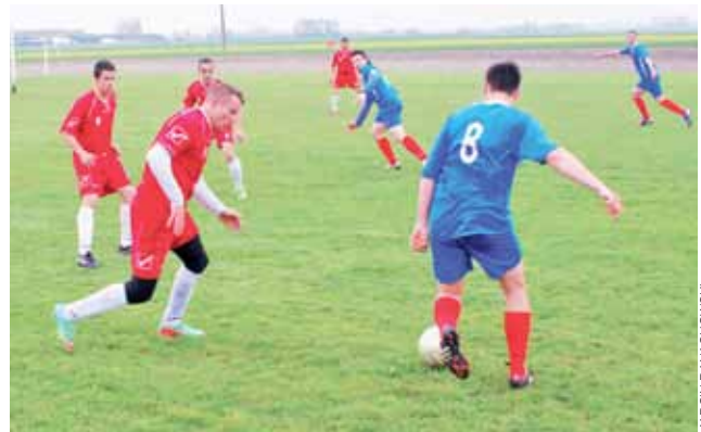
Delta Śleszyn po trzech meczach w rundzie rewanżowej z kompletem punktów.

Następne spotkanie – 15. kolejki Delta zagra na własnym boisku 26 kwietnia z Kotan II Ozorków.