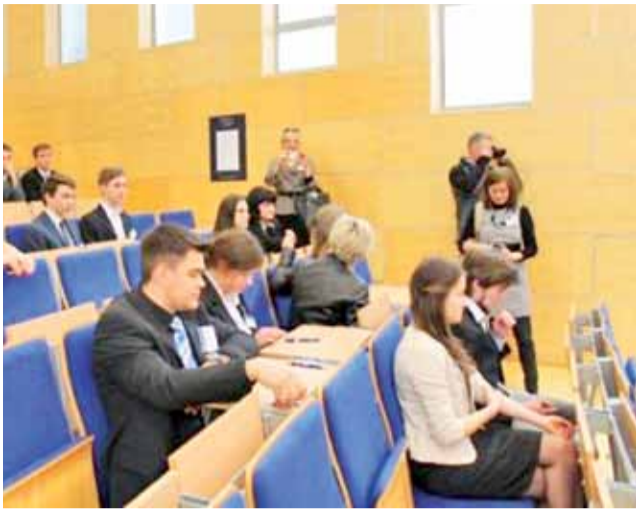
Pisemna część finału IV Ogólnopolskiego Konkursu Wiedzy o Podatkach.