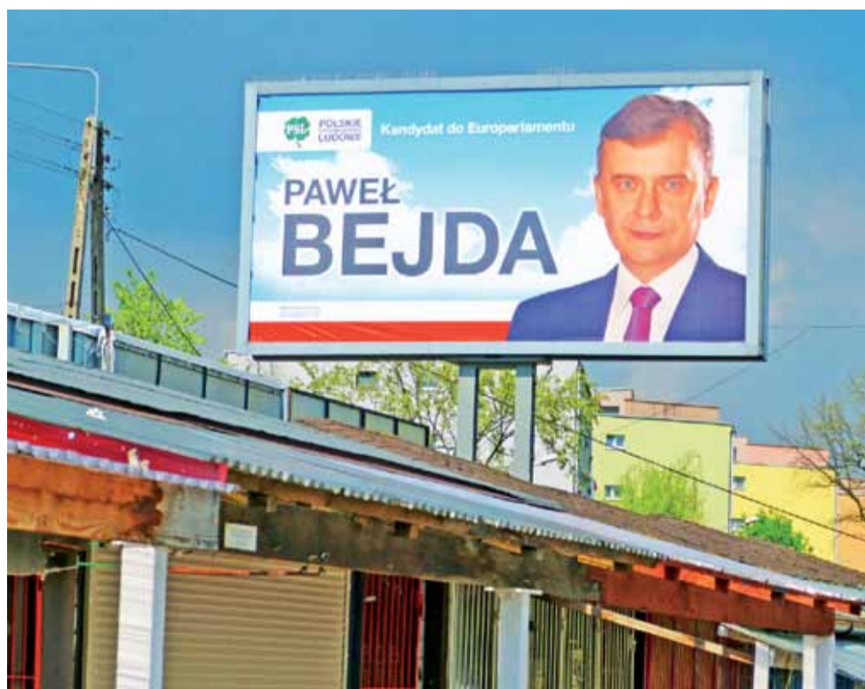
O tym, że kampania wyborcza trwa przypomina w Łowiczu billboard na miejskim targowisku. Wcześniej, przez prawie rok ta powierzchnia reklamowa nie była wykorzystywana.