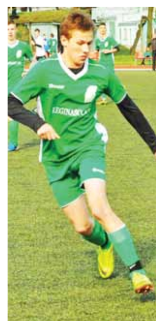
Ekipa Pelikana 1999 po remisie z PTC, ambitnie walczyła w wiceliderem ŁKS.

Po 15. kolejkach Białozieloni są na przedostatnim miej-