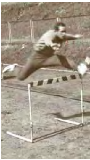
Na treningu. Podczas biegu przez płotki.