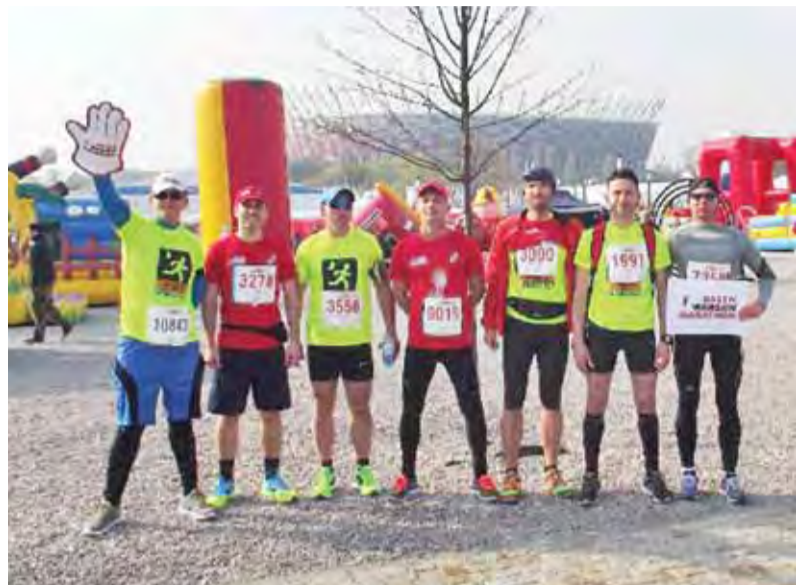
Członkowie „Night Runners”, którzy brali udział w maratonie warszawskim.