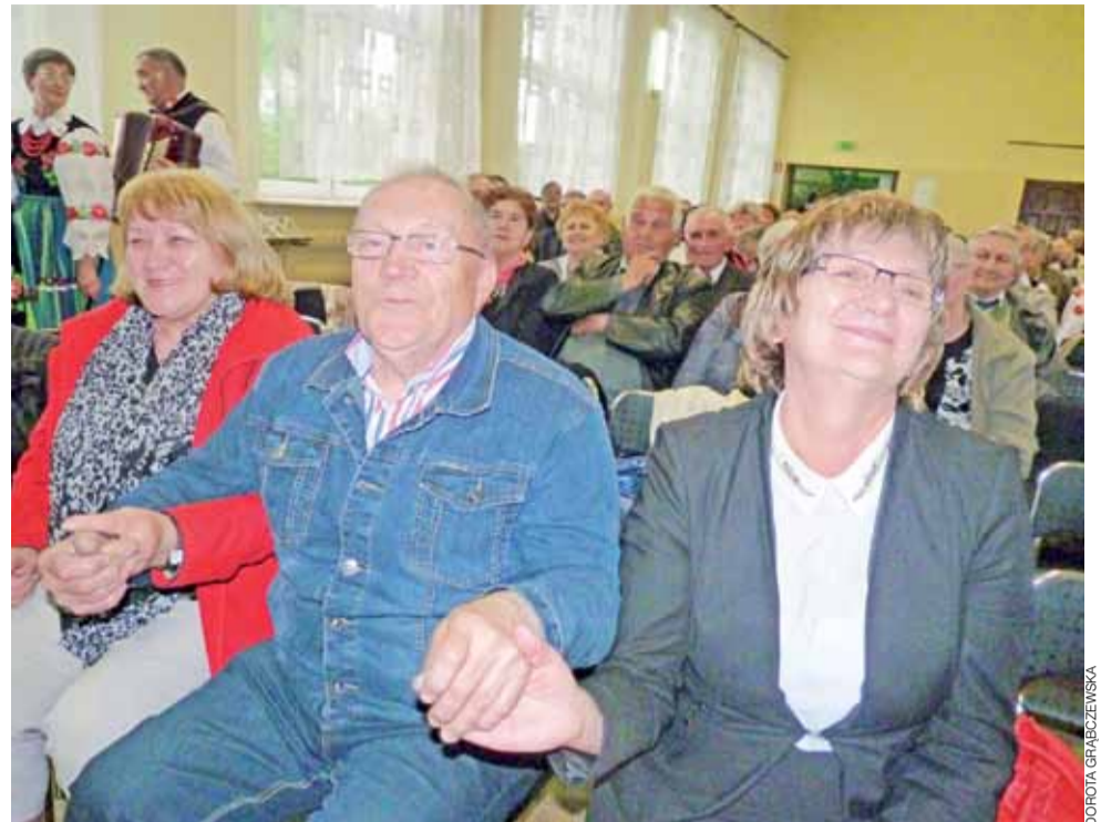
Biesiadne śpiewanie sprawiło, że ludzie chętnie śpiewali z wykonawcami i wspólnie się bawili.