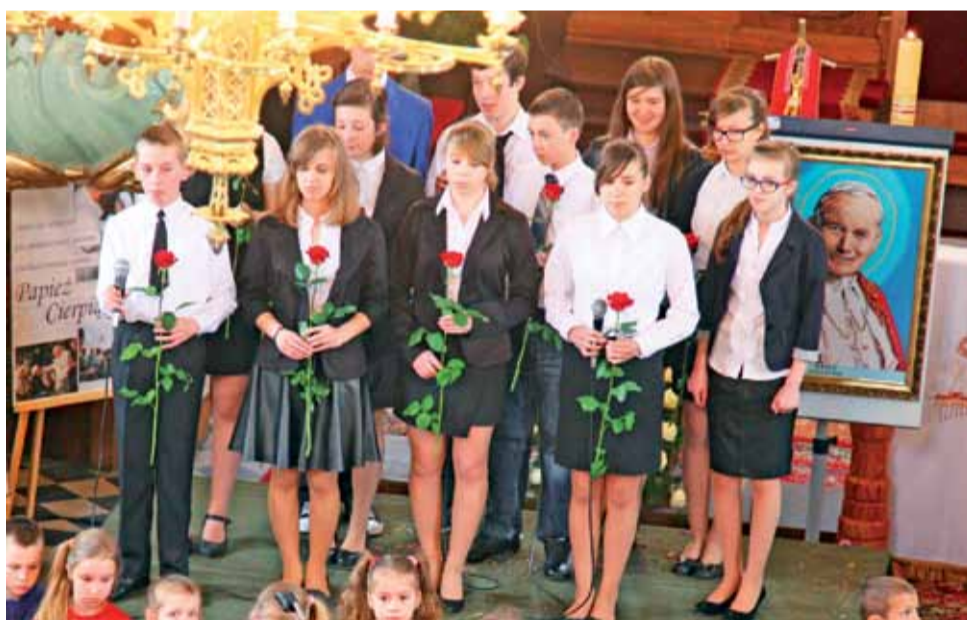
Spektakl zakończył się podziękowaniami Ojcu Świętemu i złożeniem czerwonych róż pod tablicą pamiątkową oraz odśpiewaniem pieśni „Kochamy Cię”.

Również 3 maja w Miejsko-Gminnej Bibliotece Publicznej będzie można oglądać wystawę czasową „Konstytucja 3 Maja 1791” str. 3