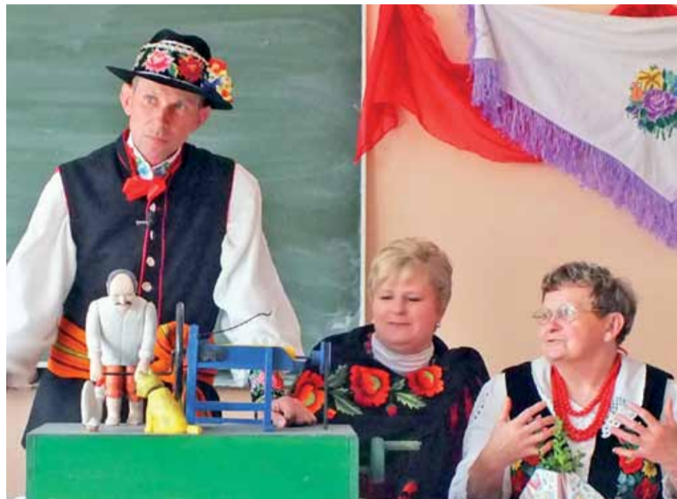
Na spotkaniu z gimnazjalistami twórcy ludowi opowiadali o tym, czym się zajmują i pokazywali cudeńka, których są autorami.

Młodzież zaprezentowała przybyłym gościom fragmenty „Zemsty” Aleksandra Fredry i „Balladyny” Juliusza Słowackiego. Wzięła również udział w konkursie wiedzy na temat działalności muzeum w Sromowie, zespołów ludowych „Boczek Chelmoński” i „Kocierzewiaczy” oraz tradycji, zwyczajów i obrzędów ludowych na terenie gminy Kocierzew. Pytania przygotowali uczniowie z klasy 2b. Ich lider-