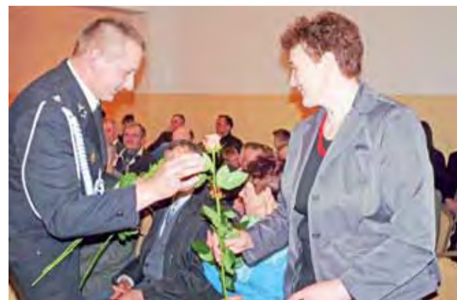
Druhowie doceniają pomoc pań z Koła Gospodyń Wiejskich. Wyrazem tego był symboliczny kwiatek, wręczony każdej z nich.