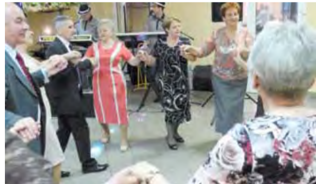
Jeden z wielu wspólnych tańców podczas gminnego dnia seniora.

– Takie przeżycia jak dzisiejszy koncert wpływają na moje samopoczucie lepiej niż dwa lata brania leków – mówił on w rozmowie z nami. – Mam wielkie słowa uznania dla artystki, która dla nas śpiewała, bo choć na co dzień nie słucham oper ani operetek, to mnie urzekła, a przy tym, choć jest bardzo młoda, potrafiła do nas dotrzeć, zachowywała się z wielką klasą. Do samego klubu się przywiązałem, bo jest tu świetna atmosfera, wszyscy są bardzo życzliwi, nikt się nie wynosi, nie wywyższa. tm