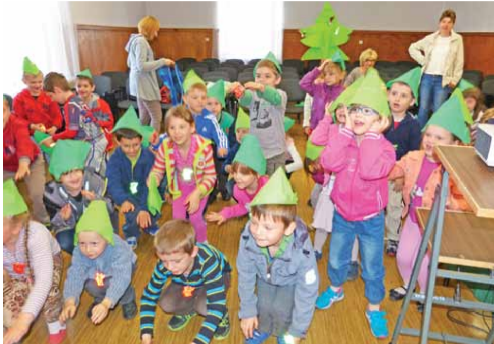
Dzieci w zielonych czapeczkach naśladowały drzewa w lesie, które wyginają się na wietrze.