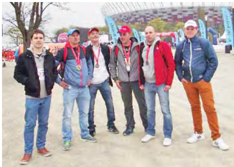
Grupa „nocnych biegaczy” z medalami po zakończonym maratonie warszawskim.