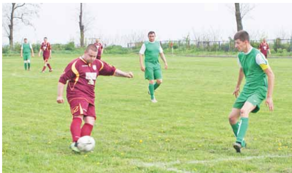
Niedzielnny mecz Olimpii Oporów z drużyną Kanarki Małachowice.