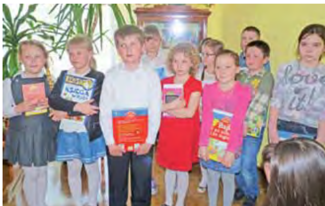
Laureaci i wyróżnieni w najmłodszej kategorii klas I-III w konkursie recytatorskim „Pięknie być człowiekiem”

Mimo to jury doceniło jej kunszt. Sympatyczna dziewczyna przyznaje, że zdecydowała się na udział w konkursie pomimo