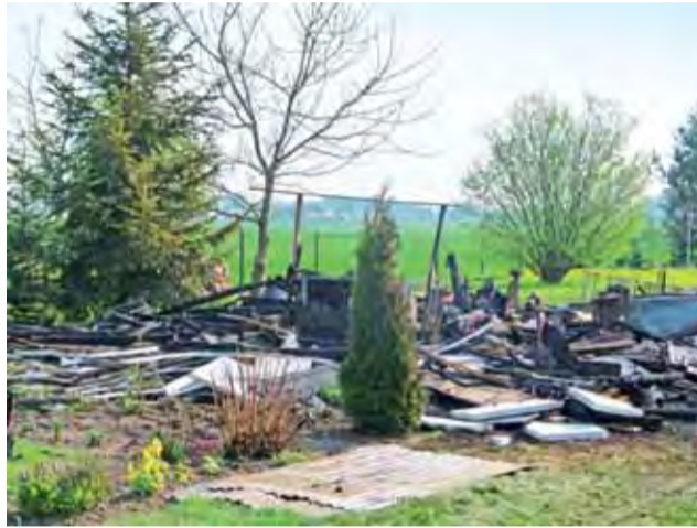
Pogorzeliško. Dom letniskowy w Waliszewie Dworskim spłonął doszczętnie.

Mieszkanka była bezwładna, na granicy całkowitej utraty przytomności, prawdopodobnie na skutek podtru-