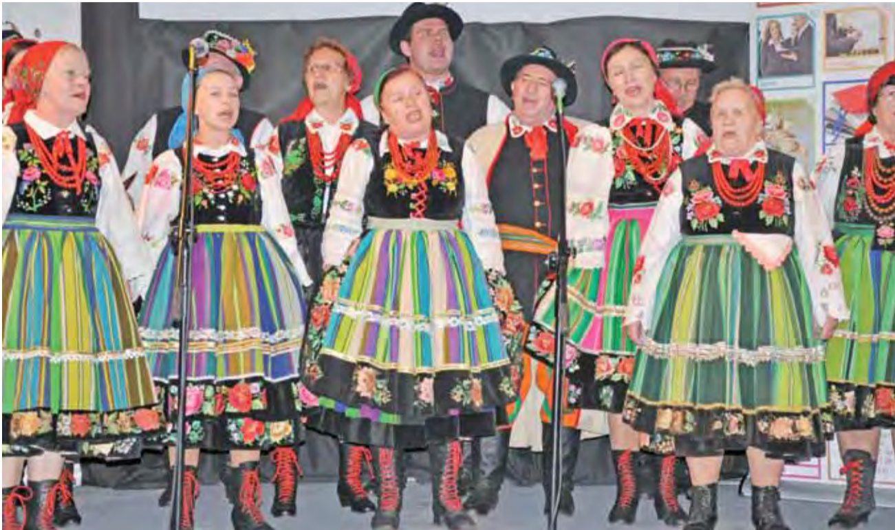
Zespół Ksinzoki w Wiosennej Rewii Talentów Mikrofon dla Seniora wystąpił w 20-osobowym składzie, zdobywając jedną z głównych nagród.