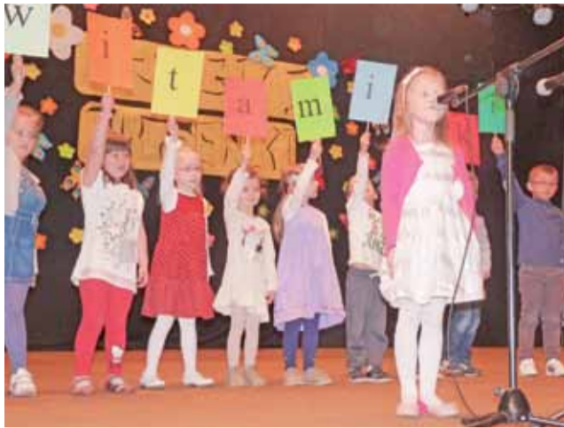
Przedшкоlaki z Przedszkola Samorządowego nr 2 w piosence „witaminki”.