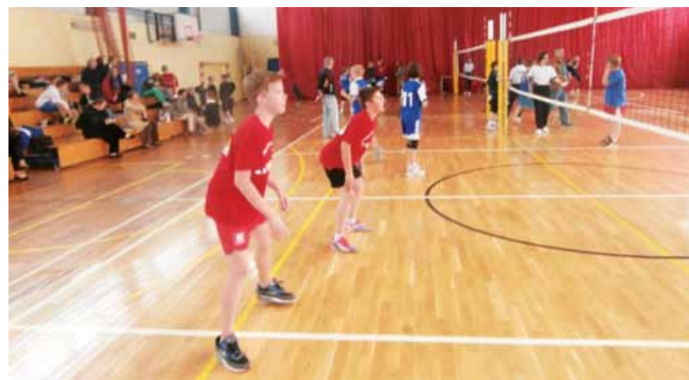
Reprezentanci SP Nr 2 Żychlin podczas Półfinału Wojewódzkiego Mini Siatkówki o Puchar Kinder + Sport.