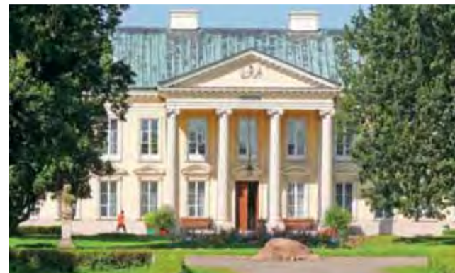
Pałac w Walewicach.