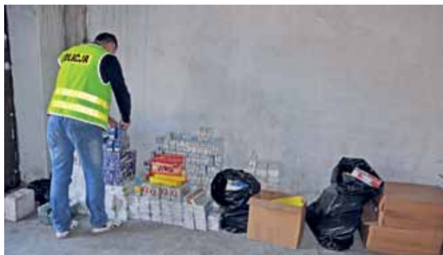
Policjanci zabezpieczają nielegalny towar.

Proceder trwał od 2010 roku. Szacuje się, że działalność pase-