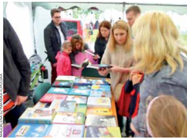
Podczas finału akcji „Z książką na walizkach” można było zakupić książki autorstwa zaproszonych pisarzy oraz uzyskać ich autografy.