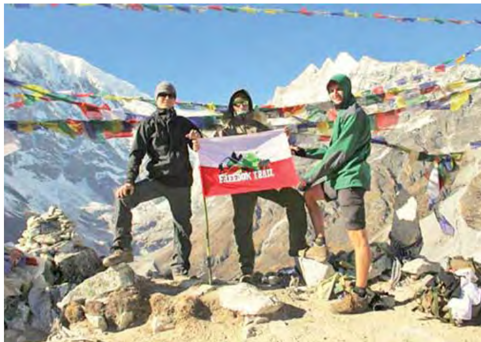
Ekipa na szczycie Ri peak (4700 m n.p.m.).