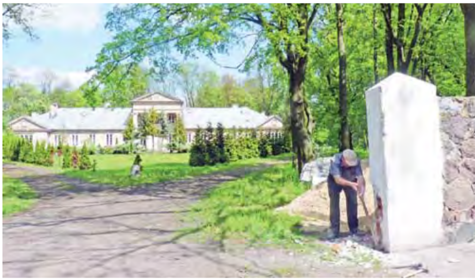
Nowy właściciel dworu w Śleszynie robi porządki. Wywieziono już część śmieci. Teraz naprawiany jest mocno zniszczony parkan z kamienia.

Tam też leży mnóstwo śmieci. Poza modernizacją samego dworu trzeba zrobić jego odwodnienie, gdyż w piwnicy jest woda.