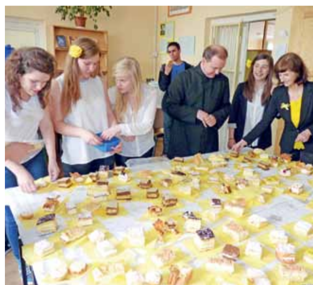
Podczas papieskiego przedpołudnia nie zabrakło w Gimnazjum nr 2 ciastek, które kojarzą się z Janem Pawłem II - kremówek.

Ostatnim etapem spotkania był konkurs muzyczny. Uczniowie ze wszystkich klas, przy