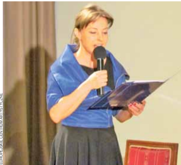
EUROPEJSKIE CENTRUM ARTYSTYCZNE