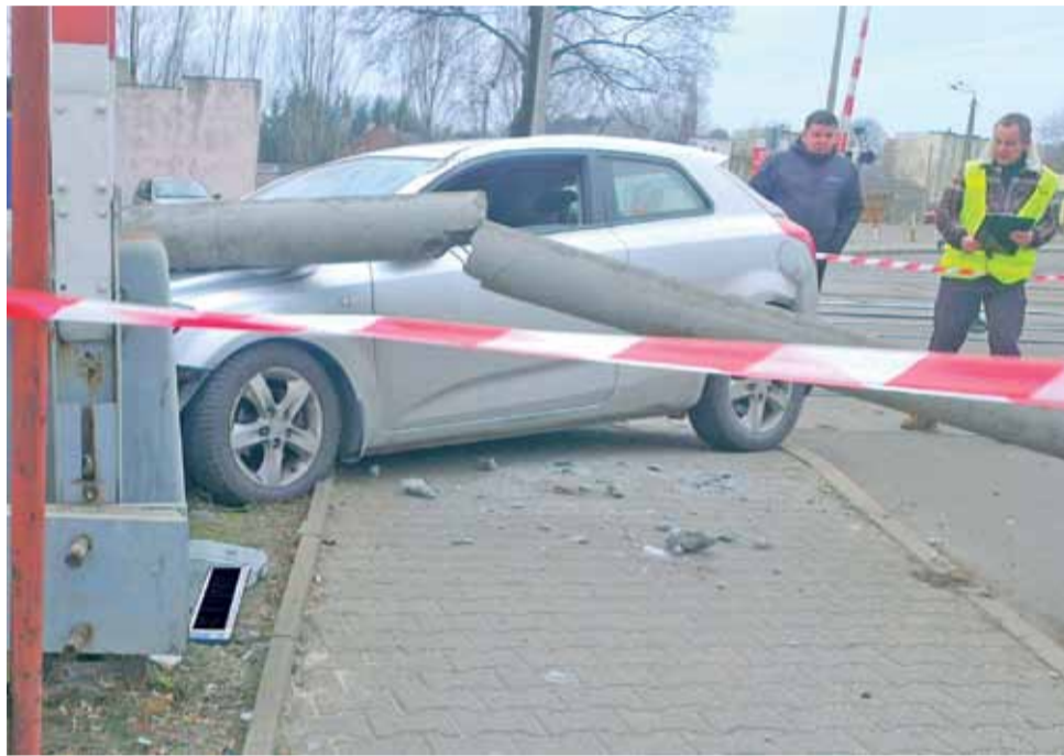
Wypadek na przejeździe kolejowym na 3 Maja w drugi dzień świąt Bożego Narodzenia – nietrzeźwy ksiądz potrafił 41-letnią kobietę i zламаł betonowy słup oświetlenia ulicznego.

Jeszcze przed ogłoszeniem wyroku sąd odczytał zeznania, jakie oskarżony składał podczas przesłuchania na policji i w prokuraturze. Dodajmy, że na pierwsze przesłuchanie na policji, które miało odbyć się dzień po spowodowaniu przez oskarżonego wypadku, ksiądz przyszedł pijany i został zatrzymany do wytrzeźwienia. Z odczytanych zeznań