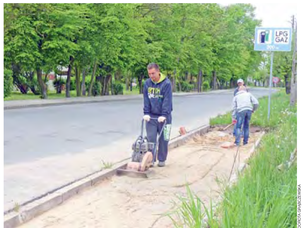
Pracownicy Mig-My robią kawałek chodnika wzdłuż ulicy Aleje Raclawickie. To pozwoli na namalowanie przejścia dla pieszych. Obecny, nieaktualny znak informujący o stacji paliw i LPG zostanie zastąpiony znakiem informującym o przejściu dla pieszych.

Z daleka było widać, że rowerzysta jest pod wpływem alkoholu, nie jechał bowiem całkiem prosto. Na widok patrolu policji wyraźnie zdenerwował się i próbował zejść z roweru, by dalej go poprowadzić. Okazało się, że w organizmie miał 1 promil alkoholu. mak