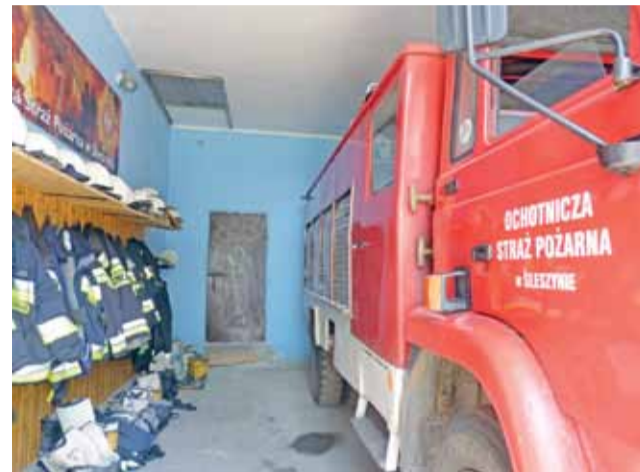
Strażacy z OSP w Śleszynie , którzy należą do Krajowego Systemu Ratowniczo-Gaśniczego, chcą kupić nowy wóz gaśniczy. Dotychczasowy Star ma 38 lat i jest awaryjny.

– Do połowy kwietnia trzeba było złożyć wnioski do Wojewódzkiego Funduszu Ochrony Środowiska i Gospodarki