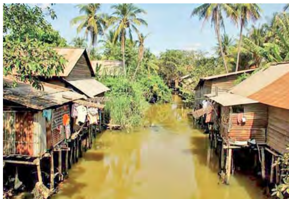
Kambodżańska wioska nad rzeką.

dy z dostępnych środków lokomocji – wynotowali, że przebyli ok. 20.000 km samolotami, po 6000 i 6000 autobusami, 2000 autostopem, 1500 motocyklami, a krótkie odcinki także na wielbłądach. Nocowali zwykle w hostelach i noclegowniach, choć mieli też przygotowane namioty. Jadali w najtańszych restauracjach i budkach, wyłącznie miejscowe dania.