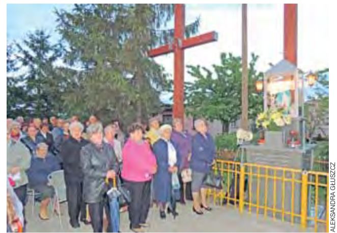
Wierni na mszy świętej, podczas której poświęcono dobrzelińskie krzyże w piątek 9 maja.

Jakby jednak nie patrzył, bez wydatkowania pieniędzy z kasy gminnej mieszkańcy gminy Oporów nadal będą jeździć po dziurach i błocie. dag