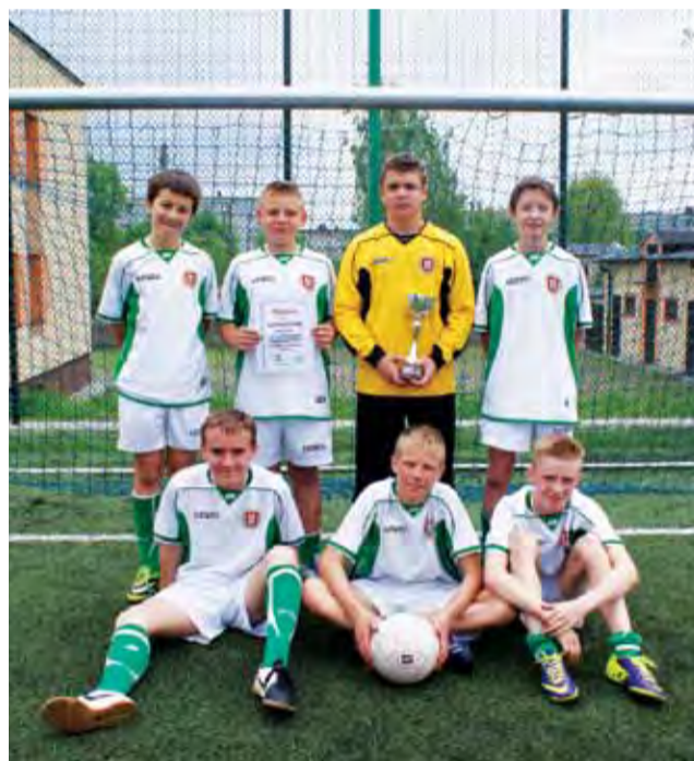
Drużyna chłopców Szkoły Podstawowej Nr 2 w Żychlinie, którzy awansowali do Finału Powiatowych Igrzysk Młodzieży Szkolnej.