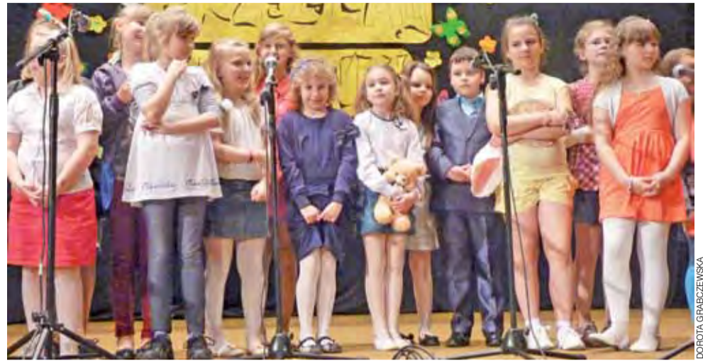
Uczestnicy „Przełądu piosenki” z klas I-III.