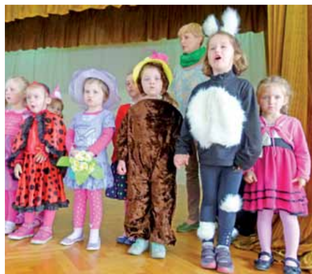
Dzieci z punktu przedszkolnego w Pleckiej Dąbrowie wystąpiły w konkursie, recytując wiersze m.in. Juliana Tuwima.

Bociany przyleciały już kilka tygodni temu. Tę parę sfotografowaliśmy w Pasiece. Zbudowały gniazdo na stupie energetycznej. Wśród wielu ludzi istnieje przekonanie, że obecność bociana na dachu budynku chroni od uderzenia pioruna (bocian w dawnej Germanii był ptakiem Tora – bóstwa, którego atrybutem były pioruny). Jednak ten przesąd nie zyskał potwierdzenia – w rzeczywistości przyczyną śmierci w gnieździe ok. 3% bocianich piskląt jest właśnie porażenie piorunem. ag