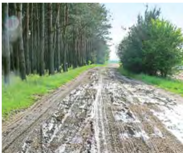
Tak wygląda droga do skansenu w Maurzycach po deszczu. Największy problem z przejeżdżaniem tędy mają autokary.

W trakcie społecznych konsultacji na temat przeznaczenia tego terenu, w roku 2012, większość tych mieszkańców, którzy wzięli w nich udział, była przeciwna budowie tam kościoła, ale większość ogólnej liczby osób mieszkających na Górkach w ogóle się nie wypowiedziała. ■