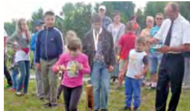
Jedną z konkurencji rozegranych w czasie Dnia Dziecka był bieg slalomem z jajkiem na łyżce.