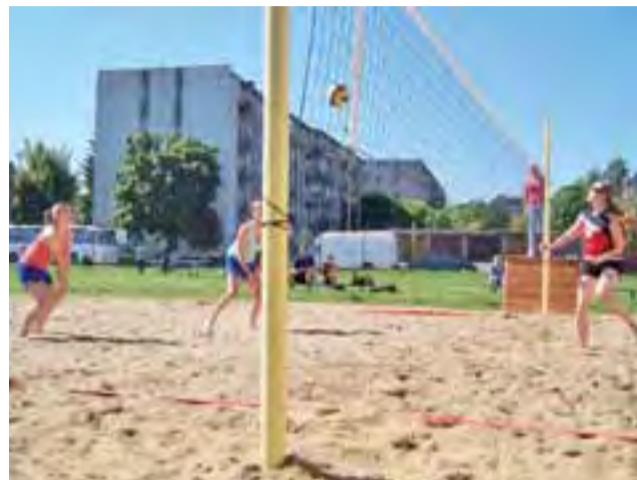
Mecz na Gimnazjalnych Mistrzostwach Powiatu w Siatkówce Piłkowej Dziewcząt - po prawej drużyna siatkarek Gimnazjum Żychlin II.

Sport szkolny | Gimnazjalne Mistrzostwa Powiatu w Siatkówce Piłkowej Dziewcząt i Chłopców