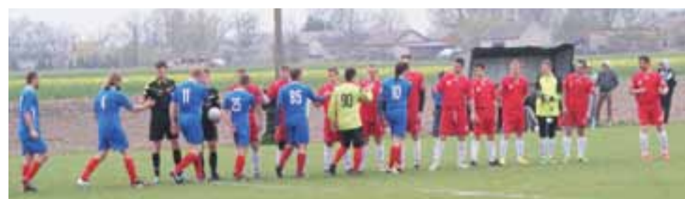
Drużyna piłkarzy Deltę Śleszyn przed rozpoczęciem spotkania.

Druga drużyna grająca w rozgrywkach łódzkiej klasy B grupy III - Olimpia Oporów prze-