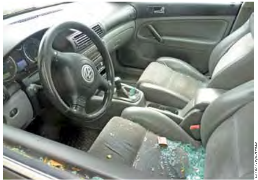
W samochodzie zabezpieczonym przez komornika wybito szybę.