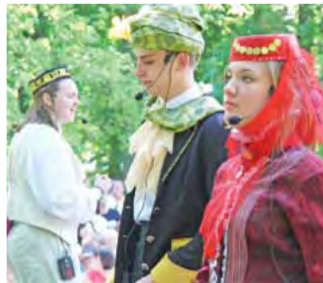
Przedstawienie teatralne odegrane zostało na starej murowanej scenie znajdującej się w cieniu drzew.

Bożena Modzelewska dodała w rozmowie z NŁ, że zajęcia na zamku nie dotyczyły wyłącznie tańca i teatru, uczniowie uczestniczyli też w zajęciach muzealnych jak i – co ciekawe – mechatroniki – budowali z klocków Lego rycerzy-roboty, które miały za zadanie stoczyć ze sobą walkę. ■