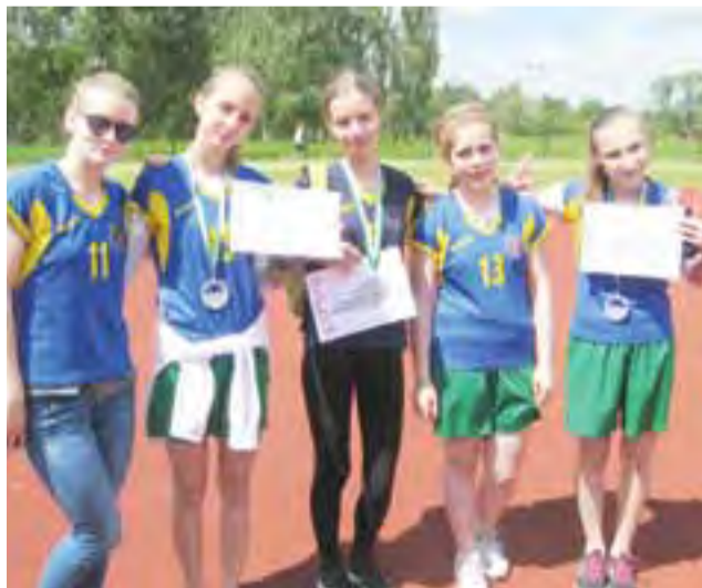
Zawodniczki ze szkół pijarskich po zawodach w Zgierzu.

W kategorii gimnazjalistek na dystansie 1000 m rywalizowało około 60 dziewcząt. Pijarskie Gimnazjum reprezen-