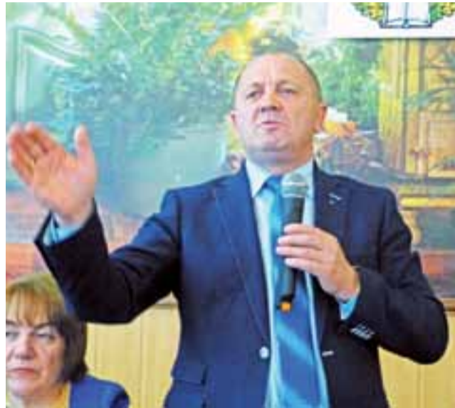
Minister Marek Sawicki na spotkaniu w Zespole Szkół CKR w Zduńskiej Dąbrowie.

23 maja Zespół Szkół Centrum Kształcenia Rolniczego w Zduńskiej Dąbrowie gościł ministra rolnictwa Marka Sawickiego, a także m.in. posłankę PSL Krystynę Ozgę, wicewojewodę łódzkiego Pawła Bejdę i starostę łowickiego Krzysztofa Figata. Na trwającym przeszło dwie godziny spotkaniu poruszano różne kwestie ważne dla polskiego rolnictwa.