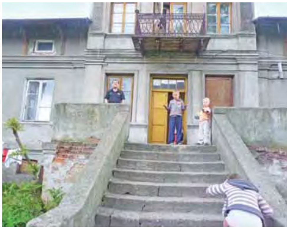
Dworek przy ulicy Narutowicza 61 będzie remontowany zgodnie z decyzją Powiatowego Nadzoru Budowlanego. Lokatorzy mają być wyprowadzeni.

Ale zakład odkładał remont w czasie, tłumacząc się, iż budynek jest tylko w zarządzie SZB. – Wykonanie decyzji przesuwano, zaślaniając się m.in. faktem, że kolejną decyzją