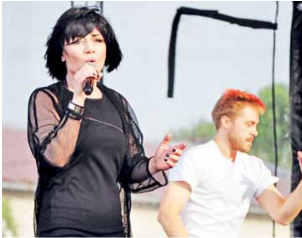
Była gwiazda disco-polo, Shazza, wystąpiła w Nowych Zdunach z dwoma tancerzami. Śpiewała głównie swoje stare, dobrze znane publiczności piosenki.

Publiczność bawiła się głównie przy jej starych piosenkach sprzed lat, np. „Jestem sobą”. Na koniec wystąpił Andrzej „Piasek” Piaseczny – także gwiazda sprzed lat, znany również z serialu Złotopolscy. Śpiewał piosenki z kilku różnych swoich albumów, np. „Chodź, przytul, przebac” i inne. Po występie chętnie rozdawał autografy, o które prosiły głównie dziewczęta. – Było super. Do tego jeszcze zdobyliśmy autogra-