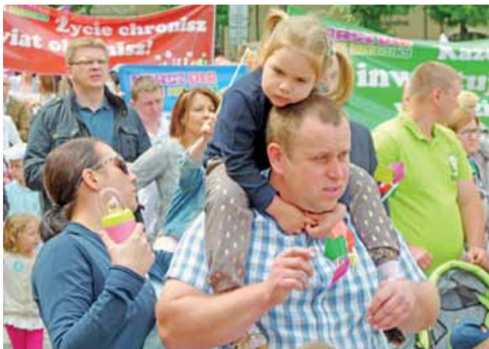
W marszu uczestniczyły całe rodziny. Zachętą do wspólnego maszerowania był późniejszy piknik na Błoniach.