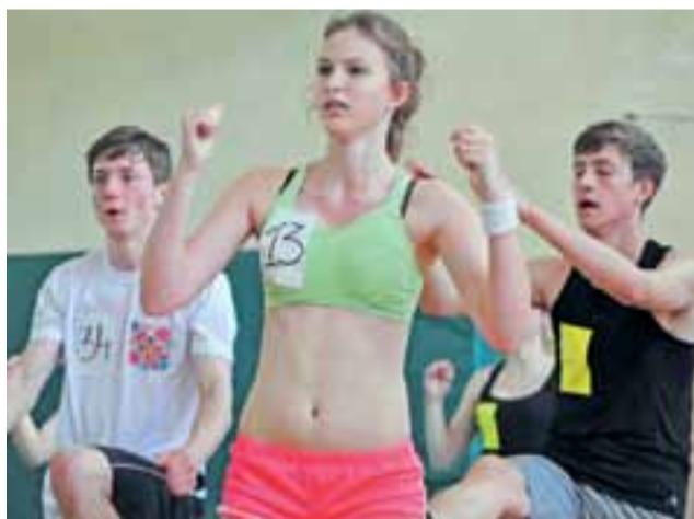
Trening był również wyczerpujący zarówno dla uczennicy, jak też uczniów.

– Widzę, że jesteście już rozgrzani. Ja też, więc przystąpimy od razu do treningu – zaczęła spotkanie mistrzyni fitness i już po kilkunastu minutach okazało się, że skończyły się żarty i każ-