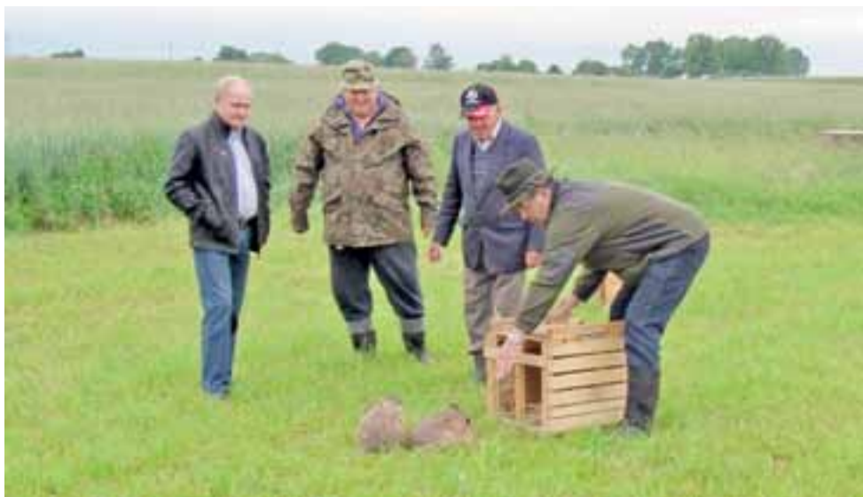
Myśliwi z Koła Łowieckiego „Jedność” z Łyszkowice wypuszczają na wolność zające szaraki. Liczą, że dzięki temu zabiegowi uda im się odbudować populację tego ssaka w swoim łowisku.

Gminy Nieborów i Łyszkowice | Koło Łowieckie „Jedność”