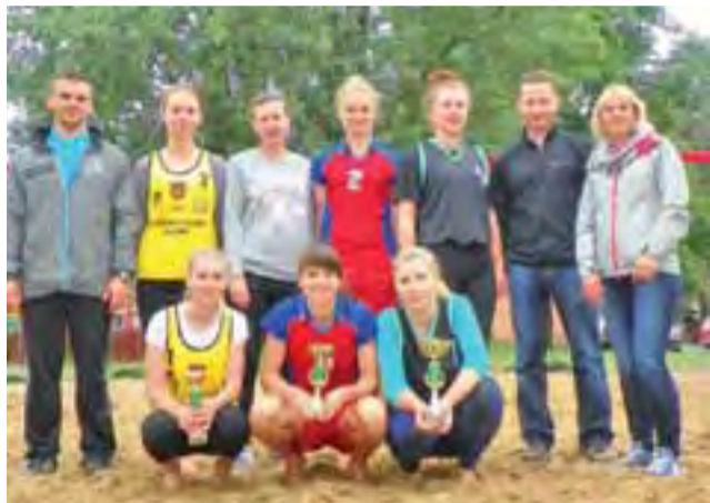
Najlepsze plażowiczki powiatu łowickiego.

W meczu o trzecie miejsce pamiątkowy puchar wywalczyły siatkarki z ZSP nr 3 Łowicz, które pokonały II LO Łowicz. Awans na zawody rejonowe wywalczyły dwie pierwsze pary: ZSP nr 4 Łowicz i ZSP nr 2 Łowicz. zł