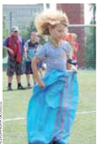
Tak to wyglądało w ubiegłym roku. Na zdjęciu wyścigi w workach.