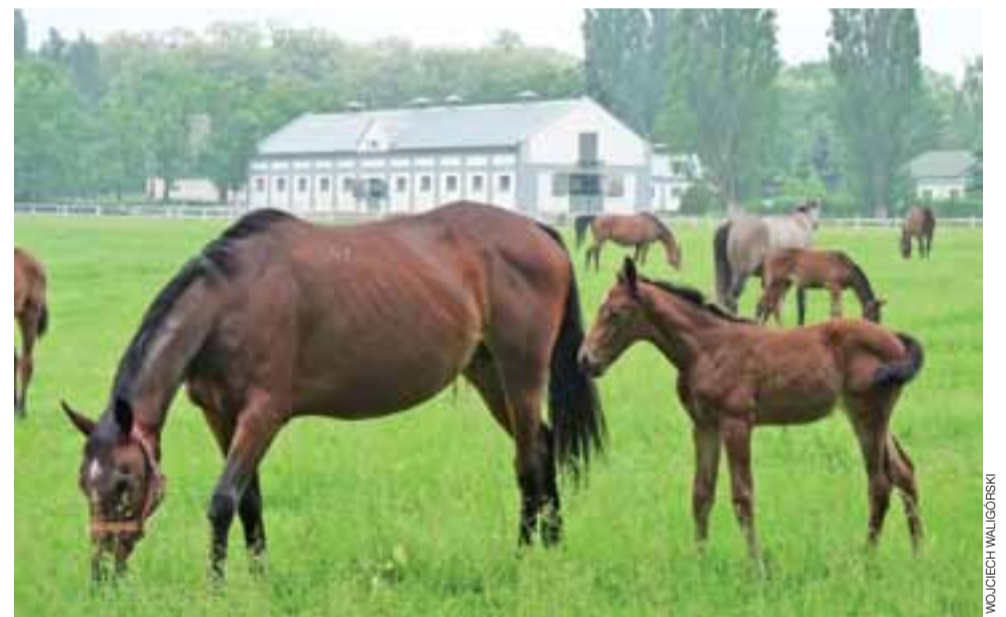
Wiele młodych żrebaków, towarzyszących starszemu pokoleniu, można zaobserwować na pastwisku przy stajniach w Walewicach. Wzbudzają zawsze duże zainteresowanie turystów, szczególnie dzieci. wal