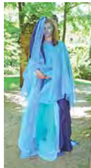
Gimnazjaliści z Dzierżówka gości w Arkadii zaskoczyli strojami. Na zdjęciach od lewej: jeden z aktorów występujących z przedstawieniem „Pan Jowialski” oraz uczennice jako żywioty ziemi i wody.

w czasie szkolnych zajęć i przy udziale rodziców.