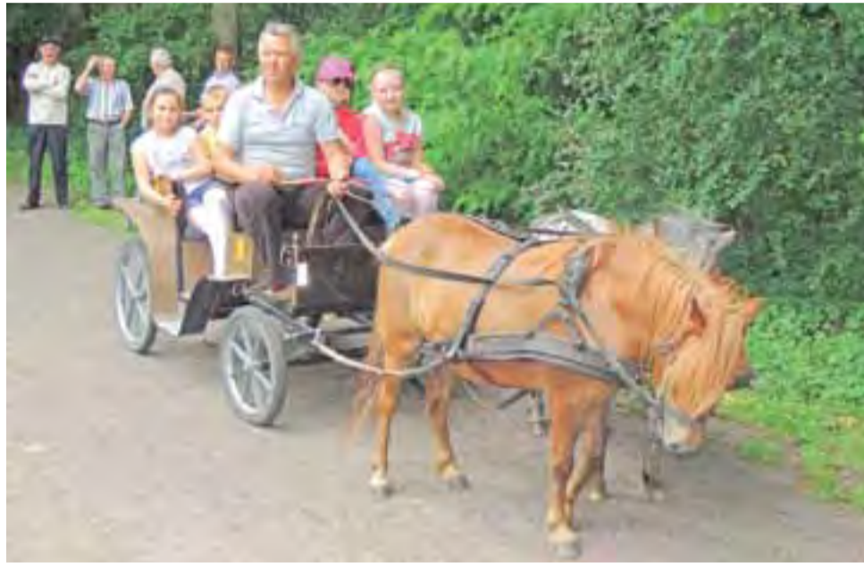
Prawie jak na rzymskim rydwanie – dzień dziecka w Oporowie.

śły sposób, zbroja była wykonana z tzw. folii bąbelkowej, a hełmy z butelek 5-litrowych po wodzie mineralnej. Po zakończeniu występów, dorosła publiczność, jak i dzieci, mogli wystartować w licznych konkursach, przejechać się miniwozem ciągniętym przez kucyki czy wziąć udział w konkursach przygotowanych przez harcerzy. Zarówno najmłodszym, jak i starszym podobaly się rowery wodne na stawach obok zamku. Pogoda dopisała, choć było dość wietrzne i niejedni ze śmiałków musieli walczyć na wodzie z wiatrem, ale chętnych nie brakowało. Podczas imprezy nie mogło zabraknąć wozu strażackiego i strażaków z OSP Skórzewa. Zebrani mogli kupić w stoiskach gastronomicznych wiele przysmaków, takich jak na gorąca kielbasa lub gofry. Przy stołach zbierały się całe ro-