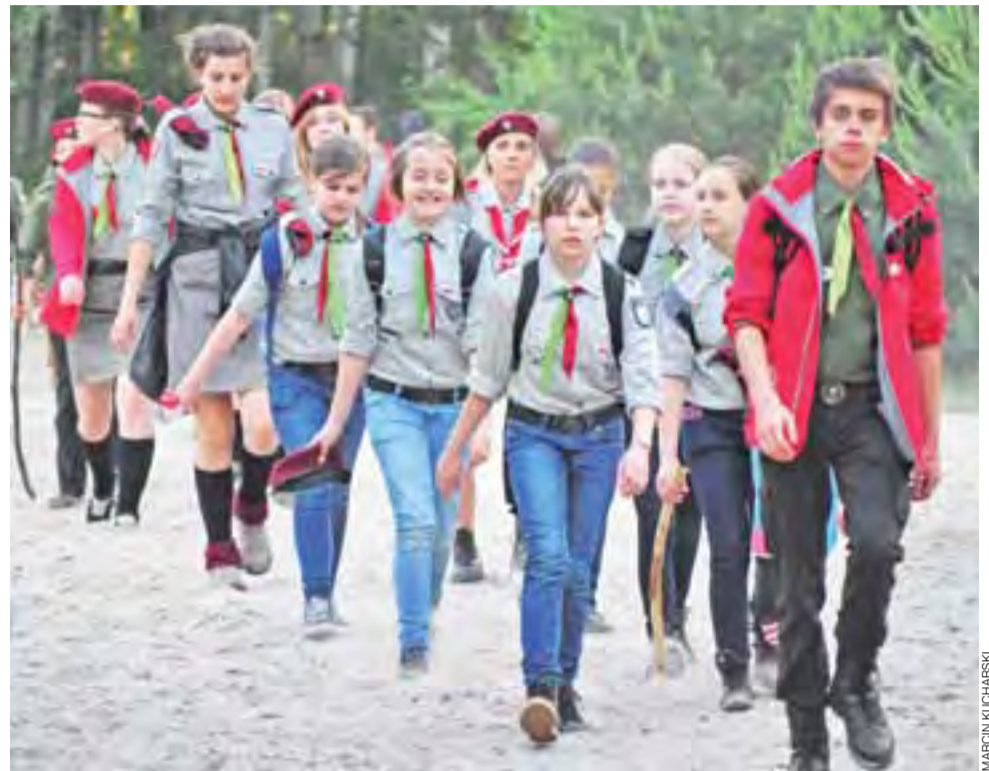
Harcerze z 3 Łowickiej Drużyny Wielopoziomowej Impessa również weszli w skład szczepu Pełnia.

Jedynym minusem imprezy był fakt, że wielu rodziców przywoziło na nią swoje pociechy autami, które zaparkowały na ul. Magazynowej i Basztowej tak, że momentami inne auta nie miały szans, aby tymi ulicami przejechać. Tłoczno i mało bezpiecznie było też na samej ulicy Klickiego, zwłaszcza przy skrzyżowaniu z wymienionymi ulicami. Doszło nawet do niegroźnej stłuczki. ■