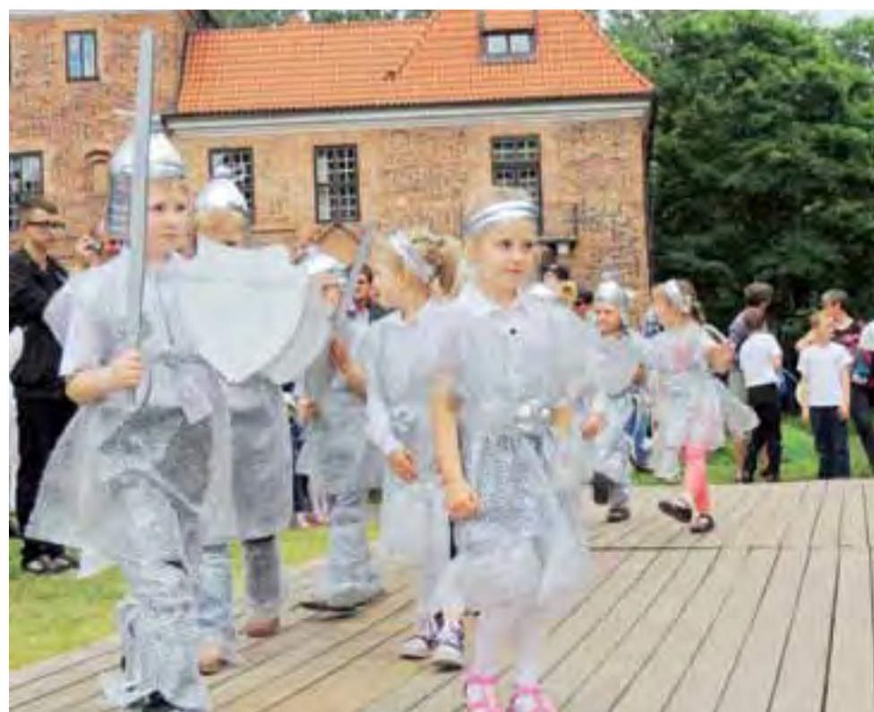
Rycerze z oddziału przedszkolnego Zespołu Szkół im. Jana Pawła II w Oporowie podczas Dnia Dziecka przy oporowskim zamku. Więcej o Dniach Dziecka w Żychlinie i Oporowie na str. 3.