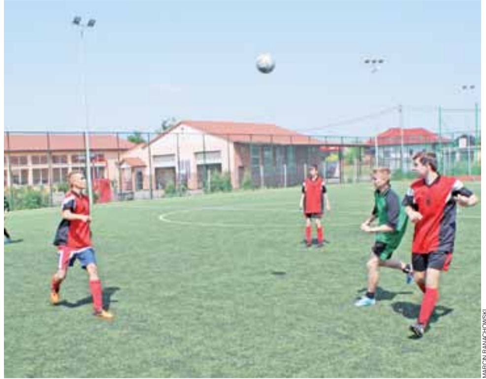
Drużyna chłopców Gimnazjum Żychlin w meczu o pierwsze miejsce z drużyną Gimnazjum Krzyżanów, zakończony remisowym wynikiem 0:0.

Sport szkolny | Półfinał Powiatowy Piłki Nożnej Chłopców i Dziewcząt