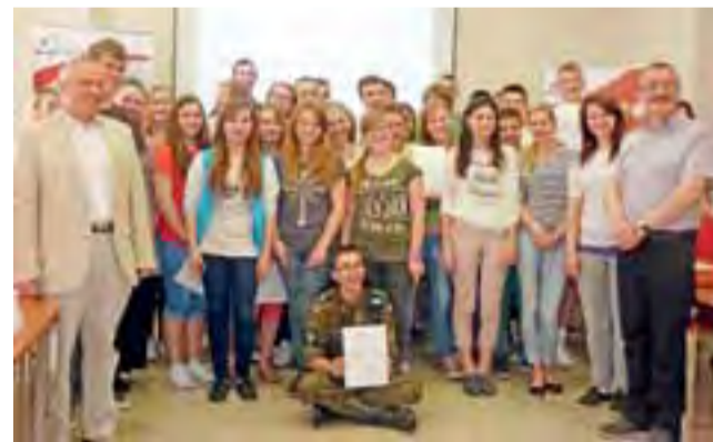
Uczestnicy projektu po zakończeniu wręczania certyfikatów.