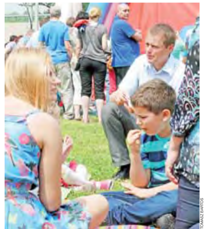
Dzień Rodziny szybko przeistoczył się majówkę. Całe rodziny rozsiadały się na kocach, aby słuchać muzyki i próbować swojskiego jadła i słodkich wypieków.

Oprócz tego, festyn to jeden z elementów integracji środowiska rodziców wokół przedszkola,