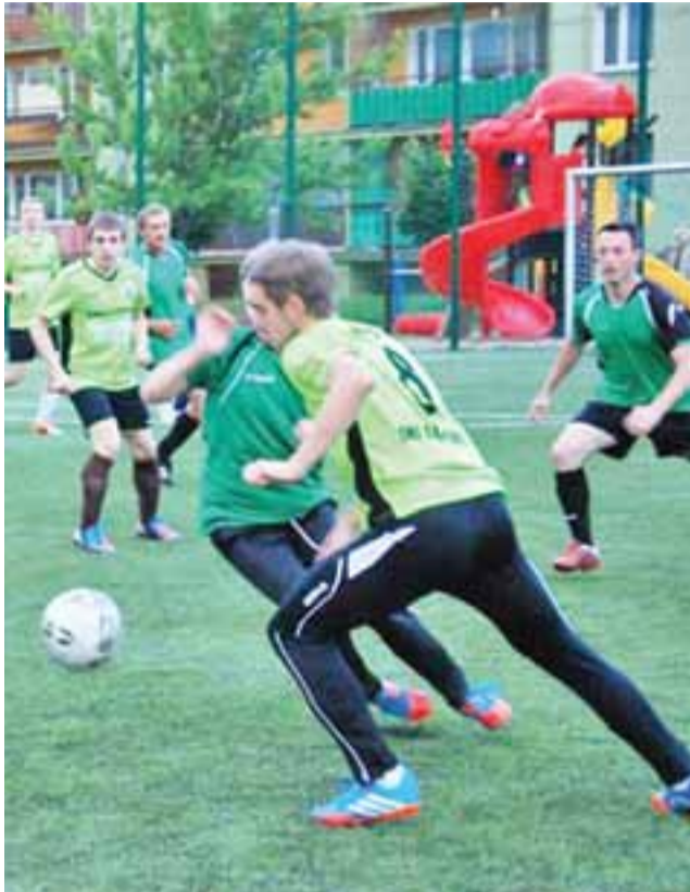
SMS Dąbkowice zaledwie zremisował ze Startem i stracił drugie miejsce w tabeli.

■ Eko-Plast Łowicz - Novum Łowicz 5:3 (2:1); br.: Bartłomiej Tkacz 3 (8', 14', 26'), Rafał Trakul 25', Bartłomiej Skoneczny 27' - Jan Pawlata 2 (20', 28'), Maciej Marciniak 12'