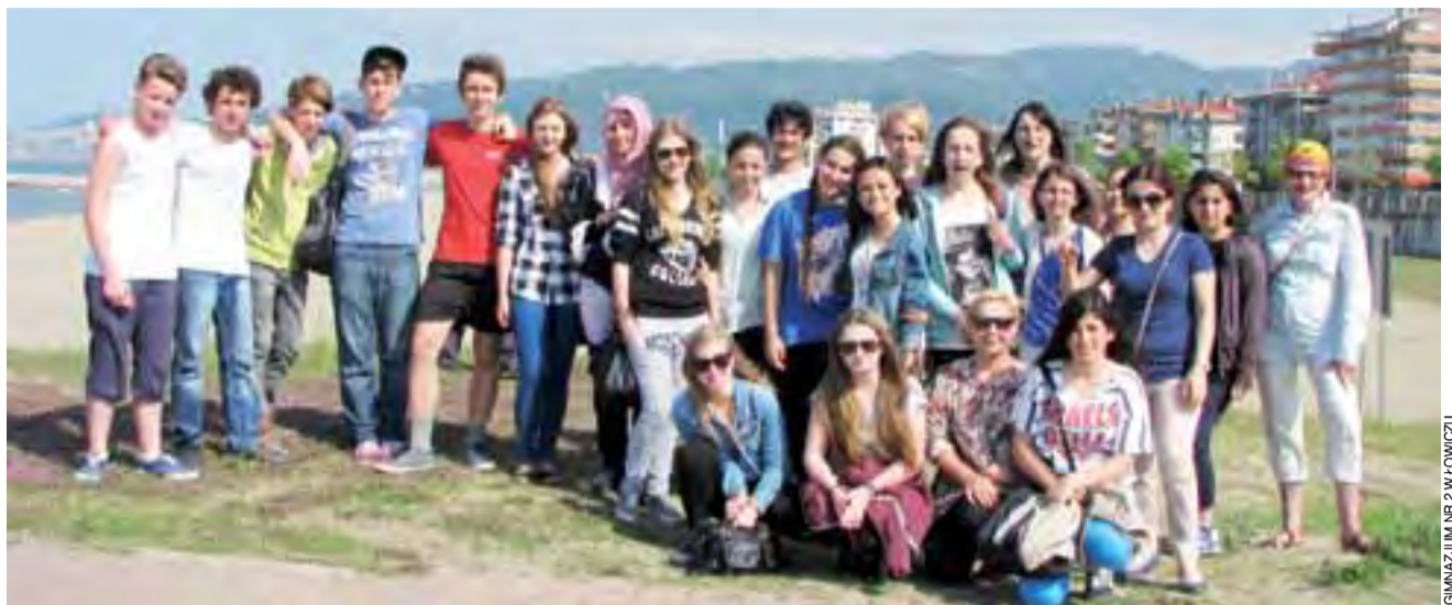
Grupa łowickich uczniów wraz z tureckimi kolegami na plaży.

Grupa z Polski wyróżniła się tym, że przygotowała dwa ro-