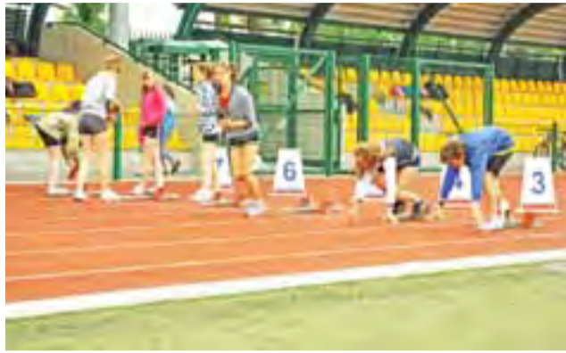
Ostatnie przygotowania przed startem.