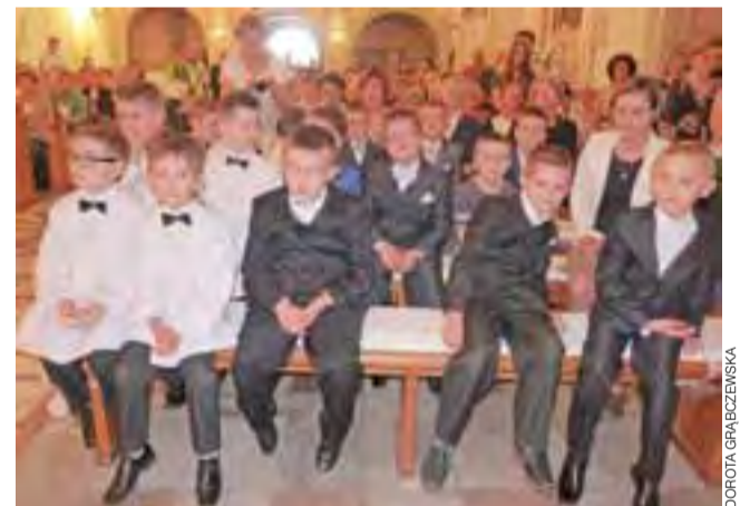
42 dzieci z SP 2 w Żychlinie przystąpiło 18 maja do I komunii świętej. Przez cały tydzień, od 19 do 23 maja, uczestniczyły w białym tygodniu. Z okazji tej uroczystości, imiona dzieci, które przystępowały do komunii, zostały wypisane na kartkach i zawieszono na specjalnych drzewkach, będących dekoracją kościoła. dag