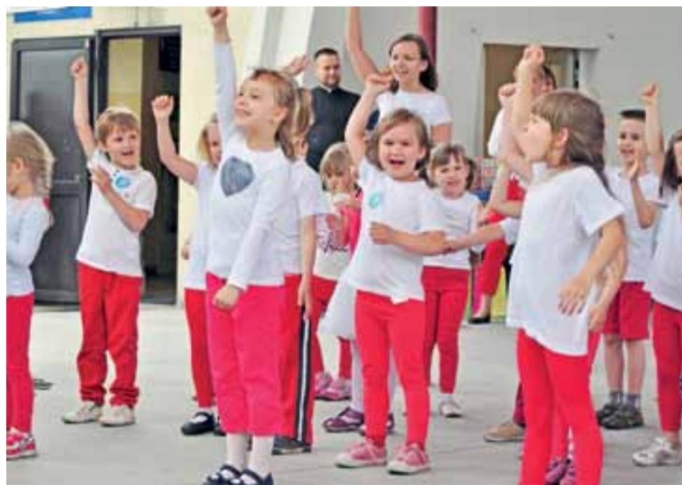
W bloku rozrywkowym jako pierwsze wystąpiły dzieci z Przedszkola Diecezjalnego.

Łowicz | Frekwencyjny sukces organizatorów