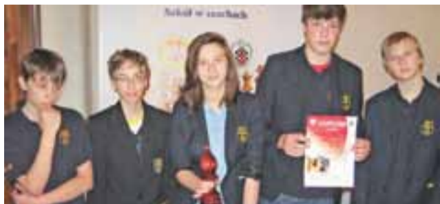
Reprezentacja szachistów z pijarskiego gimnazjum.

W krajowym turnieju uczestniczyło 27 najlepszych drużyn gimnazjalnych w kraju, wyłonionych z rozgrywek w poszczególnych województwach. Zawody przeprowadzono systemem „11 rund”. Drużyna Pijarskiego Gimnazjum w Szklarskiej Porębie odniosła 3 zwycięstwa, doznała 4 porażek i zanotowała 4 remisy. W trakcie turnieju łowicza-