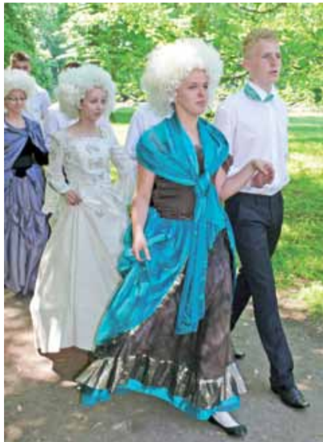
Uczniowie zaprosili do poloneza wszystkich gości festiwalu, ale tylko oni mieli fantastyczne stroje z epoki.

Po nim inna grupa gimnazjalistów zatańczyła polkę, której podstawy uczniowie poznawali także w czasie zajęć na warszawskim zamku. Zarówno aktorzy, jak i tancerze, wystąpili w strojach inspirowanych XVIII i XIX wiekiem, które powstały