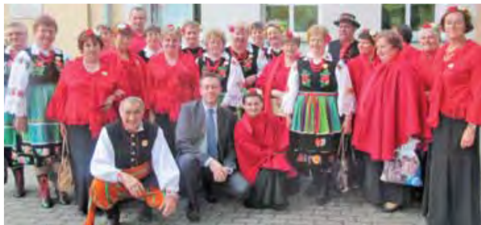
Zespoły Śpiewacze z gminy Bedlno na V Przeglądzie Ruchu Artystycznego Seniora w Łęczycy.