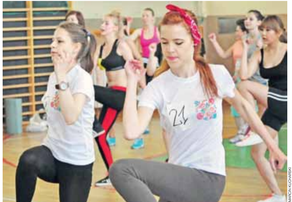
Dziewczęta wzięły udział w maratonie w okolicznościowych podkoszulkach przygotowanych specjalnie na tę okazję.

Łowicz | Zdrowy styl życia wg uczniów | LO