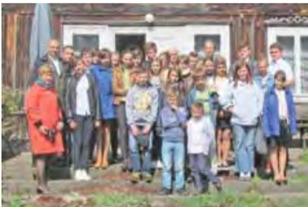
Grupa uczniów z Łaguszewa odwiedziła dom patrona swej szkoły w Kuklówce, gdzie spędził on ostatnie lata swego życia.