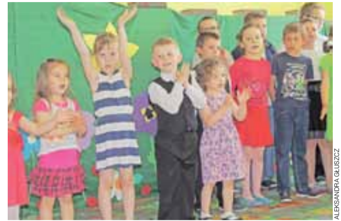
Mali aktorzy tuż po przedstawieniu.

Radni nie mieli żadnych zastrzeżeń do wójta i do wydatkowania środków. Jednogłośnie udzielili mu absolutorium. dag