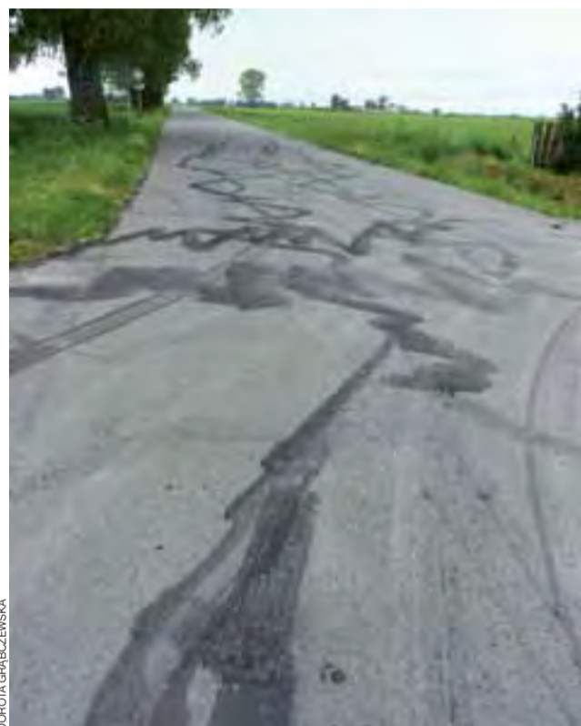
Na niedawno zrobionej asfaltowej drodze z Janowa do Florianowa młody mieszkaniec z okolic urządził sobie rajdowy pokaz. Teraz będzie musiał drogę naprawić na własny koszt.