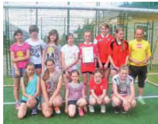
Zespół z Bielaw potwierdził swoje umiejętności w rejonie.