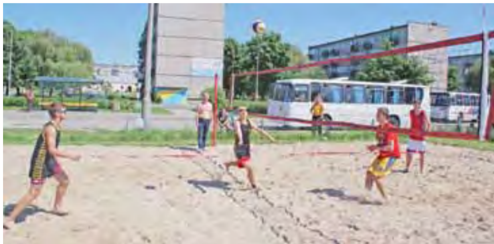
Siatkarze podczas Gimnazjalnych Mistrzostw Powiatu w Siatkówce Piłkowej Chłopców - drużyna Gimnazjum Żychlin kontra Gimnazjum Nr 1 Kutno.