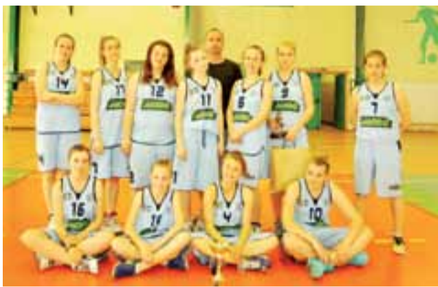
Kadetki UMKS Książek Łowicz z pucharem z I miejsce.

Spora emocji było również w spotkaniu, które mogło zdecydować o pierwszym miejscu z ŁKS-em Łódź. Książki zaczęły ten mecz bardzo dobrze, prowa-