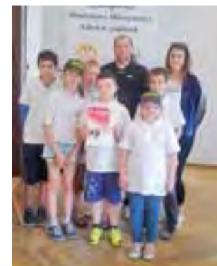
Drużyna SP Nieborów zajęła 7. miejsce w Finale.

– Gdyby przed zawodami ktoś powiedział mi, że zajmiemy 7. miejsce to brałbym ten rezultat w ciemno. Okazało się jednak, że w trakcie turnieju moja ekipa