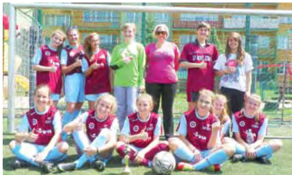
Zawodniczki z Gimnazjum w Nowych Zdunach z kolejnym tytułem mistrzowskim.

Sport Szkolny | Miejska Gimnazjada w piłce nożnej dziewcząt