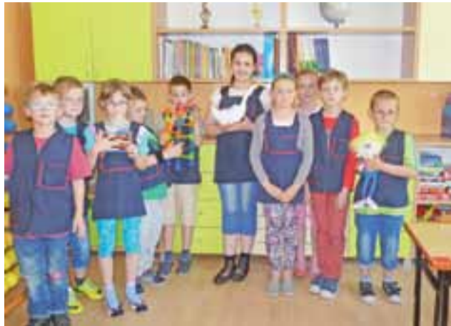
Dzięki środkom z funduszu sołeckiego Jaroszkówka, w SP w Szewcach Nadolnych, w klasie, gdzie teraz uczy się dziesięcioro dzieci z klasy II, zakupiono nowe kolorowe meble.

Sołectwo Szewce Owsiane przekazało 7,4 tys. zł. Za te pieniądze zakupiono bramki na nowe boisko oraz stoliki i krzesła do klasy języka angielskiego.