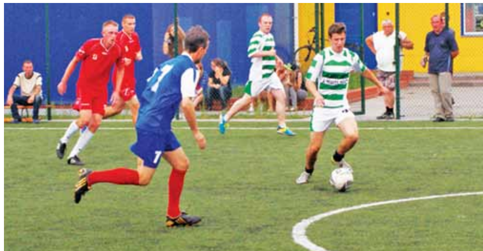
W najciekawszym spotkaniu drugiej kolejki ŻOLPN Gladiatory pokonali Deltę Skład 3:2.