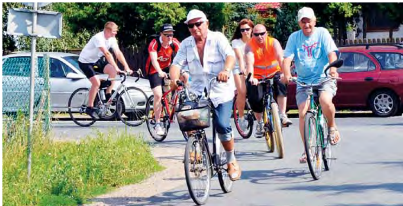
Uczestnicy Rajdu Rowerowego Krośniewice – Leszczynek.

Osoby biorące udział w rajdzie mogli obejrzeć m.in. inscenizację historyczną Wrzesień 1939, średniowieczny konny turniej rycerski oraz pokazy dynamiczne sprzętu wojskowego. mr