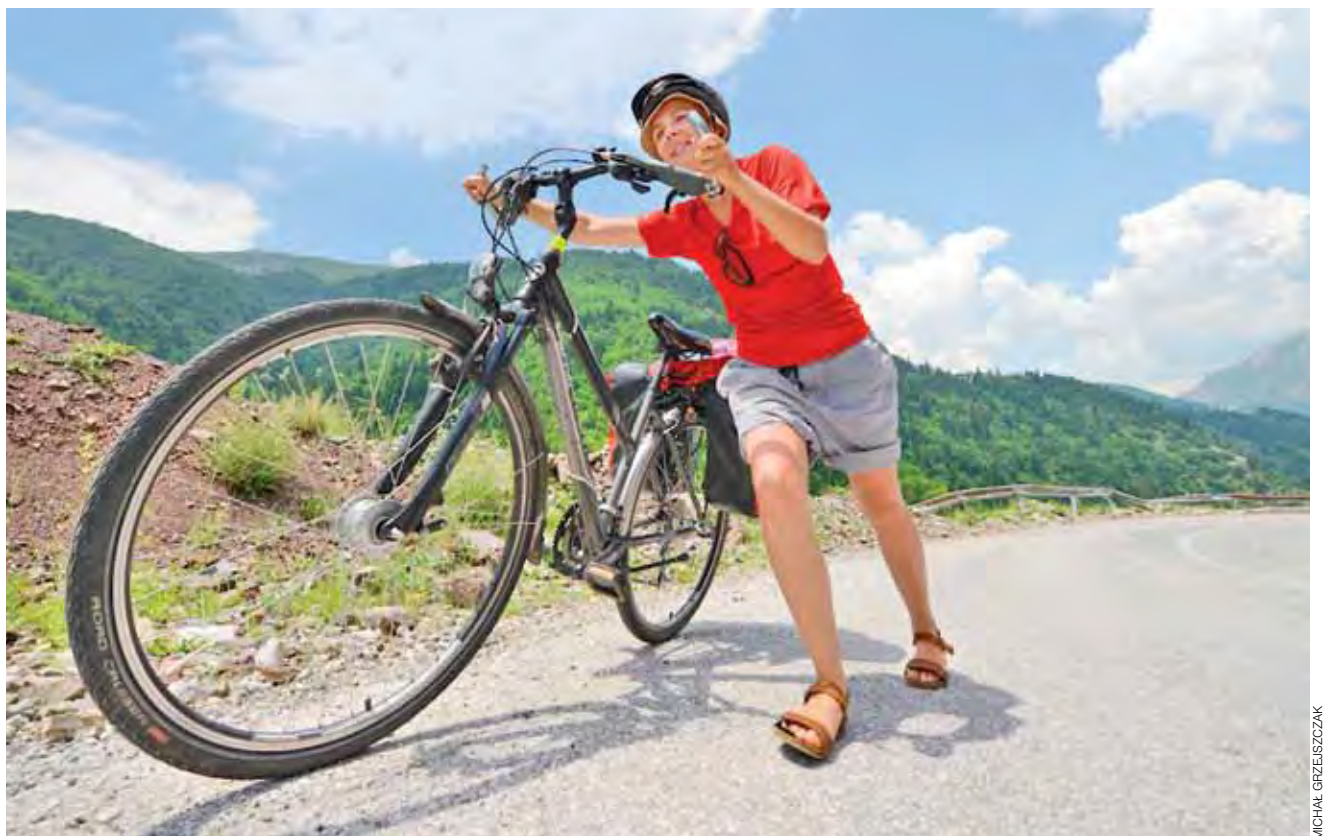
Oprócz doskonałych plaż, Grecja w swojej ofercie ma także i góry. Aby dotrzeć na niektóre z przełęczy, trzeba wycierpieć swoje.

dziennie. Autokary, jeden za drugim, wspinają się krętymi, wąskimi asfaltami na położone wysoko tarasy widokowe. Pejzaż stamtąd jest rzeczywiście imponujący, a wejścia do środka, mimo panującego tam ogromnego tłoku, trudno sobie odmówić. Grecja oferuje wiele. Choć dla większości z nas to jedynie wyspy i turkusowa woda, to jednak przemierzając kontynentalną jej