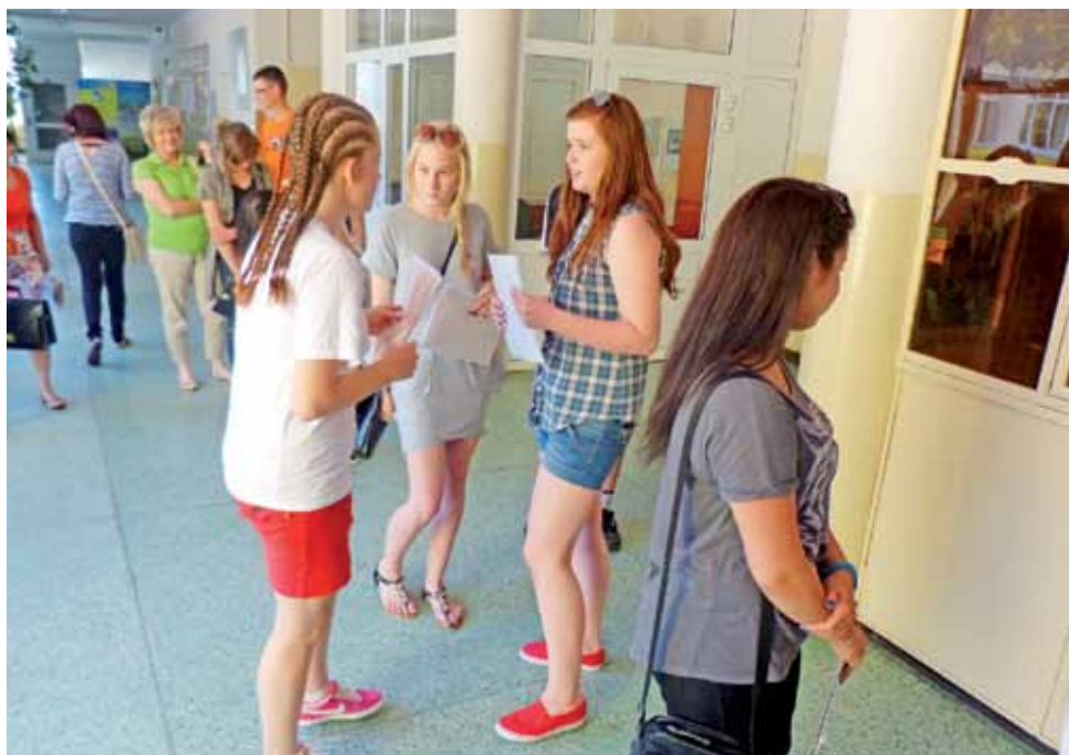
Kolejka chętnych do zostania uczniami II LO w Łowiczu.

Z kolei do techników przyciąga uczniów konkretny zawód – niektórzy są gotowi dojeżdżać nawet spoza granic powiatu (np. z Głowna), ponieważ nie mają tam możliwości kształcenia się w wymarzonej dziedzinie. Trzeba jednak zaznaczyć, że konkurencja dla łowickich techników nie śpi. O ile np. Technikum Fryzjerskie (otwarte w ZSP nr 3 w ubiegłym roku) jest jedyną taką szkołą w okolicy, tak np. Technikum Mechatroniczne w ZSP nr 1 mo-