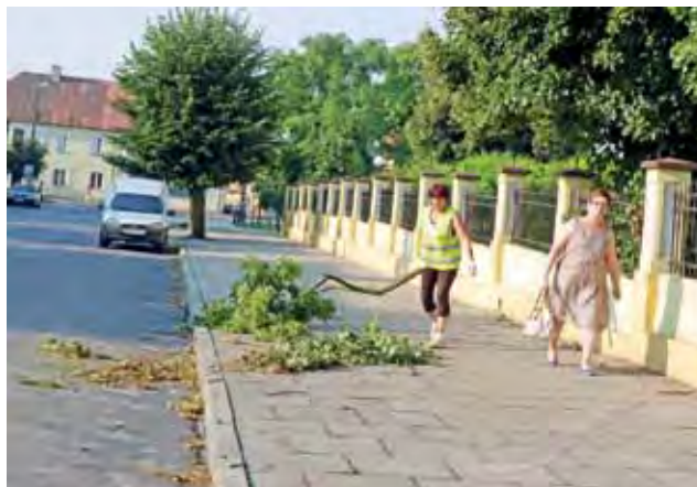
W poniedziałek od rana na ul. Jana Pawła II w Żychlinie pracownicy z robót publicznych sprząтали pourywane przez wichurę gałęzie z drzew.

O godz. 15.18 strażacy z SP Żychlin zostali wysłani do usunięcia konaru wiszącego niebez-