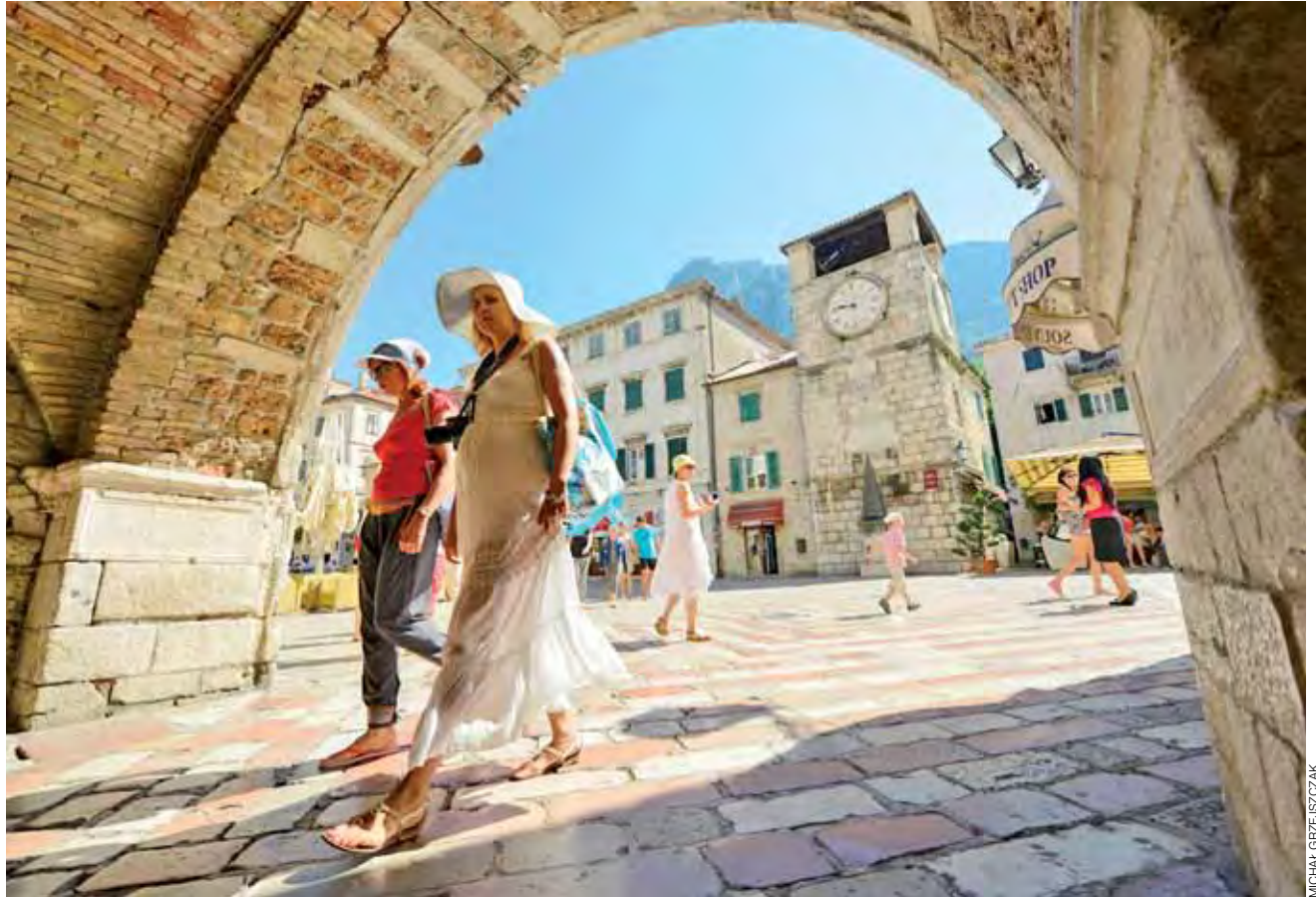
Wpisana na listę UNESCO starówkę Kotoru w sezonie zwiedzać warto już od świtu. Około południa tłum pozbawia już ulice swojej niesamowitości.

Do Bośni trafiamy w ciężkim dla regionu czasie. Tegoroczne lato zapamięta się tam na długo i bynajmniej nie przez upały. Bośnię dotknęły bowiem największe od dziesiątków lat opady, co spowodowało dotkliwie powodzie i kolosalne straty. Poziom Bosny podniósł się o kilka metrów pulsuując wszystko dookoła. Krajobraz popowodziowy był dla nas przerażający. Bloki mieszkalne oddalone od rzeki o setki metrów pozalane do wysokości pierwszego piętra, spustoszone sklepy, restauracje i warsztaty pracy, tony niesionych przez rzekę śmieci i konarów, zrównane z ziemią gospodarcze budynki i wiejskie cmentarze. Takiego obrazu w na-