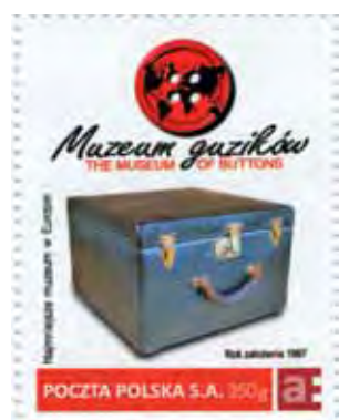
Znaczek Poczty Polskiej z XIX-wieczną walizką kupiecką.

A skoro mowa o guzikach znanych osób, to kolekcja łowickiego muzeum stale się rozszerza. Wkrótce pojawi się w niej guzik