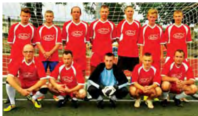
Ekipa Firmy Bracia Urbanek zdobyła łatwe punkty bez gry w pierwszym meczu.