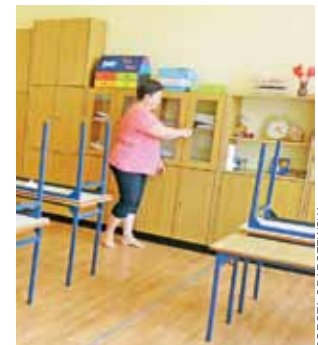
Dzięki pomocy rodziców, w jednej z klas w SP w Pniewie wymieniono podłogę, zakładając nowe gumoleum PCV, pomalowano ściany.

Wkrótce w szkole zacznie się jednak przygotowywanie pomieszczeń dla oddziału przedszkolnego. Konieczny będzie remont sanitariatów, polegający na dostosowaniu umywalk i WC do maluchów. Zamawiane jest wy-