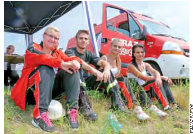
Wśród widzów zawodów znaleźli się zawodnicy i zawodniczki, którzy obserwowali poczynania rywali.