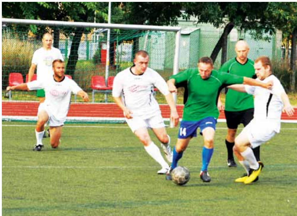
Strażacy w pierwszym meczu pokonali Partnersa 4:0.

W pierwszej kolejce udało się rozegrać tylko jeden mecz, w którym Strażacy zdecydowanie pokonali Partners 4:0 i pokazali, że w tym roku ma aspiracje nawet majstra. W ubiegłym roku PSP nie startowała w rozgrywkach, Partners zajął miejsce na 3. stopniu podium, zatem teraz