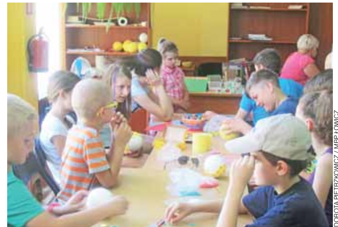
Wakacyjne zajęcia w bibliotece cieszą się sporym zainteresowaniem.

W czwartki prowadzone są zajęcia „Ćwiczenia z myślenia”,