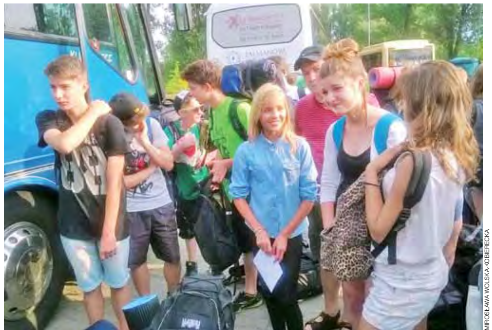
Ostatnie chwile przed wyruszeniem na poszukiwanie letniej przygody.

Około 120 zuchów, harcerzy i wędrowników z łowickiego hufca Związku Harcerstwa Polskiego wyjechało w niedzielny poranek, 20 lipca, na obóz harcerski do Załęcza Wielkiego. Harcerze będą wypoczywać w ośrodku na terenie Załęczańskiego Parku Krajobrazowego, na prawym brzegu rzeki Warty, w powiecie wieluńskim. Jeszcze przed wyjazdem, na parking za ratuszem drużynowi poprowadzili pierwsze zabawy integracyjne. Po dojechaniu na miejsce wędrownicy i harcerze starsi upiększali obozowisko budując bramę i zerbę – rodzaj ogrodzenia z gałęzi wokół obozowiska. mak