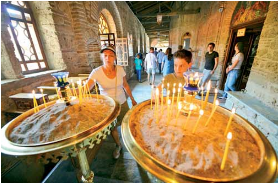
Klasztor Meteora przyciąga swoją magiczną aurą tysiące turystów dziennie. Dla wielu z nich, miejsce to stanowi cel pielgrzymek.