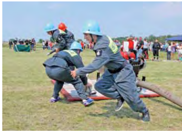
Młodzieżowe Drużyny Pożarnicze, zwłaszcza chłopcy, dowiedli, mimo, że bojętkę wykonywali na „sucho”, iż są wśród nich przyszli strażacy.

Przygotowano dla nich: 12 medali złotych, 10 srebrnych, 9 brązowych, poza tym 5 odznak wzorowego strażaka, ponad 100 odznaczeń za wysługę lat, przyznawanych przez Gminny Zarząd OSP w Kocierzewie Południowym i 22 odznaki dla członków młodzieżowych drużyn pożarniczych. mst