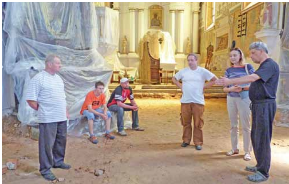
Co zrobić z kryptami? Zamurować i zostawić zmarłych w świętym spokoju. W kościele w Sobocie właśnie zapada decyzja o tym, że wnętrza grobowców nie będą badane.

Proboszczowi parafii św. Piotra i Pawła decyzja o nieodkryciu krypt wydaje się na rękę o tyle, że żadne badania archeologiczne nie zahamują prowadzonych prac, których harmonogram jest bardzo ważny ze względu na to, że zadanie dofinansowane jest w 85% dotacją z Łowickiej