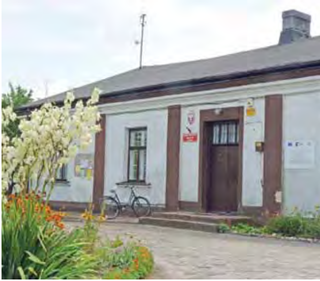
Dach na bibliotece w Oporowie pokryto nową papą, wkrótce ma być poprawiana elewacja budynku.