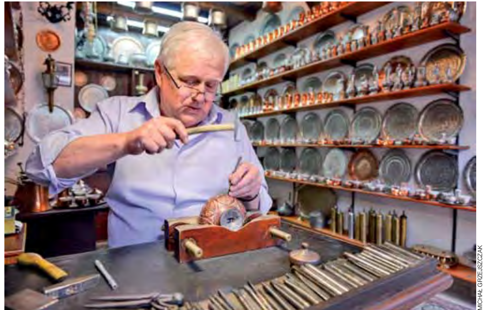
Sarajewskie manufaktury przykuwają uwagę każdego turysty odwiedzającego arabską dzielnicę.

Podróże | Michał Grzejszczak pisze po powrocie z długiej podróży rowerowej: „przekręcili” z Korfu do Łowicza 2720 kilometrów