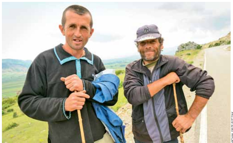
Dla albańskich pasterzy napotkanych w drodze do Macedonii okazaliśmy się niemałą atrakcją. Oni dla nas także.

Choć pogoda bardziej przypomina tę jesienną, schładzając nas na zmianę 14-stopniowymi temperaturami i znacznymi opadami, to jednak bardzo nam to nie przeszkadza. Wiemy już, że nasz plan coraz bliższy jest realizacji. Mijając największe jezioro Węgier mamy już w zasadzie z górki. W przenośni i w rzeczywistości. Delikatnie zmarszczki i napotkane podjazdy łykamy z sentymentem, wspominając pozostawione za plecami greckie odcinki specjalne.