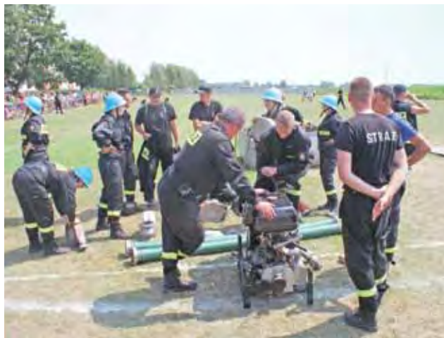
Zastęp strażaków z Pniewa przygotowujący się do ćwiczeń bojowych.

Zawsze odnosimy wrażenie, że jednostka OSP Pniewo, która wygrywa zawody gminne i reprezentuje potem gminę, jest faworyzowana przez sędziów.