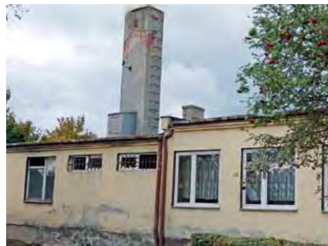
Stan budynków MOS w Kiernozi od lat jest zły.

Projekt budowy MOS w Kiernozi pochodzi sprzed kilku lat. Pozwolenie na budowę ośrodka wydane zostało 15 lipca 2011, jed-