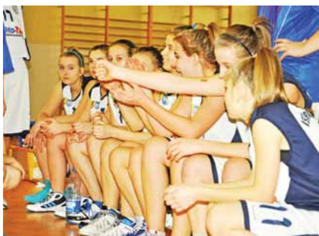
Kadetki spisały się w tym sezonie pozytywnie.