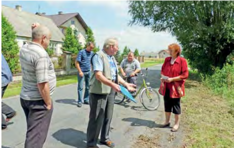
Mieszkańcy sołectwa Podgajew nie kryli zdnenerwowania arogancją zakładu energetycznego, który nie przycina gałęzi wrastających w linię energetyczne.

– Od 2 lat syn walczy z Energią Operator w Płocku, by podciąć konary drzew, które wrosły w linię energetyczną w Szymonówce i Podgajewie – opowiada kobieta. Bezskutecznie. Wprawdzie 3 września 2012 roku zakład odpisał, że przytnie konary,