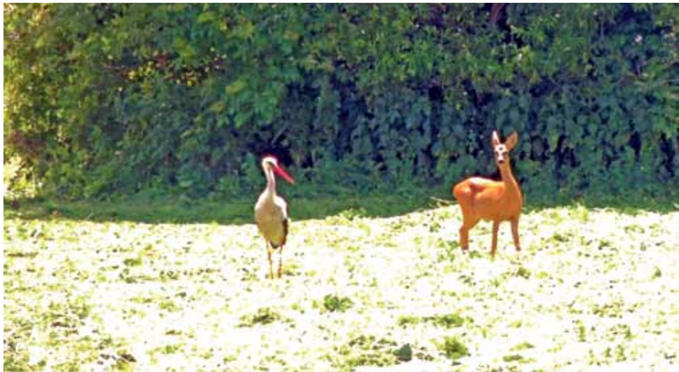
Tuż za Żychlinem, przy drodze w stronę Luszyń, na jednej z łąk bocian i sarna wspólnie się posilali. Na szczęście każde z nich gustuje w innych potrawach, więc sąsiedzi sobie nie przeszkadzali. ag