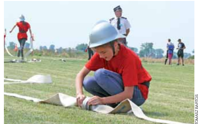
W młodzieżówce, w każdej z drużyn żeńskich, były strażaczki dziewczynki, które w długich czerwonych podkoszulkach wyglądały jak w sukienkach. Dawały sobie jednak całkiem niezłą radę, zarówno w sztafecie, jak i bojętce.

W rywalizacji Młodzieżowych Drużyn Pożarniczych