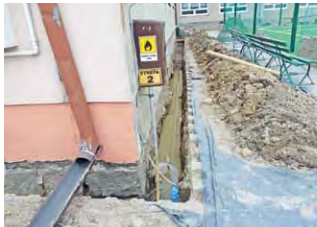
Po odkopaniu fundamentów, wokół murów pojawiła się woda.

W ramach inwestycji, ściany szkoły zostaną docieplone styropianem grubości 12 cm, wraz z warstwą elewacji tynku silikonowego typu kamyczek, docie-