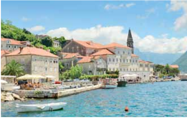
Czarnogórskie wybrzeże jest dla Polaków bardzo atrakcyjne. Oprócz doskonałej pogody oferuje również niebanalne krajobrazy i względnie niskie ceny.

ządzanej na naszych oczach, na opalanych węglem grillach. Przez albańską gościnność czy bośniackie smaki trudno nam jest niekiedy zmotywować się do dalszej jazdy.