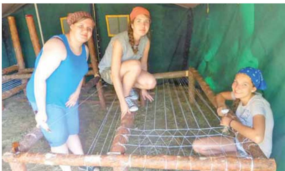
Co to by był za obóz, gdyby nie było „pionierki”, czyli praktycznego przygotowania do radzenia sobie samodzielnie w lesie. Na zdjęciu harcerki przygotowują własnoręcznie pryce.