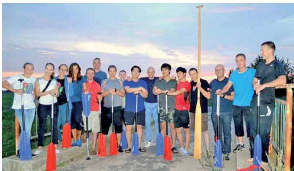
Członkowie i sympatycy Łowickiej Akademii Sportu oraz goście z Korei Południowej (w środku) po wspólnym pływaniu smoczą łodzią po Bzurze.