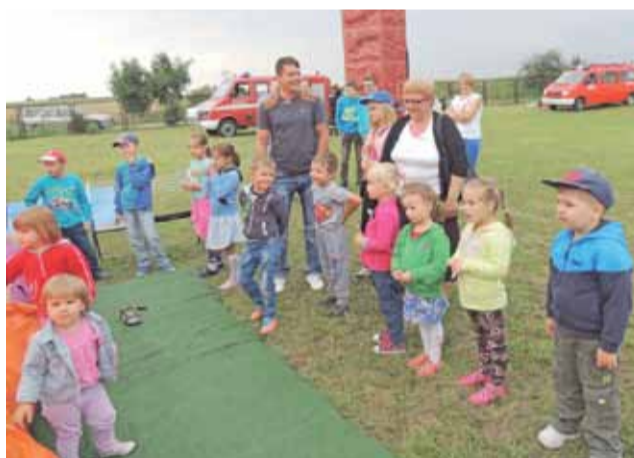
Najmłodszy w oczekiwaniu na swoją kolej, by móc zjechać na dmuchanej zjeżdżalni.