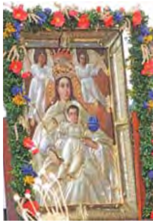
Obraz Matki Boskiej Suserskiej tuż po koronacji.