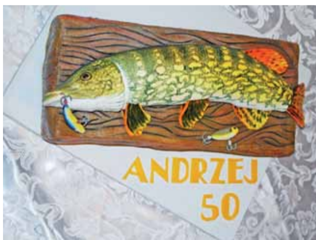
Tort dla miłośnika wędkarstwa robi wrażenie. Szczupak w każdym szczególe wygląda jak prawdziwa ryba.

Tajemnica sukcesu tkwi w umieszczanych na tortach ozdobach oraz niezwykłych