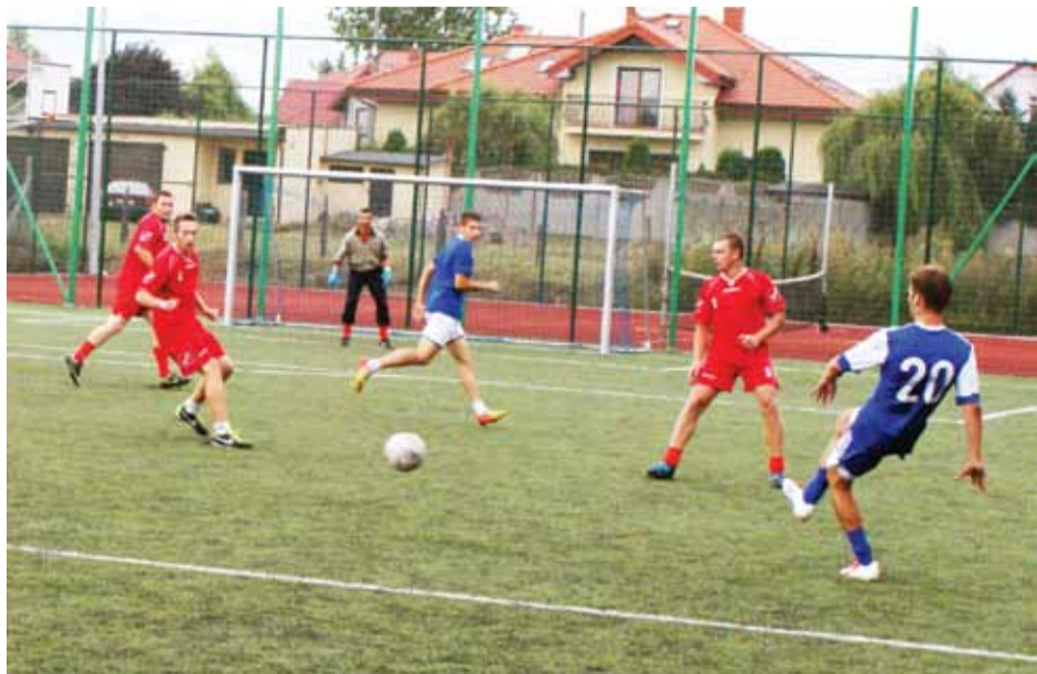
Mecz na szczycie pomiędzy Delta Skład a Jury Buhaj.