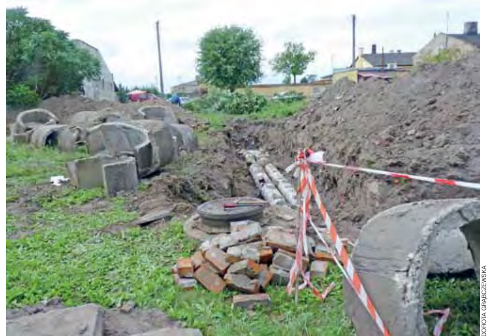
Na osiedlu Traugutta Zachód rozpoczęto modernizację 140 m ciepłociągu. Przez 2 tygodnie mieszkańcy miasta nie będą mieć ciepłej wody, gdyż trwa remont ciepłowni.