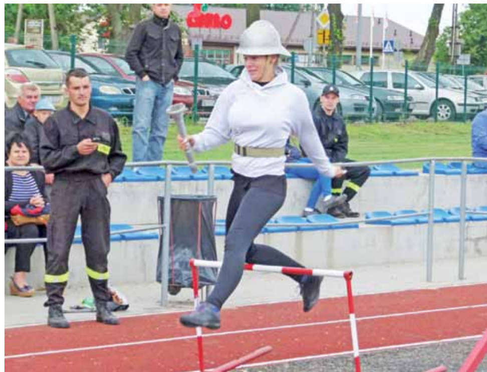
W sztafecie do pokonania był m.in. płotek, za którego przewrócenie można było dostać punkty karne.

Reczyce. Wśród panów pierwsze miejsce zajęła drużyna Reczyce A, przed Stroniewicami B, Stroniewicami A i Reczycami B. Kolejne miejsca przypadły w udziale: Rogóżno B, Strzebieszewowi, Rogóżno A, Domaniewicom B, Domaniewicom A, Kępnie i Sapom.