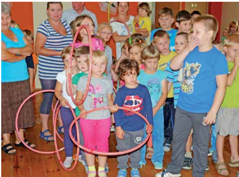
Dzieci rywalizowały między sobą w 6-osobowych drużynach, rzucając hula-hoop do celu.