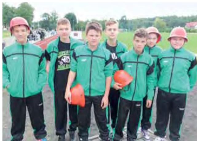
Drużyna młodzieżowa z Rogóżna liczyła na konkurencję, ale ostatecznie się jej nie doczekała.

Ostatecznie rywalizację zdominowali przedstawiciele OSP