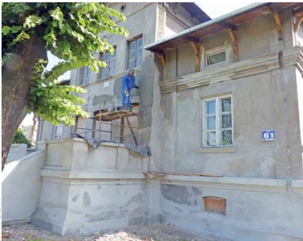
Większość tynków trzeba było skuć do cegły, by ułożyć nowe.