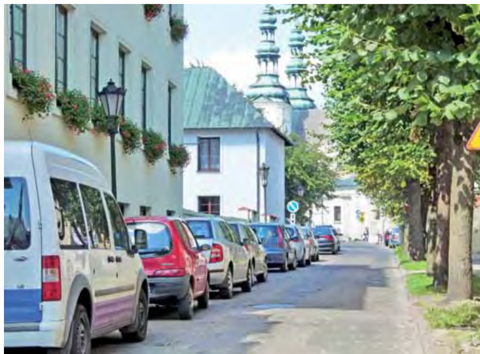
Umowa na modernizację ul. Pijarskiej ma być podpisana 27 sierpnia.

ski, przedstawił historię zmagani operacyjnych I wojny światowej w okolicach Bolimowa, gdzie wojska niemieckie w 1915 roku po raz pierwszy użyły gazów bojowych. Imitację zadymienia spowodowanego tą bronią zademonstrowali harcerze z hufca ZHP Łowicz. tm