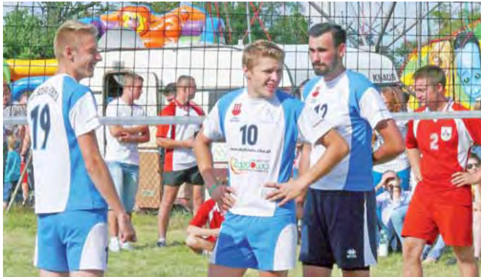
W turnieju siatkówki zawodnicy drużyny UKS Bzura Sobota stoczyli zacięty finałowy pojedynek z LKS Retki, szczęście im tym razem nie dopisało przegrali 2-1 ( 28-26, 17-25, 15-10) zajmując drugie miejsce.

kielbas z grilla oraz grochówki. Chętni mogli przejechać się na koniach, dzięki obecności pasjonatów przedwojennej formacji ułanów z Kutna, postrzelać z łuku, wziąć udział lub kibicować w turnieju „Potyczki Rodzinne”, gdzie organizatorzy zadbałi o niezwykle konkurencję dla rywalizujących rodzin, np. bieg z piłką do tenisa ziemnego, umieszczonej w łyżce stołowej,