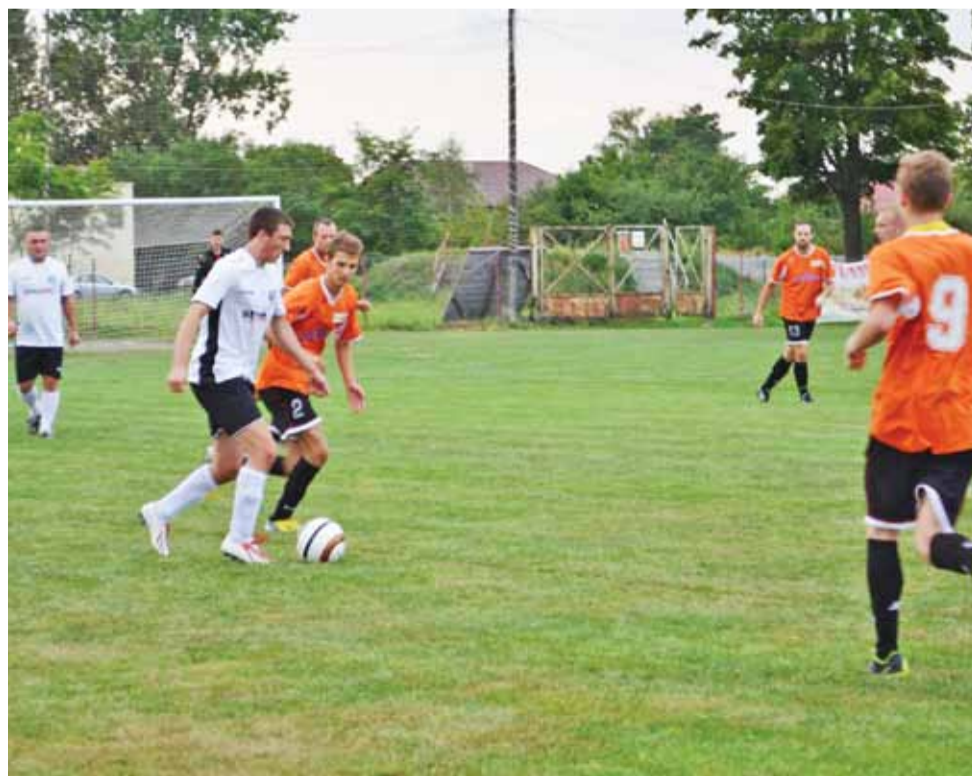
Wygrane spotkanie sparingowe GKS Bedno z Olimpią Niedźwiada 4:2.