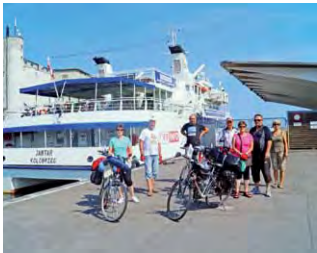
Wypawa miała szczęście do pogody, w obie strony fale Bałtyku nie były zbyt wysokie i nikt nie cierpiał z powodu choroby morskiej.