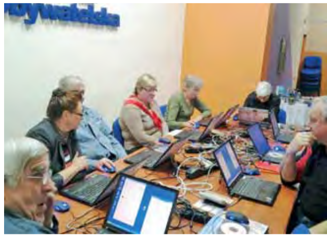
Tylko w tym roku na szkolenia komputerowe w biurze na os. Kostka przyszło 150 osób.