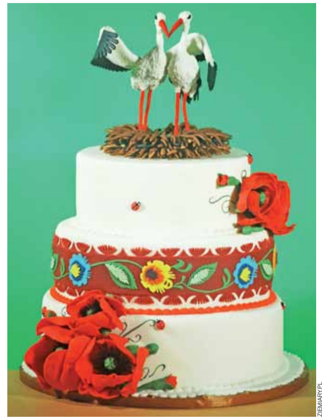
Tort z elementami łowickimi, zwieńczony parą bocianów zdobył pierwsze nagrody jury i publiczności w kategorii tortów w stylu dowolnym na Festiwalu Tortów Artystycznych.