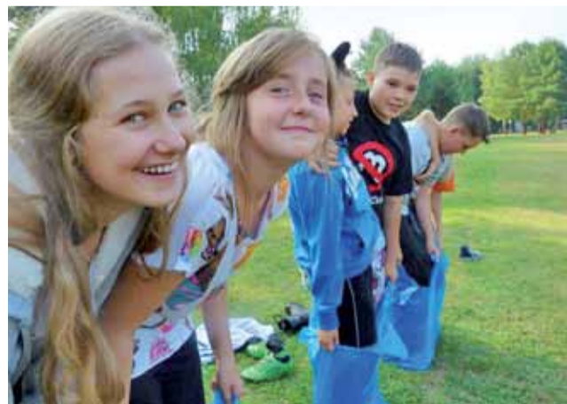
Oprócz zdobywania różnych sprawności, harcerze i zuchy mieli czas na wspólne gry i zabawy, np. bieg w workach.

pach i każda z nich miała napięty program, nie było czasu na nudę. Nawet gdy padał deszcz, dzieci i młodzież miały czas wypełniony grami i wspólnymi zabawami