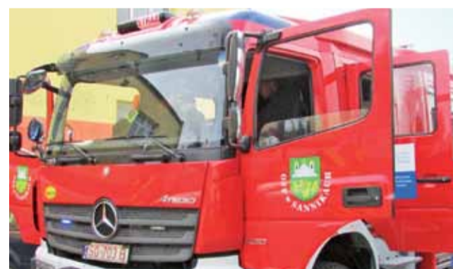
Średni samochód ratowniczo-gaśniczy na podwoziu Mercedesa już jest w jednostce OSP w Sannikach.

Fabrycznie nowy samochód ratowniczo-gaśniczy na podwoziu Mercedesa Benz Atego już stoi w garażu Ochotniczej Straży Pożarnej w Sannikach.