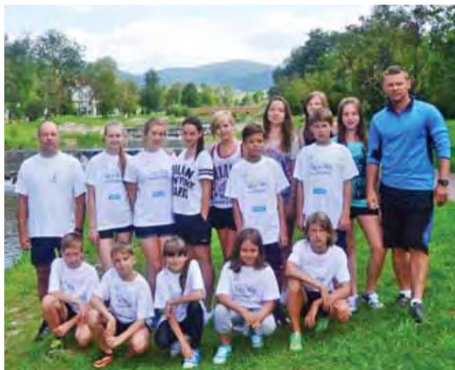
Obozowa ekipa UKS Jedyńka nad górskim potokiem.

– Zwiedzaliśmy ruiny zamku w Muszynie na Górze Basz-