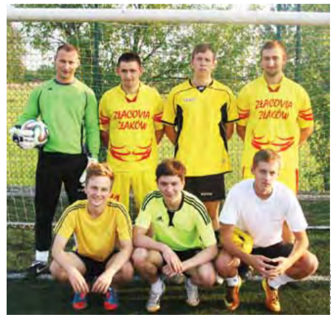
Mistrzowska ekipa: Złakovia Złaków Kościelny.

Piłka siatkowa | Przygotowania do sezonu 2013/14