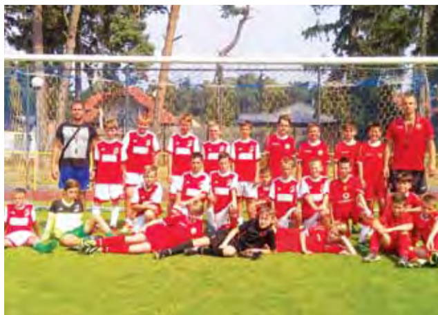
Zawodnicy Pelikana po meczu sparingowym z Widzewem Łódź.

Piłka nożna | Obóz szkoleniowy MUKS Pelikan