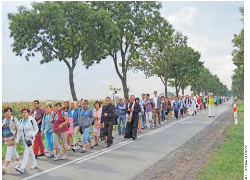
Mieszkańcy Żychlina w 162. pieszej pielgrzymce do Suserza.

Po homilii nastąpił obrzęd koronacji, który poprzedziło odczytanie dekretu Kongregacji Kultu Bożego i Dyscypliny Sakramentów przez kanclerza kurii