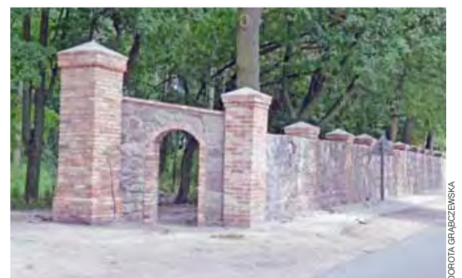
Dobiegają końca prace przy odtworzeniu mocno zdewastowanego zabytkowego parkanu przy dworze w Śleszynie. Prace są wykonywane na zlecenie nowego właściciela nieruchomości. Wybudowano też kilka nowych przęseł z cegły i kamienia, na wzór oryginalnych, które na przestrzeni lat zostały rozebrane. Trzeba przyznać, że prace wykonano solidnie. Jeszcze w tym roku ma być zamontowana stylowa, zabytkowa brama, wykonana z kutych elementów. dag