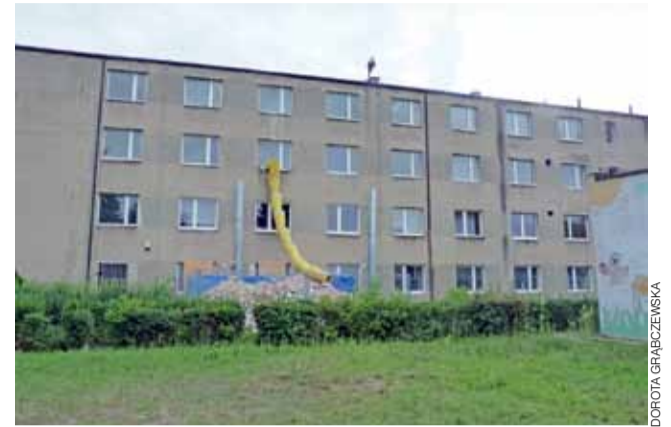
Podczas prac adaptacyjnych dawnej Placówki Opiekuńczo-Wychowawczej „Nadzieja” okazało się, że dach też przecieka. Zdecydowano, że w tym roku będzie zrobiony tylko doraźny jego remont.

Żychlin | Adaptacja budynku dawnego domu dziecka rozpoczęta