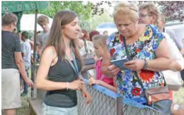
Przez większość trwania festynu miejsce to było oblegane przez bawiących się, którzy odbierali w nim drobne fanty wydawane w ramach loterii parafialnej.

W Turnieju Piłki Siatkowej wzięło udział 6 drużyn. Mecze rozgrywane były w dwóch grupach, gra toczyła się na dwóch boiskach. Zwycięzcy zawodnicy LKS Retki, II miejsce zdobyła drużyna UKS Bzura Sobota, a III miejsce Justyna TEAM. tb