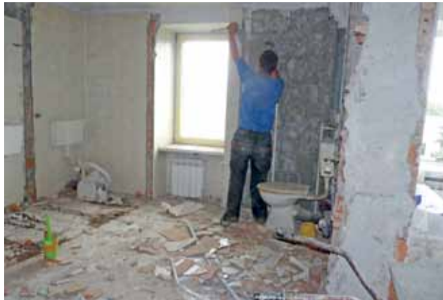
Na najwyższej kondygnacji budynku dawnej Nadziei przy ulicy Dobrzeleńskiej 6 przeróbek jest najwięcej. Konieczne były wyburzenia ścianek i skuwanie istniejących płytek w sanitariatach.

– Mamy tylko jedną kamienicę z barankiem, a w budynkach, które były malowane farbą klejową, staramy się stosować taką samą – mówi. – Damy radę, oby tylko lokatorzy potrafili uszanować pracę, jaką wykonujemy i nie dewastowali elewacji i korytarzy. ag