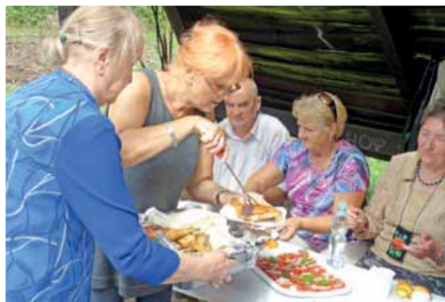
Gorący kurczak prosto z grilla trafia na stół.