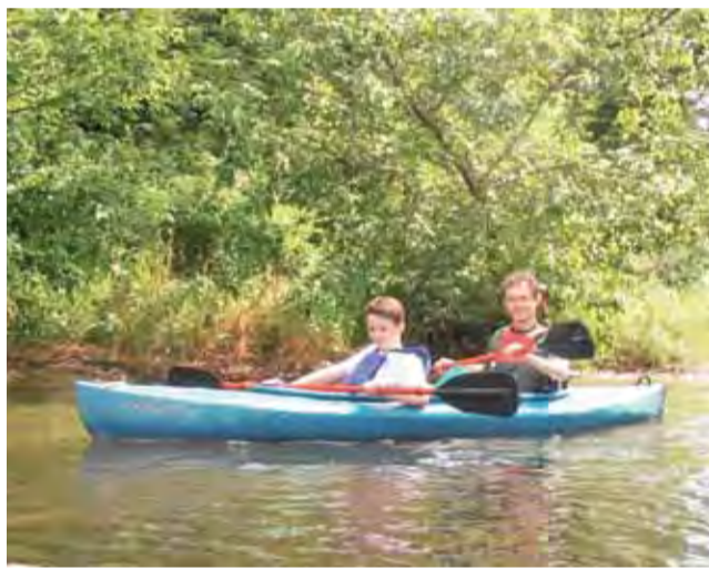
Załoga jednego z 16 kajaków, które z „Tratwą” przemierzały Rawkę.

32 osoby w wieku od 5 do 48 lat, w 16 kajakach wzięły udział w organizowanym przez łowicki Klub Turystyki Kajakarskiej „Tratwa” spływie po Rawce. Tematem przez cały czas towarzyszącym wydarzeniu były opowieści o lokalnych wydarzeniach z okresu I wojny światowej.