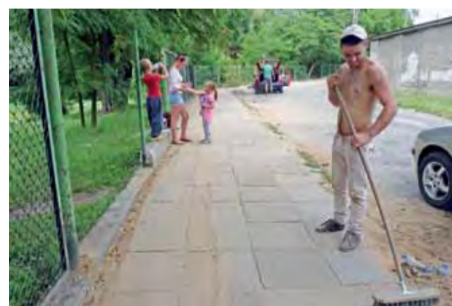
Odtwarzanie chodnika wzdłuż parku do biblioteki dobiega końca.

Radni poprawili też uchwałę przyjmującą plan odnowy miejscowości Dobrzelin, bowiem zmieniając w lipcu zapisy planu, nie zmieniono terminu jego obowiązywania. Gmina liczy, że po tych poprawkach uda się jej wreszcie dostać dofinansowanie z Urzędu Marszałkowskiego w Łodzi na budowę chodnika przy ulicy Jablonkowej. dag