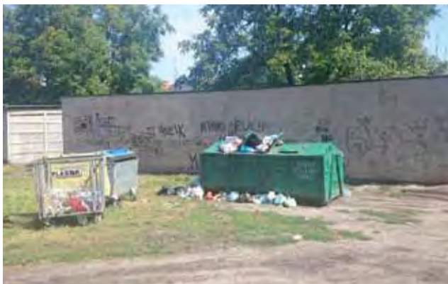
Bałagan przy kontenerze , z którego korzystają mieszkańcy budynków komunalnych.

Ci ludzie tam mieszkają i im samym przede wszystkim powinno zależeć na tym. Tymczasem im to nie przeszkadza.