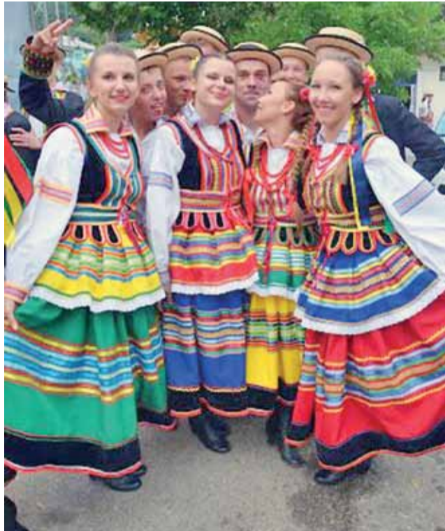
Zespoły z Łowicza i Opoczna w tradycyjnych strojach... lubelskich.

Oprócz ekipy z Polski wystąpiło też pięć zespołów z Rumu-