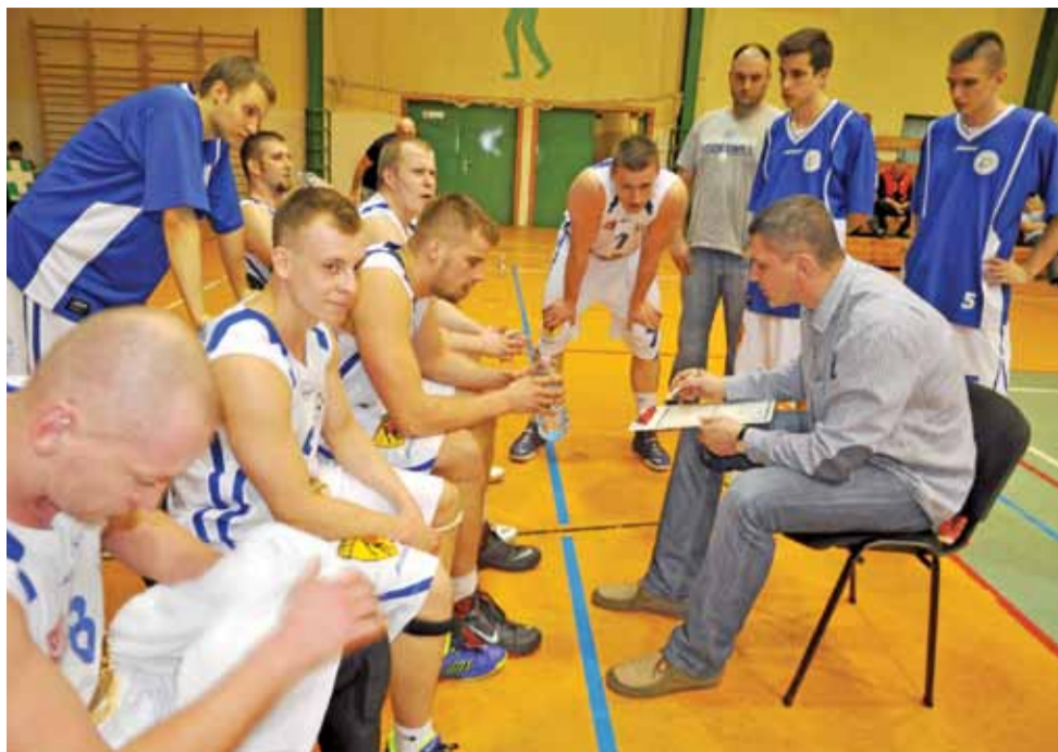
W tym sezonie trzon zespołu KS Księżak pozostanie bez zmian.

Koszykówka | Przygotowania KS Księżak do II ligi