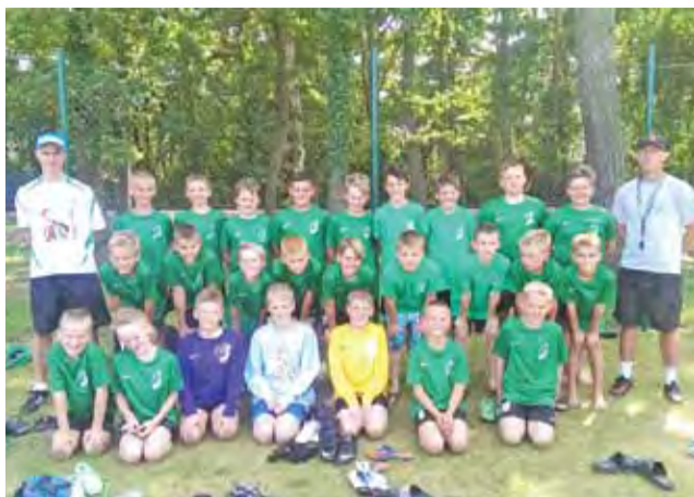
Kadra Pelikana 2003 robiła na obozie w Niechorzu spore wrażenie.