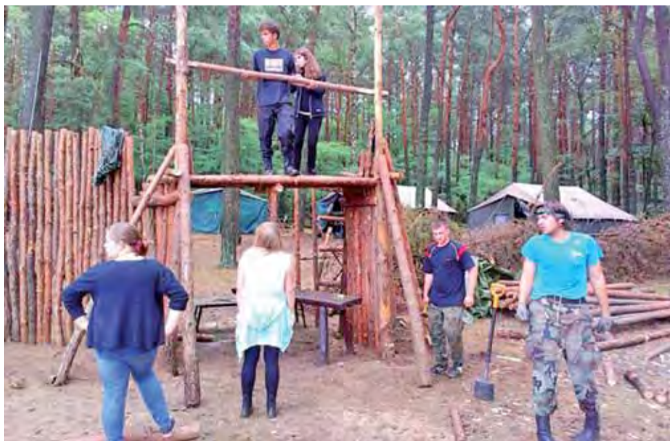
Budowa bramy wejściowej do podobozu starszych harcerzy i wartowników.