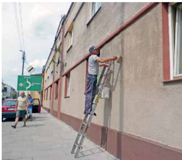
Malowanie elewacji z tzw. „baranka” jest bardzo żmudną pracą. Pistolet na farbę usprawniłby pracę.

Wejście do MOS będzie urządzone od strony ZS. Przed budynkiem powstanie też betonowy plac przeciwpożarowy o powierzchni ok. 450 mkw. Niestety, wokół budynku nie przewidziano na razie żadnych dodatkowych prac. Od strony szkoły ma stanąć winda dla niepełnosprawnych, która będzie jednak robiona przez wykonawcę wyłonionego w osobnym przetargu. Starostwo bowiem zabiega o pieniądze z Państwowego Funduszu Rehabilitacji Osób Niepełnosprawnych. Mówi się też o potrzebie termomodernizacji całego budynku w kolejnym etapie. Najprawdopodobniej dopiero wtedy teren wokół „Nadziei” zostanie uporządkowany i zagospodarowany. dag