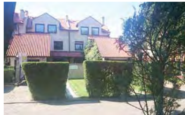
A tak wyglądają od zalepca domy stojące przy ul. Długiej.

Gdy ją o to zapytaliśmy, potwierdziła, że w tym roku (do końca października) chce zlecić wykonanie ogrodzenia wokół kontenera. Na razie jeszcze nie wie, z jakiego będzie ono materiału, ale bierze pod uwagę zakup gotowych elementów stalowych. Chodzi o to, aby było to bezpieczne oraz o to, aby firma