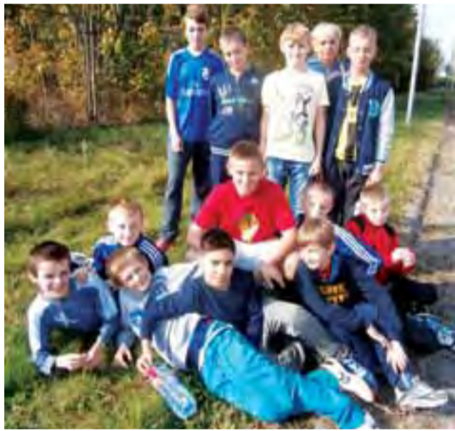
Chłopcy z SP Nr 2 Żychlin biorący udział w Mistrzostwach

Reprezentacja Szkoły Podstawowej Nr 2 Żychlin: klasy IV