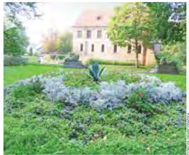
Starostwo Powiatowe w Kutnie dostało dofinansowanie wysokości 330 tys. zł na rewitalizację parku w Muzeum Zamek w Oporowie. Inwestycja będzie realizowana w 2015 roku.