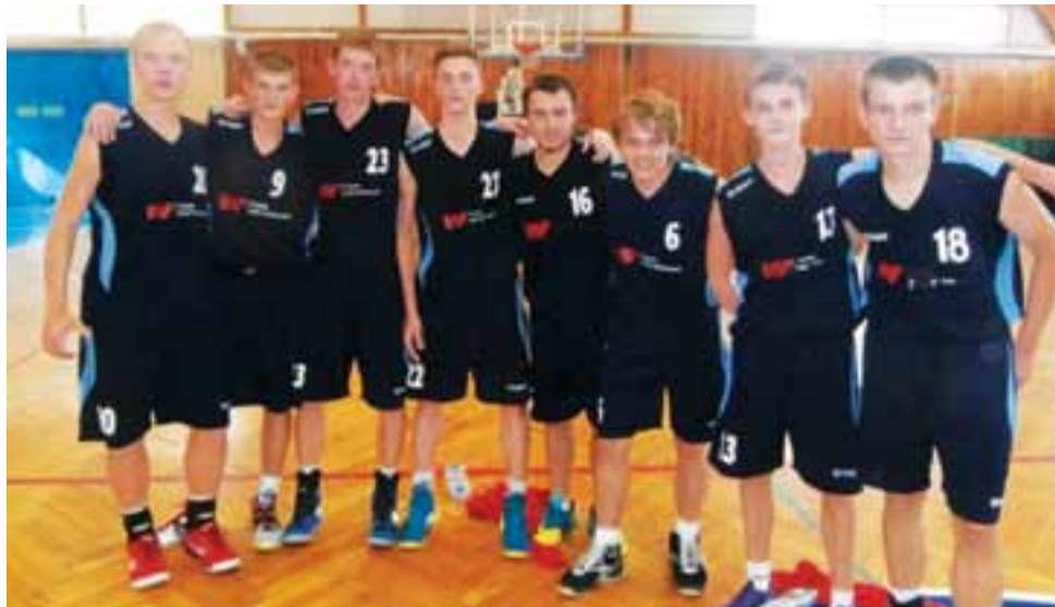
Drużyna koszykarska UKS M-G SZS Żychlin.

Piłka koszykowa | Wojewódzka Liga Juniora U-18