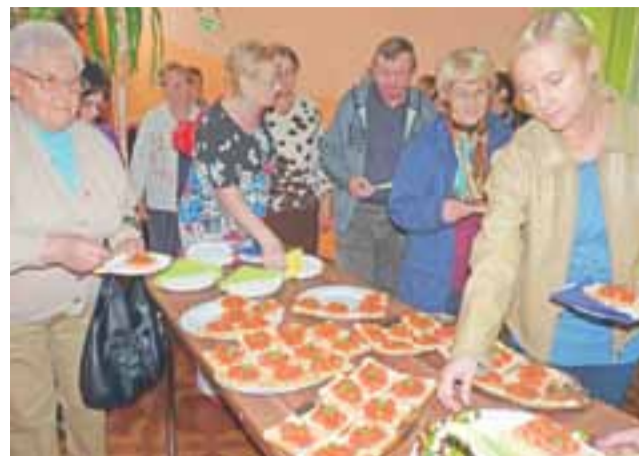
Uczestnicy spotkania z cyklu „Podróże z biblioteką” tradycyjnie degustowali włoskie potrawy przygotowane przez pracowników biblioteki.