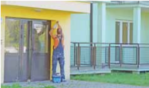
Gmina sprzedaje mieszkania w bloku dawnego TBS. Przed sprzedażą przeprowadzono ostatnie drobne poprawki.

Uczniowie szukali skarbu wokół zamku w Oporowie. str. 7