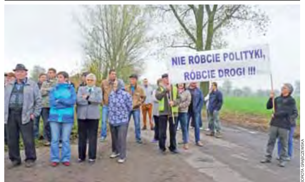
Wczoraj, od godz. 9.00 do 12.00, kilkudziesięciu mieszkańców z Dobrzelina, Drzewoszek, Czesławowa, Jurkowa Pierwszego, Wólki Lizigódz, Janek, Woli Owsianej, Woli Prosperowej, Kamiennej, Szczytu i Podgajewa wyszło na drogę powiatową, blokując skrzyżowanie Jurków – Oporów – Drzewoszek. Zdesperowani ludzie wyrazili swoje niezadowolenie z powodu braku działań Starostwa w Kutnie, które do tej pory nawet nie załatwiło dziur po poprzedniej zimie. Więcej o przyczynach protestu, o tym jak się broni starostwo i o tym, czego można się spodziewać dalej – przeczytacie w NŁ za tydzień.