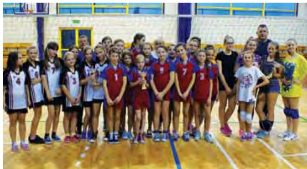
Drużyny siatkarskie dziewcząt biorących udział w turnieju.

■ Bieg na 1000 m: Artur Petikyan 3.42.96, I miejsce klasy V