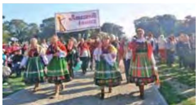
Stroje nie pozostawiły wątpliwości co do tego, z jakiego regionu przyjechała do Częstochowy ta grupa.

rekordowa frekwencja, jeśli chodzi o przedstawicielki łowickiego klubu i osoby im towarzyszące. Podkreślają one, że nie znaczy to bynajmniej, że jest więcej