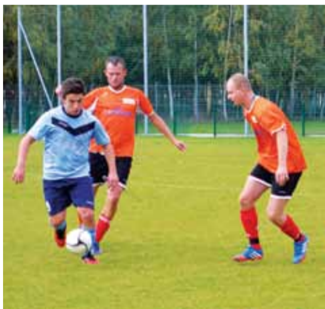
Spotkanie na boisku w Witonii pomiędzy GKS Bedno a Witonianką Witon, zakończyło się wygraną Bedna 5:0.

Kolejka 9. łódzkiej klasy A grupy III odbędzie się 19 października (niedziela). GKS Bedno zagra na własnym boisku z Dąbrowianką Dąbrowice.