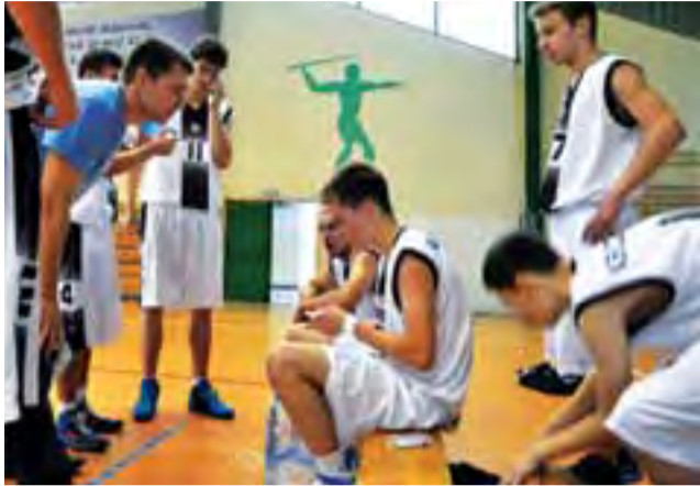
Juniorzy Księżaka wygrali drugi mecz w lidze wojewódzkiej.

– W tym meczu nieco zlekceważyliśmy rywala i mogło się to źle skończyć. Nie możemy so-