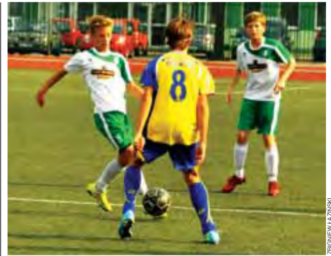
Ekipa Pelikana 2000 tym razem zremisowała.

1. I LO Łowicz (Polit, Trębska, Brzezińska i Olewicz) 54,66 s, 2. ZS 3 Skierniewice 55,93 s, 3. ZS 1 Kutno 56,06 s.