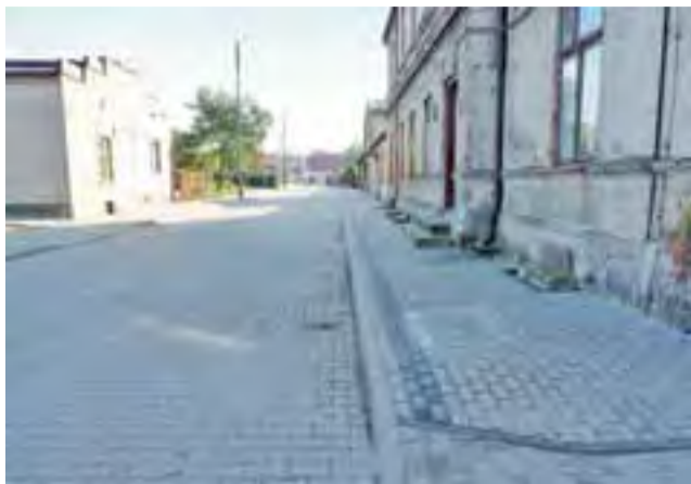
Ulica Kilińskiego została pięknie zmodernizowana.

Wykonawca, firma Elvis zapewnia, że po zakończeniu inwestycji i wybudowaniu separatora wód deszczowych (osadnika piasku) problem powinien się rozwiązać. – Byliśmy przerażeni, gdy po deszczu przed naszą posesją utworzyło się jezioro wody, a jakby tego było mało, woda przelewała się przez nasze podwórka i wpływała do piwnic – mówi mieszkanka ulicy Kilińskiego. – Mąż w kaloszach wyszedł na jezdnię i zaczął oczyszczać zapchane studzienki ściekowe. Było tam pełno liści, patyków i innych śmieci. Gdy je odblokował, aż wir się robił, co znaczy, że kanalizacja wodę odbiera.