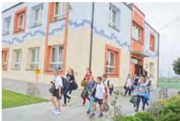
Kolorystyka elewacji szkoły w Pacynie cieszy oko.

W ramach inwestycji szkolne mury zostały docieplone styropianem grubości 12 cm, docieplono ściany fundamentów styropianem grubości 10 cm, wełną mineralną docieplono dach sali gimnastycznej oraz dach na budynku szkoły, na całości ułożono papę termozgrzewalną, wymieniono instalację odgromową, wymieniono ryny i rury spustowe, wykonano obróbki blacharskie