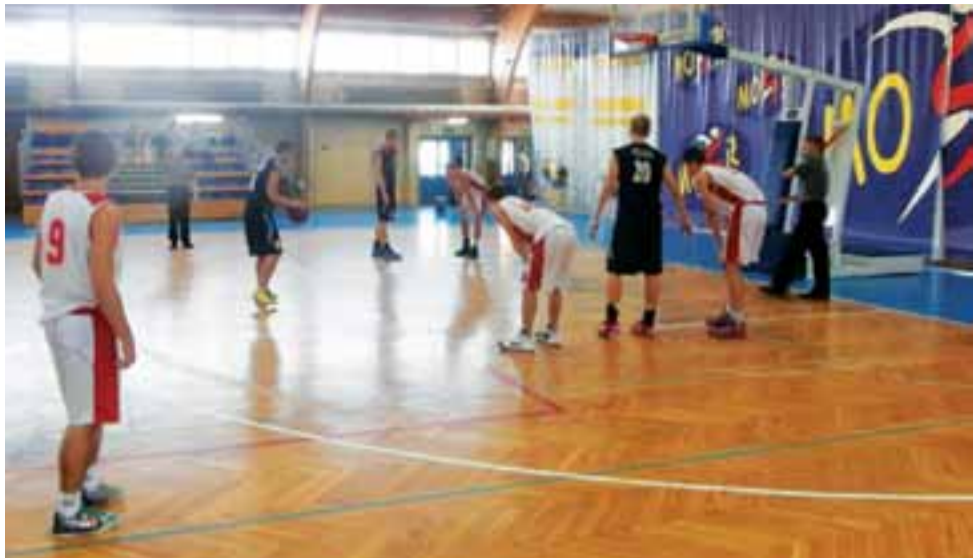
Wygrany 86:64 mecz UKS Żychlin kontra ŁKS SMS MG 13 Łódź podczas Wojewódzkiej Ligi Juniora U-18.