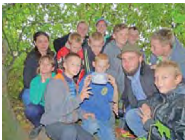
Przy pomocy wolontariuszy, studentów geografii Uniwersytetu Śląskiego, uczniowie z ZS w Oporowie znaleźli skarb geocaching

Ideą zabawy jest, by odkrywca nie zabierał skarbu, a dołożył do niego coś swojego. Może coś zamienić, ale musi ponownie schować pojemnik w tym samym miejscu. W środku jest mały notesik, do którego wpisują się kolejni odkrywcy, podając datę i nazwiska. Ponieważ dzieci chętnych do popołudniowej zabawy było aż 40, poszukiwacze podzielono na 2 grupy. Podczas gdy jedni szukali skarbu, drudzy piekli kielbaski na ognisku w zamkowym parku. Jakaż była ich radość, gdy wreszcie skarb udało się