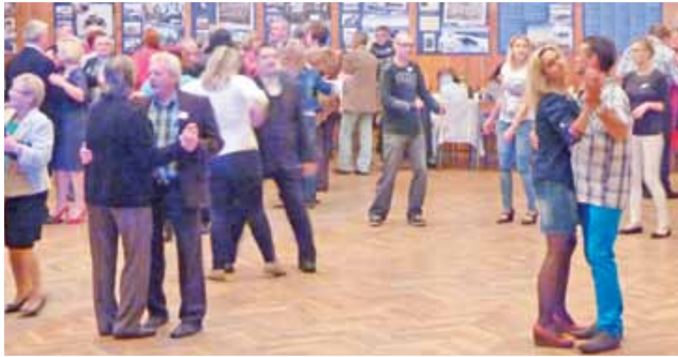
Na spotkaniu jubileuszowym Rodzinnego Klubu Abstynenta „Przystań Życia” bawili się zarówno jego członkowie ze swoimi rodzinami, jak też osoby, które wspierają to stowarzyszenie.

– Żona jest wielka, bo wyciągnęła mnie z tego piekielka – pisze w jednym ze swych wierszy. To właśnie pisaniem wierszy stara się zagłuszyć wyrzuty sumienia, które pojawiają się często. Zapisał już kilkanaście zeszytów. Pisze w