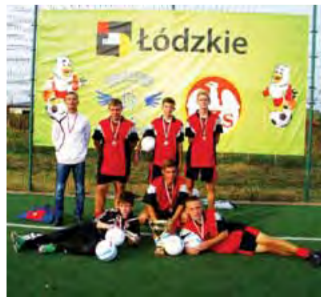
Reprezentacja Gimnazjum Żychlin z pucharem za zajęcie drugiego miejsca w Finale Orlikowej Ligi Mistrzów w piłce nożnej w Łasku.

Nowy Łowicznanin Tygodnik Ziemi Łowickiej członek Stowarzyszenia Gazet Lokalnych