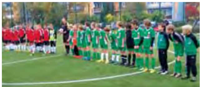
W derbach Widok okazał się nieco lepszy.

W pierwszym meczu na wyjeździe nasz zespół przegrał wysoko. Tym razem było lepiej, ale rywala nie udało się pokonać. Łowiczanie przegrali po wyrównanym meczu 2:5 i w tej chwili zajmują 2. miejsce w rozgrywkach okręgowych i widać wyraźnie, że razem z