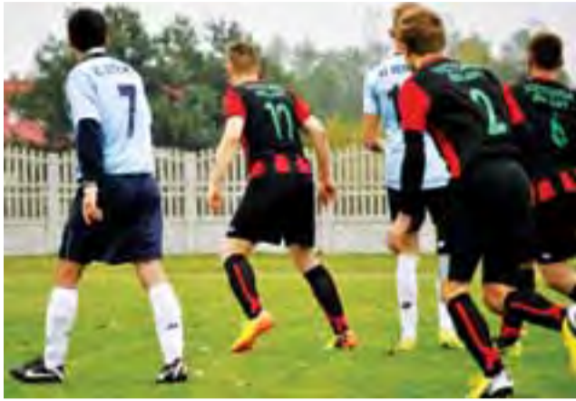
Victoria pokazuje, że jest w dobrej formie w tym sezonie.

Victoria w niedzielę zagra mecz na szczycie w Sierakowicach z tamtejszą Sierakowianką, która w tym sezonie wygrała jak dotąd wszystkie mecze. W tej kolejce zawodnicy z Sierakowic