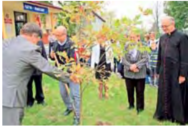
Podczas uroczystości przy Szkole Podstawowej w Niedźwiadzie posadzono dwa dęby pamięci.