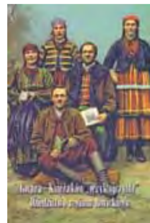
Tak wygląda okładka książki

Zespół był obecny w czasie promocji książki w muzeum, w drugiej części tego spotkania zaśpiewał i jak to zazwyczaj