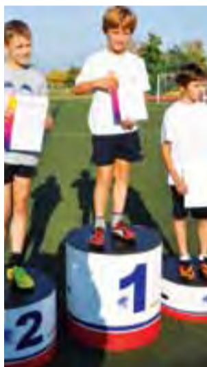
Najsybsi czwartoklasiści trzeciego rzutu Czwartków LA.