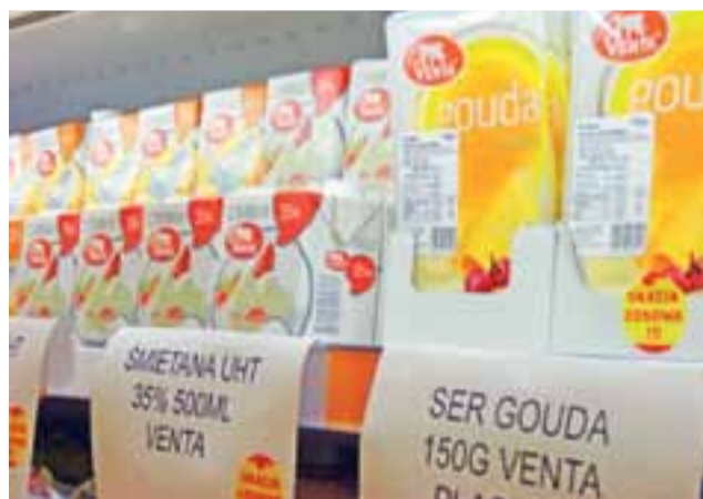
Wśród towarów, które można kupić w sklepach OSM w Łowiczu po niższej cenie, znajdują się kilka rodzajów śmietany i żółtego sera.

Zarząd mleczarni znalazł jednak na to sposób: zdecydowano sprzedawać je w Łowiczu. Ich jakość jest taka sama, jak innych produktów tego zakładu, różnią