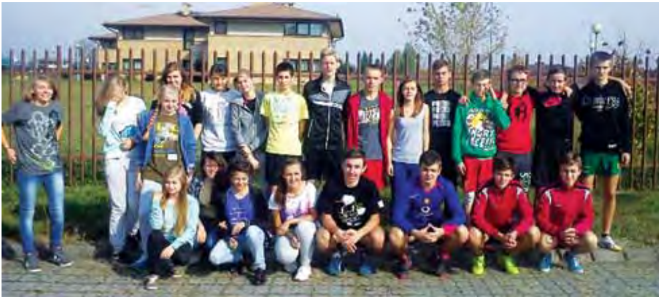
Reprezentanci Gimnazjum Żychlin w Mistrzostwach Powiatu w Sztafetowych Biegach Przelajowych w Kutnie.

Sport szkolny | Mistrzostwa Powiatu w Sztafetowych Biegach Przelajowych