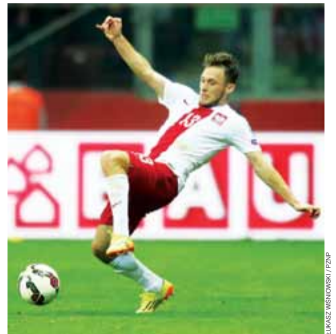
Maciej Rybus zagrał po raz kolejny w kadrze Nawałki.

Niemcy: 1. M. Neuer – 16. A. Rüdiger (83, 23. Max Kruse), 17. J. Boateng, 5. M. Hummels, 15. E. Durm – 11. K. Bellarabi, 20. C. Kramer (71, 14. J. Draxler), 18. T. Kroos, 19. M. Götze, 9. A. Schürle (77, 10. L. Podolski) – 13. T. Müller.