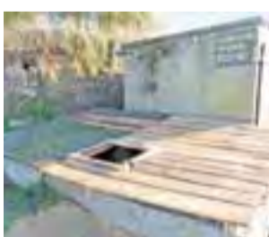
Po trzech miesiącach wybrano nieczystości i założono nową kłapę.

Podwórkową kloakę z wylęgającymi się nieczystościami i zarwaną kłapą zobaczyliśmy przy okazji oglądania mieszkania zaproponowanego w czworaku eksmitowanej rodzinie Cieślaków. Interweniowaliśmy w SZB.