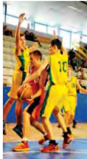
W Pabianicach Księżak musiał się tylko bronić.

Koszykówka | Tauron Basket Liga Kucharek dobrze zaczął sezon