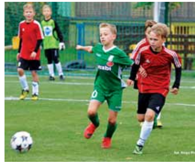
W meczu Pelikana z Widokiem nie zabrakło emocji. Wygrał Widok, jednak Pelikan zaprezentował się z dobrej strony.