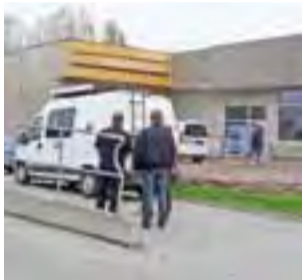
Policja zabezpiecza ślady.

Są świadkowie, którzy widzieli jak wynoszono ciało mężczyzny pod śmietnik, za teren budowy.