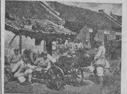
WALKI ARTYLERYJSKIE W YING-PAN

Powołanie organizacji „Służba Polsce” jest wyrazem i konsekwencją powszechnego dążenia młodzieży do maksymalnego udziału w realizacji 3-letniego planu odbudowy kultury fizycznej młodzieży polskiej.