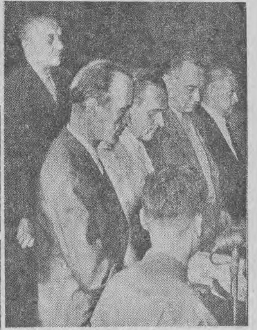
Alfred Krupp (pierwszy z prawej) w otoczeniu rekinów kapitału niemieckiego — słucha aktu oskarżenia przed trybunałem w Norymbberdze.