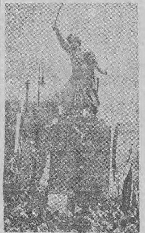
POMNIK JANA KILIŃSKIEGO szewca-patrioty, który był jednym z przywódców powstania warszawskiego podczas insurekcji Kościuszkowskiej w 1794 roku. Pomnik ten podczas okupacji udało się ocalić i przechować przed Niemcami. Obecnie znów stoi on na swym dawnym miejscu, na placu Krasińskich w Warszawie. W dniu 28 stycznia przypada rocznica zgonu tego wielkiego Polaka.