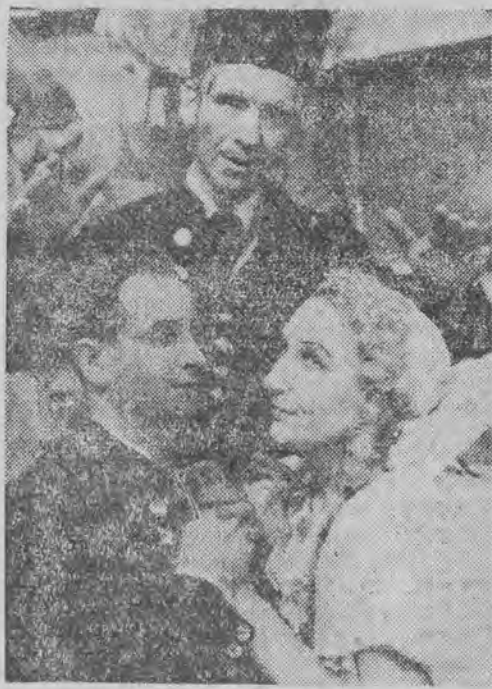
Koncowa scena z opery „Sprzedana narzeczona”

Dobrze się stało, że CZPWl przyczynił się praktycznie do tego, iż przodujący robotnicy łódzcy, z których napewno przed 1939 rokiem tylko znikomym odsetek mógł słyszeć operę, mieli możliwość zapoznać się z twórczością ope-