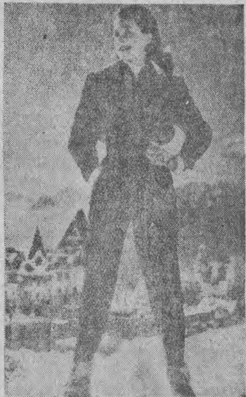
St. Moritz w chwili obecnej jest na ustach wszystkich sportowców świata. Fragment klimatycznej miejscowości w Szwajcarii widzimy na drugim planie. Ale nawet ta uroczą narciarka nie załamie uroku gór i słońca

POLSKA UCZESTNICZY W OLIMPIJSKIM TURNIEJU HOKEJOWYM Reprezentacja hokejowa Polski została ostatecznie zgłoszona do udziału w zimowych