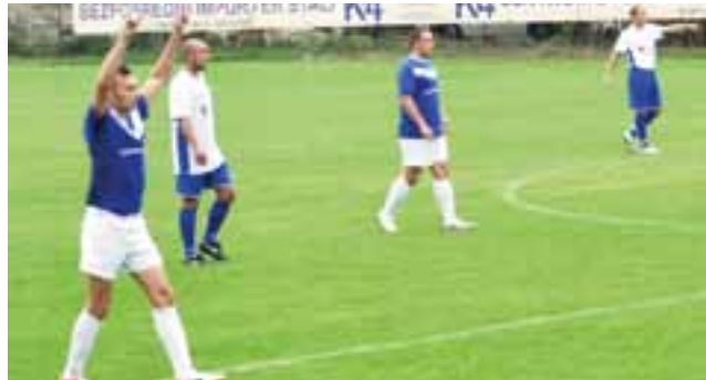
Zjednoczeni Stryków (niebieskie stroje) mogli cieszyć się ze zwycięstwa.

15. kolejka odbędzie się 20-21 kwietnia: Orzeł II Parzęczew – Kotan Ozorków, Malina Piątek – Błękitni Dmosin, Zamek Skotniki – Huragan Śwędów, LKS Sarnów – Zjednoczeni II Stryków, Nowosolna Łódź – LZS Justynów, LKS Dąbrówka – Struga Dobieszków.