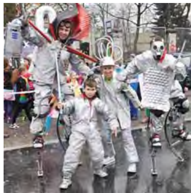
Tak prezentowali się strykowscy kibice maratonu ulicami Łodzi.