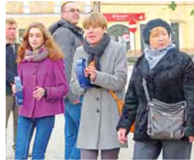
Uczestnicy misji tańczyli, grali, śpiewali i słuchali świadectw nawróconych.