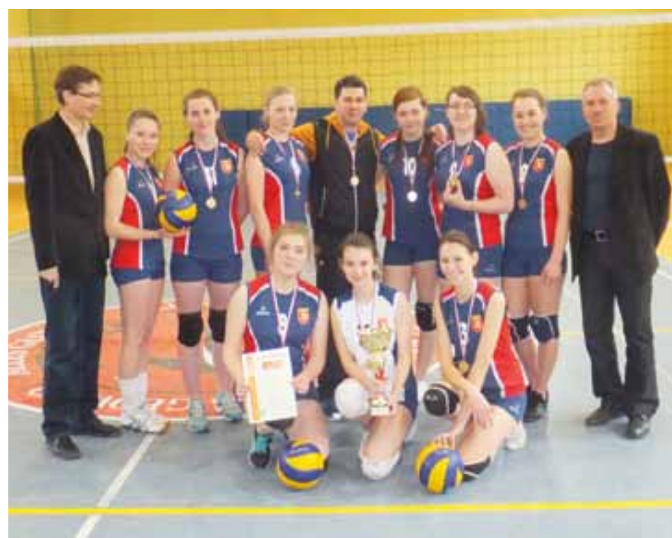
Zwycięski skład Mistrzostw Rejonu w siatkówkę dziewcząt prezentuje się wspaniale. Oby w podobnych nastrojach gównianki wracały z Wielunia.