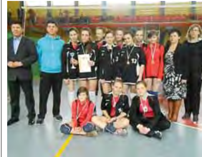
Siatkarki Gimnazjum Miejskiego w Głownie wywalczyły trzecie miejsce w powiecie.