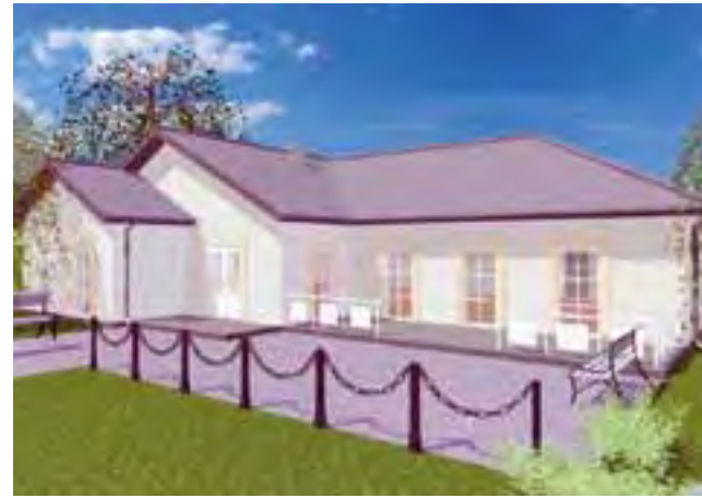
Wizualizacja świetlicy w Starych Grudzach, którą oglądali łyszkowiccy radni.