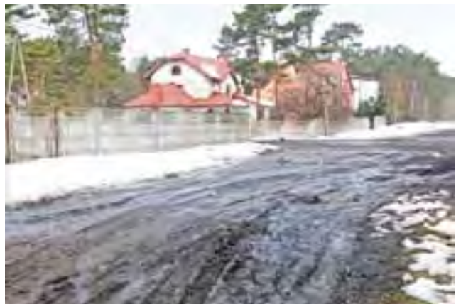
Ul. Ziewianicka po roztopach i już po wypompowaniu wody wygląda tak