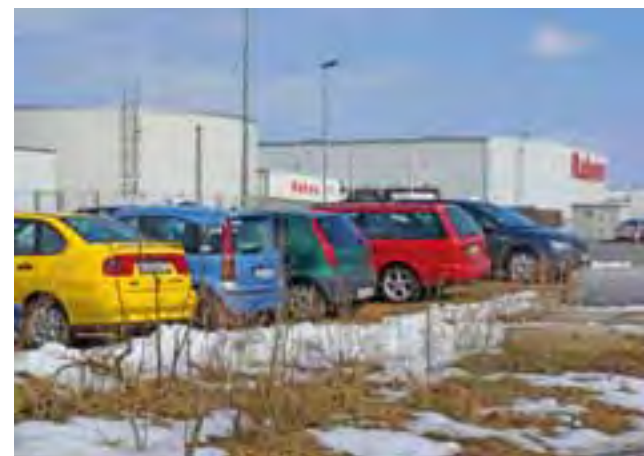
Średnio zainteresowana uruchomieniem nowej linii autobusowej była m.in. firma Raben, która zapowiada, że jeszcze w tym roku urządzi dla swoich pracowników wystarczającą liczbę miejsc parkingowych. Na razie wielu parkuje w błocie.