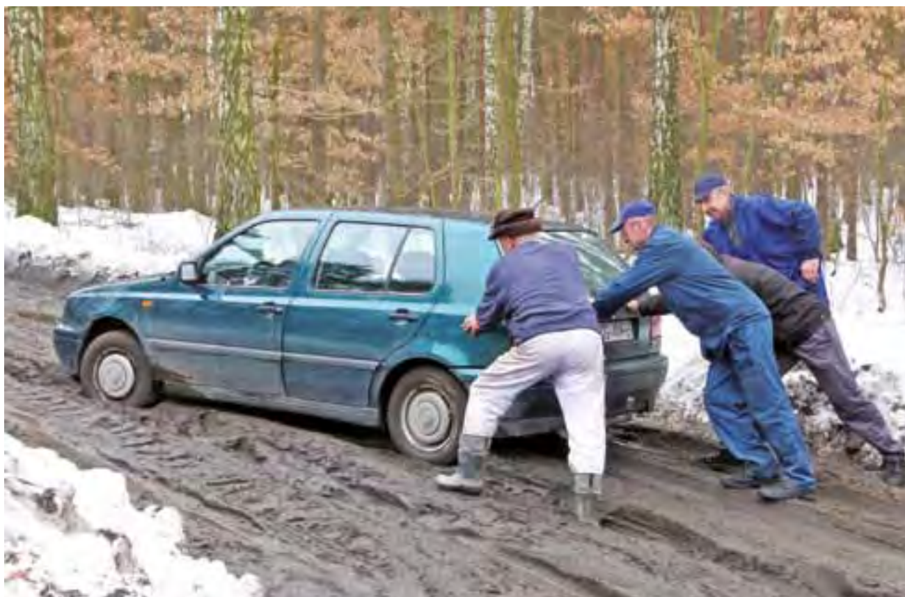
Samochody grzęzną w błocie jeden po drugim. Bez pomocy życzliwych ludzi nie dawało się wyjechać.

Trzeba dokładnie sprawdzać, gdzie stawia się stopy, żeby przypadkiem nie pozostawić w niej buta. Najodpowiedniej-