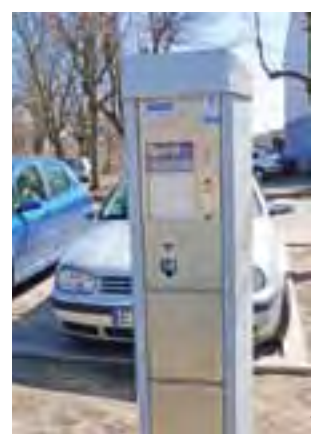
Parkowanie za darmo. W środy parkomaty przy placu Wolności w Głownie jeszcze nie działały.