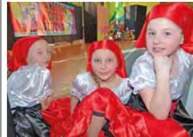
Blisko 200 małych i większych tancerzy wzięło udział w IV Tancerznej Gali Malucha, zorganizowanej 13 kwietnia przez MOK. Tancerki znalazły czas i na kibicowanie rówieśniczkom, i na pozowanie do zdjęć. Więcej – str. 36.