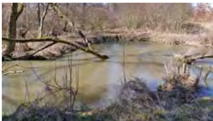
Mętna Mroga na wysokości osiedla Kopernika w Głownie.

Ponad 2,5 promila alkoholu miał w organizmie 46-letni kierowca samochodu marki Mercedes, który 14 kwietnia ok. 15.40 wjechał do przydrożnego rowu w Dobrej. Do zdarzenia doszło o godz. 15.40. Podczas wykonywania manewru skrętu kierujący – mieszkaniec gm. Stryków – utracił panowanie nad pojazdem i zjechał do rowu. Nie doznał poważniejszych obrażeń. Przybyli na miejsce policjanci ze Strykowa poddali mężczyźnie kontroli stanu trzeźwości, która dała mocno obciążający go wynik. Kierowca odpowie za jazdę po pijanemu. ewr