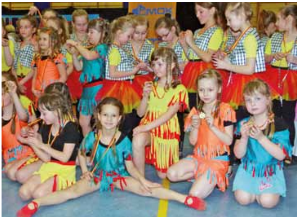
Mały medal, a tyle radości. Tuż po wręczeniu trofeów.

Z sobotniej gali żaden tancerz nie wyszedł bez medalu, ale wśród równych sobie byli również ci najlepsi. Jury postanowiło przyznać pierwsze miejsce Goldowi I i II za ukła-