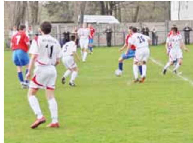
Mecze Stali Głowno z Orłem Parzęczew zawsze są zacięte i dostarczają kibicom wielu emocji.