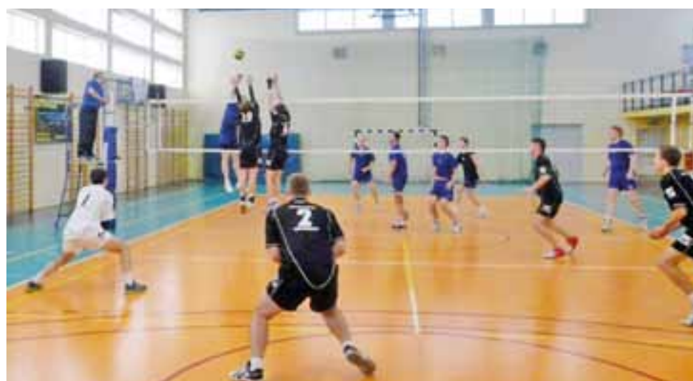
Siatkarze BKS Bratoszewice (czarne stroje) będą reprezentować Gminę Stryków podczas Amatorskich Mistrzostw Polski, które już niebawem odbędą się w Warszawie.

Amatorskie Mistrzostwa Polski w Siatkówce, w których wystąpi drużyna BKS Bratoszewice zbliżają się wielkimi krokami.