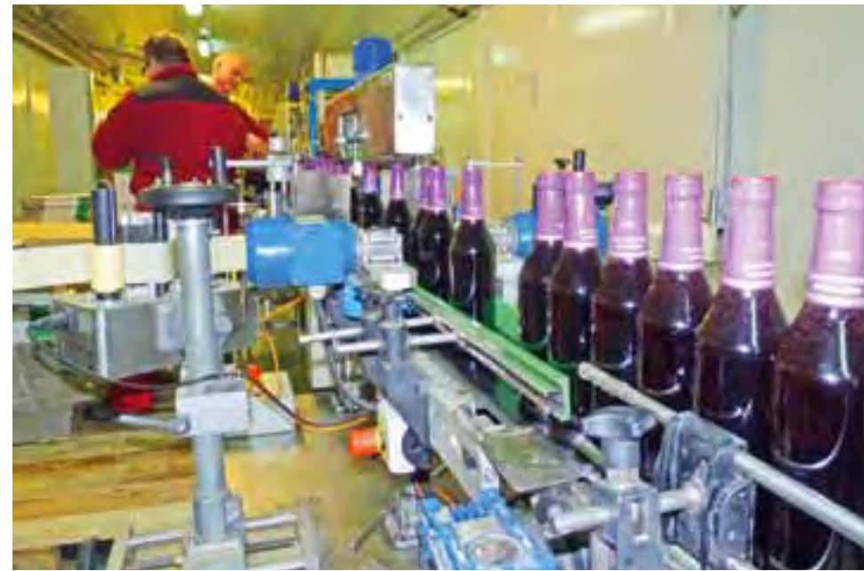
Z linii produkcyjnej schodzi właśnie syrop z owoców leśnych, który trafi na półki sieci Tesco.

Przez 12 lat firma zdążyła wypracować sobie szeroką sieć kanałów dystrybucyjnych zarówno krajowych, jak i zagranicznych. Wytwarza ona marki własne wyrobów sprzedawanych większości sieci handlowych, na czele których stoi TESCO. Jej wyroby trafia-