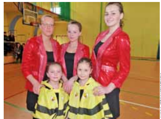
Najmłodsze i najstarsze reprezentantki strykowskiego Agatu.