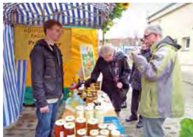
Przed zakupem można było skosztować każdego rodzaju miodu.

– Udało mi się przejechać kilka ładnych rodzin pszczelich i mogę spokojnie powiedzieć, że