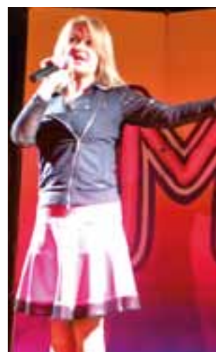
Majka Jeżowska w trakcie występu w Głownie.

W sali MOK zabrzmiały jej największe hity, takie jak choćby znane i o wiele starszej i szerszej publiczności „Wszystkie dzieci nasze są”. Jeśli mali słuchacze nie znali tekstu którejś z piosenek, artystka szybko uczyła ich choćby refrenu, co pomogło w wspólnej zabawie. W czasie występu nie zabrakło też innych atrakcji, jak choćby możliwości otrzymania plakatów, zdjęć, a nawet płyt