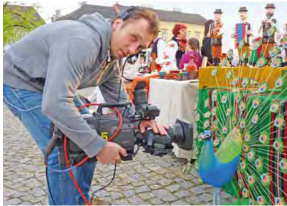
Operatorzy kamer pokazywali w telewizji łowickie ozdoby i wyroby naszych twórców ludowych, wśród nich łowickiego pawia.

Łowicz | Nasze miasto miało się czym pochwalić – choć koniec końców i tak dominowały pasiaki