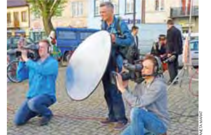
Przy każdym ujęciu pracowało dwóch operatorów kamer.

że śpiewy i widać tańce. W Kawiarni czy herbarcie zaprezentowali się m.in. Blichowiaci, Ksinzoki, Koderki i Mazovia. Swoimi umiejętnościami pochwalił się też strażacy. Zaprezentowali oni trzy sposoby, jak bezpiecznie ugasić rozżarzony olej. Było widowiskowo i – przez chwilę – niebezpiecznie.