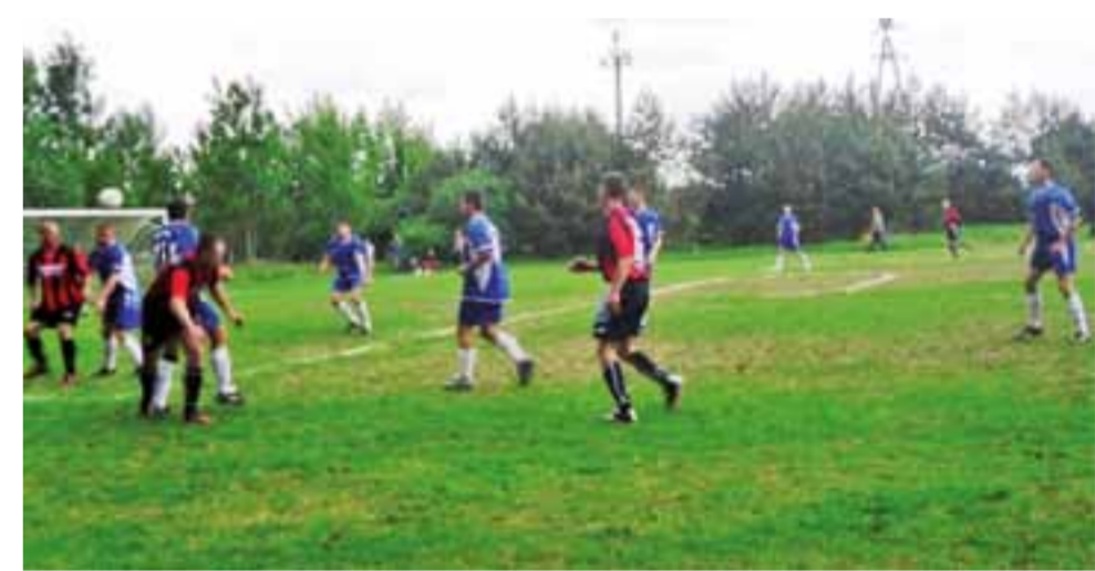
Sokół Popów celuje w mistrzostwo B-klasy.