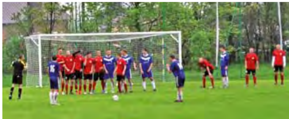
Zjednoczeni Stryków (niebieskie stroje) należą do najlepszych drużyn IV ligi. Zdaniem wielu obserwatorów piłkarze Strykowa zasługują na grę w III lidze.

Lider otrzymał walkower za pojedynek z wycofanym z rozgrywek Sorento Ządębie Skierniewice, natomiast Mechanik Radomsko pewnie 3:0 pokonał na wyjeździe słabo spisującego się wiosną Zawiszę Pajęczno. Zwraca uwagę dobra postawa beniaminka Mazovii Rawy Mazowieckiej, który notuje systematyczny awans w tabeli i jest już na ósmej pozycji. W ostatniej kolejce Mazovia nie miała problemów z pokonaniem Włókniarza Pabianice. Oprócz walki o awans, do ostatniej kolejki zapowiada się również rywalizacja o byt w IV lidze. W tej chwili najbardziej zagrożone są Włókniarz Zgierz i Orleża Cielądz.