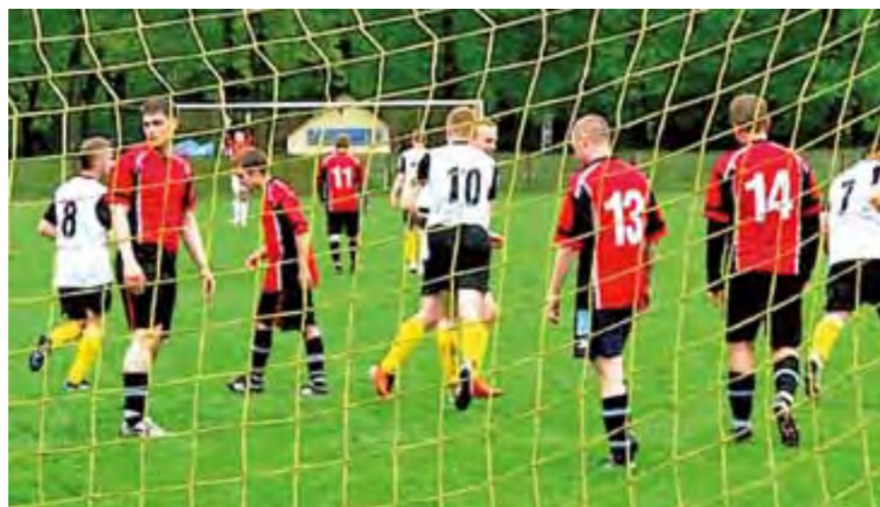
Rozgrywki B-klasy, gr. II od dawna nie dostarczały kibicom tak wielu emocji.

18. kolejka (18-19 maja): Boruta II Zgierz - LKS Kalonka, Sokół Popów - LKS Galkówek, Czarni Smardzew - Start Szczawin, Fenix Wągry - Powstańca Dobra, LKS II Różyca - KS Gozdów, LKS Gieczno - pauza.