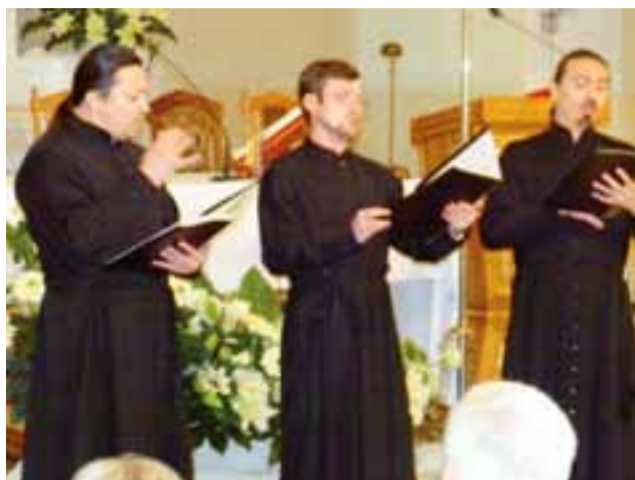
Trio wokalne Juźnyj Glas na koncercie w kościele w Łowiczach.