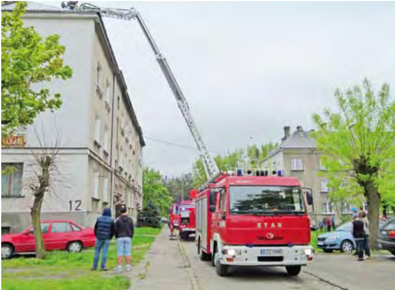
Przy bloku nr 12 pojawiło się kilka wozów gaśniczych. Strażacy musieli posłużyć się wysięgnikiem.

– Po przybyciu na miejsce stwierdziliśmy pożar sadzy w kominie. Wyglądało na