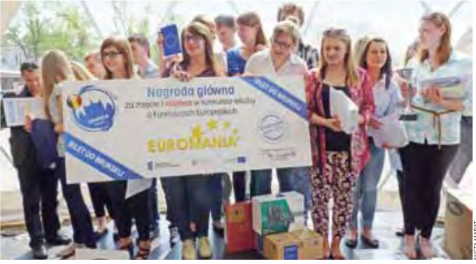
Laureaci trzech pierwszych miejsc konkursu z nagrodami i pucharami.

Na rynku roztawiono trzy duże namioty z atrakcjami. Największym zainteresowaniem cieszyły się ekspozycje i pokazy przygotowane przez warszawskie Centrum Nauki Kopernik. Można było się z nich na przykład dowiedzieć, jak działają nowoczesne roboty, jak nadaje się kolor fajerwerkom, dlaczego prąd elektryczny może działać „na odległość”. Dzieci przyciągał symulator jazdy narciarskich, używany niemal przez cały czas