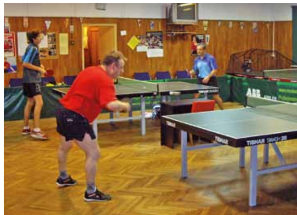
TKKF Expandor Głowno w ostatnich spotkaniach nie zachwyca formą.