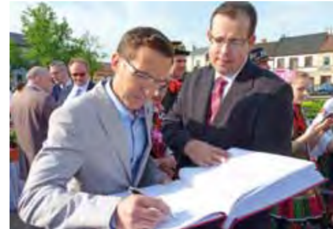
Pamiątkowy wpis prezentera do kroniki szkolnej ZSP nr 2.

Przez dwie godziny na łowickim rynku słychać było tak-