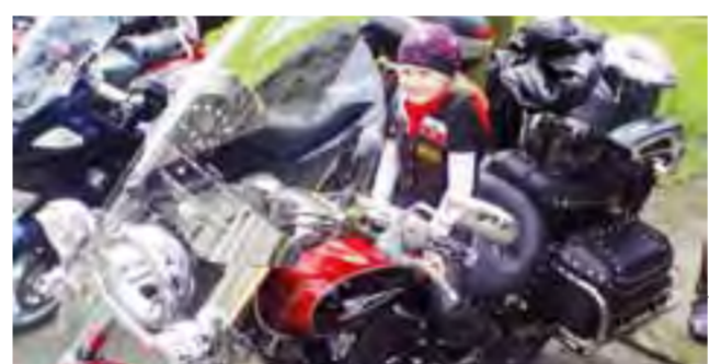
Do Strykowskiej Grupy Motocyklowej chętnie dotarczają również najmłodszy, którzy wiedzą, że panuje tam rodzinna atmosfera.