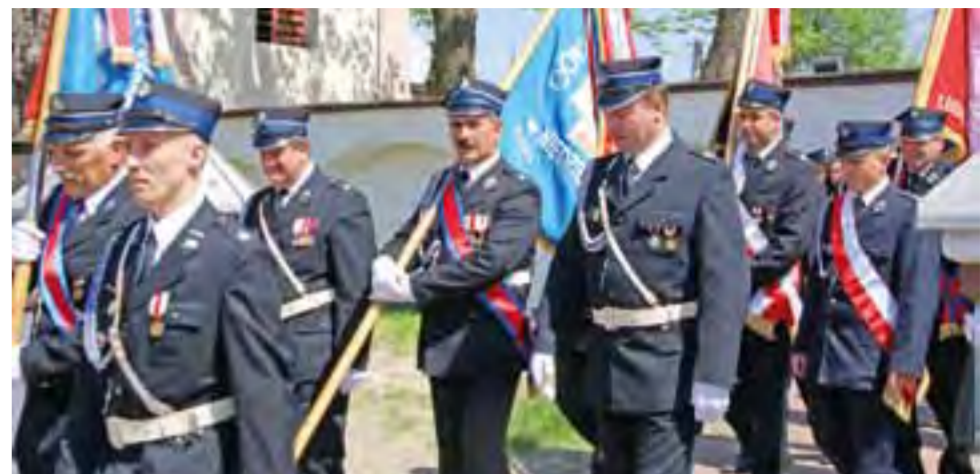
Przemarsz strażaków ze sztandarami z Kiernozii.

Od mszy świętej odprawionej 5 maja w intencji strażaków i za ojczyznę w kościele parafialnym rozpoczęły się w Kiernozii obchody Gminnego Dnia Strażaka. W modlitwę włączyli się nie tylko druhowie, ale również mieszkańcy gminy. Tuż po mszy świętej pocztą sztandarowe i druhowie w asyście orkiestry dętej z Kiernozii udali się na miejscowy cmentarz wojskowy, gdzie złożono wieńce i wianki kwiatów pod pomnikiem żołnierzy poległych w obronie ojczyzny w 1930 r. Odmówiona została tam modlitwa, po której strażacy przemarszerowali do parku. Czekal tam na nich grill i inne przysmaki.