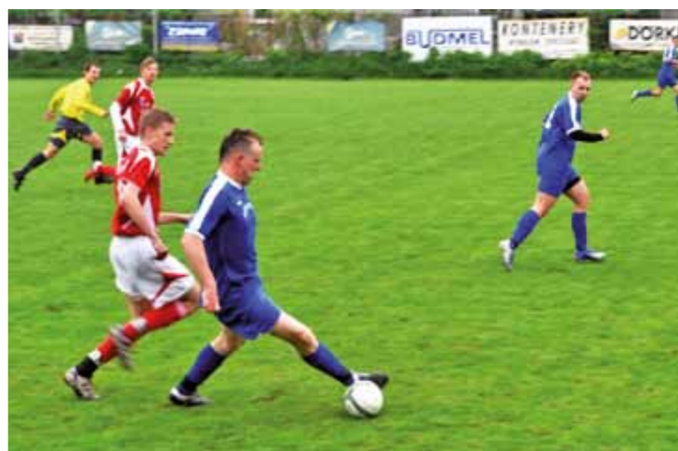
Piłkarze rezerwy Strykowa (niebieskie stroje) cały czas wierzą, że uda im się wywalczyć awans do klasy okręgowej.

Następna, 19. kolejka odbędzie się 18-19 maja: Huragan Szwedów - Kotan Ozorków, Błękitni Dmosin - Zjednoczeni II Stryków, Orzeł II Parzczew - LZS Justynów, Malina Piątek - Struga Dobieszków, Zamek Skotniki - LKS Dąbrowka, LKS Sarnów - Nowosolna Łódź.