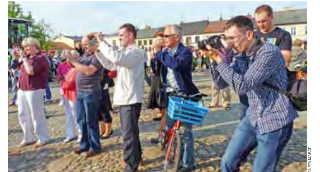
Ekipa TVP była bacznie podglądana przez łowiczanie. Wielu z nich przyszło na rynek z aparatami i robiło zdjęcia.