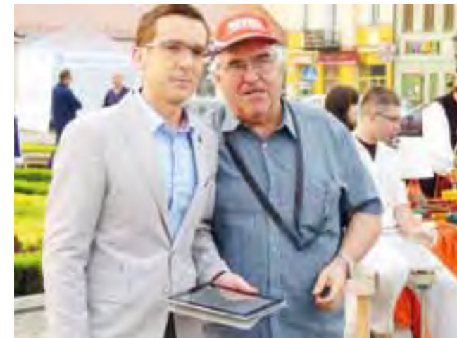
Łowiczanie chętnie robili sobie zdjęcia z dziennikarzem Maciejem Kurzajewskim.