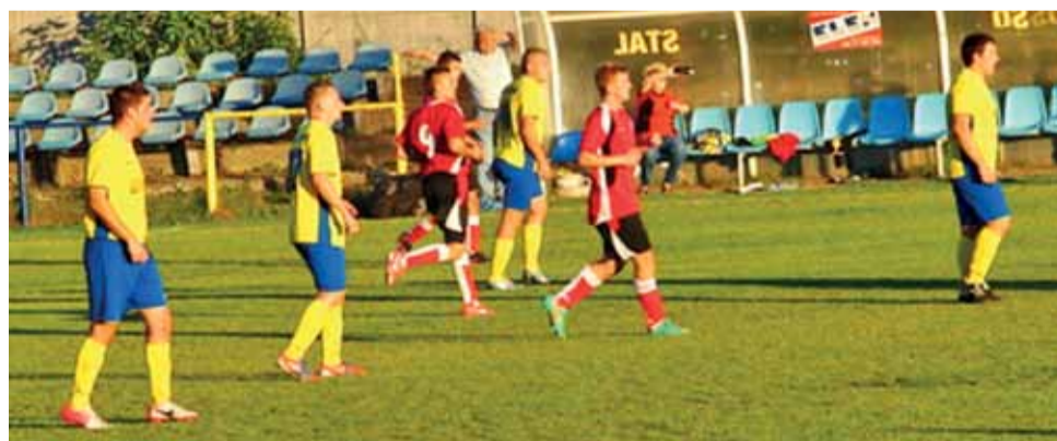
Tym razem piłkarze Stali Głowno (żółto-niebieskie stroje) pokazali dobrą grę i pokonali uniejowian.