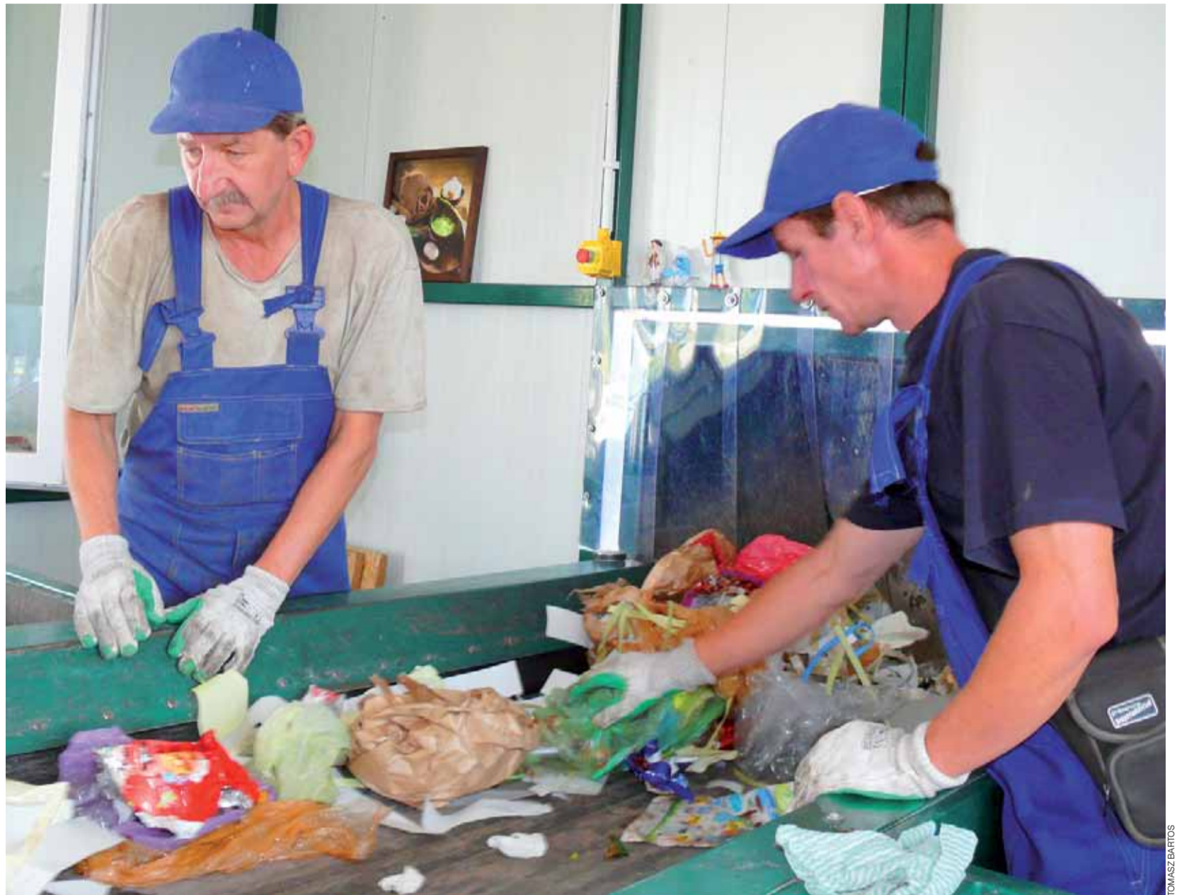
Wszystkie śmieci, jakie trafiają na wysypisko, są sortowane. Dzięki temu blisko połowa z nich nadaje się do ponownego wykorzystania.

Dawniej na terenie Belchowa odpady zmieszane trzeba było wrzucać do zielonych pojemników, natomiast szkło do pojemników tego samego koloru, ale z pomarańczową kłapą. Dlatego ci, którzy posiadają pojemniki na szkło, właśnie tam wrzucają opakowania szklane. Teraz na szkło i plastiki są przeznaczone jedynie worki. – Jeśli mieszkań-