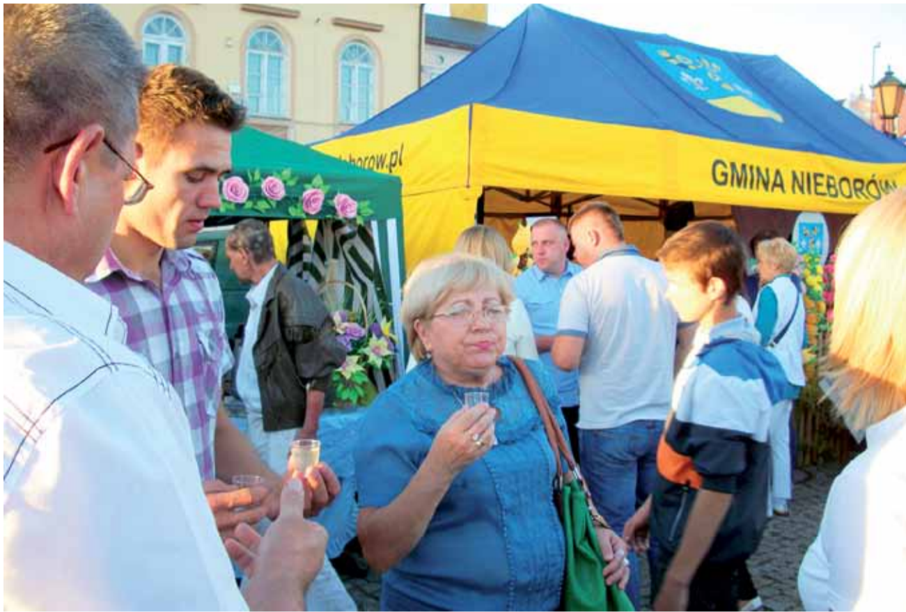
Nalewki serwowano na każdym niemal stoisku KGW - i próbowano chętnie

malinowa, śliwkowa, jabłkowa, mirabelkowa, wieloowocowa, jabłkowo-gruszkowa i jabłkowo-gruszkowo-śliwkowa) uznano, że najlepszą, nagrodzoną czekiem na 2.500 zł wiśniową, wykonały panie ze Strzelcewa.