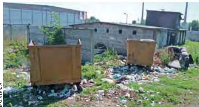
Teren wokół kontenerów jest cały zaśmiecony. W tle budynek, w którym niegdyś mieściły się toalety.

Ze sporym problemem będzie musiało uporać się miasto na niewielkim terenie przy ul. Sikorskiego w Głownie, gdzie znajdują się lokale komunalne. W miejscu, gdzie stoją kontenery na śmieci, odpady leżą w promieniu kilku metrów obok nich. Dodatkowo wiele rodzin pozbywa się w tym miejscu nieczystości.