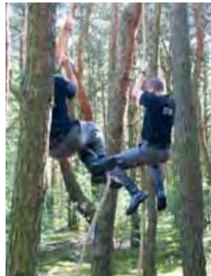
Wspinanie się po linach było jedną z najbardziej wyczerpujących konkurencji.