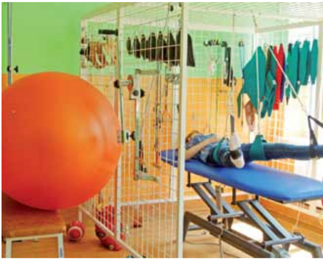
Sprzęt rehabilitacyjny w ośrodku prowadzonym przez „Nadzieję” dla wielu beneficjentów jest szansą, na którą długo czekali.