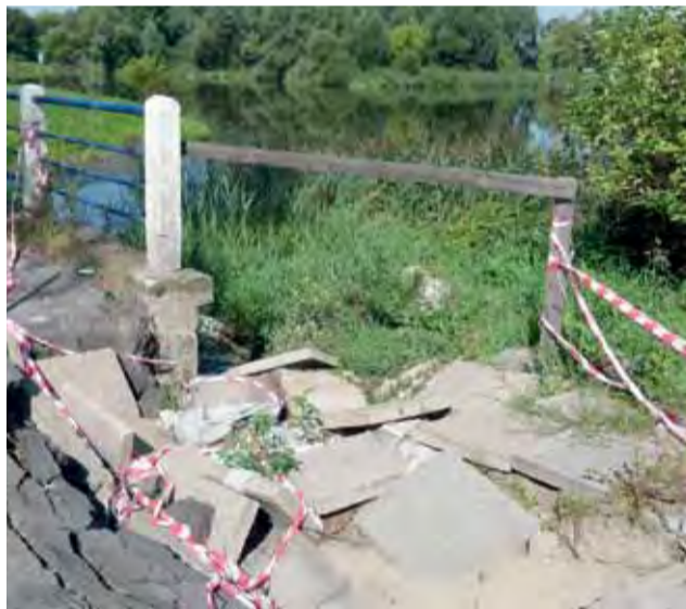
Zniszczony przyczółek mostu będzie naprawiony.

Na obie inwestycje miasto przeznaczy 420.000 zł. Naprawa mostu kosztować będzie 70.000 zł, a remont nawierzchni przy ul. Czackiego 350.000 zł. Pieniądze na te cele miasto wyasygnowało z wpływów budżetowych w postaci wadium w wysokości 1.000.000 zł wpłaconego przez Wyższą Szkołę Informatyki i Umiejętności w Łodzi w przetargu na zakup nieruchomości i sprzętu szpital-