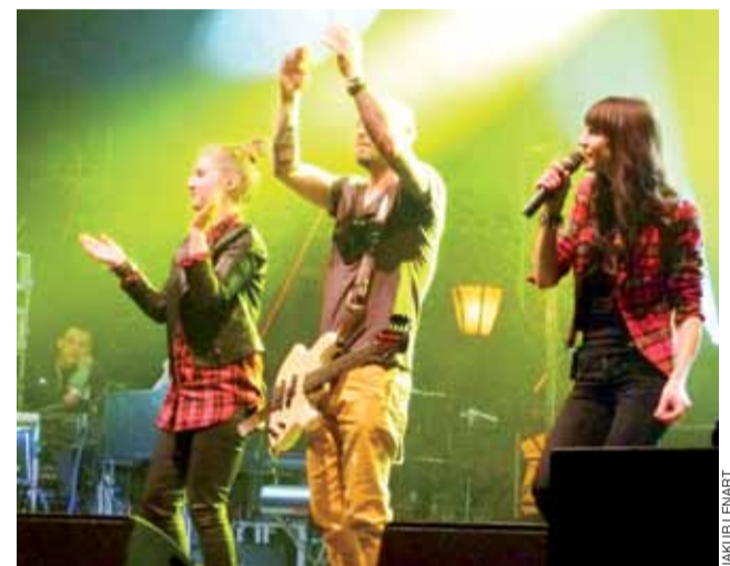
Sylwia Grzeszczak (z prawej) wraz z zespołem porwała publiczność do zabawy.