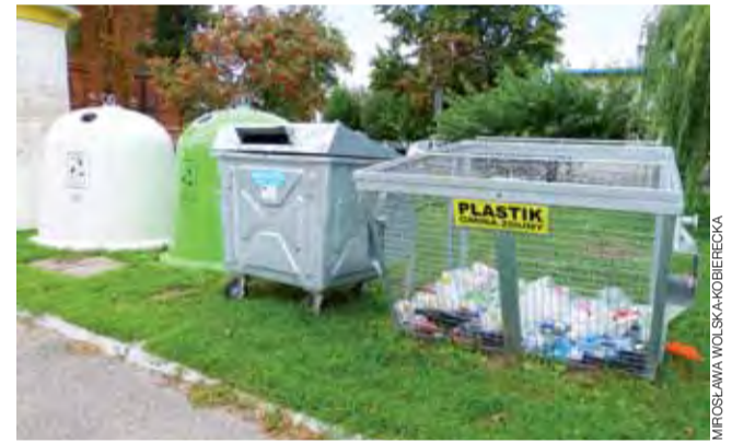
Jeden z kompletów pojemników stoi w Zdunach przy Urzędzie Gminy.

5 tys. zł, co miesięcznie stanowi 10% wszystkich należności. Pewną kwotę trzeba będzie przeznaczyć na ich windykację. Należy pamiętać, że gmina powinna zatrudnić osobę, która będzie zajmowała się sprawą śmieci i obsługą systemu, który w tym celu musiał zostać przez gminę zakupiony. Poza tym zbliża się nowy rok akademicki, zatem wójt przewiduje, że część mieszkańców zmieni swoje deklaracje z powodu wyjazdu potomstwa na studia, co spowoduje, że wpływ do kasy Urzędu Gminy z tytułu należności za wywóz odpadów zmniejszy się o ok. 2 tys. zł miesięcznie. Mimo tych zastrzeżeń bilans nie powinien być ujemny - a wielu się tego obawiało. mst