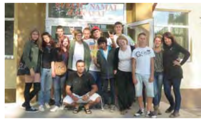
Uczestnicy projektu przed budynkiem litewskiego stowarzyszenia.