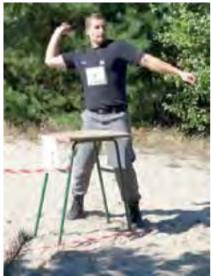
Startujący mieli za zadanie trafić granatem w wyznaczone na ziemi koło.

Problemy kadrowe, choć nie aż takie jak obecnie Wydział Ruchu Drogowego w Łowiczu, ma wiele komend w całym kraju. Powodem jest to, że tylko nieznaczny odsetek chętnych pomyślnie przechodzi testy. tm