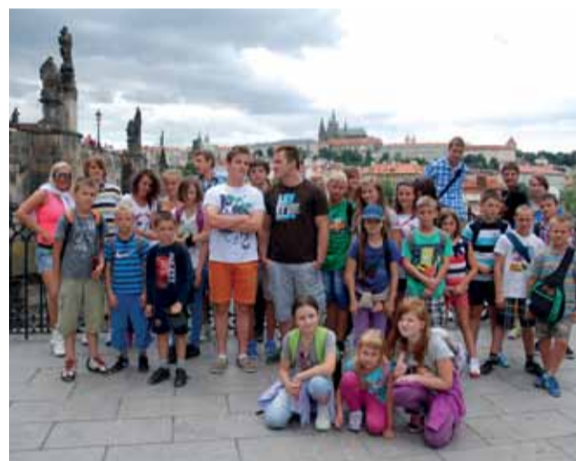
Wspólne zdjęcie uczestników letniego obozu.

Kolejnym ważnym wydarzeniem tych wakacji było wręc-