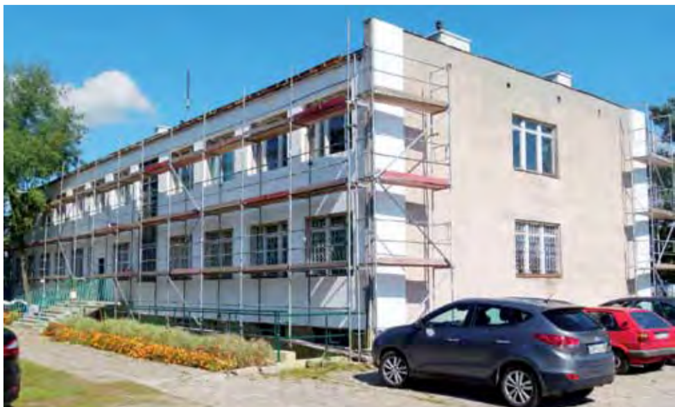
Remont w Remedium. Stan na 10 września.