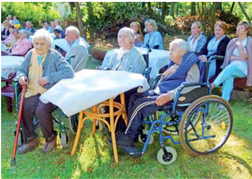
Pensjonariusze oglądają występy. 16-lecie DPS-u w Głownie.

- Wiedziałam, że są to uczciwe i odpowiedzialne osoby, że będą dalej prowadzić ten dom, a pensjonariuszom nie będzie źle i takie mam wrażenie. Najgor-