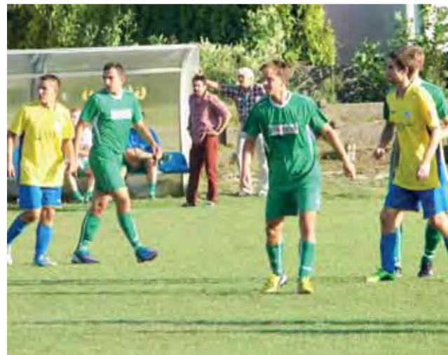
Stal Głowno (żółte koszulki) po zwycięstwie nad Termami Uniejów awansowała o kilka pozycji w tabeli V ligi.

7. kolejka – 11 września. Następną, 8. kolejka odbędzie się 14-15 września: LKS Mierzyn – KS Paradyż, Concordia Piotrków Trybunalski – Orzeł Nieborów, Włókniarz Moszczenica – Czarni Rząśnia, Astoria Szczerców – Ner Poddębice, Zjednoczeni Stryków – Warta Działoszyn, Widok Skierniewice – Włókniarz Zelów, Jutrzenka Warta – Pilica Przedbórz, ŁKS Łódź – Boruta Zgierz, Start Brzeziny – Zawisza Pajęczno, Pogoń-Ekolog Zduńska Wola – pauza.