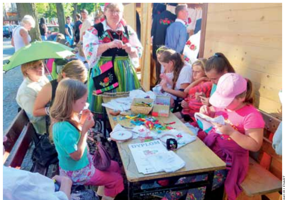
Zainteresowaniem cieszyły się także warsztaty ludowe