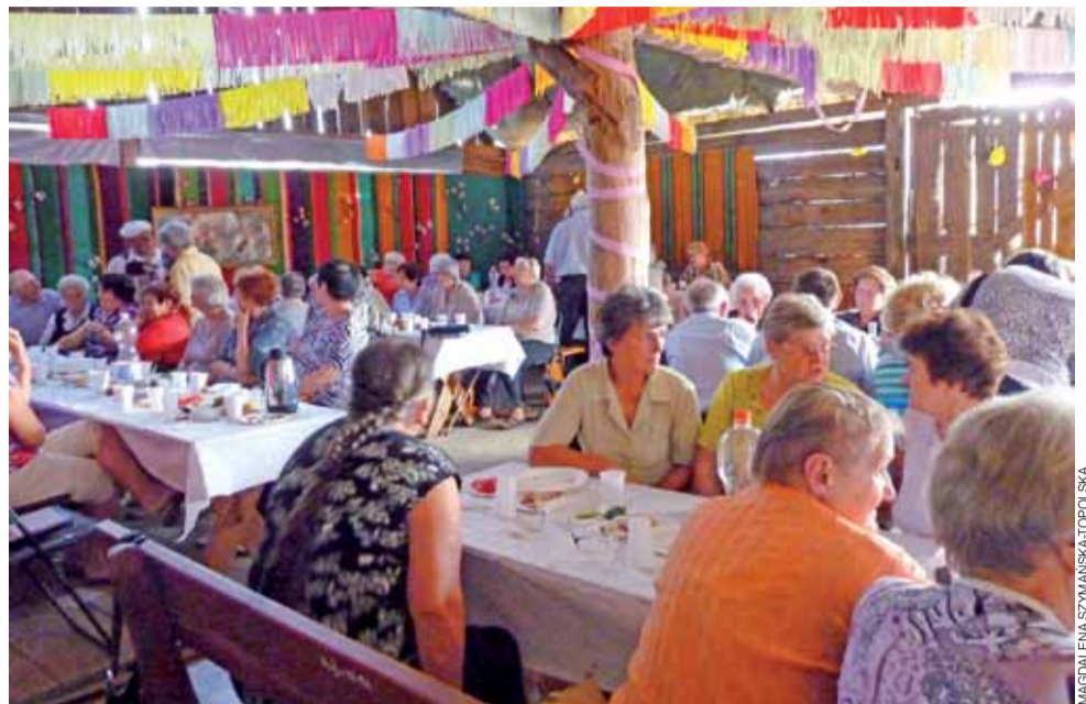
W maurzyckim skansenie bawiła się ponad setka seniorów z gminy Zduny.