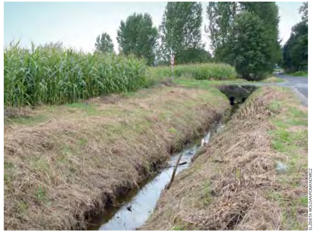
Struga Domaradzka. Tu prace konserwacyjne przeprowadzono jeszcze w sierpniu.

W każdym przypadku konserwacja polega na wykaszaniu i odkrzaczaniu skarp oraz hakowaniu, czyli wrywaniu roślin z dna. Ponadto oczyszczane