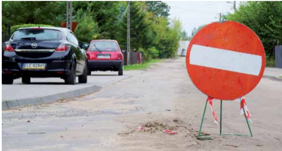
Skanalizowana, ale wciąż nieprzejezdna. ulica Czackiego czeka na odtworzenie nawierzchni.

W trakcie budowy kanalizacji okazało się, że stary i spękany asfalt na Czackiego położony był bez podbudowy na żużlu i uzupełnienie nowym dywanikiem tylko wyciętego fragmentu, miałyby się z celem. Nawierzchnia ulicy, przy której znajdują się m.in. działki inwestycyjne, jest użytkowana m.in. przez ciężkie pojazdy i powierzchnie odtworzone, na pewno szybko uległyby dewastacji. Dlatego władzom miejskim zależy na gruntownej odbudowie tej drogi, czyli wykonaniu jej praktycznie od podstaw. Po zdjęciu resztek starego asfaltu, ulica Czackiego ma zostać wykończona, a asfalt ma być położony dopiero na solidnej podbudowie z kamieni. Do tego czasu droga zostanie wyłączona z ruchu, choć teraz mieszkańcy mogą dojechać do swoich domów.