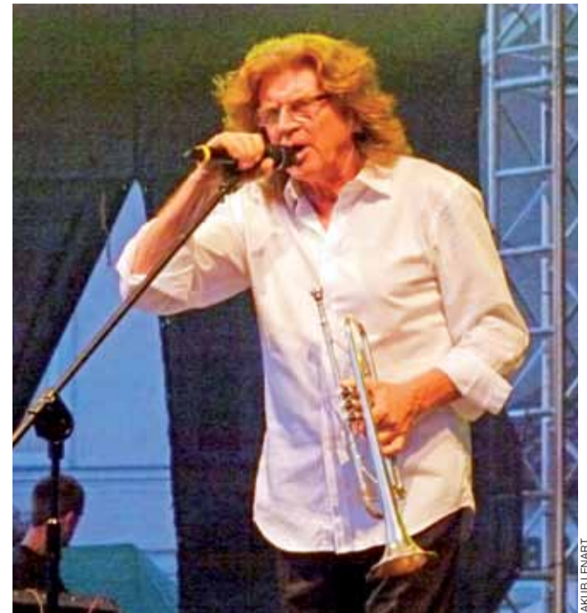
Zbigniew Wodecki zaśpiewał swoje znane przeboje takie jak „Pszczółka Maja”

Artur Michalak nie chciał na razie mówić, ile kosztowało tegoroczne Księżackie Jadło. – Będzie to wiadomo dopiero za około miesiąc – mówi. – Czekamy, aż spłyną wszystkie rachunki. Budżet imprezy wynosił jednak 135.000 zł. Naczelnik podkreślił, że na tegoroczną imprezę udało się uzyskać 40.000 zł dofinansowania z Unii Europejskiej. Pozyskano też sponsorów, którzy przekazali 25.000 zł.