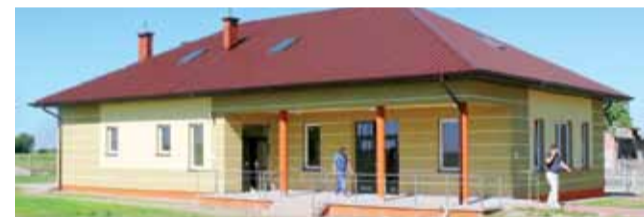
Świetlica wiejska w Karolewie jest już prawie gotowa.

Atrakcją rajdu będzie udział członków Stowarzyszenia Historycznego im. 10 Pułku Piechoty z Łowicza, którzy pojedą z turyściami w mundurach formacji i na odtworzonych przez nich rowerach, które żołnierze mieli na wyposażeniu we wrześniu 1939 roku. tb