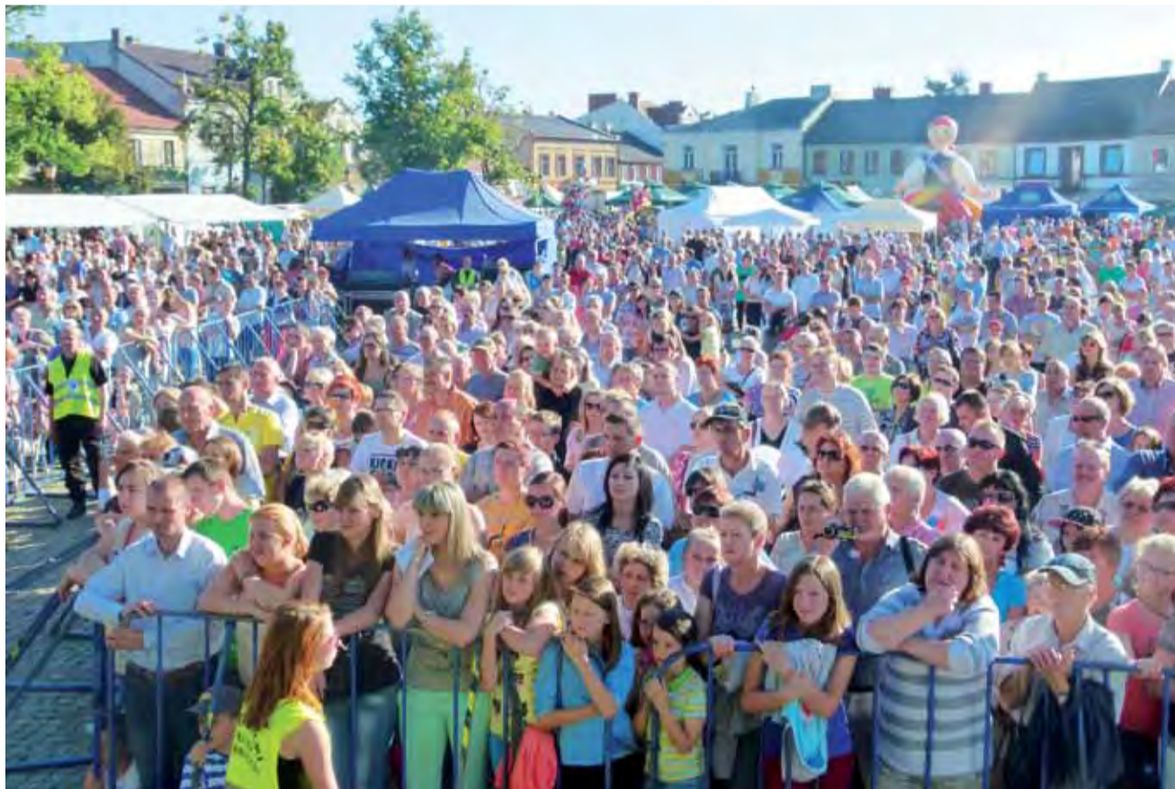
Nowy Rynek był przez większą część imprezy pełen ludzi

Praktycznie zaraz po rozpoczęciu jury, pod przewodnictwem znanego doskonale z występów w telewizyjnych programach kulinarnych takich jak „Pascal: Po prostu gotuj!” stacji TVN kucharza francuskiego pochodzenia Pascala Brodnickiego, w skład którego wchodził także m.in. burmistrz Kaliński, prze-