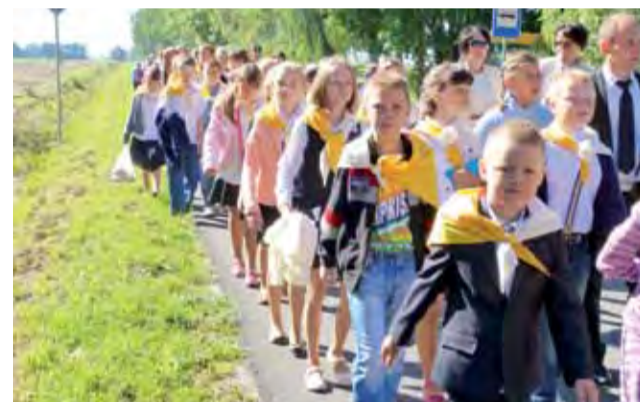
Uczniowie szkół podstawowych w Bielawach (na zdjęciu) i w Rydzynie maszerują pod pomnik swoich patronów.

z powodów politycznych, byli zmuszani do przymusowej służby w kopalniach. Wcześniej przeżyli II wojnę światową, którą wciąż noszą w pamięci.