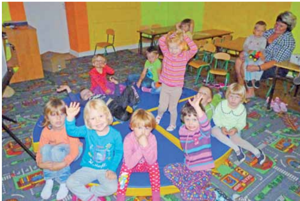
Dzieci zapisane do punktu przedszkolnego w Dąbkowicach są bardzo śmiałe i radosne.