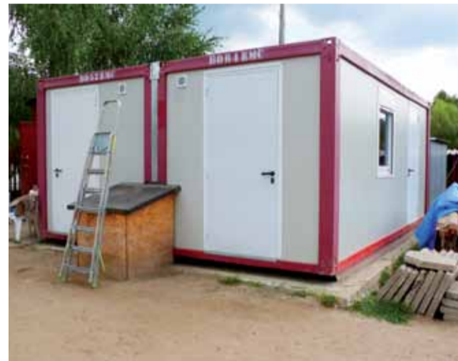
Kontenery w przytulisku. Po piśmie „Arkadii” coś zaczęło się dziać. W miniony czwartek do obiektów podłączono prąd.