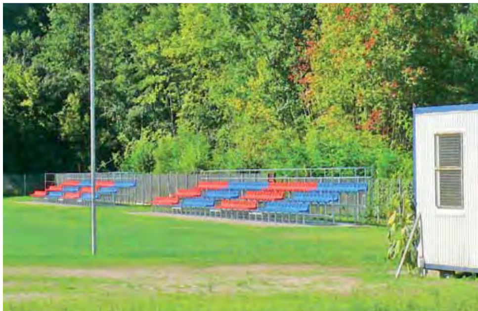
Nowe trybuny czekają na kibiców, ale ci, podobnie jak piłkarze, wejdą na boisko w Bobrownikach dopiero w przyszłym roku, gdy na murawie zakorzeni się trawa.