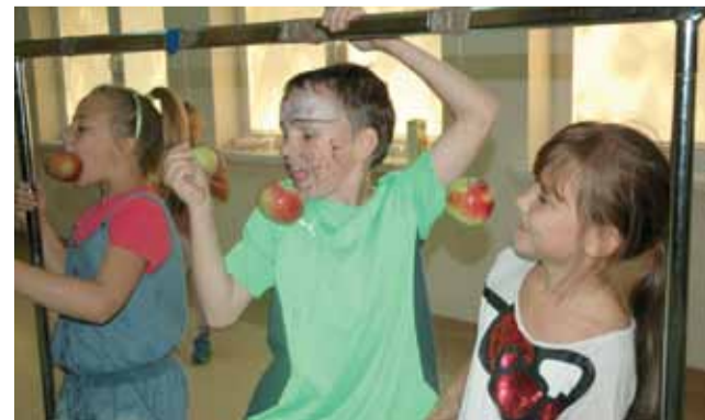
Zabawa na 102! Konkurs sprawnościowy.

nej paletce czy wykonać psa z balonika. Każdy, kto brał udział w zajęciach wakacyjnych organizowanych przez Dom Kultury, otrzymał pamiątkowy dyplom i drobny upominek. ewr