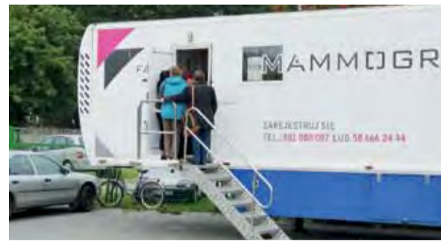
Mammografia w Głownie cieszyła się ogromnym zainteresowaniem.

Na badania nie obowiązuje rejestracja. Z badań, które odbędą się w Strykowie, mogą skorzystać wszystkie panie, które wcześniej dokonały zapisu, obojętnie od miejsca zamieszkania. kl