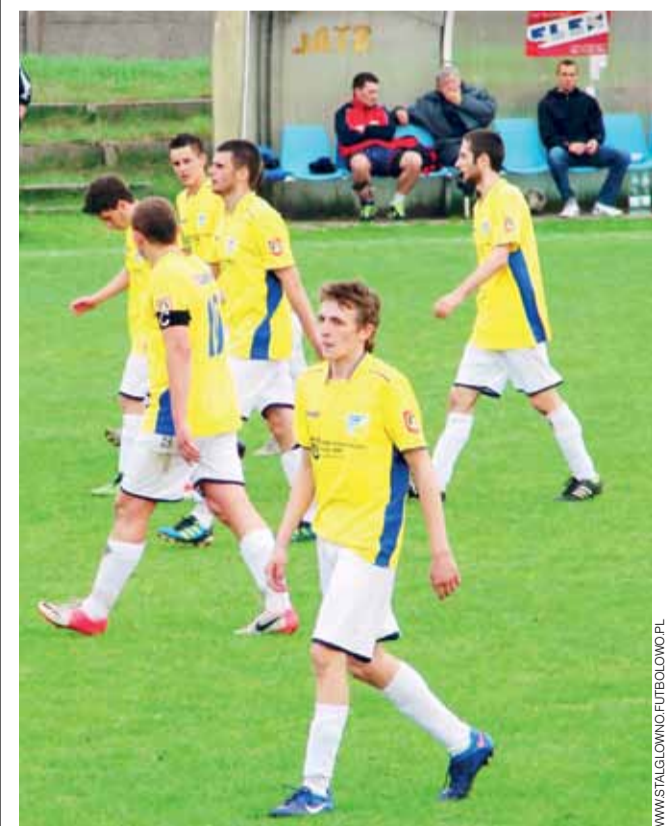
Piłkarze Stali Głowno mogą odetchnąć z ulgą po zwycięstwie nad Victorią Łódź i awansie do kolejnej rundy Pucharu Polski Okręgu Łódzkiego.