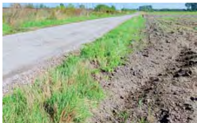
Dokładnie w tym miejscu samochód wjechał na pole, po czym kilkakrotnie koziołkował. Świadczą o tym m.in. kawałki potłuczonego szkła z reflektorów i szyby – i brudza w ziemi.