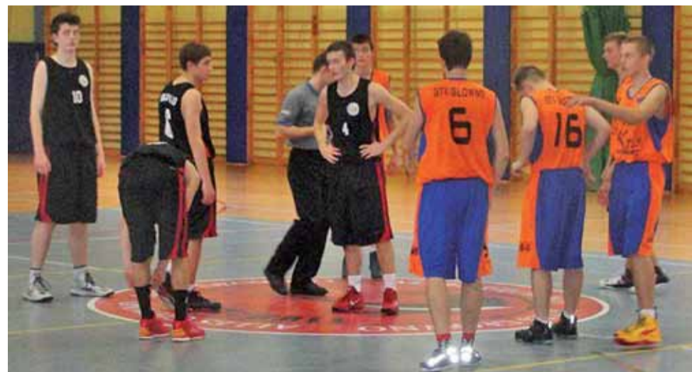
Zawodnicy GTK Głowno (pomarańczowe koszulki) mają nadzieję, że z meczu na mecz ich gra będzie wyglądać coraz lepiej.

W sobotę, 26 października w Miejskiej Hali Sportowo-Widowskiej przy Szkole Podstawowej nr 2 w Głownie odbyły się dwa ligowe spotkania z udziałem KS GTK Głowno. O godz. 10:00 na parkiet wybiegła młodsza drużyna Głowna do lat 14. GTK niestety nie sprostało SKS Start II Łódź i wciąż pozostaje bez zwycięstwa w lidze. Po pierwszej kwarcie wydawało się, że młodzi głownianie są na