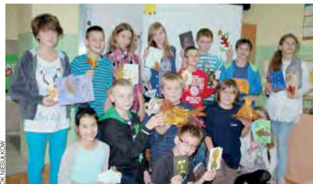
Uczniowie SP Dobra prezentują efekty kilkugodzinnych warsztatów.

dostarczyć, wprawdzie ogólnej i stereotypowej, ale jednak wiedzy o tym, co, jak, a przede wszystkim – o czym niekiedy myślą ich partnerzy. ewr