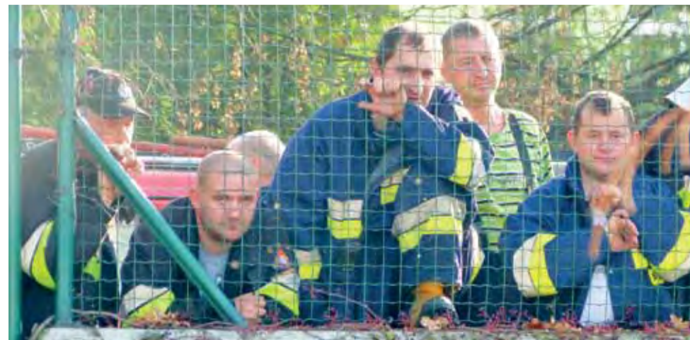
Strażacy z zainteresowaniem obserwują i dopingują poczynania kolegów sprawdzających swoje umiejętności ratownicze.