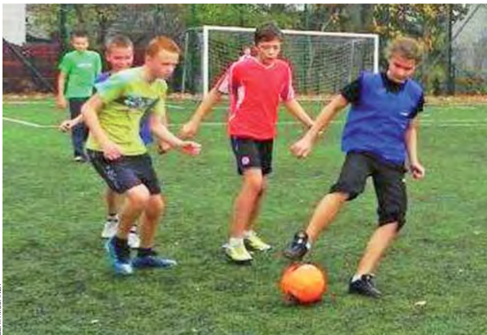
Turnieje Piłki Nożnej w Głownie zawsze cieszą się dużą popularnością.