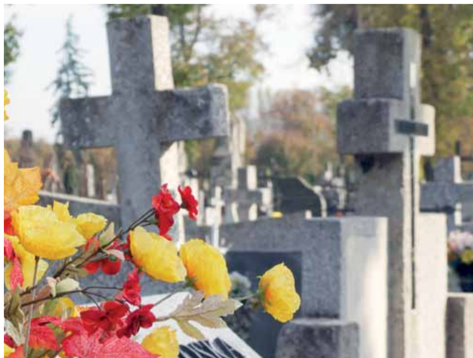
Wszystkich Świętych to dzień zadumy, refleksji i wspomnień o tych, którzy odeszli na zawsze.

Zmarła 28 czerwca 2013 r., w wieku 94 lat. W czasie II wojny światowej aktywna członkini Związku Kobiet Czynu Armii Krajowej. W 1944 r. nagrodzona za zasługi stopniem podporucznika i Srebrnym Krzyżem Zasługi z Mieczami. Ukończyła 3-letnie Studium Nauczycielskie