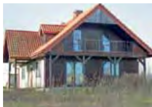
Dom przy ul. Wczasowej czeka na uregulowanie formalności.

Gmina wypłaciła właścicielce ok. 600 tys. zł, a sama weszła w ponowne posiadanie nieruchomości. Do tej pory w tej sprawie brakowało jeszcze „kropki nad i” w postaci notarialnego przeniesienia własności. Po poniedziałkowym podjęciu uchwały formalność ta będzie mogła zostać