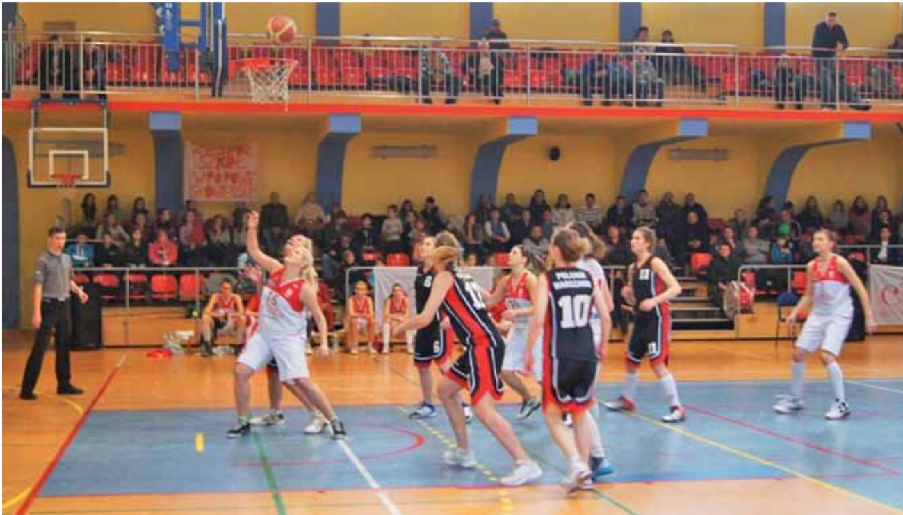
Polonia Warszawa (czarne stroje) okazała się zbyt mocna dla Alles-u.