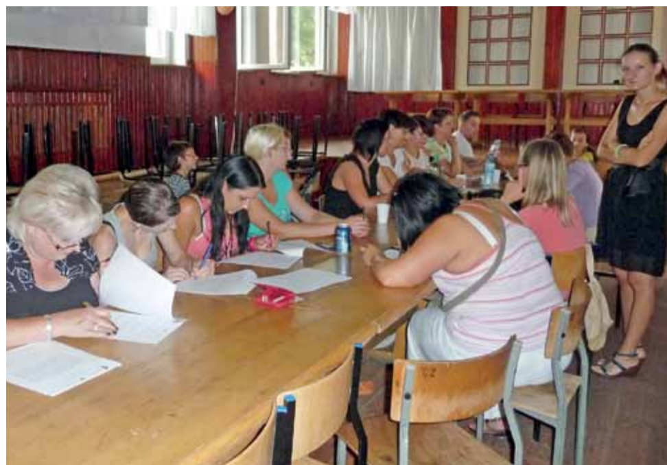
Szkolenie w ramach „Aktywnej integracji...”.

Otwarte dla głównian spoza środowiska podopiecznych MOPS były też sierpniowe spotkania dotyczące opieki nad małym dzieckiem. W tym cyklu czterech zajęć z położną i pielęgniarzką środowiskową uczestniczyło również 30 osób. Były w tym gronie zarówno przyszłe