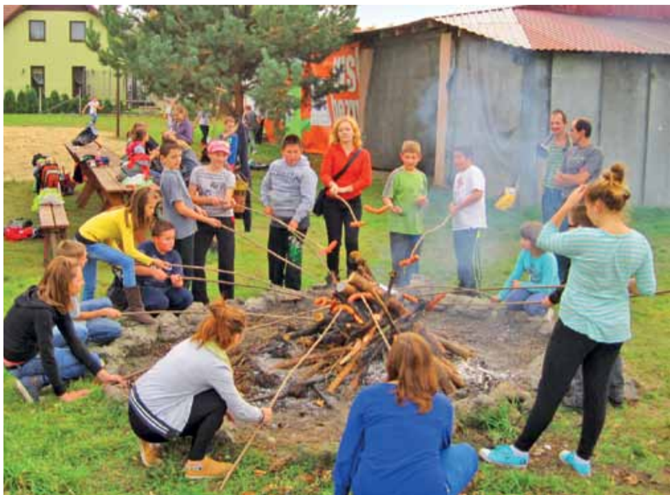
Smakowity finał rajdu. Ognisko z pieczeniem kielbasek.