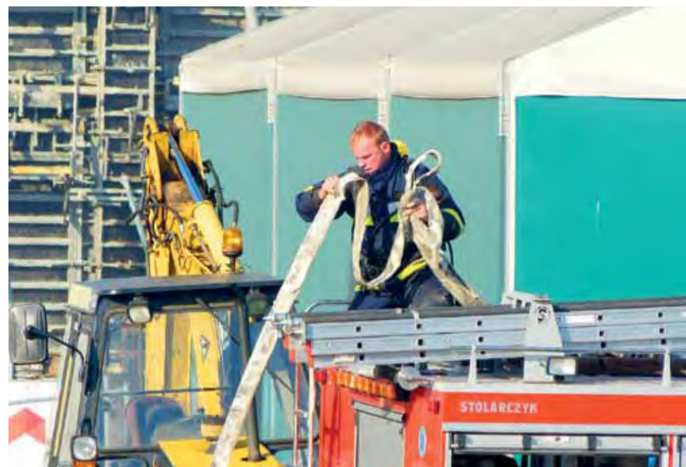
Sprawdzian wymagał dużej umiejętności współpracy i koordynacji poszczególnych zadań.

Straż pożarna | Powiatowe ćwiczenia w Łyszkowicach