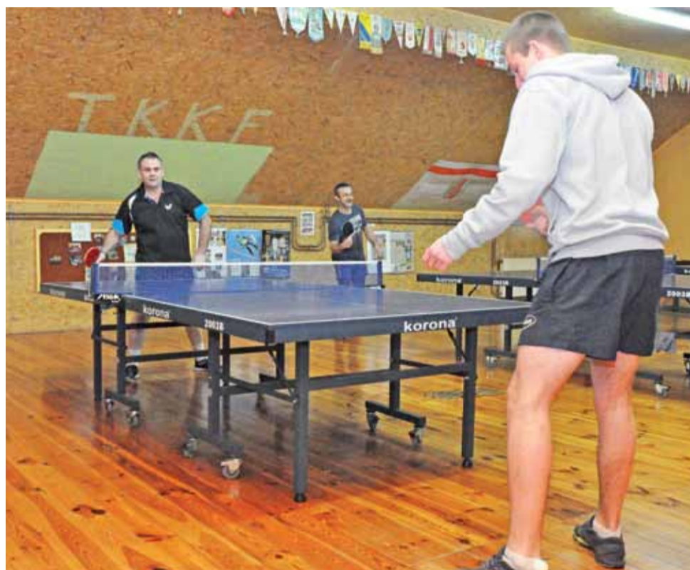
Teniści TKKF Expandora Głowno niestety przegrali kolejny mecz o mistrzostwo III ligi ŁLTSAiW