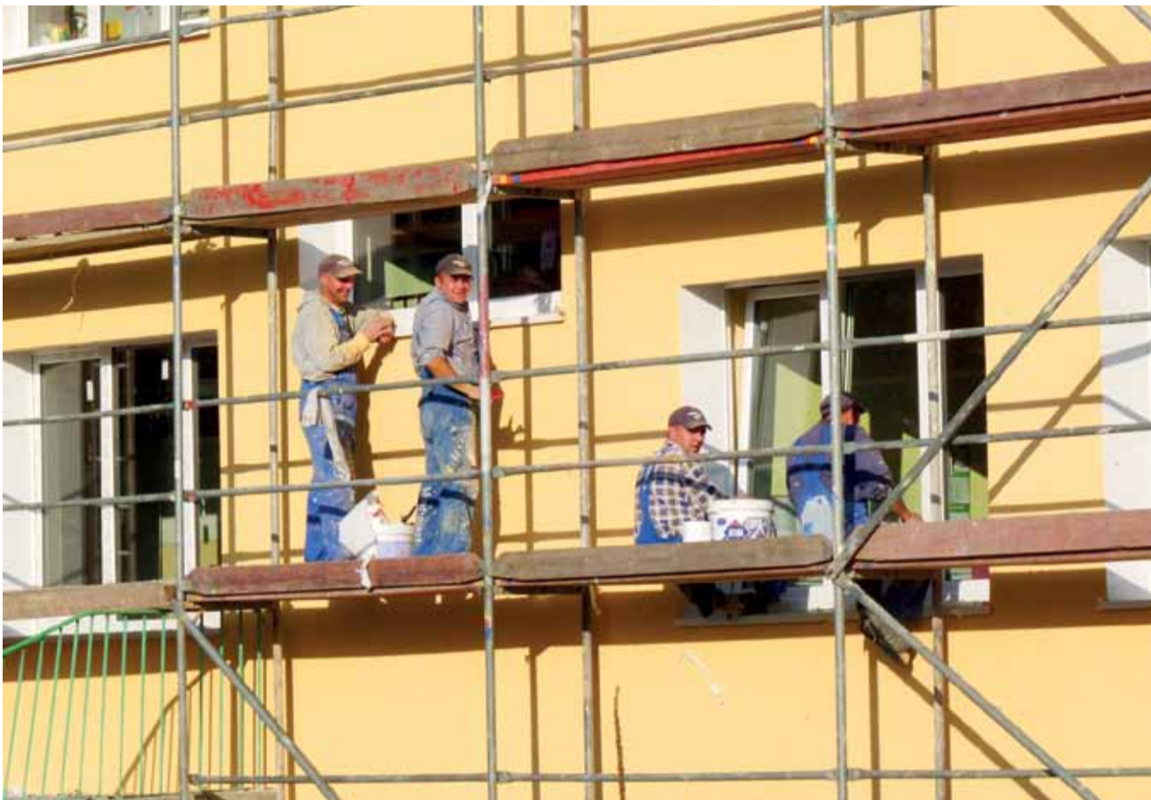
Ekipa Mont-Plastu na rusztowaniach. Głowieńska przychodnia NZOZ Remedium w procesie termomodernizacji, stan na 23 października.

Czy Stryków będzie płacił 2,1 mln zł „janosikowego”. str. 10