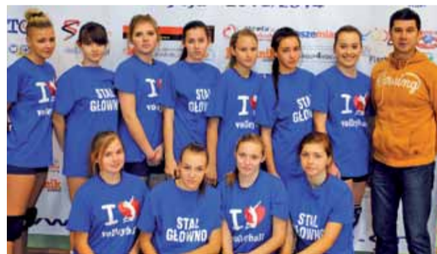
Mecze kobiecej siatkówki dostarczają kibicom nie mniejszych emocji niż spotkania w wykonaniu mężczyzn. Stal Głowno posiada w swoim klubie bardzo uzdolnione dziewczęta.

Głównianki prowadziły w spotkaniu już 2:0. Później jednak do głosu doszły łodzianki. Tsunami doprowadziło do tie-breaka, w którym jak