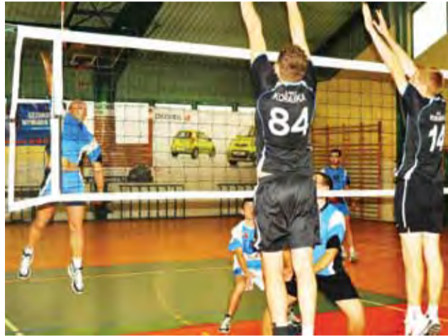
Blok UKS Korabki I będzie w tym sezonie trudny do przebicia.

■ Pijarska Łowicz – LKS Retki 0:3 (20:25, 15:25, 23:25)