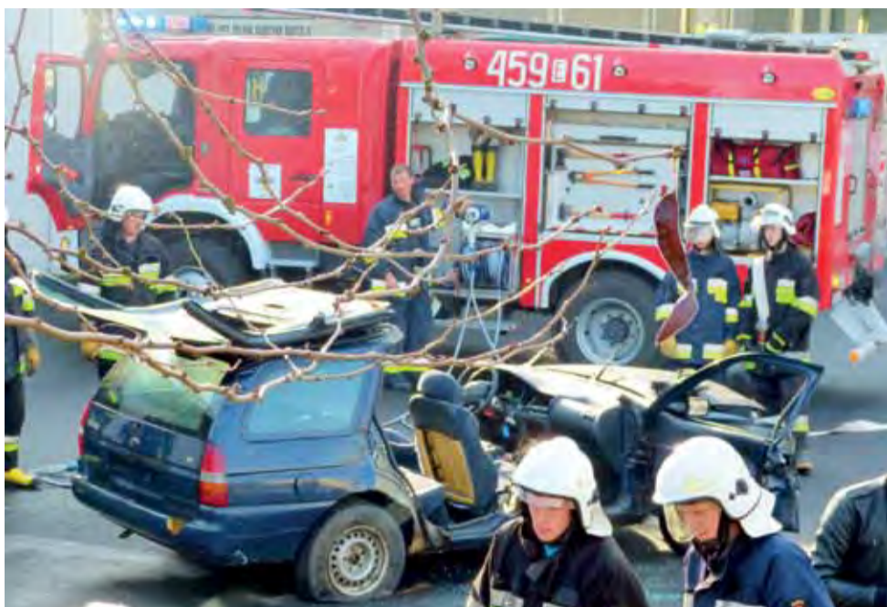
Symulacja wypadku samochodowego z wyciąganiem ze środka uwięzionej osoby.