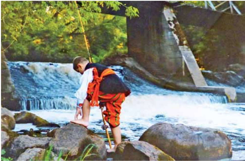
Praca A. Roźniaty „Obrazki znad Bzury”.

Łowicz | Powiatowy Konkurs Fotograficzny