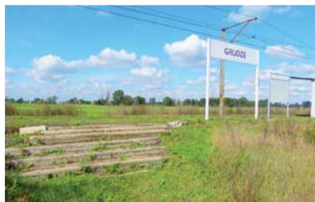
Schodki umożliwiające pasażerom dostanie się na przystanek.

ci będą zabiegać o przesunięcie przystanku, ale nie w miejsce, które wskazywał nam przedstawiciel PKP. Gdyby bowiem został on postawiony przy drodze wojewódzkiej, znalazłby się poza granicami Starych Grud, na których terenie leżał od dawna. Mieszkańcy tej miejscowości woleliby, aby nowy przystanek został ulokowany przy drodze powiatowej, biegnącej przez ich wieś, znacznie bliżej miejsca, w którym znajduje się obecny przystanek. Na ostateczne rozstrzygnięcia w tej kwestii trzeba będzie jednak jeszcze poczekać. ■