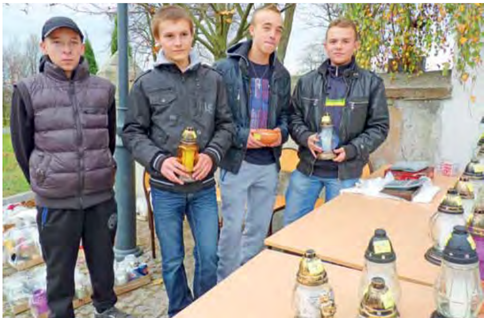
Gimnazjaliści aż do niedzieli sprzedawać będą znicze i akcesoria przy głównej bramie wejściowej na cmentarz w Dmosinie.