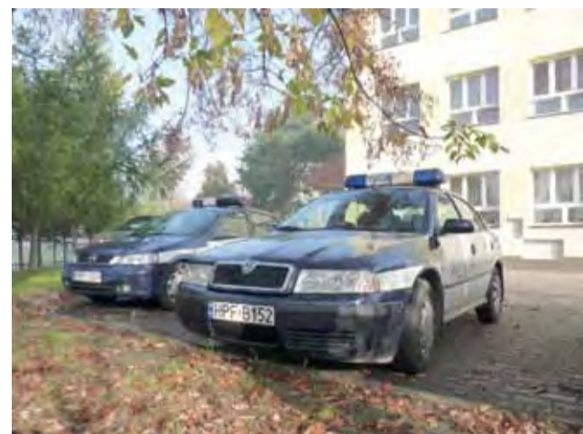
Radiowozy przed szkołą. W piątek 25 października w Gimnazjum w Bielawach pracował powiatowy zespół ds. nieletnich.

Nauczycielka z podstawówki obawia się, że gdyby nie wkroczyła w tym miejscu, agresor kopałby poszkodowanego bez opamiętania i skutki mogły być tragiczne. Przyznaje, że w nie poznała wcześniej drugoklasistę z Łazina, który do gimnazjum w Bielawach przyszedł po ukończeniu SP w Oszkovicach. Zna natomiast poszkodowane-