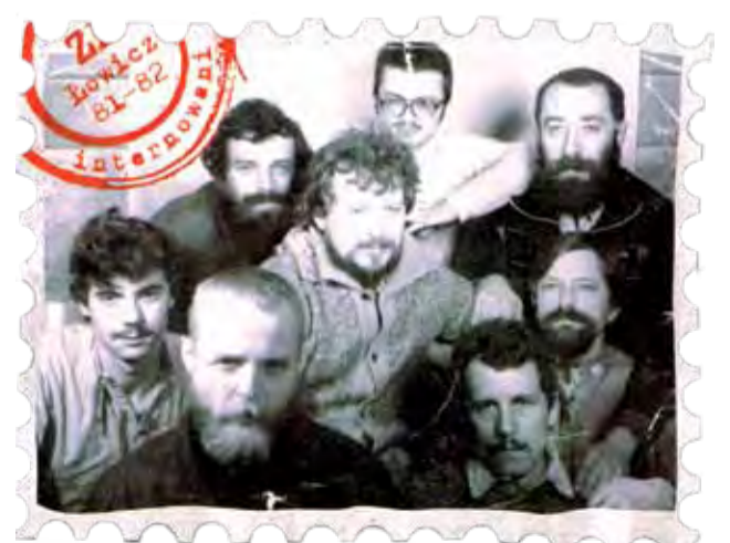
To właśnie zdjęcie było przyczynkiem do powstania filmu „Internowani”.

wiadane przez nich okazały się jednak tak ciekawe, że zdecydował się dotrzeć do następnych kilkunastu internowanych. – Może kiedyś powstanie z tego materiału serial dokumentalny... – marzy reżyser, przyznając, że to są plany mające szansę realizacji w bliżej nieokreślonej, odległej przyszłości. mwk