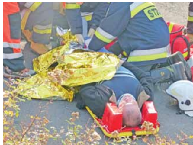
Ćwiczenia obejmowały też udzielanie pierwszej pomocy poszkodowanym.