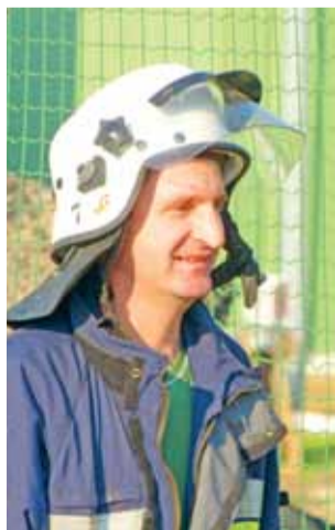
W przerwie pomiędzy ćwiczeniami.