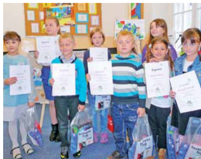
Laureaci klas I-III z dyplomami w nowej siedzibie biblioteki.