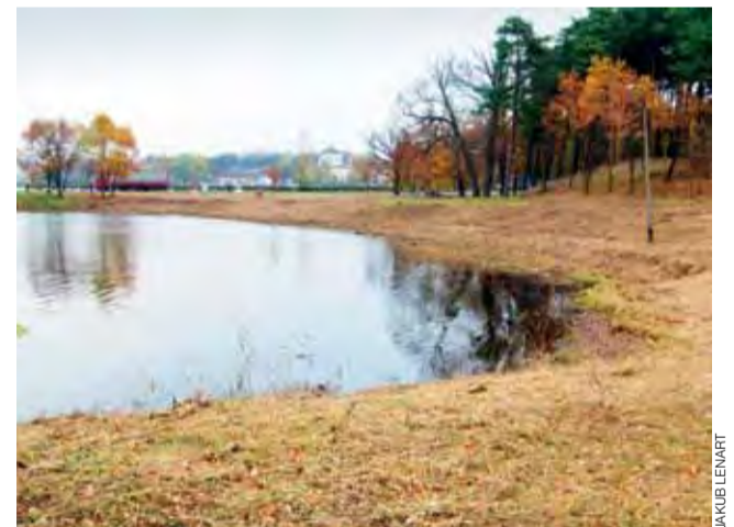
Brzezi zalewu Mrożyczka między ul. Plażową a DK14 zostały doprowadzone do porządku

Jak dowiedzieliśmy się w Referacie Infrastruktury Technicznej i Ochrony Środowiska, który dysponuje siłami pracowników robót publicznych, to nie koniec porządków nad zalewem. W najbliższym czasie podobne prace będą prowadzone wokół brzołów Mrożyczki znajdujących się wzdłuż przebiegu krajowej „14”. W ostatnim roku siła-