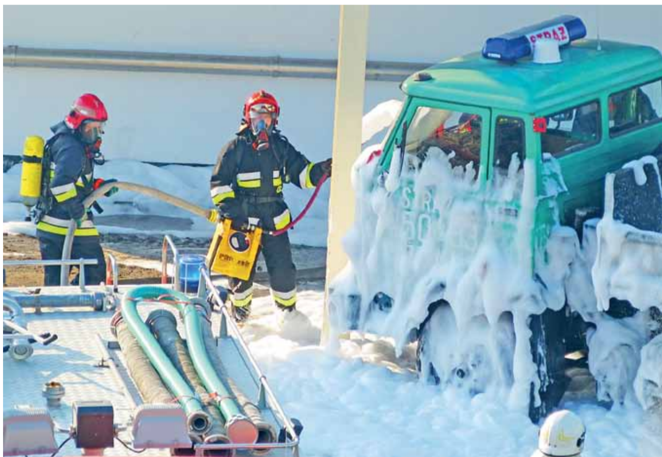
Przykład wykorzystania piany gaśniczej do gaszenia pożaru samochodu. Pianę tego typu stosuje się do gaszenia pożarów substancji i cieczy niereagujących z wodą.