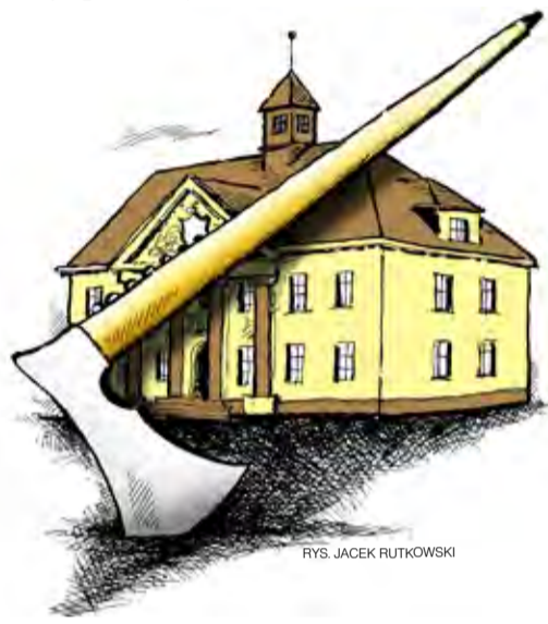
RYS. JACEK RUTKOWSKI

Początkowo do gminy Stryków dotarły informacje, że powinna w przyszłym roku zapłacić do budżetu państwa janosikowe rzędu 2,2 mln zł. Z ostatecznych wyliczeń wynika, że będzie to nieco mniej, bo 2.139.872 zł. – Okazało się, że wzrosła nam liczba mieszkańców, miał 12.316 osób, mamy ich teraz 12.431 – mówi skarbnik Barbara Walak. Różnica w wysokości 60 tys. zł to jednak niewielkie pocieszenie, biorąc pod uwagę ogromny skok wysokości janosikowego w stosunku do lat ubiegłych. W ubiegłym roku gmina zapłaciła go 891 tys.