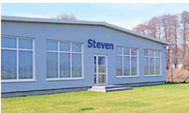
Zakład firmy Steven widziany z zewnątrz.

Właściciel chwali współpracę z władzami gm. Łowicz. Dobrze czuje się też wśród społeczności Jamna. W rozmowie z nami przyznał, że wybranie tej lokalizacji na biznes było „strzałem w dziesiątkę”. ■