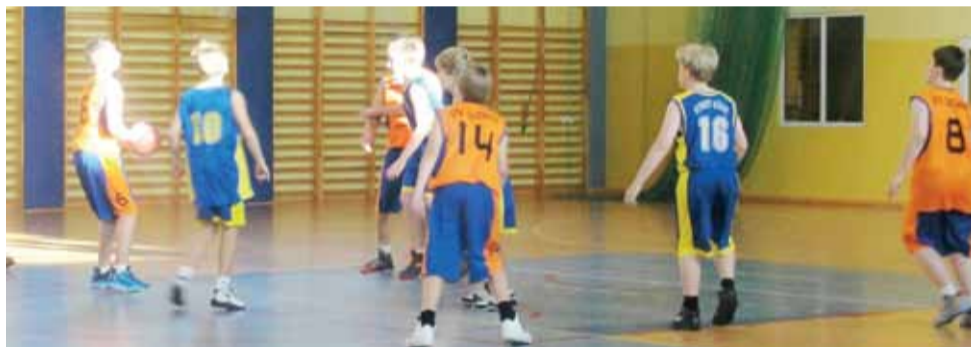
Zawodnicy GTK Głowno U-14 (pomarańczowe koszulki) dają z siebie wszystko podczas każdego spotkania.

Następna, 5. kolejka odbędzie się 24 listopada: LUKS Trójka Sieradz - UKS Basket I Aleksandrów Łódzki, ŁKS KK Łódź - MKS Kutno, Widzew I Łódź - TK Alles Głowno (10:00), UKS Orlik Ujazd - pauza.