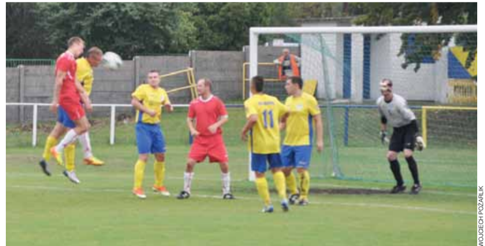
Gracze Stali Głowno (żółte koszulki) muszą wykluczyć ze swojej gry takie wpadki jak ta z Justynowem.