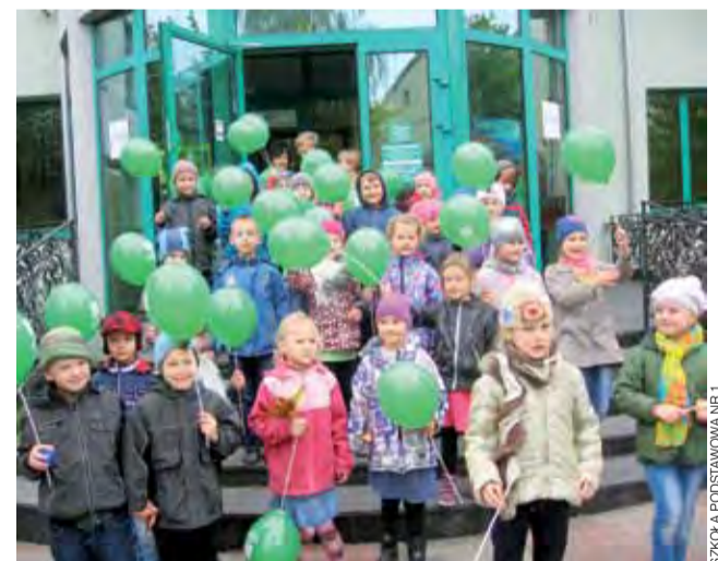
Uczniowie pierwszej klasy głowieńskiej Szkoły Podstawowej nr 1 pod koniec października odwiedzili Bank Spółdzielczy w Głownie. W placówce pierwszaki zapoznawały się ze specyfiką pracy w banku i dowiedziały się ciekawych informacji na temat oszczędzania i wartości pieniądza. Nie obyło się też bez obustronnych upominków. Dzieci otrzymały słodczyce i balony, a bank specjalnie przygotowaną na tę okazję pracę plastyczną. kl