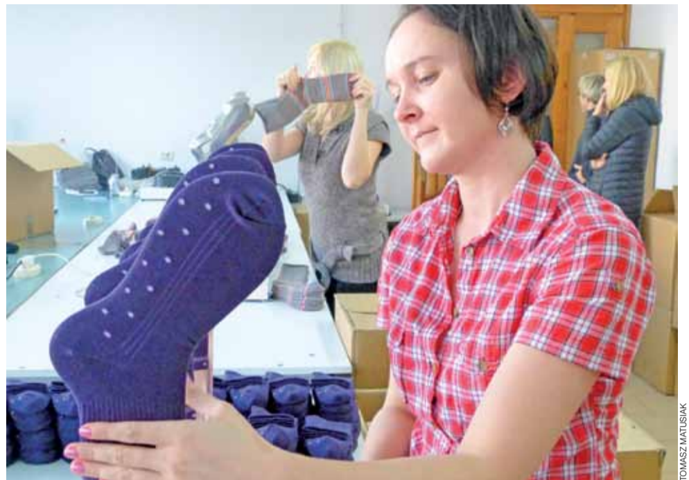
Nawet nowoczesne maszyny nie zastąpią we wszystkim ludzkich rąk.

Gospodarka | Dwie firmy z okolic Łowicza: Steven i SOX, zaprezentowano w telewizji Polsat