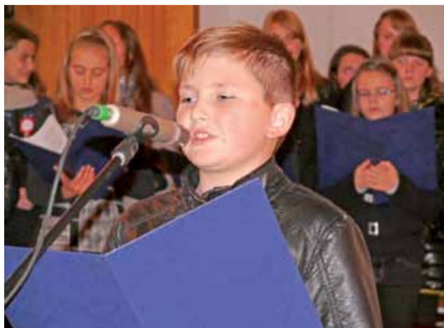
Pieśni i wiersze wykonywali członkowie grupy teatralnej Eureka z Zespołu Szkół Licealno-Gimnazjalnych oraz Szkoły Podstawowej nr 3 (na zdjęciu).