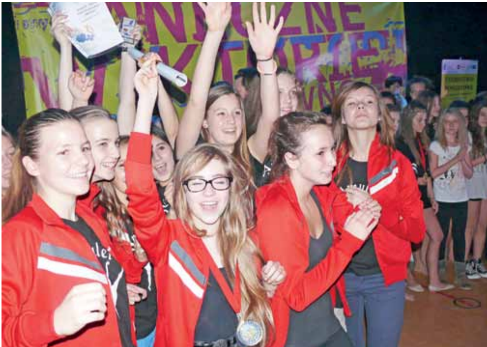
Radość dziewczyn z zespołu Amulat z Pałacu Młodzieży w Bydgoszczy za zajęcia pierwszego miejsca w grupie wiekowej 13 - 16 lat, kategorii tańca współczesnego.