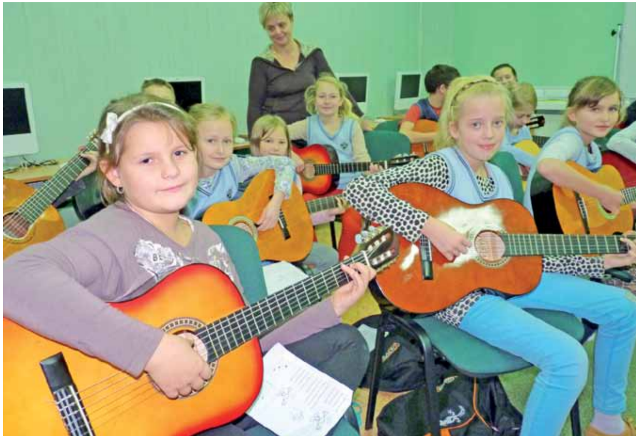
Kółko gitarowe w Niesułkowie zaczęło od dwóch uczniów, dziś jest ich ponad dwudziestu i z roku na rok przybywa.

Jednak nie tylko rodzinne pasje i chęć bycia ponownie wśród grupy występujących na scenie rówieśników zachęca do nauki gry na gitarze. Rolę odgrywa również sposób prowadzenia zajęć. Czas spędzony na próbach owocuje na wiele sposobów. Dzieci uczą się gry i śpiewu, ale także języka, bo zazwyczaj śpiewają po angielsku. Mają tylko godzinę zajęć w tygodniu w ramach świetlicy szkolnej.