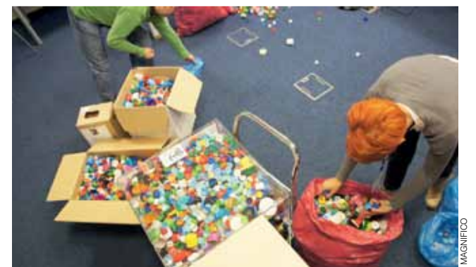
Podsumowanie akcji zbierania nakrętek.

Obecnie Corning przygotowuje się do dostosowania powierzchni fabryki do potrzeb osób niepełnosprawnych ruchowo. ljs