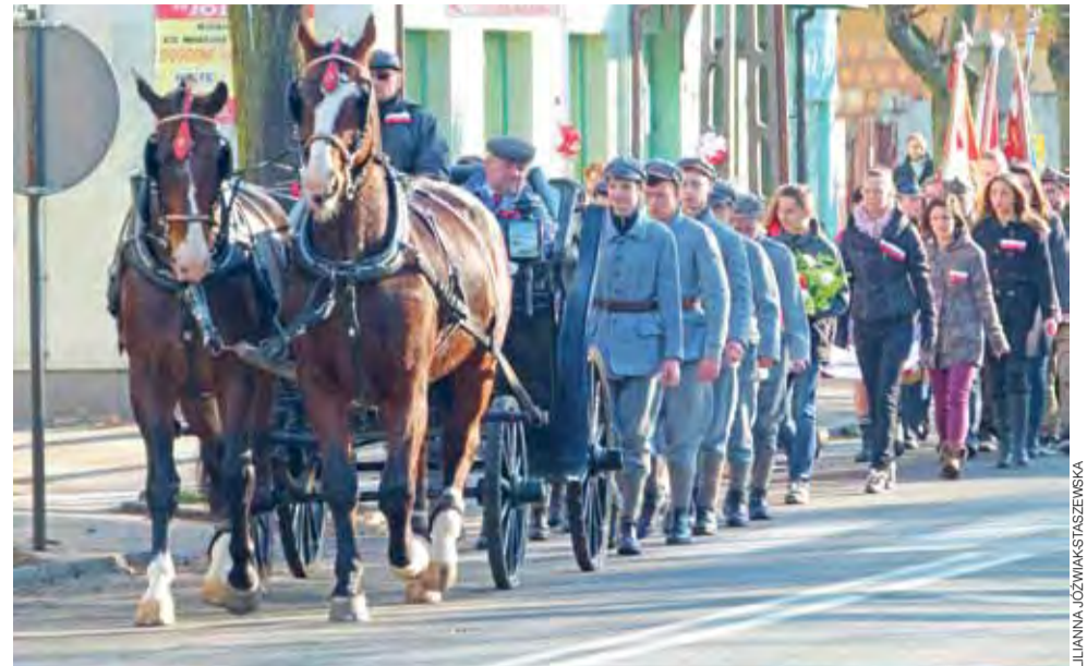
Tegorocznym obchodom Święta Niepodległości towarzyszył Marsz dla Niepodległej.

10 listopada, już po zakończeniu gry, w kościele pw. św. Maksymiliana w Głownie we współpracy z Zabrzańskim Stowarzyszeniem św. Jana Bosko odbył się z kolei Wieczór Poezji i Pieśni Patriotycznej. O nim piszemy osobno na stronie 7. kl