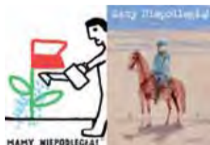
Projekt Piotr Młodożeniec oraz Józef Wilkoń.

Od 4 do 11 listopada drużyny i druhowie z łowickiego Hufca ZHP uczestniczyli w ogólnopolskiej akcji „Mamy Niepodległość!”, którą zorganizowało Muzeum Józefa Piłsudskiego w Sulejówku.