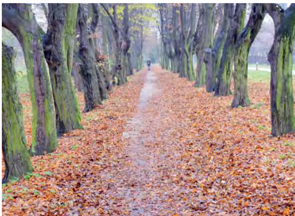
Spacer chodnikiem przy ul. Wigury nie należy jesienią do najłatwiejszych.

Tytułowe zdanie wydaje się być oczywiste. Jak się jednak okazuje, w przypadku ulicy Wigury w Głownie wcale tak nie jest. Tutaj znaczna część pieszych chodzi właśnie ulicą, a nie pobliskim chodnikiem. To z kolei bardzo denerwuje kierowców, którzy muszą ich omijać i wzmacniają koncentrację jeszcze bardziej niż zwykle.