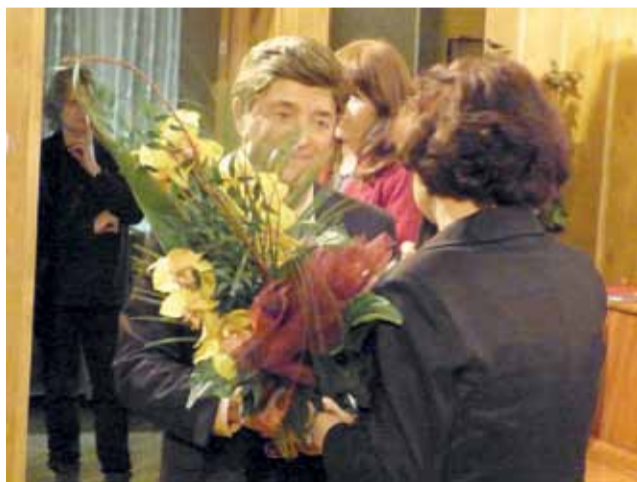
Jerzy Połomski przyjmuje podziękowania.

Koncert Jerzego Połomskiego w Domu Kultury był główną atrakcją Dnia Seniora obchodzonego w Strykowie 9 listopada. Publiczność, złożona w zdecydowanej większości z przedstawicieli starszego pokolenia, dopisała - sala wypełniona była po brzegi, zabrakło nawet wolnych miejsc siedzących.