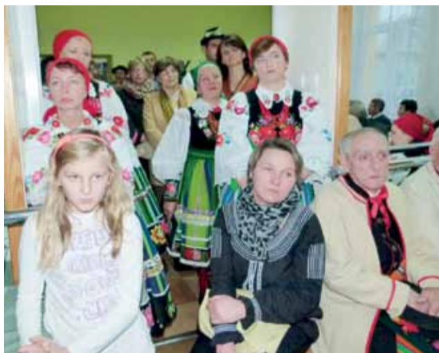
Tegoroczny Dzień Seniora w Domaniewicach zgromadził tak dużo osób, że niektórzy stali w przejściu i w korytarzu.