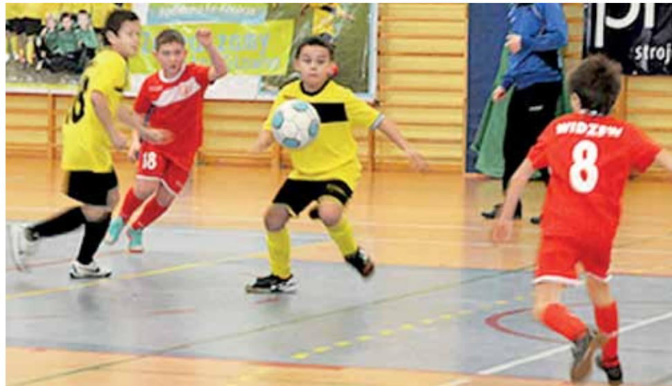
Wśród młodych piłkarzy walka na boisku była na takim samym poziomie jak w profesjonalnym futbolu.

Piłka nożna | Turniej eliminacyjny o Puchar Marszałka Województwa Łódzkiego