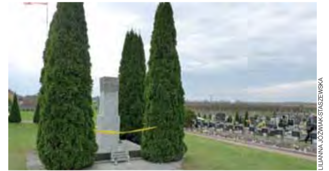
Remontowany pomnik jest centralnym punktem kwatery wojennej.

Remont kosztować będzie 29 tys. zł, z czego 27 tys. zł to dofinansowanie z Rady Ochrony Pamięci Walk i Męczeństwa. ljs