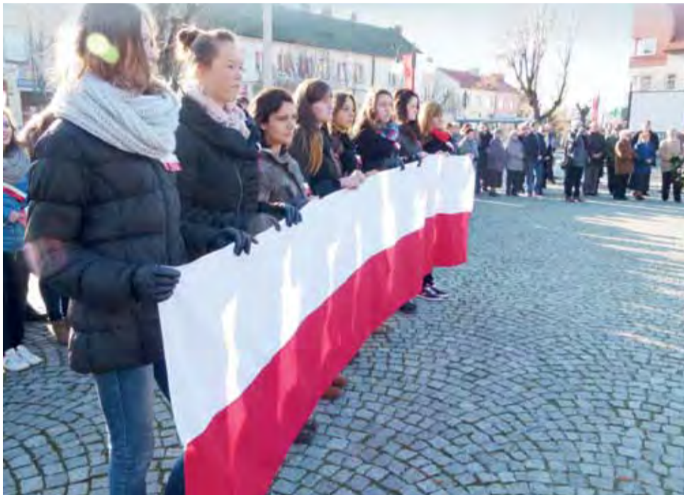
Flagę narodową trzymają uczennice Zespołu Szkół Licealno-Gimnazjalnych.