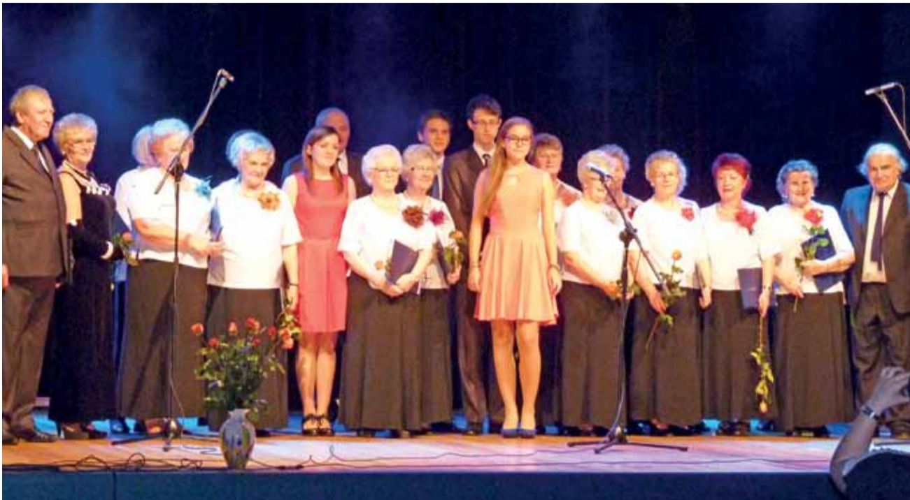
Koncert Chóru Klubu Seniora "Radość" i gości na wyremontowanej scenie w sali kina Feniks wypadł znakomicie.