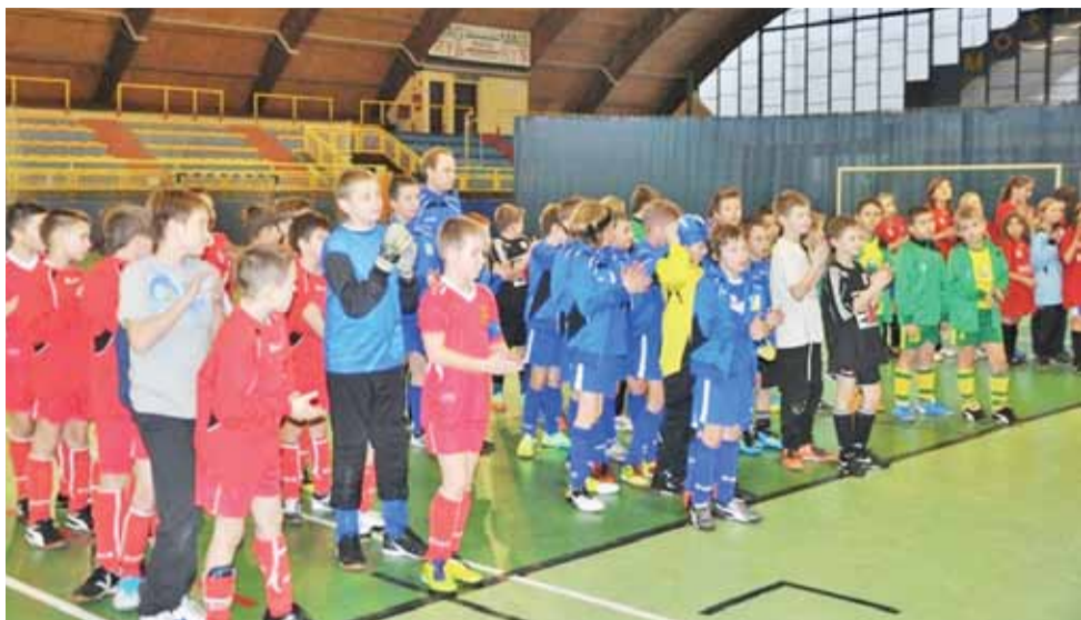
Po zakończonym turnieju wszyscy młodzi piłkarze zostali nagrodzeni przez organizatorów.