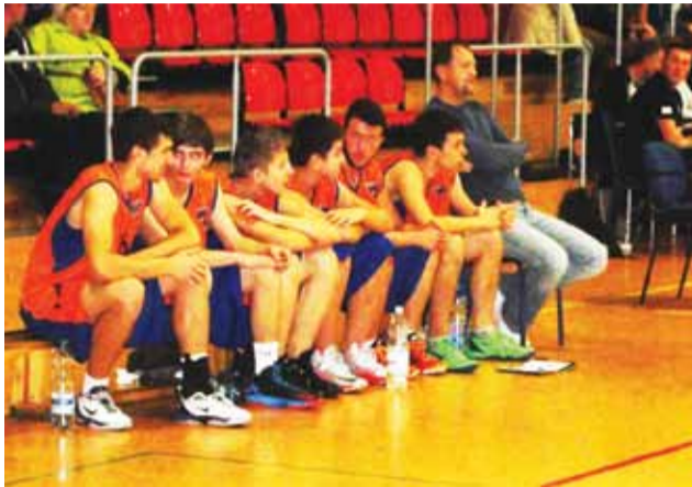
Drużyna Głowna do lat 18 z meczu na mecz prezentuje się coraz lepiej, czego efektem są kolejne zwycięstwa.

Następny mecz GTK Głowno rozegra 23 listopada. W Hali Sportowo-Widowskiej przy ul. Andersa 37 głównianie podejmą SMS MG-13 Łódź. Jeśli gospodarze myślą o awansie do kolejnej fazy to muszą pokonać trudnego przeciwnika, który jest jednak w zasięgu głowieńskich koszykarzy do lat 18. wp