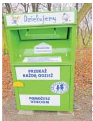
Nowy kontener przy ul. Wigury w Głownie.

Widoczne w wielu miejscach miasta pojemniki beżowe należące do firmy Wtórpol ustawiane są najczęściej bez powoleń. Firma je wystawiająca, pomimo pisma z magistratu, nie uzupełniła nadal wymaganej dokumentacji. kl