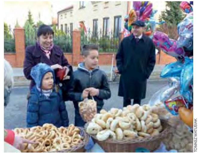
Pomiędzy poważnymi uroczystościami, goście odpustu, zwłaszcza ci najmłodsi, mieli okazję trochę się rozzerwać, odwiedzając stragany przy ul. Jana Pawła II.