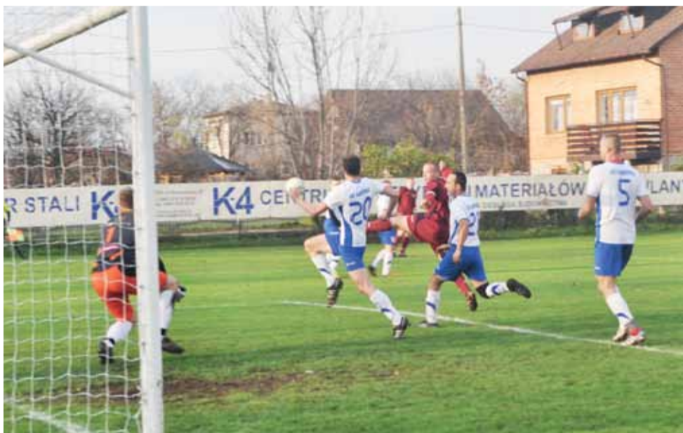
Po pokonaniu Dąbrowki piłkarze rezerw Zjednoczonych (bordowe stroje) umocnili się na prowadzeniu w tabeli.

Piłka nożna | 10. kolejka A-klasy, gr. II