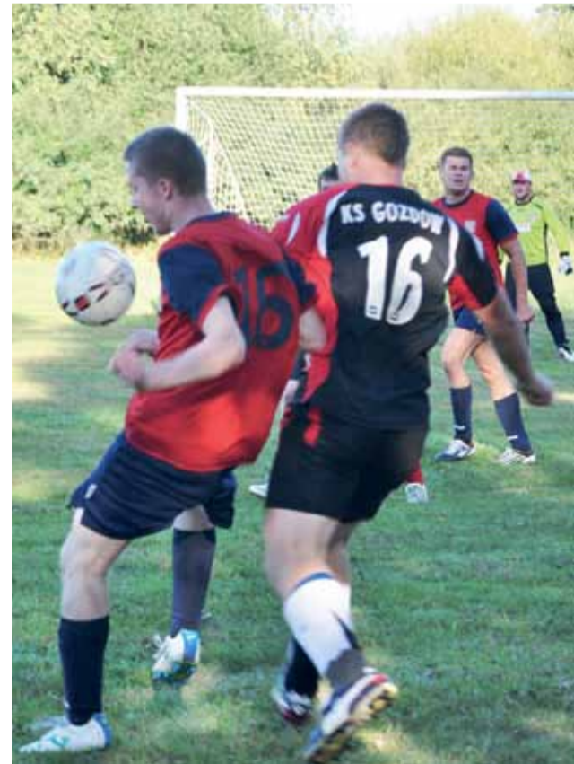
Drużyna KS Gozdów nie może być już tak pewna awansu, jak jeszcze dwie kolejki temu.