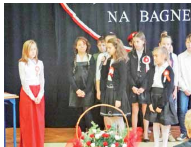
Skąd wzięło się to święto Niepodległości uczniowie Szkoły Podstawowej w Bolimowie dowiedzieli się 8 listopada od Ojczyzny - uczennicy ubranej w narodowe barwy. Później inny z uczniów, który wcielił się rolę sędziwego dziadka, snuł opowieść o rozbiorach, powstaniach i I wojnie światowej, która dla Polski zakończyła się odzyskaniem niepodległości. Opowieść ta przeplatana była utworami poetyckimi i pieśniami z tamtego okresu, wykonanymi przez chór. tb