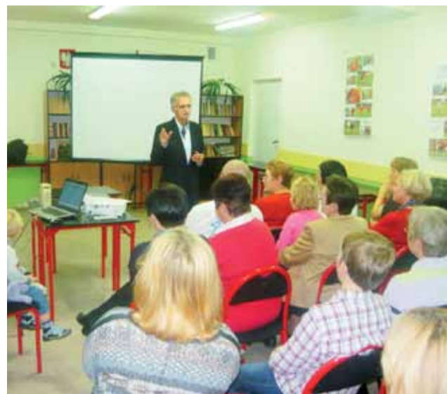
Jacek Fedorowicz na spotkaniu w Bratoszewicach

Chętni mieli też oczywiście okazję otrzymać od satyryka autograf czy podpis pod egzemplarzem jego książki.