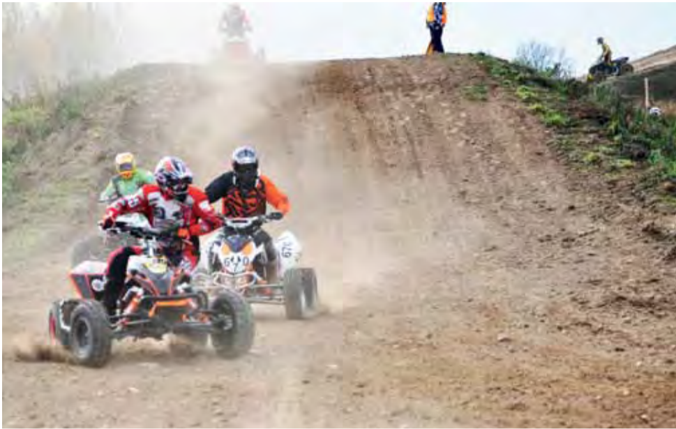
Zmagania quadów należą do jednych z najbardziej emocjonujących, ale wymagają niebywalej sprawności fizycznej.

Motocross | Podsumowanie sezonu 2013 w Cross Country