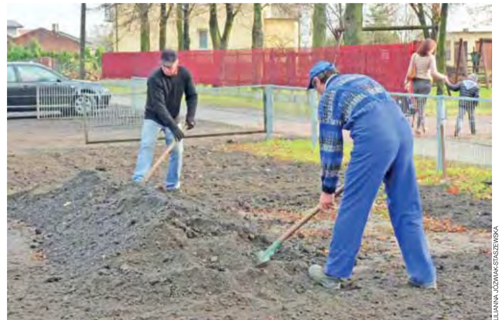
Pracownicy strykowskiej Jednostki Robót Publicznych wyrównują powybijane pobocze ul. Szkolnej.

Autorzy projektu zapowiadają złożenie odwołania, gdyż nie zgadzają się z punktacją przyznaną mu w ramach merytorycznej oceny wniosków. ljs