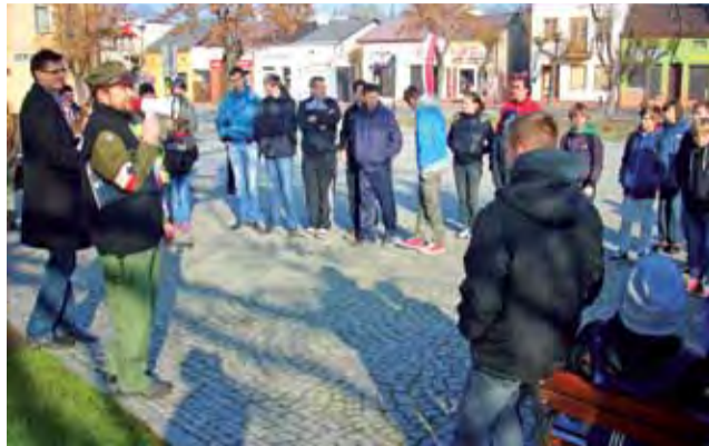
Na chwilę przed wyruszeniem na start gry.

I tak przy ul. Sikorskiego uczestnicy, dysponując ściągawką mieli przy pomocy chorągiewek nadać w alfabecie Morse'a hasło „Gibraltar”. Za każdą poprawnie pokazaną literę można było otrzymać 1 punkt. Dodatkowo, 10 punkt, drużyna otrzyma-