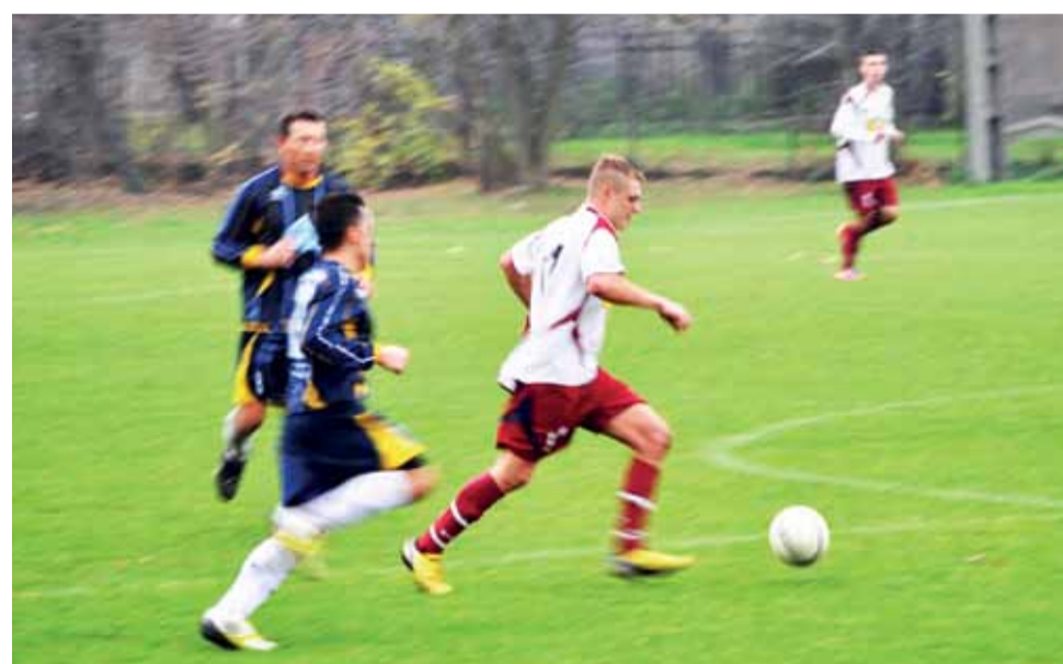
Zjednoczeni Stryków od początku sezonu są kilka kroków przez większością drużyn IV ligi.

W hicie tej kolejki Widok Skierniewice zremisował 1:1 z wiceliderem KS Paradyż. Na