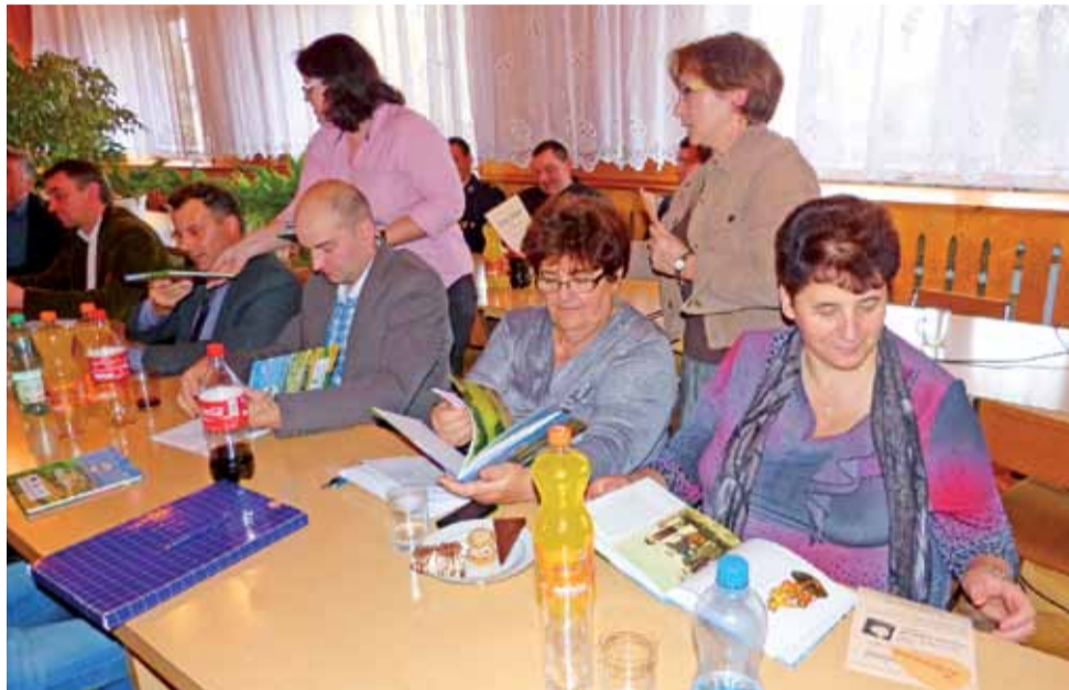
Radni gminy Zduny oglądali z zainteresowaniem publikację o swojej gminie.

W dalszej części znajdują się: opis geograficzny gminy, historia jej terenów od średniowiecza, historia szkolnictwa, tradycje ludowe, sylwetki znanych twórców ludowych pochodzących z gminy Zduny, działania w zakresie kultury wraz z historią Domu Ludowego, informacją o skansenie w Maurzycach i trzech parafiach: w Zdunach, Złakowie Kościelnym i Bąkowie Górnym, o cmentarzach i innych