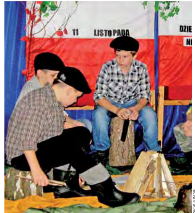
Uczniowie Szkoły Podstawowej w Huminie 8 listopada obejrżeli przedstawienie z okazji 95-rocznicy odzyskania przez Polskę niepodległości. Wystąpili ich koledzy z klas IV, V i VI. Przedstawili oni losy Polski od I rozbioru Polski aż po dzień 11 listopada 1918. Na koniec wszyscy wspólnie odśpiewali hymn. tb