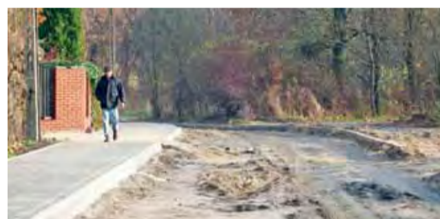
Już niedługo będzie można tędy ponownie przejechać samochodem.

Do remontu dołożono 350 tys. zł z miejskiej kasy, a całość powierzono do wykonania Miejskiemu Zakładowi Komunalnemu. Prace wykonywane były siłami pracowników zakładu. W związku z tym, że mają