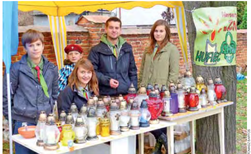
Harcerze z 3 Łowickiej Drużyny Wielopoziomowej Impresy, sprzedający znicze przy ul. Blich.

zniczy przez harcerzy. W Łowiczu można było spotkać ich stoiszka przy cmentarzu katedralnym i Emaus, na terenie powiatu łowickiego w Bednarach, Nieborowie i Kocierzewie – czyli na terenie na którym działa 9 Szczęp Drużyn Wiejskich Blich.