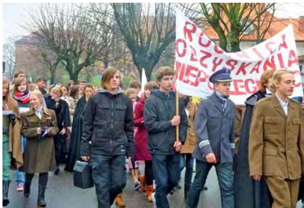
Specjalnie na marsz patriotyczny uczniowie szkoły pijarskiej starają się ubierać w stroje z dawnych epok.