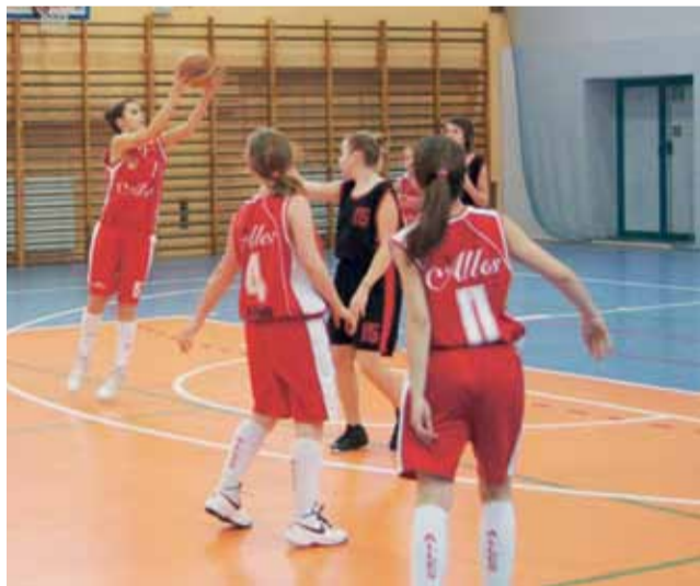
Młodziczki Alles Głowno (czerwone stroje) znakomicie sobie radzą w nowym sezonie wojewódzkiej ligi koszykarek do lat 14.

Alles z kompletem punktów jest drugi w tabeli. Głównianki mają bardzo groźnego rywala w walce o pierwsze miejsce, bowiem same zwycięstwa notuje również łódzki Widzew. Młode koszykarki Głowna właśnie z tą drużyną zmierzą się w następnym meczu. Spotkanie na