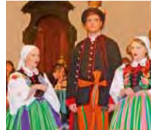
Na Wigilię w muzeum koledzy śpiewał Zespół Pieśni i Tańca Blichowiacy.

Gość dziwi się, że zamknięte są wszystkie sklepy i hotele, a wszędzie widnieją kolorowe dekoracje. Jego wizyta skłania domowników do rozmowy o tym,