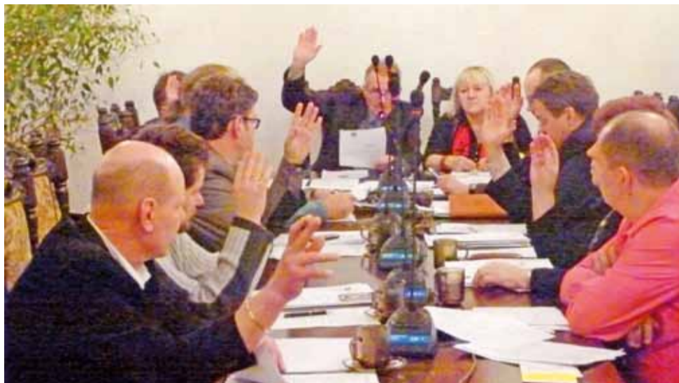
Radni głosują nad przyjęciem budżetu na 2014 rok.