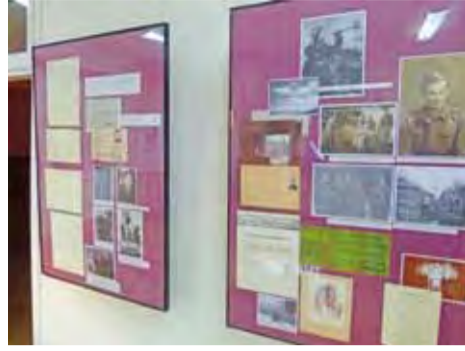
W Domaniewicach można oglądać 25 plansz poświęconych Tadeuszowi Chciukowi-Celtowi.

Również burmistrz Strykowa Andrzej Jankowski cenił talent zmarłego i jego umiejętność zainteresowania młodzieży żywą historią. Lucjan Muszyński uczył patrzeć na wydarzenia sprzed lat, jak na losy bliskich nam osób, a nie tylko ciąg dat do wyuczenia na pamięć. Wszystkich mieszkańców swojej gminy burmistrz Strykowa zapewnia, że wprowadzona z inicjatywy łodzianina tradycja obchodów kolejnych rocznic bitwy pod Dobrą i walk Powstania Styczniowego będzie w gminie kontynuowana. ewr