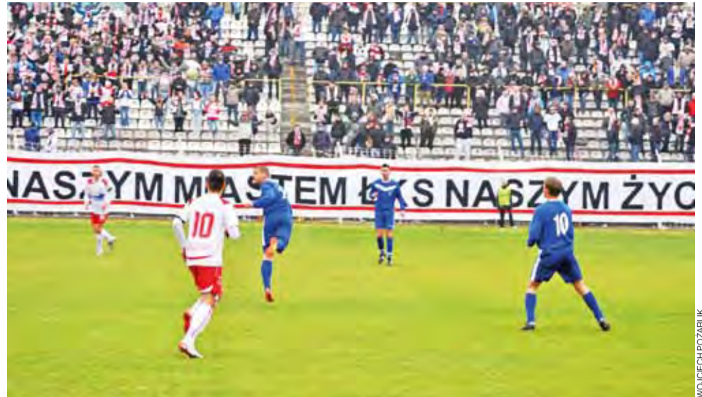
ŁKS – Zjednoczeni. Historyczna wygrana w Łodzi to jeden z najważniejszych momentów w historii Strykowa.

1. kolejka: Zjednoczeni Stryków – Start Brzeziny 1:0 (Buchowicz k. 30')