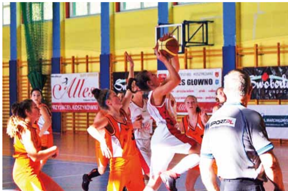
Młodziczki TK Alles Głowno (białe stroje) prezentują na parkietach zarówno skuteczną, jak i efektowną grę, czego efektem jest wysokie miejsce w ligowej tabeli.