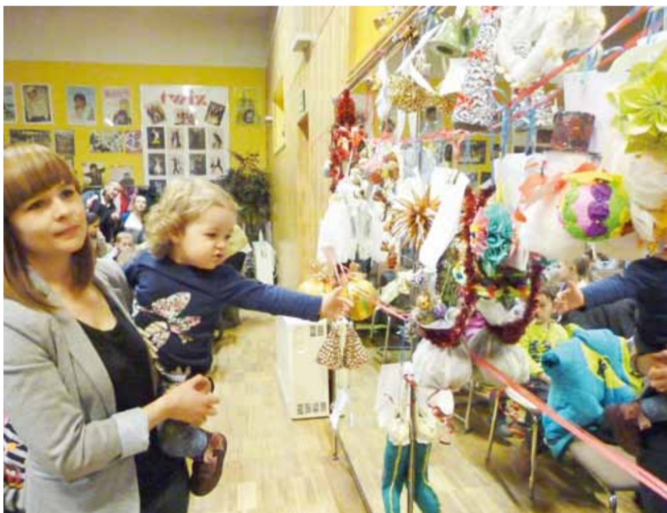
Prace wykonane przez dzieci jeszcze przed ogłoszeniem wyników były chętnie oglądane przez tych, którzy przyszli na wtorkowe spotkanie.

Dziewczyny chcą skończyć kurs rachunkowości I stopnia, kurs nauki angielskiego na poziomie B1, brać udział w otwartych wykładach zarządzania i ekonomii na UE, a jak się uda, to również znaleźć się w finale Turnieju Wiedzy o Ekonomii WODN. kl, tjs