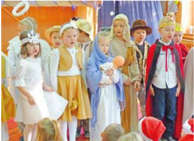
Jest taki dzień... Jasełka w Przedszkolu Miejskim nr 2.

Boże Narodzenie każdy z nas przeżywa na swój sposób. Czas przedświąteczny płynie inaczej, a atmosfera towarzysząca świętom trwa zwykle dłużej niż 2-3 dni. Dziś przypominamy niektóre spotkania wigilijne i jasełka, które odbyły się na naszym terenie.