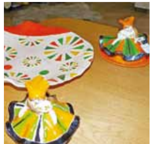
Łowiczanki to firmowy wyrób Pracowni DeJa. W środku patera o podobnej kolorystyce.