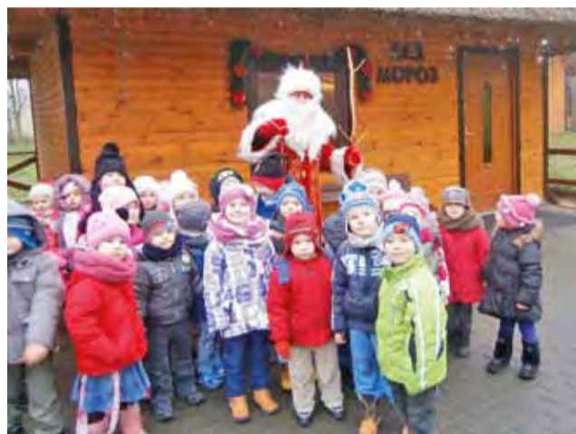
Dzieci z MP1 z wizytą w Krainie Św. Mikołaja.

spektaklu złożono sobie świąteczne życzenia i podzielono się opłatkami. Czekoladowymi mikołajkami nagrodzono laureatów i uczestników szkolnego konkursu plastycznego, polegającego na przygotowaniu kartki świątecznej z życzeniami w języku angielskim i rosyjskim.