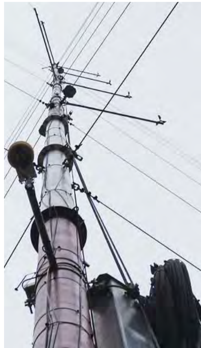
Maszt pomiarowy w Łagowie – pierwsza duża konstrukcja wzniesiona przez Bonwind w gminie Łyszkowice. Kiedy możemy spodziewać się wiatraków?

Od czterech lat mówią też mieszkańcom o korzyściach, ja-