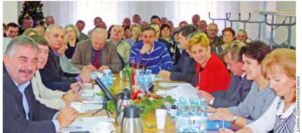
Przegłosowany budżet wymalował uśmiech na twarzach samorządowców, ale jak widać - nie wszystkich.

– Dziękuję radnym, sołtysom, wszystkim, którzy brali udział w konstruowaniu ostatecznego kształtu tego budżetu. Każdy z was może mieć niedosyt, ponieważ każdy by chciał, żeby w jego rejonie działało się więcej, żeby kolejna droga, oświetlenie, wodociąg, tam gdzie go nie ma, powstał, ja też bym chciał. Na razie nie możemy sobie na to pozwolić, ale myślę, że mamy przed sobą dobrą perspektywę i w ciągu 2-3 lat te najtrudniejsze problemy rozwiążemy – mówił burmistrz. Wyraził on również nadzieję, że kilka inwestycji, które nie znalazły