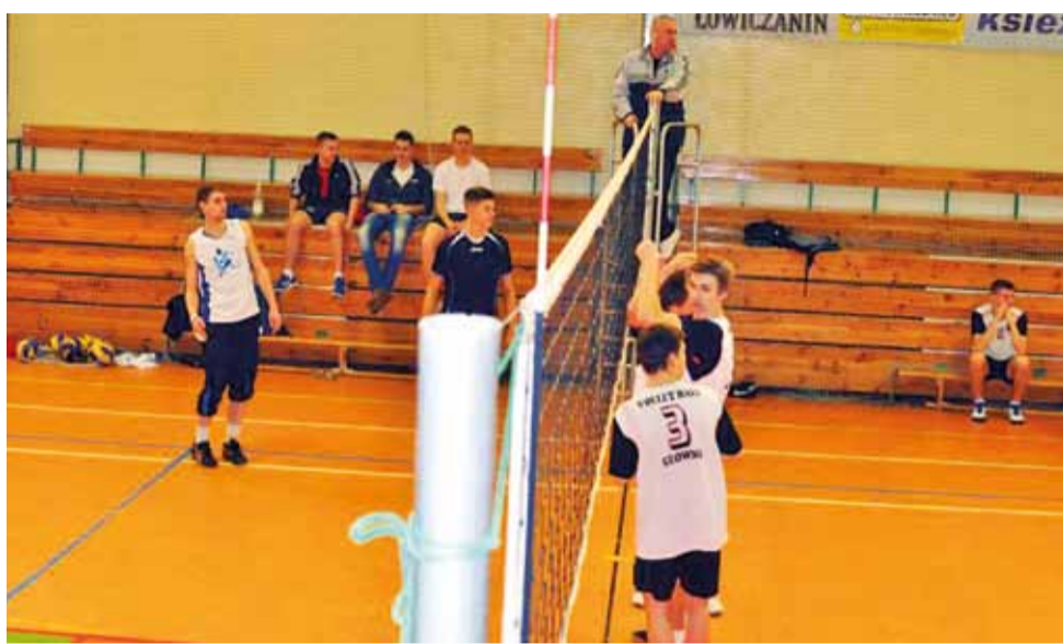
Siatkarze Volleyball Gimnazjum Głowno (z prawej) mimo młodego wieku spisują się bardzo dobrze i należą do najlepszych drużyn rozgrywek Siatkarskich Amatorskich Mistrzostw Łowicza.

W drugiej partii sytuacja wyglądała niemal identycznie. Początek należał do gości, którzy prowadzili do momentu zdobycia 20 pkt. W decydującym momencie seta w szeregi Volleyball wdarła się jednak nerwowość, czego winą może być również brak doświadczenia w meczach o dużą stawkę. Siatkarze Korabki wykorzystali słabszą postawę