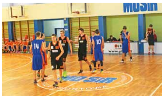
Koszykarze GTK Głowno (niebieskie stroje) notują dobry sezon w Wojewódzkiej Lidze Juniorów do lat 18.

Następna, 11. kolejka odbędzie się 4 stycznia: ŁKS II Koszykówka Męska Łódź – PKK 99 Pabianice, Piotrcovia Piotrków Trybunalski