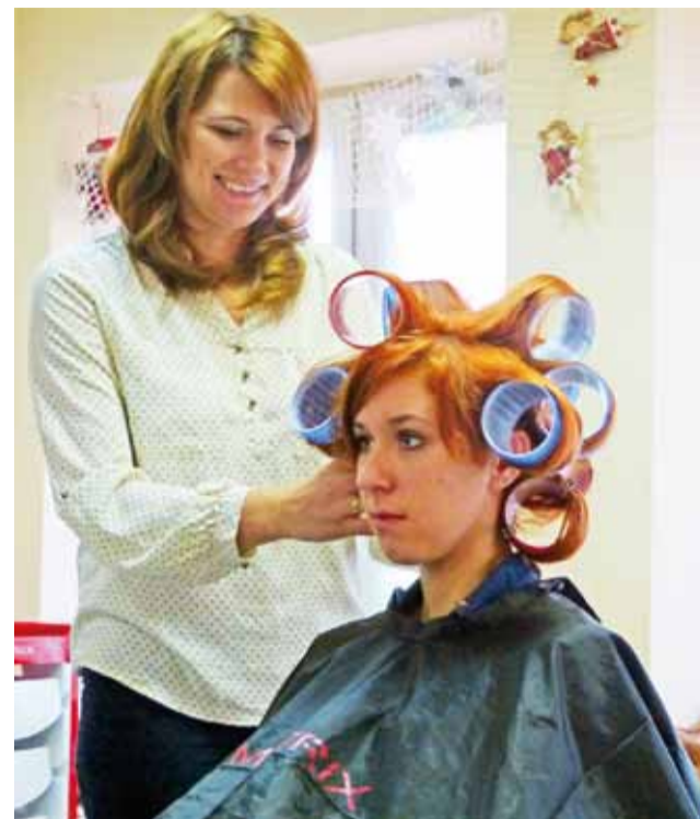
W studiu fryzjerstwa "Matrix" przy ulicy Zduńskiej dużo pracy było także w Wigilię.

Dostrzega też pewną, niezmienną od lat tendencję – panno-