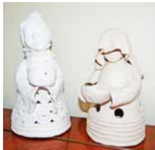
Te prace nazywane są Nianie. Są to świeczniki (małą świecę umieszcza się w środku).