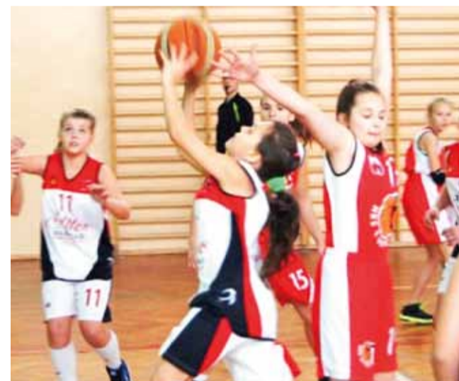
Spotkania młodziczek ligi U-14 dostarczają kibicom wielu emocji.