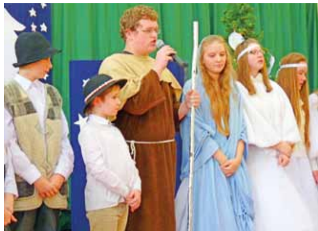
Świąteczne życzenia. Finał jasełek w ZS w Popowie Głowieńskim.