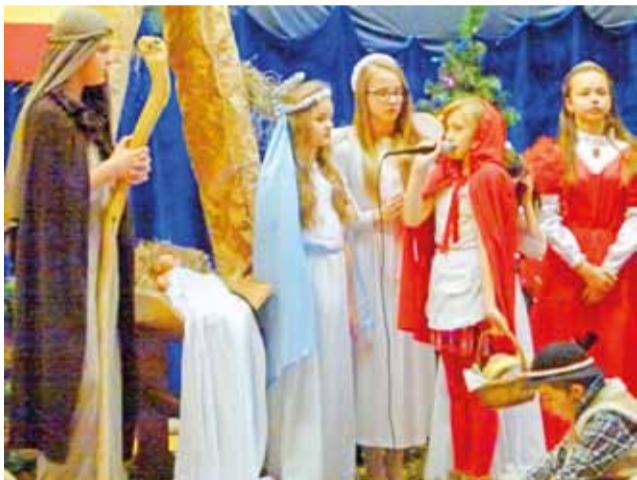
Wśród bohaterów jasełek w SP1 pojawił się m. in. Czerwony Kapturek.

uczniowie Zespołu Szkół w Popowie Głowieńskim.