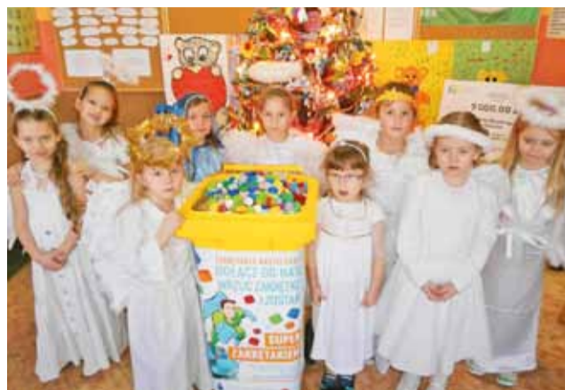
Przedszkolaki z Jedynki włączyły się m. in. do akcji zbierania korków.

i opiekuna chóru Pawła Karlikowskiego. Opowieść o narodzeniu Chrystusa w betlejemskiej stajence przeplatano koledami, w śpiewanie których włączyła się także publiczność. Młodzi aktorzy występowali ucharakteryzowani w postaciach z Biblii, a za dekoracje wokół żłóbka posłużyła pomysłowa imitacja ogniska, a także imponujące figury zwierząt, wykonane z papieru. Obok stada owieczek, przy stajence stał także duży papierowy wielbłąd i osiołek. Po bożonarodzeniowym