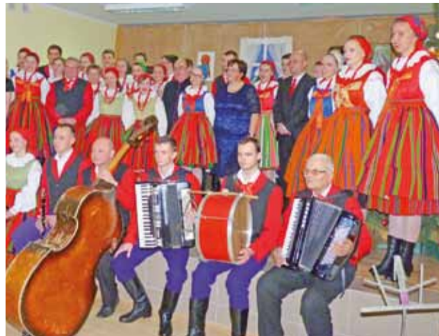
Oto sannicki artyści, którzy przygotowali tegoroczne jasełka.

Jako że scenariusz tego przedstawienia bożonarodzeniowego nie jest wykorzystywany co roku, a członkowie zespołu co pewien czas się zmieniają, postanowiono pokazać je jeszcze raz. Jasełka w Sannikach każdego roku są przygotowywane przez zespół innego. Angażują się w nie poszczególne parafie i szkoły. Występ Regionalnego Ze-