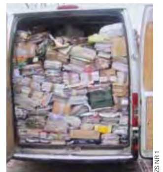
Transporter załadowany makulaturą zebraną przez uczniów ZS Nr 1.

Pomysł budowy studni za makulaturę należy do Łódzkiej Wspólnoty Fundacji Nauk i Wychowania, prowadzonej w Sudanie właśnie przez księży sałzejajców. Wśród gimnazjalistów najczęściej, bo 376 kg makulatury, zebrała klasa Ia, natomiast wśród uczniów podstawówki – klasa I – 333 kg. ljs