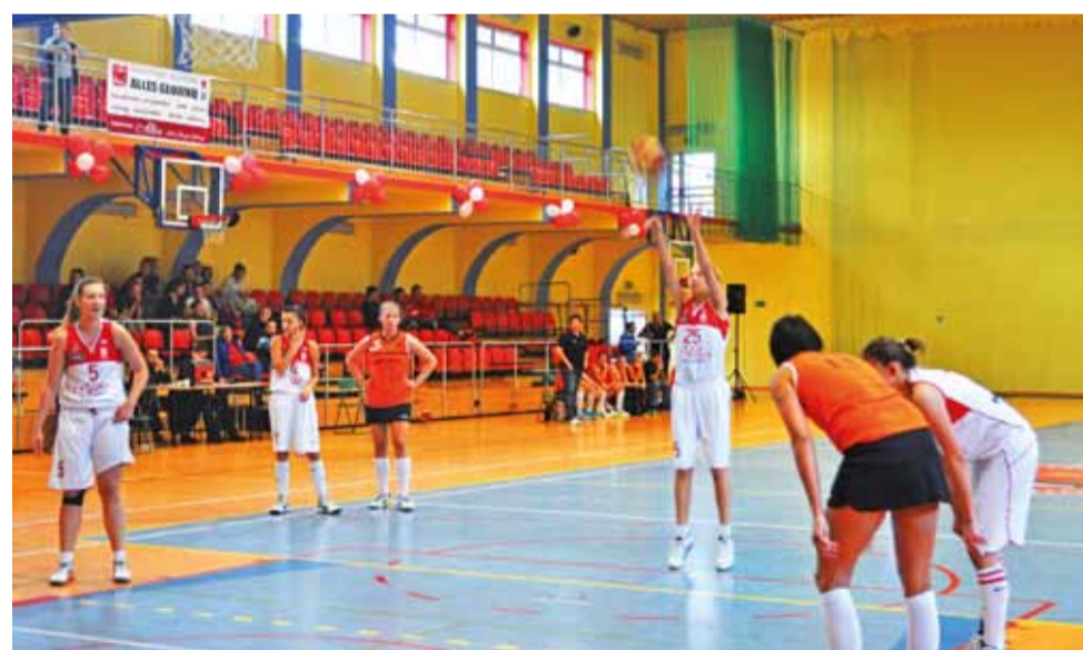
Koszykarki głowieńskiego Alles (biało-czerwone stroje) w drugiej części sezonu muszą grać lepiej.