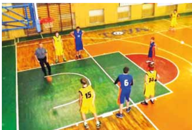
Głowniecki młodzicy (niebieskie stroje) zanotowali pierwszą wygraną.

12. kolejka: AZS PWSZ Skierniewice – GTK Główna (18.01.2014r.)