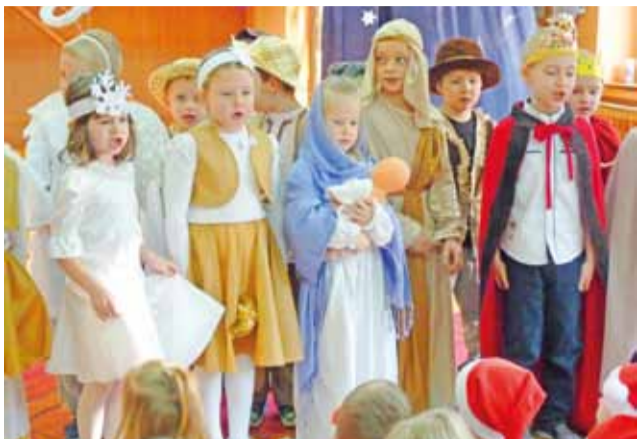
Jest taki dzień... Jasełka w Przedszkolu Miejskim nr 2.

Była Maryja z Dzieciątkiem Jezus i Józefem, był chór aniołów, byli pastuszkowie i trzej mędrcy z darami. Tradycyjne jasełka, wplecione we współczesne realia rozmowy szkolnych koleżanek, wystawili w czwartek, 19 grudnia,