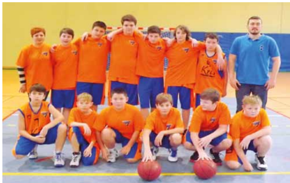
Zespół GTK Głowno walczyć będzie o jak najwyższe miejsce w klasyfikacji najlepszych drużyn w województwie łódzkim.

Patrząc na ostatnią formę i progres gry głowieńskich młodzików GTK stać na odniesienie kompletnego zwycięstwa z tymi rywalami i prześcignięcie ich w końcowej klasyfikacji Wojewódzkiej Ligi Młodzików. wp