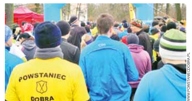
Zawodnicy Powstańca Dobra są widoczni w każdym łódzkim biegu.