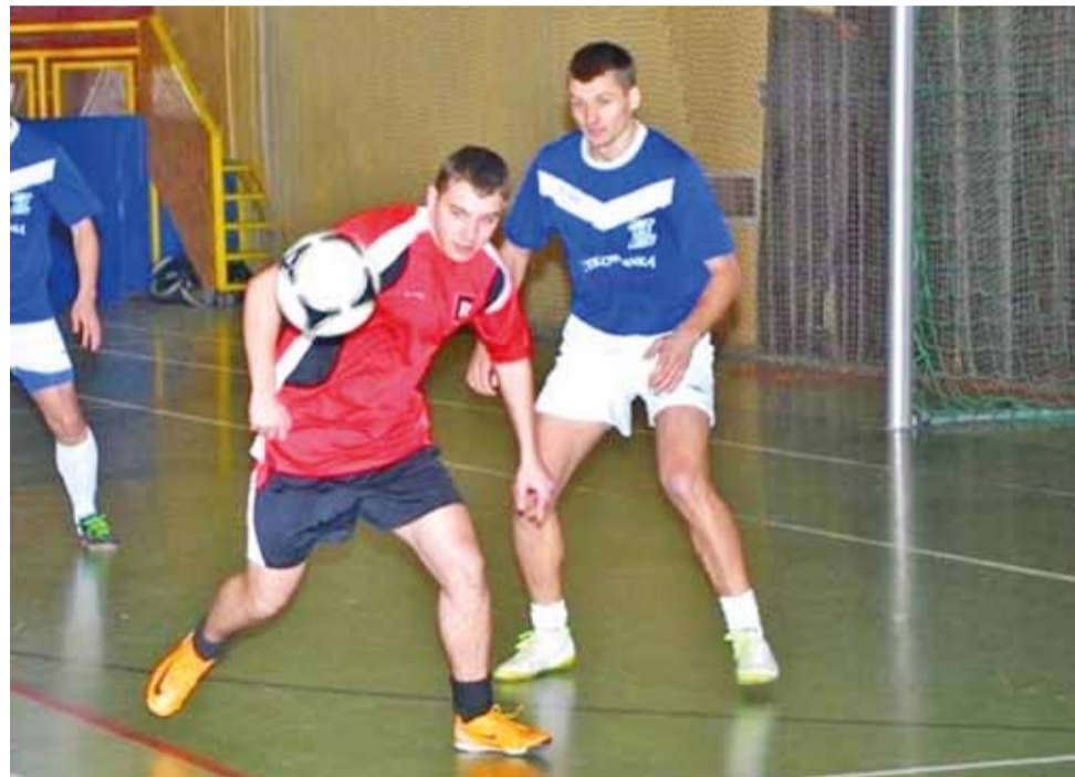
Zjednoczeni Stryków (niebieskie koszulki) nie zdołali obronić trofeum sprzed roku.