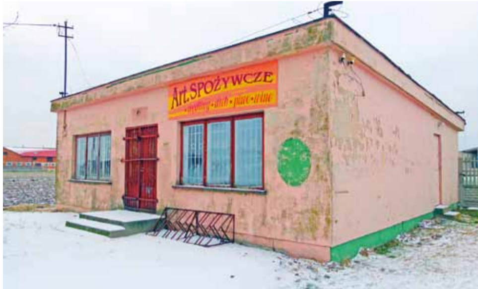
Budynek GS w Mięsośni. To tę nieruchomość sołectwo chce zagospodarować na wiejską świetlicę.

nawet odwołanie ich z pełnionych funkcji. Ta groźba uderzyła w adresatów, którzy poczuli się zbyt ostro potraktowani przez wójta. On sam w rozmowie z „Wieściami” 14 stycznia przyznał, że może niepotrzebnie użył tak mocnego zdania i podobno nawet przeprosił za nie sołtysów i radę, ale oni nie cofnęli swojej jednoznacznej decyzji o rezygnacji. Wycofali się też z porozumienia z prezesem