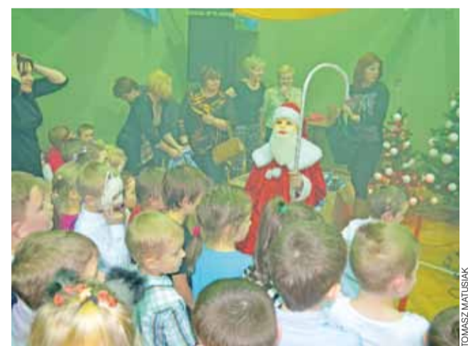
Dzieci ustawiają się w kolejce po prezenty od Mikołaja.