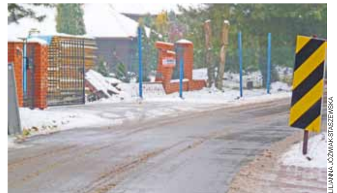
Mieszkańcy Ługów boją się tego łuku drogi.

ków ruchu. Od momentu, kiedy w podstrykowskim Sosnowcu uruchomiono węzeł komunikacyjny łączący drogę krajową nr 14 z autostradami A1 i A2, przez Ługi jeżdżą sznury samochodów, które chcąc ominąć korki na „czternaste”, wybierają boczną drogę, bo nią szybciej można dostać się do Strykowa. W okresie letnim z kolei przez Ługi na swe działki w Cesarce chętnie jeżdżą mieszkańcy Łodzi. Droga choć wydawałaby się boczną i spokojną, wcale taką nie jest. ljs