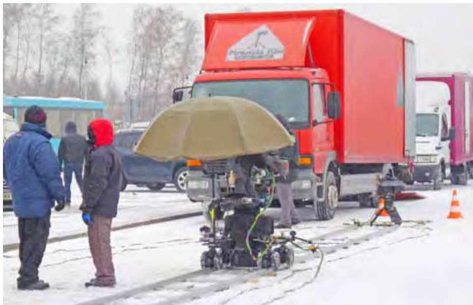
Kampus filmowy na autostradowym parkingu. Przygotowanie do kolejnych ujęć.

Latem ubiegłego roku jeden z odcinków poprzedniej serii kręcono w Dobrej. Często jest tak, że w jeden dzień sceny kręcone są w kilku obiektach czy plenerach, do kilku odcinków. Tym razem, podobnie jak w lipcu w Dobrej, skupiono się na jednym. Filmowcy spędzili dzień przy autostradzie A-2, w obrębie parkingu i położonej niedaleko pod lasem posesji.