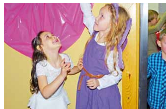
W sali gimnastycznej dzieci – w typowy dla swojego wieku sposób – „ogłądały” dekorację z użyciem rąk.

Rodziców było w szkole niemało, zwłaszcza podczas choinki dla najmłodszych uczniów, która trwała do godz. 14.00. – Nasi rodzice się angażują i to bardzo do-