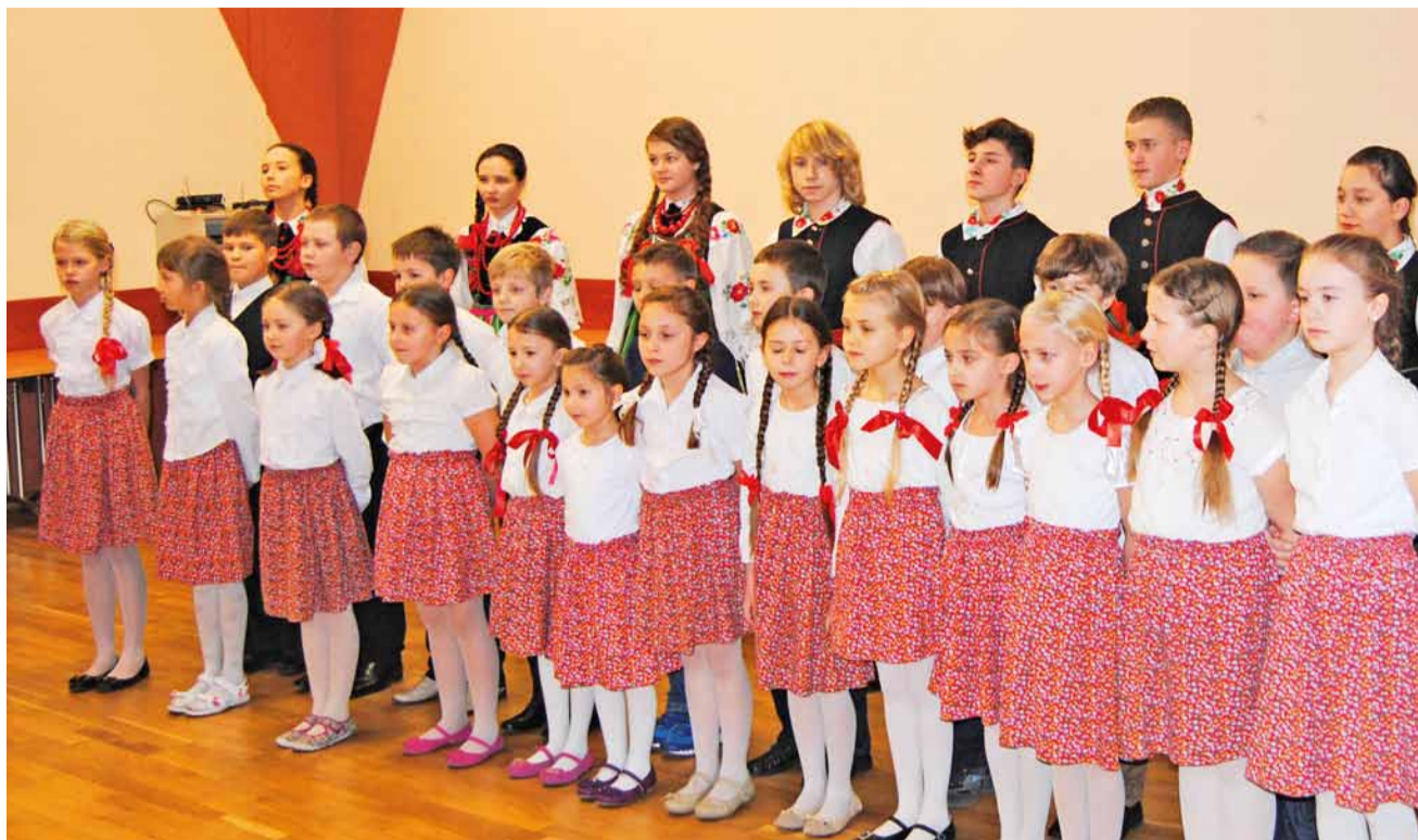
Dzieci z Dziecięcego Zespołu Ludowego Kocierzewiaczy z przejęciem śpiewały kołędy i pastorałki. To był ich pierwszy publiczny występ w takim składzie.