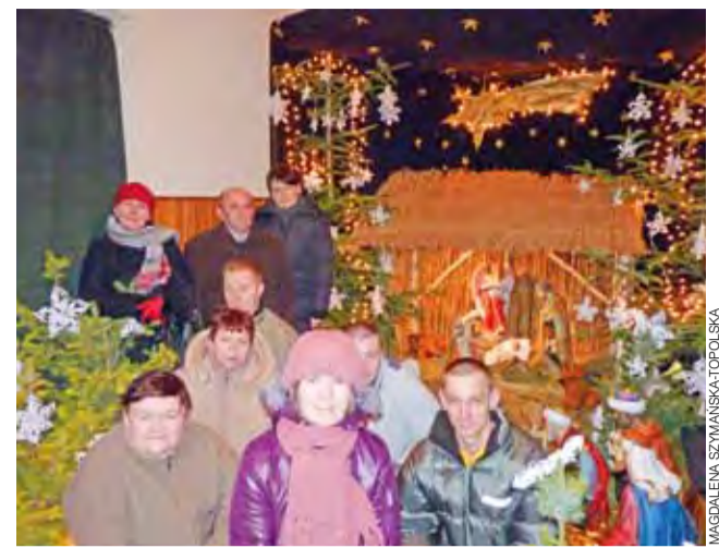
Piękna szopka bożonarodzeniowa i jej twórcy – niepełnosprawni uczestnicy Warsztatów Terapii Zajęciowej.