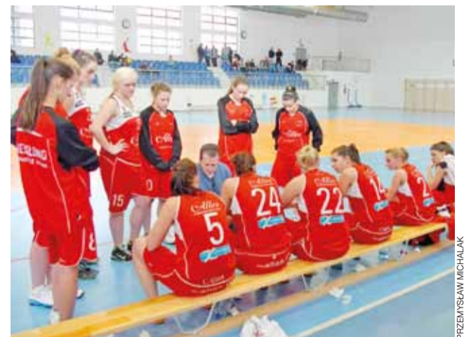
Głowieńskie koszykarki Alles przeżywają trudny okres, ale starają się sumiennie wykonywać zalecenia trenera i razem przejść przez ten czas.

Następna, 10. kolejka odbędzie się 25 lutego: Alles Głowno - UKS Basket Aleksandrów Łódzki 68:75, SKK Polonia Warszawa - UKS 4 Ursus Warszawa, SMS PZKosz Łomianki - Hutnik Warszawa, Altkom AZS Politechnika Warszawska - UKS Huragan Wołomin.