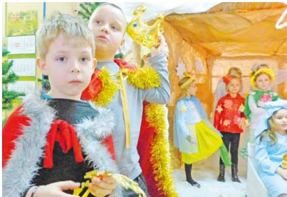
Jasełka w Przedszkolu nr 3 były wystawiane kilka razy. 15 stycznia aż trzykrotnie!

Współpracę ze szkołami z innych krajów w ramach Comeniusa Gimnazjum nr 2 podjęło w tym roku szkolnym. W 2013 roku napisano projekt, który będzie realizowany w latach 2014-2015. Kolejna grupa 10 uczniów tej szkoły pojedzie jeszcze w tym roku do Turcji, a następna w 2015 – do Niemiec. mst