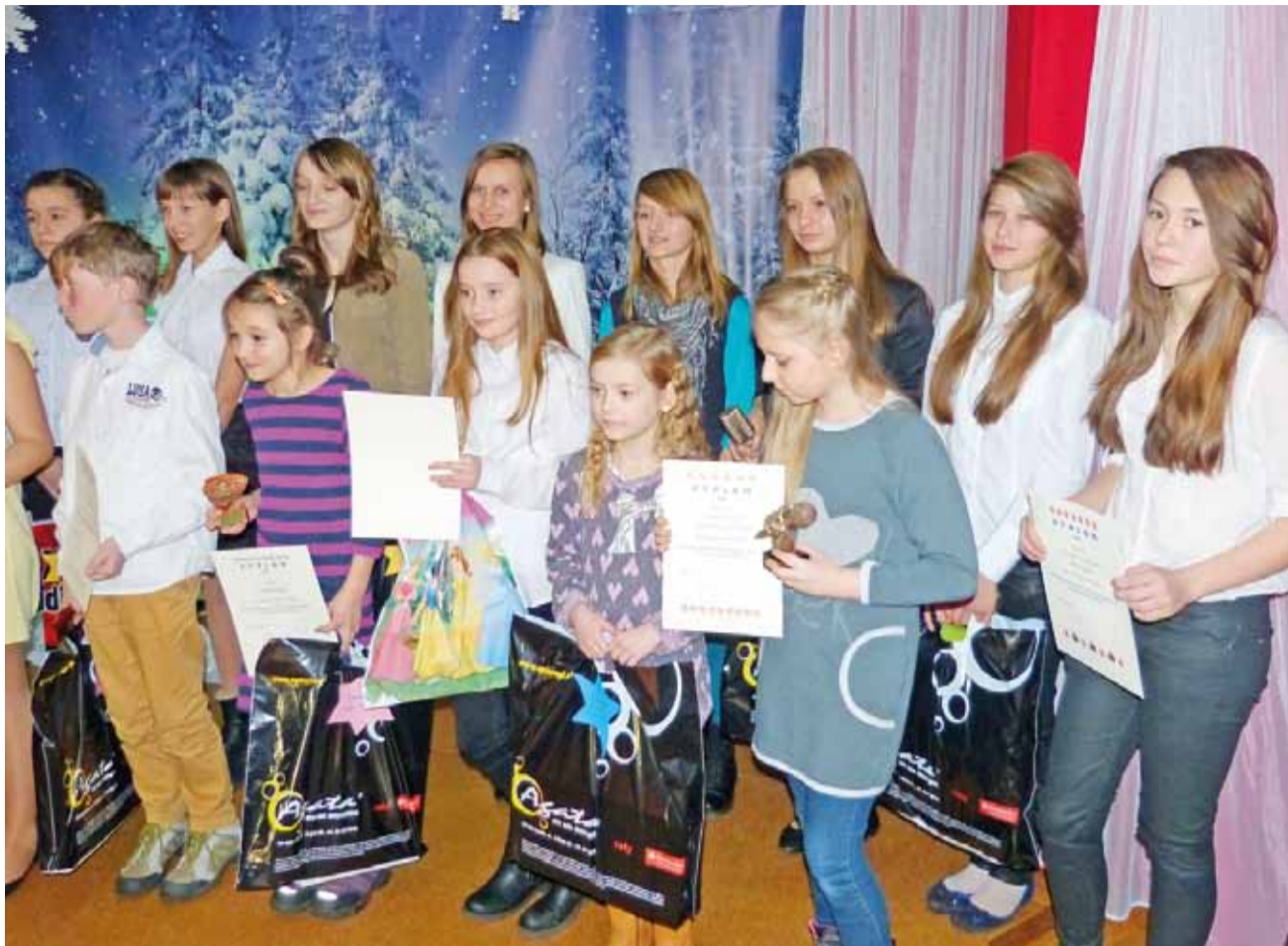
Nagrodzeni i wyróżnieni uczestnicy przeglądu otrzymali nagrody, które pomogło ufundować kilkunastu sponsorów.