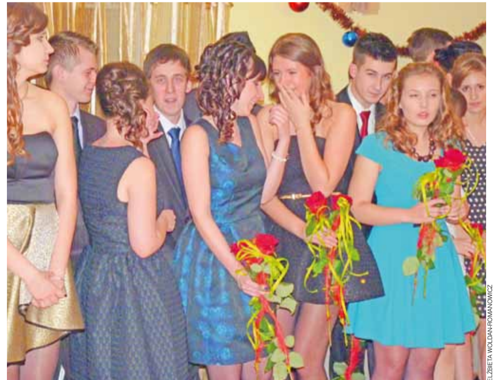
Już za chwilę wielki bal. Początek studniówki ZSL-G w Głownie.