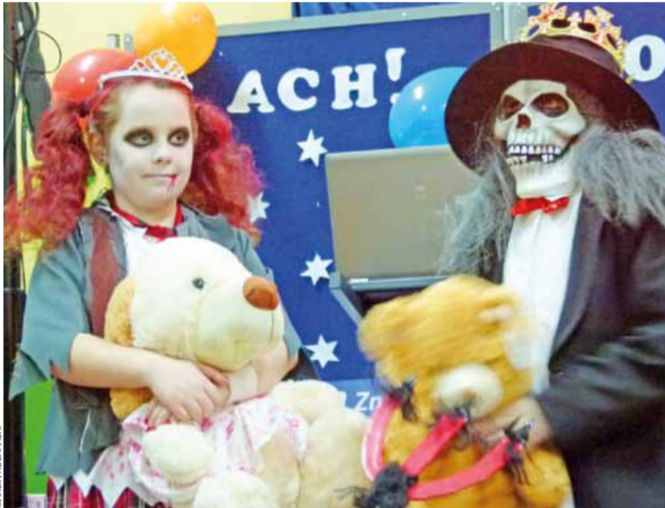
Z przymrużeniem oka, ale jednak trochę strasznie...