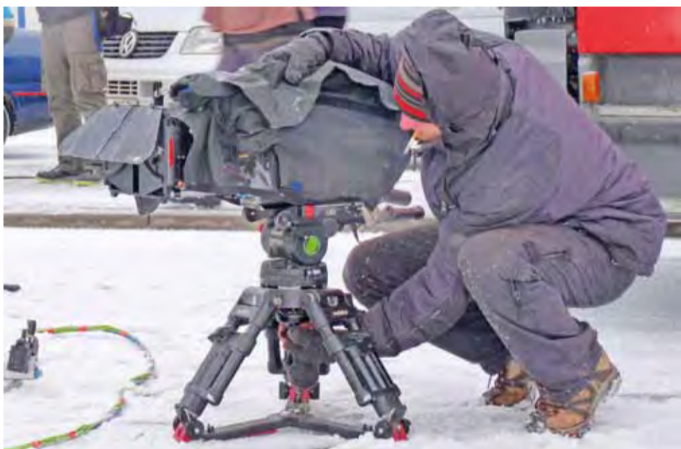
Ustawianie statywów kamer w śniegu i lodzie to nie pierwsza dla zespołu zdjęciowego Komisarza Alexa.

Od początku roku na Piaskowej trafiły m.in.: łaciaty piesek znaleziony na ul. 18-go Stycznia, kot z ul. Fabrycznej, kotka znaleziona na ul. Swoboda, szaro-umaszczonego pies, który błąkał się w okolicach ul. Piaskowej, inny (o ciemnej sierści) znaleziony został na ul. Głównej i czarny kundel z ul. Bielawskiej, a także suka w typie owczarka z ul. Westerplatte. oprac. ewr