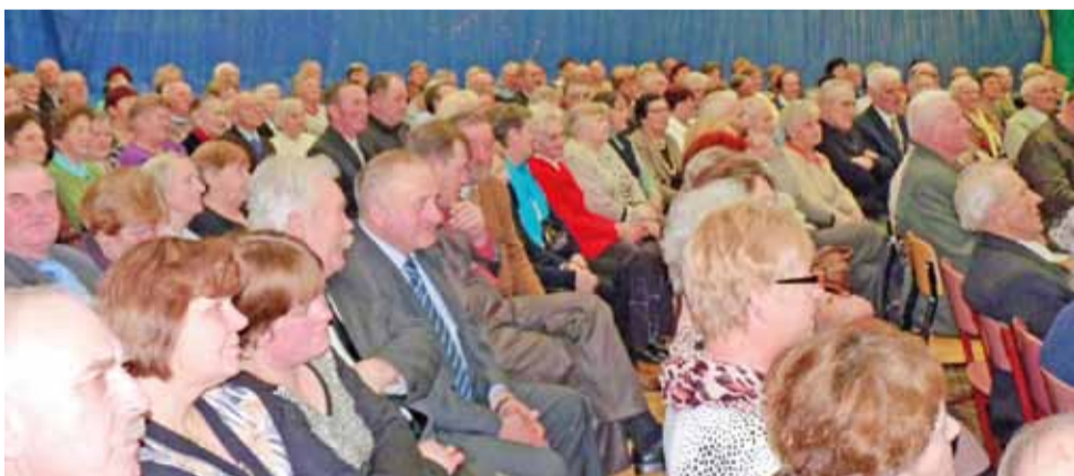
Bardzo liczna grupa babć i dziadków przybyła do Gimnazjum w Popowie na organizowany specjalnie dla nich Dzień Seniora.

– Przez 32 lata pracy w szkołach nie spędziła ani jednego dnia na zwolnieniu chorobowym, zawsze była dysponowana. Jedyne przerwy związane były z macierzyństwem. Nigdy nie mieliśmy okazji wyjechać na dłuższy, tygodniowy urlop, zdarzało się, że jechaliśmy do teatru, na jedno- czy dwudniową wycieczkę