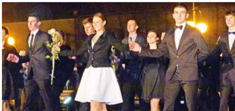
Tego jeszcze w Głownie nie było: przyszli maturzyści tańczyli na bruku Placu Wolności.

Bezpłatne (finansowane przez Fundusz) są w przychodni na Kopernika świadczenia: podstawowa opieka zdrowotna, poradnia diabetologiczna, poradnia reumatologiczna, poradnia dermatologiczna, poradnia pulmonologiczna, poradnia laryngologiczna, poradnia chirurgiczna, poradnia leczenia uzależnień, poradnia ortodontyczna, zabiegi rehabilitacyjne, transport sanitarny w przypadkach określonych przez NFZ oraz badania RTG w ramach podstawowej opieki zdrowotnej lub specjalizacji posiadających kontrakt NFZ.