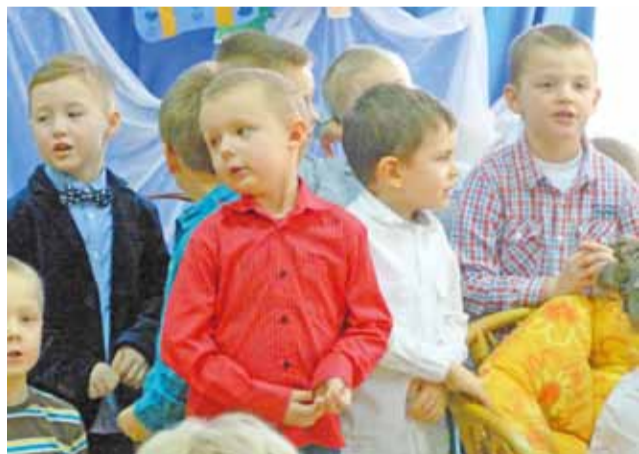
Piątkowe przedstawienie dla babć i dziadków. Mimo wypełnionej po brzegi widowni, trema nie zjadła małych artystów.

Pierwszego dnia wspólnie z seniorami bawiła się najstarsza grupa, zaś dwie pozostałe swoich dziadków i babcie przywitały dzień później. W ciągu dwóch dni przybyło łącznie ok. 300 gości, wśród nich także pradiadkowie i prababcie oraz rodzice, którzy nie chcieli przegapić występów swoich pociec. W programie dominował klimat i tematyka świąteczna. Grupa starszaków wystawiła 45-minutową historyjkę, w której grupa Mikołajów dowia-