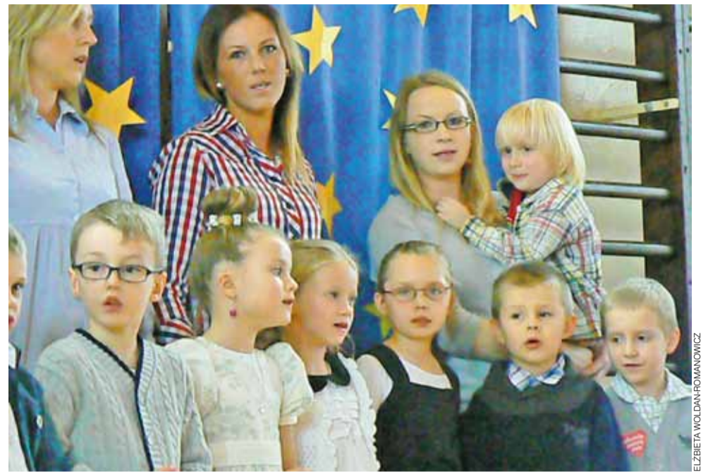
Rodzinne kolędowanie w „Trójce”. Tu: pierwszaki występują razem ze swoimi mamami.