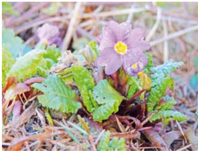
Stycziowa prymulka. Wkrótce ten kwiatek pewnie przemarznie.

Nadzwyczajnie ciepły styczeń sprawia, że rośliny, które o tej porze roku powinny pozostawać w uśpieniu, budzą się do życia. Świeże listki na różanych krzewach, pąki wierzby czy przedwcześnie rozkwitłe prymulki niechybnie czeka zagłada, bo mrozy i śniegi mają dopiero nadejść.