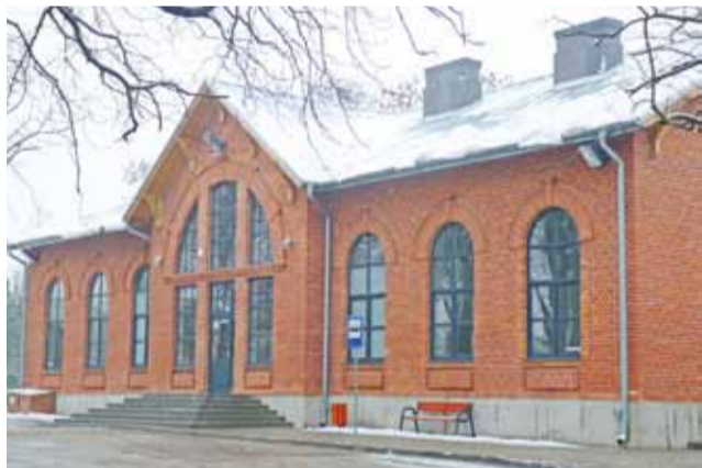
Zmodernizowana stacja PKP w Strykowie.

kowanie go przez 5 lat, a po tym okresie wykup przez gminę za przysłowiową „złotówkę”, na co jednak nie chce się zgodzić PKP SA. Obecny właściciel budynku chciałby natomiast, aby po 5 latach użytkowania gmina zapłaciła za niego zgodnie z wyceną już po remoncie. Taka propozycja z kolei jest nie do przyjęcia dla gminy. – Skoro PKP skorzystało z unijnej dotacji, otrzymując 85% dofinansowania remontu, my chcielibyśmy, aby w umowie zapisane zostało, że po 5 latach bierzemy obiekt, ale za cenę 15% faktycznie poniesionych przez PKP kosztów – mówi o kontrpropozycji gminy burmistrz Andrzej Jankowski. Na dzień dzisiejszy gmina Stryków gotowa jest przejąć do użytkowania jedno, największe pomieszczenie stacji o pow. ok. 60 mkw z węzłem sanitarnym. Chciałaby również powierzyć sprzątnięcie terenu wokół swojej jednostce robót publicznych, a nie płacić za te usługi firmie zewnętrznej. Negocjacje nadal trwają. ljs