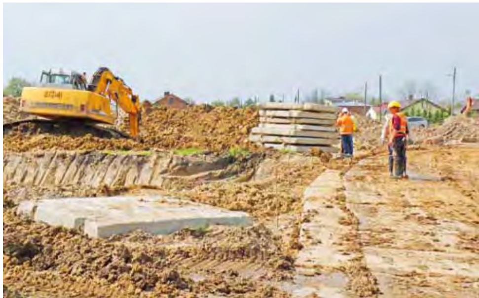
Prace na A-1 w okolicy Sierźni i Anielina rozpoczęły się wiosną ubiegłego roku.

Autostrady z obawy chociażby o hałas nikt tutaj specjalnie nie wyglądał, ale skoro wiele lat temu ktoś ją tu zaprojektował,