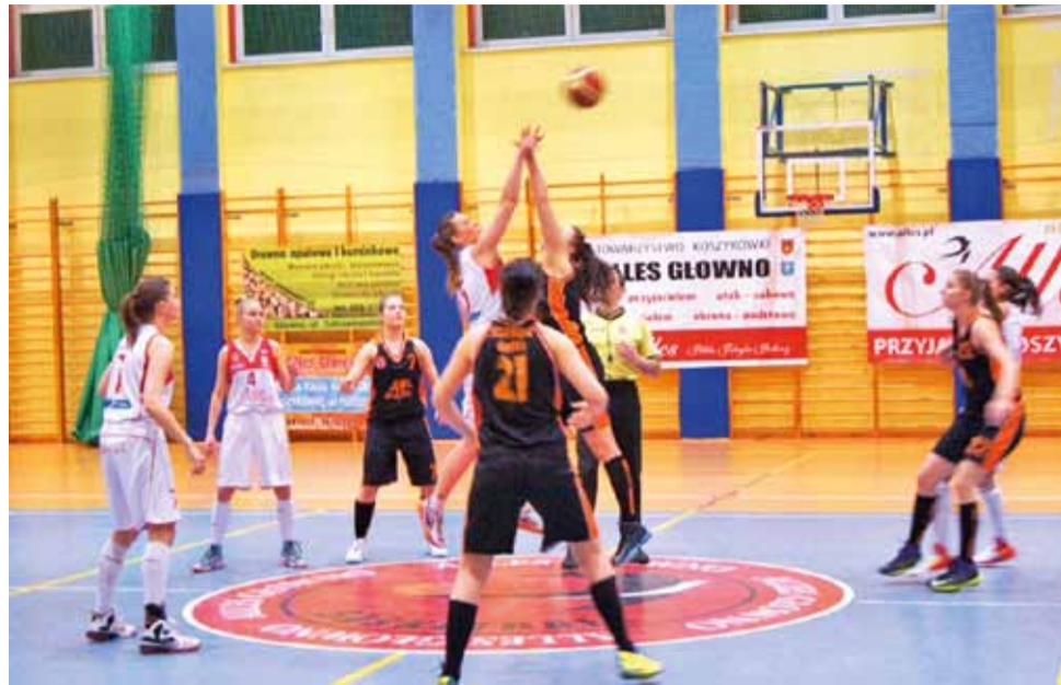
Mecz Alles Głowno (białe stroje) z Polonią Warszawa z pewnością nie będzie miło wspomniany przez głowieńskich kibiców.

Druga kwarta była w wykonaniu głównianek znacznie lep-