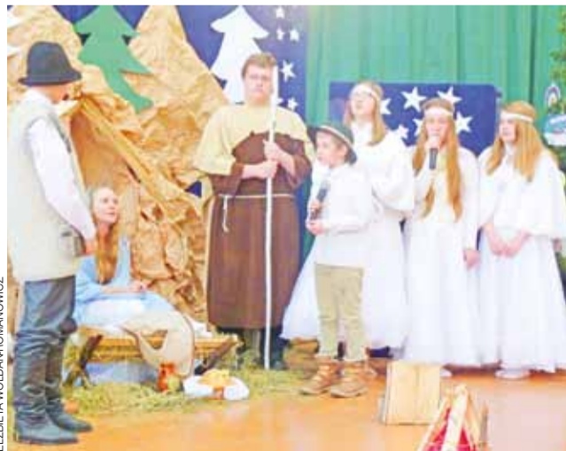
Pasterze u żłóbka. Jasełka w Zespole Szkół w Popowie Głowieńskim.