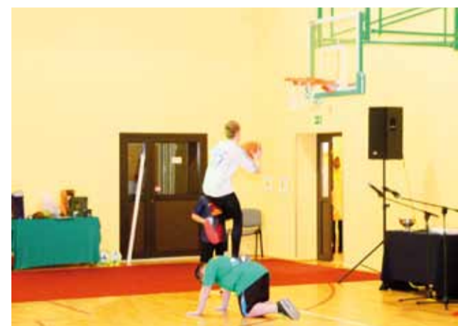
Podczas otwarcia sali gimnastycznej w Dobrej nie mogło również zabraknąć sportowych popisów uczniów.