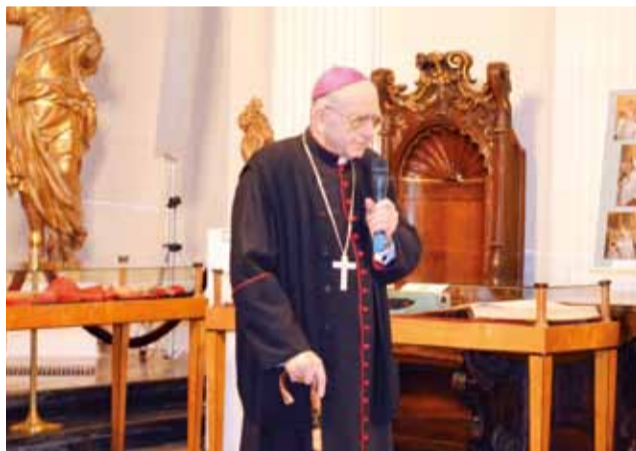
Biskup senior Alojzy Orszulik, o rok młodszego Józefa Glempa poznał jeszcze w seminarium.