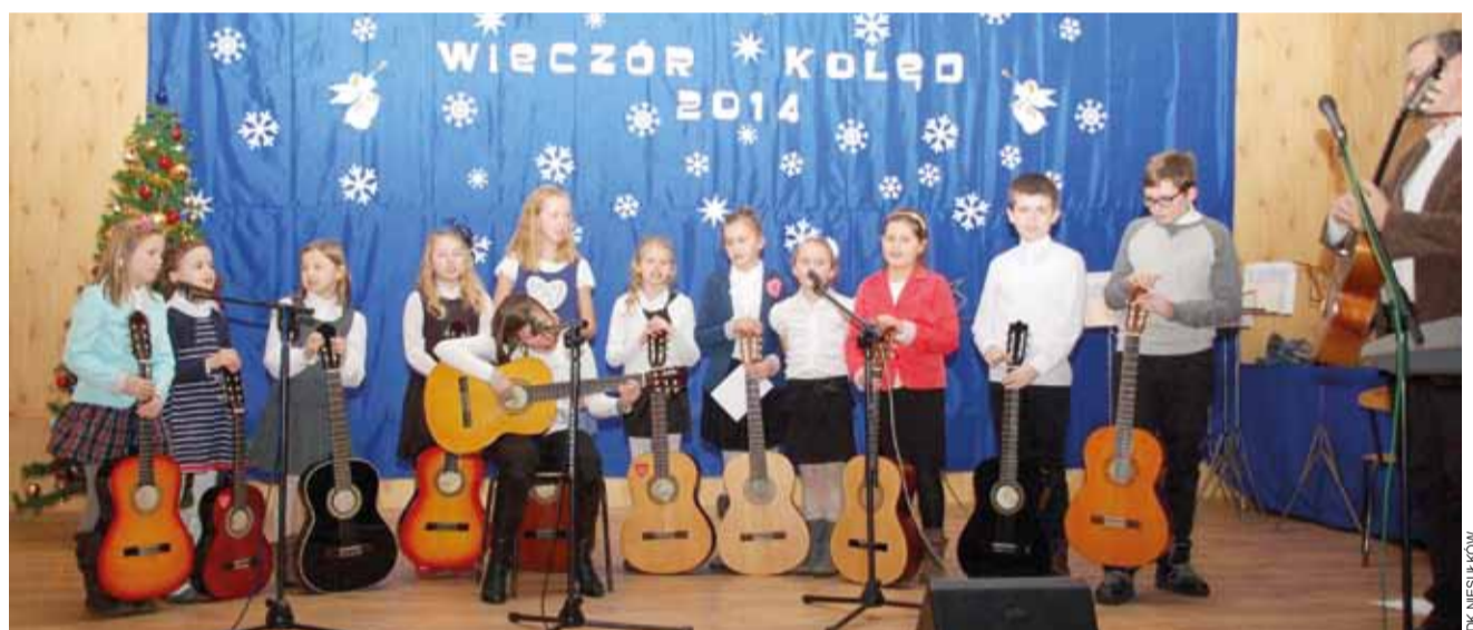
Zespół gitarowy działający w Szkole Podstawowej w Niesułkowie to najmłodsze pokolenie prezentujące się na dorocznym koncercie.