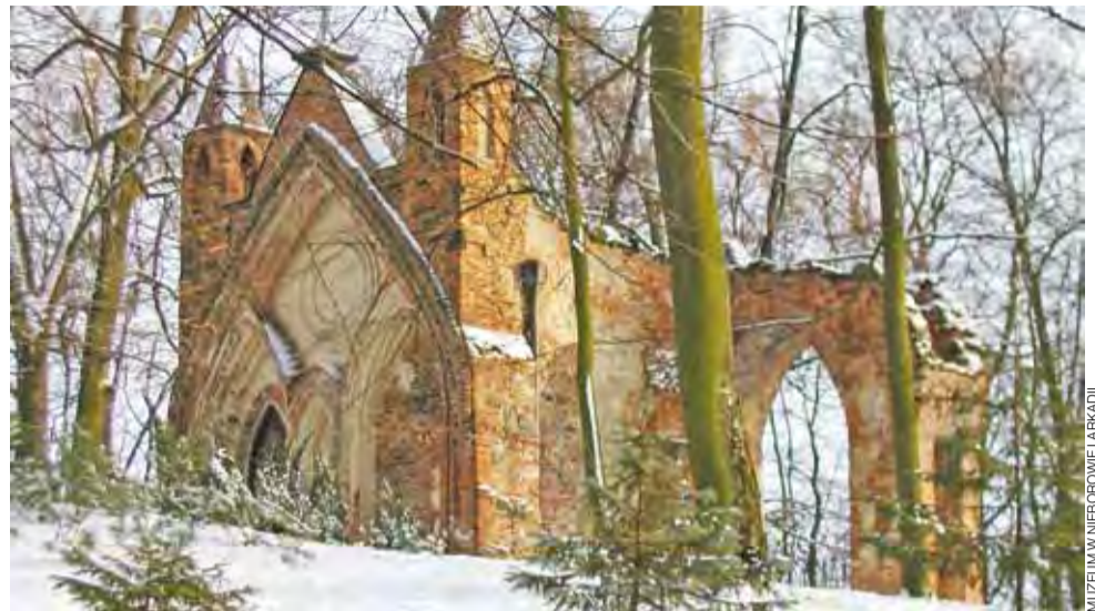
MUZEUM W NIEBOROWIE I ARKADII