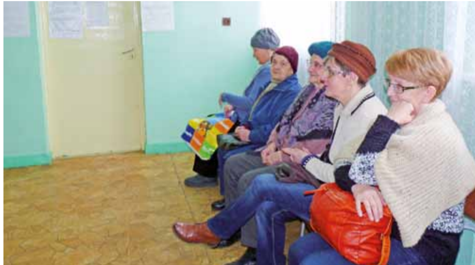
Pacjenci czekający pod gabinetem lekarskim w bratoszewickim ośrodku zdrowia, dziś prowadzonym jeszcze przez Remedium.