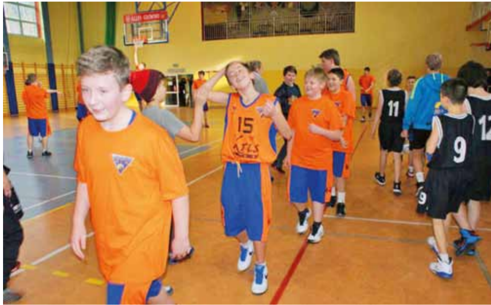
Młodzicy GTK Głowno w dobrych nastrojach przystępują do rywalizacji w finałach.

Coraz lepsza forma głowieńskich młodzików pozwala mieć nadzieję, że GTK w czterech nadchodzących spotkaniach może pokusić się nawet o komplet zwycięstw, dzięki czemu zajmie pierwsze miejsce.