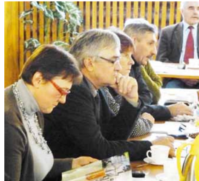
Radni chcą, aby szkoła w Mastkach dalej podlegała gminie.

Wójt chce, aby Stowarzyszenie Wspierania Inicjatyw Lokalnych w Chaśnie, choć nie dostanie pod opiekę szkoły, działało dalej. Zaznacza, że może ono być bardzo pomocne w pozyskiwaniu środków zewnętrznych na projekty oświatowe. ■