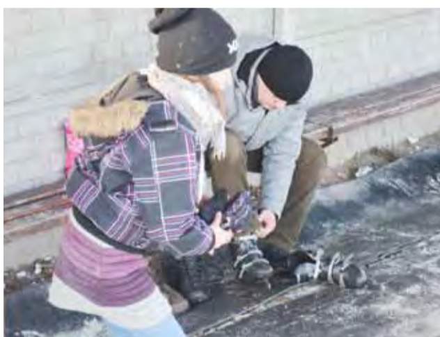
Wiązanie łyżew – dla komfortu jazdy i bezpieczeństwa.

Miłośnicy jazdy na łyżwach doczekali się w końcu możliwości poślizgnięcia się na powietrzu. W sobotę 25 stycznia odwiedziliśmy „Białego Orlika” przy ulicy Bolimowskiej oraz lodowisko przy szkole w Domaniewicach – rodzinnej miejscowości Zbigniewa Bródki. Duży mróz sprawił, że tego akurat dnia chętnych było przy Bolimowskiej mniej, niż można było się tego spodziewać. Tuż po godzinie 10 nie było jeszcze nikogo, „Orlik” zaczynał żyć dopiero od południa. W Domaniewicach też przybyli na lód najwytrwalsi – ci, którzy podkreślali, że mróz albo nie ma znaczenia, albo że wręcz nadaje zabawie klimatu. Nie było ich jednak tak wielu jak w pozostałe dni. Teraz mróz zelżał, warunki do jeżdżenia są idealne. Oba lodowiska mają być otwarte tak długo, jak pozwoli na to pogoda.