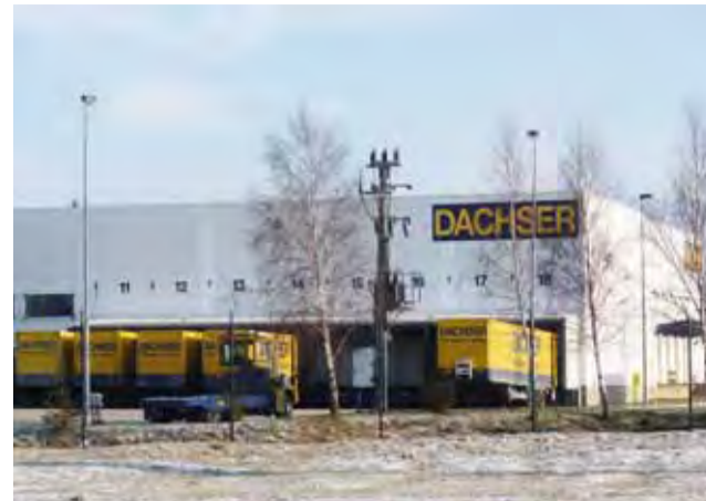
Terminal przeladunkowy spółki Dascher, pierwsza inwestycja logistyczna, która pojawiła się pod Strykowem wiele lat temu. Dziś firma chce się rozwijać, ale nie może, ze względu na zapisy w planie zagospodarowania.

Dobieszków | O pieniądzu i wokół pieniędzy