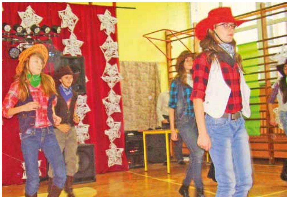
Uczniowie klasy VI w czasie zabawy karnawałowej zaśpiewali i zatańczyli do kowbojskiej piosenki pt. Rednex-Cotton Eye Joe