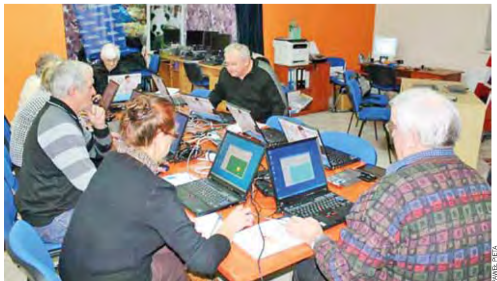
Ta grupa rozpoczęła zajęcia 20 stycznia. Jak zapewnia prowadzący zajęcia, kursanci są zdyscyplinowani i wiedzą, czego chcą się nauczyć.

– Są to głównie osoby w przedziale wiekowym 50-65 lat, chociaż mieliśmy też kursanta 82-letniego, który radził sobie już z komputerem, ponie-