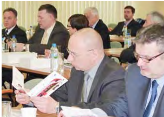
Zainteresowanie wzbudzały foldery Łódzkiej Kolei Aglomeracyjnej, a jeszcze bardziej to czy jej rozkład jazdy i prędkość rokuja, że ich załogi będą wołały jeździć do pracy pociągiem niż samochodem.