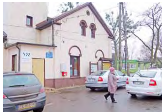
Ośrodek Zdrowia w Kołacinie mieści się dziś w tym budynku, nowy obiekt powstanie po przeciwnej stronie ulicy, obok sklepu i punktu aptecznego.

– Budowę rozpoczniemy na pewno w tym roku i chcielibyśmy ją jak najszybciej zakończyć. Inwestycja planowana jest na 3 lata, będzie to już zupełnie inny