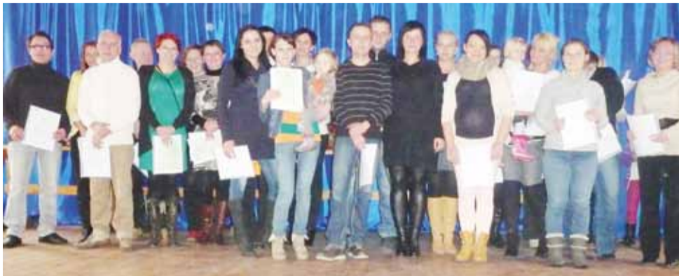
Po rozdaniu dyplomów. Podsumowanie „Aktywnej integracji...” 2013.

Do tej pory wydzwaniamy do nas ludzie pytając o te konsultacje. Mamy nadzieję, że uda nam się to kontynuować.