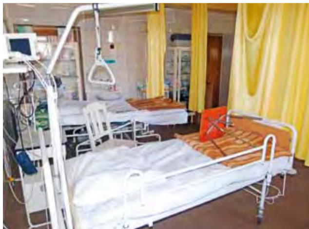
Oddział internistyczny. Po wystąpieniach sesyjnych wydaje się, że wszystkim zależy na dalszym funkcjonowaniu szpitala w Głownie, ale o tym, czy on nie opustoszeje, decyduje postępowanie konkursowe.

Lista zarzutów pod adresem właścicieli szpitala w Głownie była jeszcze dłuższa, dlatego dyrektorka Kręcka uważała za zasadne przedstawienie radzie przyczyn i skutków postępowania przedstawicieli WSInfU w kontaktach z Funduszem. – Mówiłam, że jeżeli nie będzie podpisa-