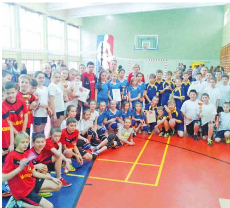
Uczestnicy Turnieju Mini Siatkówki w Gimnazjum Miejskim byli bardzo zadowoleni z przebiegu imprezy i żałują, że kolejne zawody dopiero za rok.