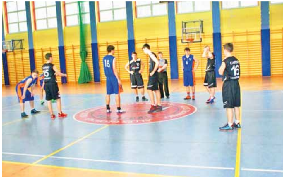
Juniorzy GTK Głowno (niebieskie stroje) liczą na wsparcie kibiców. Mecze we własnej hali zawsze były dodatkowym atutem po stronie głowieńskich zawodników.

Dwie najlepsze drużyny z Finału A, czyli Mistrz i Wicemistrz Województwa Łódzkiego będą reprezentować okręg podczas Turnieju Strefowego, który