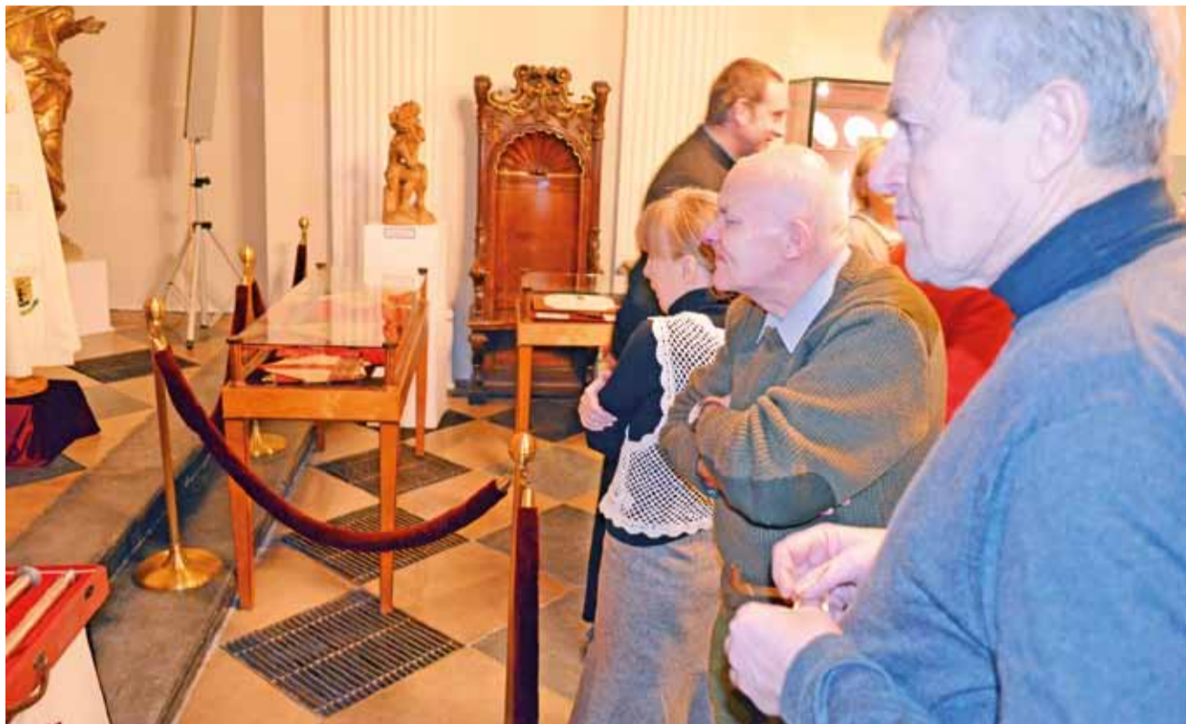
Na otwarciu wystawy nie było tłumów. Wszyscy oglądali eksponaty z dużym zainteresowaniem.