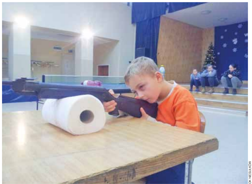
Zmaganiom strzeleckim z wiatrówek, chwilę przed strzałem, towarzyszyło wielkie napięcie.