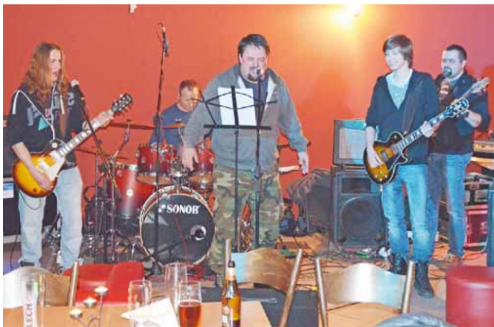
Mocny akcent na zakończenie koncertu – zespół bez nazwy (czyli de facto The Thrill ze zmienionym wokalistą) śpiewa piosenkę Proletaryatu.