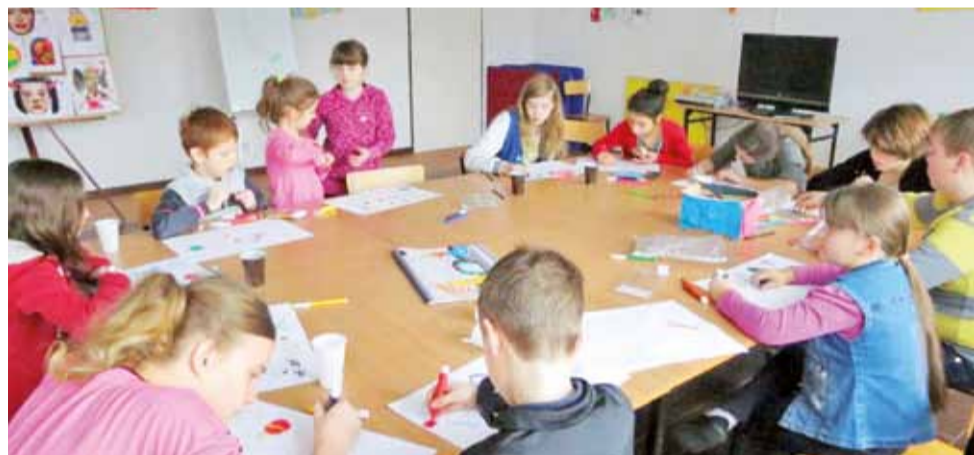
Ferie w dobieszkowskim OHP upływały miło m.in. na zajęciach plastycznych.

2 lutego w strażnicy OSP Stryków przy ul. Targowej odbędzie się zbiórka krwi. Potrzeba ona od 10. do 13. i przeprowadzi ją jak zwykle Regionalne Centrum Krwiodawstwa i Krwiolęcznictwa w Łodzi. Krew będą mogły oddać osoby dorosłe cieszące się dobrym stanem zdrowia. Na miejsce trzeba zabrać ze sobą dowód osobisty. IJS