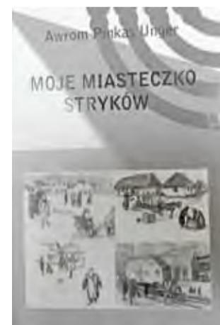
Nowa książka niebawem dostępna będzie w strykowskiej bibliotece.

Przypomnijmy, że w 2008 roku ukazała się monografia Bratoszewic „Z Dziejów Bratoszewic” Alicji Król-Kamińskiej,