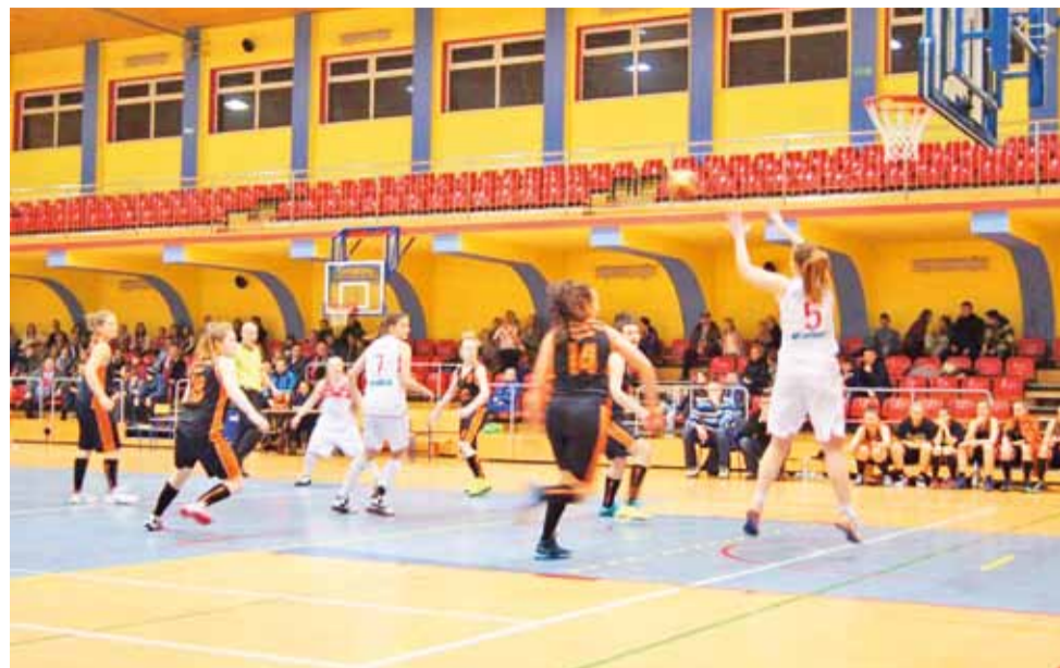
Zespół senierek Alles Głowno (białe stroje) potrafi stworzyć świetne widowisko. Szczególnie przed własną publicznością główki są trudne do zatrzymania.

grupach wiekowych. Seniorek, młodziezek do lat 14, zaczął do lat 12. Klub Głowna prowadzi nabór dziewcząt z rocznika 2000 i młodsze, chcących przeżyć sportową przygodę z koszykówką. Drużyny młodzieżowe TK Alles na co dzień z sukcesami rywalizują w Wojewódzkiej Lidze prowadzonej przez Łódzki Okręgowy Związek Koszykówki. O świetnym podejściu do młodzieży świadczą nie tylko wyniki sportowe głowieńskich koszykarek, ale także hasło, które zachęca dzieci do uprawiania tej dyscypliny sportu: „Każda Kasia, każda Ola gra w koszykówkę od przedszkola!”. Ponadto klubowi przyświeca motto: „Koszykówka - przyjacielem, trening - nauczycielem, atak - zabawą, obrona - podstawą”. Więcej informacji znaleźć można na oficjalnej stronie internetowej klubu, która mieści się pod adresem: www.tkalles.pl. wp