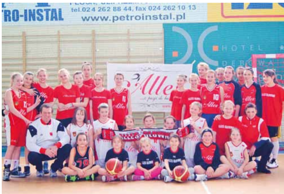
Nastroje w zespole młodych zawodniczek Alles są świetne dzięki wspaniałej współpracy trenerów i jeszcze nieoszlifowanych koszykarskich talentów.

Następna, 11. kolejka odbędzie się 1 lutego: Altkom AZS Politechnika Warszawska - UKS Basket Aleksandrów Łódzki, SMS PZKosz Łomianki - UKS Huragan Wołomin, Hutnik Warszawa - SKK Polonia Warszawa, UKS 4 Ursus Warszawa - Alles Głowno.