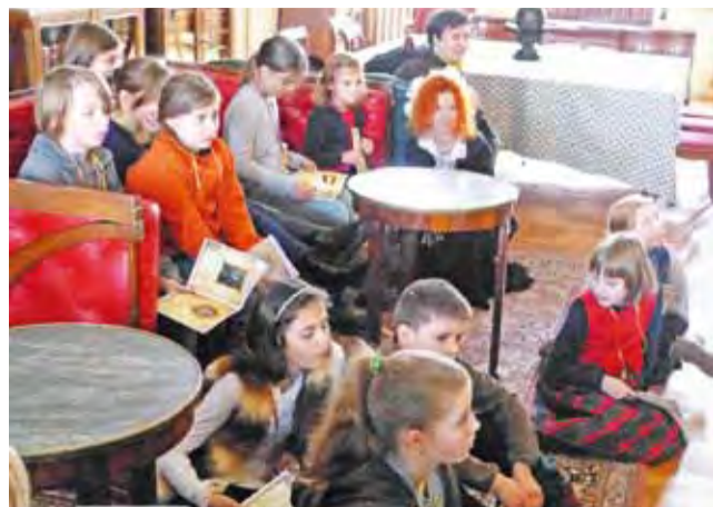
Dzieci zdobywają wiedzę w pałacowej bibliotece.