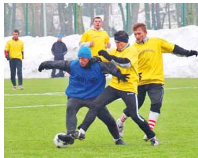
Zjednoczeni Stryków (żółte koszulki) nie oszczędzają się w sparingach.