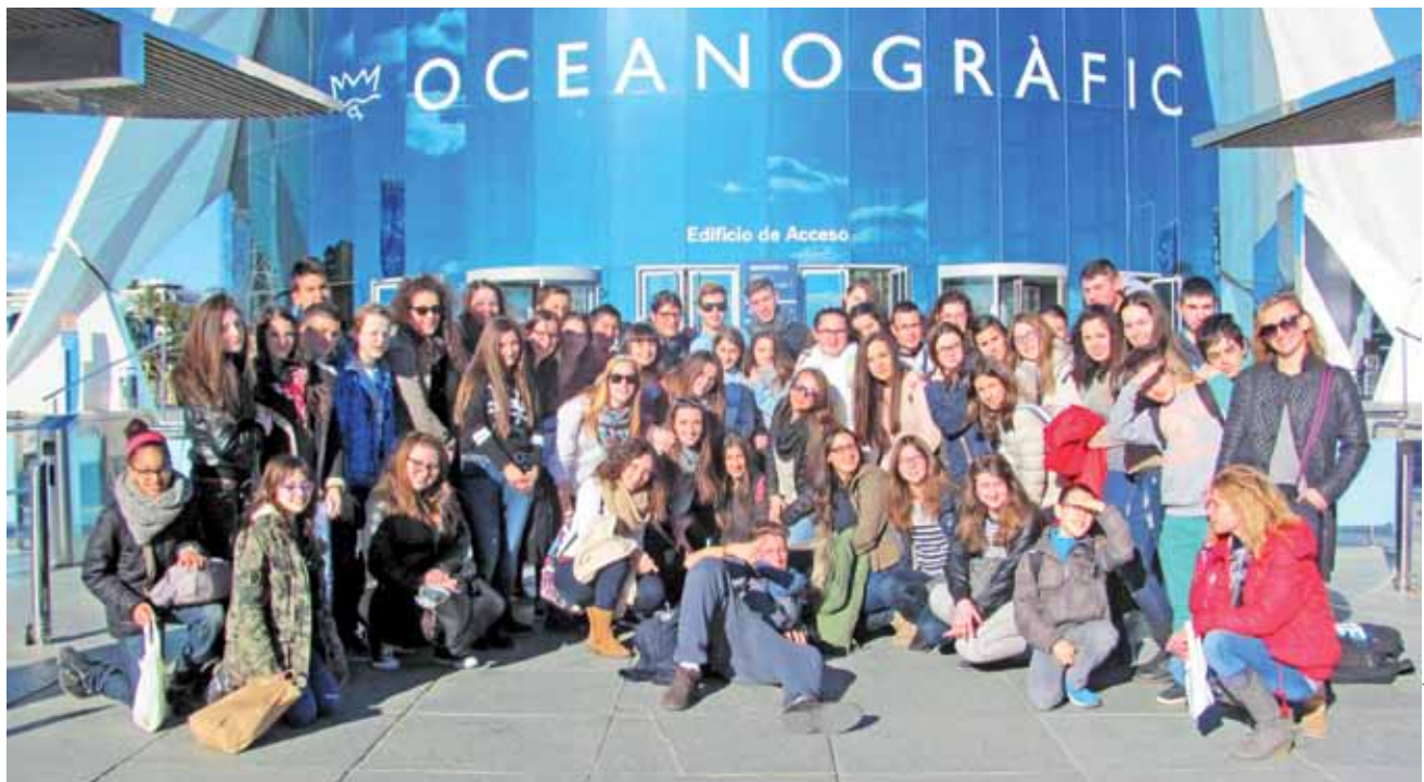
Międzynarodowa grupa młodzieży i nauczycieli przed oceanarium w Walencji. Znajduje się tam aż 13 ekosystemów światowych mórz i ponad 500 gatunków pływających zwierząt.

Do Hiszpanii strykwianie lecieli z przesiadką. W Zurychu musieli czekać 5 godzin, ale i to nie było żadnym problemem, ponieważ już wtedy nawiązali znajomości z Grekami, którzy lecieli z nimi drugim samolotem. Na miejscu czekali na nich