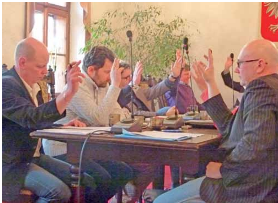
Radni Rady Miejskiej w Głownie poparli pomysły inwestycyjne burmistrza.

Do głosowania doszło 26 lutego i zgodnie z przewidywaniami nie było żadnych niespodzianek, radni przyjęli propozycje władz miasta. W głosowaniu „za” głosowali wszyscy obecni na sali. Przypomnijmy więc, jakie inwestycje mają zostać w tym roku zrealizowane. Łącznie z pierwotnie planowanymi w budżecie środkami mają one kosztować 3.060.470 zł. Na pierwszy etap budowy boiska wielofunkcyjnego przy Szkole Podstawowej nr 1 zabezpieczono w budżecie 775.470 zł. Istnieje szansa na uzyskanie dofinansowania w wysokości do 1/3 kosztów z Urzędu Marszałkowskiego.