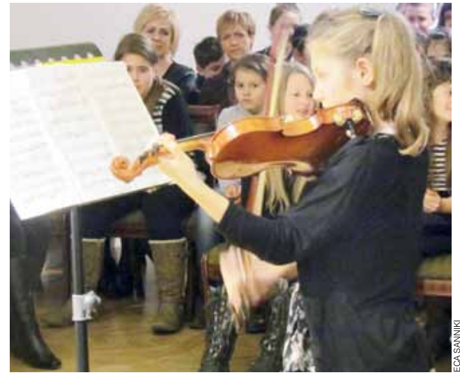
Uczniowie z Gąbina mieli okazję po raz pierwszy wystąpić we wnętrzach pałacu w Sannikach.

Projekt „Kalina – utrwała tradycje” zrealizowano w ramach programu Działaj Lokalnie VIII Polsko-Amerykańskiej Fundacji Wolności, który realizuje Akademia Rozwoju Filantropii w Polsce oraz Stowarzyszenie Lokalna Grupa Działania POLCENTRUM. ■