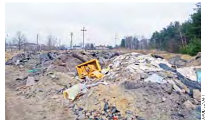
Składowisko nie należy do najprzyjemniejszego sąsiedztwa.