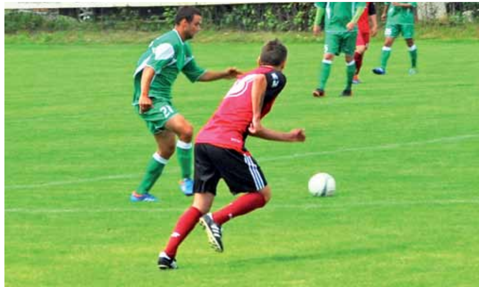
Piłkarze Sokola (zielone stroje) już kiedyś sprawdzali formę Zjednoczonych. Wtedy też wygrali do zera.

miała wpływ na postawę Zjednoczonych w tym spotkaniu, którzy od początku nie wyglądali zbyt pewnie. Strykowie dość długo adaptowali się do panujących warunków, co wykorzystali gracze Sokola. W 15 min. zawodnik Aleksandrowa Łódzkiego przejął piłkę po zbyt krótkim wybiegu obrońcy Strykowie i pięknym strzałem z 20 m w samo okienko strzelił bramkę, dającą prowadzenie Sokolowi. Kilka minut później Aleksandrowianie prowadzili już 2:0. Defensywa Strykowie nie upil-