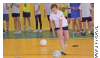
Konkurs 5 milionów w szkołach.

ślalomem, sztafety ortograficznej oraz biegu z przeszkodami zawrotnymi przez ławeczkę. Natomiast najstarsi uczniowie z klas V-VI zmagali się z konkurencjami typu: kozłowanie piłki koszykowej i ręcznej, przekładanie piłek z lewej na prawą stronę oraz wyścig z przyborami. Podczas tych wszystkich skomplikowanych zadań najlepiej spisujący się uczniowie ze Szkoły Podstawowej nr 2 ze Strykowie, którzy uzyskali tym samym prawo reprezentowania Gminy Stryków na Mistrzostwach Powiatu Zgierskiego, które odbędą się już w najbliższy piątek, 7 marca od godz. 10:00 w Hali MOSiR w Zgierzu. wp