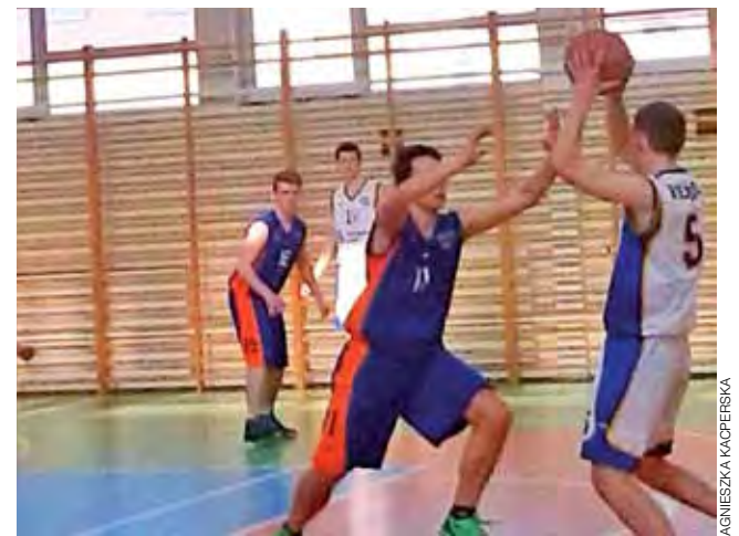
Koszykarze GTK (pomarańczowo-niebieskie stroje) podczas obrony.