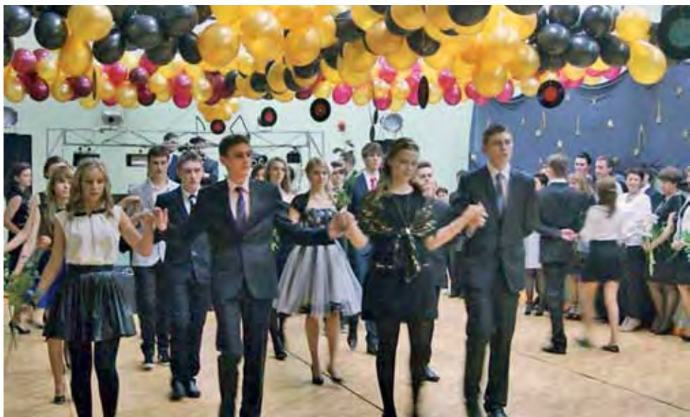
Polonez gimnazjalistów. Bal odbył się na efektywnie przystrojonej szkolnej sali gimnastycznej.