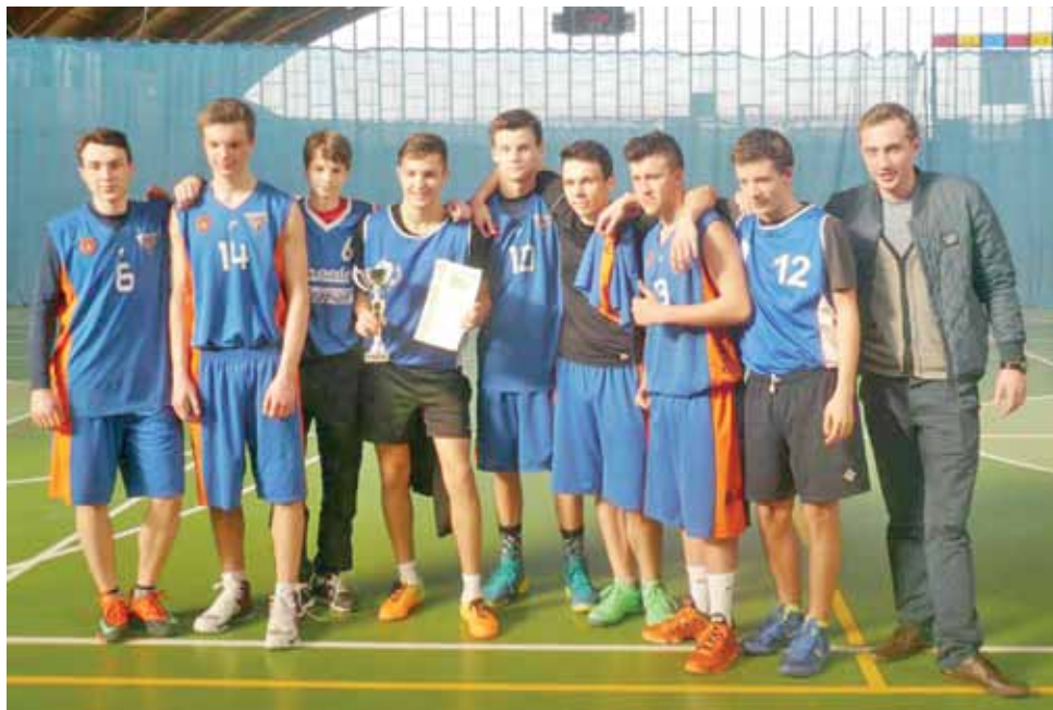
Uczniowie Liceum Ogólnokształcącego w Głownie - mistrzowie powiatu zgierskiego w koszykówce.

Głownianie wygrali wszystkie spotkania w ramach powiatowej Gimnazjady i nie dali rywalom żadnych szans.