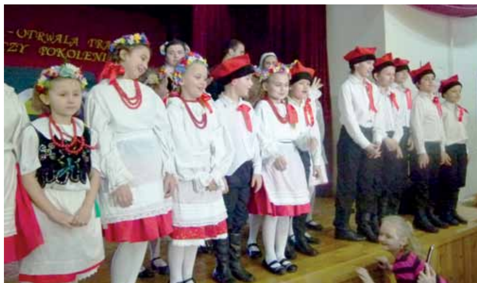
Dumni młodzi tancerze po swoim brawurowym występie.

Końcowym efektem pracy gimnazjalistów było nakręcenie filmu „Moje miejsce”, w którym opowiadali o swoich ulubionych miejscach, w których lubią spędzać czas. Gdy projekt był podsumowywany, Zygmunt Murowaniecki nakręcił reakcje młodych ludzi na stworzony przez nich obraz i na bazie tego materiału stworzył swoisty film o filmie. Przy realizacji projektu „Kalina...” zdecydowano o tym, że to właśnie on powinien zająć się kręceniem filmu o zespole.