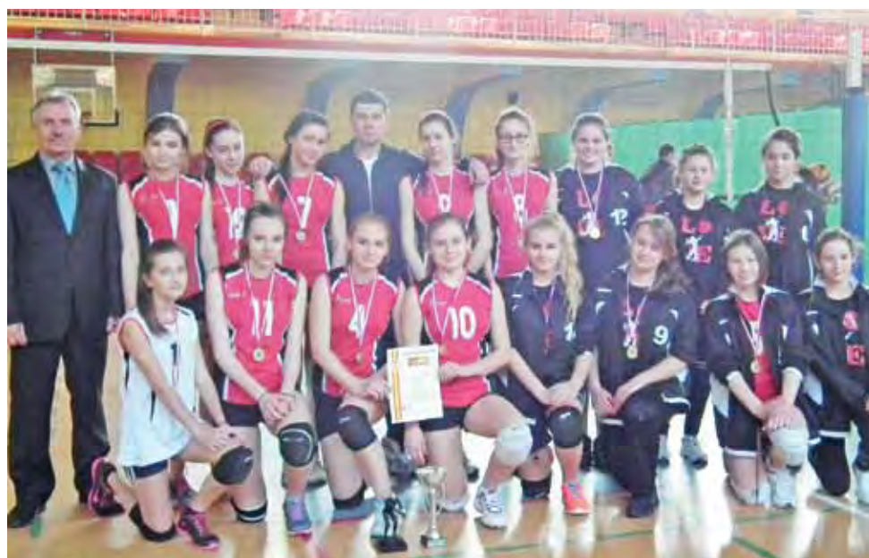
Uczennice głowieńskiego Gimnazjum Miejskiego - najlepsze siatkarki powiatu zgierskiego.

W grupie I znalazły się drużyny Gimnazjum Powiatowego w Głownie, Gimnazjum Miejskie w Aleksandrowie Łódzkim i ZSS Aleksandrów Łódzki. Głowieńskie siatkarki niestety przegrały dwa spotkania po 0:2