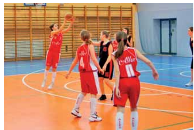
Zawodniczki TK Alles Głowno (czerwone stroje) mają szansę zostać trzecią drużyną województwa łódzkiego.

Następna, 4. kolejka Finału C odbędzie się 9 marca: Widzew II Łódź – UMKS Książak Łowicz, UKS Teofilów 48 Łódź – Mag-Rys Zgierz, UKS Basket II Aleksandrów Łódzki – pauza.