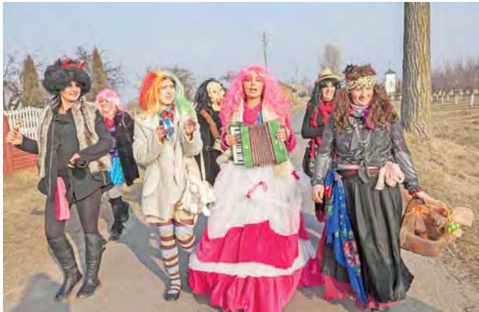
Kolorowy korowód w Strzebieszewie.