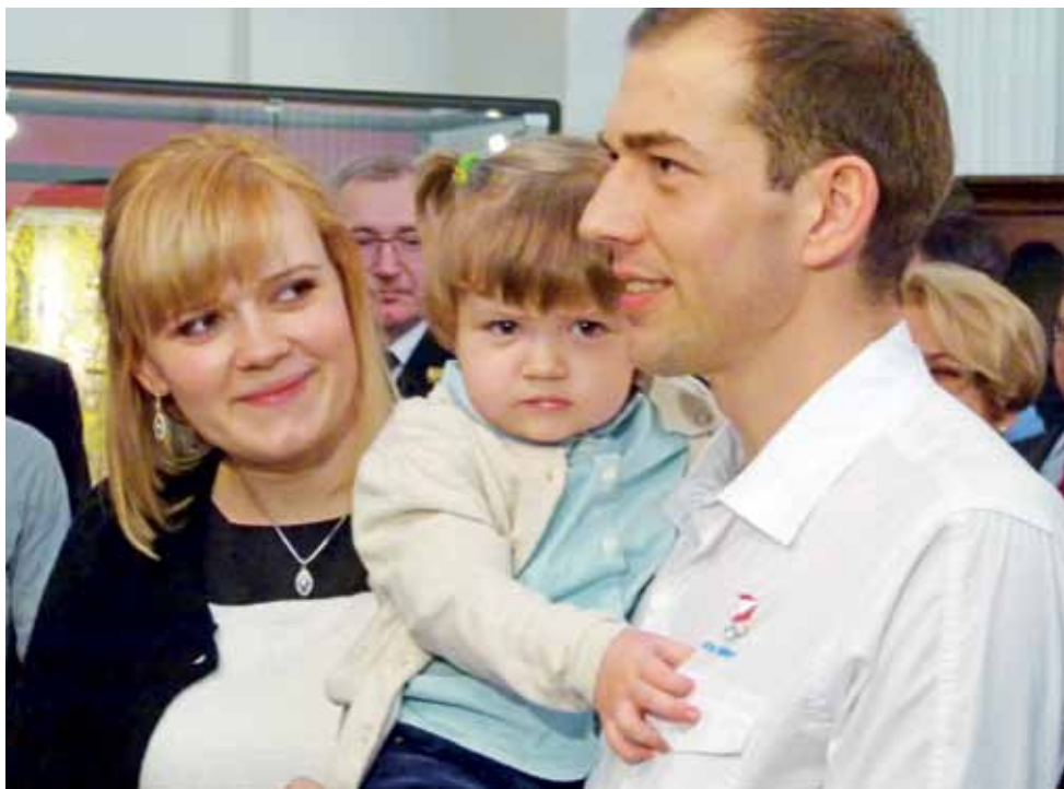
Zbigniew Bródka przyjechał do Łowicza z rodziną, m.in. z żoną oraz starszą córką.