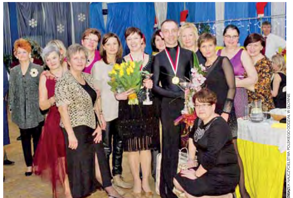
Mistrzowie Polski. Zwycięzcy w otoczeniu kolegów z oddziału ZNP w Głownie.