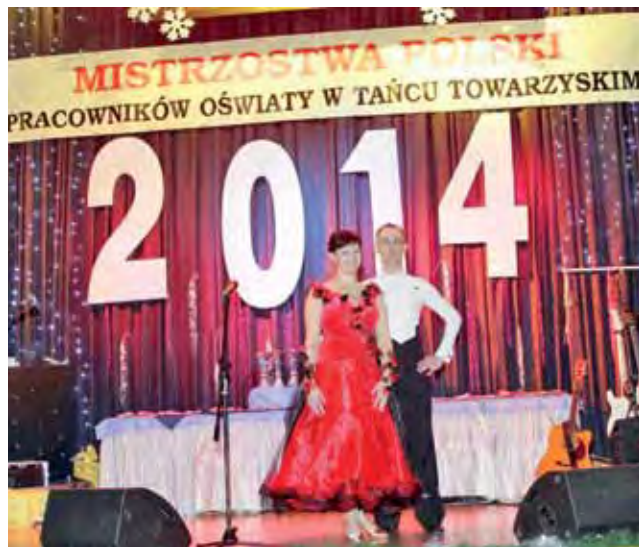
Mistrzowska para. Zwycięzcy Tanecznego Turnieju Pracowników Oświaty.

Entuzjastyczny doping kolegów z Głowna momentami zagłuszał słowa jurorów.