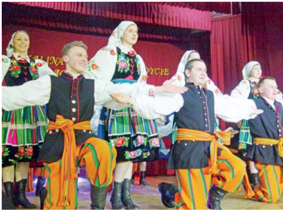
Zespół Pieśni i Tańca Kalina w trakcie występu (suity tańców łowickich) na gali podsumowującej projekt.