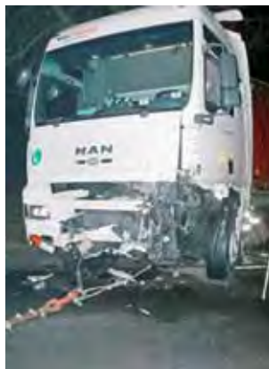
Samochód osobowy w wyniku zderzenia został całkowicie zniszczony, TIR poważnie uszkodzony po stronie kierowcy, gdzie przyjął uderzenie.

Kierujący Manem 35-latek z powiatu sochaczewskiego nie odniósł obrażeń, był trzeźwy. Stan trzeźwości kierowcy BMW określa wyniki sekcji zwłok, które do 4 marca (do momentu zamykania tego numeru Wieści)