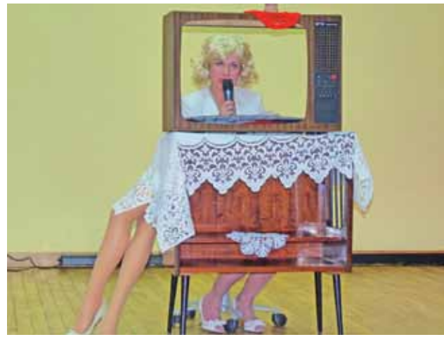
Boska Loska i dziennik telewizyjny w wykonaniu KGW Szczecin.