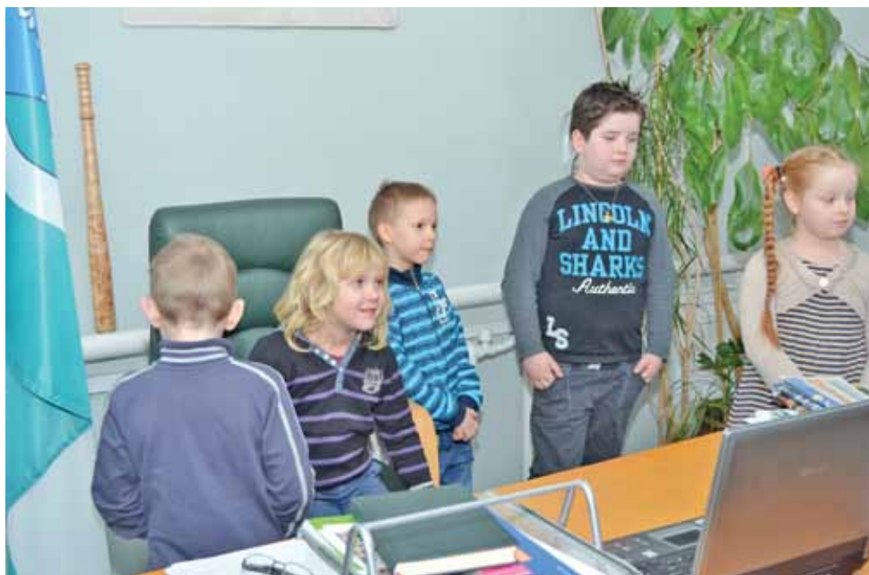
Na stanowisku. Każdy mały gość miał okazję na chwilę zasiąść w fotelu wójta gminy Głowno.

Wszystkie procedury mogą potrwać od kilku miesięcy do nawet roku. kl