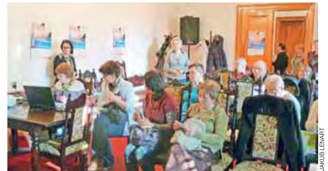
Na spotkaniu z przedstawicielami ZUS pojawiło się około 20 osób.

kładu wnioski. Płatnicy składek mogą poprzez PUE sprawdzać dane osób zgłoszonych do ubezpieczenia, składać wnioski dotyczące rozliczeń itp. Z kolei świadczeniobiorca może dzięki niej np. sprawdzić informacje na temat otrzymywanych świadczeń. Lekarze mogą wystawić i przegłądać zaświadczenia.