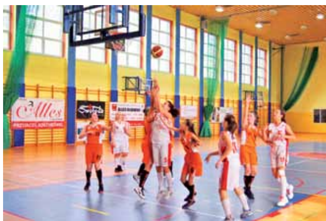
Widzew (czerwone stroje) po raz kolejny okazał się lepszy od TK Alles.