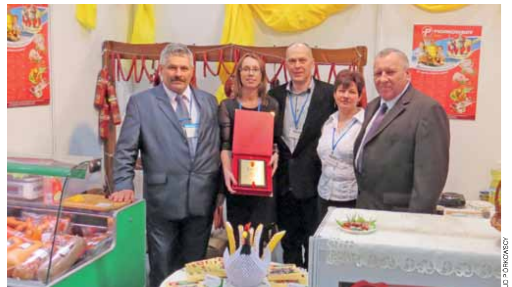
Przedstawiciele UD Piórkowscy tuż po wręczeniu nominacji.