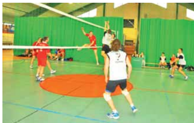
Siatkarze głowieńskiego Volleyball (białe koszulki) udanie reprezentowali miasto podczas mistrzostw Łowicza.