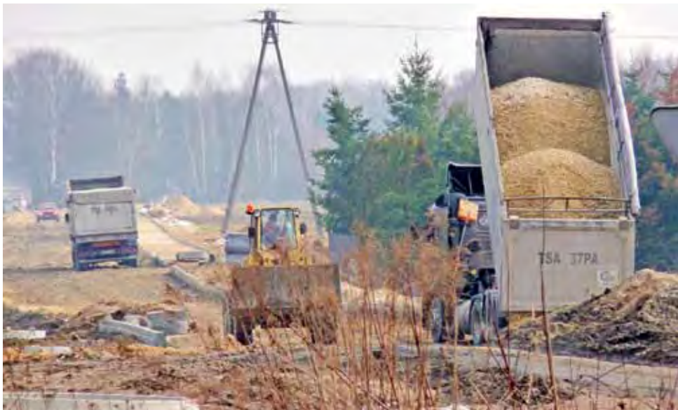
Nowa droga budowana w kierunku Sosnowca Pierki ma skomunikować obszar przemysłowy firmy Prologis, położony wzdłuż trasy krajowej nr 14.

Przypomnijmy, że na stanowisko kierownika nowego referatu miasto przeprowadziło konkurs, ale żaden z sześcioro kandydatów nie przeszedł dalej niż do testu wiedzy z zakresu wymiennego w ogłoszeniu o konkursie (wiedza z zakresu samorządu, finansów publicznych, ochrony środowiska, nowej ustawy o gospodarce odpadami itd.).