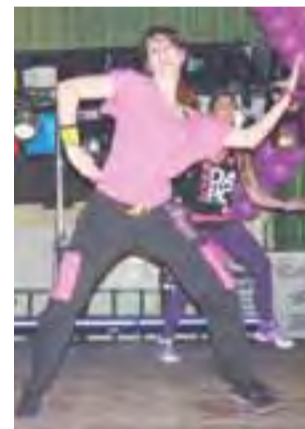
Instruktorzy pokazywali układy, nieznanie wcześniej uczestnikom.

Maraton trwał trzy godziny. Wydarzenie to było przygotowane we współpracy ze stowarzyszeniem Łowicki Klub Amazonek. Występ tancerzy był charytatywny. Dla wszystkich uczestników zapewniona była woda do picia i zdrowe przekąski, głównie owoce. W przerwie przeprowadzono aukcję. Zlicytowano między innymi: koszyki z wikliny papierowej, serwetę szydełkową, aniolki z masy solnej a także biżuterię, zaprojektowaną, wykonaną i ofiarowaną