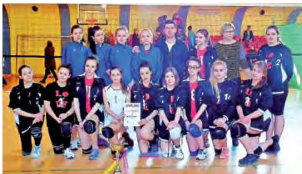
Zespół Gimnazjum Miejskiego im. Jana Pawła II w Głownie - wicemistrzynie rejonu w siatkówce dziewcząt.