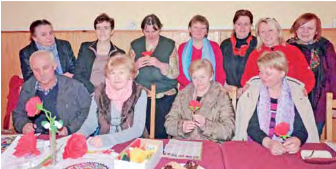
Członkowie Stowarzyszenia „Dolina Bobrówki” mają mnóstwo pomysłów i chęci do działania. Jako formalna organizacja, będą starali się o pozyskanie funduszy, by realizować swoje zamierzenia.