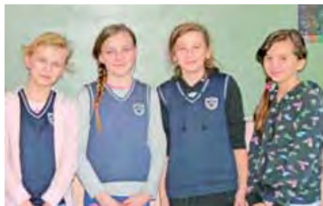
Zaśpiewały „W moim ogródecku” i zwyciężyły.

Klasa, która przygotuje najlepszą PIT-a i najsukceszniej przekona rodziców, wygra darmowe wyjście do kina „Feniks”. Termin nadsyłania prac mija z ostatnim dniem kwietnia, tak samo jak termin rozliczeń z fiskusem.