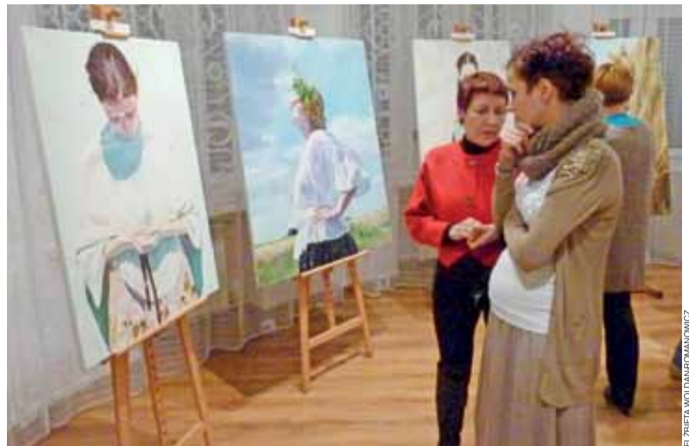
Na werniszu. Wystawa „O niej” została 7 marca otwarta w galerii MOK w Głownie.