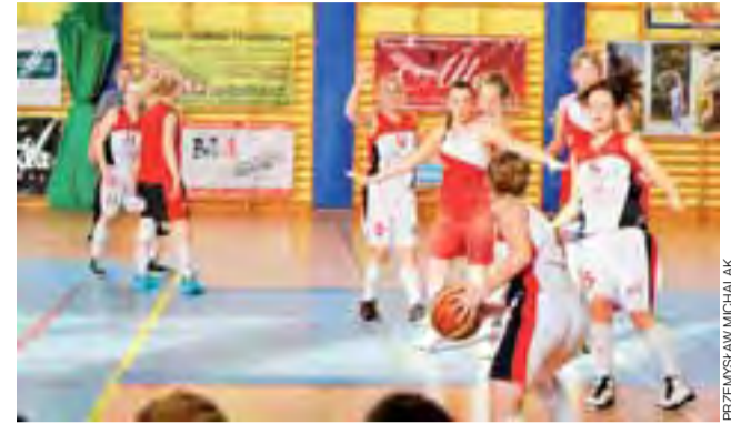
Młodziczki TK Alles (białe stroje) trzecie w województwie łódzkim.

Głownianki od początku wiedziały czego chcą i zaatakowały koszykarki Sieradza z całych sił. Już w pierwszej kwarcie TK Alles objął wysokie prowadzenie 22:13. W drugiej odsłonie gra się bardziej wyrównała. Goście