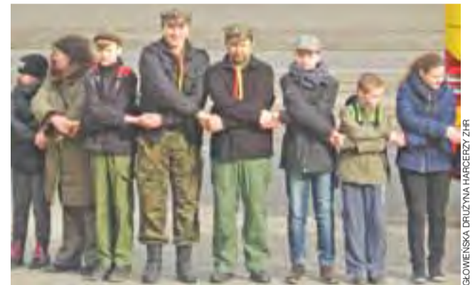
W braterskim uścisku. Harcerze ZHR z Głowna na Dniu Myśli Braterskiej w Łodzi.

„Jedynka” jest ostatnią miejską podstawówką, która nie ma jeszcze nowoczesnego boiska. W minionych latach przy SP nr 2 i SP nr 3 zostały wybudowane Orliki. O wyborze wykonawcy decyduje cena. Po zakończeniu prac miasto może liczyć na zwrot 33% kosztów, tytułem refinansowania inwestycji przez Urząd Marszałkowski w Łodzi. ewr