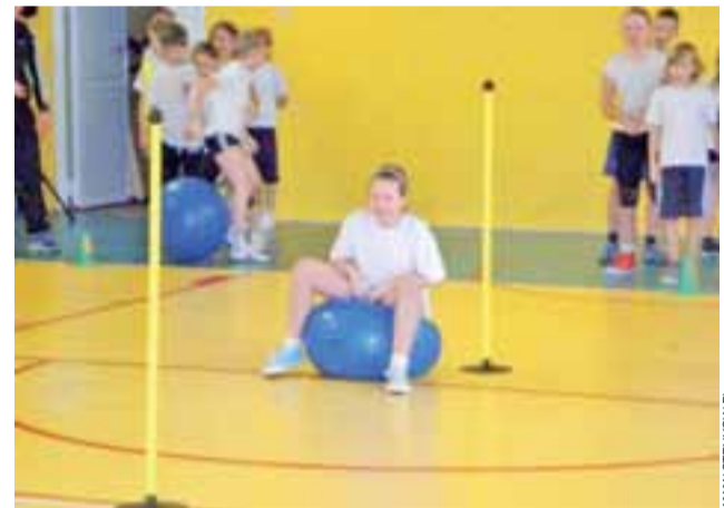
Jedna z konkurencji 5 milionów - wyścig na piłce z uszami należała do bardzo lubianych przez uczniów.