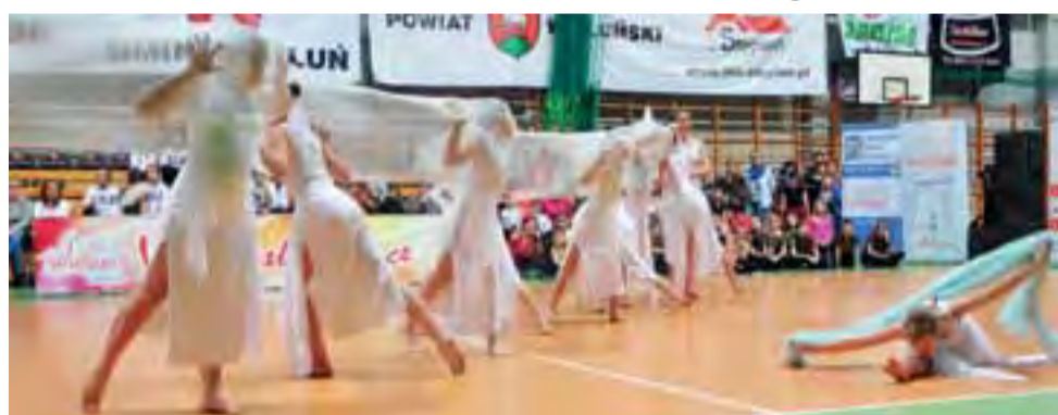
Utwór „Ave Maria” nagrodzony pierwszym miejscem.

Wiele godzin spędzonych na przygotowaniach, zaowocowa-