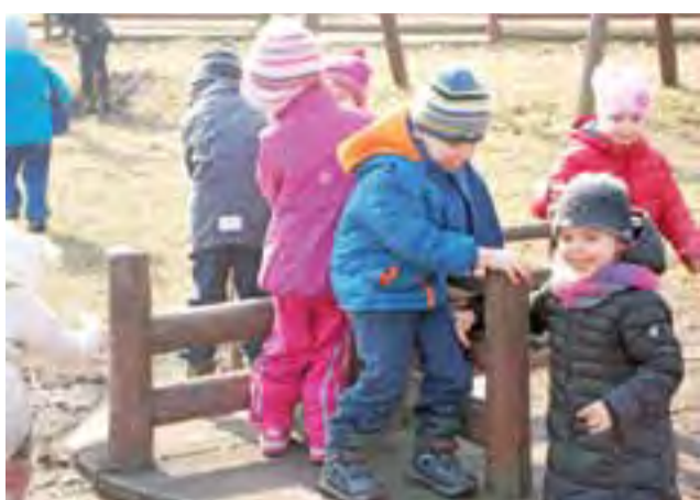
MIEJSKIE PRZEDSZKOLE NR 3

Sport to zdrowie. Dzieci z Miejskiego Przedszkola nr 3 w Głownie rozpoczęły sezon wiosennych wypraw w różne zakątki miasta. W ubiegłym tygodniu wraz z nauczycielkami udały się na plac zabaw nad zalewem Mrożyczka, gdzie spędziły przedpołudnie korzystając z huśtawek, zjeżdżalni i karuzeli. Nikogo nie trzeba było zachęcać do zabawy. oprac.ewr