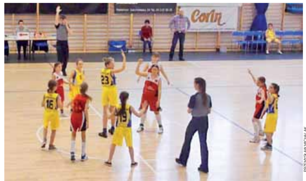
Początek meczu TK Alles Głowno - TK Basket I Stryków. Niezapomniana chwila, bowiem było to pierwsze w historii derbowe starcie w koszykówce dziewcząt. Zwycięsko wyszły z niego koszykarki głowieńskiej Towarzystwa Koszykówki (czerwone stroje).