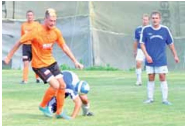
V-ligowi gracze Justynowa (pomarańczowe koszulki) okazali się lepszymi od strykowskiego kandydata do awansu do III ligi.

Zjednoczeni mieli zacząć agresywnie, tak jak będą grać w spotkaniach ligowych. Początkowo niewiele z tego wynikało, a po przypadkowej akcji gospodarze niespodziewanie wyszli na prowadzenie. W polu karnym błęd popełnił Podedworny, który źle wybił piłkę, a później spokojnie rzut wolny pośredni z 7 m. Mimo zamurowania bramki Strykowiec Justynowa precyzyjnym uderzeniem pod poprzeczkę pokonał Pająka. Odpowiedź gości była błyskawiczna. W 17 min. po świetnym zagra-