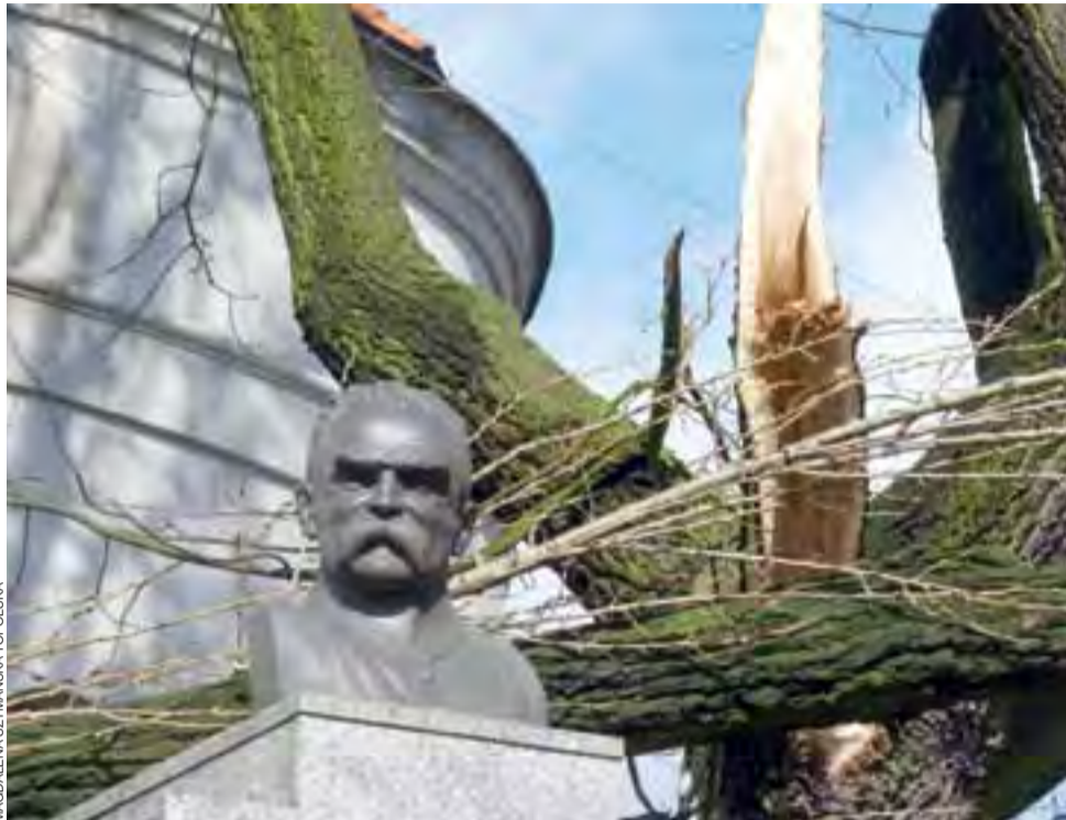
W Głownie dużych strat nie było, ale w Łowiczu i okolicach problemów było sporo – wiatr zrywał dachy, spadające gałęzie uszkadzały samochody. Cudem ocalało popiersie Józefa Piłsudskiego na cokole przy ul. Podrzecznej w Łowiczu, obok którego runęła stara topola.

NASI DZIENNIKARZE DO WASZEJ DYSPOZYCJI OD 8.30 DO 15.30 Telefon redakcyjny 42 710 82 55 e-mail: jakub.lenart@lowiczanie.info JAKUB LENART