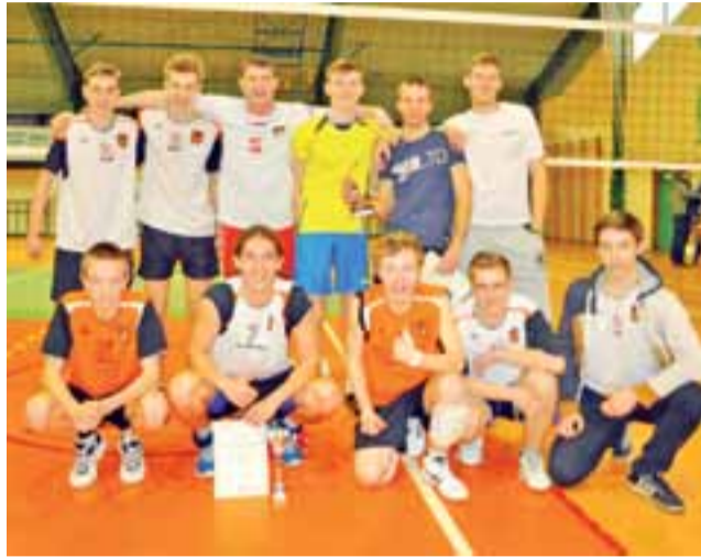
Siatkarze Volleyball Głowno mogą się cieszyć z trzeciego miejsca w Pucharze Ligi SAM Łowicz.