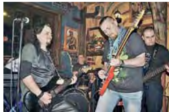
Sochaczewski zespół Tajm będzie gwiazdą kolejnego rockowego wieczoru w nieborowskiej Oazie.

kazać je innym – najpierw burmistrzowi Krzysztofowi Janowi Kalińskiemu w Ratuszu, a potem rodzinom w domach. tm