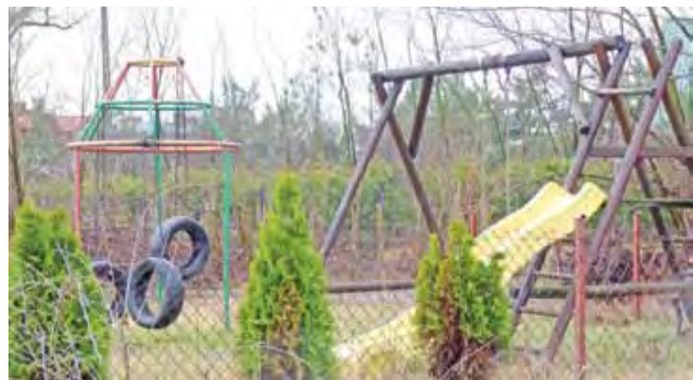
Plac zabaw na os. Kopernika jeszcze przed wiosennymi porządkami. Pytanie tylko, kto je wykona?

Pomysł powstania stałej ekspozycji najmniejszego w Polsce muzeum dojrzał od kilku lat. Inicjatywa wypłynęła od Marty Wróbel, właścicielki Galerii Łowickiej. Jacek Rutkowski uważa, że warto to zrobić, ponieważ jego zbiory dotychczas pokazywane były okazjonalnie. Było to bardzo uciążliwe, ponieważ przygotowanie ich wymagało dużego nakładu pracy, a miała okazję je obejrzeć ograniczona liczba osób. str. 25