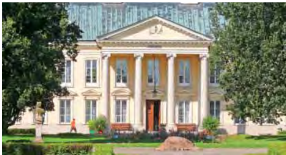
Pałac w Walewicach jest jednym z najciekawszych zabytków w powiecie łowickim.