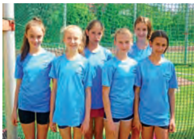
Żeńska drużyna SP nr 3 w Głownie, czyli wicemistrzynie powiatu zgierskiego w czwórboju lekkoatletycznym.

Młodzi lekkoatleci ze szkół podstawowych przystępują do rywalizacji tradycyjnie w maju, po rozegraniu eliminacji gminnych. W Głownie bezkonkurencyjna była SP nr 3 i to ona reprezentowała miasto na zawodach powiatowych. Rywalizacji sprzyjała pogoda, dlatego kibice mogli oglądać zmagania na dobrym poziomie. Sześciuosobowe zespoły dziewcząt i chłopców rywalizowały w następujących konkurencjach: sprint na 60 m, skok w dal, bieg na 600 m (dziewczeta) i 1000 m (chłopcy) oraz rzut piłeczką palantową. Każdy zawodnik za osiągnięty wynik otrzymywał punkty, które później zostały zsumowane do wyniku całej drużyny. Po kilku godzinach rywalizacji okazało się, że zarówno w kategorii dziewcząt, jak i chłopców głownianie uplasowali się na bardzo wysokim drugim miejscu, zostając tym samym wicemistrzami i wicemistrzami powiatu zgierskiego. Bezkonkurencyjni okazali się gospodarze z Zespołu Szkół Sportowych nr 3 w Alek-