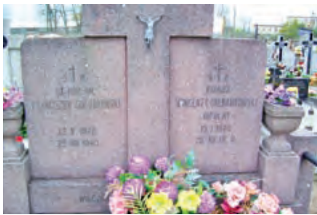
Grób księży posługujących w strykowski parafii św. Marcina w Strykowie.