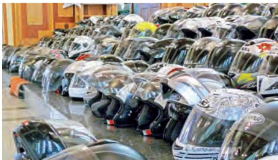
Motocykliści złożyli pod ołtarzem kościoła na Korabce 160 kasków, które na zakończenie mszy zostały poświęcone przez księżę.