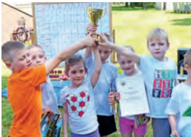
Dzieci z Przedszkola Diecezjalnego cieszą się z pucharu za I miejsce.