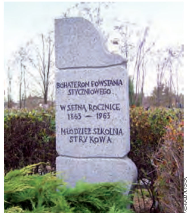
Pomnik poświęcony bohaterom Powstania Styczniowego na cmentarzu w Strykowie.

Na archiwalnej fotografii wykonanej ok. 1916 r. widoczne są nieistniejące dziś macewy i rosyjskie okopy, będące fragmentami fortyfikacji pozostałymi po rozgrywającej się tutaj bitwie łódzkiej. Dziś obok nieistniejącego już cmentarza przebiega północna obwodnica Strykowa. ■