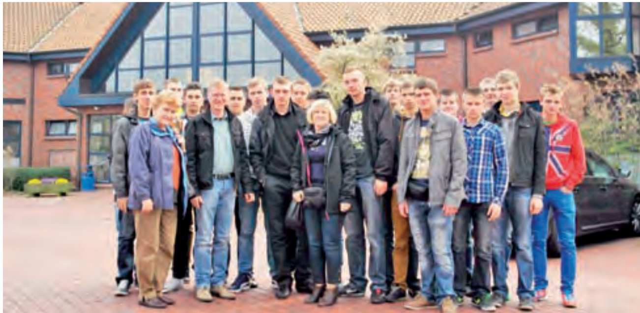
Grupa uczniów była liczna – i wyłącznie męska.

O projekcie pisaliśmy na naszych łamach w momencie, gdy szkoła do niego przystąpiła, jesienią ubiegłego roku. Uczniowie biorący w nim udział rozpoczęli wówczas dodatkowe zajęcia z języka niemieckiego, mechanizacji rolnictwa, ochrony roślin i środowiska, BHP i pedagogiczne. Poznawali też kulturę Niemiec i zgłębiali zasady savoir vivre.