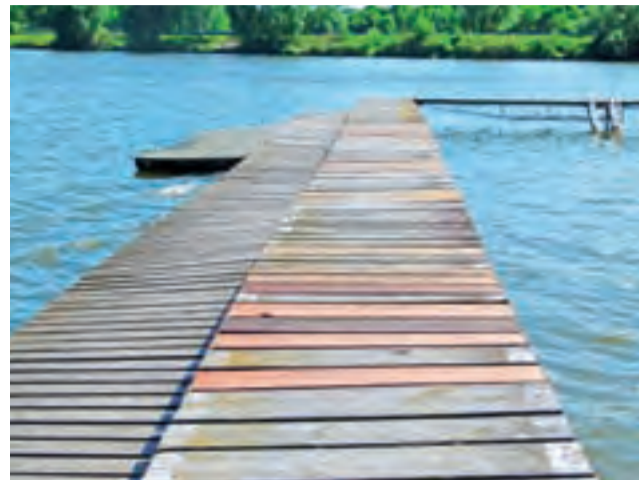
Molo przy kąpielisku zostało naprawione

Zakład wyrobił się z pracą dużo szybciej. Czterech pracowników MZK 20 maja uwinęło się w ciągu dnia pracy z uzupełnieniem wszystkich braków.