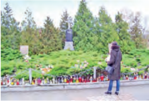
Pomnik poświęcony żołnierzom poległym w I wojnie światowej na cmentarzu w Strykowie.