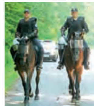
Patrol policyjny na koniach przyjechał do Nieborowa aż z jednostki w Tomaszowie Mazowieckim.

że prawdopodobnie było to pierwsze wykorzystanie takiego patrolu na naszym terenie. Nawet mecz Pelikana w Łowiczu nigdy nie miały takiej asysty. Zabezpieczono wszystkie możliwe drogi dojazdu do Nieborowa, na każdej stał radiowóz. Łódzcy kibice zachowywali się jednak spokojnie, prawdopodobnie zdali sobie sprawę, że nie mają szans ze znacznie większymi siłami policji, przed gwizdkiem sędziego ogłaszającego przerwę, po pierwszej połowie meczu, w większości odeszli, wsiadli do samochodów i odjechali.