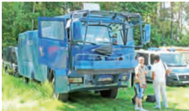
Kibice Orła Nieborów żartowali w czasie meczu, że po jego zakończeniu policyjny samochód wyposażony w armatki wodne powinien podlać murawę boiska.