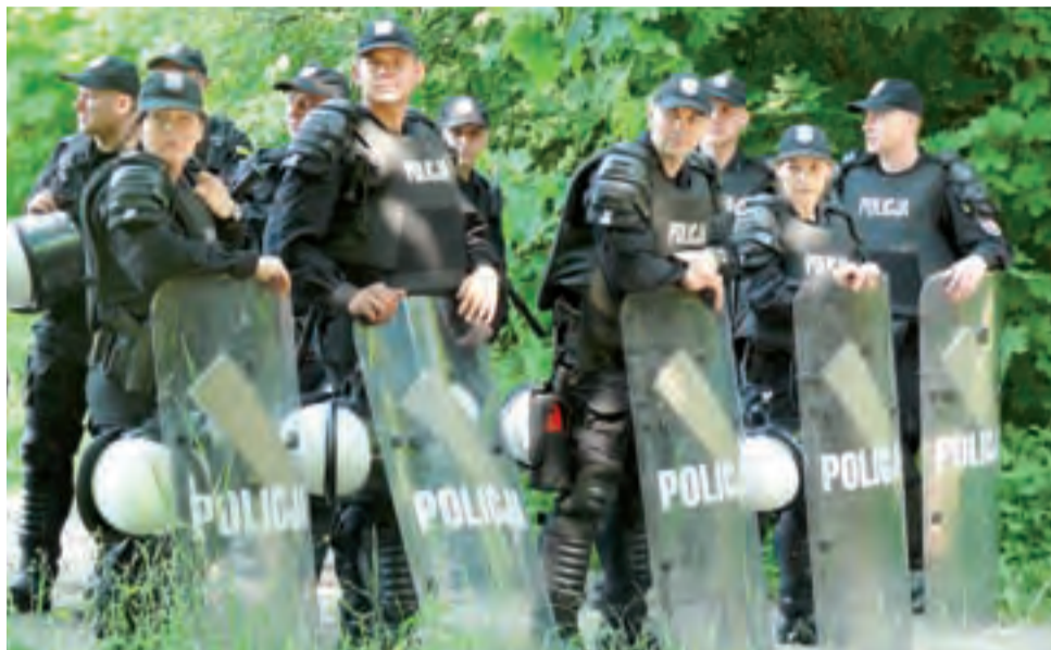
Takiego widoku ileborów jeszcze nie widział policjanci z tarczami i hełmami stojący na drodze dojazdowej do stadionu Orła.

Policjanci stali nawet w lesie od zachodniej strony kompleksu sportowego w Nieborowie, aby uniemożliwić dostanie się kibiców na teren stadionu przez wysoką siatkę.