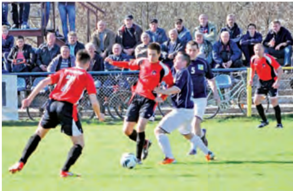
Zawodnicy Stali (czarne koszulki) jedynie przez krótki okres nie powstrzymali piłkarzy Rosanowa i to wystarczyło, by lider zwyciężył w Głownie z dużą przewagą.