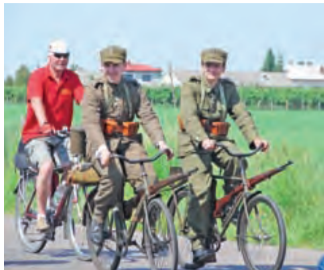
Dziesiątacy na starych rowerach.