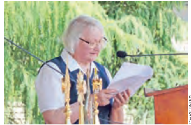
Częścią spotkania kobiet w Domaniewicach były świadectwa.