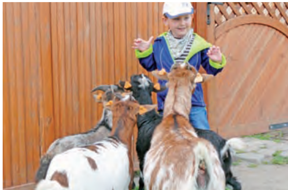
Kozy, owce, gęsi, kaczki, idyki - w zagrodzie dzieci mogą spotkać się z tymi zwierzętami oko w oko, nawet nakarmić je i pogłaskać.

Bednary | To miejsce powinno zrobić furorę