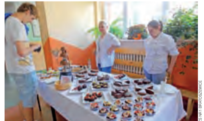
Owocami maczanymi w czekoladzie z fontanny oraz słodkimi wypiekami można było delektować się już za symboliczną złotówkę.

W czasie Niedzieli dla Ciebie przewidziana jest także możliwość przebadania słuchu, pomiaru ciśnienia, poziomu cukru we krwi, badanie EKG z poradą czy też konsultacje z dietetykiem. Więcej na temat imprezy napiszemy na naszych łamach za tydzień. ki