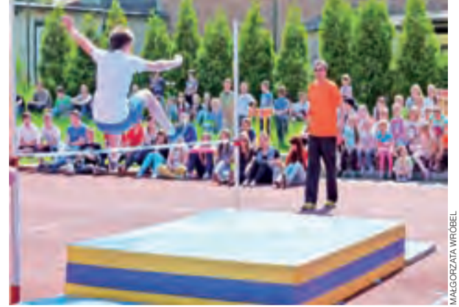
Artur Partyka (z prawej) na Orliku w Strykowie osobiście komentował każdy skok oddany przez uczniów strykwian szkoły. Sam mistrz także zaprezentował pokaz swoich niezwykłych umiejętności.