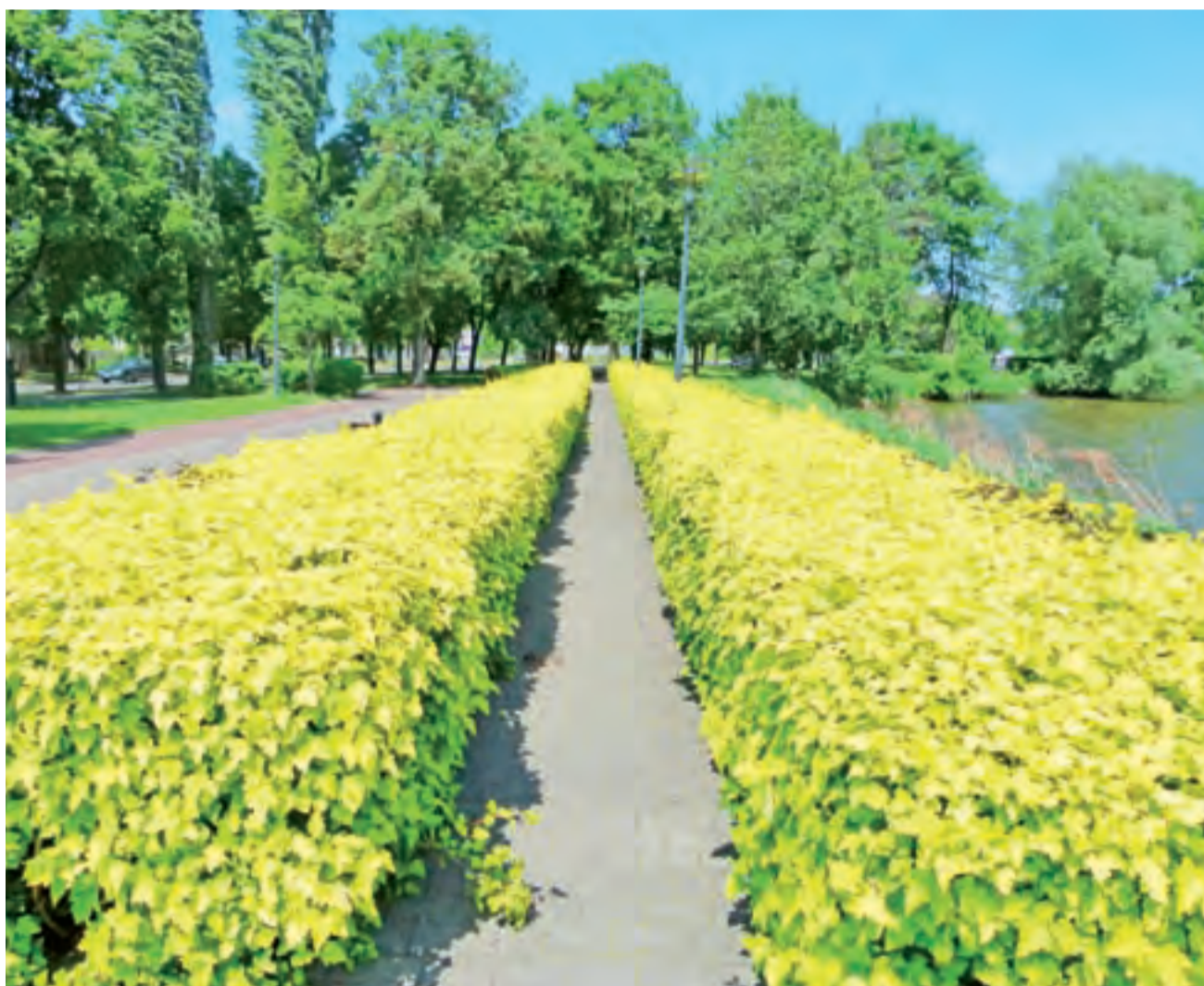
Ciekawie wygląda obecnie żywopłot w alejce przy promenadzie nad zalewem Mroźyczka w Głownie. Liście tworzących go krzewów, od dołu zielonkawe, im wyżej, tym nabierają intensywnie żółtego koloru, co w połączeniu z ich gęstością, robi przyjemne dla oka wrażenie. Sam żywopłot widać dobrze już z daleka. kl