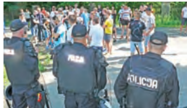
Kibice łódzkiego klubu nie weszli na nieborowski stadion, stali na dwanej drodze krajowej nr 70 a dojeżdżając do obiektu pilnowali policjanci.