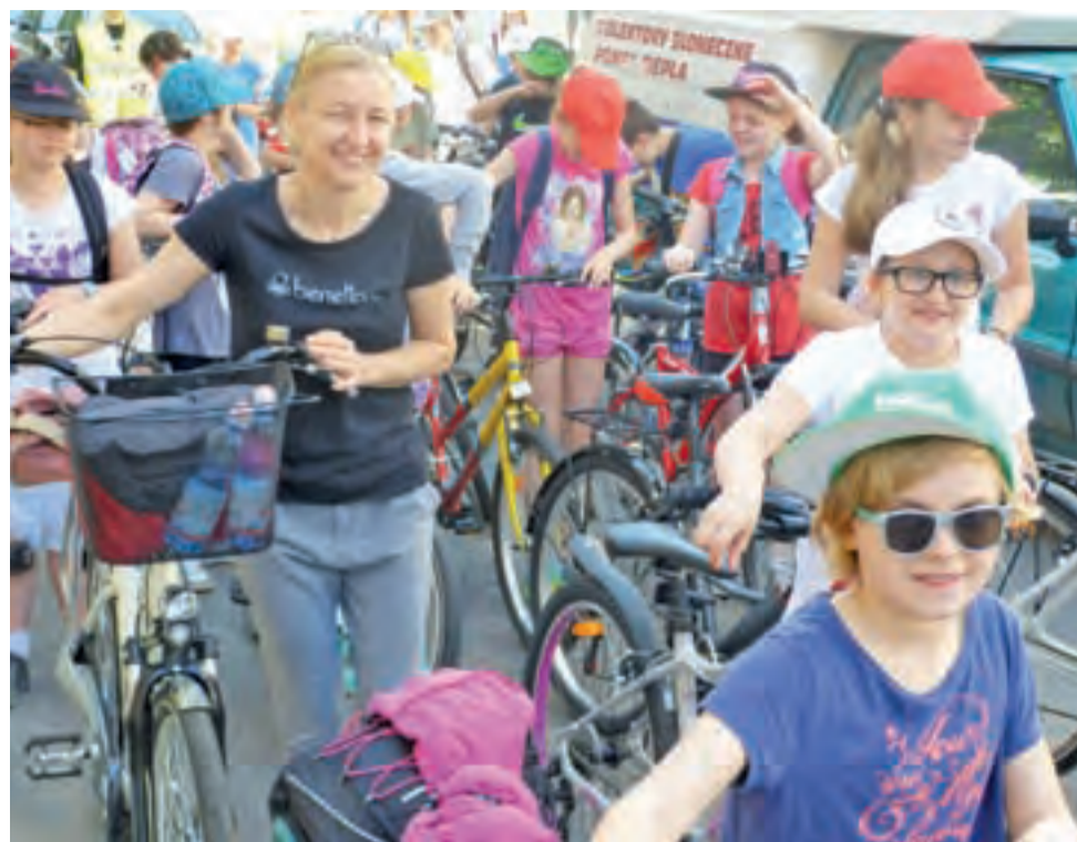
Najmłodsze klasy Szkół Pijarskich wyruszają w drogę.

Na scenie swoje umiejętności muzyczne i wokalne prezentowali przedstawiciele poszczególnych klas. Był też quiz z wiedzy z dziedziny historii i ogólnej. Uczniowie szkoły podstawowej sprawdzali się fizycznie, podczas m.in. biegów na 300 metrów czy meczu piłkarskiego. Przygotowano też warsztaty plastyczne.