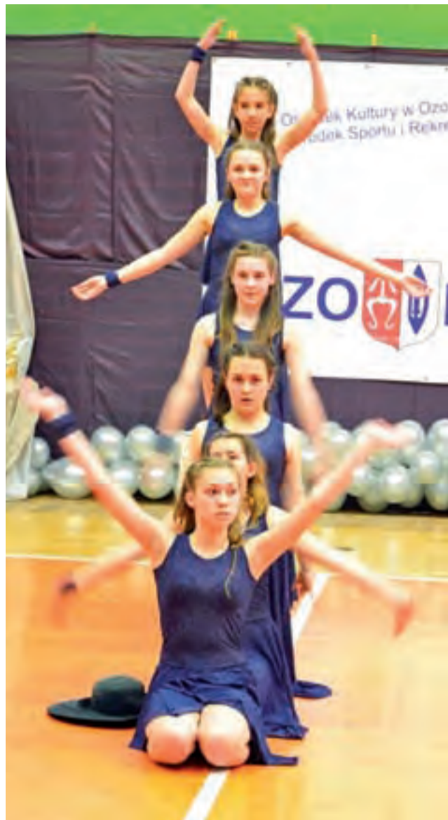
Gold 1 zdobył trzecie miejsce w swojej kategorii wiekowej.