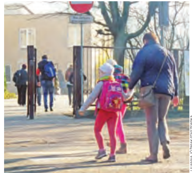
Wielu rodziców sześciolatków nie widzi od września swoich dzieci wśród uczniów szkół podstawowych.

Poradnia Psychologiczno-Pedagogiczna w Głownie, która obejmuje zasięgiem miasto i gm. Głowno oraz miasto i gm. Stryków, jest obecnie we wstępnej fazie wykonywania diagnoz sześciolatków. Przebadana została niewielka część zapisanych dzieci, większość przejdzie te badania w końcu roku szkol-