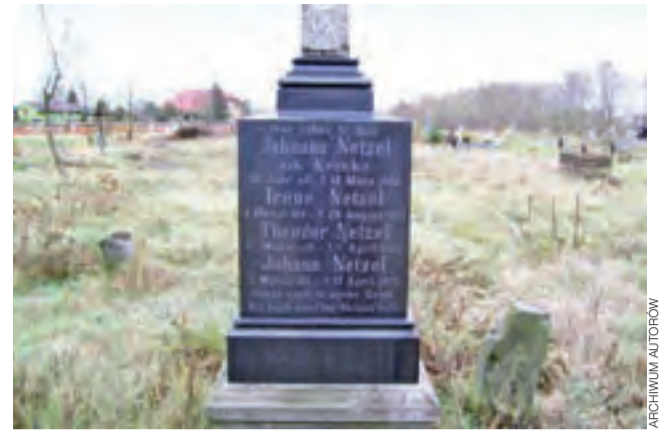
Grób rodziny Netzlów na starym cmentarzu ewangelickim w Strykowie.