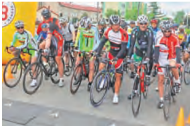
Na starcie Tour de Powiat nie mogło również zabraknąć najbardziej doświadczonych kolarzy.

W klasyfikacji generalnej również dwójka zawodników ze