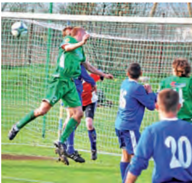
Zjednoczeni Stryków (niebieskie stroje) pokazali rywalom, że zasłużenie należą do czołowych drużyn tego sezonu w IV lidze.

porażkach z rzędu Zjednoczeni zaprzepaścili już szansę na awans do III ligi. W poprzednim tygodniu strykowanie pauzowali ze względu na odwołane spotkanie z Mierzynem. Zjednoczeni mieli więc dużo czasu na odpocznienie i dobre przygotowanie się do meczu z Concordią teraz, gdy dla Strykowa najistotniejsze jest utrzymanie trzeciej pozycji w lidze, która byłaby najlepszym wy-