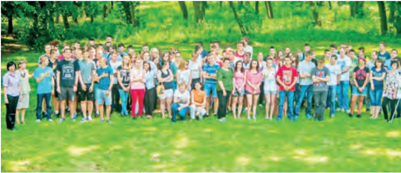
Uczestnicy projektu w parku, który objęli swoją adopcją.