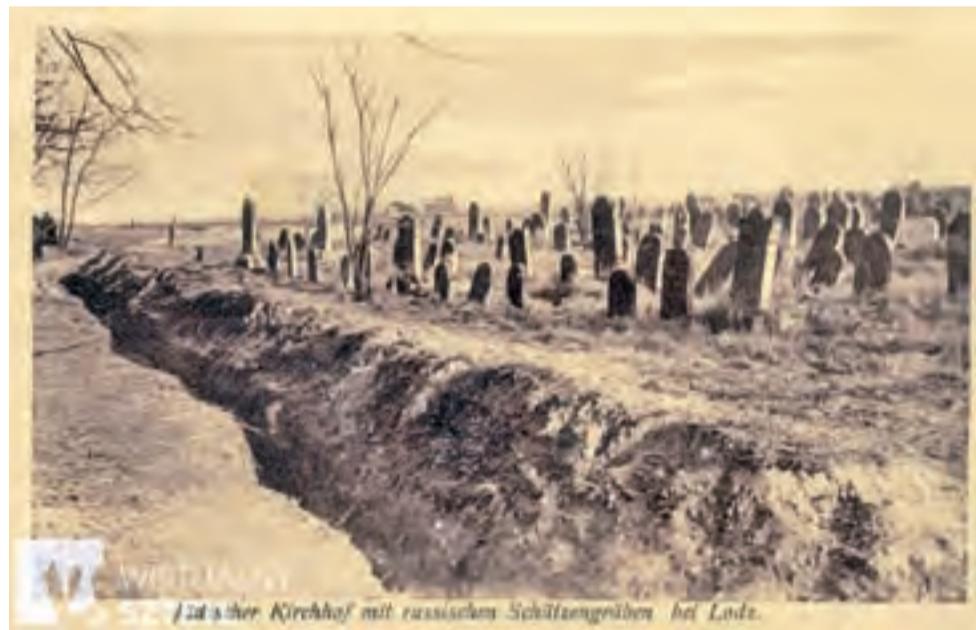
Cmentarz żydowski w Strykowie. Fotografia z 1916 r.

Przed II wojną światową w mieście funkcjonowały cztery cmentarze wyznaniowe, co świadczy jak różnorodna była mozaika religijna mieszkającej tutaj ludności. Obecnie w Strykowie funkcjonują dwie parafie: rzymskokatolicka, dysponująca