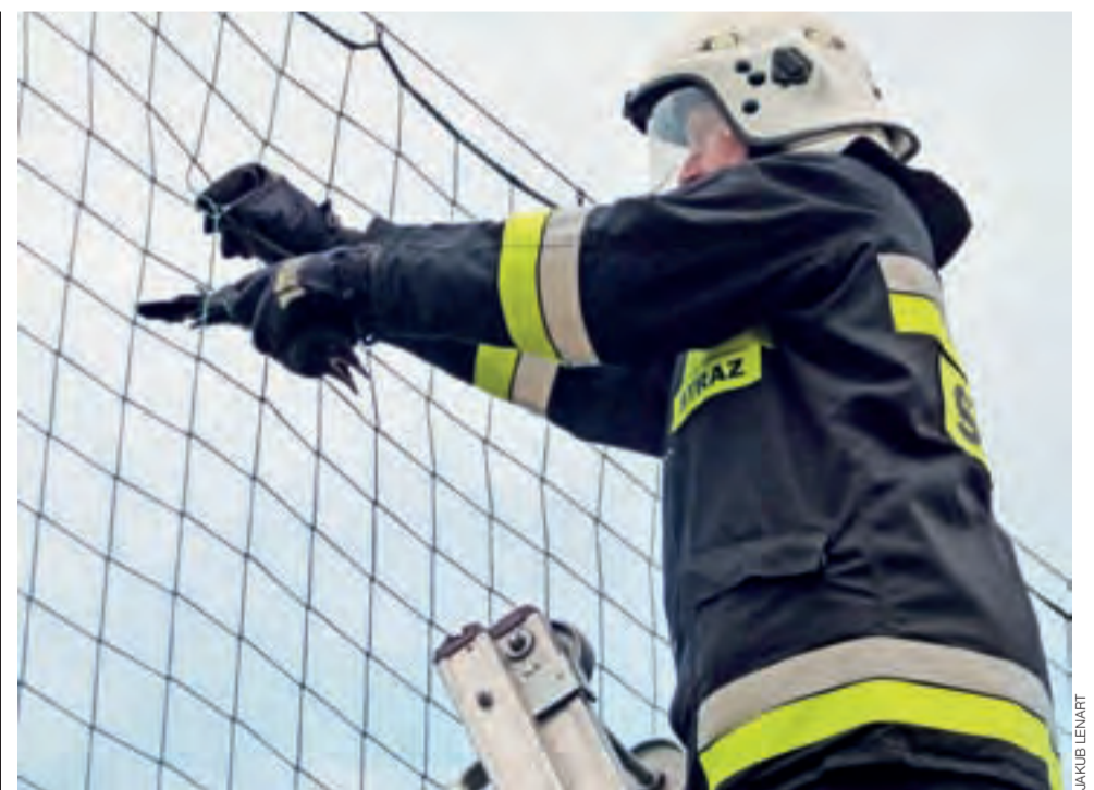
Ptaka udało się uratować dzięki pomocy strażaków.

■ 26.05 o godz. 8.05 w Nowostawach Dolnych kierujący samochodem VW Passat mieszkaniec Głowna potrafił sarnę, która nagle wybiegła przed jego pojazd. Zwierzę nie odniosło większych obrażeń, natomiast w samochodzie uszkodzony został zderzak, nadkole i drzwi. IJS