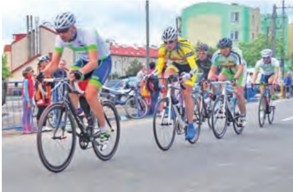
Szybka jazda kolarzy na Tour de Powiat 2014 mogła podobać się kibicom. Niestety szybko skończyło się także ściganie na drogach powiatu zgierskiego.