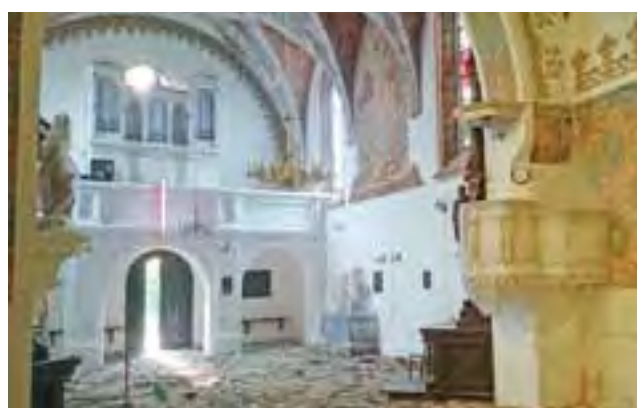
Niecodzienny widok. Remont posadzki kościoła w Sobocie w gm. Bielawy.