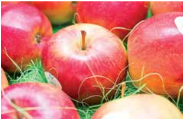
Jabłka z certyfikatem. Doceniony ligol Elity.

Jabłka odmiany ligol z oferty Grupy Producentów Owoców Elita z Lubiankowa otrzymały certyfikat Ogólnopolskiego Programu Promocyjnego „Doceń polskie”, któremu patronuje Ministerstwo Rolnictwa i Rozwoju Wsi. Równocześnie z certyfikatem jabłkiem przyznano tytuł Top Produkt.