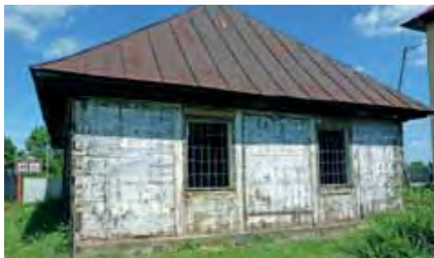
Po zdjęciu pierwszej warstwy desek ukazał się pierwotny wygląd chaty.