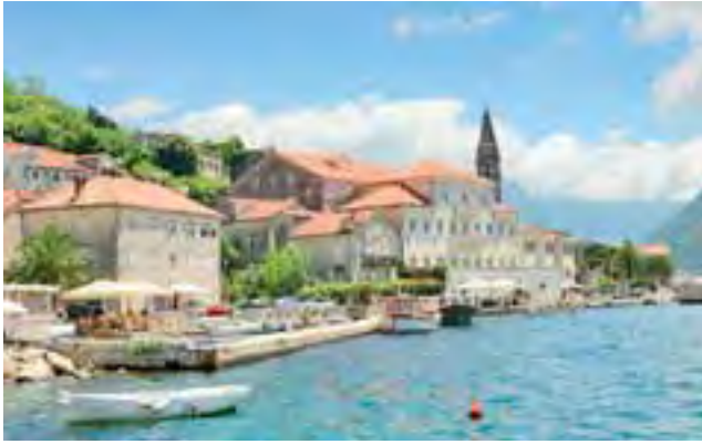
Czarnogórskie wybrzeże jest dla Polaków bardzo atrakcyjne. Oprócz doskonałej pogody oferuje również niebanalne krajobrazy i względnie niskie ceny.

ządzanej na naszych oczach, na opalanych węglem grillach. Przez albańską gościnność czy bośniackie smaki trudno nam jest niekiedy zmotywować się do dalszej jazdy.