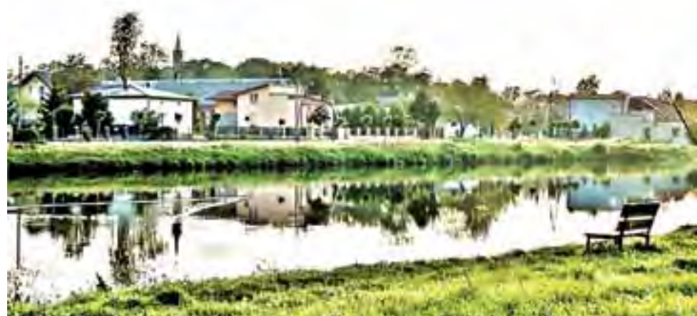
Ulubione miejsce spotkań biegaczy z Dobrej, staw przy ul. Starowiejskiej.

Podczas biegowej wycieczki po terenach Gminy Stryków uczestnicy mogli poznać zabytki i miejsca związane m.in. z Powstaniem styczniowym i Bitwą nad Bzurą, a także zwiedzić cały obszar Dobrej. Kolejne spotkania biegaczy z historią odbędą się już wkrótce, a szczegółowe informacje systematycznie zamieszczane będą na oficjalnej stronie klubu z Dobrej: www.powstaniecdobra.pl. Każdy może również zgłosić swój pomysł na przeprowadzenie krajoznawczych wypraw biegowych.