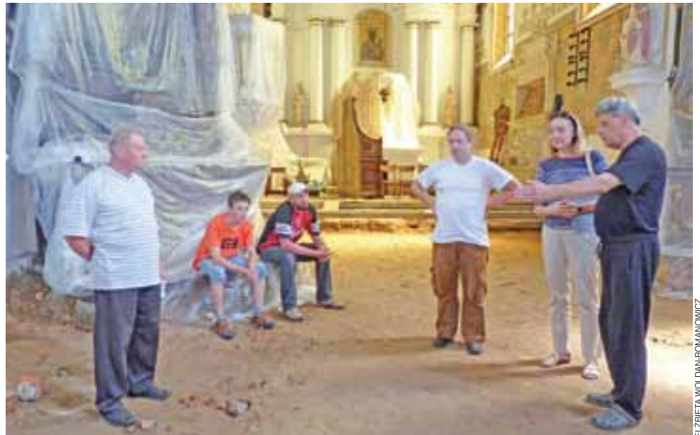
Co zrobić z kryptami? Zamurować i zostawić zmarłych w świętym spokoju. W kościele w Sobocie właśnie zapada decyzja o tym, że wnętrza grobowców nie będą badane.

Proboszczowi parafii św. Piotra i Pawła decyzja o nieodkryciu krypt wydaje się na rękę o tyle, że żadne badania archeologiczne nie zahamują prowadzonych prac, których harmonogram jest bardzo ważny ze względu na to, że zadanie dofinansowane jest w 85% dotacją z Łowickiej