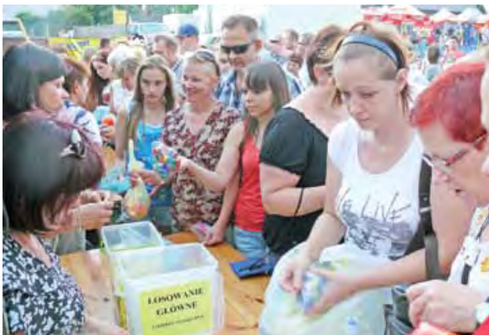
Przy stoiskach, gdzie wydawano losy loterii fantowej było tłoczno, każdy stał z mniejszym lub większym woreczkiem plastikowych korków, które wymieniał na losy.