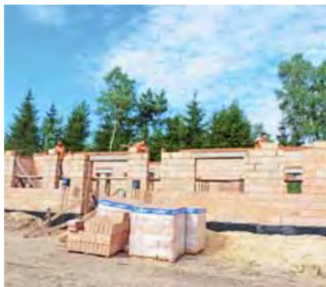
Mury pną się już do góry. Niebawem przygotowania pod strop.