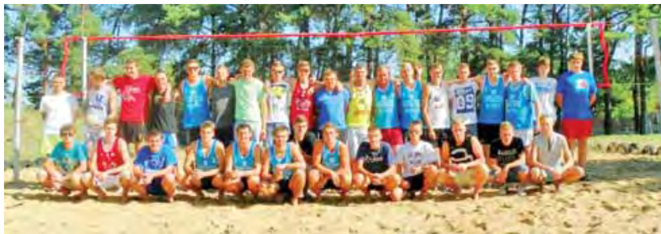
Uczestnicy I Turnieju Otwartych Mistrzostw Łowicza w siatkówce plażowej, a wśród nich liczne grono reprezentantów Główna.

Przez cały czas historii OME rozgrywana była różna liczba turniejów. W 2014r. organizatorzy przewidzieli dla zawodników trzy turnieje. Pierwszy z nich odbył się w minioną sobotę. System rozgrywek, tzw. brazylijski polegał na grze jednego seta do 21 pkt., a każda para uczestniczyła w turnieju do dwóch przegranych. Ze względów organizacyjnych w sobotnim turnieju udział