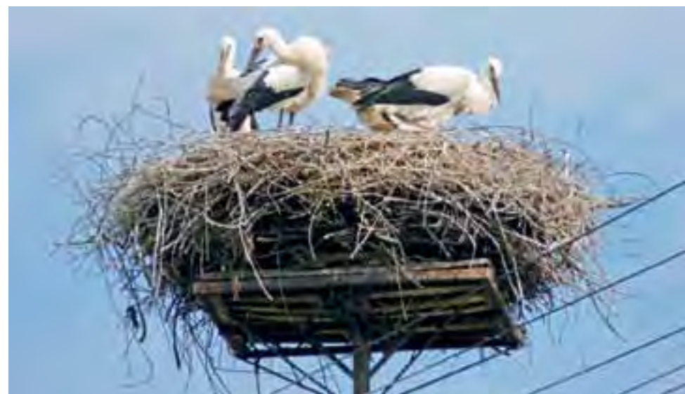
To okazałe bocianie gniazdo na stałe wpisało się już w krajobraz Dmosina. Ptaki raz są, raz ich nie ma, ale ten sezon jest wyjątkowy. Bociany przyleciały późno, za to założyły sporą rodzinę. W azylu uwitym na wierchołku słupa energetycznego mieszkają aż cztery ptaki. Miejscowi widywali je w tym roku z niemałym zdziwieniem nawet na pobliskich plantacjach truskawek. ag