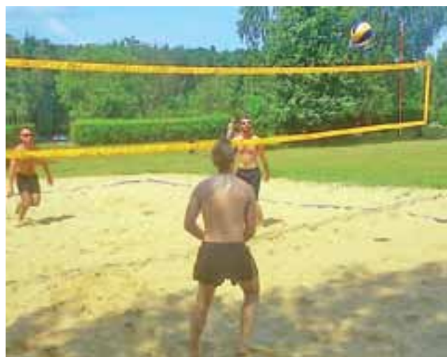
Walka w II Turnieju o Grand Prix Malinka toczyła się w wielkim upale.

Kolejny, trzeci turniej o Grand Prix Malinka w Zgierzu zaplanowany jest na 3 sierpnia o godz. 11:00. W sumie zorganizowanych zostaną cztery imprezy, a na ko-