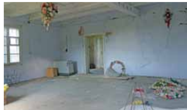
Przed rozbiórką. Wnętrze chaty mąkolskiej.