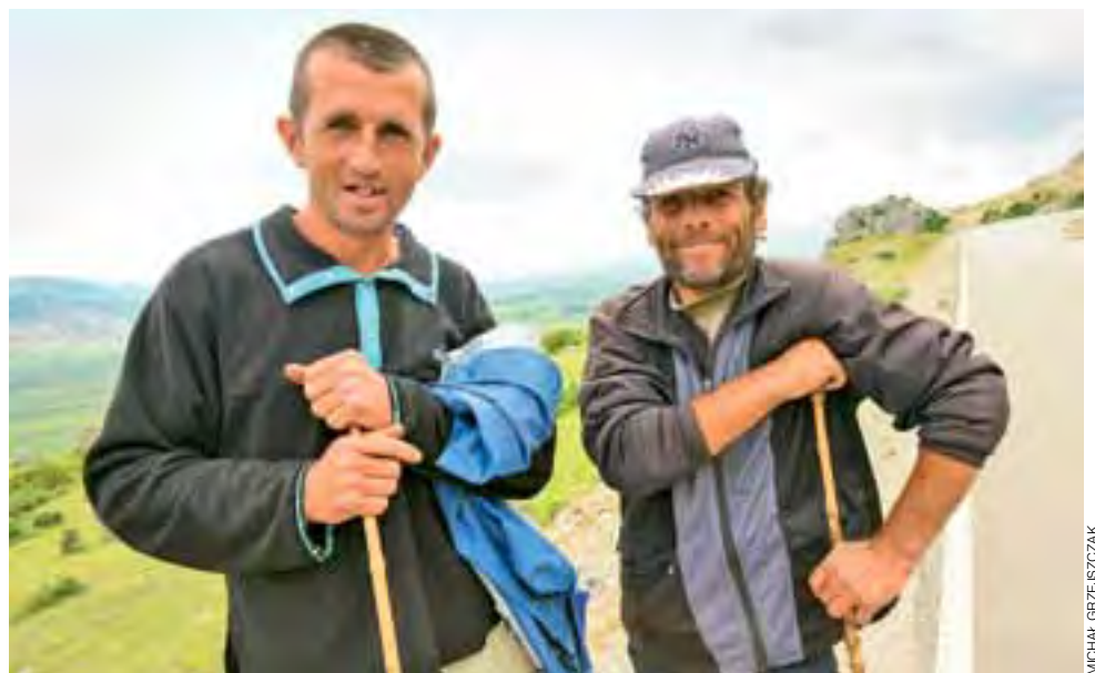
Dla albańskich pasterzy napotkanych w drodze do Macedonii okazaliśmy się niemałą atrakcją. Oni dla nas także.

Choć pogoda bardziej przypomina tę jesienną, schładzając nas na zmianę 14-stopniowymi temperaturami i znacznymi opadami, to jednak bardzo nam to nie przeszkadza. Wiemy już, że nasz plan coraz bliższy jest realizacji. Mijając największe jezioro Węgier mamy już w zasadzie z górki. W przenośni i w rzeczywistości. Delikatne zmarszczki i napotkane podjazdy łykamy z sentymentem, wspominając pozostawione za plecami greckie odcinki specjalne.