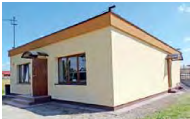
Przed odbiorem. Budynek po dawnym GS-ie w Mięsośni zmienił się nie do poznania.

Po remoncie budynek będzie pełnił funkcję wiejskiej świetlicy, w której można będzie się spotkać czy zorganizować niewielką rodzinną uroczystość. ewr