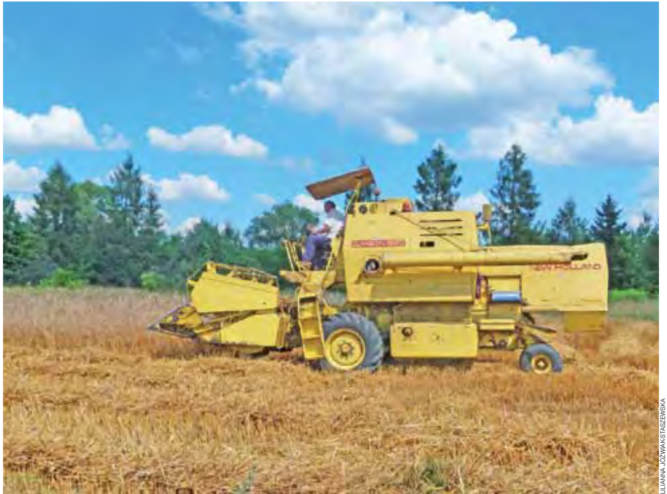
We wtorek, 22 lipca, pracujący na polu kombajn można było spotkać również m.in. w okolicach Głowna, a konkretnie w Domaradynie.

Z monitoringu, prowadzonego na bieżąco przez Łódzki Ośrodek Doradztwa Rolniczego z siedzibą w Bratoszewicach, wynika, że średnia cena za godzinę pracy kombajnu w województwie łódzkim to obecnie 300-350 zł, natomiast prasy kosztującej – 130 zł. Z kolei średnia cena skupu żyta za kwintal wynosi obecnie 40 zł netto, czyli podobnie jak w roku ubiegłym, co już wówczas nazywane było przez rolników katastrofalnym. Z przewidywań specjalistów ŁODR wynika, że po żniwach cena ta może nawet ulec obniżeniu, ze względu na tegoroczny urodzaj na polach. Ijs