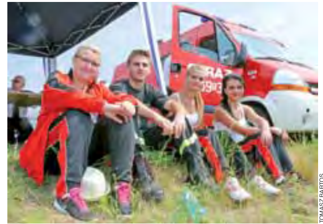
Wśród widzów zawodów znaleźli się zawodnicy i zawodniczki, którzy obserwowali poczynania rywali.

W rywalizacji Młodzieżowych Drużyn Pożarniczych