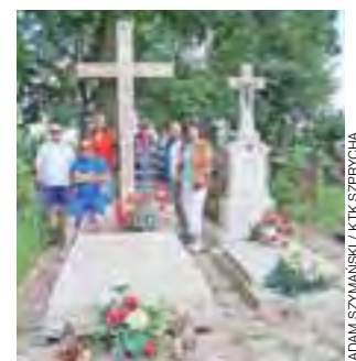
Łowiccy cykliści przy grobach w Żelechowie.