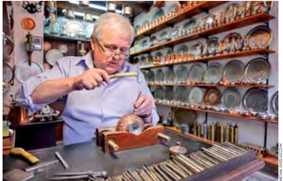
Sarajewskie manufaktury przykuwają uwagę każdego turysty odwiedzającego arabską dzielnicę.

Podróże | Michał Grzejszczak pisze po powrocie z długiej podróży rowerowej: „przekręcili” z Korfu do Łowicza 2720 kilometrów