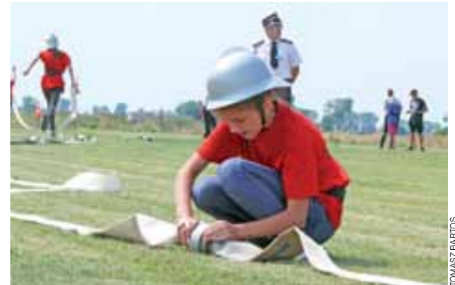
W młodzieżówce, w każdej z drużyn żeńskich, były strażaczki dziewczynki, które w długich czerwonych podkoszulkach wyglądały jak w sukienkach. Dawały sobie jednak całkiem niezłą radę, zarówno w sztafecie, jak i bojówce.

w kategorii dziewcząt wystartowały trzy drużyny: I miejsce – OSP Wicie (113,7 sek), II miejsce – OSP Boczki, III – OSP Lipnice. W kategorii chłopców startowało osiem drużyn, co w skali powiatu łowickiego należy uznać za ilość bardzo dużą. I miejsce zajęła drużyna z OSP Wicie (93,6 sek), II miejsce – OSP Sromów (93,8 sek), III – OSP Różyce (102,5 sek), IV – OSP Boczki, V – OSP Wejście, VI – OSP Kocierzew, VII – OSP Lipnice, VIII – OSP Łaguszew.