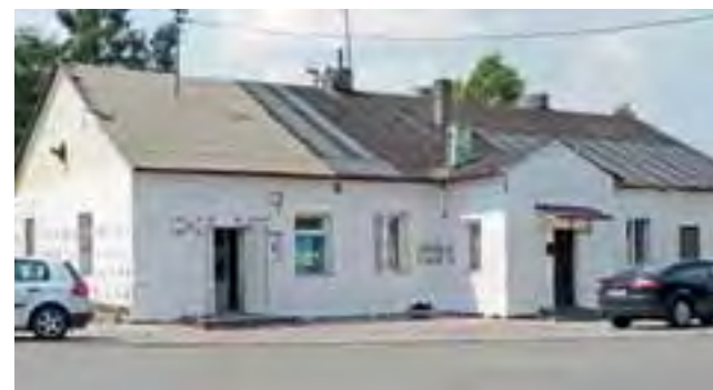
Gminny budynek w remoncie. Stan na 9 lipca.

Szereg drobniejszych prac wykonywanych jest także w pomieszczeniach przeznaczonych na 4 mieszkania komunalne. Za całe zadanie strykowski samorząd zapłaci wykonawcy 295 tys. złotych. ewr