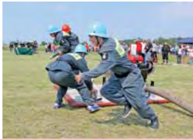
Młodzieżowe Drużyny Pożarnicze, zwłaszcza chłopcy, dowiedli, mimo że bojówkę wykonywali na „sucho”, iż są wśród nich przyszli strażacy.

należący do pułkownika Ryszarda Kuklińskiego. Postać tę przypominał w tym roku film sensacyjny „Jack Strong”, co też pośrednio wiąże się z Muzeum Guzików, ponieważ w jego zbiorach znajduje się już guzik odtwórcy roli pułkownika – Marcina Dorocińskiego. tm