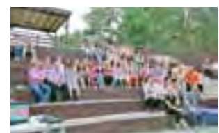
Liczne grono przybyłych gości.

na wszystkich zrobili motocykliści, którzy na swoich potężnych maszynach robili przejażdżki dla wszystkich chętnych. Po zakończeniu uroczystości klub życzył wszystkim udanych wakacji. Za kilka miesięcy rusza kolejny sezon koszykarski. wp