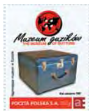
Znaczek Poczty Polskiej z XIX-wieczną walizką kupiecką.

A skoro mowa o guzikach znanych osób, to kolekcja łowickiego muzeum stale się rozszerza. Wkrótce pojawi się w niej guzik