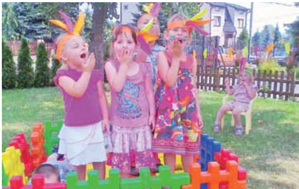
Indiańskie lato. Dzieci z Przedszkola „Tygrysek” w Głownie w wakacje nie narzekają na nudę.