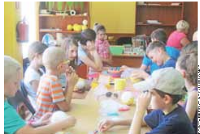
Wakacyjne zajęcia w bibliotece cieszą się sporym zainteresowaniem.

W czwartki prowadzone są zajęcia „Ćwiczenia z myślenia”,