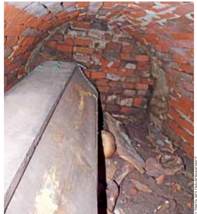
Trumna w krypcie. Groby pod remontowaną podłogą kościoła w Sobocie nie będą badane przez naukowców. Przypadkowo wybity otwór, ze względu na zagrożenie dla zdrowia, miał szybko zostać zamurowany.

Granit w kościele św. Piotra i Pawła zostanie ułożony na podbudowie z piasku, wylewki betonowej, styropianu, folii, kolejnej warstwy wylewki i podsypki.