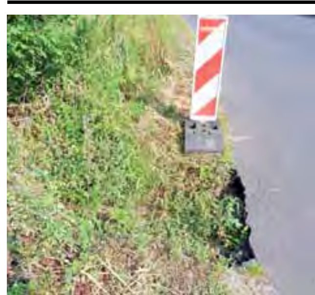
Wyrwa oznaczona 19 lipca przed naprawą nawierzchni.