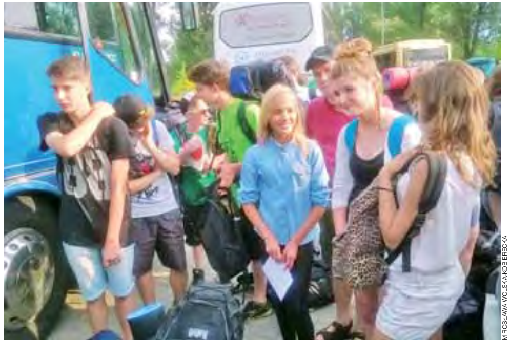
Ostatnie chwile przed wyruszeniem na poszukiwanie letniej przygody.

Około 120 zuchów, harcerzy i wędrowników z łowickiego hufca Związku Harcerstwa Polskiego wyjechało w niedzielny poranek, 20 lipca, na obóz harcerski do Załęcza Wielkiego. Harcerze będą wypoczywać w ośrodku na terenie Załęczańskiego Parku Krajobrazowego, na prawym brzegu rzeki Warty, w powiecie wieluńskim. Jeszcze przed wyjazdem, na parkingu za ratuszem drużynowi poprowadzili pierwsze zabawy integracyjne. Po dojechaniu na miejsce wędrownicy i harcerze starsi upiększali obozowisko budując bramę i zerbę – rodzaj ogrodzenia z gałęzi wokół obozowiska. mak