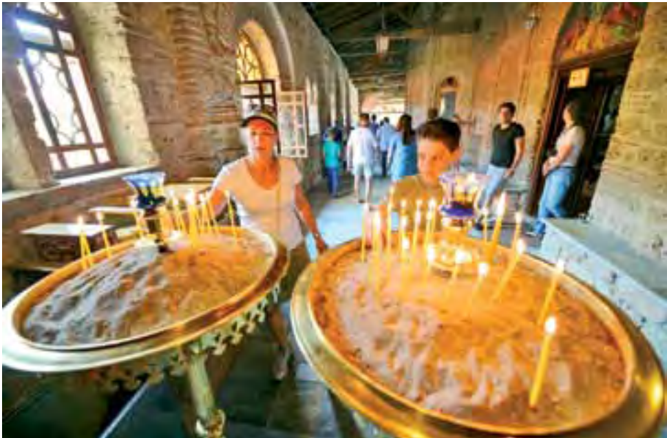
Klasztor Meteora przyciąga swoją magiczną aurą tysiące turystów dziennie. Dla wielu z nich, miejsce to stanowi cel pielgrzymek.