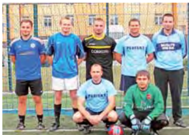
Piłkarze drużyny Perfekt, jednego z zespołów Amatorskiej Ligi Szóstek.