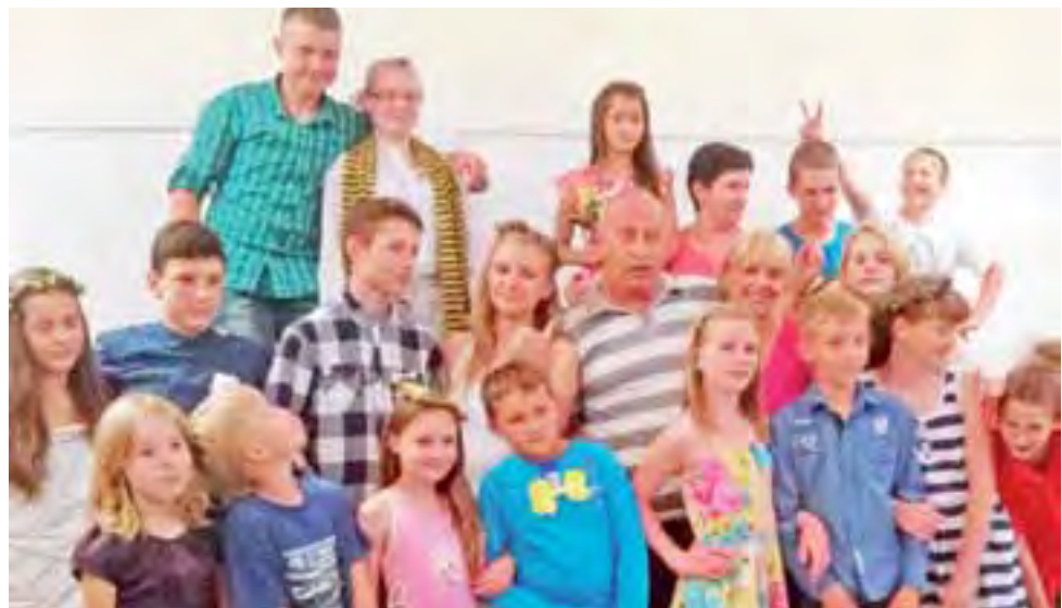
Wypoczynek na koloniach KRUS. Zdjęcie z kolonijnych ślubów.

sobą kilka nowszych i starszych radiostacji. W ciągu dotychczasowych spotkań Niesułkowian udało się połączyć z takimi miejscami w kraju jak: Gdynia, Jarosław, Bytom, Piekary Śląskie, Piła czy Bydgoszcz. ijs