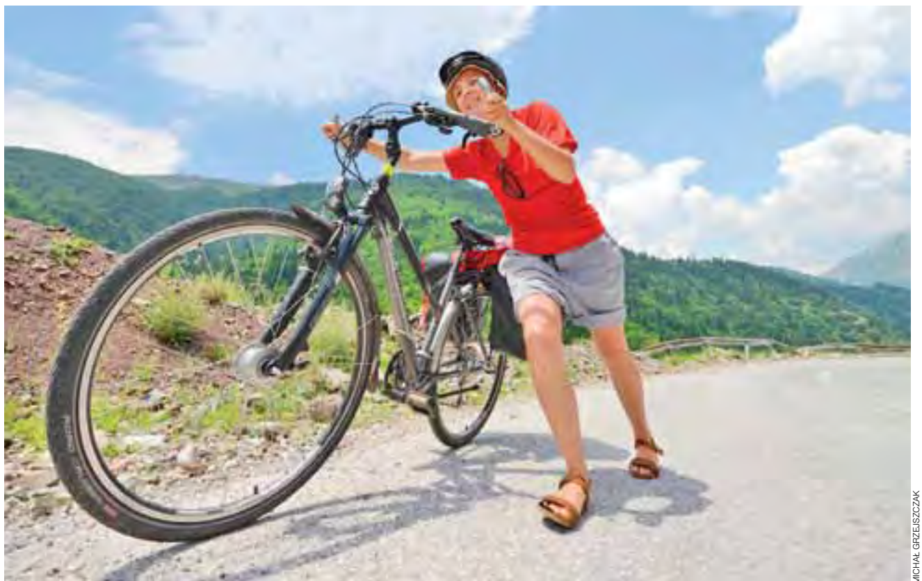
Oprócz doskonałych plaż, Grecja w swojej ofercie ma także i góry. Aby dotrzeć na niektóre z przełęczy, trzeba wycierpieć swoje.

dziennie. Autokary, jeden za drugim, wspinają się krętymi, wąskimi asfaltami na położone wysoko tarasy widokowe. Pejzaż stamtąd jest rzeczywiście imponujący, a wejścia do środka, mimo panującego tam ogromnego tłoku, trudno sobie odmówić. Grecja oferuje wiele. Choć dla większości z nas to jedynie wyspy i turkusowa woda, to jednak przemierzając kontynentalną jej