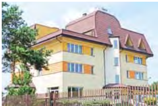
ZOL Medical. Otwarcie w najbliższą sobotę.

już w najbliższą sobotę, 26 lipca. Będzie to Zakład Opiekuńczo-Lecznicy (czyli placówka, w której przebywają ludzie obłożnie, długotrwale chorzy) o nazwie „Medical”.