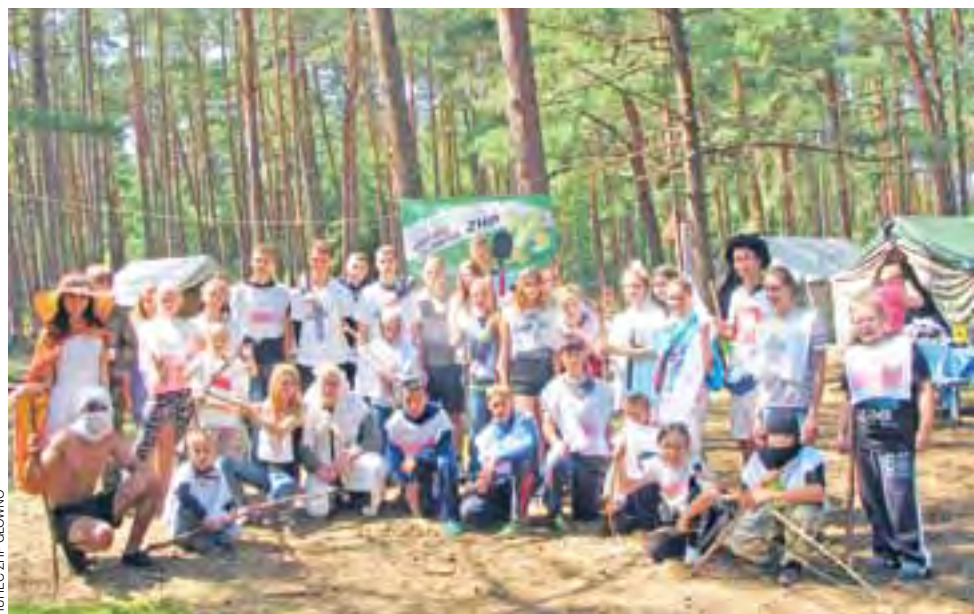
Bitwa pod Jarostawcem. Tak uczestnicy obozu ZHP uczcili 604. rocznicę bitwy pod Grunwaldem.

ZHP Głowno | Ten obóz zapamiętają na długo