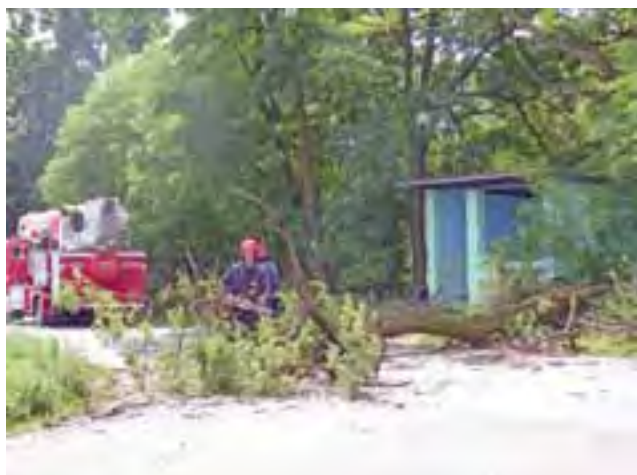
Usuwanie zagrożenia. W akcji uczestniczyli strażacy z JRG PSP w Strykowie.