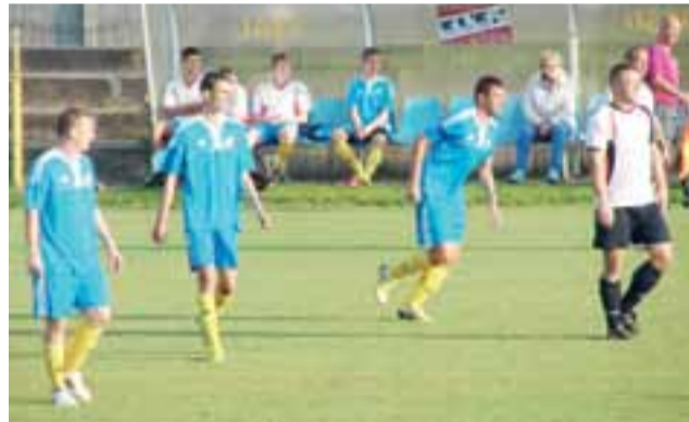
Głownianie (niebieskie stroje) pewnym okiem spoglądają na szczyt ligowej tabeli, który wkrótce ma zostać zdobyty.