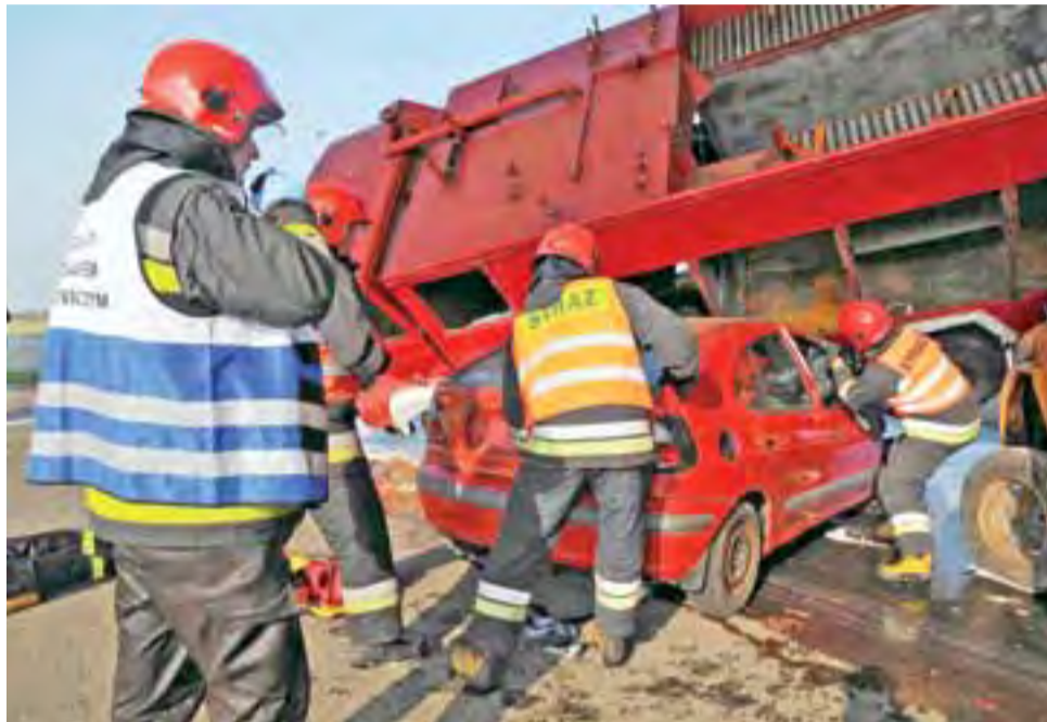
Na ćwiczeniach ciężarówka przygnoiła samochód osobowy – ratownicy próbują dotrzeć do poszkodowanych.

Scenariusz ćwiczeń zakładał skomplikowany wypadek drogowy z udziałem kilku pojazdów, z zagrożeniem zdrowia i życia dwóch poszkodowanych, a także groźbą skażenia terenu. Sytuacja wyglądała w sposób następujący: na wiadukcie w biegu drogi gminnej Anielin – Warszewice nad nieużytkowanym odcinkiem Autostrady A1 na skutek nieuwagi kierowcy samochód ciężarowy, w którym podróżują dwie osoby, zjeżdża na przeciwległy pas ruchu, gdzie w jego stronę zmierza bus z 5 osobami. Chwilę przed zderzeniem kierowca ciężarówki gwałtownie skręca, chcąc powrócić na swój pas ruchu, ale traci panowanie nad pojazdem. W efekcie ciężarówka uderza w samochód osobowy, przebijając barierę energochłonną na wiadukcie i spada w dół na pas ruchu A1 w kierunku północnym. Jadący autostradą inny samochód ciężarowy uderza w pojazd, który chwilę wcześniej