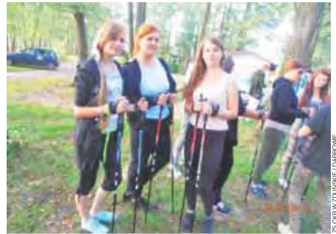
Uczestniczki warsztatów miały też czas na relaksujący spacer z kijkami.

Wszyscy nauczyciele otrzymali w prezencie jabłko – wprawdzie nie wykonane z najcenniejszego kruszcu, ale za to bardzo smaczne – i czerwone długopisy. W ramach rewanżu, nauczyciele wręczyli swoim podopiecznym ananasy – po jednym na klasę, tm