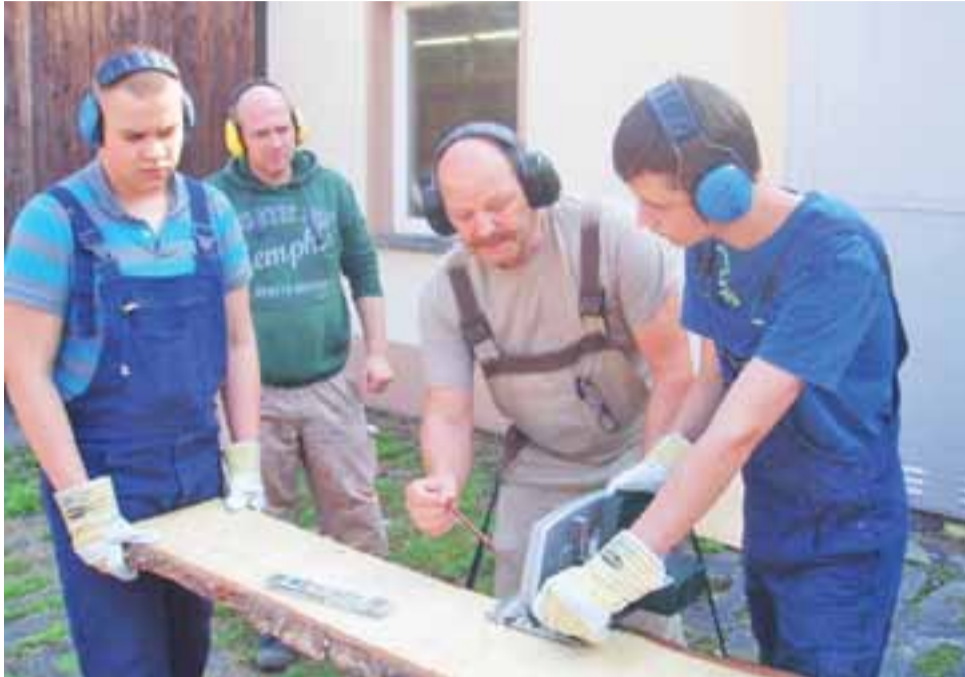
Zadaniem stażystów stolarzy było skonstruowanie i wykonanie od podstaw składanego taboretu.

W Niemczech kucharze-kelnerzy mieli za zadanie obsłużyć dwie imprezy okolicznościowe: bankiet dla zasłużonych seniorów miasta oraz imprezę regionalną w restauracji Haus Einstein w centrum Frankfurtu. Zadaniem stolarzy było natomiast skonstruowanie składanego taboretu. Wszyscy stażysty otrzymali certyfikaty potwierdzające podniesienie kwalifikacji zawodowych. Młodzież zwiedziła Frankfurt i Berlin.