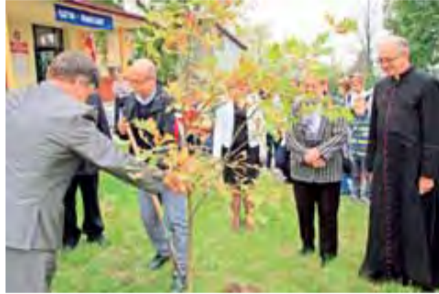
Podczas uroczystości przy Szkole Podstawowej w Niedźwiadzie posadzono dwa dęby pamięci.