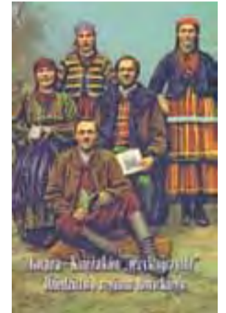
Tak wygląda okładka książki

Zespół był obecny w czasie promocji książki w muzeum, w drugiej części tego spotkania zaśpiewał i jak to zazwyczaj