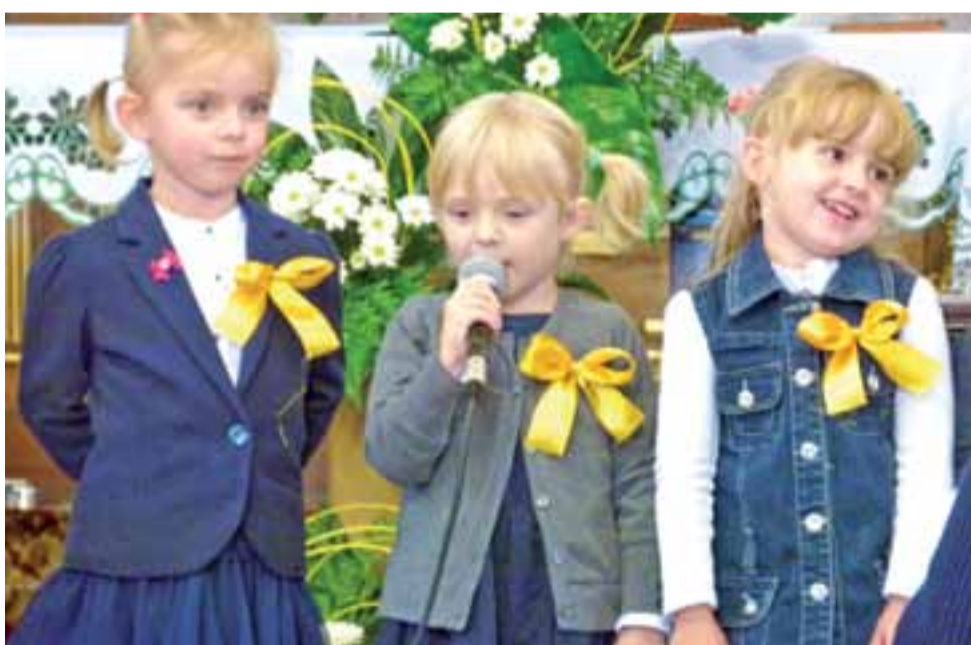
Mali o świętości JP II. Występ dzieci z Przedszkola Sióstr Służebniczek w Strykowie.