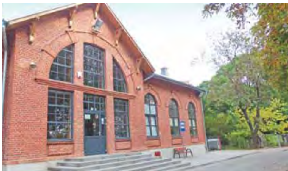
Część budynku stacji PKP w Strykowie gmina chce wykorzystać na filię Domu Kultury.

Wstępnie mówi się o tym, że nowy Dom Kultury w Strykowie byłby budynkiem trzykondygnacyjnym, z jedną kondygnacją znajdującą się pod ziemią. Tutaj zapewne miałyby się znaleźć biblioteka. Na parterze budynku swoje miejsce zna-