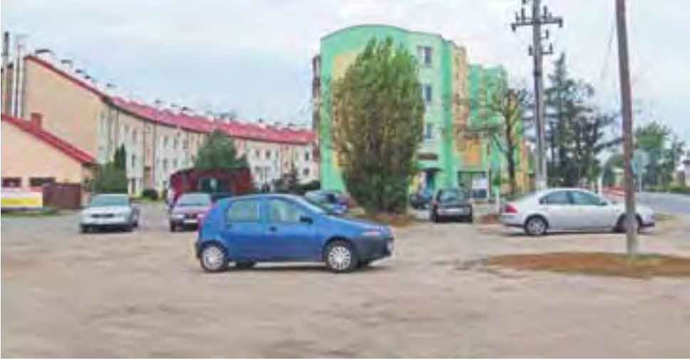
Zgierski TBS okazał się jedynym poważnie zainteresowanym wybudowaniem nowego bloku w tym miejscu.