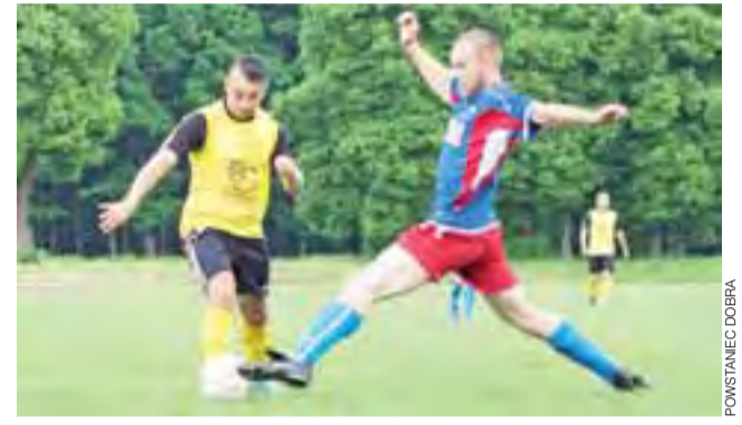
Piłkarze Powstańca (żółto-czarne stroje) nie spisują się najlepiej.

Następna, 8. kolejka odbędzie się w dniach 18-19 października: Czarni - KKS II Koluszki, KS Gozdów - Iskra Głowno, Start - LKS Gieczno, Powstaniec - LKS II Gałkówek, Ner Łódzki II - LKS II Różyca, Zamek - Sokół Popów.