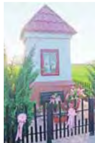
Odnowiona kapliczka w Karnkowie.

Po mszy św. uczestników niedzielnej uroczystości zaproszono na poczęstunek do sali OSP w Popowie Głowieńskim.