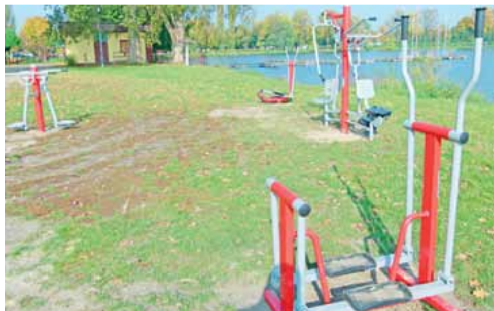
Siłownia pod chmurką przy zalewie Mroźyczka.

Więcej urządzeń zainstalowano przy wypożyczalni sprzętu nad zalewem. Tutaj stanęły: wahadło podwójne (działa na dolne partie ciała, przede wszystkim nogi), twister potrójny (wspomaga aktywność stawów biodrowych, kręgosłupa lędźwiowego, pozytywnie wpływa na mięśnie brzucha), narciarz (służy do treningu mięśni i bioder), orbitrek (do treningu ogólnorozwojowego górnych i dolnych części ciała) oraz dwufunkcyjne urządzenie, czyli wyciąg górny (wzmacnia górne partie mięśniowe, przede wszystkim ramiona i mięsień najszerszy grzbietu) z możliwością