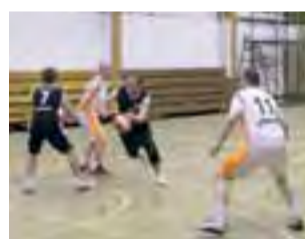
BKS Bratoszewice (czarne stroje).

BKS trafił do grupy A wraz z Danak, Magic Travel, MOSiR Łódź, TRNR.PL oraz Polską Organizacją Sportową. Grupę B tworzą natomiast Rozjuszone Leniwece, Ball Don't Lie, Dipol. tv, CDM Folie, Salos Łódź oraz Gromar Bad Boys. Swoje pierwsze spotkanie w tegorocznej rywalizacji koszykarze Bratoszewice mają już za sobą. Wynik tego meczu nie jest nam znany, gdyż spotkanie odbyło się po zamknięciu tego wydania Wieści. Kolejny mecz BKS rozegra natomiast w czwartek, 23 października o