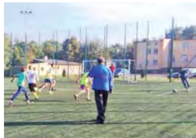
Turniej Integracyjny w Głownie przebiegał w bardzo pozytywnej atmosferze, a uczestnicy nie mogą doczekać się już kolejnych imprez.