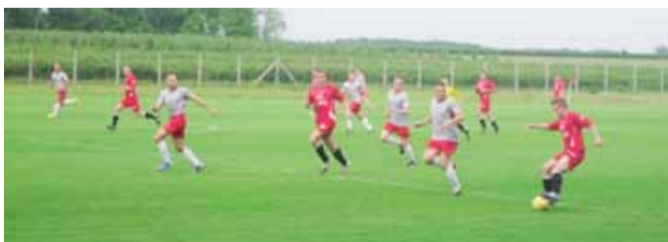
Błękitni Dmosin (czerwone stroje) udanie prezentują się w tym sezonie, zwłaszcza na własnym stadionie.

W kolejnym Rajdzie wezmą udział już wszyscy członkowie Strykowskiej Gr. Motocyklowej. wp