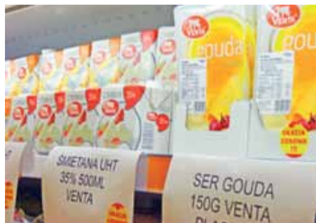
Wśród towarów, które można kupić w sklepach OSM w Łowiczu po niższej cenie, znajdują się kilka rodzajów śmietany i żółtego sera.

Zarząd mleczarni znalazł jednak na to sposób: zdecydowano sprzedawać je w Łowiczu. Ich jakość jest taka sama, jak innych produktów tego zakładu, różnią