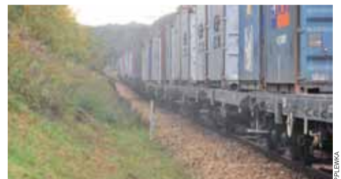
Pociąg stanął, blokując przejazd kolejowy. Daleko w głębi: służby ratownicze na miejscu tragedii.

0,5 promila. Kierowca przyznał, że wypił kilka piw. MAN został zabezpieczony w celu przekazania właścicielowi. Za prowadzenie w stanie nietrzeźwości kierowcy grozi do 2 lat pozbawienia wolności, utrata prawa jazdy, a także zakaz prowadzenia pojazdów nawet na 10 lat. ijs