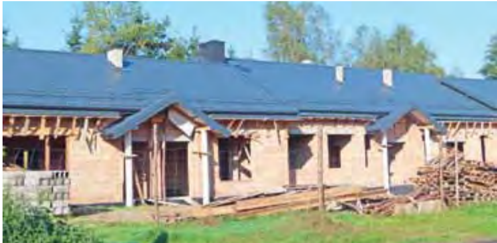
Widok na nowy budynek ośrodka zdrowia z drogi prowadzącej w kierunku Brzezin.

Budowa nowego ośrodka kosztować będzie 1,45 mln zł. Znajdzie się w nim miejsce nie tylko dla gabinetów lekarskich przeniesionych z budynku po przeciwnej stronie ulicy, ale również na stomatologa, aptekę i punkt bankowy. ljs