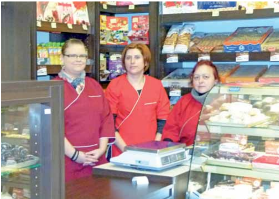
Już otwarte. Uśmiechnięte ekspedientki w nowej cukierni czekają na smakoszy tortów, ciast i ciasteczek.