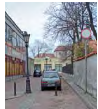
Ulica Chopina ponownie „ślepa”. mq

Decyzja taka jest spowodowana, jak się dowiedzieliśmy w Urzędzie Miejskim, niemożnością przystosowania ul. Chopina do częstego ruchu pojazdów. Na czas remontu Pijarskiej ul. Chopina była otwarta, by ułatwić dojazd do szkoły pijarskiej. mq