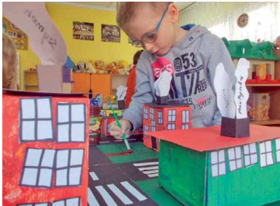
Przedzkolaki z grupy trzeciej – 4- i 5-latków – z Przedszkola Stoneczko w Łowiczu zbudowały makietę miasta, w którym chciałyby mieszkać. Oprócz budynków, ulic, na nich samochodów, chodników, itp., umieściły na swojej pracy także klomby z kwiatami. mak