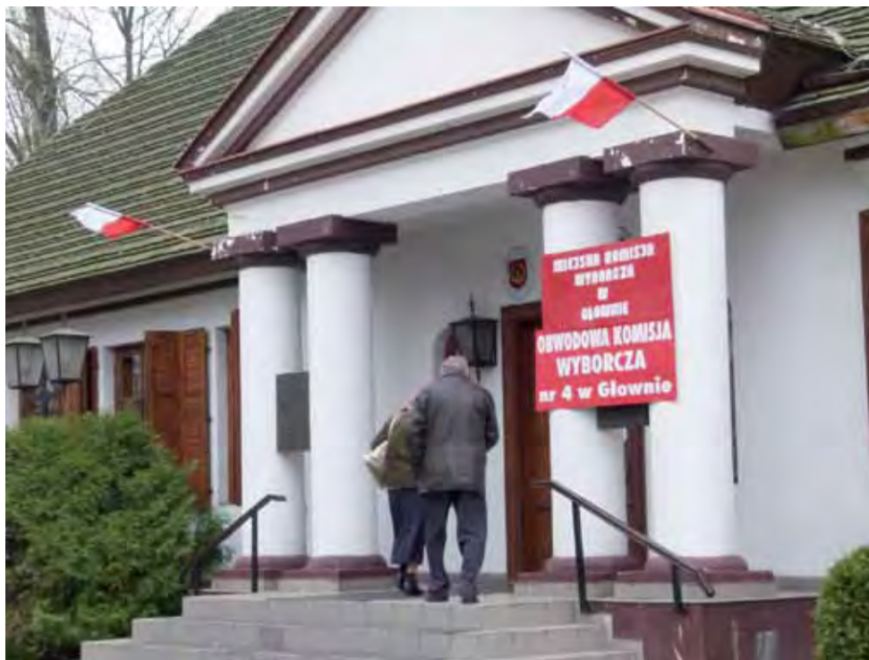
Głosowanie w Głownie. Wyborcy wchodzą do lokalu wyborczego przy ulicy Dworskiej.

Przed wszystkim dziękuję za oddane głosy, za poparcie. Nasz dobry wynik ma też odzwierciedlenie w wyborach do Rady Miejskiej, do której wprowadziliśmy pięcioro radnych. To ewenement, aby komitet skonstruowany na potrzeby wyborów miał większe poparcie niż jakikolwiek komitet partyjny. Nasz sukces to również efekt dwuletnich działań opozycyjnych w radzie oraz kilku miesięcy przygotowań do wyborów. Jesteśmy zadowoleni z tego, że walka była czysta. Prowadziliśmy pozytywną, spokojną kampanię.