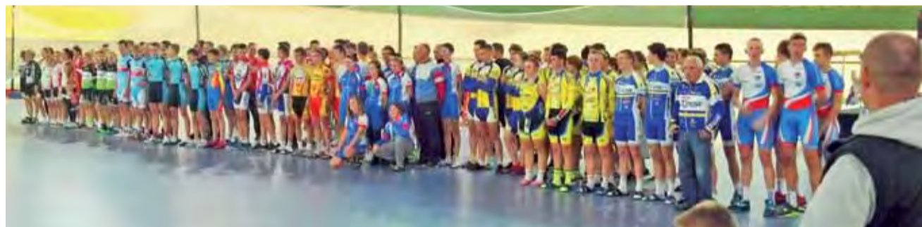
Uczestnicy kolejnych kolarskich zawodów na jedynym krytym, drewnianym torze w Pruszkowie.