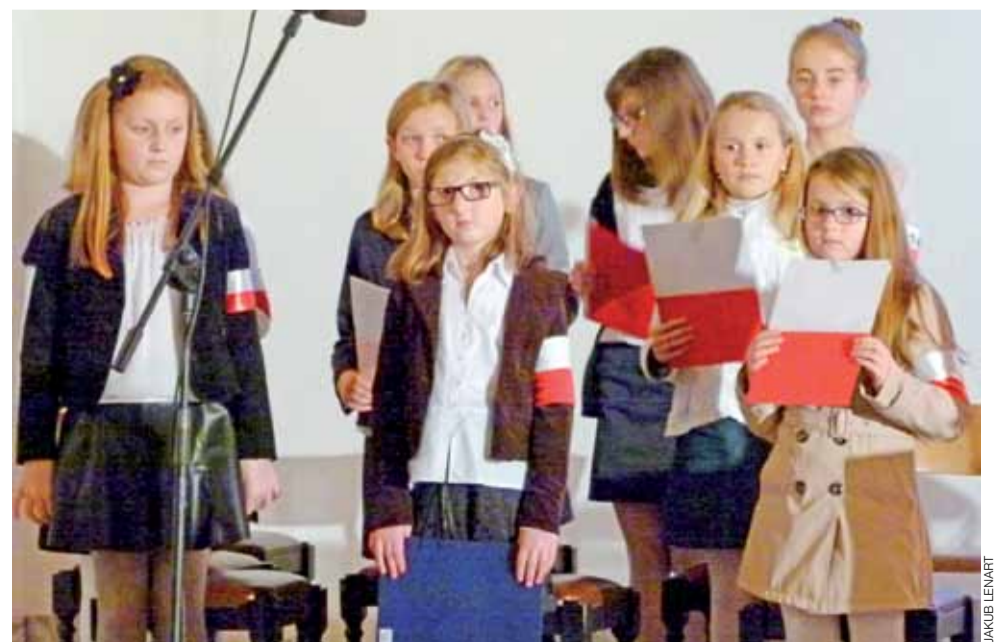
9 listopada wierni zgromadzeni na wieczornej mszy świętej w kościele św. Maksymiliana w Głownie mogli obejrzeć program słowno-muzyczny o charakterze patriotycznym. Jego tematyka poświęcona była walce Polaków o niepodległość w czasie II wojny światowej. Ze względu na tegoroczną 75-rocznicę wybuchu Powstania Warszawskiego sporo miejsca poświęcono właśnie temu wydarzeniu. Program przygotowali: Zabrzeźniańskie Stowarzyszenie im. św. Jana Bosko, działający przy Zespole Szkół Licealno-Gimnazjalnych w Głownie Teatr Eureka oraz chór parafii św. Maksymiliana. kl