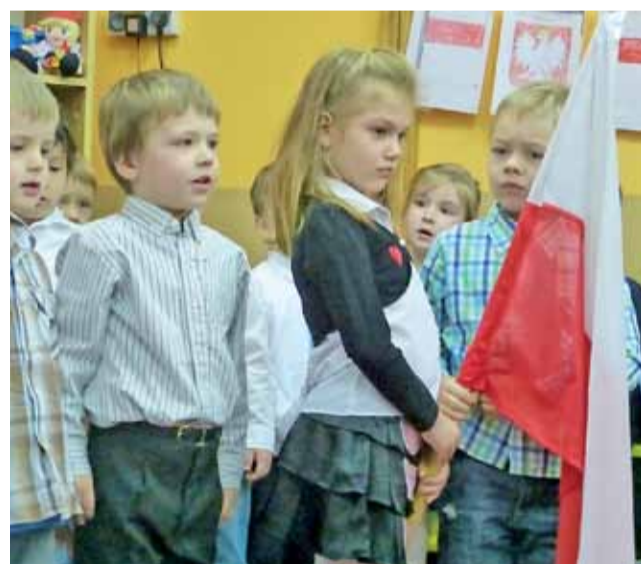
W przedszkolu przy ul. Ułańskiej dzieci od małego uczą się szacunku dla flagi państwowej.