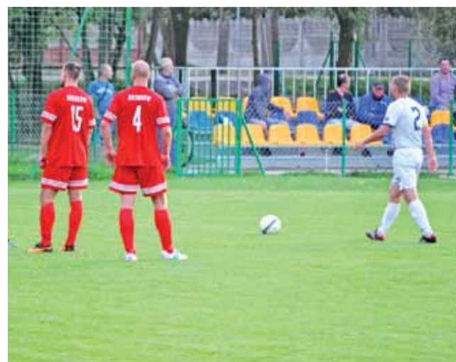
Gracze Zjednoczonych (białe stroje) mogą powoli udać się na urlop.

■ 17. kolejka: Warta Działoszyn - MKP Boruta Zgierz 1:1, Mechanik Radomsko - Włókniarz Moszczenica 1:3, Zawisza Pajęczno - Polonia Piotrków Trybunalski 1:2, GKS II Bełchatów - Zawisza Rzgów 3:1, Orzeł Nieborów - Ner Poddębice 3:0, Pilica Przedbórz - Astoria Szczerców 0:3, Widok Skierniewice - Zjednoczeni Stryków 1:2,