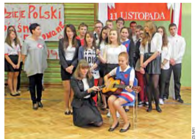
Podczas koncertu zaprezentowały się wszystkie klasy.

Uczniowie oraz nauczyciele Zespołu Szkół Nr 1 w Strykowie uczcili Święto Niepodległości 7 listopada. W szkole podczas uroczystego apelu odbył się koncert patriotyczny „Dzieje Polski pieśnią malowane”. Uczniowie oraz nauczyciele śpiewali piękne polskie pieśni patriotyczne w scenarii barw narodowych, kotylionów i flag. Rozpoczęli nauczyciele, którzy zaśpiewali „Pieśń o Małym Rycerzu”. Później kolejno klasy zaprezentowały znane żołnierskie szlagiery, wśród których pojawiła się m.in. „Dziewczyna z granatem”. W sumie w trakcie koncertu zabrzmiało 19 pieśni.