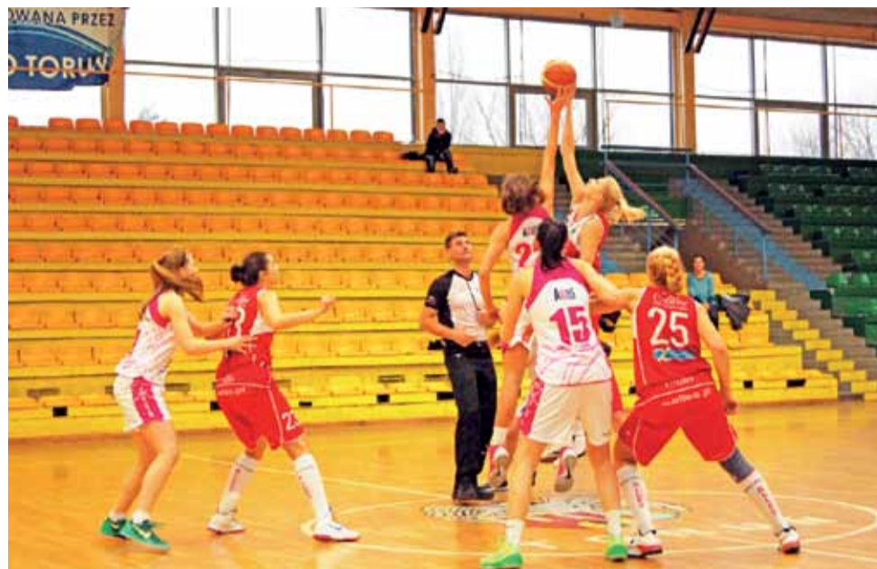
Koszykarki TK Alles (czerwone stroje) wyżej skaczą, lepiej łapią i celniej rzucają od swoich rywali. Głownianki bezdyskusyjnie prowadzą w tabeli, mimo że wszystkie mecze rozgrywały na wyjeździe.

mi UMK, które po 3. kolejkach zajmowały pozycję wiceliderki. Głownianki w tym sezonie pokazują jednak porażającą formę i nic sobie nie robiły z hasłem "Mecz na szczycie", bowiem sobotni pojedynek wyglądał raczej na starcie Dawida z Goliatem. TK Alles już w pierwszej kwarcie pozbawił gospodynie jakichkolwiek złudzeń. Wygrana 34:7 mówi sama za siebie, a w kolejnych odsłonach koszykarki Głowna również były lepsze. Do przerwy prowadzenie aż 53:21 zwiastowało kolejny pogrom i kolejne przekrocze-