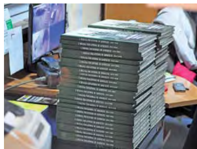
Po spotkaniu sprzedanych zostało w ciągu kilkunastu minut aż 161 książek.