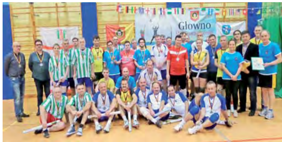
Wielka siatkarska rodzina po raz kolejny zebrała się na Turnieju Samorządowców. Tym razem domem była Hala Sportowo-Widowska w Głownie.