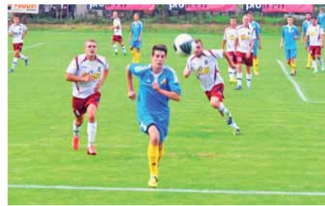
Zjednoczeni II (białe koszulki) od początku sezonu za plecami Stali.