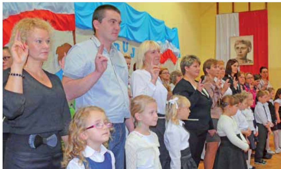
Jednym z ważniejszych momentów uroczystości w Bobrownikach było ślubowanie uczniów, a zaraz po nim rodziców oraz nauczycieli.

z krat zbierających wodę w ul. Grunwaldzkiej, zamontować po jednej nowej kratce w ul. Mickiewicza – w pobliżu łuku drogi oraz na ul. Zachodniej. Oprócz tego, wykonać dwie poważniejsze prace: zlikwidować nieszczelny kolektor deszczowy w ul. Świętojańskiej, w sąsiedztwie ARiMR, w miejscu gdzie powstaje zapadlisko oraz oczyścić kolektor deszczowy między blokami nr 8 a 9 na osiedlu Starzyńskiego, gdzie do plukania ciśnieniowego jest około 50 m sieci, a 30 m do przełożenia. Kolektor w tym miejscu jest bowiem bardzo mocno przerosnięty przez korzenie drzew. tb