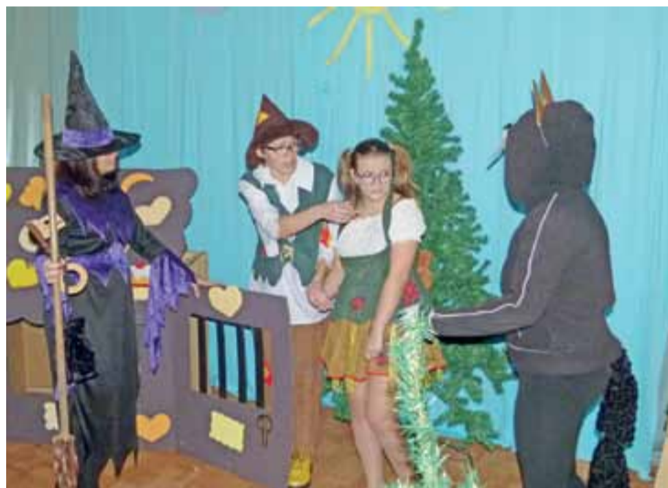
Aktorzy wcieliili się w swoje role bardzo przekonująco.

Przygotowania do przedstawienia trwały dość długo. Zorganizowano pięć prób, ostat-