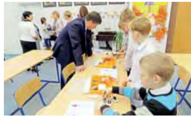
Prezentacji uczniów przygląda się burmistrz Grzegorz Janeczek.

Następnie została ona wyposażona w sprzęt audiowizualny, pomoce dydaktyczne związane z nauką przedmiotów przyrodniczych, meble, nowe żaluzje, rośliny doniczkowe, a nawet kącik hodowlany, w którym uczniowie