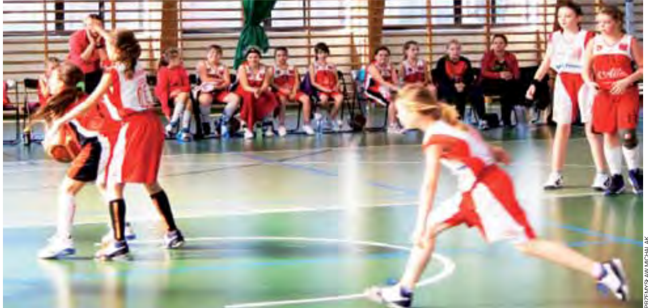
Głowieńskie kadetki z TK Alles (czerwone stroje) tym razem musiały uznać wyższość rywalów z Ujazdu.

Po 10. kolejkach zespół Głowna do lat 16 zajmuje 9. miejsce w tabeli. W kolejnym meczu TK Alles zmierzy się na wyjeździe z arcytrudnym rywalem, liderem rozgrywek MKS Ósemką Skierniewice. Spotkanie odbędzie się w Hali Ośro-