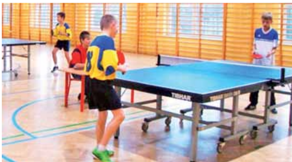
Uczniowie z całej Gminy Stryków rywalizowali w Niesułkowie w Mistrzostwach Tenisa Stołowego

Mecz o 3. miejsce: Zjednoczeni Stryków - Pelikan Łowicz 0:1.