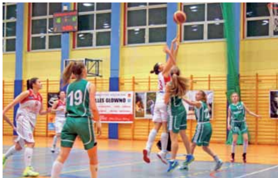
Koszykarki TK Alles Głowno (białe stroje) w tym sezonie wciąż nie zaznały goryczy porażki.

Głowieńskie zawodniczki nie zamierzają zwalniać tempa i chcą wygrać wszystkie mecze w run-