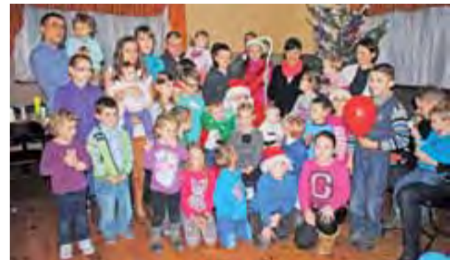
Pamiątkowa fotografia na zakończenie popołudnia obfitującego w wiele atrakcji.

Były również konkursy z balonami, kartkami papieru, celowanie do kosza, wyścig w zjeździe pięciu kawałków ciasta w czasie karmienia przez koleżankę lub kolegę, konkurs po-