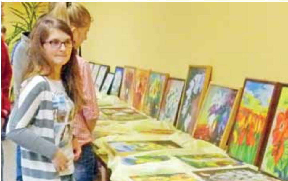
Na wernisazu. Uczniowie głowieńskich szkół oglądają prace artystki malującej ustami.