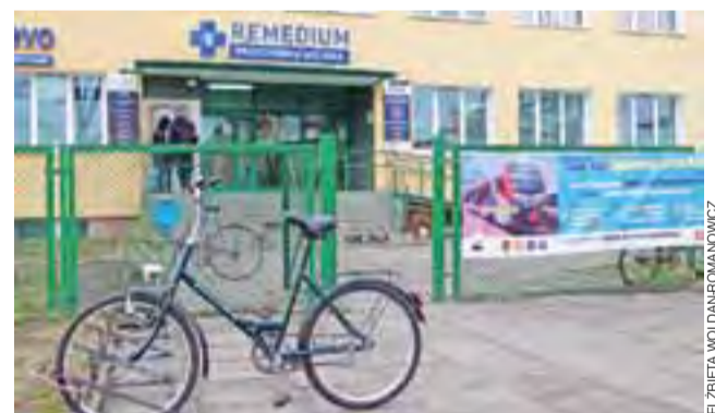
Przychodnia Miejska Remedium. Zmodernizowaną nazwę placówki utrwała w świadomości pacjentów nowy sztyl.

Od września br. miejska spółka Centrum Medyczne przy ul. Kopernika funkcjonuje pod zmodyfikowaną, decyzją właściciela, nazwą Przychodnia Miejska Remedium.