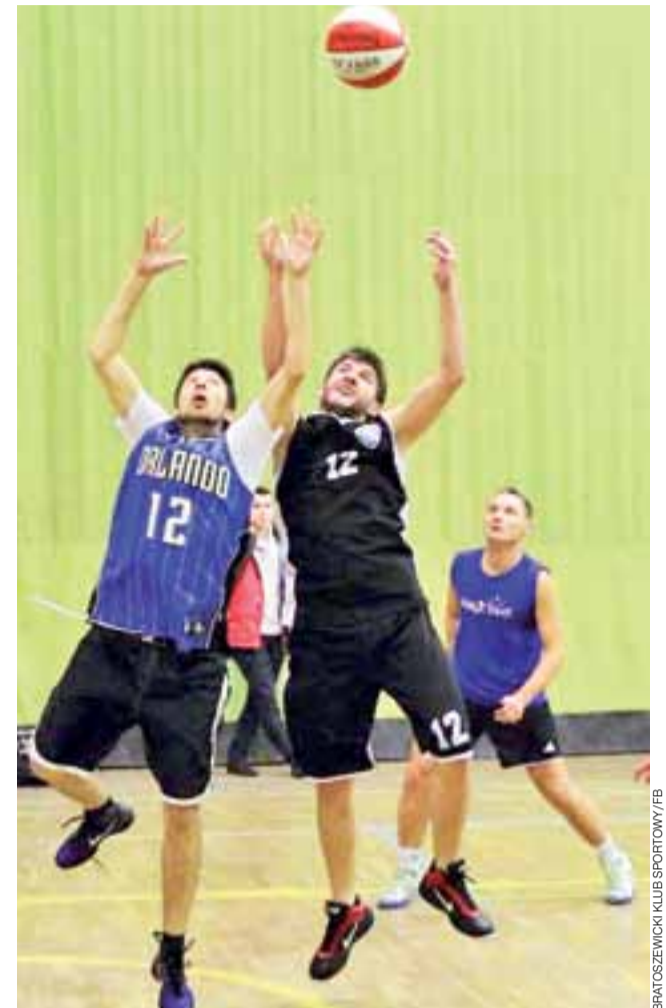
Koszykarze BKS-u Lalalilo Bratoszewice (czarne stroje) nie odpuszczają, chociaż walka w play-offach zawsze jest bardzo zacięta.

Trwa również ciekawa rywalizacja w półfinałach, gdzie