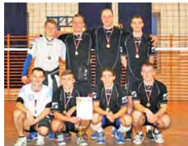
Siatkarze BKS-u Bratoszewice z medalami i pucharem ze 3. miejsce w Turnieju Mikołajkowym.

Spotkanie ligowe nie było jedyną aktywnością BKS-u na arenie sportowej. Dzień wcześniej w sobotę, 13 grudnia odbyła się kolejna edycja Turnieju Mikołajkowego w Bielawach, zorganizowanego przez klub UKS Bzura sobota. Do rywalizacji w zawodach przystąpiło 6 drużyn, podzielonych na dwie grupy. Sędziami głównymi byli Dominik Kuś oraz Michał Brzeziński.