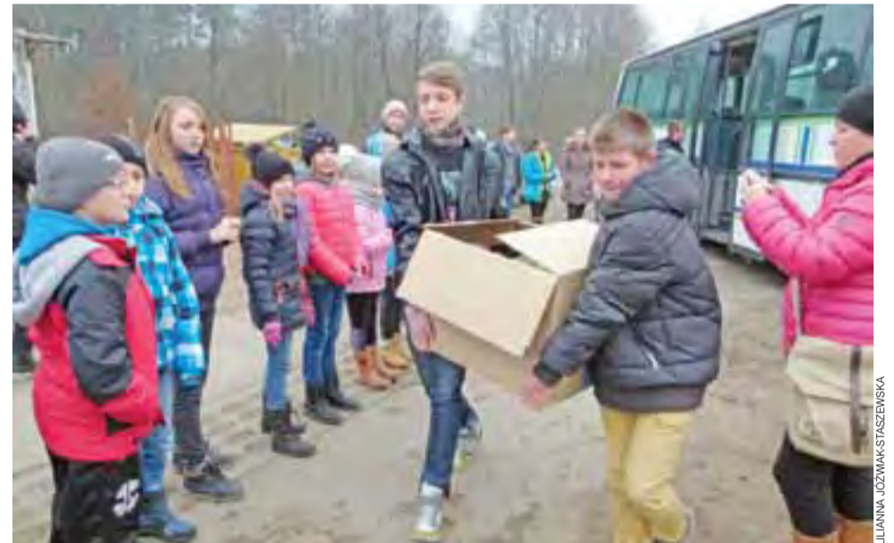
Zbrane dary uczniowie dmosińskiej szkoły przyniosli pod bramę schroniska nawet w okazałych pudłach.

– Najgorzej jest w okresie letnim. Dlatego już teraz musimy tak dysponować zapasami,