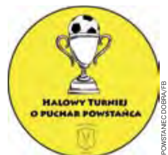
Oficjalne logo Turnieju już jest.

Turniej piłki nożnej halowej „O Puchar Powstańca” zbliża się wielkimi krokami. Zaplanowana na 28 grudnia br. impreza odbędzie się z udziałem 10-12 drużyn, a nie jak pierwotnie zakładano 8. Organizatorzy zdecydowali się powiększyć grono uczestników ze względu na duże zainteresowanie i by jeszcze zwiększyć dodatkowo rangę zawodów. W tej chwili można potwierdzić udział takich drużyn, jak: Czarni Smardzew (B-klasa, gr. II), Struga Do-