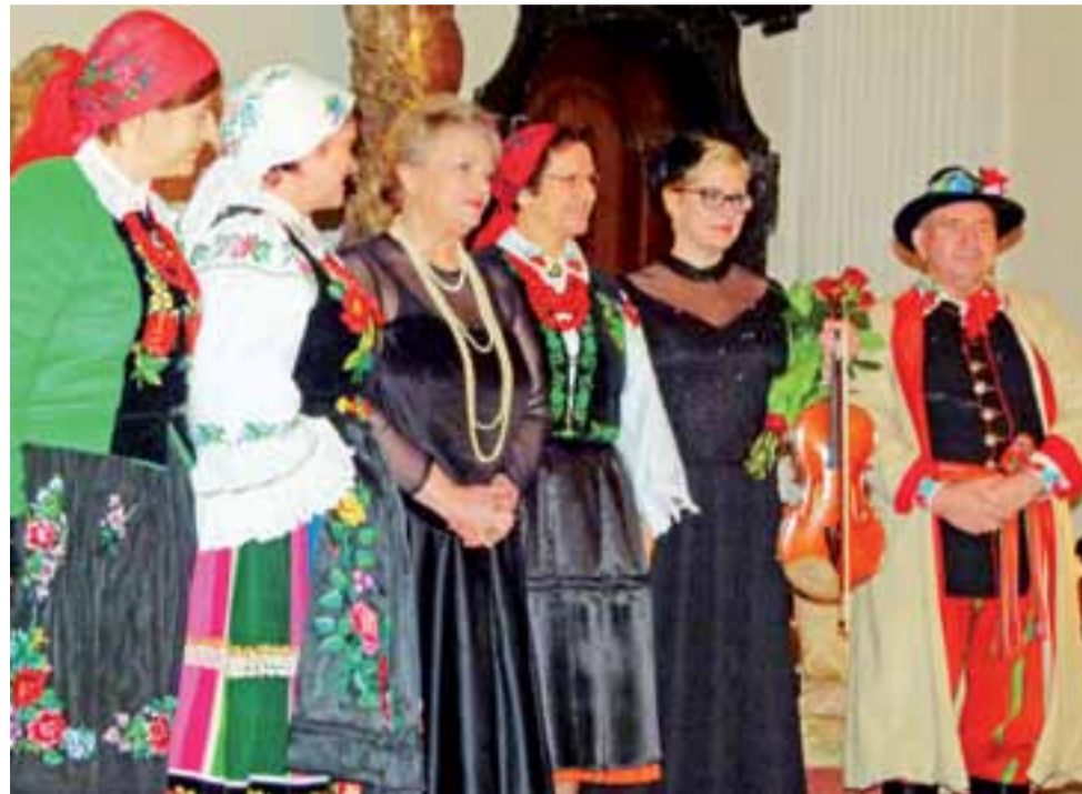
Anna Seniuk oraz Magdalena Małecka chętnie fotografowały się z Ksiazkami w autentycznych strojach łowickich.

Akompaniująca aktorkę Magdalena Małecka jest jej córką, a panie występują razem prawie od... momentu poczęcia. Wiąże się z tym ciekawe zdarzenie. Otóż w jednym z wywiadów Anna Seniuk przyznała, że niewiele brakowałoby, żeby „przez córkę” nie wystąpiła w filmie Witolda Leszczyńskiego „Koniopielka” (1981). Kiedy zaczęły się zdjęcia do filmu, okazało się, że aktorka jest w ciąży. Do filmu dopisana więc została scena, w której filmowa Handzia (Anna Seniuk) powiedziała do filmowego męża Kaziuka Bartoszewicza, którego zagrał Krzysztof