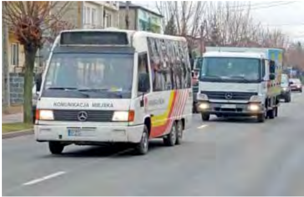
Komunikacja miejska. Autobus na ulicy Sikorskiego.

Burmistrz wspominał o wniosku na zakup 2 autobusów hybrydowych razem ze stacją tankowania w ramach Łódzkiego Obszaru Metropolitalnego (zakup ma być dotowany z funduszy unijnych). Po tym zakupie łatwiej będzie zwiększyć częstotliwość kursów i ewentualnie zmodyfikować trasy. Wyzwaniem będzie sprzężenie odjazdów autobusów z jednej strony z kursami pociągów ŁKA, a z drugiej z potrzebami uczniów, dojeżdżających komunikacją do miejskich szkół. Na razie przystanek bezpośrednio przy szpitalu nie powstanie, ale na przyszłość planowane jest pusczenie autobusów ulicą Wojska Polskiego i z tą intencją miasto ubiega się o dofinansowanie