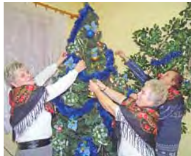
Panie z Koła Gospodyń Wiejskich w Woli Cyrusowej Kolonii ubierają choinkę – podarunek od jednej z mieszkanki, która osiedliła się w tych okolicach na dobre dopiero całkiem niedawno.

Koło otrzymało od gminy wyremontowane pomieszczenia starej szkoły podstawowej. Tu, gdzie był gabinet stomatologiczny, urządzono kuchnię. Z dwóch izb lekcyjnych powstały pomieszczenia, gdzie z powodzeniem można spotkać się w większym gronie. Jest też zaplecze sanitarne i dwa korytarzyki. Przekazanie pomieszczeń nastąpiło pod koniec sierpnia, a w ubiegły piątek poradziły sobie z ich wyposażen-