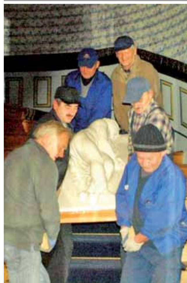
Rzeźba świętej Cecylii opuściła 20 listopada Muzeum w Nieborowie. Została ona zabrana do pracowni konserwatorskiej Bieniewo Pawła Pietrusińskiego i Bartosza Markowskiego w Warszawie. Posłuży ona za wzór do stworzenia kopii, która zostanie umieszczona, zgodnie z oryginalnym założeniem, w rekonstruowanym grobowcu na wyspie topolowej w arkadyjskim parku. Całość prac, których finisz zapowiedziany jest na wiosnę 2015 roku, będzie kosztować 70 tys. zł. tb