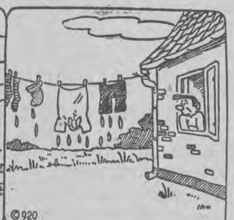
Wszystko się suszy!