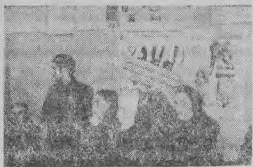
Zaloga PZPB Nr 21 w skupieniu słucha wykładu z historii Polski

chowcami — mówi tow. Orczykowski — a także ludzi o wysokim poziomie moralnym; my będziemy pierwszą fabryką, która zlikwiduje straż przemysłową, a pragnęlibyśmy, by w przyszłości móc się obejść również bez re-