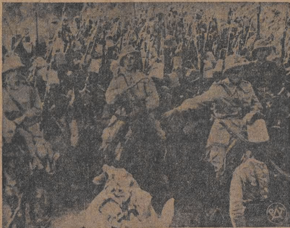
Człowiek oddziały piechoty włoskiej, które zdobyły Aduę sfotografowane na kilka godzin przed atakiem.

wiadomości z Addis-Abeby sięga 6.000, a obsadzili oni cały obszar frontu od rzeki Takka aż do Makalle. Okolice Makalle przedstawiają w chwili obecnej istny obóz warowny.