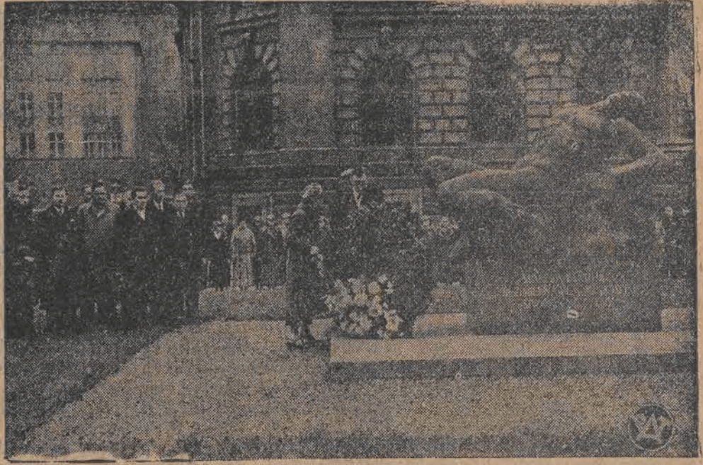
W Warszawie odbył się walny zjazd Pocztowego Przystosobienia Wojskowego. Na zdjęciu lewym — fragment inauguracyjnego posiedzenia. Na zdjęciu prawym: uczestnicy odbywającego się w Warszawie VI-go zjazdu Zjednoczenia Młodzieży Pracującej „Orle” przed pomnikiem Pełowiaka w Warszawie, u stóp którego złożyli wieniec.