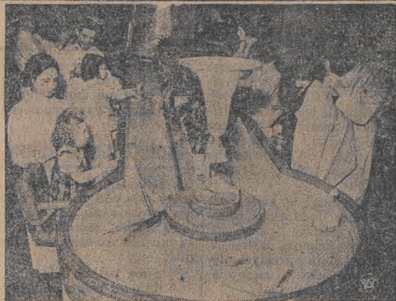
W Paryżu otwarto specjalny zakład przeznaczony dla dzieci. Aby zbawić małych klientów zbudowano basenik z bieżącą wodą, w którym obok żywych złotych rybek pływają stateczki i kaczki z celuloidu.