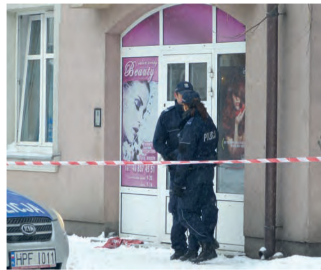
Bezpośrednio po zabójstwie policja zamknęła ruch w okolicach salonu.

Z naszych ustaleń wynika, że mężczyzna, który dokonał zabójstwa, dorabiał jako taksów-