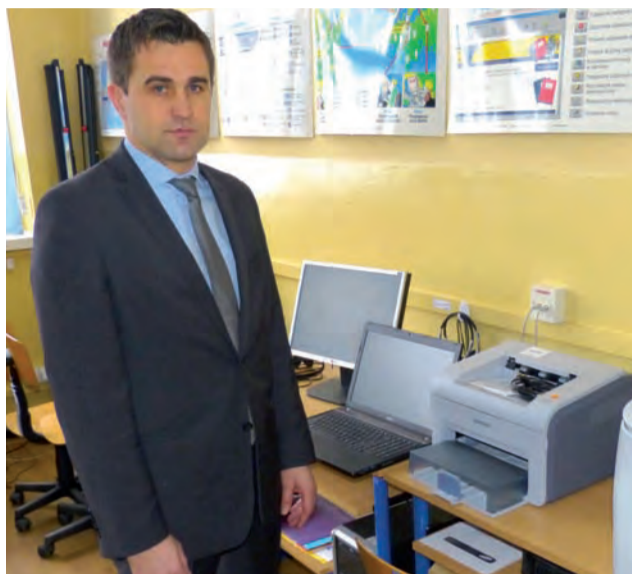
Na sprzęt dla szkoły w Mastkach gmina pozyskała 95 tys. złotych.

Udało się zrobić wszystko, co zaplanowaliśmy, chociaż oczekiwania wciąż rosną.