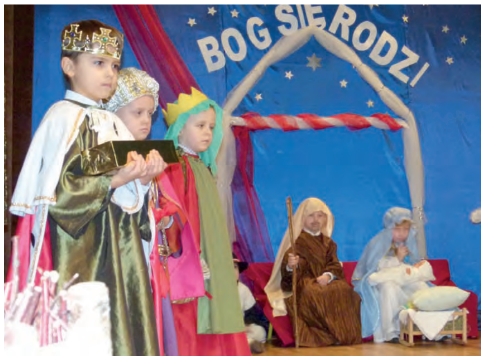
Trzej Królowie jak zwykle należą do najbardziej barwnych postaci jasełek.

Stryków | Przedszkole Sióstr Służebniczek