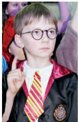
Uczniowie szkoły przebrali się na bal za zwierzęta oraz bohaterów ulubionych filmów m.in. Harry'ego Pottera.

Uczestnicy balu oraz rodzice mogli w czasie zabawy posilić się w bufecie. Powodzeniem cieszyły się ciasta, jak się dowiedzieliśmy – mamy przygotowały ich aż 28 różnych rodzajów. Dochód osiągnięty ze sprzedaży losów jak i ciast został przekazany na sfinansowanie imprezy, pozostałe koszty pokryła Rada Rodziców i szkoła. tb