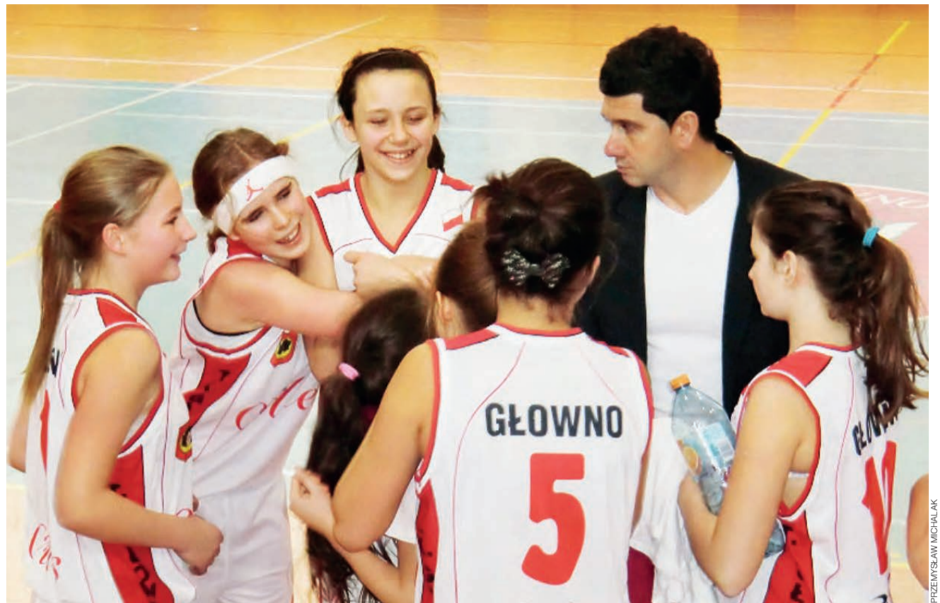
Alles Głowno – ŁKS KK Łódź 68:67. Młode koszykarki Alles Głowno po fantastycznym zwycięstwie nad ŁKS-em mają prawo być w pełni uradowane.

Koszykówka | 13. kolejka młodziczek młodszych, U-13