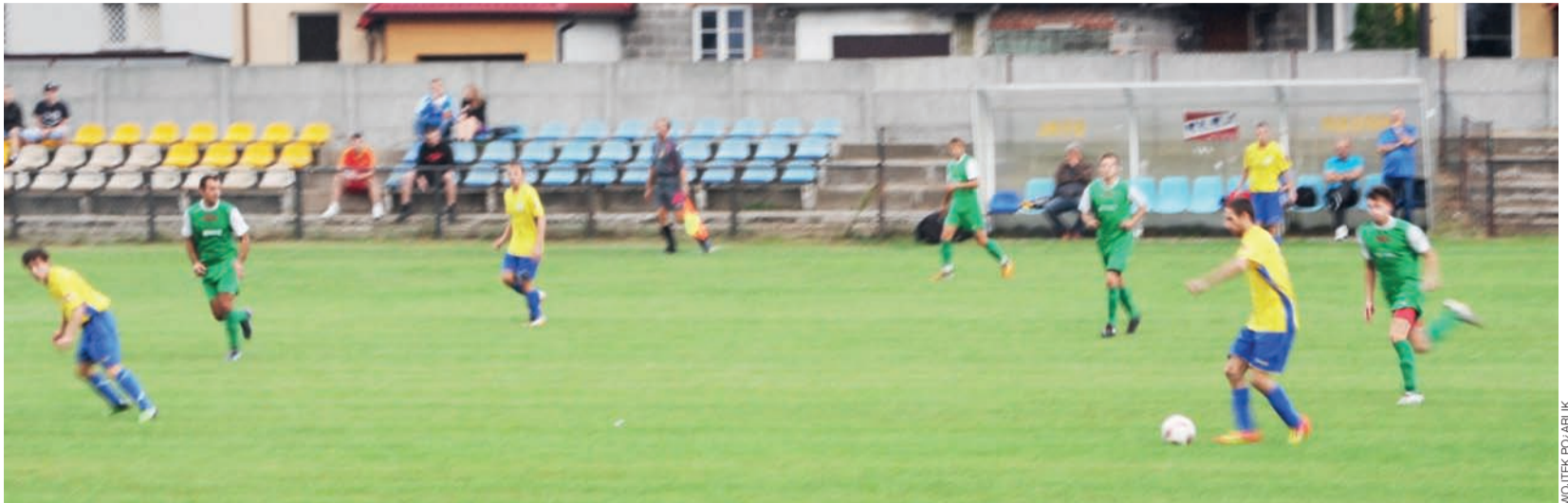
Piłkarze Stali Głowno rozegrają dziesięć meczów sparingowych, które mają przygotować ich do wyczerpującej rundy wiosennej.

Stal Głowno treningi wznowiła 14 stycznia, a swój pierwszy mecz kontrolny rozegra 2 lutego. Tego dnia w Łowiczu, o godz. 12:00 głównianie sprawdzą się w starciu z rezerwami Zjednoczonych Stryków (A-klasa, gr. II Łódź). W sumie Stal rozegra 10 sparingów, a przeciwnicy głównian będą bardzo różnorodni, od A-klasy do IV ligi.