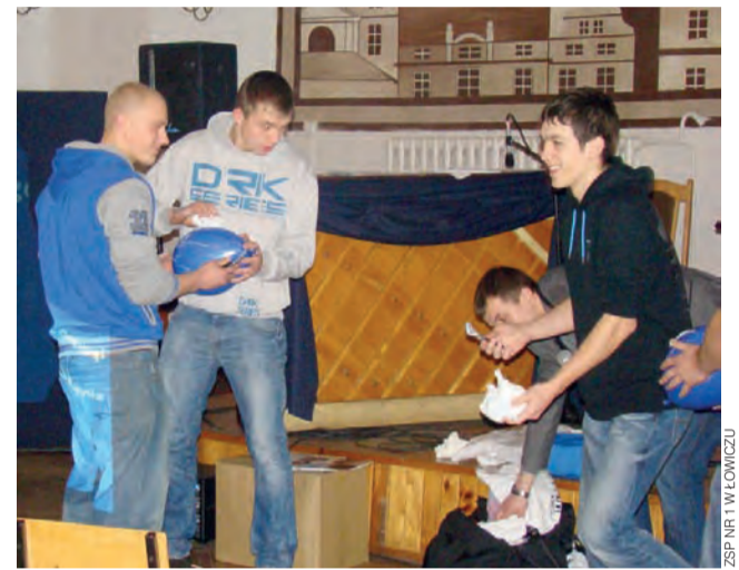
Uczniowie ZSP nr 1 poprzez zabawę ćwiczyli, w jaki sposób prawidłowo się golić.