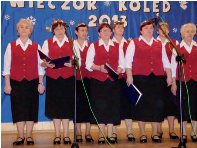
Zespół Lipkowianka zaprezentował się w kilku najbardziej znanych kolędach i pastorałkach.