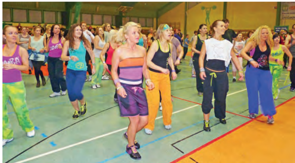
Początek maratonu. Wszyscy w pełni sił tańczą zumbę. Instruktorzy są nie tylko na scenie, ale też w pierwszym rzędzie.