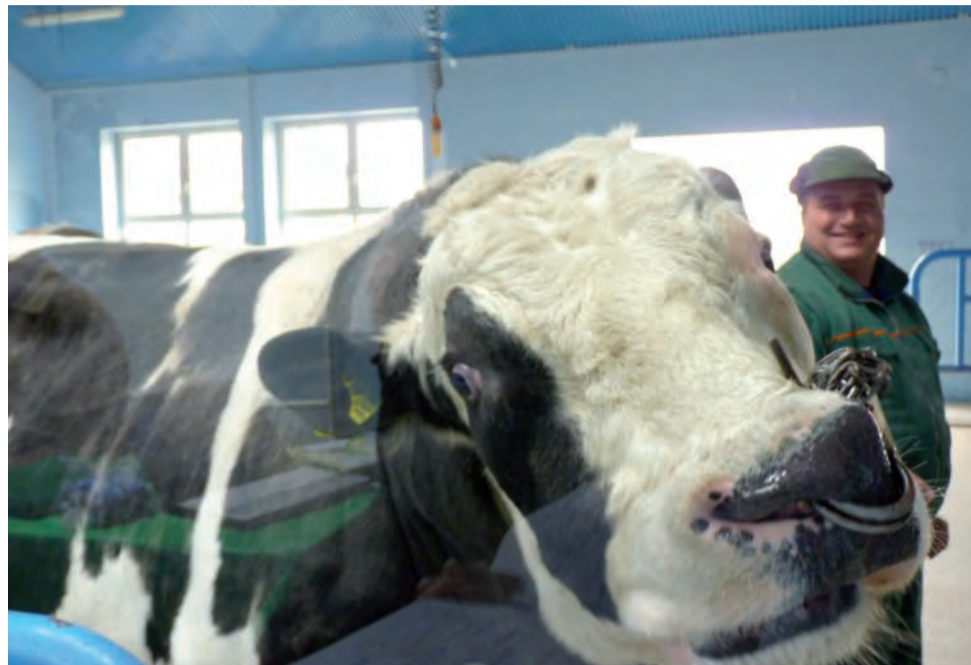
Jeden z buhajów będących w posiadaniu Centrum w czasie pokazu.

Mazowieckie Centrum Hodowli i Rozrodu Zwierząt funkcjonuje na terenie Łowicza od 1956 roku, do roku 2000 był to zakład budżetowy, potem został przekształcony w spółkę z o.o ze 100-procentowym udziałem Skarbu Państwa. Centrum skupia hodowców bydła, trzody