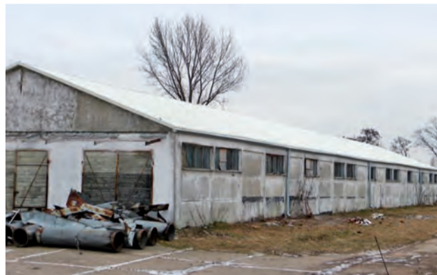
Jedna z obór na terenie pracowni rolniczej ma już nowy dach. Eternit ze starego pokrycia został zutylizowany.

Uczniowie mają czas na wykonanie plakatów do połowy lutego, a szkoła do 22 lutego zgłosi je do placówki terenowej KRUS w Gostyninie. Tam wyłonione zostaną prace, które będą reprezentować placówkę na etapie wojewódzkim. Nagrody rzeczowe otrzyma czterech laureatów obu etapów. Prace laureatów trzech pierwszych miejsc etapu wojewódzkiego z każdej kategorii wiekowej niniejszego konkursu wezmą udział w etapie centralnym konkursu. mak