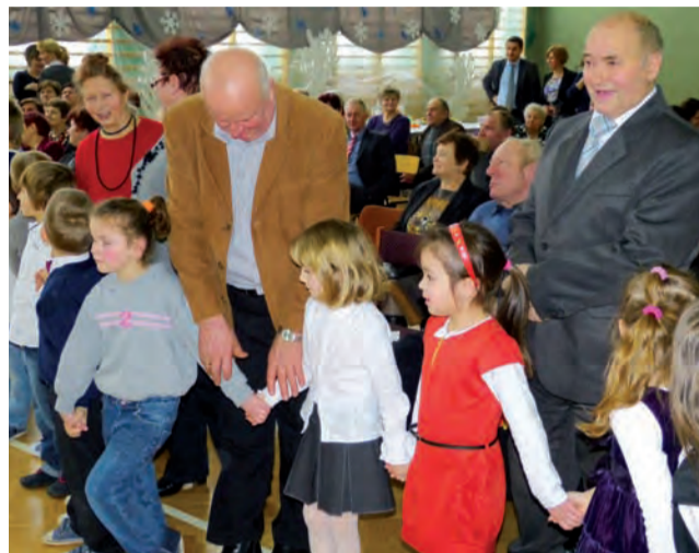
Do Szkoły Podstawowej w Mastkach przyszło ponad 70 seniorów.

Punkt kulminacyjny spotkania, podczas którego dzieci wybiegły w stronę seniorów z drobnymi prezentami, niejednemu