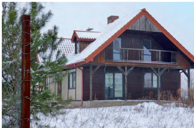
Gmina Stryków, chcąc nie chcąc, weszła z powrotem w posiadanie działki przy ul. Wczasowej, a do tego wybudowanego na niej domu. Kosztowało ją to blisko 600 tys. złotych.

Rozstrzygnięcia zapadające przed sądem, od których strony składały odwołania, raz przechylały się na szalę powódki, raz na szalę gminy. Ostatecznie 19 grudnia ubiegłego roku Sąd Apelacyjny w Łodzi zasądził 42% żądanej