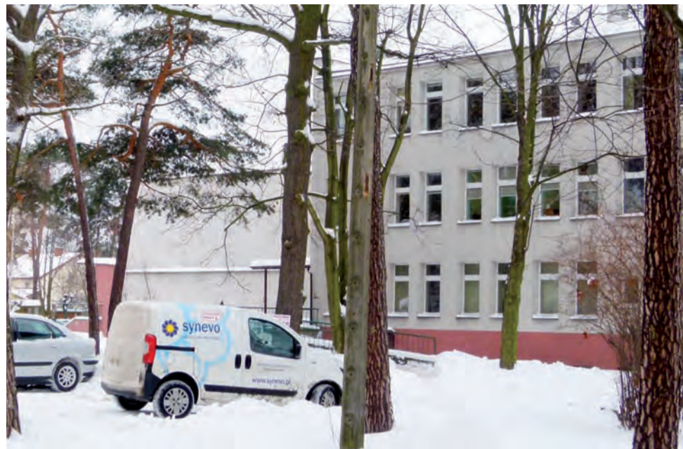
Szpital w Głownie. W Sądzie Okręgowym w Łodzi wkrótce rozprawa w sprawie czynszu niepłaconego przez dzierżawcę miejskiego majątku.