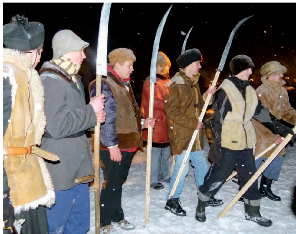
Powstańcy 1963 r. Uczniowska adaptacja „Ballady o księdzu Brzózce i jego kosynierach”.

Wstępnej tezy postawionej przez policjantów z KP Głowno i zapisanej w prowadzonej przez komisariat książce wydarzeń krótko po zdarzeniu o tym, że sprawcą wypadku był kierowca samochodu osobowego, który na skrzyżowaniu równorzędym nie ustąpił pierwszeństwa jadącemu z prawej strony motorowerystyce, nie były w stanie jednoznacznie potwierdzić ustalenia załogi Wydziału Ruchu Drogowego KPP Zgierz, która na miejsce zdarzenia dotarła jako druga w kolejności. str. 5