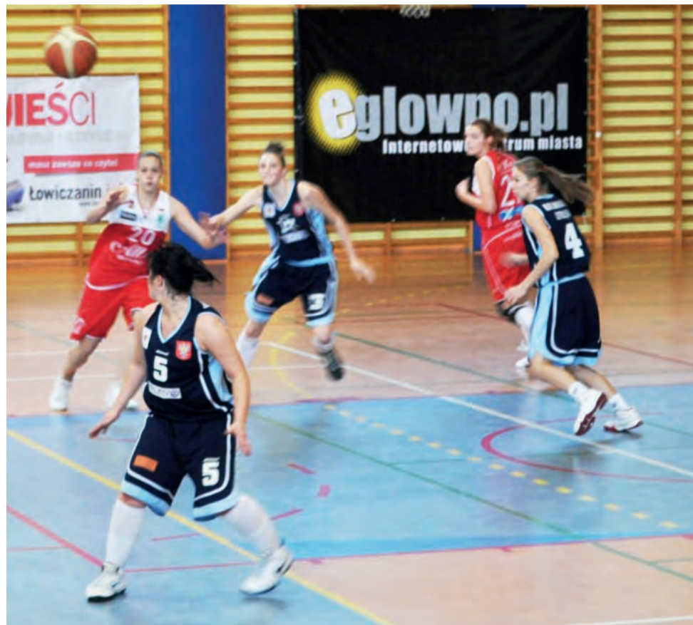
Głownianki (biało-czerwone stroje) wygrały kolejny mecz w rozgrywkach II ligi i są coraz bliżej czołówki.