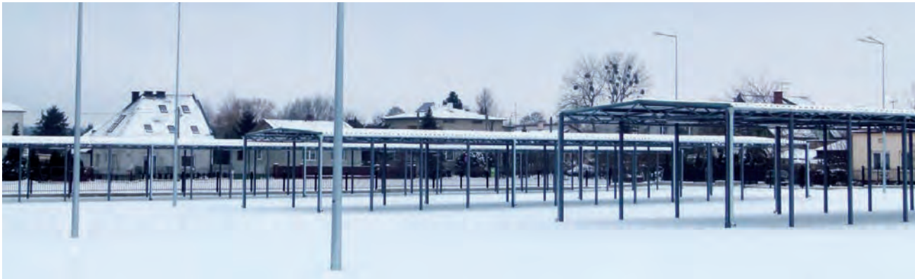
Targowisko w końcu gotowe do użytkowania.

Tysiące metrów kwadratowych dachów trzeba odśnieżać pod Strykowem. str. 7