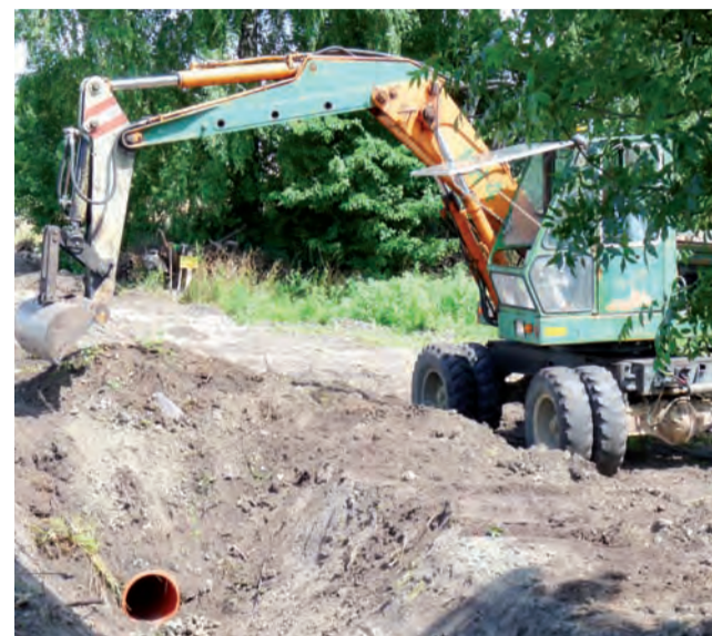
Okopywanie rowów – to była jedna z poważnych inwestycji 2012 roku.

konanie w 2012 roku „spinki” wodociągowej pomiędzy Wyborowem a Mastkami. Wodociąg o długości ok. 1,2 km spinający te dwie miejscowości kosztował ok. 70 tys. zł. Pozwoliło to na połączenie dwóch niezależnych do tej pory sieci wodociągowych zasilanych z hydroforni w Skowrodzie Południowej (doprowadza wodę do 7 wsi) i wspomnianej hydroforni w Wyborowie. Po co wykonywano tę inwestycję? Studnia przy hydroforni w Skowrodzie okazała się w ostatnich latach mało wydajna. – Dawało się odczuć, szczególnie w lecie i wietrzorami, spadki ciśnienia wody. Teraz hydrofornia z Wyboro-