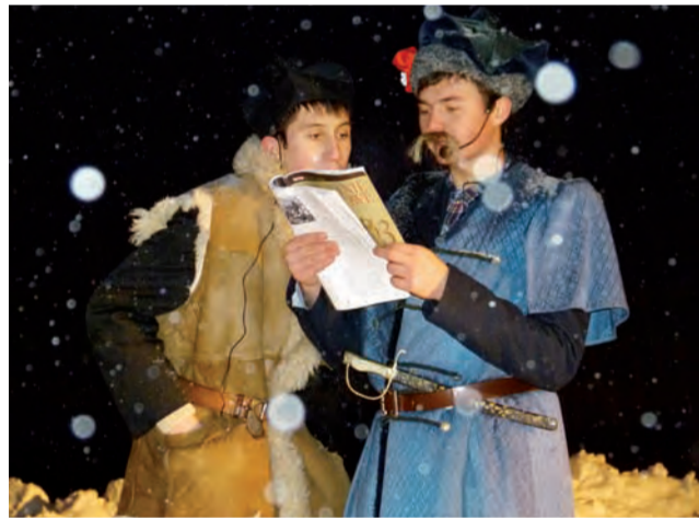
Do bronii! Ksiądz Stanisław Brzózka z powstańcem.

W „Balladzie o księdzu Brzózce i jego kosynierach” położono akcent na jedność Polaków w obliczu bojowego wyzwania, a momentem szczególnie poruszającym była przysięga kosynierów składana przed ich dowódcą – młodym duchownym. Przed widowiskiem spektaklu defilowali żołnierze z powstańczymi flagami. Realizmu plenerowej inscenizacji dodały oryginalne stroje i rekwizyty, m.in. repliki bronii. Kosy dla kosynierów przekuli na sztorc technicy ze szkoły, a część kostiumów, dzięki finansowemu wsparciu Urzędu Miejskiego, wypoży-