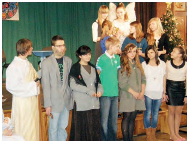
W czasie spotkania Kół Gospodyń Wiejskich młodzież z Gimnazjum Publicznego w Zdunach wystawiła jasełka.