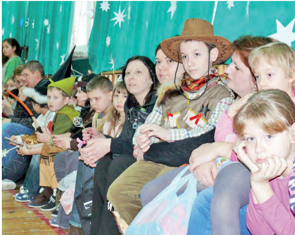
Uczestnicy zabawy choinkowej przyglądają się uczniom klas III-VI, którzy właśnie tańczą poloneza.