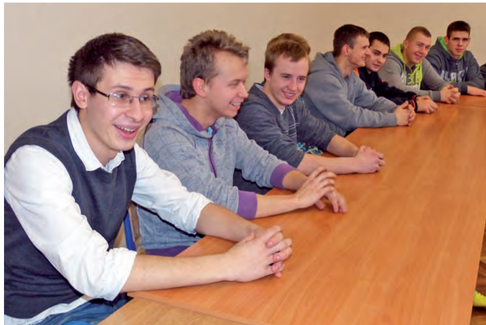
Uczniowie IV klasy technikum w odnowionej sali do nauki języków obcych.

Ze szkolnych finansów wyremontowano także 12 pokoi mieszkalnych w internacie. Prace budowlane rozpoczęły się 26 listopada. Podobnie jak w salach lekcyjnych, w pokojach położono nowe gładzie na ścianach i sufitach. Budowlanci wymienili także przestarzałą instalację elektryczną, oprawy oświetleniowe oraz kąciki sanitarne. Na podłodze znajduje się teraz nowa terakota, którą zamontowano zgodnie z zaleceniami sa-