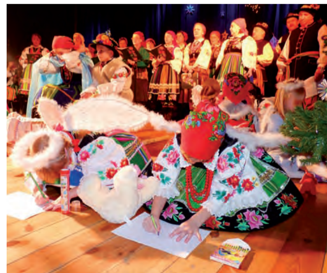
Scenariusz przedstawienie przewidywał m.in. to, że Furkotki będą rysować na scenie.