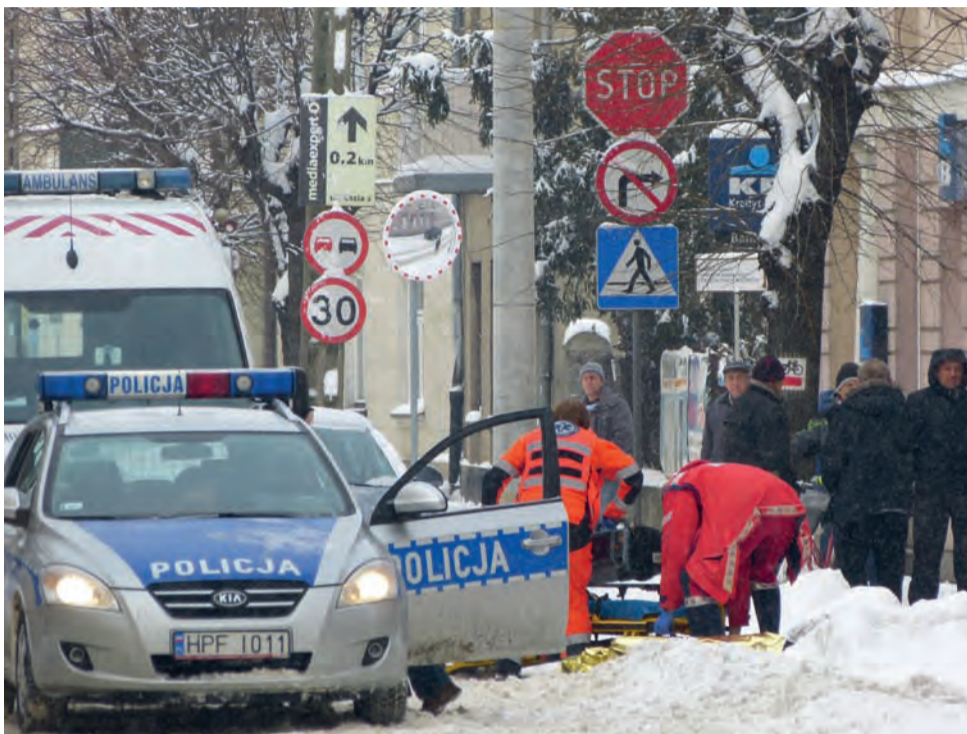
Kobiety nie udało się uratować, choć pogotowie ratunkowe zjawilo się błyskawicznie.