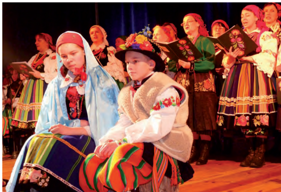
Scenariusz przedstawienia napisała Joanna Bolimowska.

Łowicz | Ksiazki i Furkotki na jednej scenie