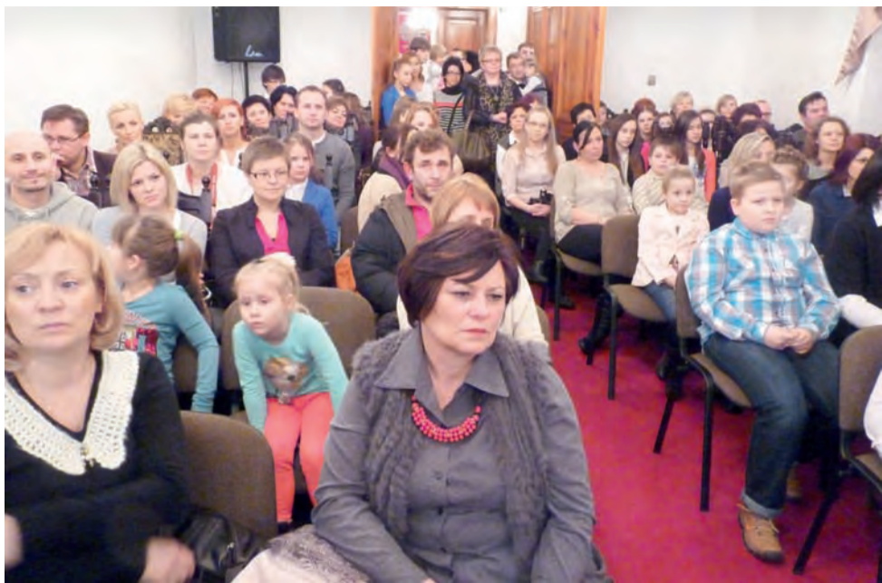
Podsumowanie konkursów zgromadziło na sali wiele osób.