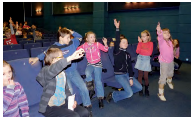
Konkursy cieszyły się dużym powodzeniem. Dzieci chętnie brały w nich udział i wygrywały nagrody.

Bałwankowa kraina w Teatrze Piccolo, a następnie zwiedziły Muzeum Bajki Se-Ma-For. W miniony poniedziałek do Łodzi pojechało 38 osób. Podobnie jak poprzednio zaplanowano zwiedzanie Muzeum Bajki i wejście na spektakl. Tym razem jednak dzieci nie obejrzały tradycyjnego przedstawienia, ale wzięły udział w otwartej próbie. Spotkały się z reżyserem i choreografem. A po obejrzeniu kilku scen doradzały, co warto jeszcze zmienić w przedstawieniu, by jeszcze bardziej podobało się najmłodszym widzom. – Te dwa wyjazdy były zupełnie inne. Pierwszy, w którym wzięły udział dzieci młodsze, miał jedynie charakter zabawy. Drugi był zorganizowany bar-