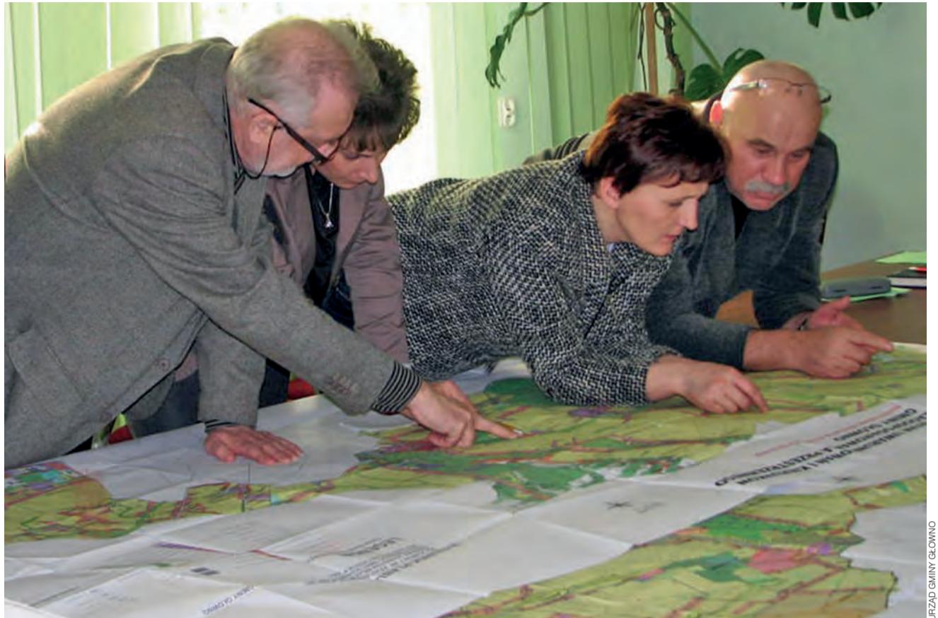
Dyskusja nad studium uwarunkowań i kierunków zagospodarowania przestrzennego gminy Głowno.

1 lutego w Urzędzie Gminy trwała dyskusja nad studium uwarunkowań i kierunków zagospodarowania przestrzennego gminy. Wzięli w niej udział przedstawiciele urzędu, radni gminy Głowno i przedstawiciele pracowni architektonicznej. Wkrótce dyskusja nad studium ma przenieść się także do komisji stałych Rady Gminy Głowno. Nieoficjalnie udało nam się dowiedzieć, że rozmowy dotyczyły także przeznaczenia pewnych terenów pod ewentualną budowę elektrowni wiatrowych. Studium uwarunkowań miałyby przewidywać budowę dwóch kompleksów farm wiatrowych, z których każda liczyłaby od 6 do 8 wiatraków. Obszar, w którym mogłyby stać elektrownie, to grunty należące do mieszkańców Feliksowa i Mąkolic, w pobliżu autostrady A1.