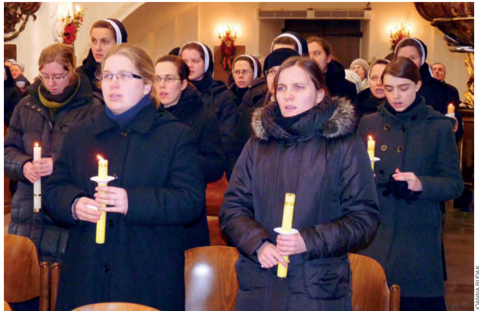
Wśród zakonnic wiele było nowicjuszek, które nie były jeszcze ubrane w habitę.

Patrycja Otto, Dziennik Gazeta Prawna 8.02.2012