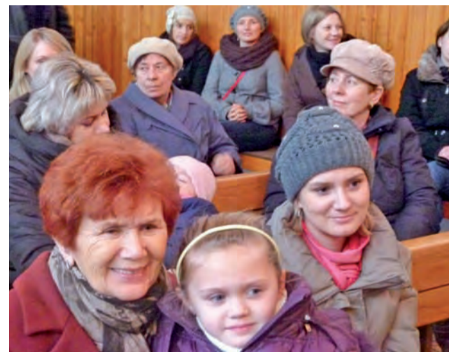
Publiczność tworzyły przede wszystkim mamy i babcie przedszkolaków.