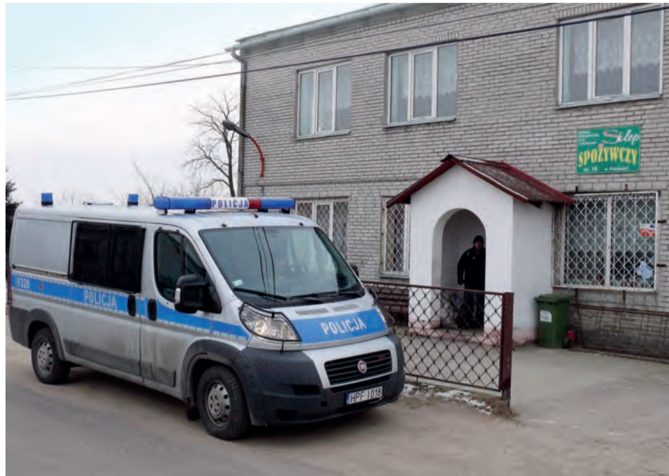
Policjanci pod sklepem w Patokach niecałą godzinę po mającym tam miejsce napadzie.