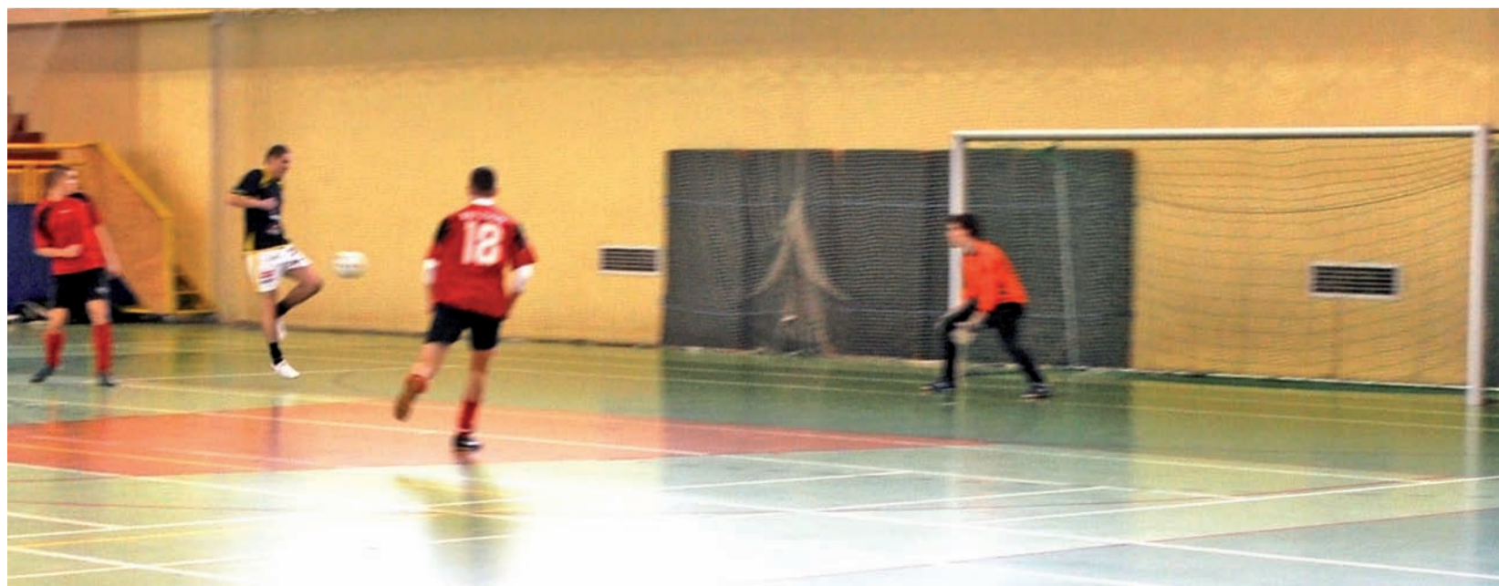
Turnieje w głowieńskiej hali cieszą się dużą popularnością.