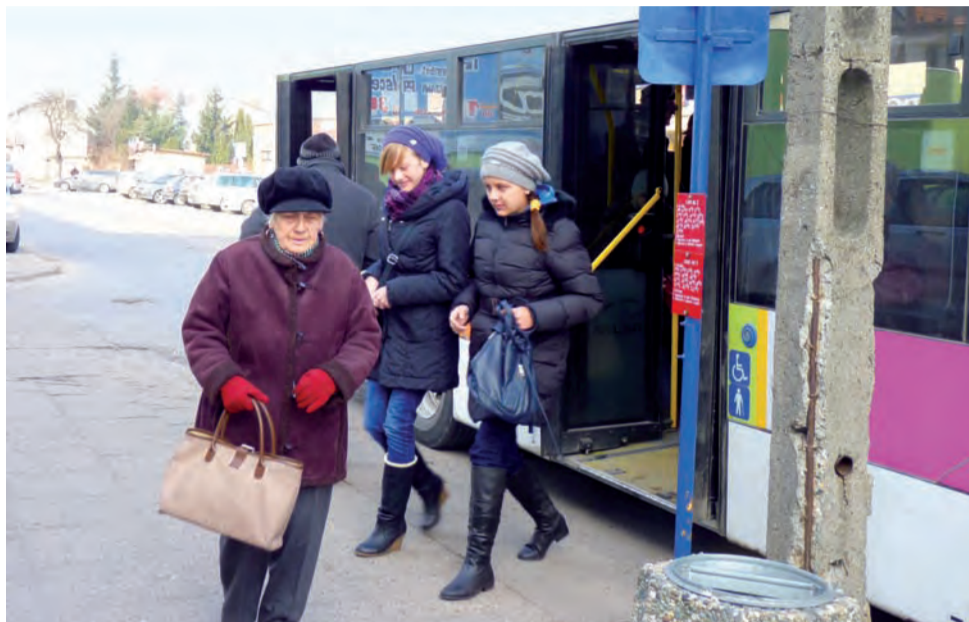
Z przystanku na ul. Kurkowej w Łowiczu można dojechać m.in. do Dąbkowic, Niedźwiady i Seligowa.

W tym roku, ze względu na wzrost cen paliwa, władze gminy spodziewają się przeznaczyć