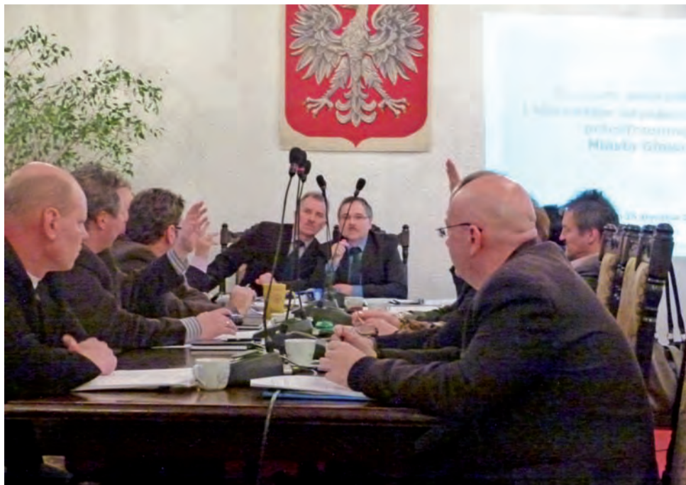
Rada Miejska w Głownie w końcu uchwaliła zmiany w studium uwarunkowań.