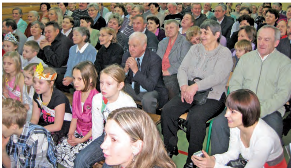
W szkole w Mąkolicach spotkały się trzy pokolenia. Tego dnia najważniejsi byli dziadkowie.