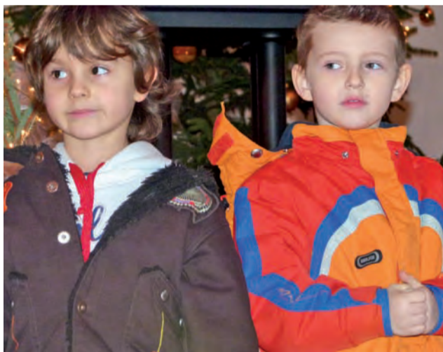
W kościele św. Maksymiliana na Zabrzeżni wystąpili także chłopcy.