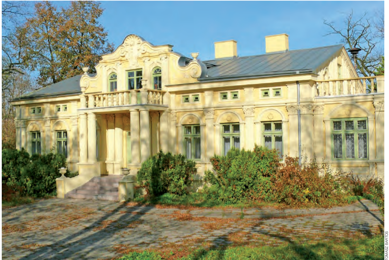
Pałac Jabłońskich, w którym swoją siedzibę ma Muzeum Regionalne to jeden z najstarszych budynków w Głownie.

Czy możliwe jest czerpanie z posiadania zabytku jakiegokolwiek korzyści? Teoretycz-