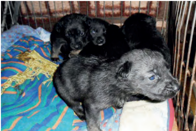
6 szczeniaków zostało podrzuconych do Arkadii w dużej torbie.

NASI DZIENNIKARZE DO WASZEJ DYSPOZYCJI OD 8.30 DO 15.30 Telefon redakcyjny 42 710 82 55 e-mail: jakub.lenart@lowiczanie.info JAKUB LENART