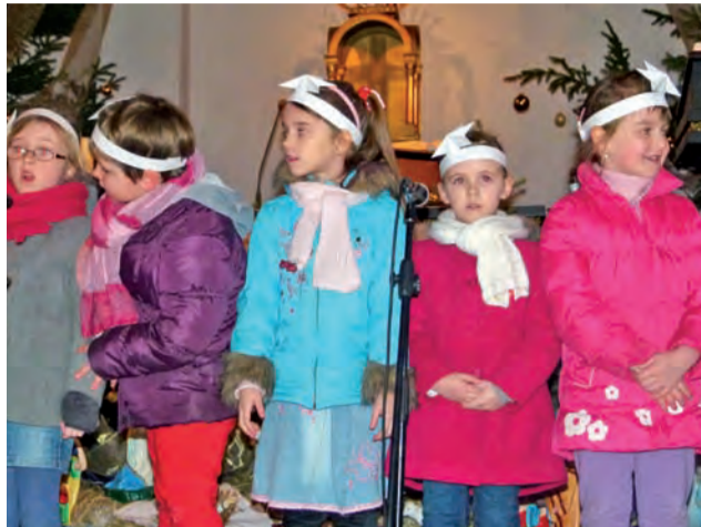
Aniołeczki z „Jedyneczki” w czasie występu w kościele na Zabrzeżni.