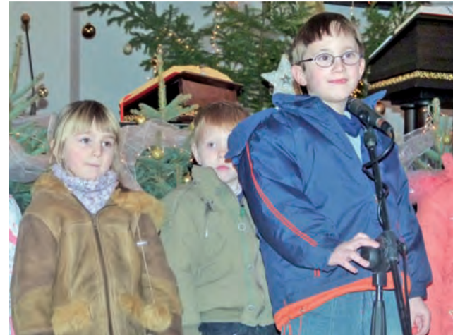
Muchomorki z Przedszkola nr 3 zaśpiewały utwór „Jest taki dzień”.