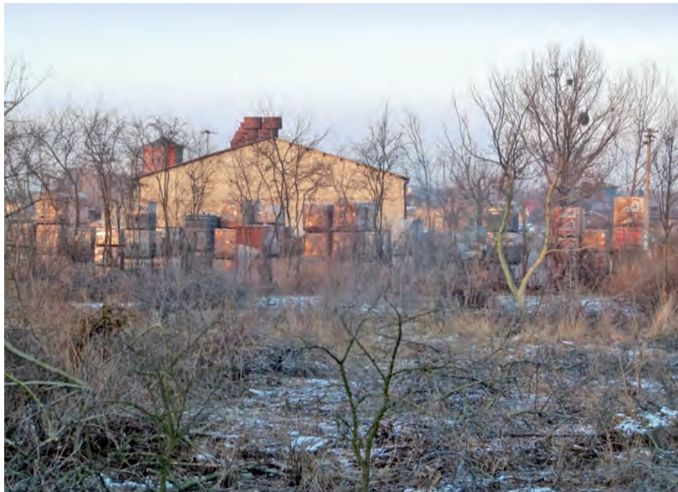
Na działce przy ul. Kolejowej 7 wkrótce powstanie skład materiałów budowlanych. W tle budynek firmy Wimax, która stała się nowym właścicielem nieruchomości.

Firma Wimax sprzedaje materiały budowlane, hydrauliczne, węgiel i nawozy. Świadczy również usługi transportowe. Obecnie posiada dwie hurtownie: w Strykowie i w Głownie.