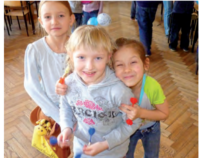
Dziewczeta pytały wychowawców o to, czy na obiad będą kotlety schabowe.

Dzieci z Korabki w czasie półkolonii, poza wspomnianymi wycieczkami do Nieborowa i Sochaczewa, brały też udział w wycieczce do Imaxu w Łodzi, w którym obejrzały film „Kot w butach” w wersji 3D. mwk