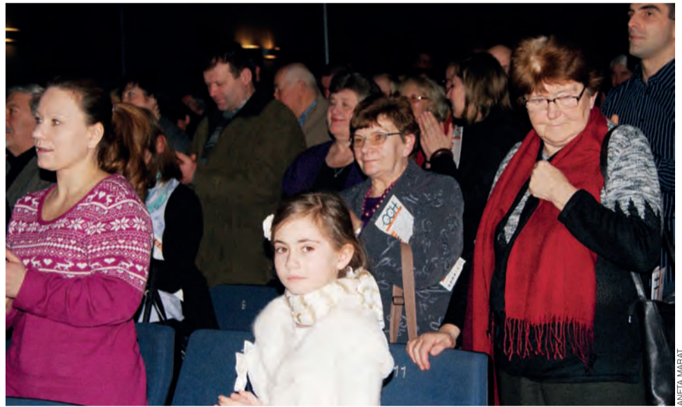
Reakcje publiczności pokazały, że koncert odniósł wielki sukces.