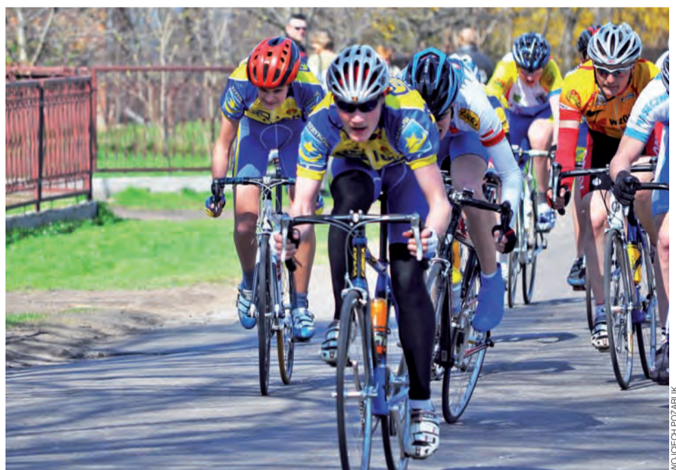
Rezerwy Zjednoczonych Stryków musiały odwołać sparing z powodu mrozów. Kibice tęsknią już za wiosną.

Myślę przede wszystkim o tym, aby jak najlepiej przygotować się do tego sezonu. Nie wiem jeszcze co mnie czeka w przyszłości.