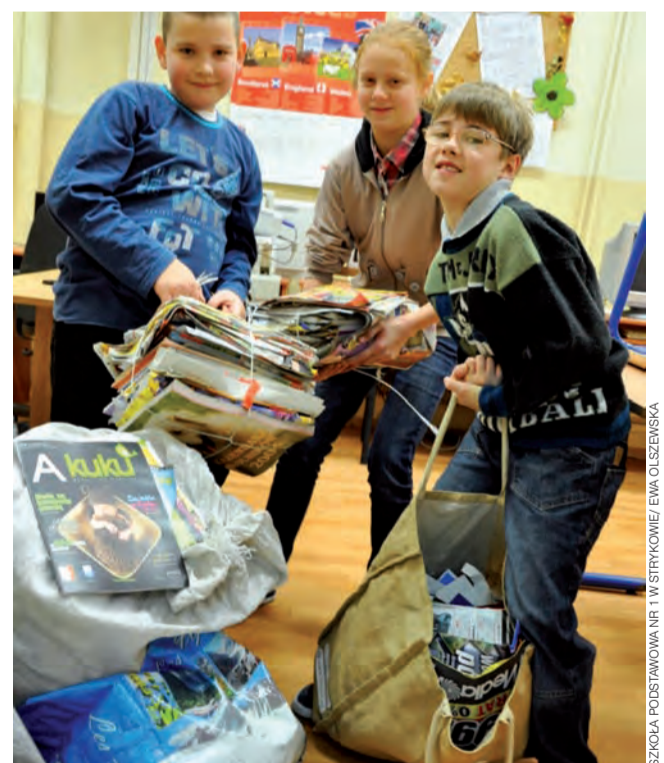
Strykowskie wolontariusze zbierali także makulaturę.