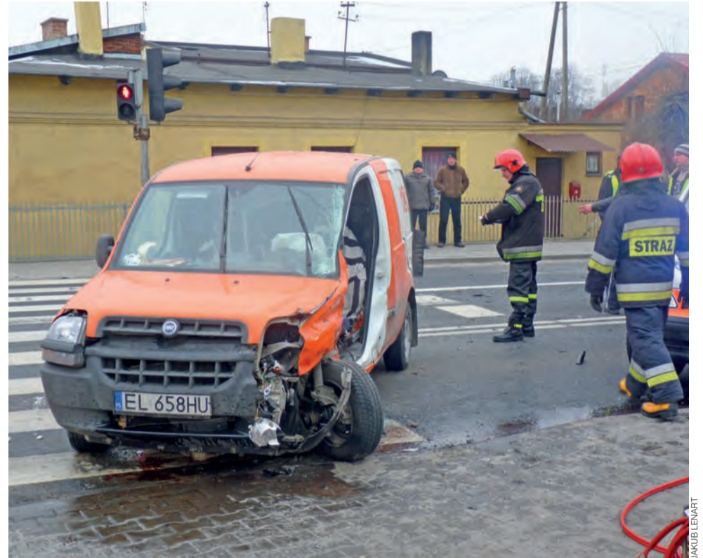
Kierowcę Fiata Doblo strażacy uwalniali przy pomocy specjalistycznego sprzętu.

O tym, kto zostanie ukarany za spowodowanie wypadku, zdecyduje jednak sąd, ponieważ ani Litwin, ani prowadzący Fiata Doblo nie przyznają się do jazdy na czerwonym świetle. kl