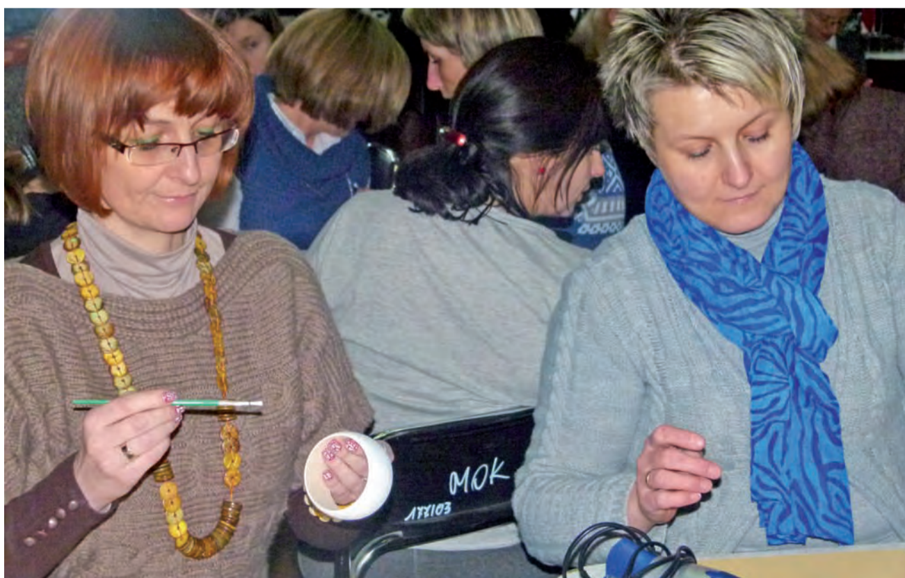
W warsztatach decoupage w MOK wzięły udział wyłącznie kobiety.