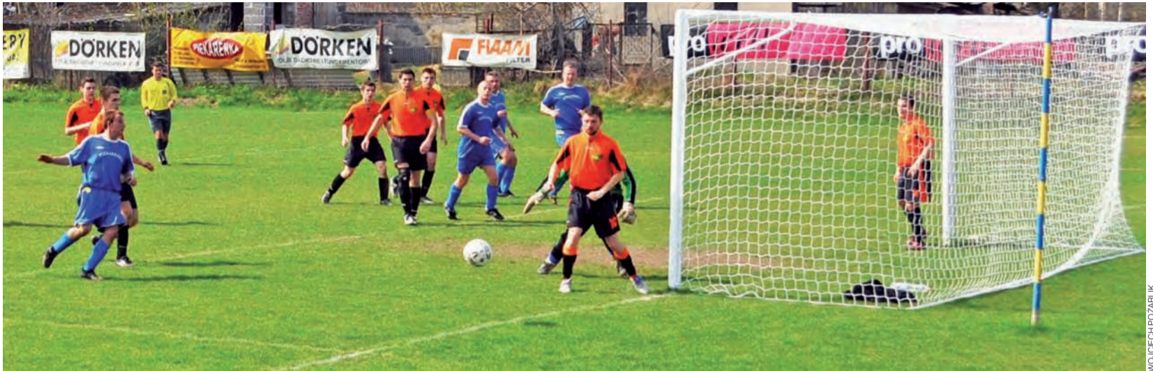
Rezerwy Zjednoczonych Stryków musiały odwołać sparing z powodu mrozów. Kibice tęsknią już za wiosną.

To jednak może być bardzo trudne, bo Zjednoczeni już co każdy weekend mają w planach sparing do rozegrania. Rezerwy Strykowa teraz przygotowują się do pojedynku z Victorią Rąbień. Trwają intensywne rozmowy na temat znalezienia sztucznego boiska. Ekipa z Rąbienia prowadzona przez byłego zawodnika Zjednoczonych