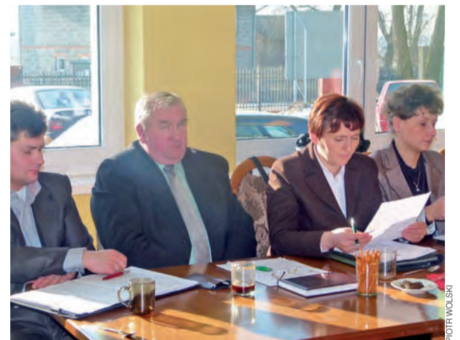
Radni gminy Głowno w czasie pierwszej sesji w tym roku uchwalili budżet na bieżący rok.

Oprócz budżetu radni jednogłośnie przegłosowali uchwałę w sprawie Wieloletniej Prognozy Finansowej Gminy Głowno na lata 2012 – 2022, którą samorządy muszą uchylać wraz z budżetem. Radni nie mieli żadnych zastrzeżeń do obydwóch uchwał. pw