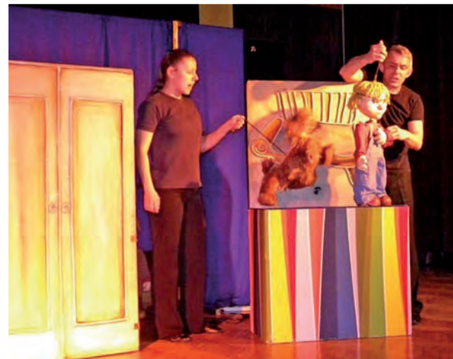
Teatr Lalek Pacuś wystawił spektakl pt. „Czarodziejskie okulary”.

Tego samego dnia odbyły się też warsztaty decoupage dla dzieci. opr. kl