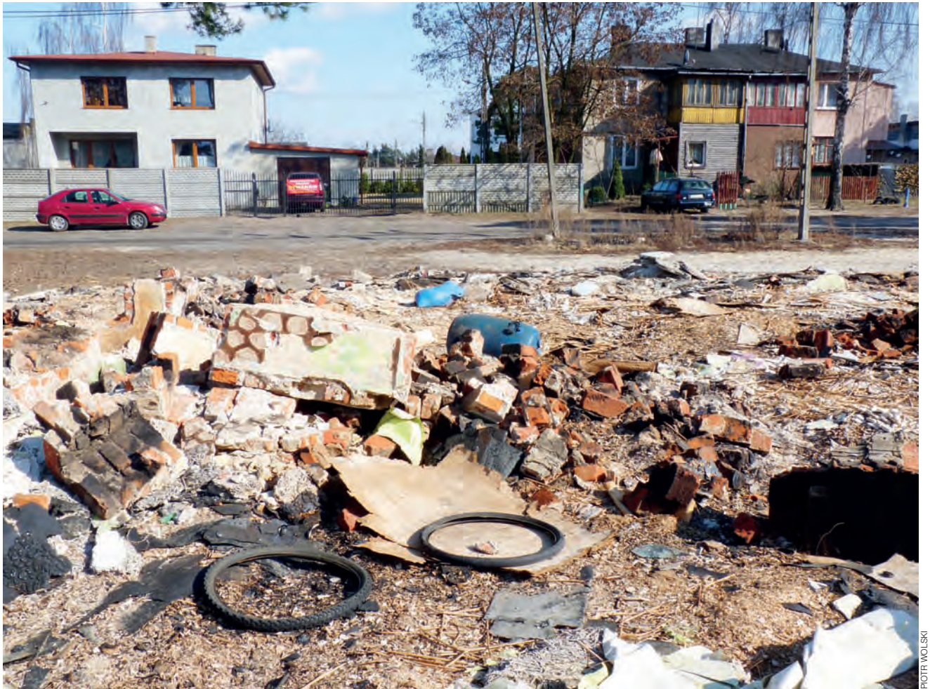
Ruiny starego budynku przy ul. Zagajnikowej 8/10 w Głownie. Miejska działka psuje krajobraz ulicy.

Pytanie tylko dlaczego MZK wcześniej nie uporządkował działki na Zagajnikowej? Zgodnie z informacją dyrektora Szremskiego było to spowodowane przyczynami formalnymi, które polegały na oczekiwaniu na pozwolenie na rozbiórkę. pw