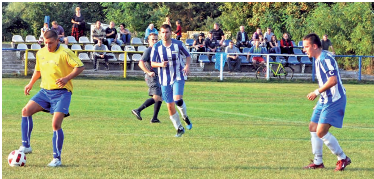
W pojedynku głowieńskiego V-ligowca z aspirującym do awansu do klasy okręgowej zespołem Zjednoczonych Stryków lepsi okazali się gracze Stali Głowno, którzy pokonali strykowian 2:0.

W ostatnim sparingu przed rundą wiosenną głównianie odnieśli zwycięstwo, ale ze stylu gry nie mogą być zadowoleni.