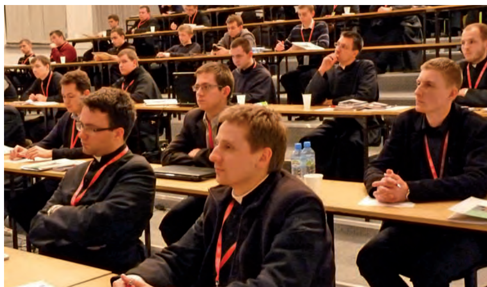
Redaktorzy gazetek seminaryjnych spotykają się od 4 lat.