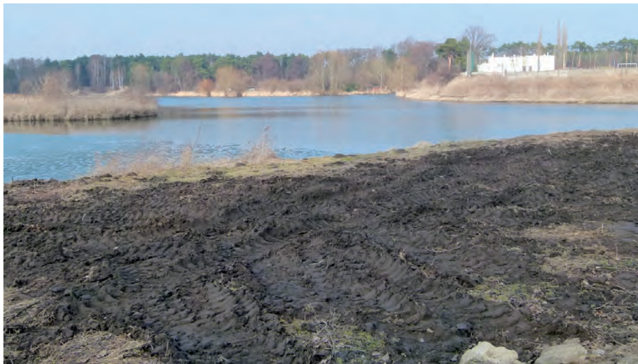
Po wycięciu zarośli widok na zalew od strony ul. Solskiego jest dużo lepszy, a dojście do brzegu łatwiejsze.

– Uznaliśmy, że to miejsce jest tak ładne, że szkoda byłoby go nie wykorzystać – tłumaczył wiceburmistrz. – Teraz mieszkańcy będą mogli w lepszych warunkach posiedzieć nad wodą. Jak powiedział Wieściom w rozmowie telefonicznej wiceburmistrz Urbanik, w najbliższym czasie będą podejmowane inne działania związane z porządkowaniem miasta po okresie zimowym. kl