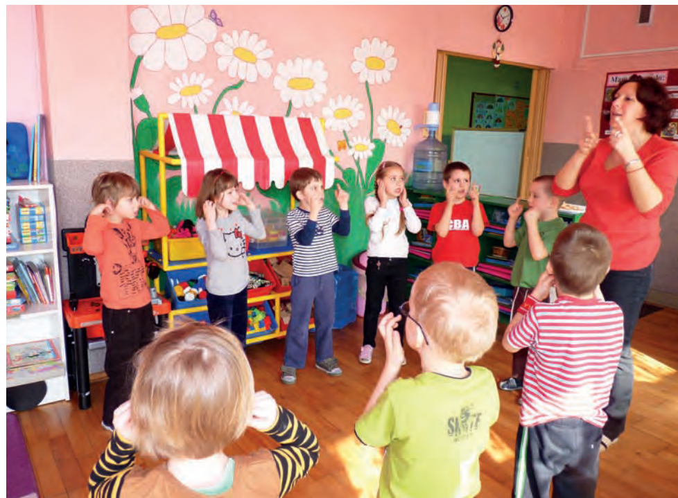
W czasie dnia otwartego w grupach trwały normalne zajęcia, do których mogli dołączyć goście. Na zdjęciu zabawa z pokazywaniem części ciała w grupie Stokrotki.