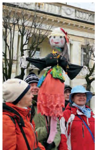
Łowiccy turyści w czasie wiosennego rajdu w 2011 roku.

Klasa humanistyczna z elementami dziennikarstwa ma powstać od 1 września tego roku w Liceum Ogólnokształcącym w Zespole Szkół Licealnych w Zdunach. Na zajęciach uczniowie poznają tajniki warsztatu dziennikarskiego, zasady redagowania tekstów, poznają najpopularniejsze gatunki dziennikarskie i prawo prasowe. Nauka w klasie o tym profilu ma stanowić przygotowanie do studiów na kierunkach: dziennikarstwo i komunikacja społeczna, politologia, psychologia, socjologia, filologia polska i stosunki międzynarodowe. W ramach nauki mają odbywać się także wycieczki programowe do lokalnych i ogólnopolskich mediów. Aktualnie w ZSL w Zdunach można uczyć się w liceach ogólnokształcących o profilach: kultura europejska, turystyczno-lingwistycznym oraz obronnym i matematyczno-przyrodniczym. Istnieje tu także Uzupełniające Liceum Ogólnokształcące na podbudowie Zasadniczej Szkoły Zawodowej. td