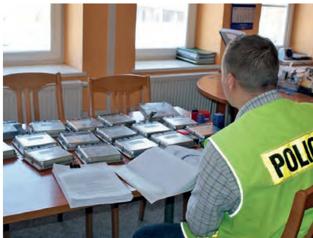
Policjanci zabezpieczyli sprzęt, który mógł służyć legalizowaniu kradzionych samochodów.

W wyniku czynności prowadzonych przez KPP w Brzezinach dzień po tym wydarzeniu, czyli 14 marca, funkcjonariusze zatrzymali kolejne 2 osoby – 48-letniego mieszkańca powiatu brzezińskiego i 29-letniego mieszkańca powiatu zgierskiego, którzy wspólnie i w porozumieniu, między 1 a 31 stycznia 2012 roku, dokonali licznych kradzieży na szkodę jednej z firm budujących odcinek autostrady A2 pomiędzy Dmosinem a Strykowem. Ich łupem padło: 400 litrów oleju napędowego (wartość 2.200 zł), 50 sztuk metalowych słupków ogrodzeniowych (1.000 zł) oraz 100 mb siatki ogrodzeniowej (2.000 zł). Skradzione słupki i siatkę policjanci znaleźli w trakcie przeszukania u 48-latka. Mężczyzna był recydywistą. W przeszłości był już notowany za kradzież, spowodowanie wypadku komunikacyjnego ze skutkiem śmiertelnym oraz fałszowanie dokumentów. Jego 29-letni kompan miał z kolei na koncie jazdę rowerem w stanie nietrzeźwości. Całej trójce 15 marca postawiono zarzuty dotyczące popełnionych przez nich kradzieży opr. kl