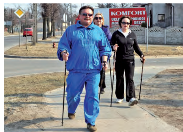
Coraz więcej mieszkańców Strykowa dba o swoje zdrowie. Żeby się o tym przekonać, wystarczy wyjść na ulicę.