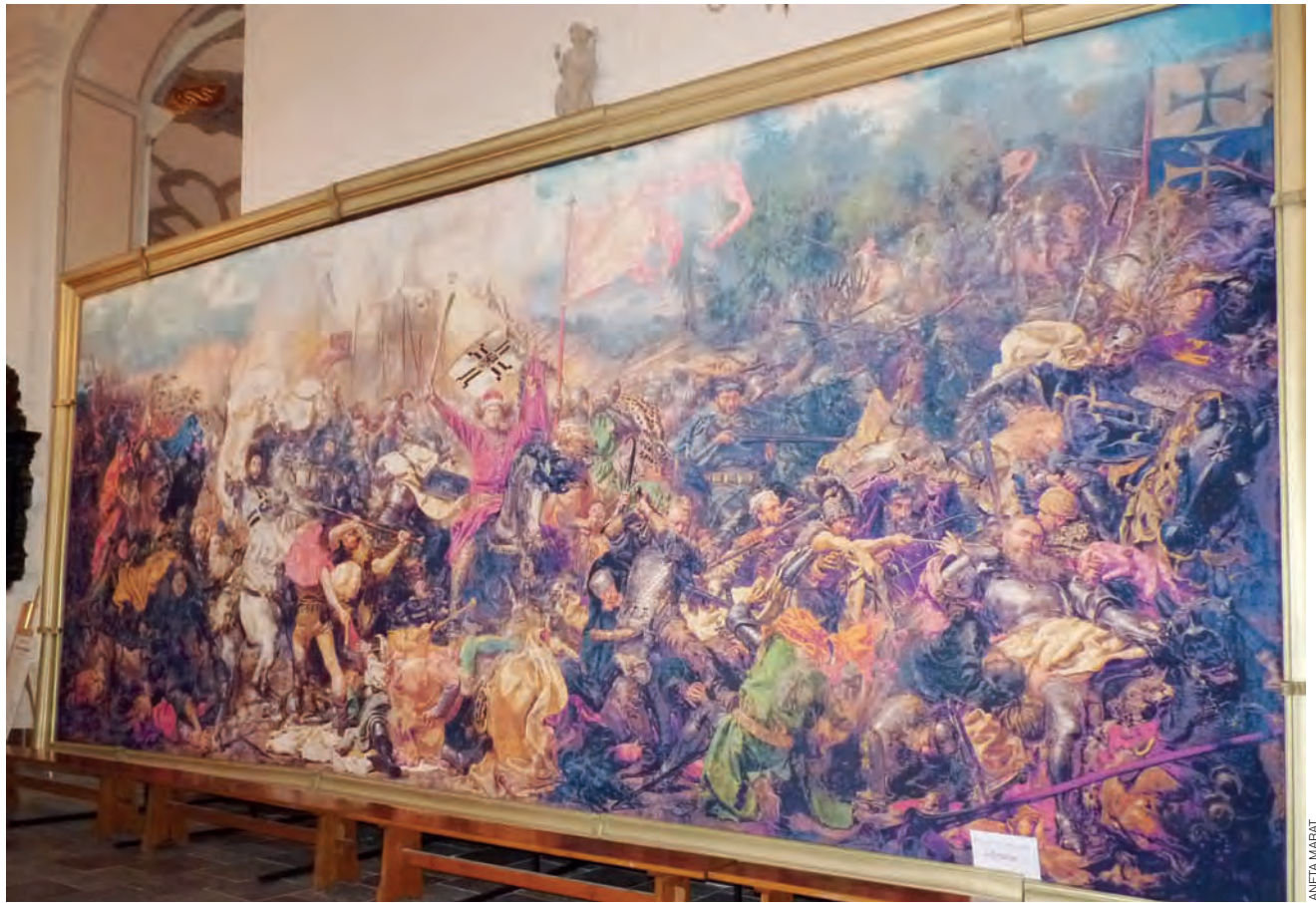
Kopia obrazu Bitwy pod Grunwaldem zadziwia nie tylko wielkością, ale także bogatą kolorystyką.