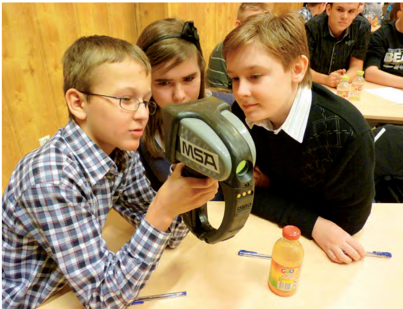
Uczestnicy turnieju w Strykowie, uczniowie SP1 z zaciekawieniem oglądają kamerę termowizyjną, którą często posługują się strażacy.

W środę, 7 marca w Mąkolicach odbyły się eliminacje turniejowe dla rejonu miasta i gminy Głowno, o których piszemy poniżej.