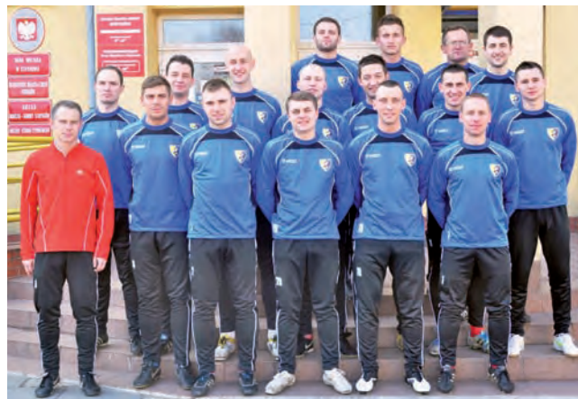
Piłkarze Zjednoczonych Stryków są już gotowi do walki w rundzie wiosennej IV ligi.