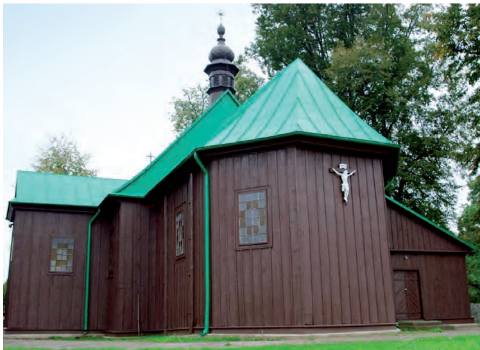
Drewniany kościół w Kołacinku poddany zostanie kapitalnemu remontowi.

Zdaniem proboszcza, najpilniejszą sprawą, którą trzeba będzie wykonać jako priorytet, będzie naprawa dachu. Remont przydałoby się wyko-