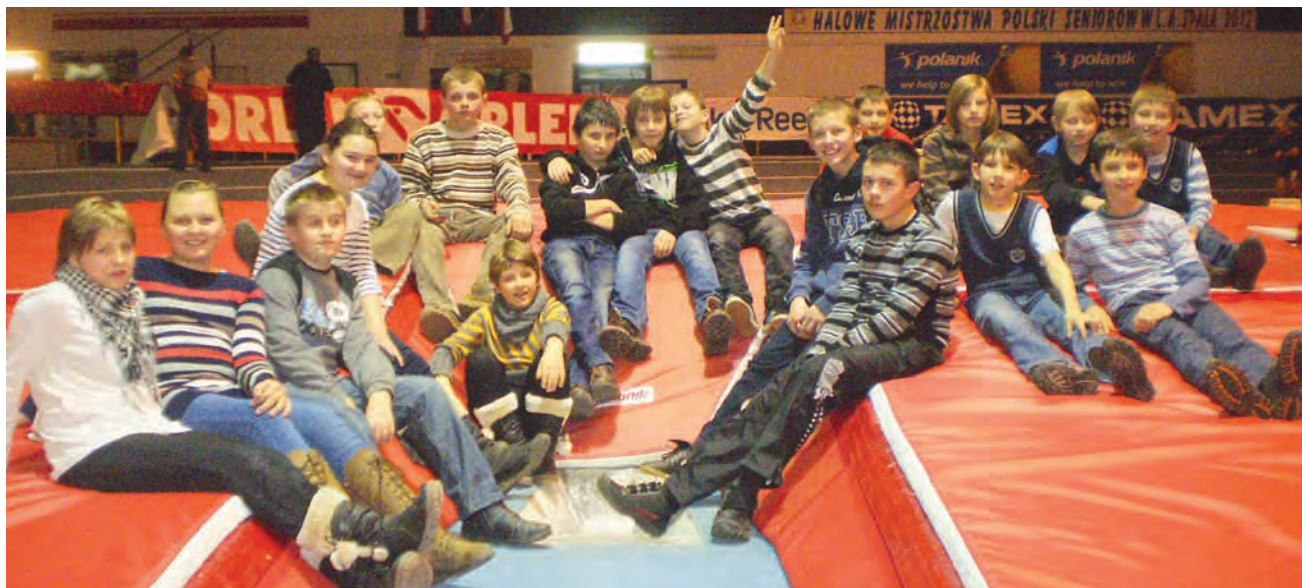
Centrum Przygotowań Olimpijskich w Spały zwiedzili uczniowie z Koła Olimpijczyka w Łyszkowicach.

Uczestnicy wycieczki z Łyszkowic mieli możliwość przez