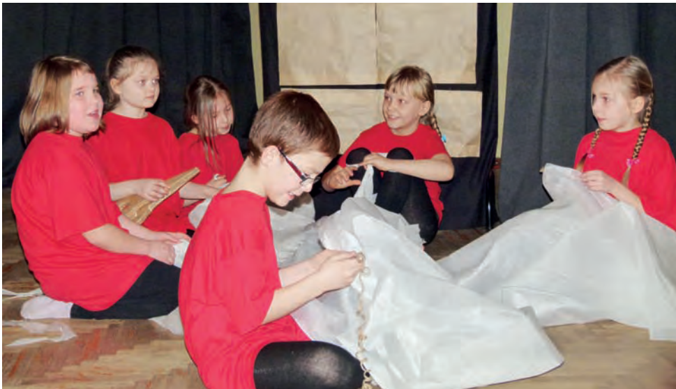
W przedstawieniu „Baśnik” młodsza część grupy teatralnej szyła suknie i welony dla zakochanych panien. Młodzi artyści nie byli stremowani, choć połowy obsady nie było na scenie z powodu... choroby