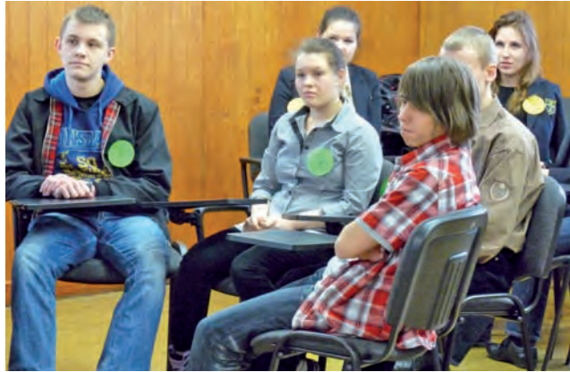
Drużynę nr 7 stanowili uczniowie Społecznego Liceum Ogólnokształcącego w Skierniewicach. Za nimi siedzą uczniowie pijarskiego LO.

– Chciałyśmy połączyć zabawę z poszerzeniem wiedzy na temat WB i USA – mówiła w rozmowie z NŁ współorganizatorka konkursu i wykładowca kolegium w Łowiczu Elżbieta Laskowska-Przybył. – Uczniowie mogą czerpać swoją wiedzę