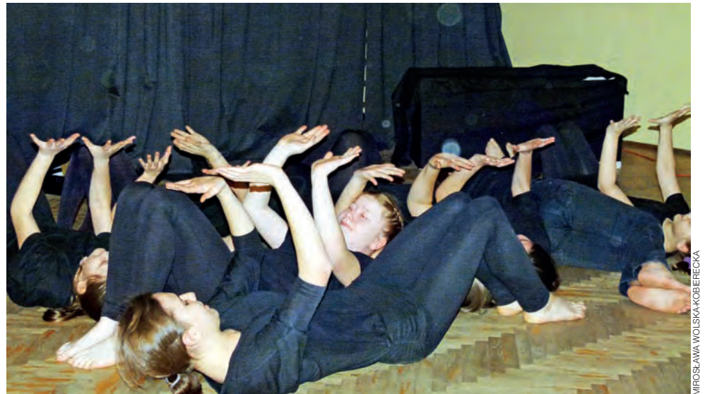
„Opowieść przedwigilijna” rozpoczyna się od etudy, w której zabawki na choinkę postanawiają opuścić ciasne pudełko na długo przed świętami.

Łowicz | Zespół Szkół przy ul. Grunwaldzkiej