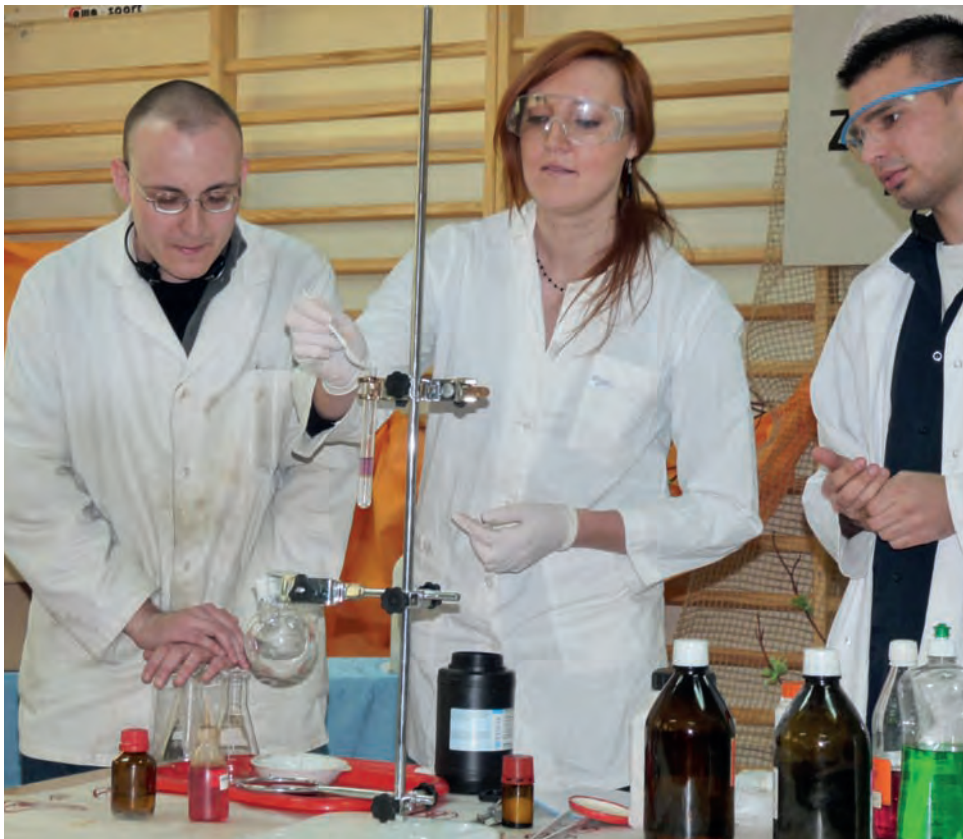
Studenci Uniwersytetu Łódzkiego pokazali gimnazjalistom doświadczenia chemiczne.

Finał konkursu odbył się 16 marca w łowickiej szkole pijarskiej. Brali w nim udział