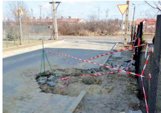
Wykop na ul. Pięknej w Głownie. Miejski Zakład Wodociągów i Kanalizacji w Głownie uzupełni brakujący fragment kostki brukowej, kiedy ziemia rozmarznie na 1,5 m głębokości.

Wodociągów i Kanalizacji, powiedział naszej redakcji, że po usunięciu awarii wodociąg został zasypany ziemią. – Nie układaliśmy bruku w okresie mrozów, ponieważ byłoby to zbędna praca. Zamrożonej ziemi nie dałoby się odpowiednio zageścić i roztopi spowodowałyby zapadnięcie się nawierzchni – wyjaśnił wiceprezes Frach i potwierdził, że to już nie pierwszy sygnał o nieusuniętych skutkach awarii na ul. Pięknej. Zapowiedział on, że w związku z ociepleniem ziemia powinna być już rozmarznięta na potrzebnej do wykonania nawierzchni głębokości – 1,5 metra i z pewnością w tym tygodniu wyrwa zostanie usunięta. pw