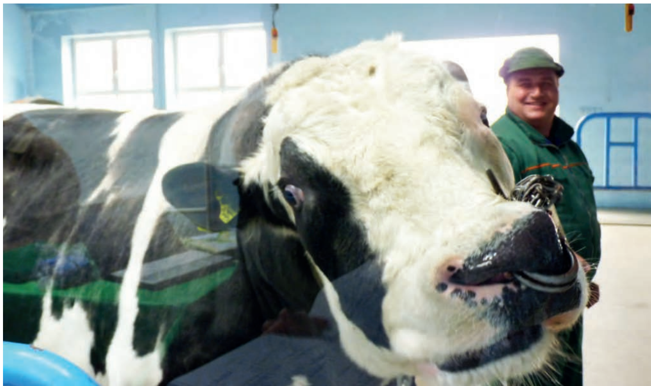
Jeden z prezentowanych buhajów w czasie pokazu.

Hodowcy zobaczyli, że buhajami opiekuje się wyznaczona do tego załoga. Osoby postronne nie mają prawa się do nich zbliżać, dlatego też goście oglądali i zwierzęta przez szybę. Wielu rolników zobaczyło buhaje, od których pochodziło nasienie dla potrzeb ich hodowli.