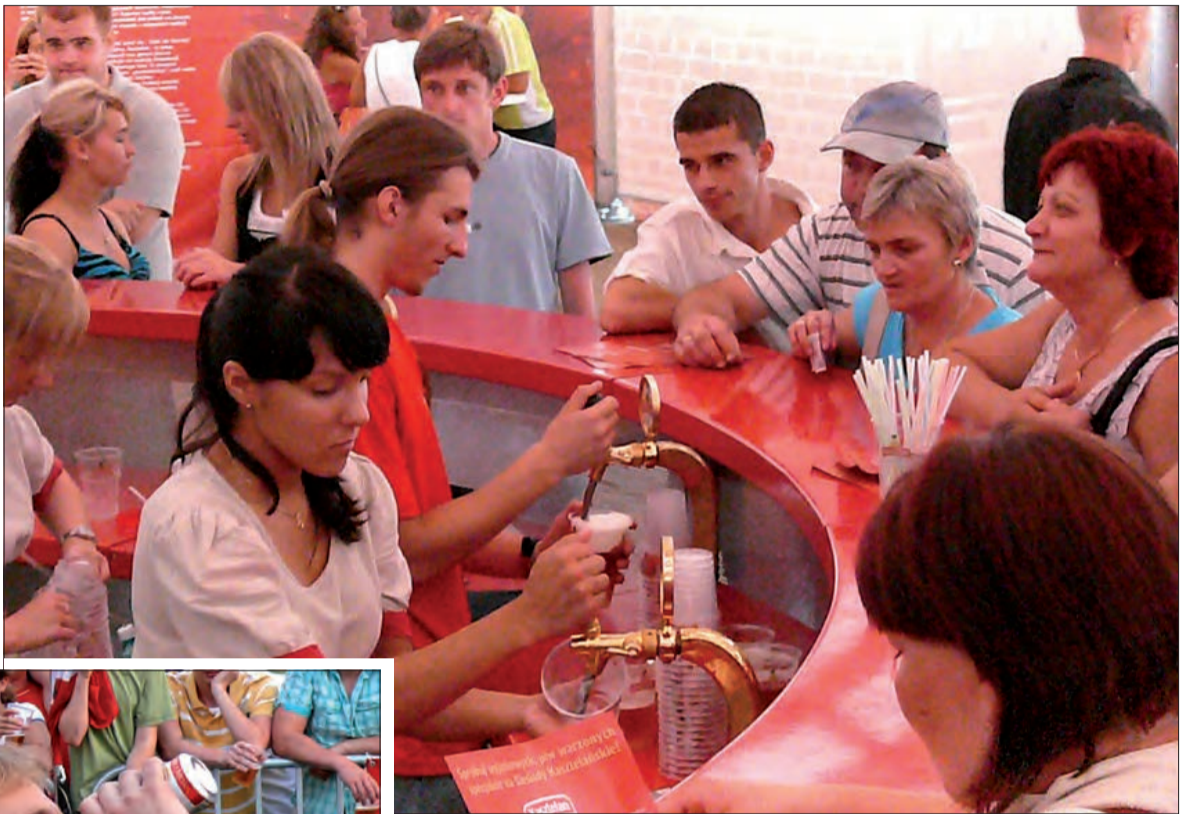
W wielkim namiocie można było spróbować specjalnie ważonych na biesiadę niepasteryzowanych piw.

Dla osób, które chciały wypić piwo pod dachem, przygotowano wielki zadaszony namiot, pod którym mogło zasiąść przy