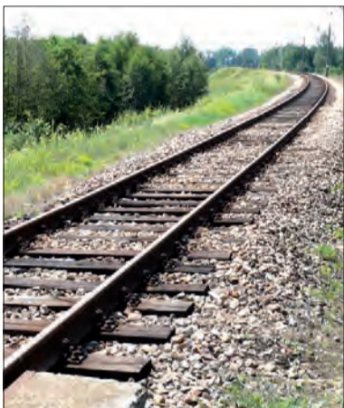
Wszystkie drewniane podkłady będą wymienione na betonowe.

Na odcinku od stacji w Belchowie do podstacji Skierniewice Park (kilkaset me-