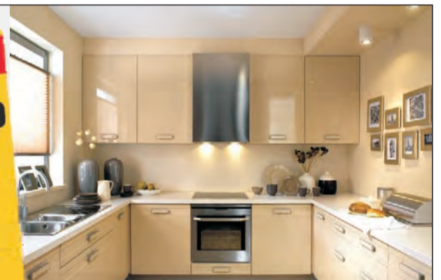
kuchnia TWIN, kolor: beż połysk, materiał: płyta MDF; NOWOŚĆ w ofercie promocyjnej