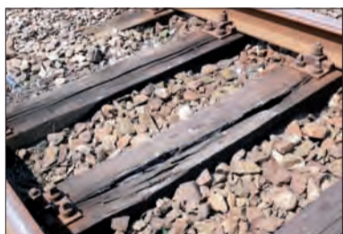
Podkłady pod torami łącznicy z Bednar do Placencji są w fatalnym stanie.

Zakres remontów był kilkakrotnie zmieniany. Pierwotne założenia sprzed kilku lat były takie, że miała być to inwestycja na bardzo dużą skalę. W grę wchodziła nie tylko całkowita wymiana podkładów i torów, ale też wymiana trakcji elektrycznej, całej automatyki kolejowej na tym odcinku, budowa nowej instalacji odwodnieniowej, profilowanie skarp i nasypów itd.