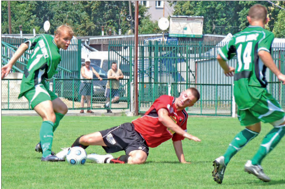
W ostatnim meczu kontrolnym przed niedzielą ligową inauguracją z Sokółem łowicki Pelikan jedynie zremisował z trzecioligową Pogonią-Ekologiem 1:1.