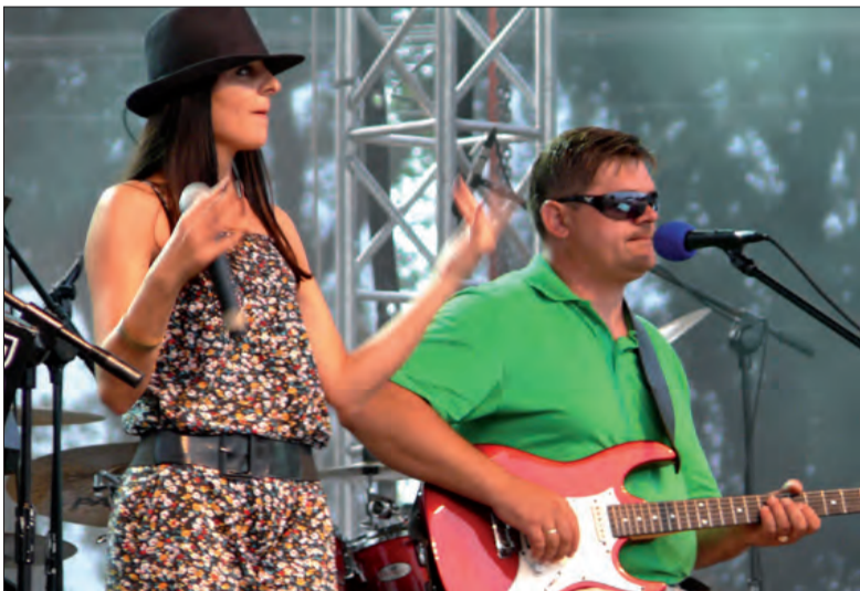
Na scenie Biesiady publiczność nie zobaczyła Dody, tylko Happy Band.

stolikach blisko 500 osób. Tam podawano piwo w wielkich, 0,8-litrowych kufkach. Ci, którzy chcieli widzieć i słyszeć lepiej, co dzieje się na scenie, mogli wybrać jedno z miejsc pod parasolami. Osoby lubiące chmielowy trunek w postaci niepasteryzowanej mieli szansę spróbować kilku ich rodzajów przygotowanych specjalnie na biesiadę. Panowie i panie mieli też szansę zmierzyć się w różnych konkurencjach