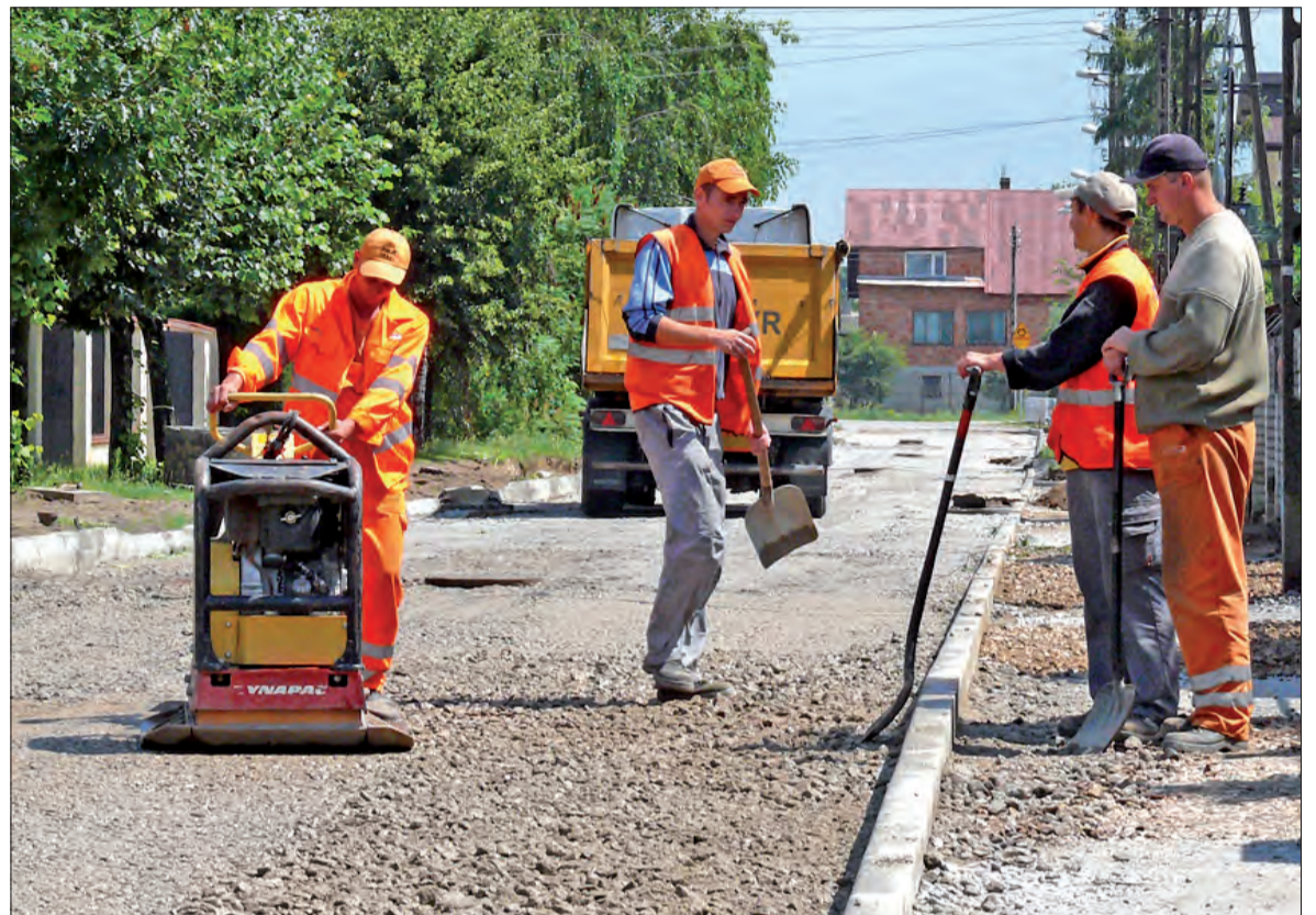
PRZYBYWA KOSTKI NA GÓRKACH. Na ulicy Wieniawskiego na osiedlu Górki w Łowiczu, firma Trakt z Kutna wykonała już podbudowę pod nawierzchnię z betonowej kostki i rozpoczęła jej układanie. Podobne prace będą przeprowadzone na położonej obok ulicy Piątkowskiej. Koszt zlecenia udzielonego firmie przez ratusz to 854 tys. zł, realizacja tej inwestycji ma się zakończyć do 20 października.