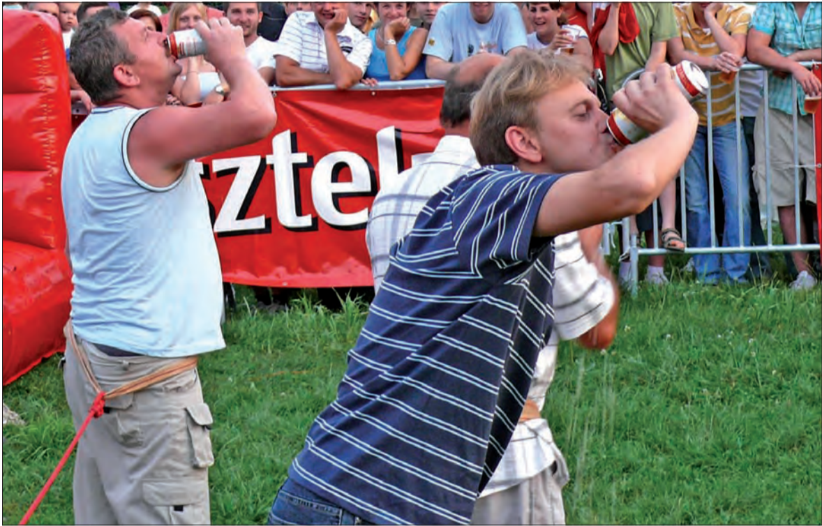
Piwo lało się do gardeł szerokim strumieniem, panowie dzielnie walczyli w kasztelańskich konkurencjach.