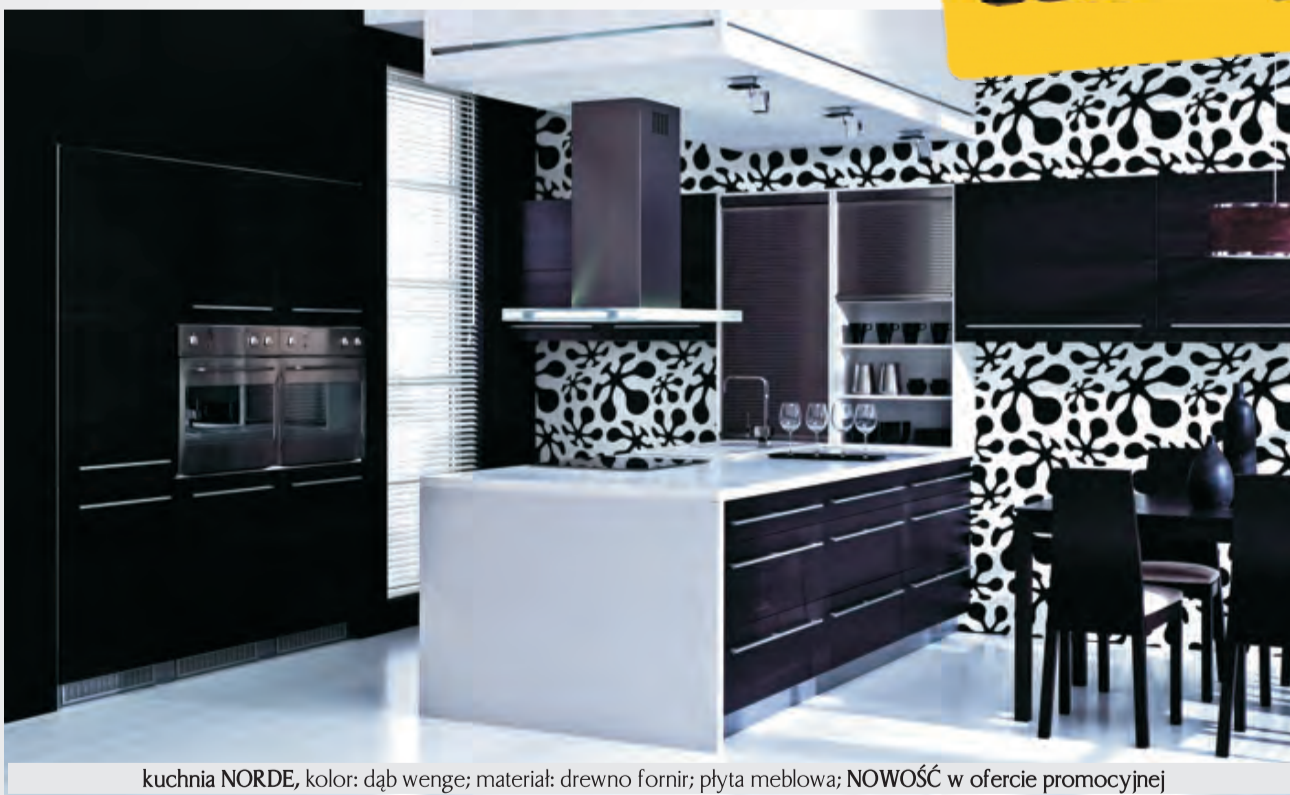
kuchnia NORDE, kolor: dąb wenge; materiał: drewno fornir; płyta meblowa; NOWOŚĆ w ofercie promocyjnej