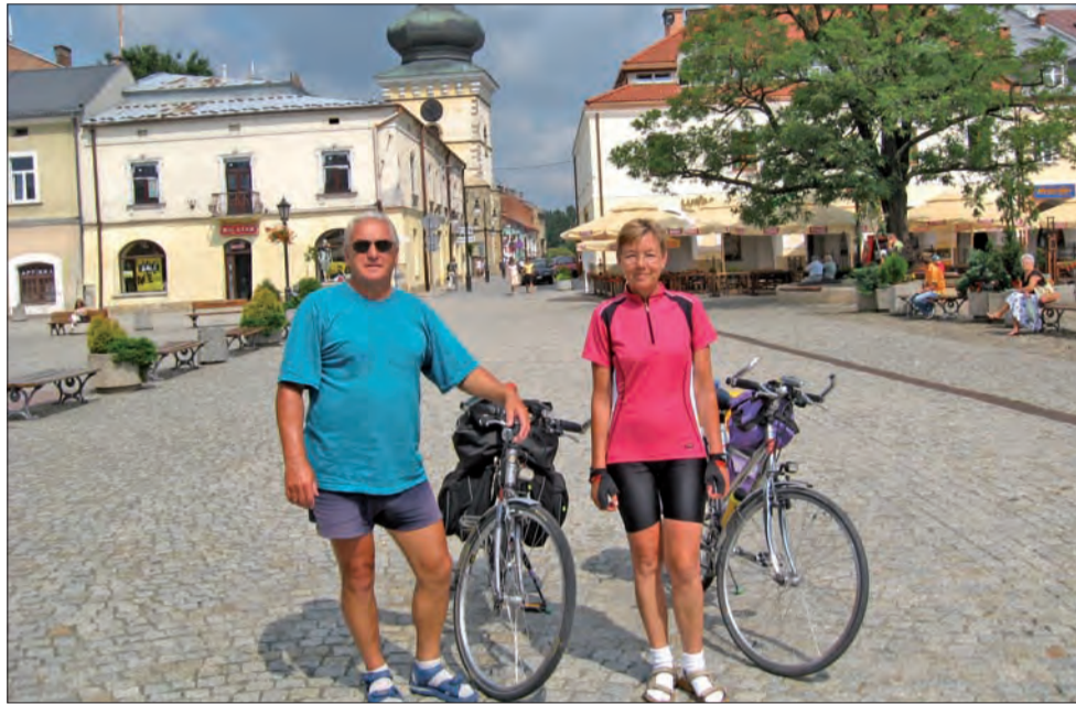
Wnukowie w Krośnicach, mieście znanym z huty szkła i legendy o tragicznej historii Anny i Stanisława Oświęcimów, którzy pomimo pokrewieństwa mieli czynić starania o zgodę papieża na ich ślub.

wych schronisk, które zwykle czynne są tylko w sezonie wakacyjnym. Udało im się jednak opracować trasę wycieczki tak, aby skorzystać z tych, które działają całorocznie.