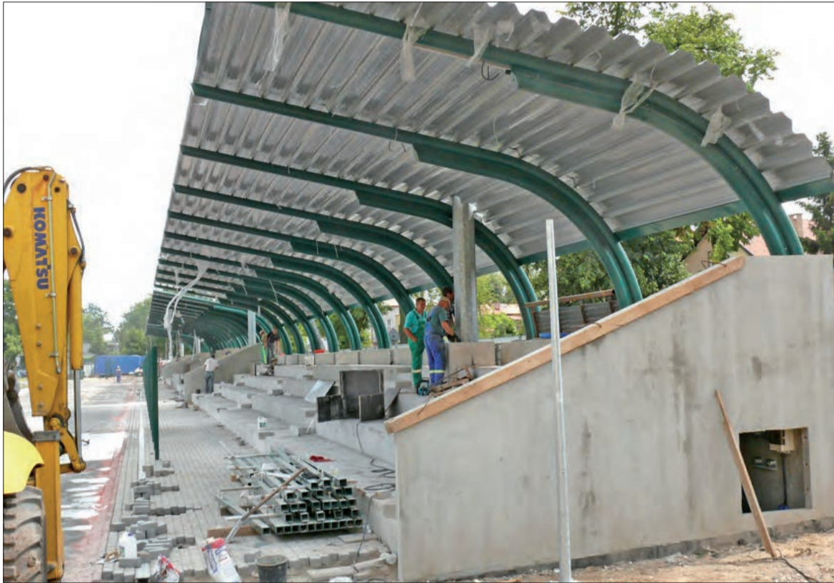
Na trybunach montowane jest obecnie zadaszanie, wokół jest układana betonowa kostka.

Modernizacja całego stadionu OSiR prowadzona etapami już trzeci rok, kosztowała w sumie już ponad 8 mln zł. Ratuszowi, który jest inwestorem i ponosi koszty, co roku