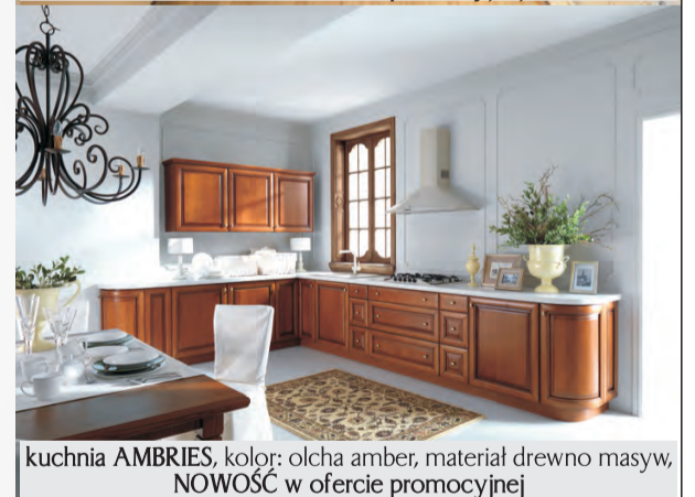
kuchnia AMBRIES, kolor: olcha amber, materiał: drewno masyw; NOWOŚĆ w ofercie promocyjnej