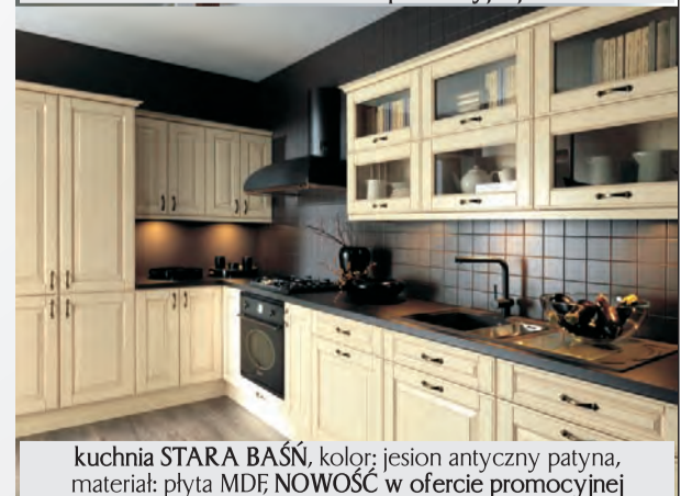
kuchnia STARA BAŚŃ, kolor: jesion antyczny patyna, materiał: płyta MDF; NOWOŚĆ w ofercie promocyjnej