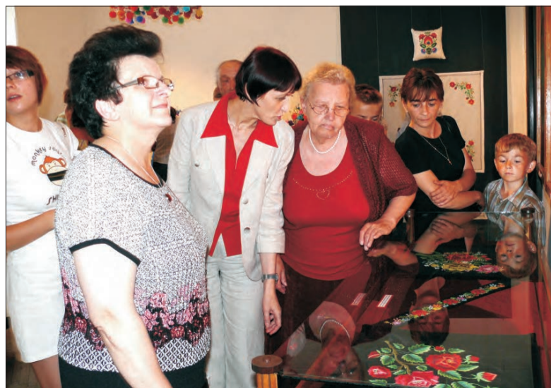
Sami uczestnicy konkursu oraz goście wernisażu podziwiali nagrodzone i wyróżnione prace.