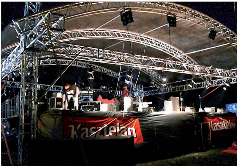
Banery zdjęto, dach sceny opuszczono, Doda nie wystąpiła. Pogoda nie pozwoliła, by Biesiada Kasztelańska trwała do północy.

Na odbywającej się w sobotę Biesiadzie Kasztelańskiej około godz. 19.00 było cicho i spokojnie. Tłum ludzi przechadzał się pod sceną, na której od czasu do cza-