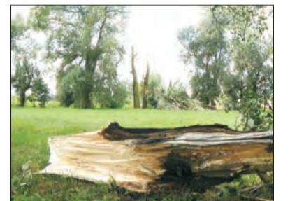
Skutki wichury widać było długo.

Powalone konary drzew lub całe drzewa najczęściej blokowały drogi gminne, powiatowe czy krajowe. 18 lipca strażacy z PSP w Łowiczu oraz druhowie z miejscowych OSP usuwali powalone drzewa w Marywilu, Łyszkowicach, Nieborowie, Niedźwiadzie, Chaśnie, Otolicach, Strugenicach, Piotrowicach, Kocierzewie oraz