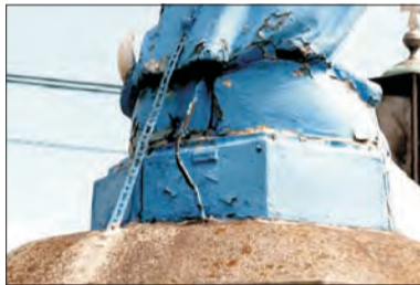
Figura Matki Bożej jest dość przewoźniczo przymocowana do cokołu.

Firma, która realizuje obecnie przebudowę „dwójki”, poszukuje firmy, która zajęłaby się w należyty sposób przeniesieniem kapliczki. Zalewski podkreśla, że intencją Generalnej Dyrekcji, jak i wykonawcy prac jest, by wszystko odbyło się należycie. Kapliczka zostanie dokładnie sprawdzona pod względem konstrukcyjnym. Jeśli będzie taka możliwość, to zostanie ona w całości przetransportowana w nowe miejsce. Jeśli nie - będzie rozebrana. Generalna Dyrekcja konsultowała z proboszczem para-