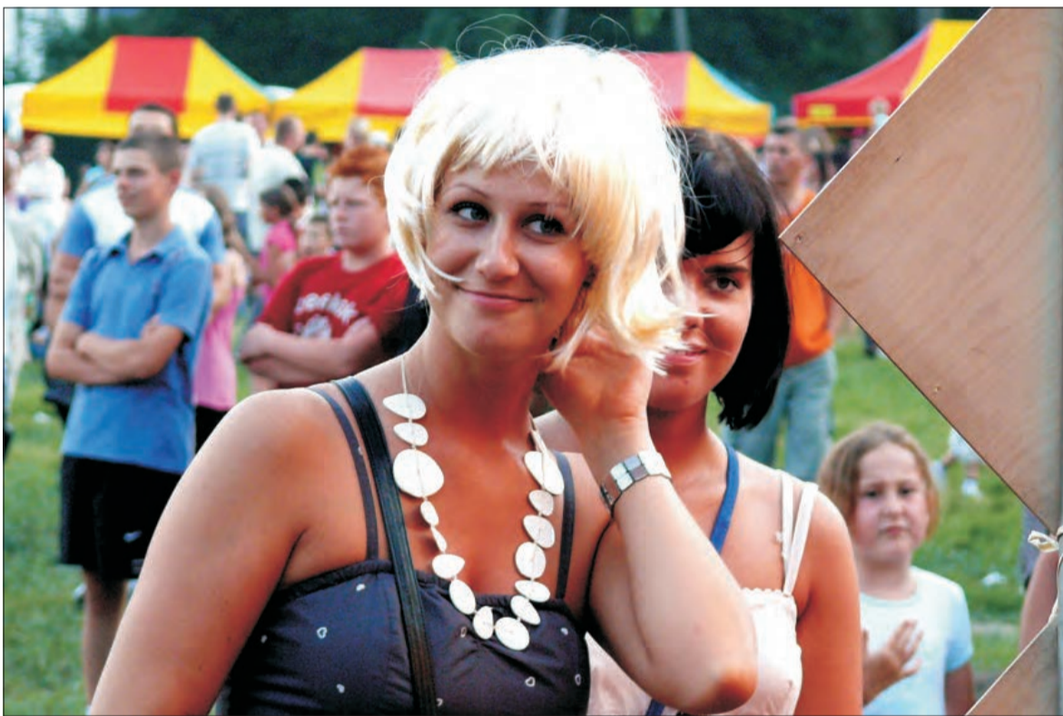
Lepiej w takich, czy w naturalnych? Peruki, które można było kupić na jednym z licznych stoisk towarzyszących sobotniej Biesiadzie Kasztelańskiej w Łowiczu, cieszyły się ogromnym wzięciem. O Biesiadzie - w tym roku niedokończonej z powodu burzy - czytaj na str. 17.

Sprawa była rozpatrzona w trybie przyspieszonym, wyrokiem Sądu Rejonowego w Łowiczu kierowca został skazany na 2 lata i 2 miesiące kary pozbawienia wolności w zawieszaniu na okres 5 lat, zakaz prowadzenia pojazdów mechanicznych na okres 7 lat, grzywnę w wysokości 3 tys. zł oraz nawiązkę w wysokości 500 zł na rzecz Stowarzyszenia Ofiar Wypadków. (tb)