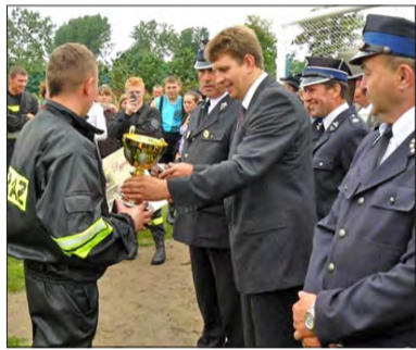
Puchar za zajęcie I miejsca w grupie A przypadł druhom z OSP Wicie.

Pogoda nie była jednak jedyną przeszkodą, aby przeprowadzić je, we wszyst-