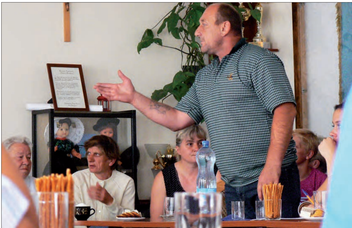
Mieszkańcy z budynku przy Warszawskiej 138 twierdzą podczas obrad sesji rady gminy, że nie opuszczą budynku.

Wizyta mieszkańców na sesji nie przyniosła oczekiwanego przez nich rezultatu. Na tej samej sesji bowiem radni jednogłośnie podjęli wniosek, który upoważnia wójta do podjęcia kroków w celu remontu i rozbudowy wspomnianego budynku w Osmolinie. - Potem tam wszystkich z budynku przy Warszawskiej, oczywiście, którzy chcą, przenosimy, a ten budynek idzie do wyburzenia. W centrum nie ma miejsca