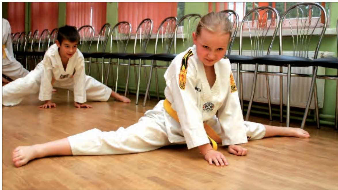
Najmłodszy zawodnik Dragona mają 9 lat.