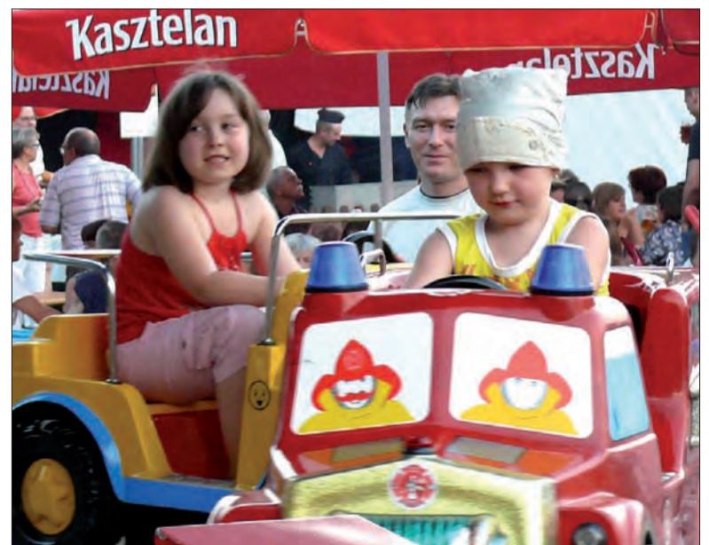
Na dzieci czekało wesołe miasteczko, karuzele, dmuchane zamki i zjeżdżalnie.