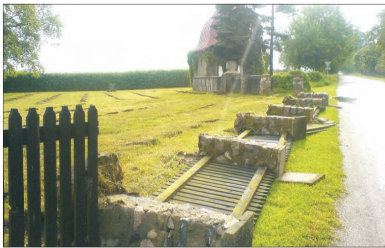
Zniszczone ogrodzenie cmentarza wojennego w Bolimowskiej Wsi.

N ie dojechał do kresu swej podróży kierowca Fiata 126 p z Piotrkówka w gminie Słubice. Jego samochód zapalił się 18 lipca o godzinie 12.30 na drodze powiatowej w Wituszy. Prawdopodobną przyczyną zapalenia się auta była awaria układu zapłonowego. Maluch splonął całkowicie. Straty oszacowano na 500 zł. (eb)