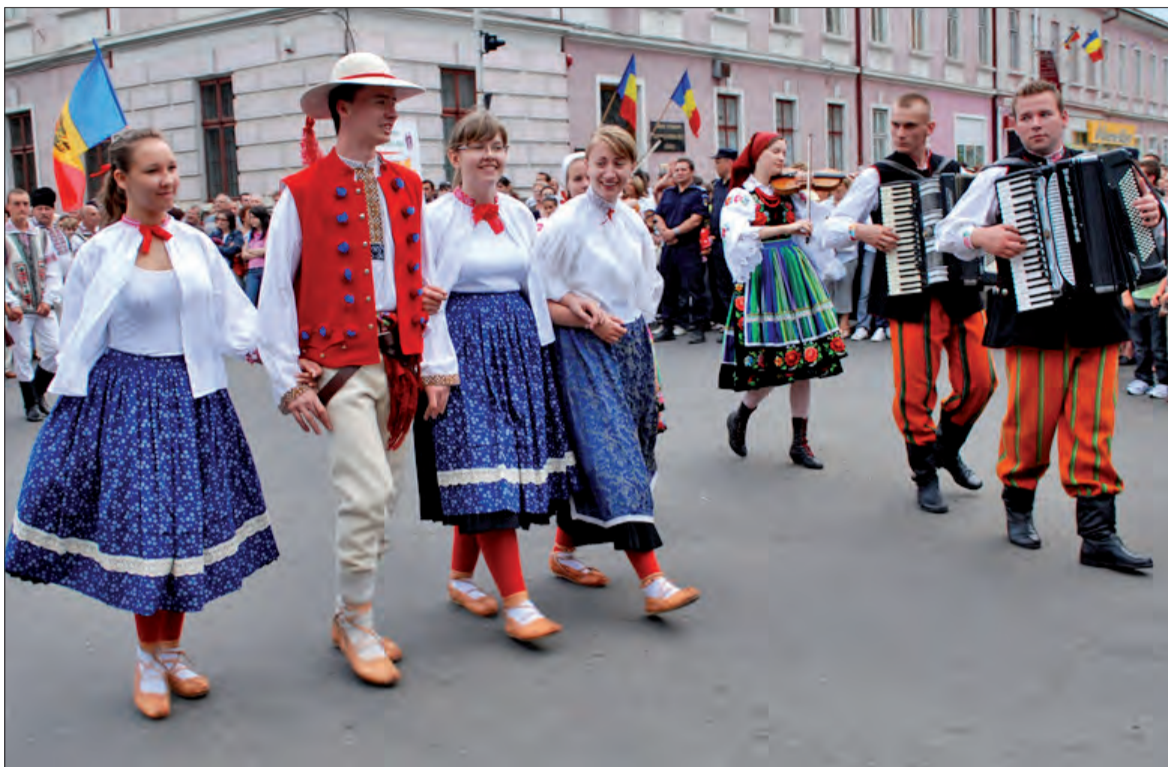
Oprócz tańców łowickich, Koderki zaprezentowały również tańce popularne w Beskidzie Żywieckim. Na zdjęciu widoczni łowicki tancerze w żywieckich strojach podczas parady ulicami miasta.