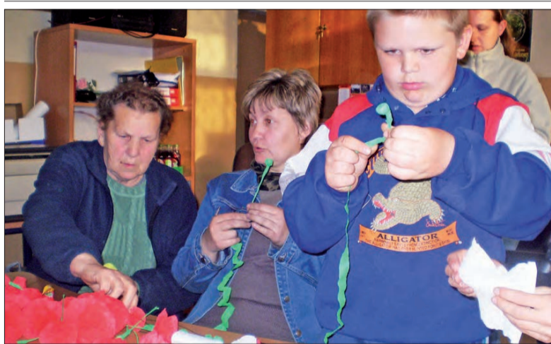
Starsi i młodzi uczyli się wykonywania kwiatów z bibuły.