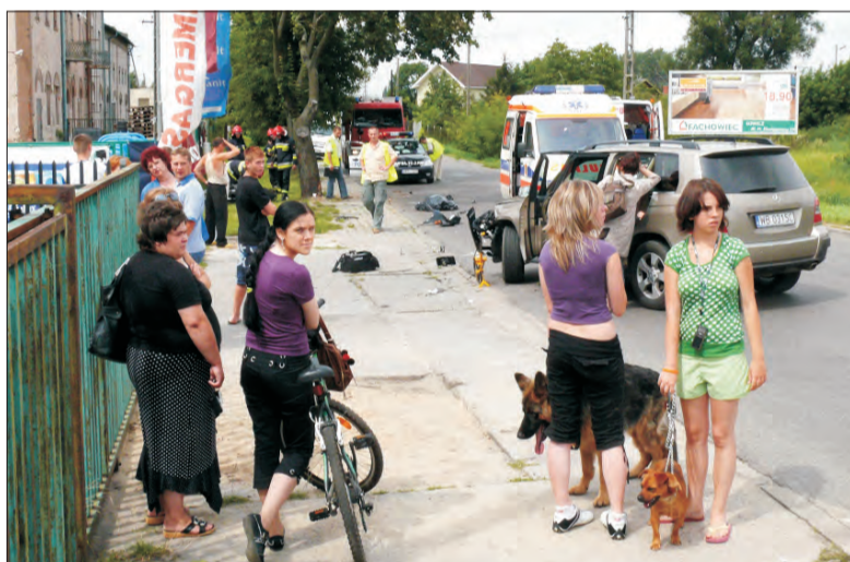
Tragiczny wypadek na ulicy Klickiego przy dawnej paszarni. Śmierć poniósł w nim 33-letni motocyklista.