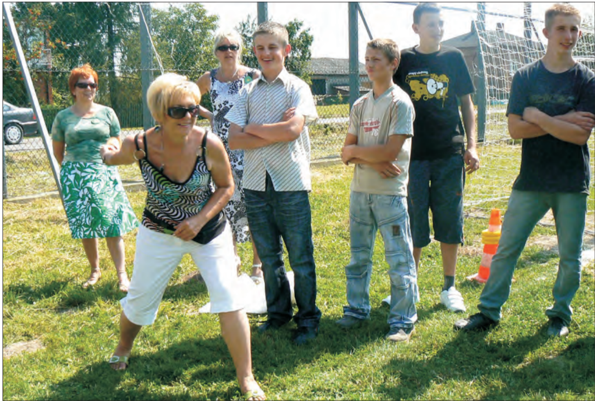
Początkowo panie wstydziły się wziąć udział w rzucaniu wałkiem, dzięki zachętom organizatora ostatecznie wystąpiło ich kilkanaście.

kultury fizycznej w środowisku wiejskim. Piknik rozpoczął się o godz. 10 mszą świętą w kościele w Lwówku odprawioną w intencji miejscowego klubu sportowego. Przed południem rozpoczął się I Międzypowiatowy Turniej o Puchar Lwówka. Puchar pozostał we Lwówku. Wywalczyli go Old Boye Lwówianki, którzy wygrali z Unią Czern-