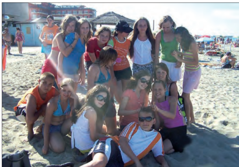
Młodzież z Łowicza na pierwszym turnusie wakacji w Krynicy Morskiej.