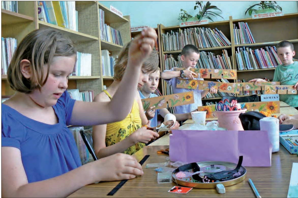
Każdy znajdzie tu coś dla siebie. Można haftować koralikami, wycinać i składać origami lub dekorować kwiatami drewniane powierzchnie, w tym biblioteczne regały.

Podczas wakacji w godz. od 11.00 do 13.00 korzystanie z Internetu w bibliotece jest bezpłatne.