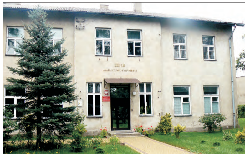
Budynek III Liceum Ogólnokształcącego stoi jak dotąd niewykorzystany.