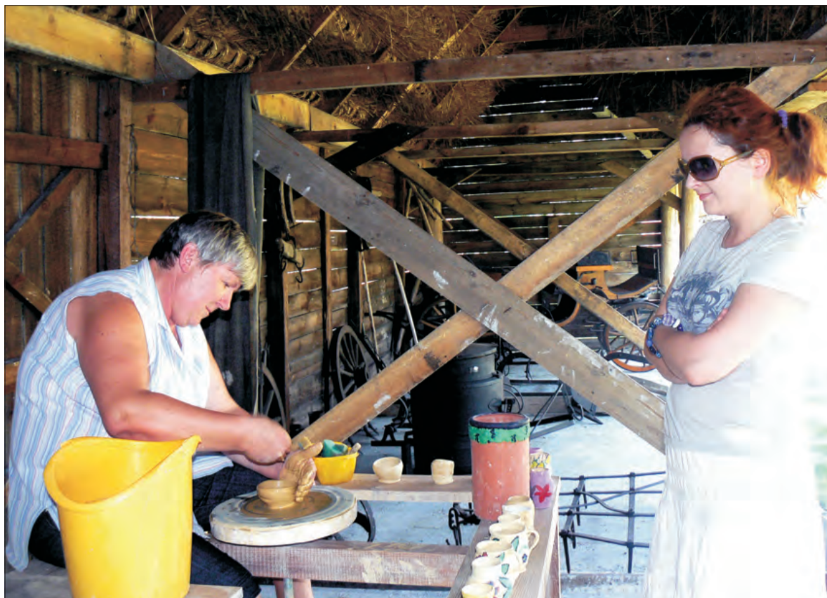
W skansenie w Maurzycach można nie tylko przyglądać się jak powstają garnki, ale również samemu spróbować je uformować.