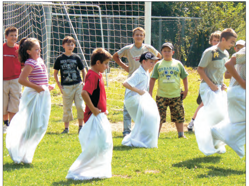
Inną zabawną konkurencją dla młodszych uczestników pikniku był wyścig w workach.