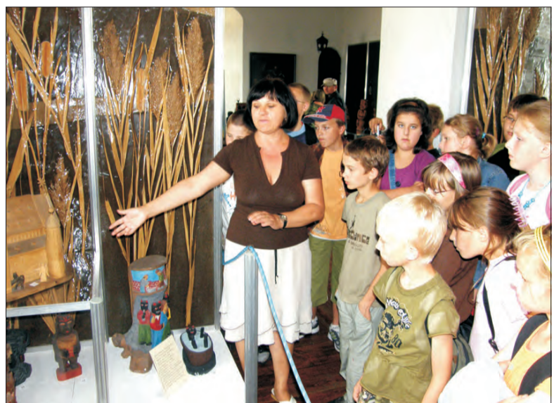
Młodzież z Gminy Zduny w czasie zwiedzania ekspozycji w Muzeum na Zamku Królewskim w Łęczycy.