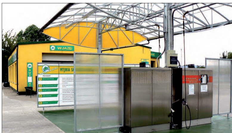
Myjnia samoobsługowa na Bratkowicach już działa.