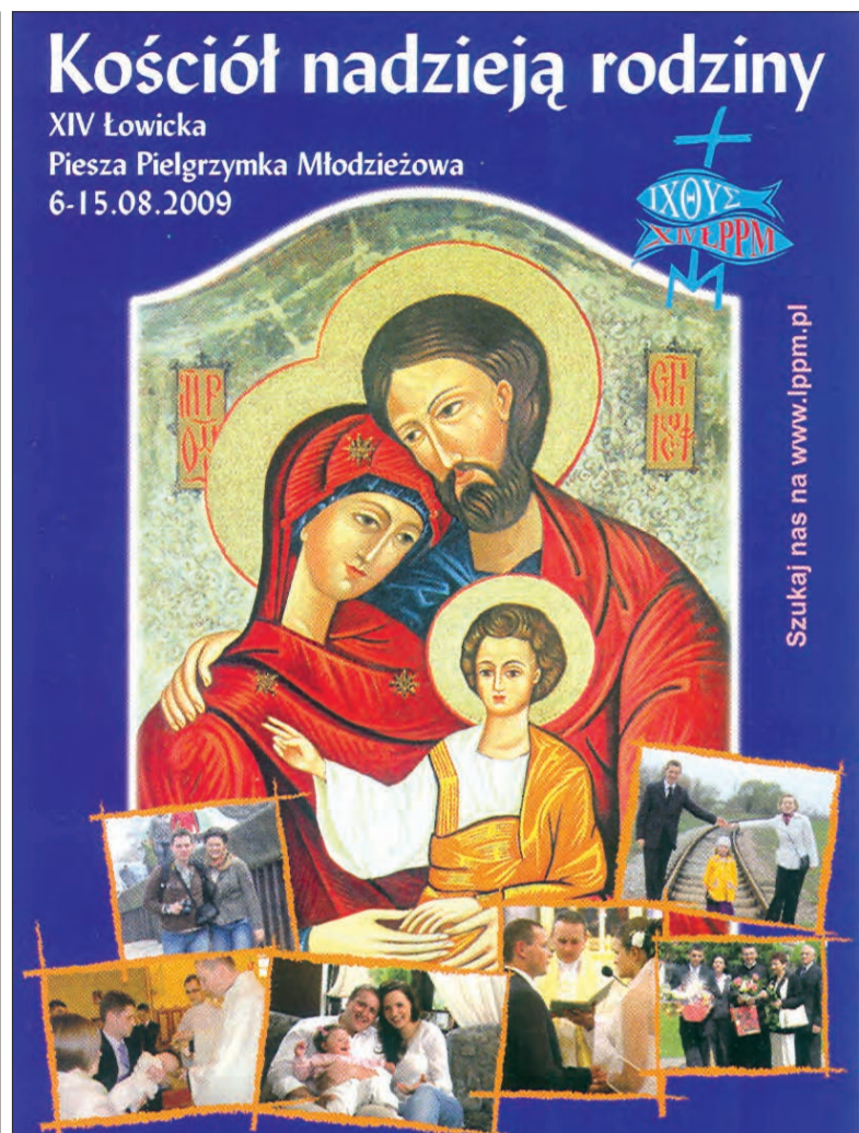
Plakat XIV pielgrzymki nawiązuje do hasła „Kościół nadzieją rodziny”.