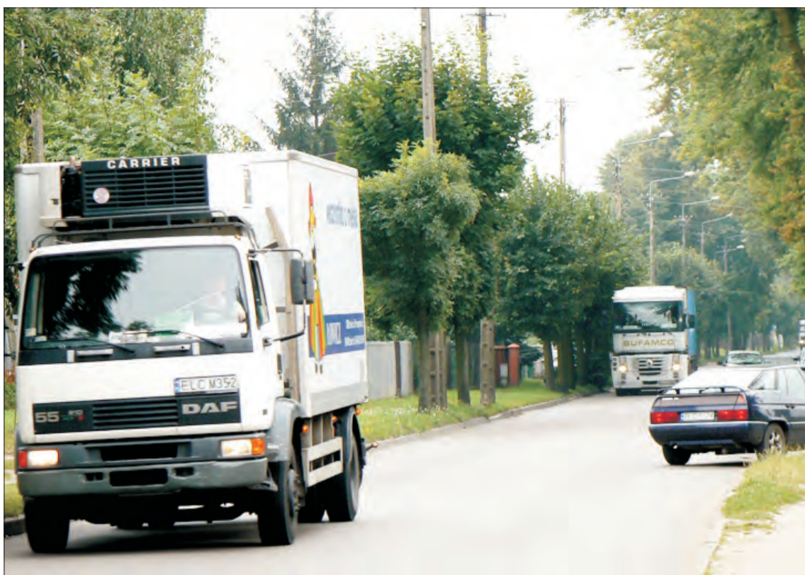
Mieszkańcy ul. Armii Krajowej oczekują, że ciężarówki, które teraz jeżdżą pod ich oknami, w niedalekiej przyszłości jeździć będą ulicami Płocką i Małszyce.

Komisja postanowiła też powiadomić właścicieli zakładów pracy istniejących przy ul. Armii Krajowej i Małszyce o potrzebie skierowania ruchu ul. Małszyce. Pismo rozesłał PZD do 36 firm, nie tylko transportowych. Wymowa pisma jest jednak zaskakująca, bo Zarząd Dróg Powiatowych prosi o spowodowanie zmia-