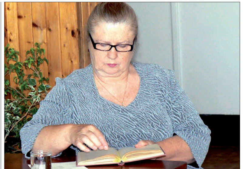
Stanisława Celińska zachwycała recytacją wierszy Haliny Poświatowskiej.