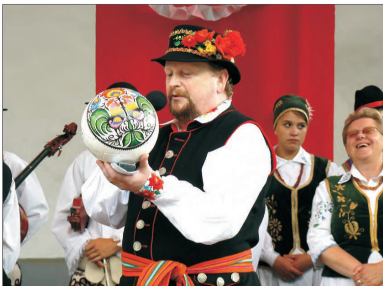
Księżacka piłka z motywem zaczerpniętym z łowickiej wycinanki trafiła już do ponad 900 osób. Teraz znów jest do nabycia w powiatowym centrum promocji.