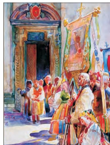
Fragment procesji przy kościele kolegiackim w Łowiczu, papier, akwarela, 1933 r. ze zbiorów Muzeum w Łowiczu.

Sztuk Pięknych, kierownikiem wydziału kultury urzędów powiatowych w Łowiczu, Skierniewicach i Rawie Mazowieckiej, kierownik artystyczny Spółdzielni „Sztuka Łowicka”, a także współzałożycielem i członkiem wielu towarzystw społecznych i kulturalnych w mieście. Uprawiał malarstwo sztalugowe i ściennę, grafikę i rzeźbę, projektował pomniki, tablice, sztandary i inne formy użytkowe, zajmował się też konserwacją obiektów sztuki; pozostawił po sobie wiele wspaniałych dzieł związanych z Łowiczem i regionem.