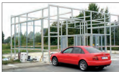
Myjnia na Bolimowskiej dopiero powstaje.

Kolejna myjnia bezdotykowa powstaje przy stacji paliw pod marką Orlen i salonie sprzedaży samochodów marki KIA przy ulicy Bolimowskiej w Łowiczu. Tam jednak nie będzie to myjnia samoobsługowa, tylko obsługiwana przez pracownika. Przewidywany start tej myjni to koniec sierpnia. Aktualnie powstaje konstrukcja budynku, urządzenia myjące mają przyjechać w przyszłym tygodniu. O starcie nowej myjni poinformujemy, gdy tylko będzie znany konkretny termin jej uruchomienia. (mak)