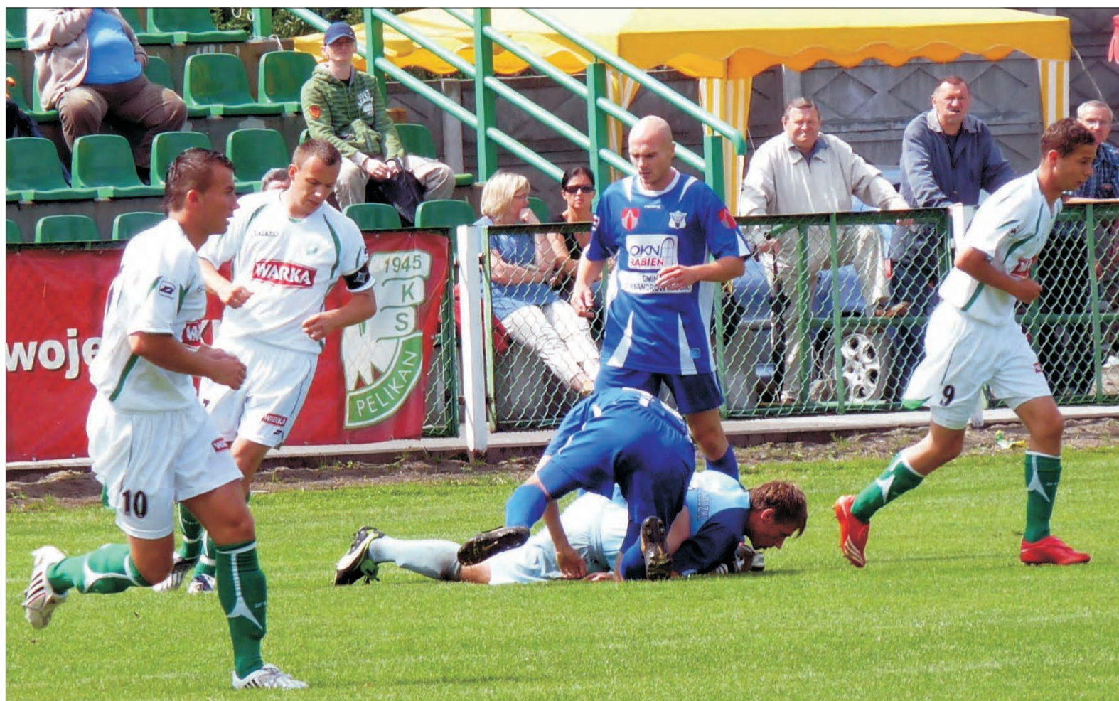
Pelikan po dwóch kolejkach jest współliderem rozgrywek II ligi.

Piłkarska - 2. kolejka II ligi, grupa wschodnia