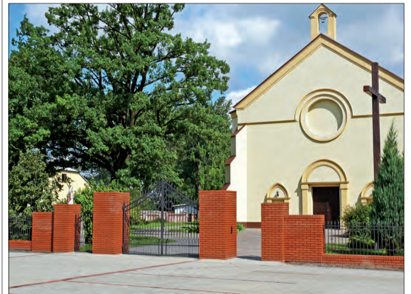
Nowe ogrodzenie i nowy parking będą gotowe na niedzielą uroczystości.

Uroczystości rozpoczną się o 11.30 uroczystą mszą świętą w kościele parafialnym w Łyszkowicach. Po mszy świętej na placu przed tamtejszą nową strażnicą i urzędem gminy odbędzie się natomiast ceremonia strażacka. Mają na niej zostać wręczone odznaczenia i medale. Na placu, pomiędzy budynkiem urzędu gminy a nową strażnicą poświęcony ma być stojący na betonowym cokole kamień o wymiarach około 1,5x2 m upamiętniający obchody rocznicowe oraz wizytę Prymasa Polski. Potem goście zaproszeni zostaną na obiad do szkoły. (mak)