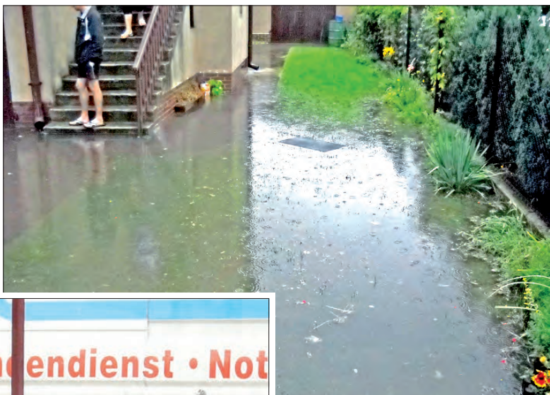
Zalewane były również posesje, np. przy skrzyżowaniu ulicy Wiśniowej i Zagórskiej na Górkach.

Zanim to się jednak wyjaśni, na ulicy Sikorskiego będą studzienki czyszczone