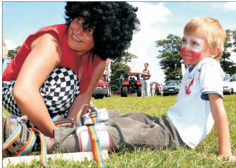
Wśród dzieci były także odważne kilkulatki, które chciały spróbować spaceru na szczydach

W kategorii juniorów pierwsze miejsce zajęła drużyna West Chaśno, drugie McDo-