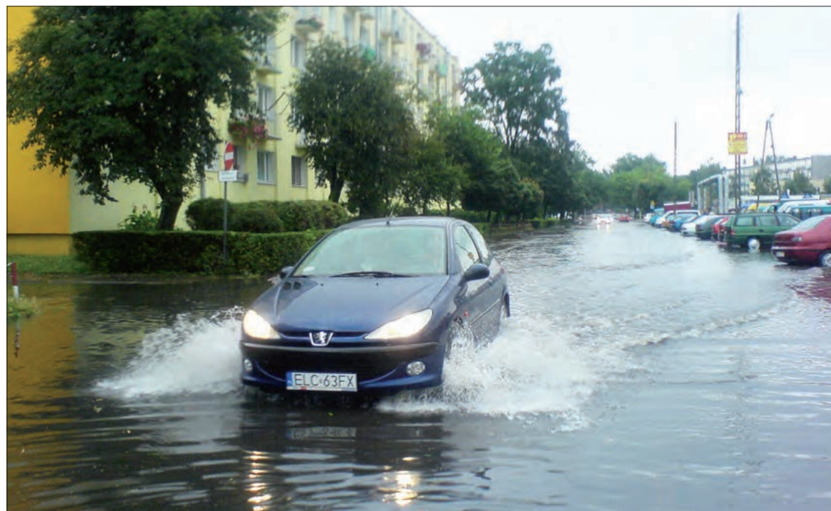
Na ulicy Sikorskiego w Łowiczu woda wypełniła jezdnię i zalała chodniki. Dostała się też na targowicę miejską.

w ramach zlecenia, jakie miasto udzieliło zewnętrznej firmie. Wyczyszczone mają być wszystkie studzienki, wpusty i separatory na terenie miasta. Przetarg