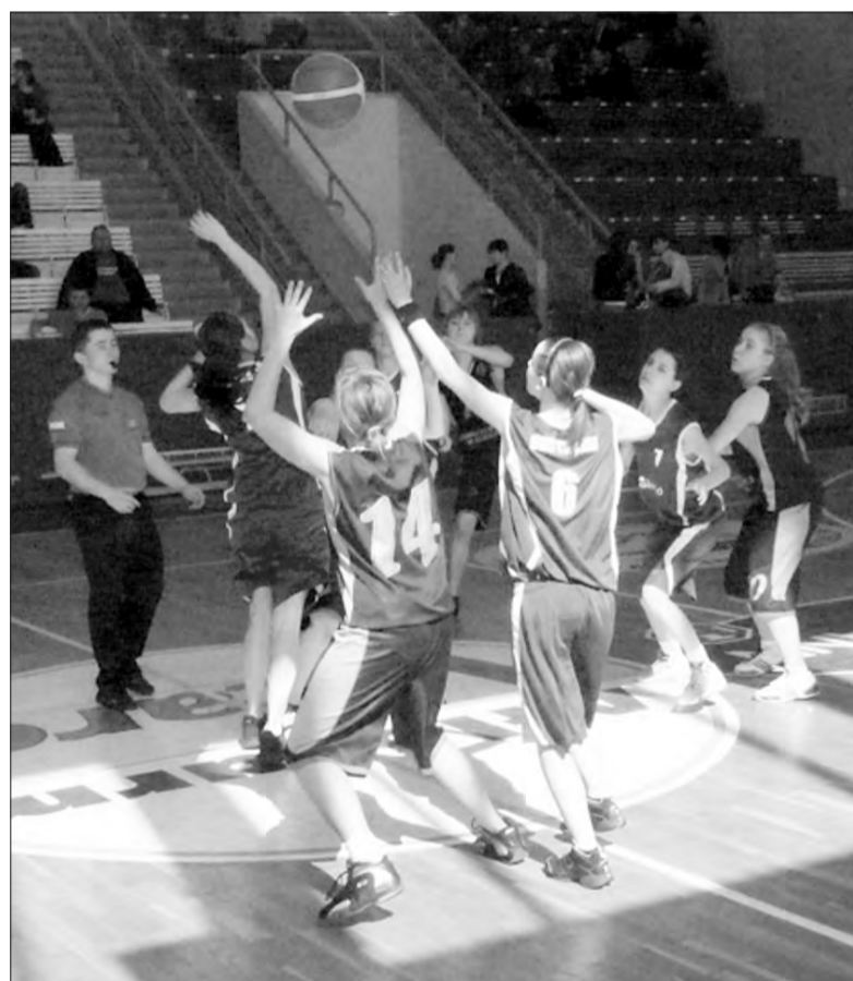
Reprezentantki Gimnazjum nr 2 w Łowiczu sięgnęły po brąz w turnieju koszykówki.