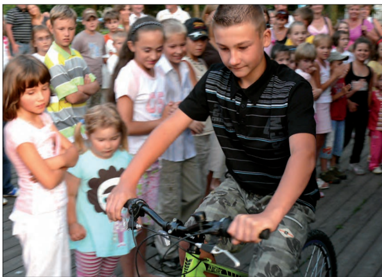
Jedna z konkurencji rozegranych pod sceną - jazda zółwia na rowerze.