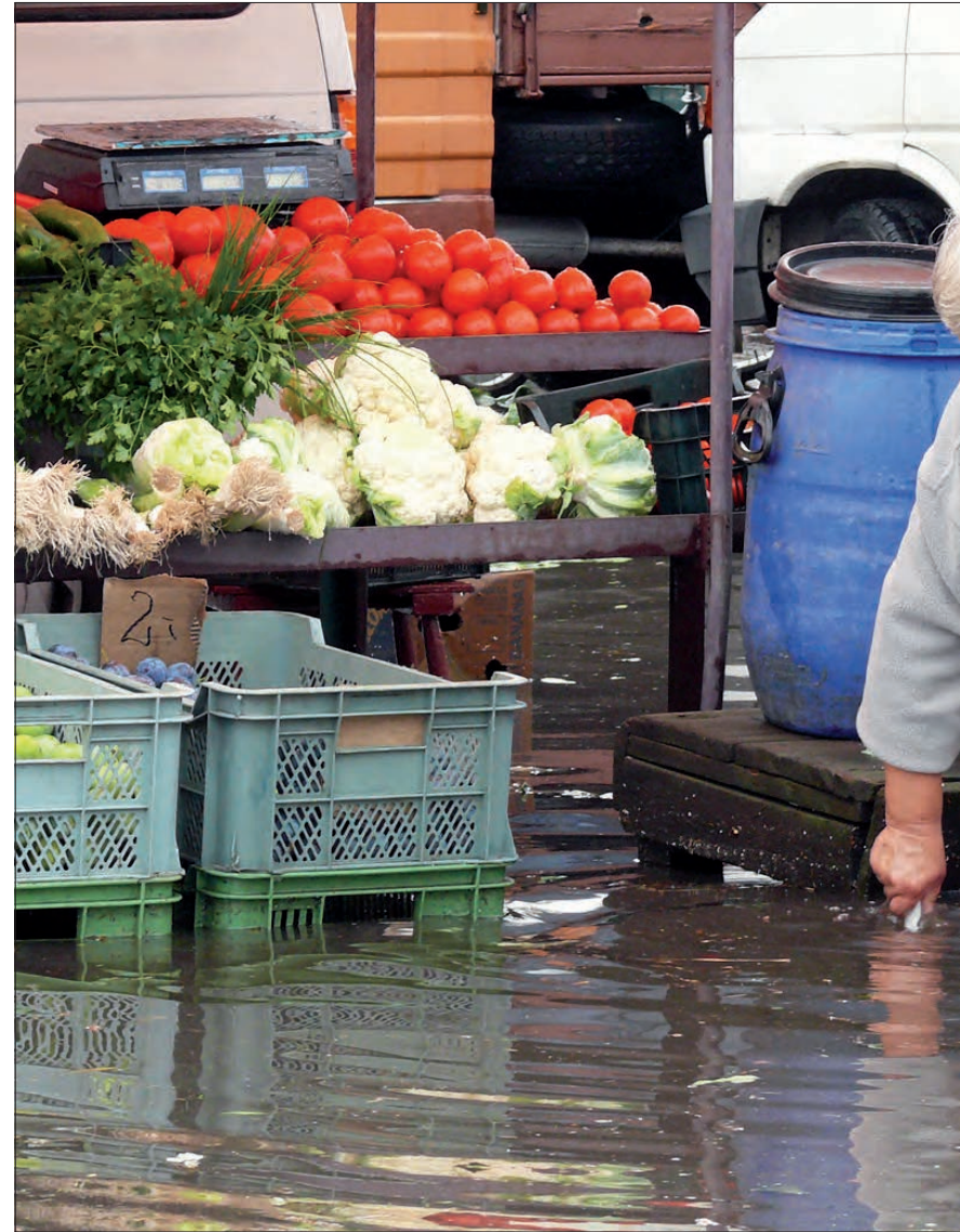
Jedna z handlujących na łowickiej targowicy próbuje kijem udrożnić wpust z kratką, który powinien odebrać wodę - niestety bezskutecznie.

Burmistrz wie, że największe problemy z wodą deszczową są zawsze w tych samych miejscach: na targowicy, na ulicy Sikorskiego, na Ułańskiej i na Armii Krajowej, tuż za skrzyżowaniem z ulicą Poznańską.