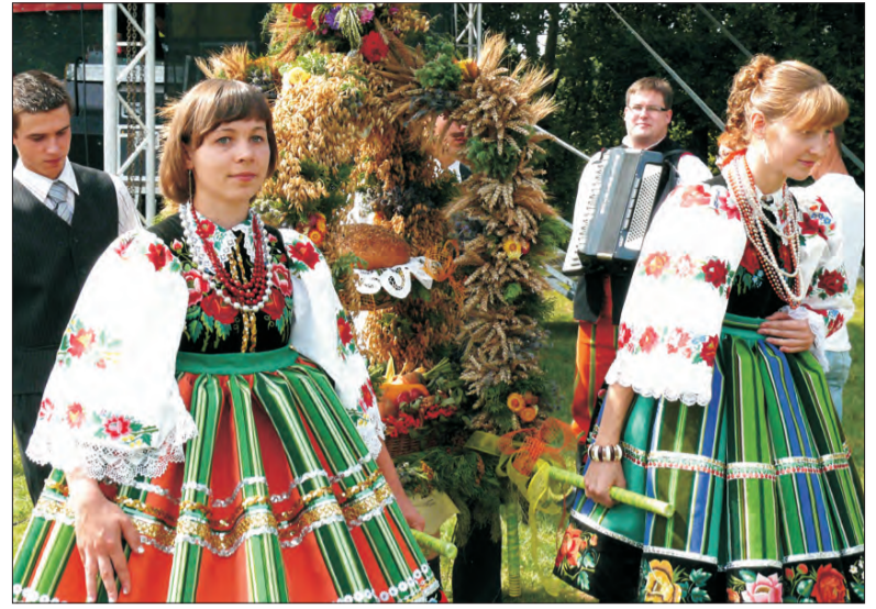
Większość wieńców nosiły dziewczęta w łowickich strojach ludowych, tu wieńiec ze Skowrody Północnej.