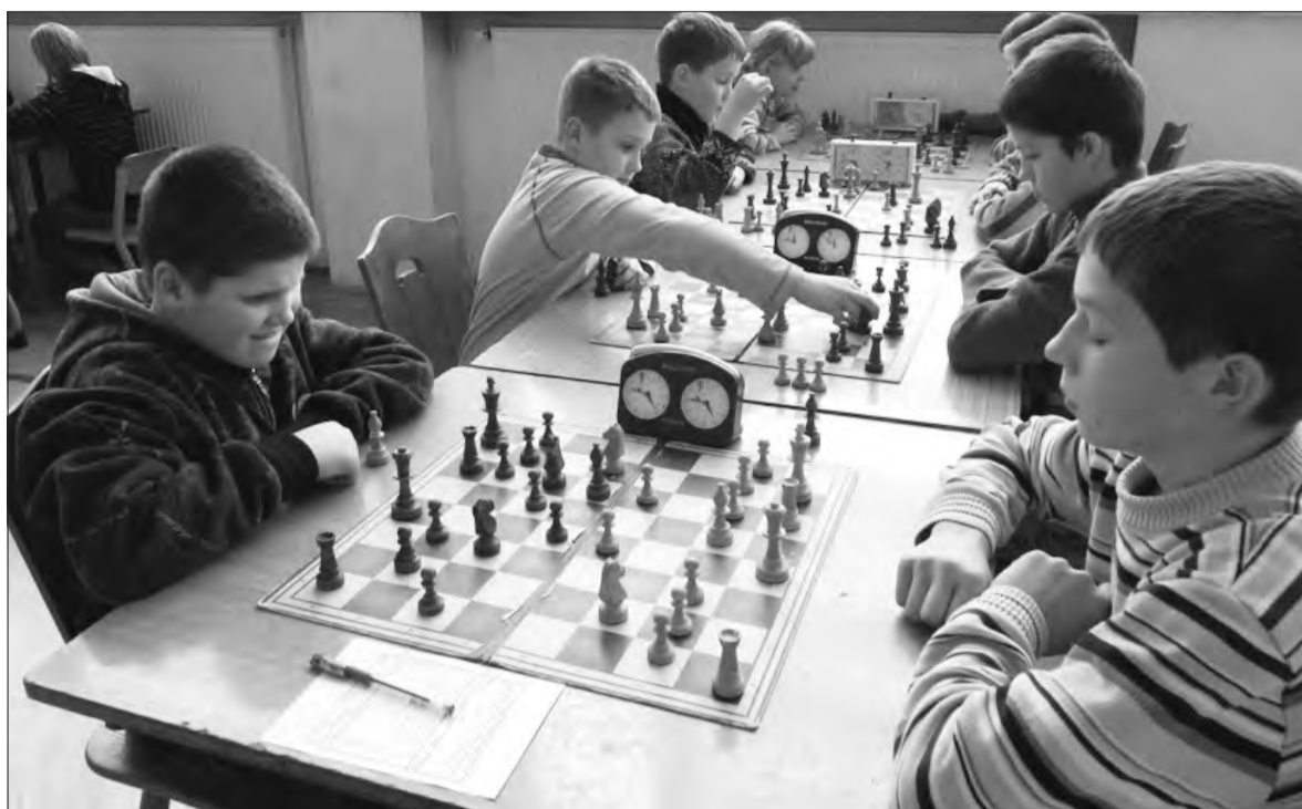
Po raz drugi z rzędu młodzi szachiści ze Szkoły Podstawowej w Nieborowie sięgnęli po brązowy medal w województwie łódzkim.

W nawiasie podano miejsce w klasyfikacji z ubiegłego roku szkolnego.