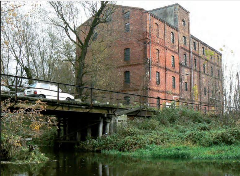
Gmina Zduny chce zastąpić stary drewniany most na Bzurze nowym żelbetowym, chciałaby go jednak wybudować nie tylko za swoje pieniądze.