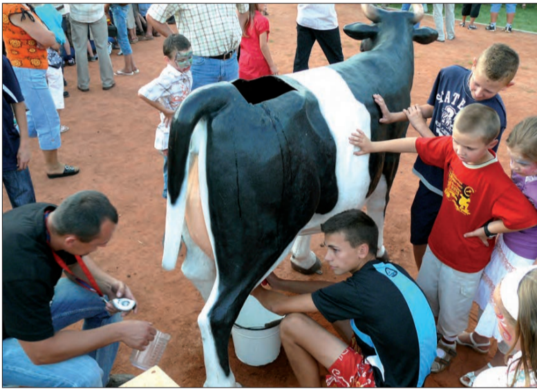
W dojeniu krów mogli zmierzyć się młodzi i starzy, niektórzy narzekali, że zamiast mleka z wymion lała się woda.

Momentem, na który publiczność najbardziej czekała, było losowanie losów w loterii fantowej, ich cena 5 zł nie odstraszyła kupujących, sprzedano wszystkie z ponad tysiąca. Sierotka Marysia, w którą wcieliła się jedna z dziewczyn z zespołu Boczki Chelmońskie, szybko uporowała się