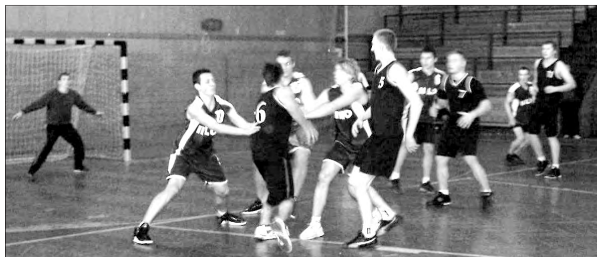
Szczypiorniści z II LO zawędrowali aż do finału WLS, ale medalu nie zdobyli.