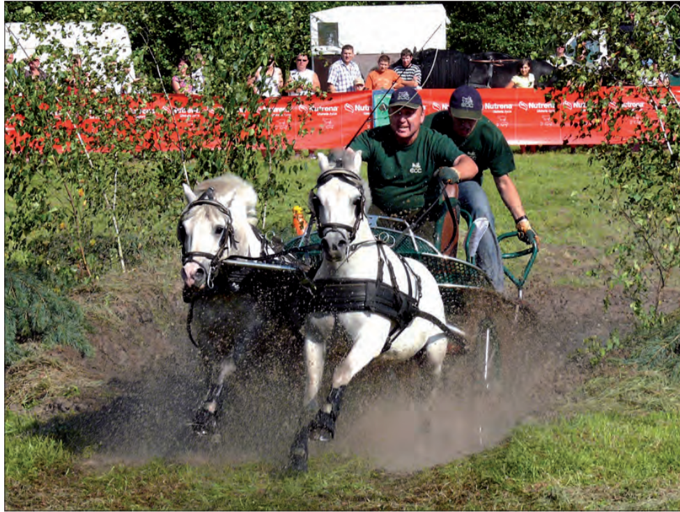
Pokonanie rowu z wodą było dla wielu koni nie lada wyczynem, za nic nie chciały wejść do wody, inne wpadały w nią w biegu.

gi wjeżdżały w jedną z kilkunastu bramek ustawionych na parkurze. Wspaniale w zaprzęgach spisywały się kuce walijskie, które szybko zyskały sympatię publiczności. Wśród koni były też małopolskie, wielkopolskie i fryzyjskie.