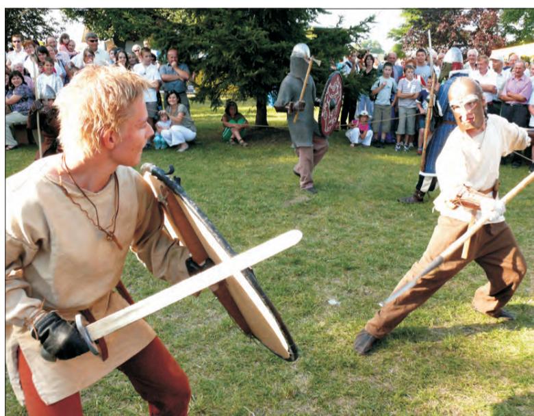
Wikingowie i Słowianie toczyli między sobą ciężkie boje ku uciesze widzów w czasie festynu w Bąkowie.

Większość osób, która przybyła na festyn, pierwsze kroki kierowała do stoiska, gdzie sprzedawane były losy loterii fantowej. Cieszyły się one bardzo dużą popularnością i już przed godz. 17. wszystkie były wysprzedane. Za każdy los można było wygrać dary od parafian i sponsorów, a w głównym losowaniu nagrody główne: tradycyjnie już - cielaczka, kozy, świnie oraz rowery, sprzęt RTV i AGD i wiele innych.