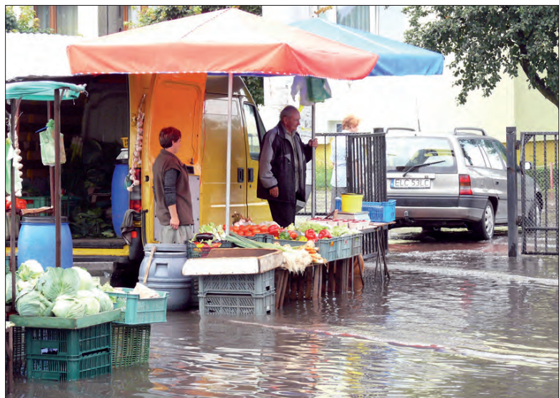
Na kupujących przy takiej wodzie trudno było liczyć, sprzedający czekali więc aż ona opadnie.