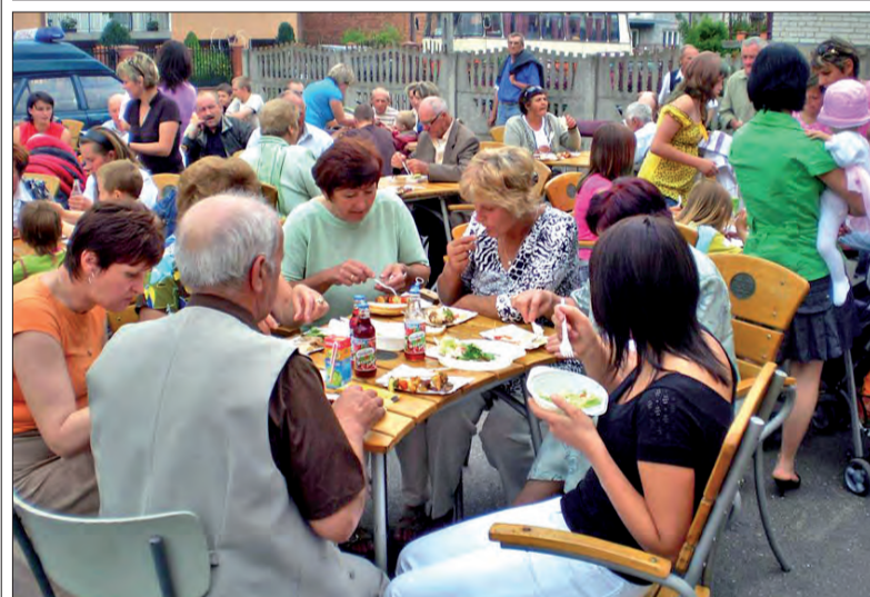
Podsumowaniem kilkumiesięcznych warsztatów kulinarnych był czerwcowy piknik w Sierzchowie. Wszyscy mieszkańcy mogli skosztować dań z grilla przygotowanych przez uczestników kursu.

Spotkania członków koła odbywają się w każdą drugą środę miesiąca o godz. 16 - w Sali Ślubów Łowickiego Ośrodka Kultury przy ul. Podrzecznej. (mww)