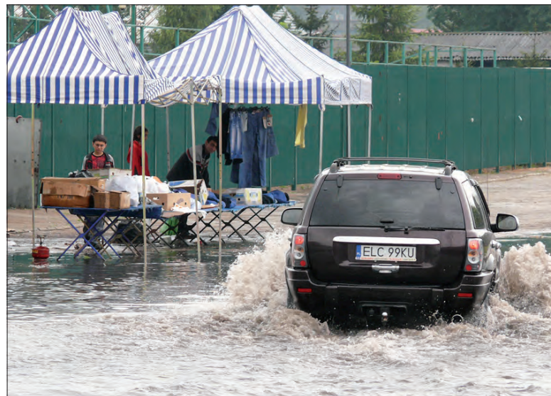
Od strony boiska woda zalała jedno ze stoisk z ubraniami, właściciele szybko się pakowali.