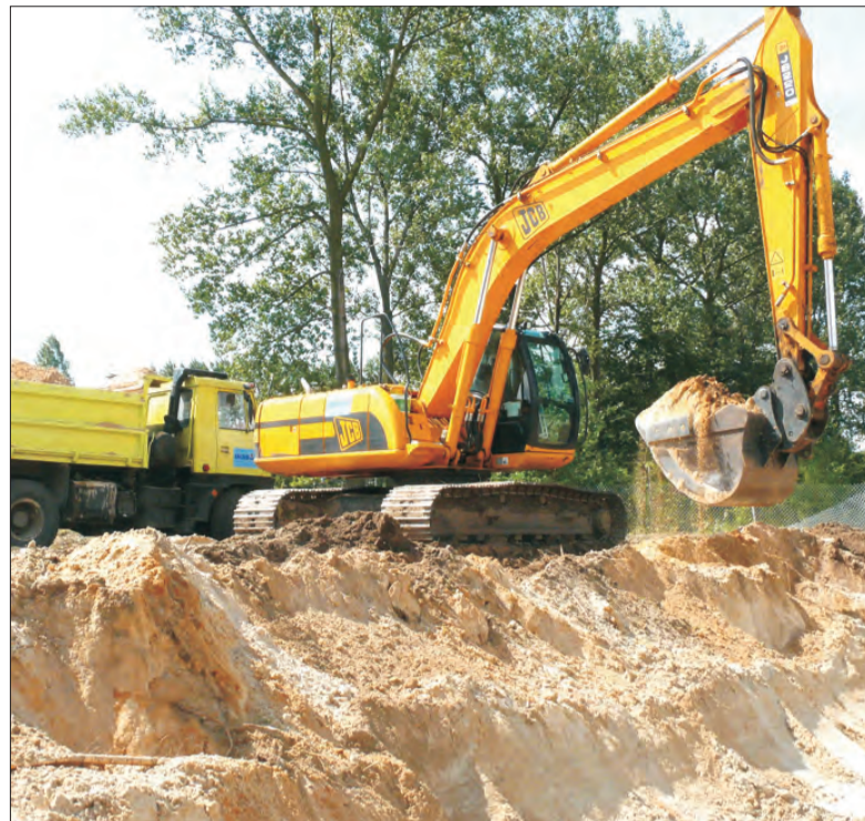
Wykop pod nowy blok komunalny jest już prawie gotowy, znajdują się tam fundamenty i piwnice.

- budowa kompleksu sportowo-rekreacyjnego w Jamnie w gminie Łowicz - 1,5 mln zł, dofinansowanie 500 tys. zł. - Gmina Bolimów ma otrzymać także 500 tys. zł na budowę ogólnodostępnego kompleksu sportowego w Bolimowie , który ma kosztować ogółem 1,3 mln zł. (mwb)