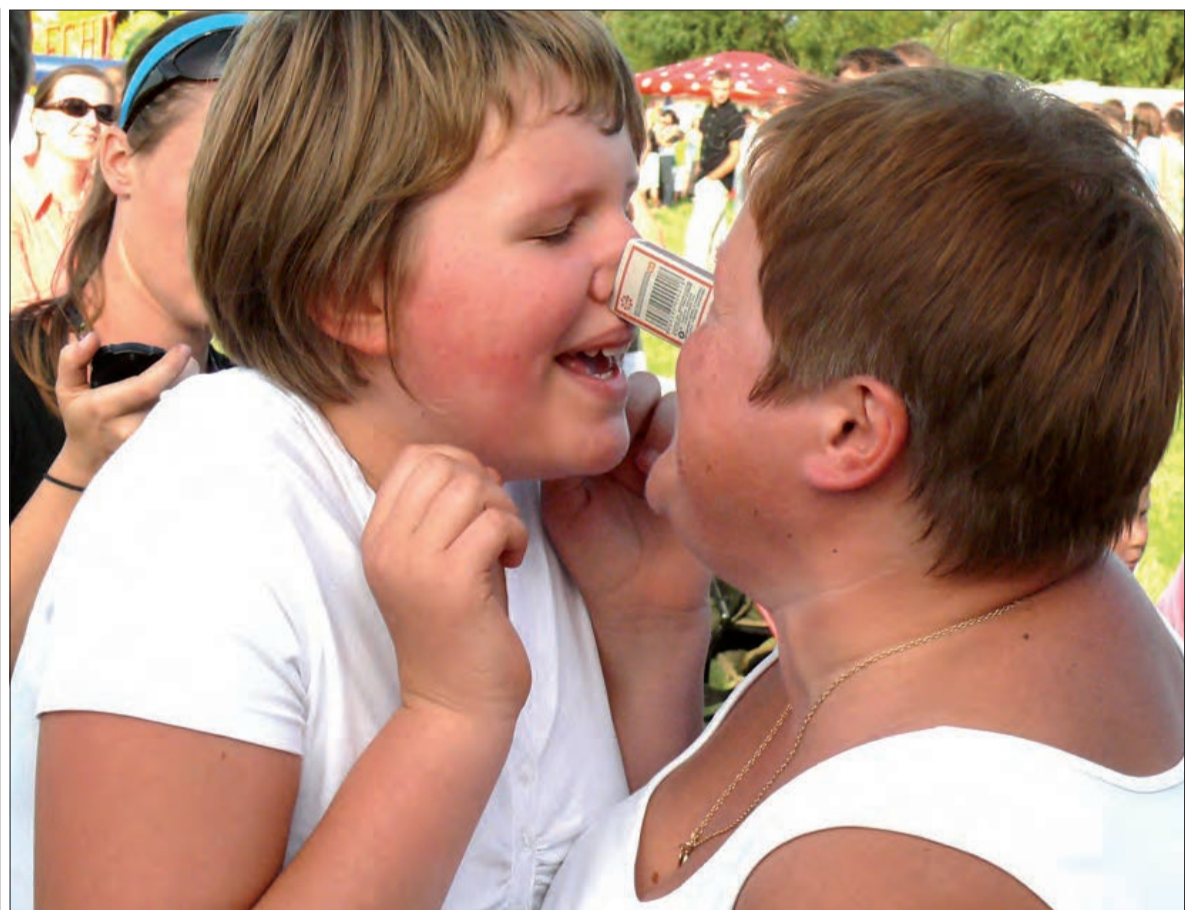
Przekazywanie sobie za pomocą nosa pudełka od zapalek wcale nie jest łatwe, przekonali się o tym uczestnicy turnieju rodzinnego w Bąkowie. Więcej na stronie 17.

sami poradzili sobie z uruchomieniem filtra. Zapowiada, że otwarcie basenu jest pewne na 99,9%. Do końca miesiąca będzie czynny w godz. 11-19, od września w stałych godzinach. Zupełnie niesprawy filtr, od którego kilka tygodni temu odpadła dennica, zostanie naprawiony przez holenderskiego producenta w pierwszych dniach września. Po naprawie basen znów będzie mógł pracować na pełnych obrotach. (mwk)