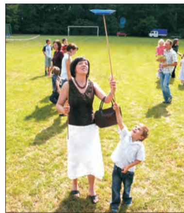
Zabawa z cyrkowcami dała wiele radości najmłodszym, szczególnie zabawa z kręceniem kijekami talerzykami.