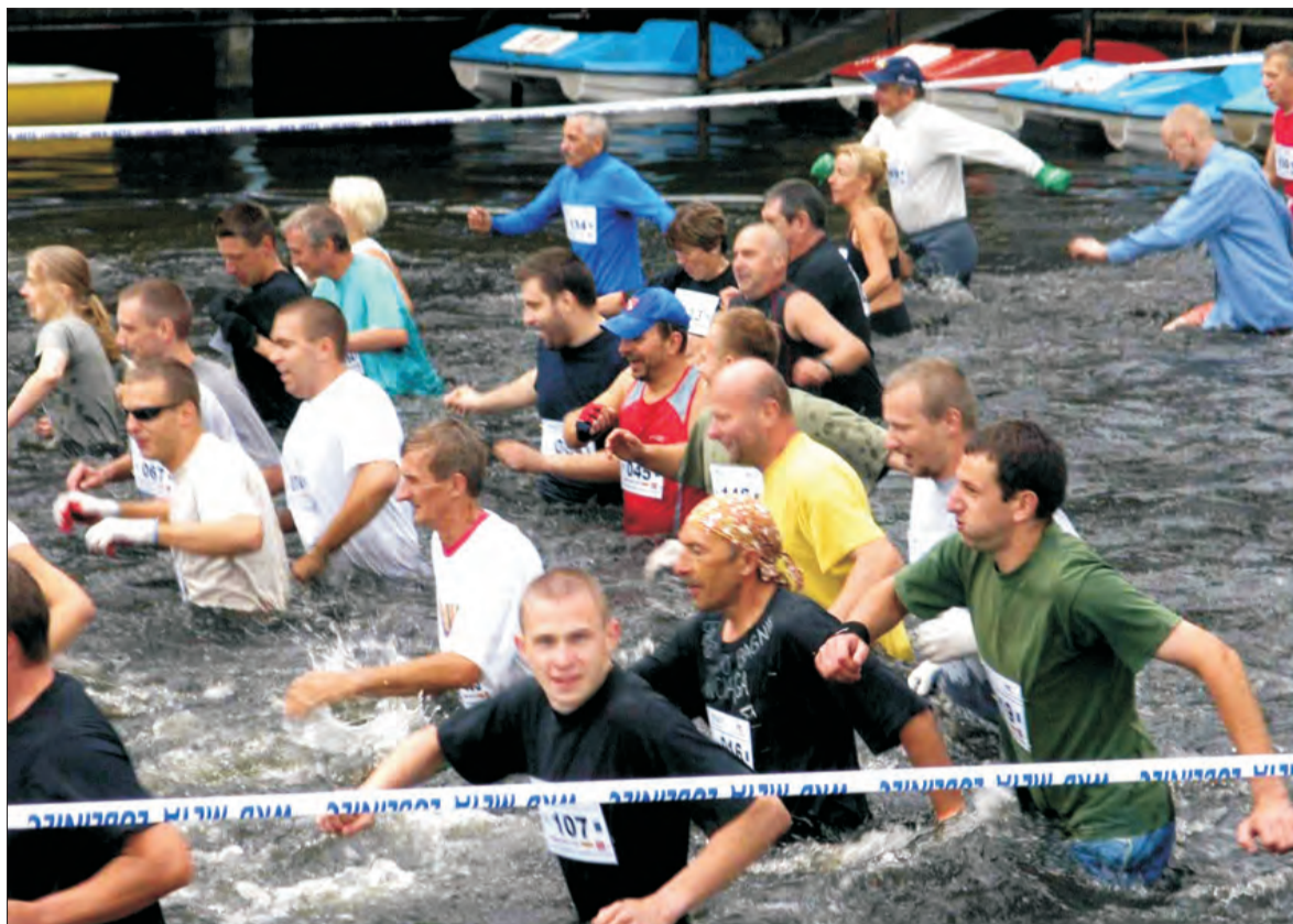
Na starcie wyprzedza się jeszcze najłatwiej... Im później - tym gorzej...