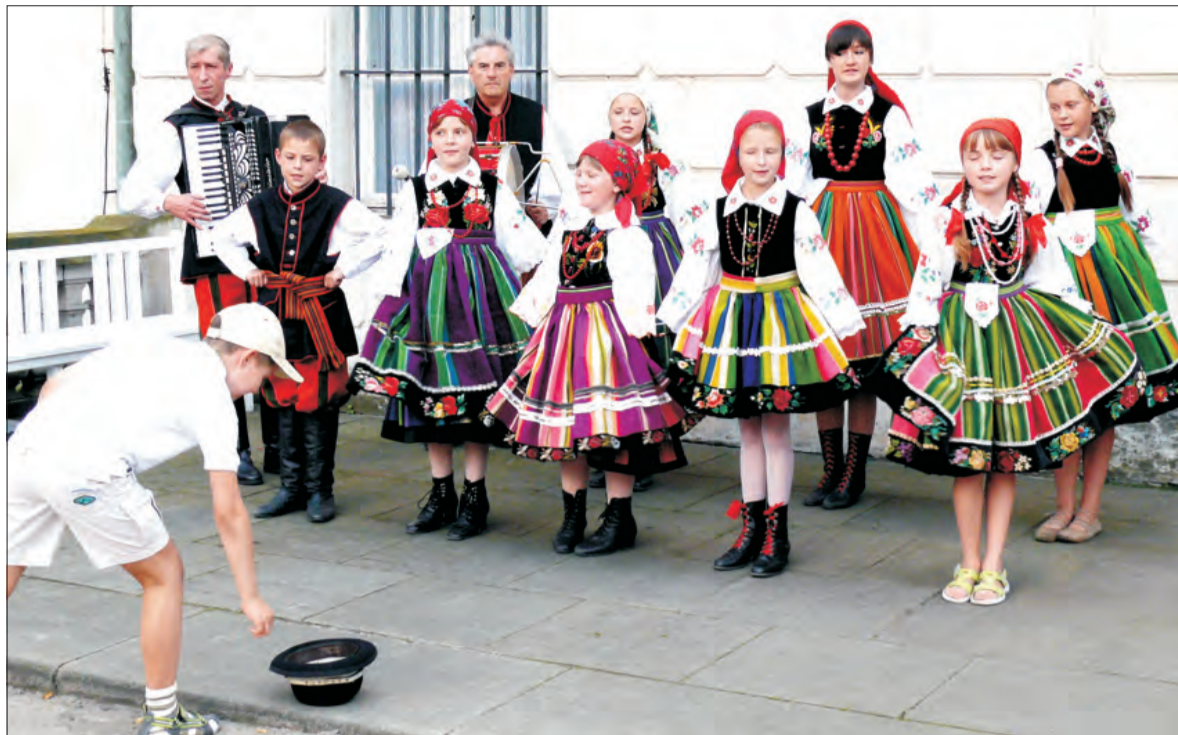
Krzewina grała „do kapelusza”. Zespół folklorystyczny „Krzewina” z Bobrownik wystąpił w sobotę, 8 sierpnia przed głównym wejściem do pałacu w Nieborowie. Około godziny 13-tej zaskoczeni występem turyści tłumnie gromadzili się wokół Krzewiny. Mieli okazję posłuchać łowickich przyspiewek oraz gawęd. Wiele osób wrzucało datki do ustawionego przed zespołem kapelusza. Członkowie zespołu również chętnie pozowali do zdjęć. Zebrane w ten sposób pieniądze zostaną przeznaczone na finansowanie wyjazdów członków zespołu. (mak)