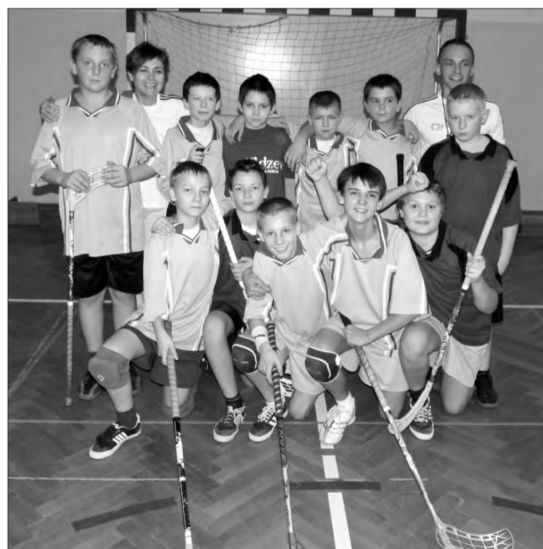
Ekipa SP Bielawy zdobyła w finale WIMS w unihokeju brązowy medal.