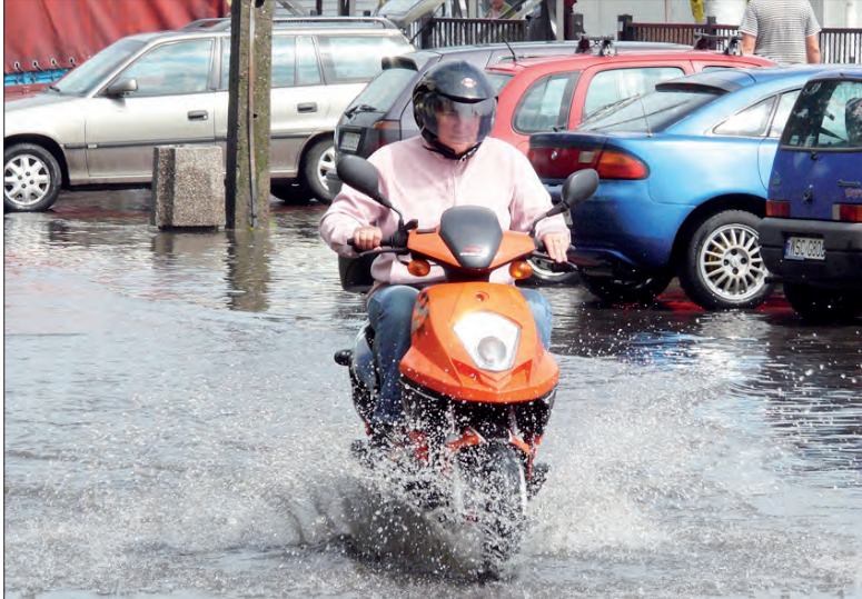
Mimo wysokiej wody ulicą Sikorskiego próbowali przejechać kierowcy samochodów i skuterów.

Jeszcze w czasie ulewy handlowcy biegali w strugach deszczu, by ratować przed wzbierającą szybko wodą stojące w skrzynkach na ziemi owoce i warzywa. Potem, gdy deszcz przestał padać, próbowali odetkać studzienki odbierające wodę z drogi. Udało się to w przypadku jednej, reszta pozostała niedrożna. - To skandal, wie pan, ile się tutaj płaci? - mówiła do nas zdenerwowana kobieta w przemoczonych butach i nogach oblepionych jakimś liściem - 60 złotych za rezerwację miejsca, 10 złotych za każdorazowy wjazd na targowicę w dni handlowe i 6 złotych za handel. Tyle pieniędzy - i stać w błocie i wodzie? Jak szybko policzyła jej koleżanka, miesięcznie odprowadza ponad 400 złotych za handlowanie