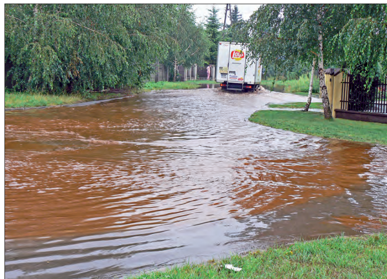
A tak po ulewie wyglądało skrzyżowanie ulic gen. Bołtucia i gen. Kutrzeby. Kanalizacja deszczowa nie była w stanie odebrać czerwonej wody, spływającej z ul. Armii Krajowej.