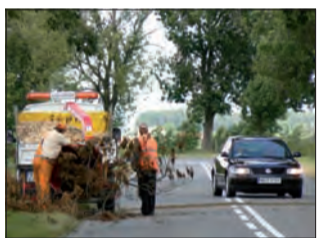
Rozdrabniarka pracowała na zlecenie pow. gostyńskiego.

Tego samego dnia, tuż po sesji, można było zauważyć na drodze powiatowej w Omółsku służbę drogową, która zbierała ścięte gałęzie i od razu je rozdrabniała. (eb)