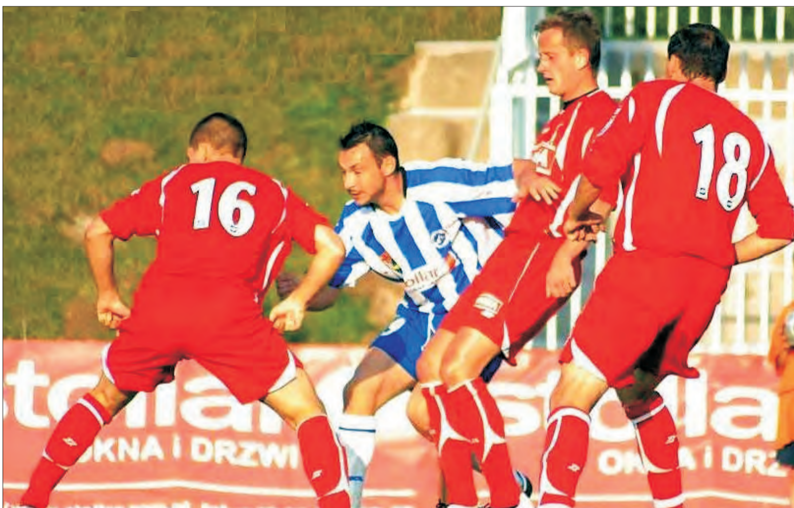
Łowicki Pelikan wywiózł z Suwałk cenny jeden punkt.