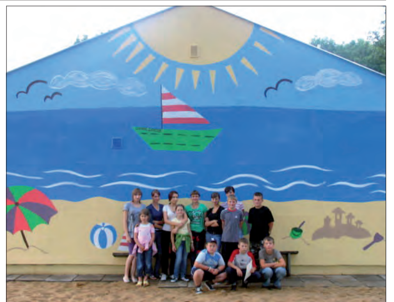
Pomalowana ściana strażnicy OSP w Stroniewicach i jej młodzi autorzy.

160 tys. zł przeznaczono w budżecie gminy Bolimów na dokończenie budowy drogi w Kolonii Woli Szydłowieckiej. W ubiegłym roku wykonano pierwszy etap tej inwestycji. Po przetargu okazało się, że cena wyniosła 132 tys. zł. Asfalt kładziony jest obecnie na pow. 1200 m przez Przedsiębiorstwo Robót Drogowo-Mostowych z Piotrkowa. Jeszcze w tym roku rozpoczną się przygotowania do budowy kolejnych dróg. Po 15 tys. zł mają kosztować dokumentacje projektowe czterech odcinków dróg: w Huminie, Kolonii Woli Szydłowieckiej, Ziąbkach i drugiego fragmentu w Kolonii Woli Szydłowieckiej.