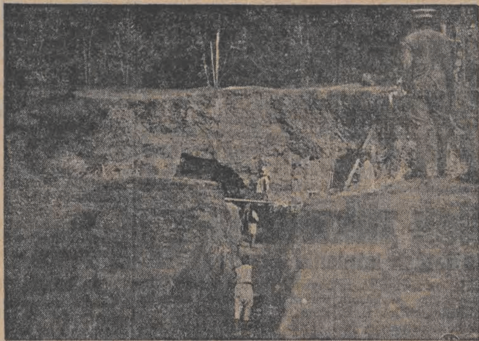
W parku, należącym do poselstwa francuskiego w Addis-Abebie w pośpiechu mykoczące są schrony przeciwlotnicze w przewidywaniu bliskiego ataku włoskich sił lotniczych na miasto.

— Lecieć naprzód byłoby samobójstwem — mówi nam już na lotnisku. „Czarny Orzeł”. W ten sposób kończy się mój każdorazowy lot.