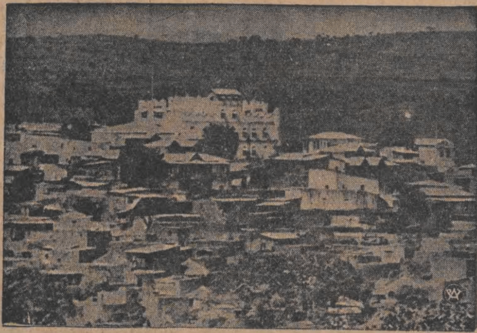
Na stadionie w Atenach (zdjęcie lewe) odbyła się wielka manifestacja, w której wzięły udział liczne delegacje wojskowych garnizonów Grecji. Premier Kondylis, który jest zarazem regentem kraju, wygłosił przy tej sposobności dłuższe przemówienie, w którym oświadczył, że w najbliższym czasie odbędzie się plebiscyt w sprawie przywrócenia monarchii. NA ZDJĘCIU PRAWEM: Miasto Marrakech, jeden z najbliższych celów ofensywy włoskiej.