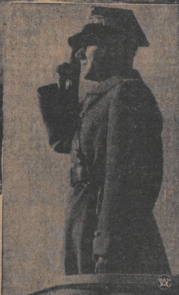
Generalny Inspektor Sił Zbrojnych, gen. Rydz-Śmigły przyjmuje defiladę z trybuny. NA ZDJĘCIU LEWEM: Piękny pomnik Marszałka Piłsudskiego, odsłonięty w dniu 11 listopada r. b. w Tarnopolu. NA ZDJĘCIU ŚRODKOWYM: Defilada 21 p. p. „Dzieci Warszawy”. NA ZDJĘCIACH GÓRNYCH: Junaczki i junacy (kadry pracy Stow. nad Niezatrudnioną Młodzieżą) podczas defilady.