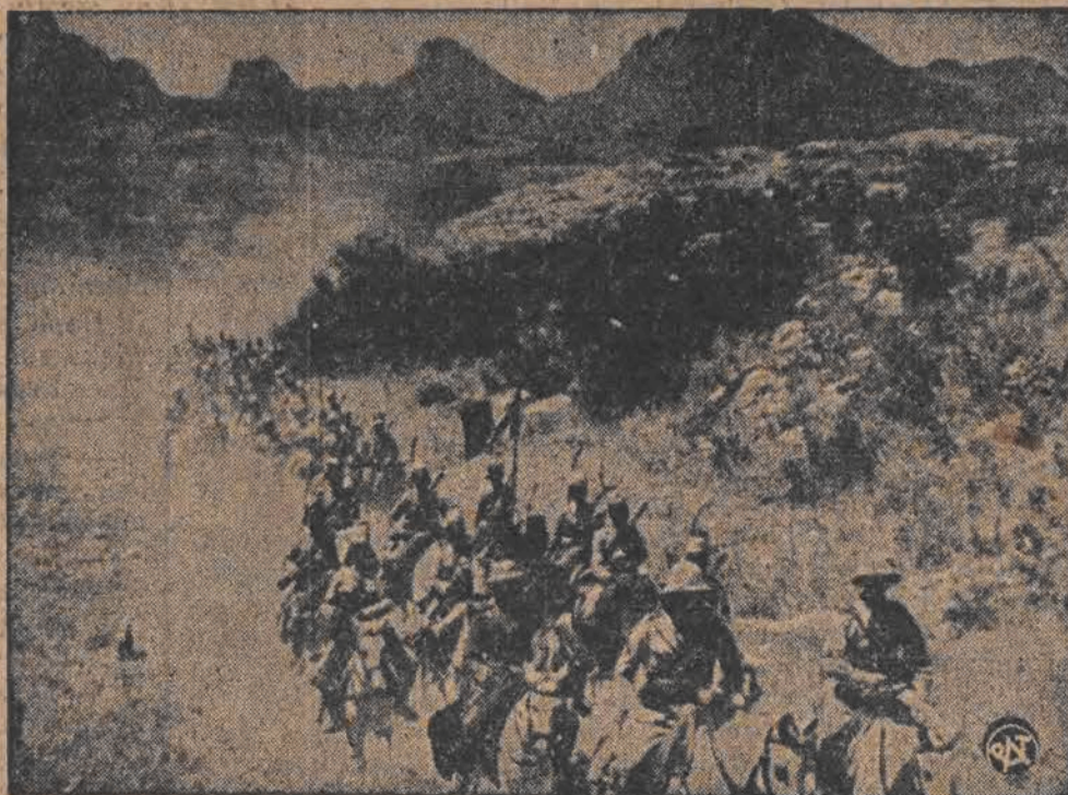
Nieprzeliczone kolumny wojsk włoskich dzień i noc posuwają się naprzód po trudnym górskim terenie

Dopiero w 2 godziny po przywróceniu mu życia, nastąpił, niestety, momentalny paraliż obu ożywionych organów. Dalsze próby przywrócenia życia nie dały wyników. Stwierdzono ostatecznie, że chłopiec zmarł — ponownie. Fakt ten wywołał jednak ożywione komentarze w świecie lekarskim w Anglii.