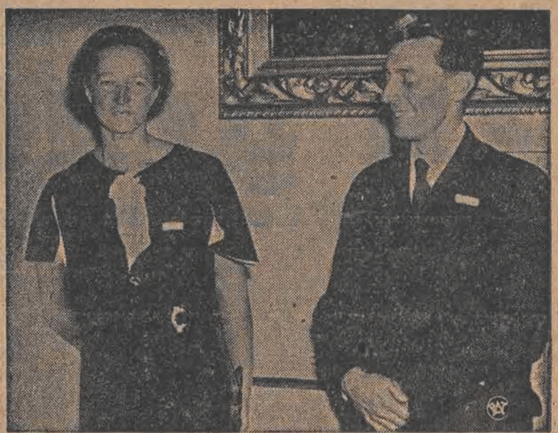
Nagrodę Nobla ro dziale Chemii za rok 1935 przyznano prof. Joliot i jego małżonce Irene Joliot Curie, córce A. p. Marji Skłodowskiej Curie. Laureatów przedstawia nasze zdjęcie.

Skoro miłość Pani jest w dalszym ciągu tak żywa, walczyć o odzyskanie ukochanego. Sposób nato jest mnóstwo. Napisać mu to wszystko, co mnie, a jeszcze lepiej powiedzieć ustnie, otwarcie i śmiało.