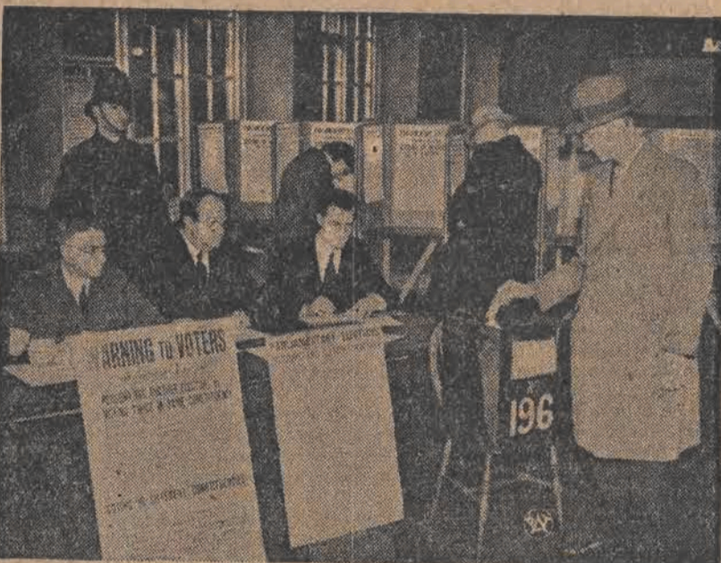
Obrazek z ostatnich wyborów do Parlamentu angielskiego, które przyniosły rządowi jednoci narodowej wybitną przewagę, około 250 mandatów

Od młodości do starości będziesz mieć ZDROWE ZĘBY Używaj stała AGATOL pastę do zębów ST. GÓRSKIEGO