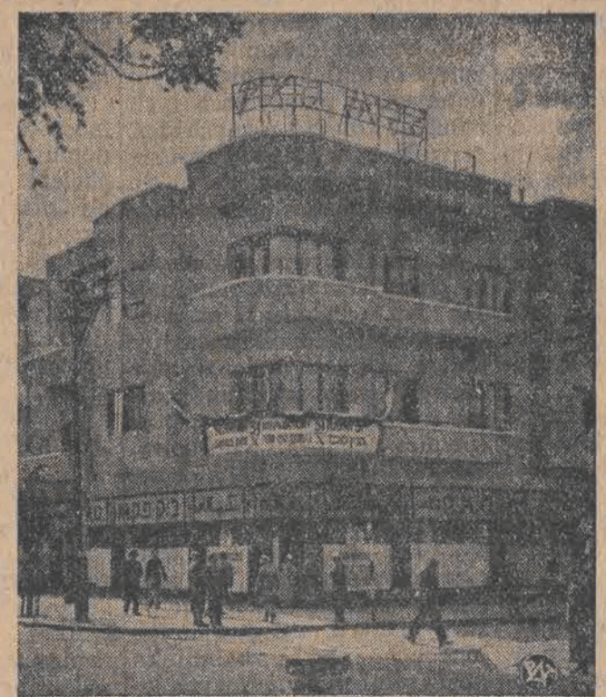
W oddziale Banku P. K. O. w Tel. Ambrota Międzynarodowy Dział Oszczędności był obchodzony równie uroczysto, jak w Polsce. Na zdjęciu widok udekorowanej fasady Oddziału telegraficznego P. K. O., który rozciąga się bardzo pomysłowo.