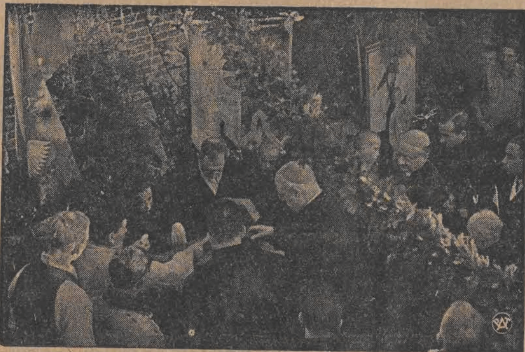
Jak donosiłmny, na Annapolu stanie niezadługo kosztem około 120.000 złotych Dom Pracy imienia ks. Kardynała Aleksandra Kakowskiego przeznaczony dla bezrobotnej młodzieży. Na zdjęciu — fragment uroczystości romurowania aktu erekcyjnego. Na pierwszym planie ks. kardynał Kakowski, nuncjusz papieski mgr. Marmaggi i ks. biskup polowy Gwolina.