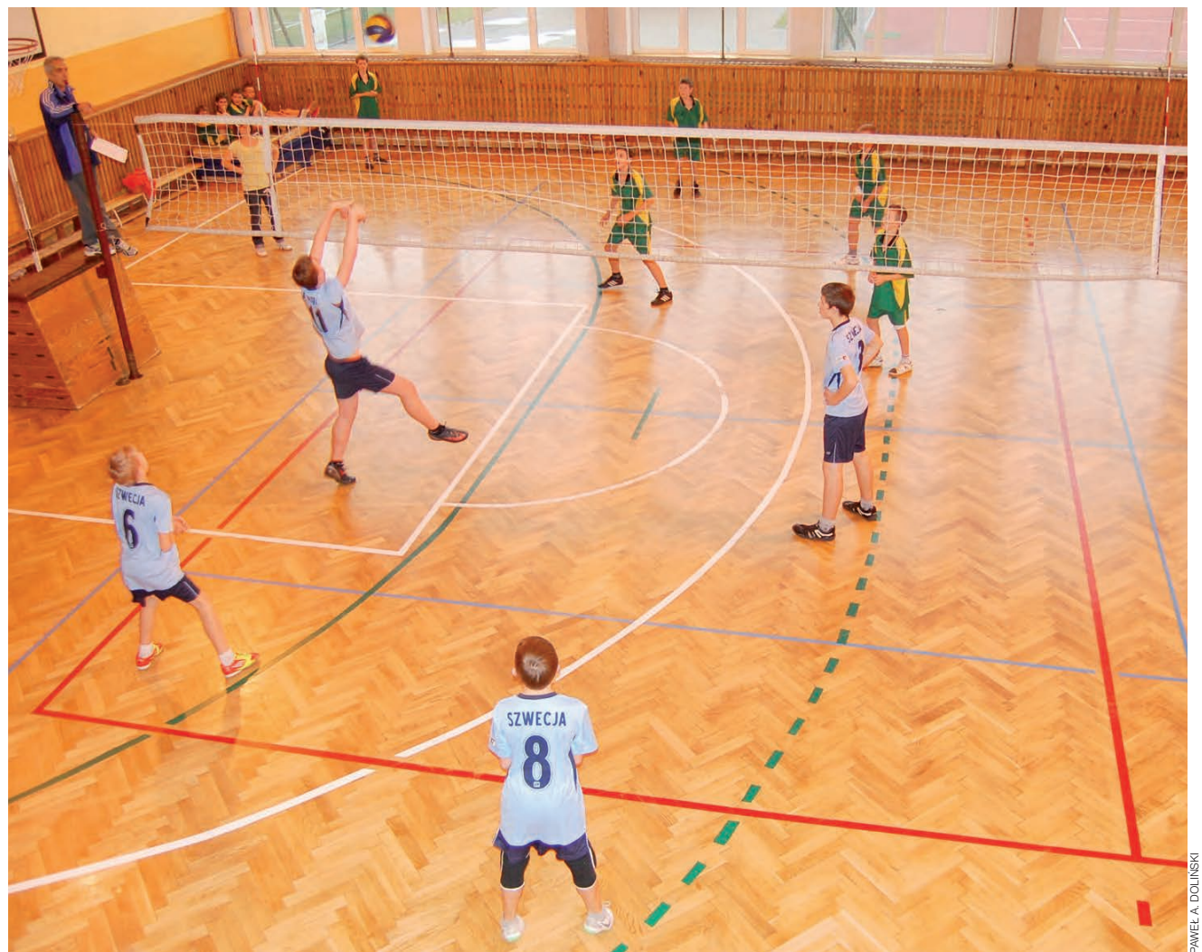
W rozgrywkach grupowych lepszą okazała się ekipa z Kocierzewa, ale w finale wygrali jednak siatkarze z łowickiej Jedynki.

■ SP 1 Łowicz – SP Kocierzew 2:1 (25:11, 16:25, 15:13)