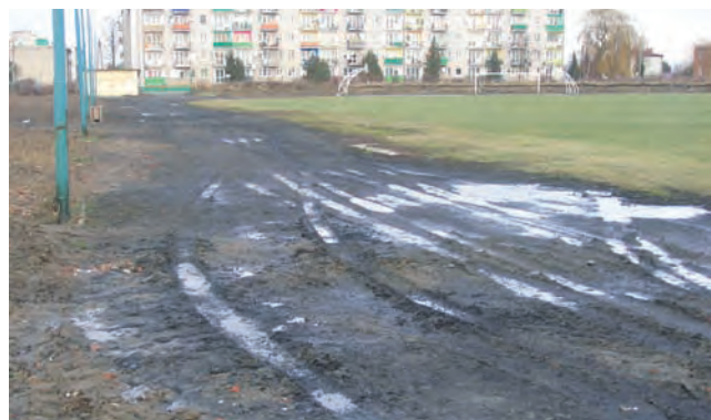
Na stadionie już widać zmiany. Rozebrano już budynek socjalny i część trybun. To, co widać na pierwszym planie, było kiedyś bieżnią.

W budżecie zaplanowano 230 tys. zł na modernizację sali gimnastycznej przy ulicy Barlickiego 4 wraz z opracowaniem projektu technicznego. 21 tys. zł ma kosztować modernizacja pomieszczeń budynku Przedszkola Samorządowego nr 2, a 32.860 zł modernizacja budynku Przedszkola Samorządowego nr 1. W zadaniach zapisano