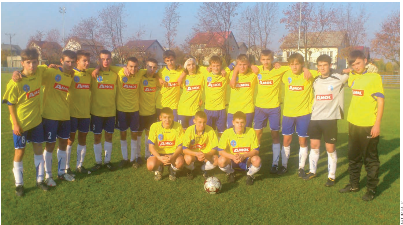
Drużyna Laktozy Łyszkowice zajęła trzecie miejsce w grupie eliminacyjnej.

W rywalizacji z łowickim Pelikanem, która zawsze jest