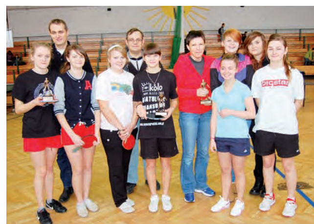
Puchary w tym roku wywalczyły zespoły II LO, ZSP 2 i I LO.