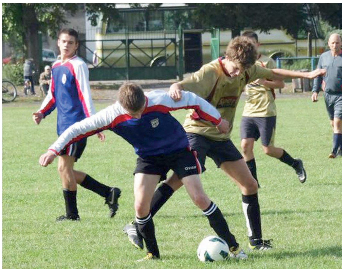
Walcząca drużyna MKS Żychlin w jednym z meczów rundy jesiennej.