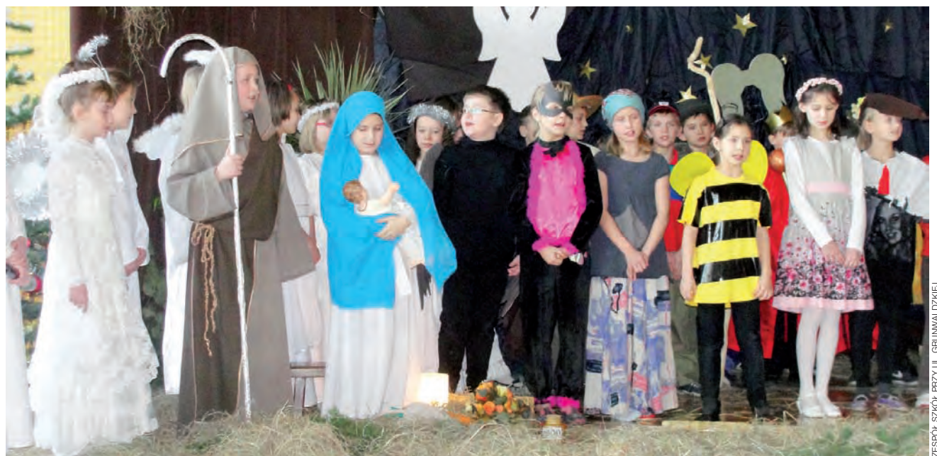
Tym razem jasełka przygotowali uczniowie klas III Szkoły Podstawowej nr 3.

28 grudnia Rada Gminy Zduny podjęła uchwałę w sprawie zarządzenia wyborów uzupełniających sołtysa Bogorii Dolnej. Wójt Jarosław Kwiatkowski musi zwołać zebranie mieszkańców tej wsi do końca stycznia. Dziś nie był znany jeszcze jego termin. pw