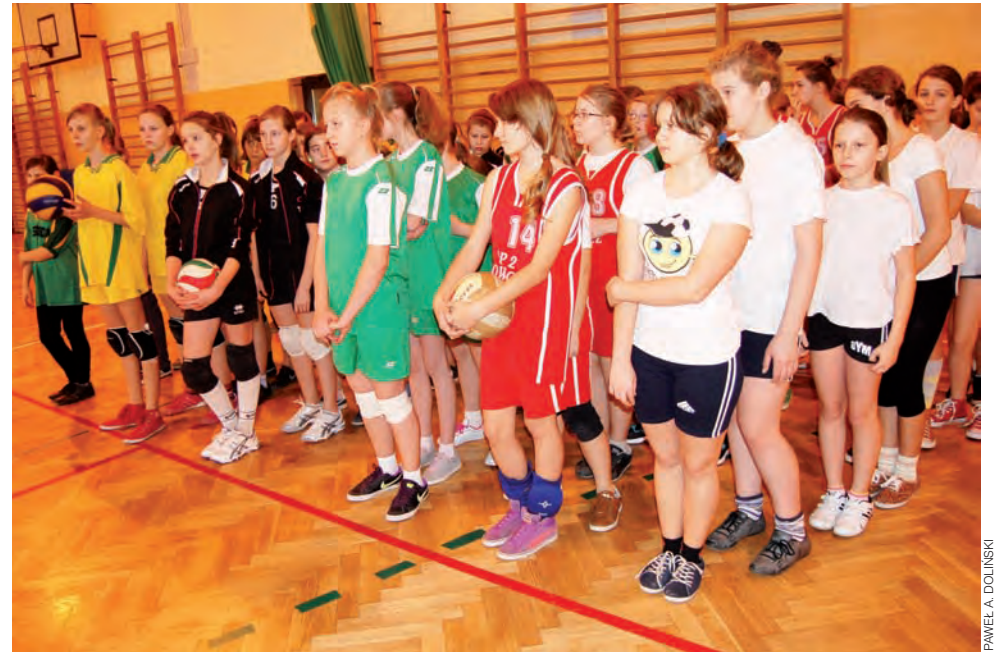
W finale powiatowym zagrało jak zwykle sześć ekip.