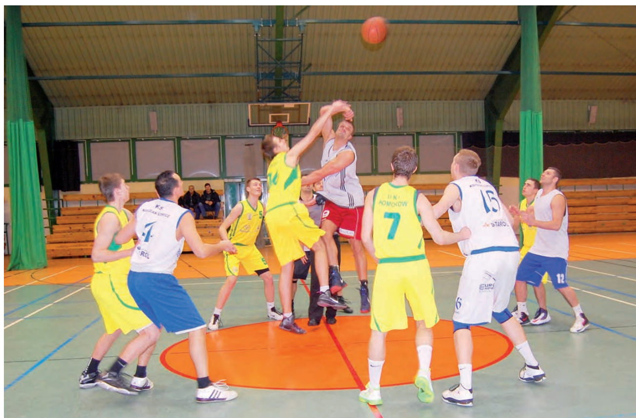
Koszykarze Księżaka na koniec 2012 roku rozegrali mecz sparingowy z UKS Komorów.

A sam mecz z Komorowem? Tylko chwilami naszym zawodnikom udawało się zachować koncentrację na wysokim poziomie. Odnajdujemy jedynie, że we wszystkich czterech częściach łowiczanie okazali się lepsi od