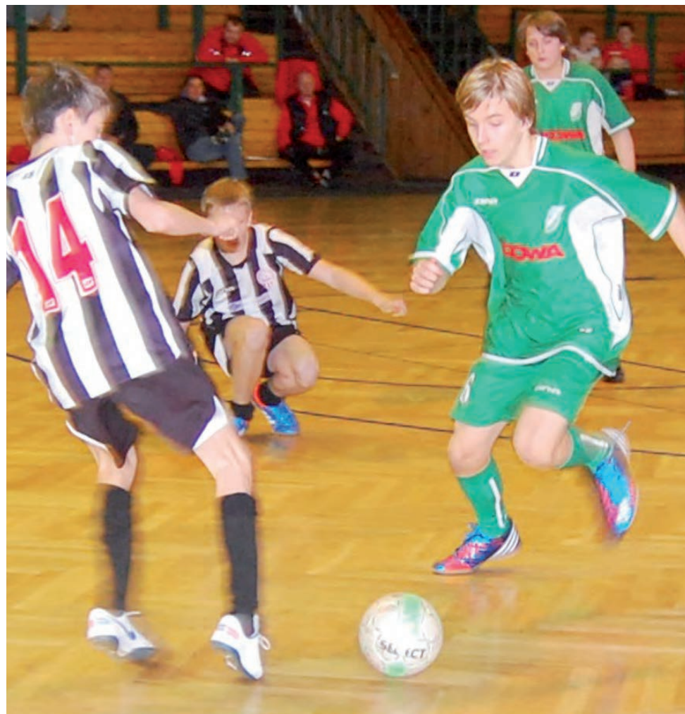
W finale gracze Pelikana-98 Łowicz pokonali Borutę Zgierz 2:1.