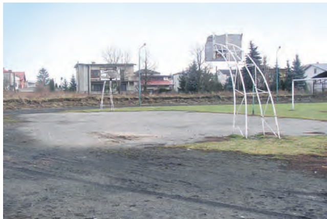
Płyta do koszykówki na miejskim stadionie. Tu wszystko ma się zmienić.

Gmina rozpocznie budowę wodociągu w ulicy Polowej w Żychlinie, co będzie kosztowało 40 tys. zł. str. 4