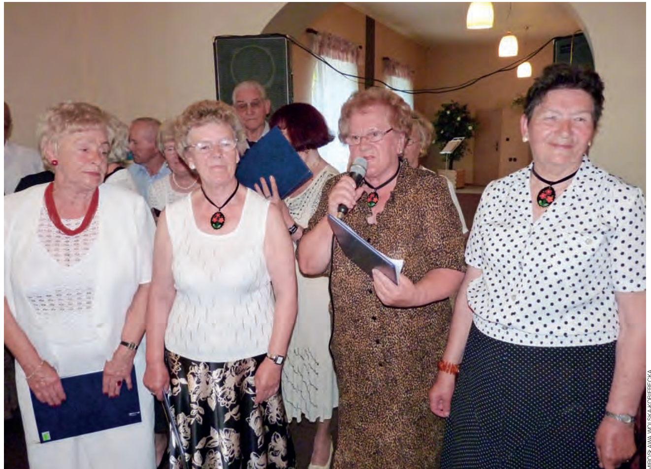
3. urodziny Klubu Seniora Radość w Łowiczu obchodzone w restauracji Polonia przy Starym Rynku, 30 czerwca 2010 roku.

Przez 5 lat klub rozrósł się od 50 do około 200 osób. →