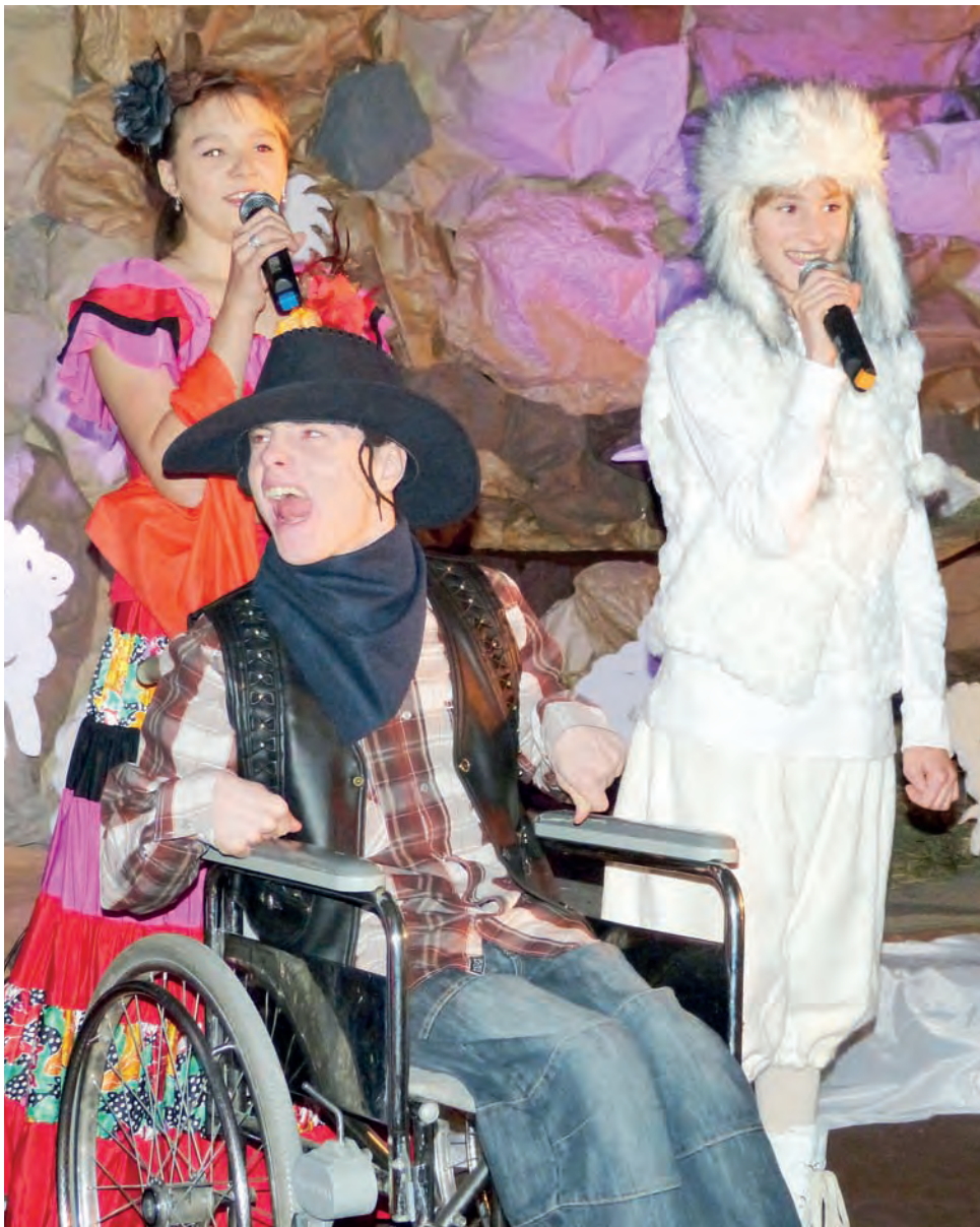
Występ podopiecznych ośrodka w Moczarzewie był ciekawie wyreżyserowany a wykonawcy stanęli na wysokości zadania.

Publiczność festiwalową stanowiły natomiast między innymi dzieci i młodzież z niepełnosprawnością intelektualną w stopniu znacznym i głębokim. Choć z niektórymi z nich kontakt był bardzo utrudniony, po twarzach było widać, że są zadowolone. Wszak niecodziennie można słyszeć muzykę