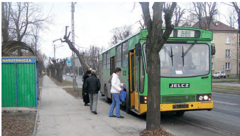
Jak wiekowy jest jeżdzący dotąd po naszych ulicach Jelcz, świadczy choćby jego rejestracja: jeszcze z białymi literami na czarnym tle.

również modernizację pomieszczeń budynku Zespołu Szkół nr 1 w Żychlinie, która ma kosztować 53 tys. zł oraz wykonanie konstrukcji kotary grodzącej boisko w hali sportowej. Kosztować ma ona 20,5 tys. zł.