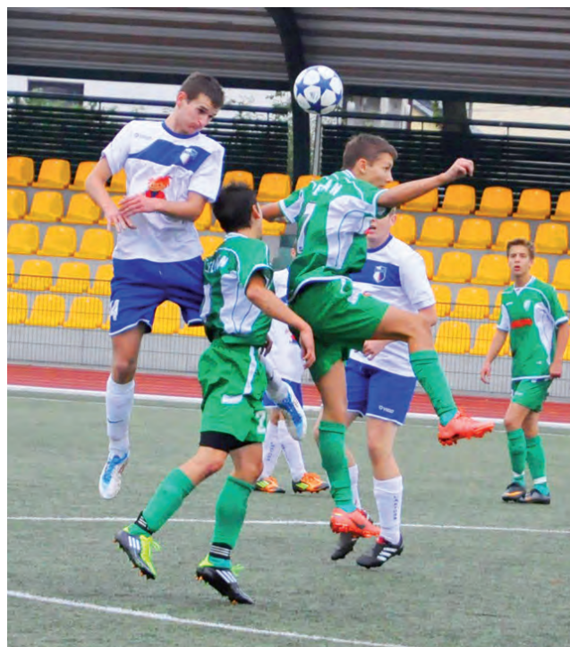
Laktoza-96 miała sporą szansę na awans do rozgrywek centralnych.

bardzo ciekawa, ekipa Laktozy była zdecydowanie lepsza. Jeden mecz wygrała 2:0, a drugi zremisowała 2:2. Na pewno największym osiągnięciem w rundzie jesiennej było pokonanie najmocniejszej drużyny rozgrywek z Bełchatowa. Cenny był też remis z Widzewem Łódź. W meczach z niżej notowanymi rywalami Laktoza raczej nie zawodziła i zdobywała punkty.