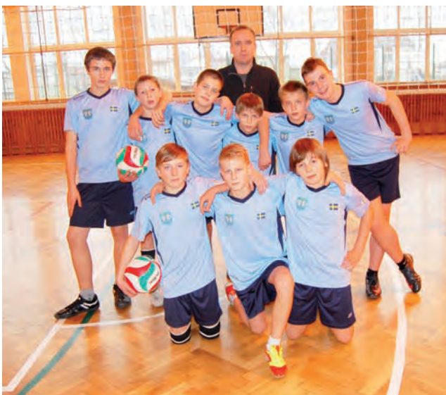
Uczniowie SP 1 Łowicz wygrali po raz trzeci z rzędu.

1. SP 1 Łowicz 4 8 8-2 2. SP Kocierzew 4 6 5-6 3. SP 3 Łowicz 4 6 5-5 4. SP Bednary 4 6 6-5 5. Pijarska SPKP Łowicz 2 2 2-4 6. SP Bielawy 2 2 0-4