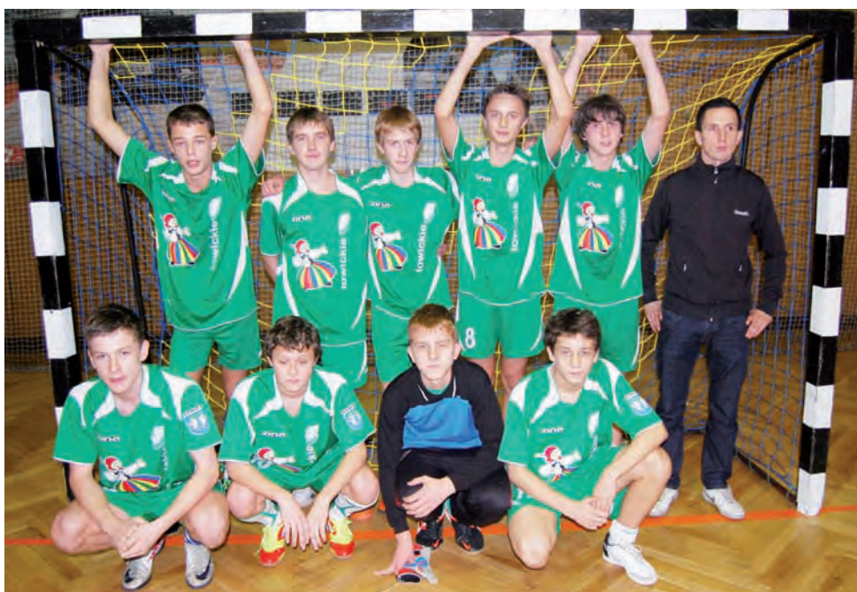
Gracze Pelikana-98 okazali się najlepsi w turnieju rozgrywanym w Łowiczu.

Piłka nożna | Podsumowanie rundy jesiennej Pelikana-98 w wojewódzkiej lidze Michałowicza