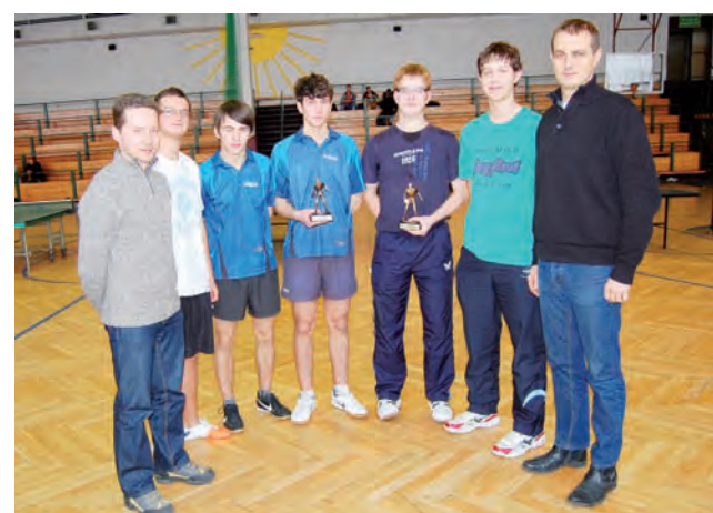
Pingpongiści z I LO i ZSP 4 powinni powalczyć o awans do finału.