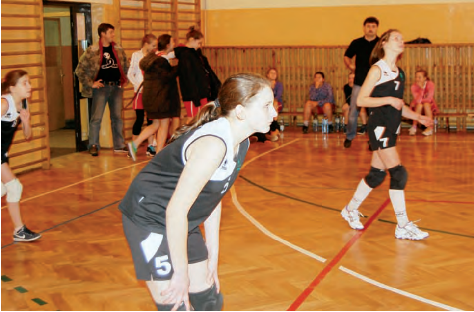
Najlepszą okazała się ekipa siatkarek ze Szkoły Podstawowej w Domaniewicach.