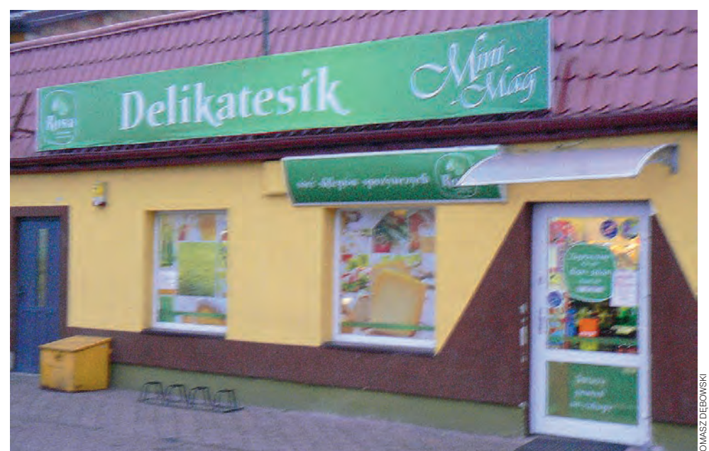
Nowego Łowiczana dla Żychlina i okolic kupisz w delikatesach Mini Mag w Bednie należących do sieci sklepów spożywczych Rosa. Sklep cieszy się sporą popularnością wśród mieszkańców Bedna i okolic. Można tu kupić artykuły spożywcze, chemię, prasę, a także artykuły papiernicze i alkohole.