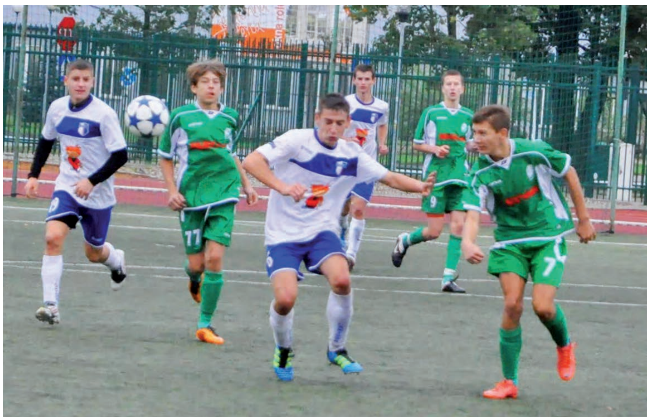
Na wiosnę zespoły Pelikana i Laktozy rozegrają trzeci w tym sezonie mecz derbowy w lidze wojewódzkiej.

Ekipa Pelikana-96 wygrała w rundzie jesiennej trzy spotkania, jeden mecz zremisowała a przegrała osiem pojedynków. Dwa razy biało-zieloni pokonali drużynę z Żelowa. Największą niespodzianką jesieni było pokonanie w meczu wyjazdowym Widzewa Łódź. To był na pewno najlepszy mecz Pelikana, który młodzi piłkarze długo