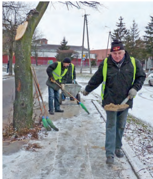
Pracownicy zatrudnieni przez Urząd Gminy w Żychlinie dbają o stan chodników przy ulicy Żeromskiego.

Żychlin jest miastem, gdzie wzdłuż ulic i chodników są roztawione specjalnie zamknięte pojemniki na piasek. Zamknięcie sprawia, że piasek nie zamara i jest cały czas dostępny. dag