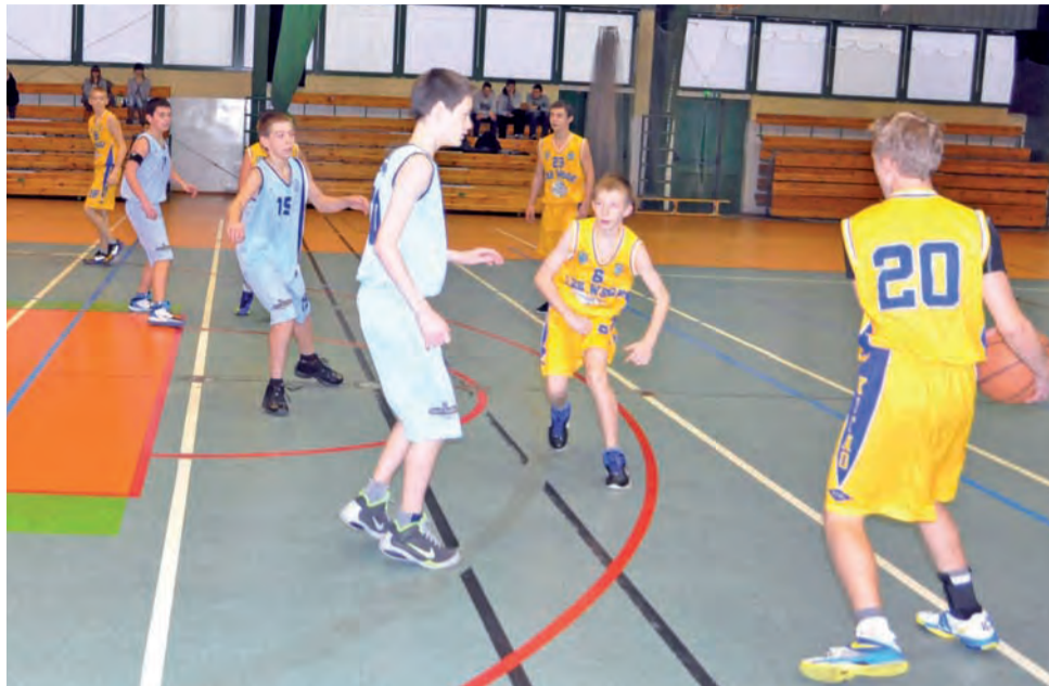
Młodzicy Księżaka-99 co prawda przegrali, ale zaprezentowali się znacznie lepiej niż kilka tygodni wcześniej w zagrani w Kutnie.