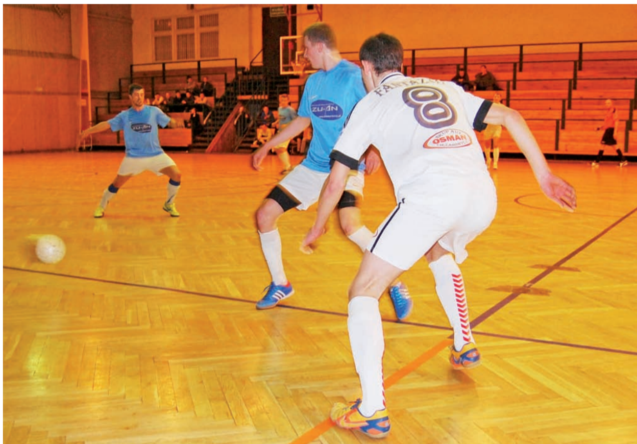
Po sobotnim zwycięstwie z Zatorzem ekipa Fantazji Głowno następnego dnia została boleśnie sprowadzona na ziemię przez Imadła...