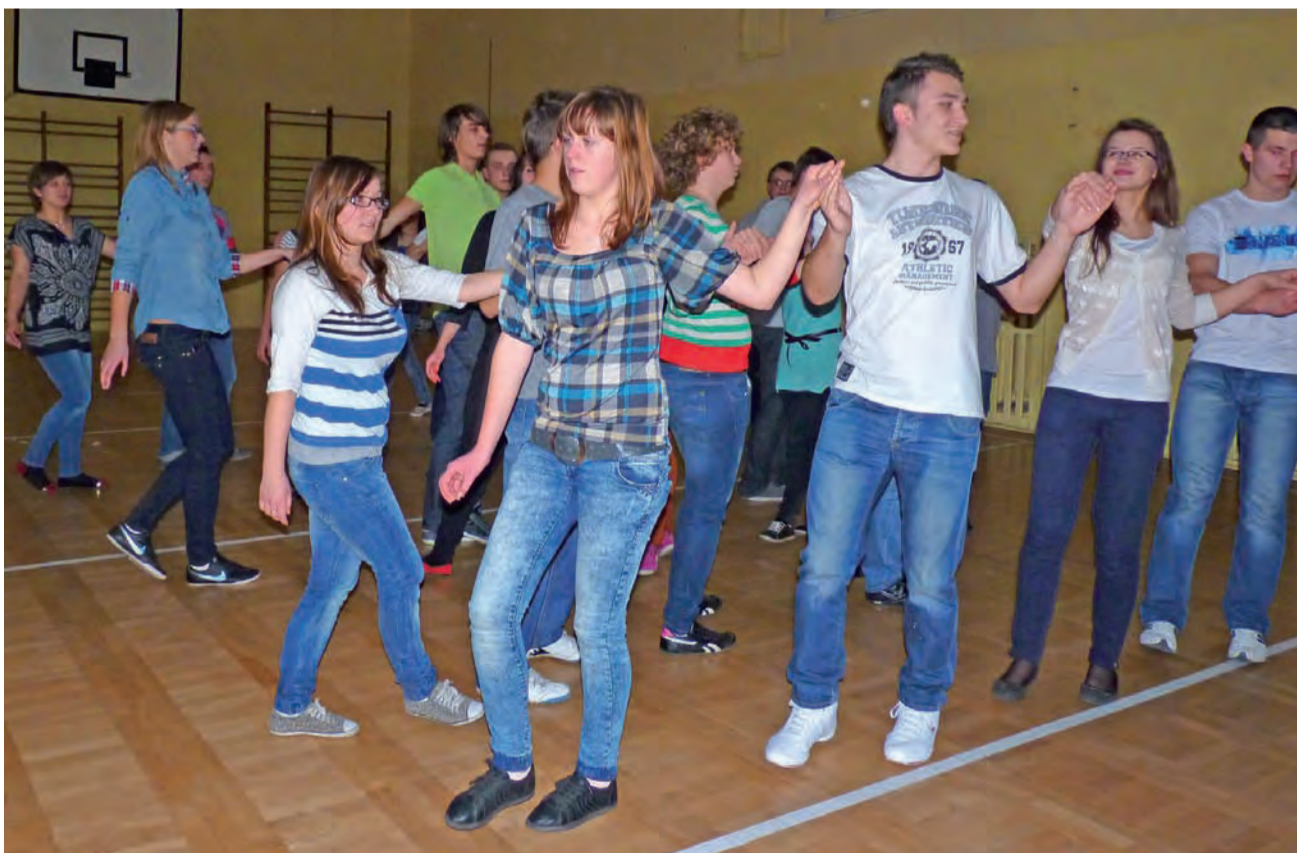
Uczniowie ZS nr 1 ćwiczą poloneza. Tym tańcem zaczną studniówkowy bal.

Pilotażowe CCS w Bełchatowie i przesyłanie CO 2 w okolice Wojszyc stoi pod znakiem zapytania.