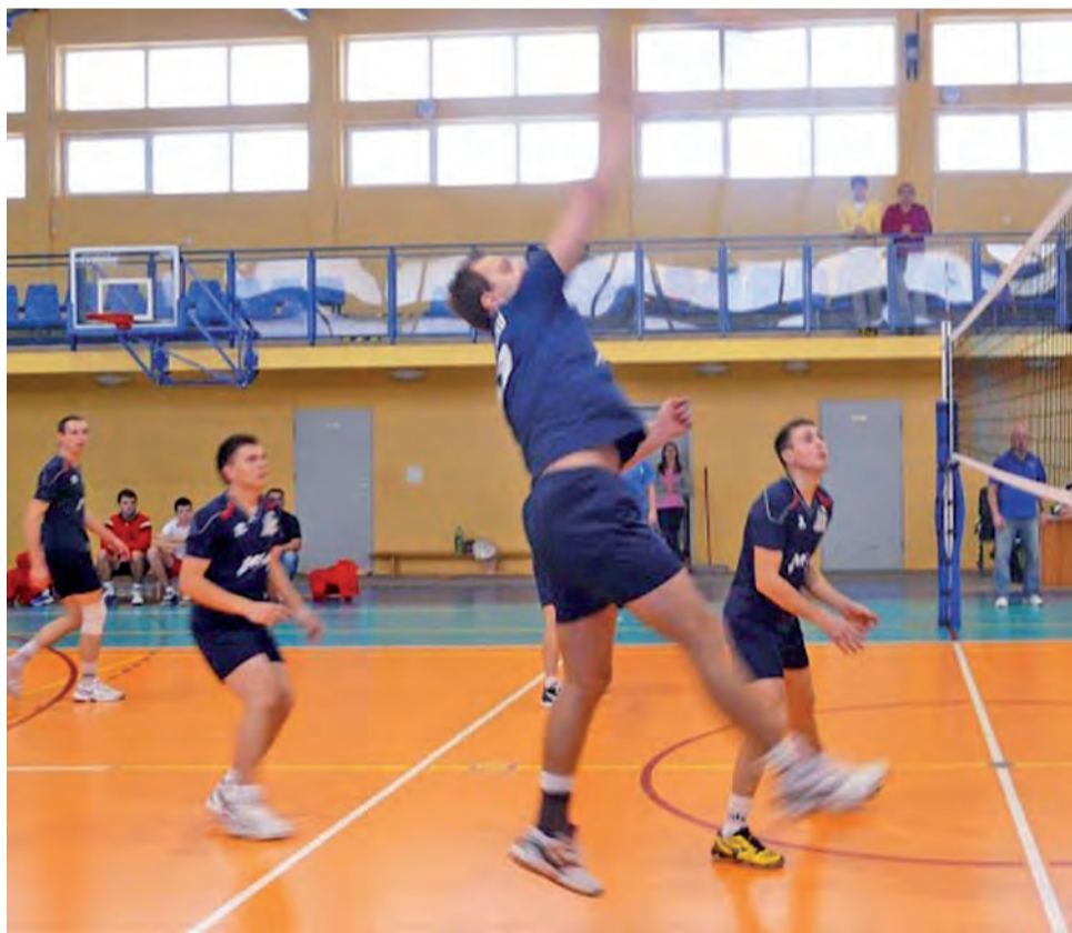
Zawodnicy z Bedna mimo starań na parkiecie ulegli drużynie Aura Łąck.

■ Team Gostynin – Farbis Łowicz 3:1 (25:22, 18:25, 25:19, 25:21)