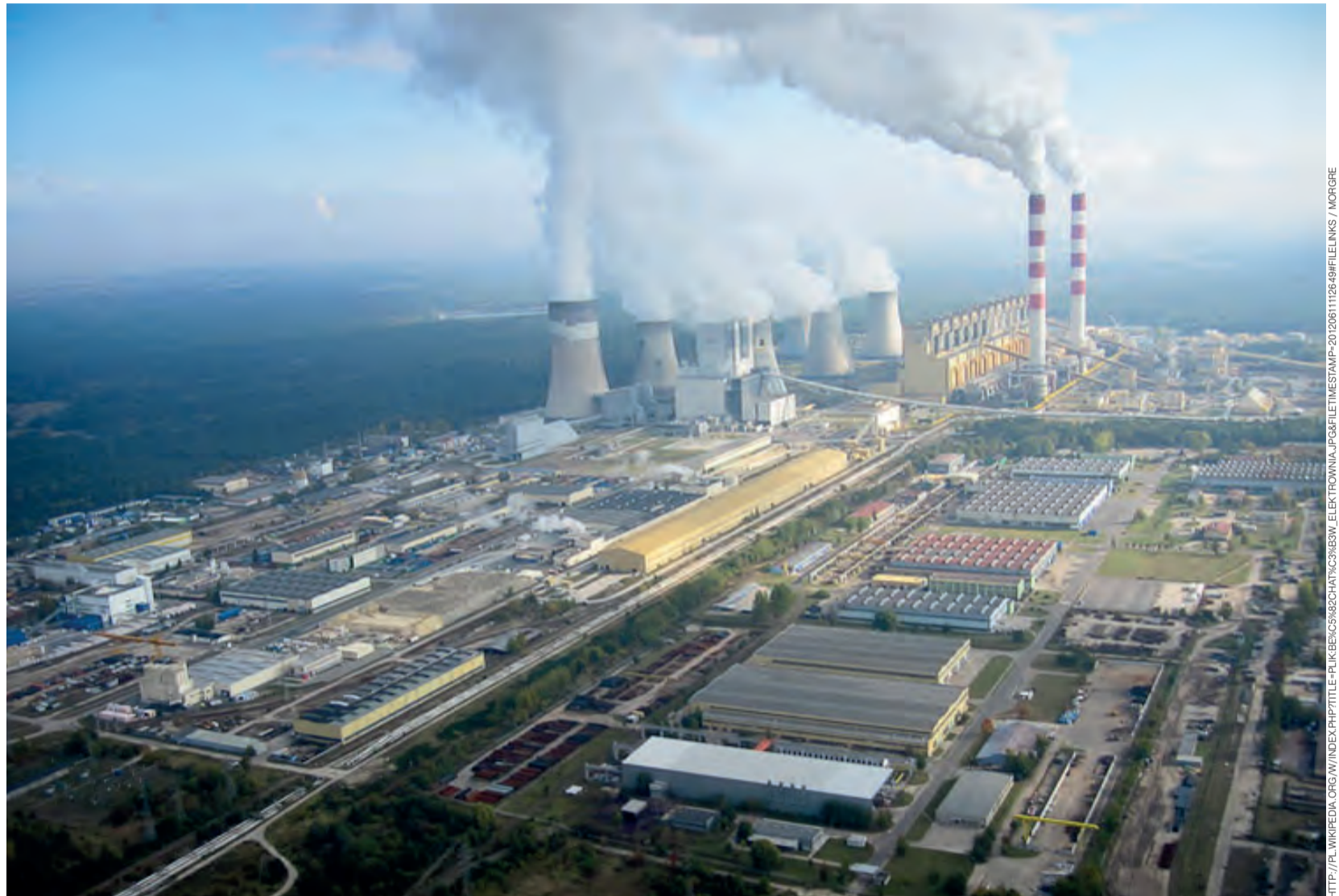
Widok z lotu ptaka na Elektrownię Bełchatów.

Firma chce budować rurociąg, ale od ostatnich spotkań nic się nie dzieje.