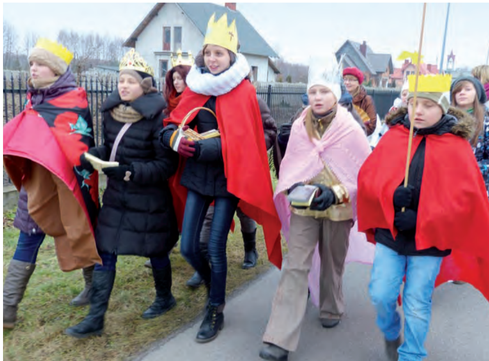
Kolednicy z Koła Misyjnego odwiedzali dom za domem. Wszędzie śpiewali kolędy, w drodze również.

Zanim kolednicy rozpoczęli odwiedzać mieszkańców Parmy, uczestniczyli w mszy świę-