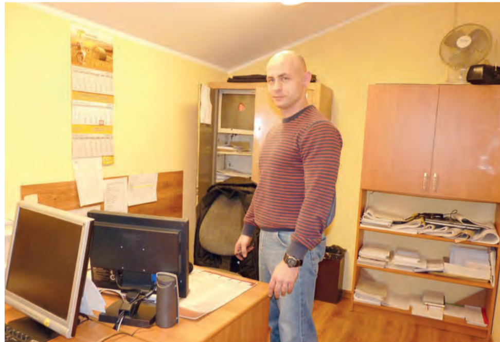
Tak wyglądają pomieszczenia komisariatu na strychu po remoncie. W pomieszczeniu pracuje teraz 4 policjantów.

Przypomnijmy, że w sierpniu 2010 roku, decyzją Sanepidu, wyłączono z użytkowania pomieszczenia na najwyższej kondygnacji komisariatu, bowiem pomieszczenia nie spełniały standardów, były zbyt niskie. Przez kilkanaście miesięcy policja wynajmowała pomieszczenia dla swoich dzielnicowych w pomieszczeniach pobliskiego Zespołu Szkół nr 1. Teraz policjanci pracują w wyremontowanym po-