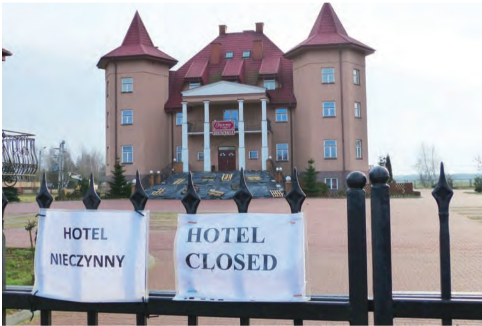
Interrex został zamknięty w listopadzie ubiegłego roku - i nadal nie został sprzedany.

Tymczasem 3 miesiące później – 1 listopada ubiegłego roku – Interrex został zamknięty dla gości, a na bramie wjazdowej pojawiły się dwie białe kartki formatu A4 z napisami „hotel nieczynny” i „hotel closed”. W związku z tym, że brama wjazdowa oddalona jest o kilkadziesiąt metrów od drogi krajowej nr 92, informacja ta jest mało widoczna i zdarza się, że do hotelu nadal zjeżdżają podróżni. – To było do przewidzenia, że w końcu zamkna ten hotel, od kilku lat ruch jest przecież mniejszy. Myślę, że od kie-