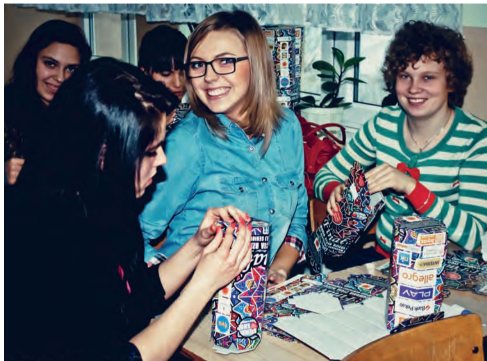
Wolontariusze z ZS nr 1 im. Adama Mickiewicza w Żychlinie w trakcie składania orkiestrowych puszek.

Powiat łowicki | Łowicka Grupa Rybacka oceniła wnioski o dofinansowanie przedsięwzięć