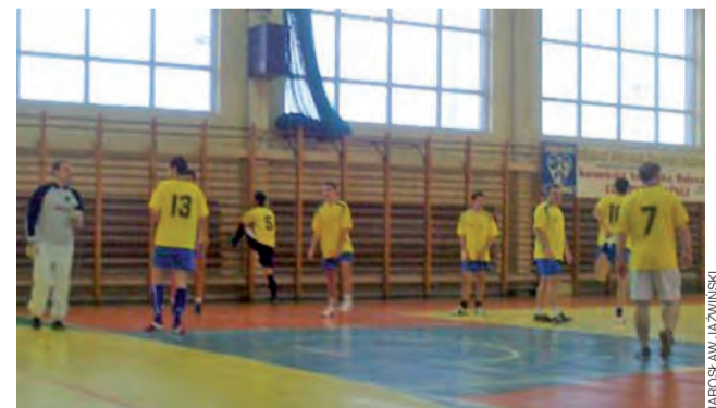
Drużyna Gladiatory z Miasta Noży rozgrywa się przed kolejną walką o punkty.

Nowy Łowicznanin. Tygodnik Ziemi Łowickiej, członek Stowarzyszenia Gazet Lokalnych.