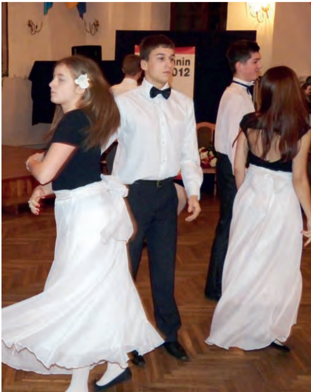
Walca zatańczyły cztery pary z II LO w Łowiczu.