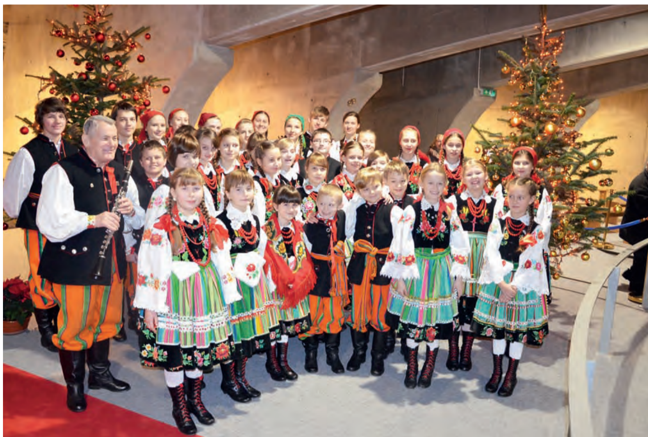
Koderki wystąpiły w regionalnych strojach. Świątynia, dzięki ich muzyce i przekazywanej radości, nabrała w niedzielę nowego blasku.

Większość została do samego końca, a później nagrodzi-