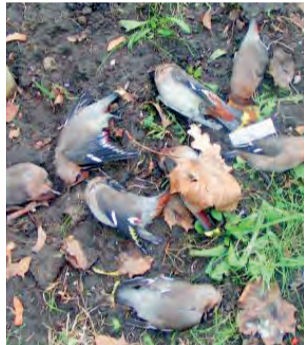
Jemiołuszki, które zabiły się o szklaną powierzchnię ekranu akustycznego przy łowickim Tesco.