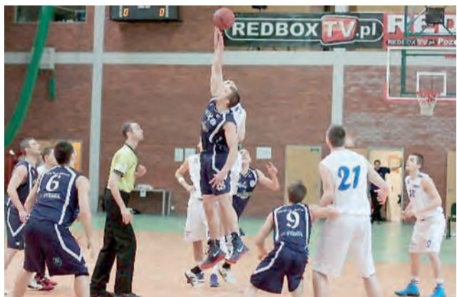
Łowiczanie odnieśli na przedmieściach Poznania szóstą wygraną.