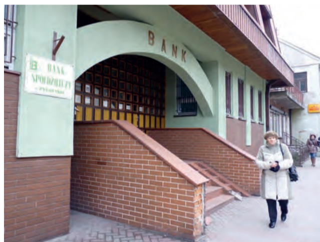
Wyплаты zasiłków będą w Banku Spółdzielczym w Żychlinie. Pierwsi podopieczni pomocy społecznej dostaną pieniądze 21 stycznia.