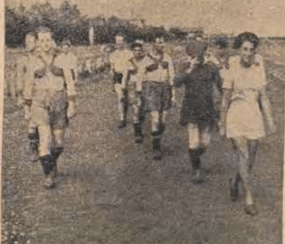
יידישע ספארטלער אין מאַרש

ק, גאָלדקאָרן, ריימאנאווא, פיבא, פון יונג-אָפּט, פון דער יונג אָפּטיילונג ביים ז.ש.ק. פון