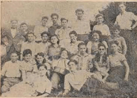
די ליגניצער יוגנט-היים אויף אָפּרו אין קאמיאנקאוו

באזונדער באליבט זיינען ביי דער יוגנט די אָונטן ביים פייער. דעם 7-טן אויגוסט איז פאָרגעקומען אזא אָונט. אין דעם "שלאָס" פארק, וואָס האָט אמאָל געהערט צום ס.ס.ר. אפיציר גראָף פאָן טאָס, זיינען זיך צינויפגע- קומען די יוגנטלעכע פון דער ליגניצער בורסע. אין א ברויטן קרויז האָבן זיי זיך אויסגעזעצט ארום דעם צעפלאקערטן פייער. נאָך א קורצן