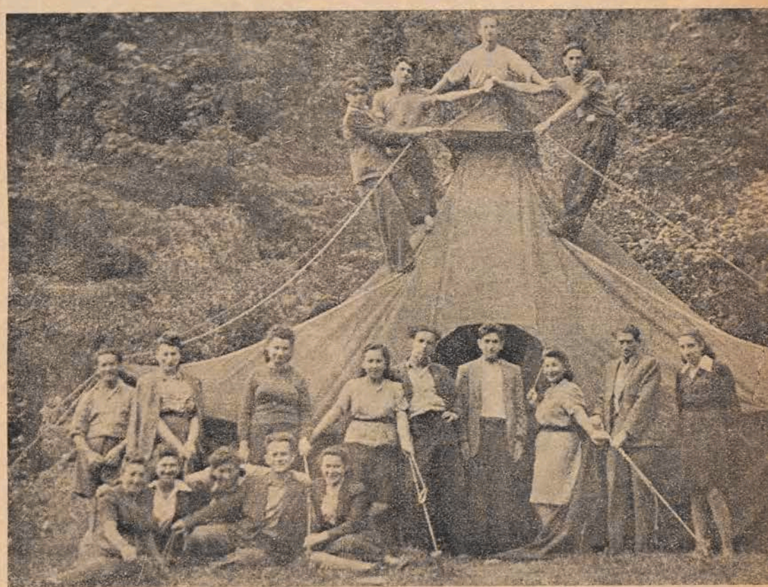
יידישע יוגנטלעכע: קוילנרגעבער, וועבער, סטודענטן, מעטאָליסטן א.א. אין אַפּרוֹהוּז פון דער יוגנט־אַפּטיילונג ביים צ.ק. פון יידן אין פּוילן, אין בעלאָווע

מיר פאָרן ווייטער אין דער ריכטונג צום אַפּרוֹהוּז אין בעלאָווע. ווידעראמאָל שמאַלע, געשלענלעכע וועגן, דאָס פּערד שלעפּט אונזער