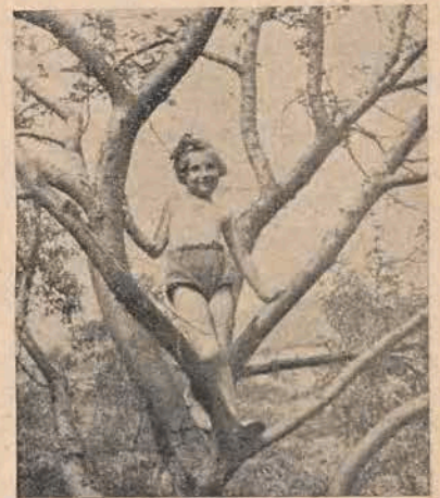
די יינגסטע קאלאניסטין אייזענשטאט אין קאמיאנקאוו (וואצלאוו)

דעם אויספלוג פירט דער ח' בעמער. א דאנען וועג מארשירט מען מיט געזאנג, אבער אויף דער האלבער הויך פון בארג הערט זיך שוין א שווער אטעמען. דא און דארט הערט זיך שוין א פעסימיסטישע שטים פון א חברטע: