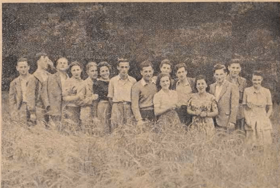
די יוגנט אין ביעלאָווער אַפּרו־הויז געניסט פון זון, וואַלד און פעלד

דער נידער־שלעזישער יידישער ישוב אין דאָס יאָר באַרויכערט געוואָרן מיט א נאנצער רוי אַנשטאַלטן, מיט א נעץ פון אַפּרו־הויזער פאר דער יידישער יוגנט. דער צענטראַלער יוגנט־ראַמט דאָס פארשטאַנען די וויכטיגייט