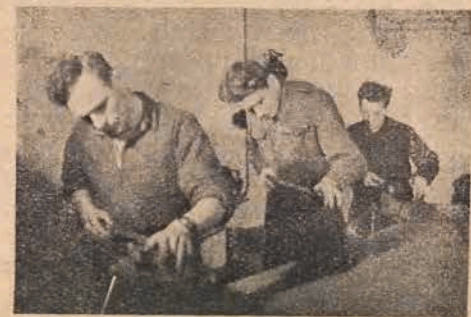
קאָדער פון יידישן פילם „נידער-שלעזיע“ יוגנטלעכע ביי דער אַרבעט

אונטער-ציענדן א סיי-הכל פון א יאָר-טע- טיקייט — קענען מיר עסטשטעלן, אז די יוגנט-היימען האָבן פאר דער צייט פיל דער- גרייכט און נישט ווייניק איז אונז נאך גע- בליבן צו דערגרייכן. באדיינדיק דאָס פראַבלעם יוגנט-היימ, וואָלט געווען א פעלער נישט צו דערמאנען איר פינאנסיעל-מאטעריעלע זייט. אויף דעם געביט שטייען מיר שטארק אָפ. אָבער דאָ דאָמינירן גאנץ אַביעקטיווע סיבות. די יוגנט-היימען אין לאנד מאכן ארויך א צייט פון ערנסטע פינאנסיעלע שוועריקייטן. נישט איינמאָל שטעלט זיך די פראגע: צי קען מיר ביי א זא לאגע ווייטער עקזיסטירן און אנטוויקלען אונזער ארבעט? דער ענטפער פון יעדן יוגנט-טוער איז: מיר קענען און מוזן די דאָזיקע שוועריקייטן בייקומען. די אזוי גוצי- לעכע און צום לעבן בארעכטיקטע אינסטיטור- ציע, מוז מיט אלע מיטלען דערהאלטן און גע- שטיצט ווערן: זאָל אונז דאָ דינען פאר א ביי- שפיל די פּוילישע געזעלשאפט, וועלכע שטיצט