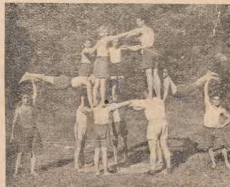
גימנאַסטישע איבונגען פֿון דער „באַראַכאָוו-יוגנט

מאַנראַפֿיע, געשיכטע פֿון עליות, וועגן חלוצים און קיבוצישער באַזעגונג, פּועליציוניזם און יודישע ארבעטער-באַזעגונג, סאציאָלאָגיע און פּאָליטישע עקאָנאָמיע. ס'איז געלערנט געוואָרן די העברעאישע און יודישע שפּראַכן, יודישע ליי-