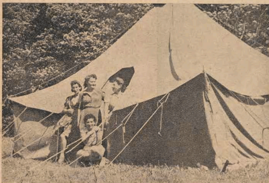
אַ גוטן אויפֿשטאַנד! אונזערע מיידלעך ציט צו דער זון

געניסנדיק פון דער נאַטור־רייכקייט און שיינקייט, פאַרפּולקאַמט זיך דאָ דער יוגנט־לעכער אויפן געביט פון פיזישער און גי־סטרי־פער דע־זייגונג, לערנט זיך לויב צו האָבן די בענטשן, וואָס בויען די וועלט מיט דער מי פון זייערע הענט און שטרעבן צו א גליקלעכער