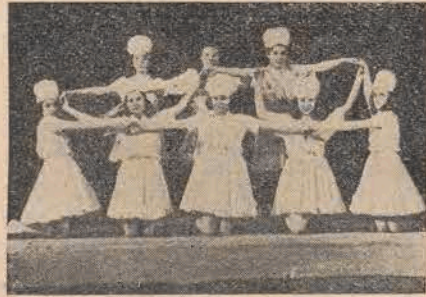
דראַמקרויז פון גורדוניה אין לאָדזש

אויף די אַרומיקע פעלדער גייט מיט א ברען די שניט־קאַמפּאַניע. אויף א מעכאַנישער זשניוויאַרקע געפירט פון 2 אויסגעפאַשעטע פּערד, אַרבעטן 3 בחורים פאַרברענטע פון דער זון, און פון דער ווייטנס פירן אַנדערע בחורים א פּולן וואָגן מיט וויין. אָנגעלאָרן ביז אַרויף. דאָס זיינען א טייל פרוכטן פון דער אַרבעט־זאַ- מער מי פון דער קבוצה גורדוניה — „החורש גלילי“ — אין פּילאָווע.