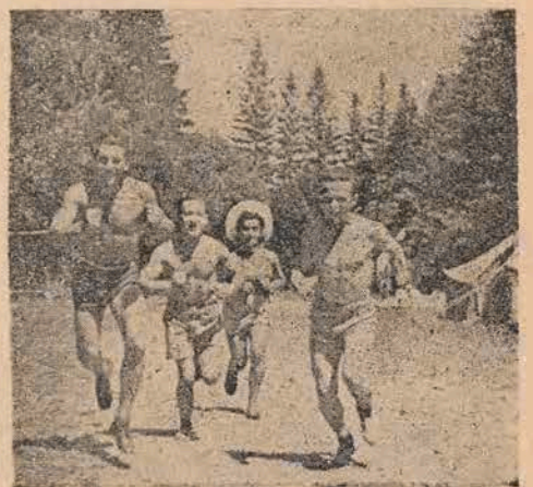
לויף-פּאַרמעסט אין ביעלאָווער אָפּר-הויז

אין אַ שיינעם פּרימאָרגן האָבן מיר זיך אַ לאָז געטאָן גאָנצע עטלעכע יונגט-רעפּובליקן. דורך געשלענגלעטע וועגן, דורך בערג און טאָלן פּאַרן מיר אַרויף און אַראָפֿ. לענגוים זעב שאַסיי טרעפֿן מיר גרופּעס יונגטלעכע אויף עפּאַציר. לויט זייערע אַניפּאַרמען דערטענען פיר באַלד פֿון וועלכער אָרנאַניזאַציע זיי זיי נען. מיר שמעלן אָפֿ אַ גרופּע פּריילעכע, צע- שמיכלטע מיידלעך מיט גרויע בלוזעס און שוואַרצע האַלזטוכן פֿון השומר הצעיר. מיר פּרעגן דאָס אָרט פֿון וואַרשעלאַווער יונגט-היים, זיי ווייזן אונז דעם וועג. מיר פּאַרן פּאַרביי