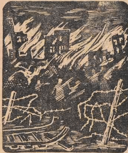
די געטא אין פּלאַטען

טראָץ די באשווערונגען פון ארויסבו-און ארוינבוין אין געטא — זוערט דער קאנ-טאקט מיטן אויסער-געטא ענגער. עס זיינען ארויס די ערשטע פארטיזאנישע גרופן אין די וועלערע. מ'היינט געזער ביי די פויער-מ'שיקט ארויס אויספירן-גרופן, די געווער-מאנאזיען ווערן פולע. די אויגענע פראָדוק-