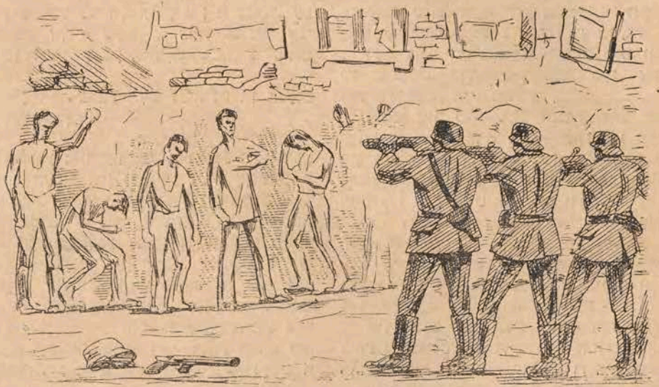
די לעצטע פון די 72 יודישע יוגנטלעכע קעמפער אין ביאליסטאָקער געטאָ ווערן צעשאָסן

דער צייכן איז געגעבן געוואָרן. דער פּראָנט האָט זיך אויסגעצויגן לענגוויס די צוויי