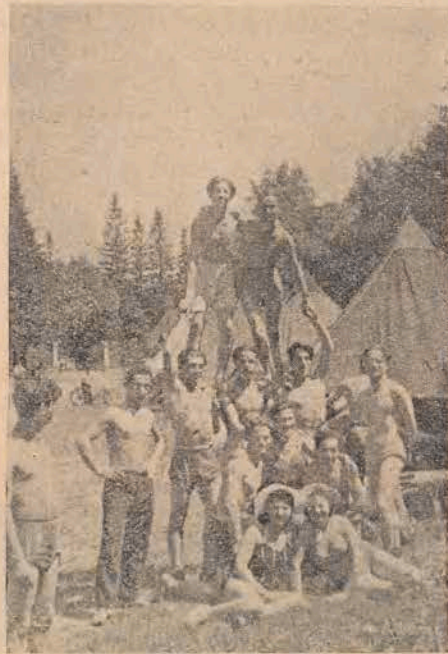
יונגט-אַפּר-הויז אין ביעלאָווע

מיר זיינען אויפֿן אָרט. אנטקעגן קומען ארויס די יונגטלעכע מיט זייערע לייטערס, מיר