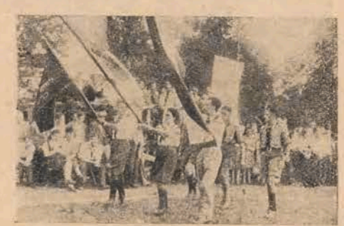
מאַרש פון שומרישער יוגנט אויף דעם צוזאַמענפּלי

נאָך אים האָט אין נאָמען פון דער הנהגה העליונה גענומען דאָס וואָרט ח' יעקב